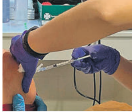
de Salut de Bocairent, i després a la residència, sempre protegides per la Guàrdia Civil. A pri-

Els seus 34 residents i un 90% dels professionals del centre van rebre la primera de les dos dosis d'aquesta vacuna, mentre que 21 dies després, el 29 de gener, està prevista la segona dosi. Les males condicions meteorològiques, amb neu, fred i gel, no van impedir que les esperades vacunes arribaren, primer al Centre