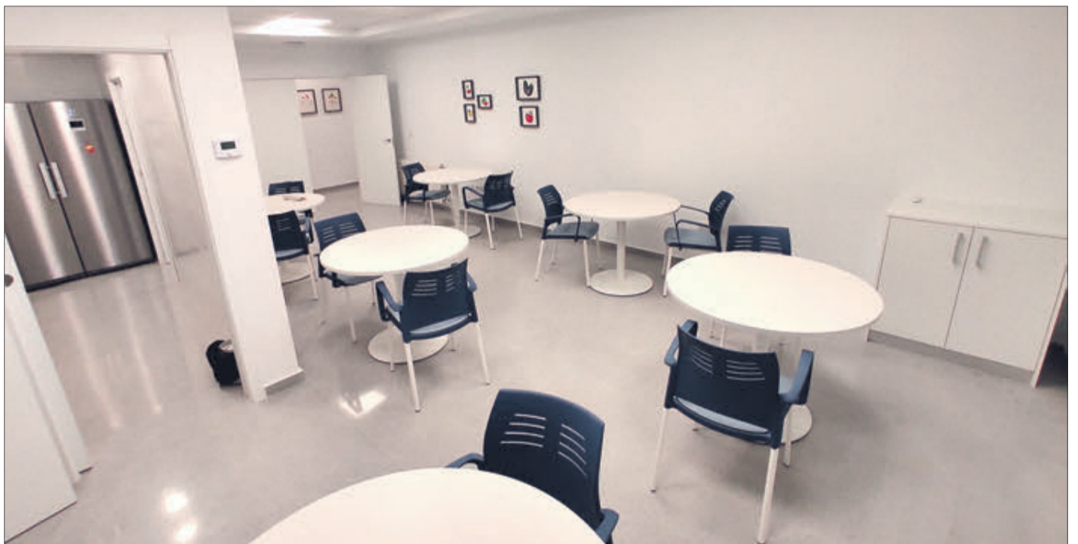
Espai destinat a menjador.

Des de la junta de l'Alzheimer s'ha fet públic un comunicat agraint a totes les persones que van fer la visita, amb la confiança de què el que van veure resultara del seu grat. També es va mostrar el seu infinit agraiement a l'Ajuntament, a la Diputació Provincial, a la Generalitat, als socis i a quantes institucions, empreses, negocis i particulars han fet possible que el nou centre siga una realitat.