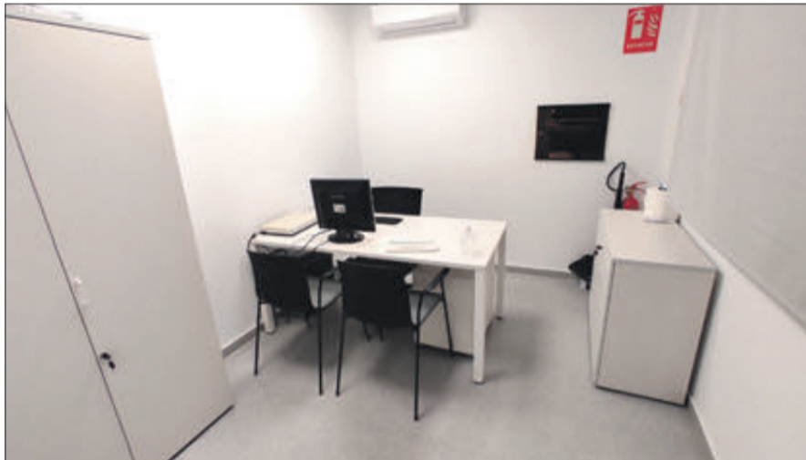
Un dels despatxos.