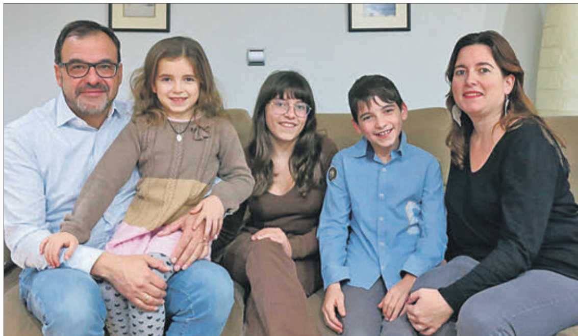
Clavaris de les festes d'enguany.

El dilluns, dia 13 de desembre, festivitat de Santa Llúcia, tindrà lloc una missa a les 20.00 hores en sufragi de tots els confreres difunts.