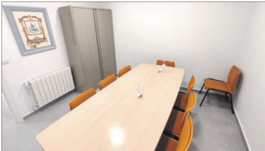
Sala de reunions.