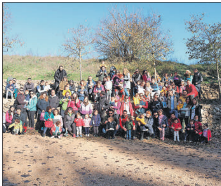
Grup que va participar en l'activitat.

L'experiència va ser molt positiva i va suposar una activitat complementària molt enriquidora que va permetre també fer valdre els nostres espais naturals.