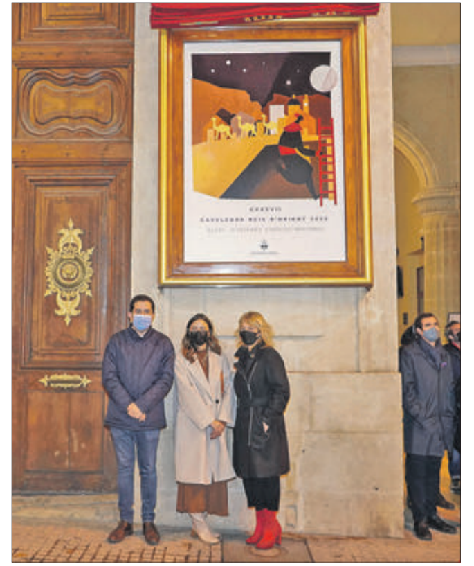
L'autora, junta a l'alcalde d'Alcoi i la regidora de festes.

EL VAN PENJAR EL DISSABTE PASSAT A LA FAÇANA DE L'AJUNTAMENT