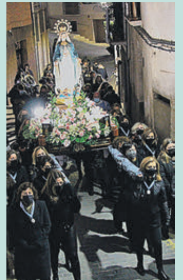
La imatge durant la processó.

que els Ajuntaments són instruments idonis per a impulsar normes i plans que fomenten la igualtat d'oportunitats, detectar la violència de gènere i dissenyar polítiques integrals per a superar aquesta forma de maltractament que està destruint tantes vides.