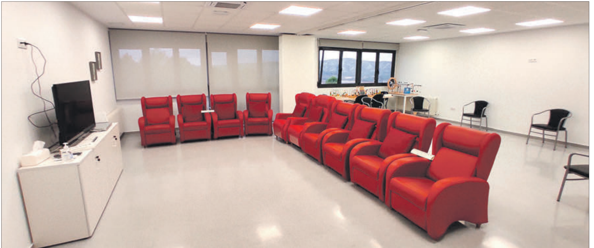
Sala que es desdobra per a relaxament i gimnàs.

LES VISITES ES VAN ORGANITZAR PER GRUPS FENT UNA RUTA GUIADA