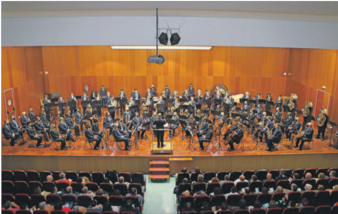
La Societat Musical a l'Auditori Municipal de Beneixama.