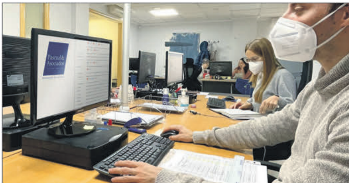
Oficinas de Pascual & Asociados en Muro de Alcoy