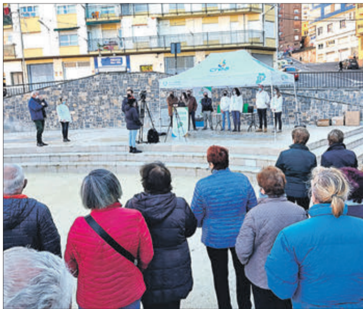
La plaça de Juan Bautista Domenech va ser l'escenari de l'acte.