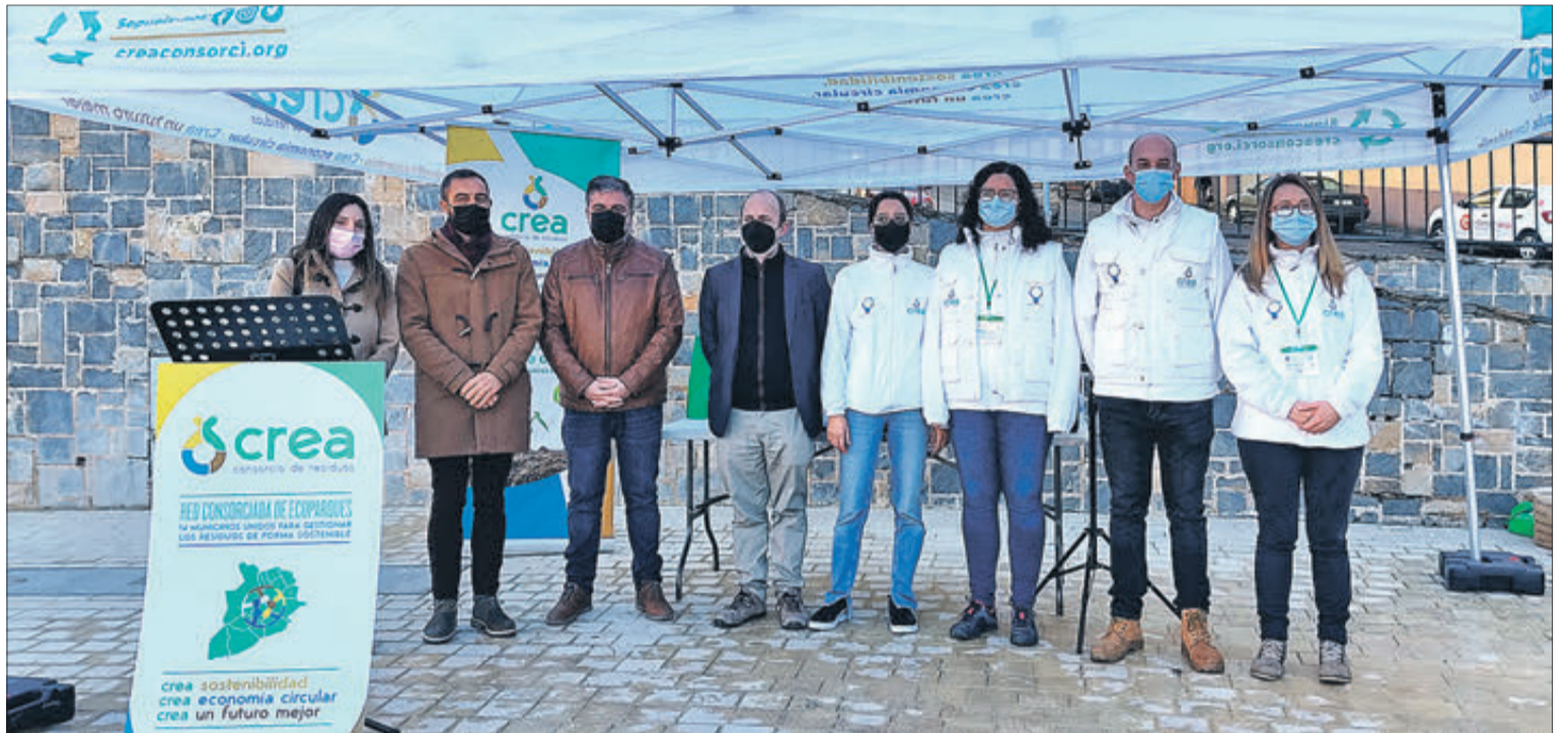
Autoritats i educadors ambientals durant la presentació.

El treball dels educadors ambientals estarà dirigit a tots els sectors: ciutadania en general, associacions, àmbit educatiu, restauració, comerç, mercats, indústries, empreses, etc. No sols informaran i conscienciaran en matèria de residus, sinó que també resoldran dubtes i admetran aportacions i suggeriments que puguin plantejar-se. Informaran sobre com separar correctament els residus en el domicili i tractaran de conscienciar sobre la importància d'utilitzar els ecoparcs, participar en projectes de compostatge i altres aspectes relacionats amb la gestió de residus.