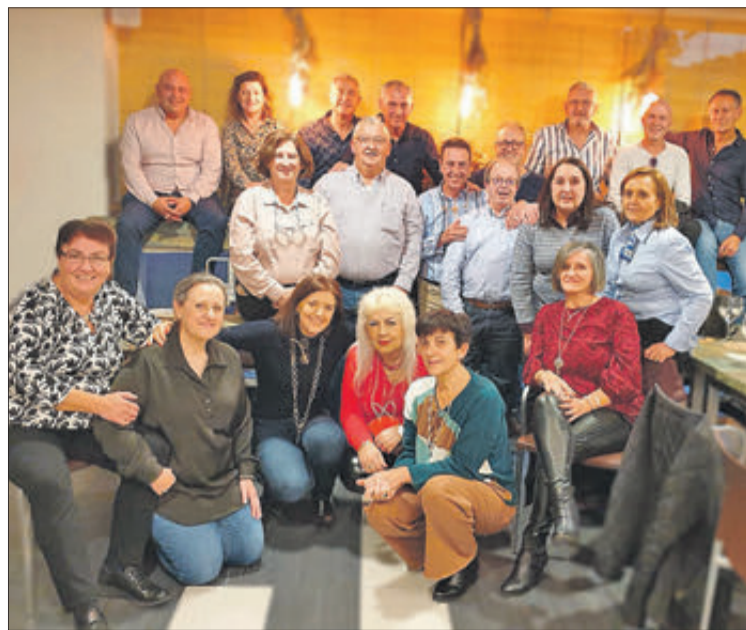
El grup de nascuts en 1961.