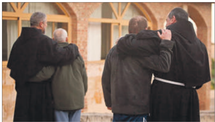
El Centre d'acolliment està situat a Palma de Gandia.

d'AECOC, per a sensibilitzar als seus clients, mitjançant l'emissió de missatges per la megafonia en els supermercats, sobre l'aprofitament dels aliments perquè no acaben en el fem, promovent una compra responsable.