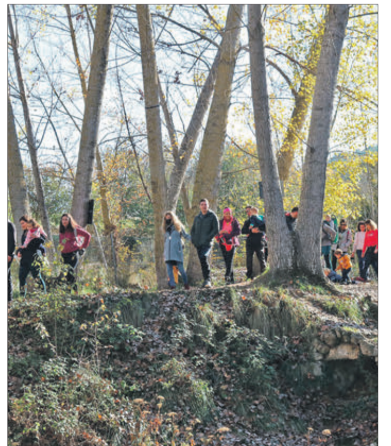
Excursió per la zona del Molí l'Ombria.