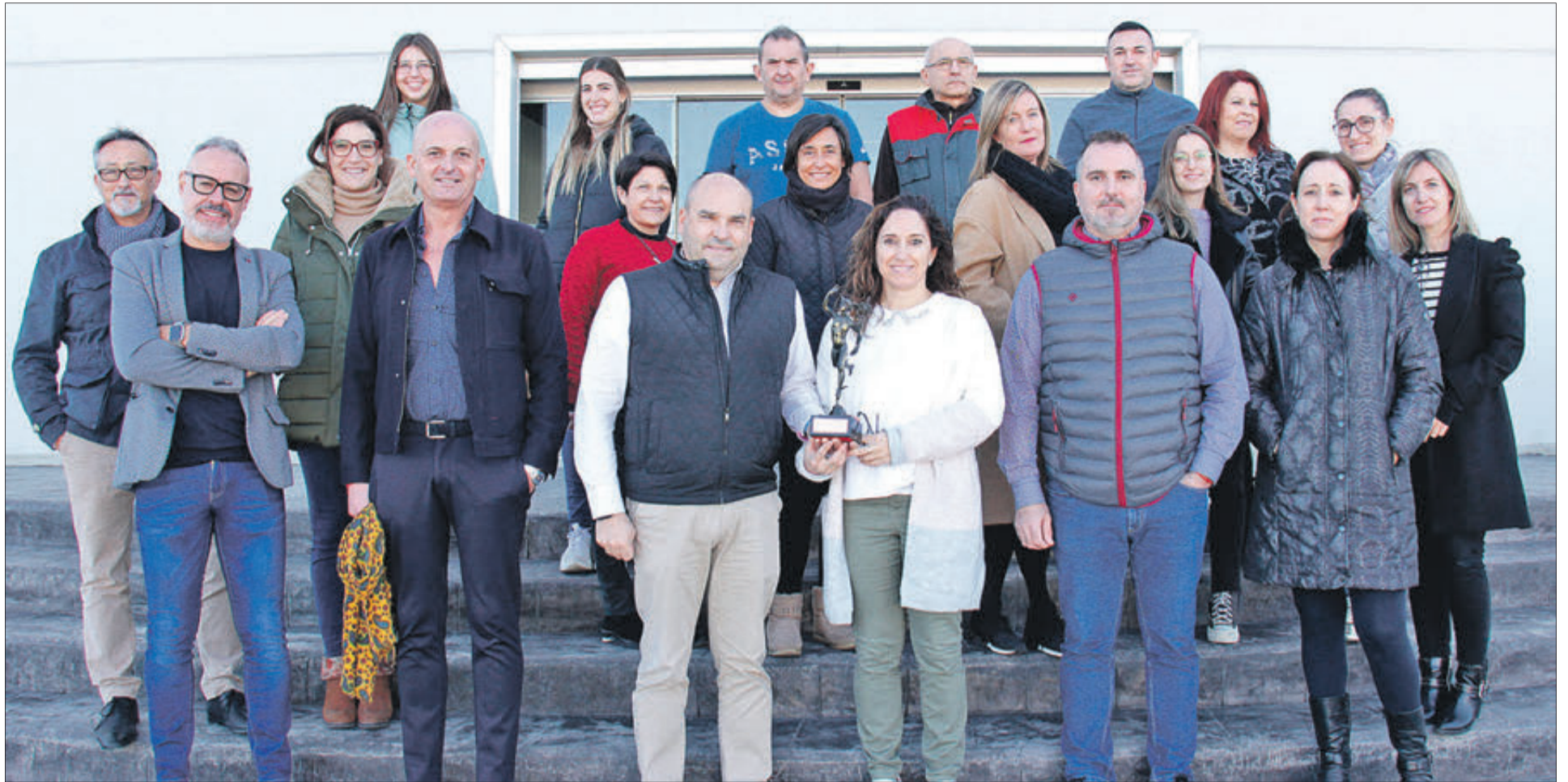
Equip humà de Kuo's Professional.