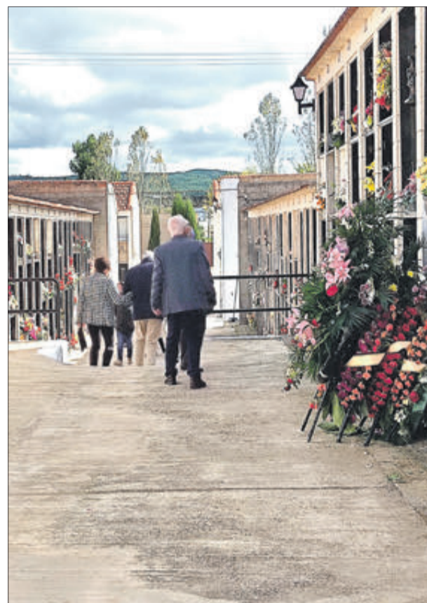
Centenars de persones van visitar el camp sant.