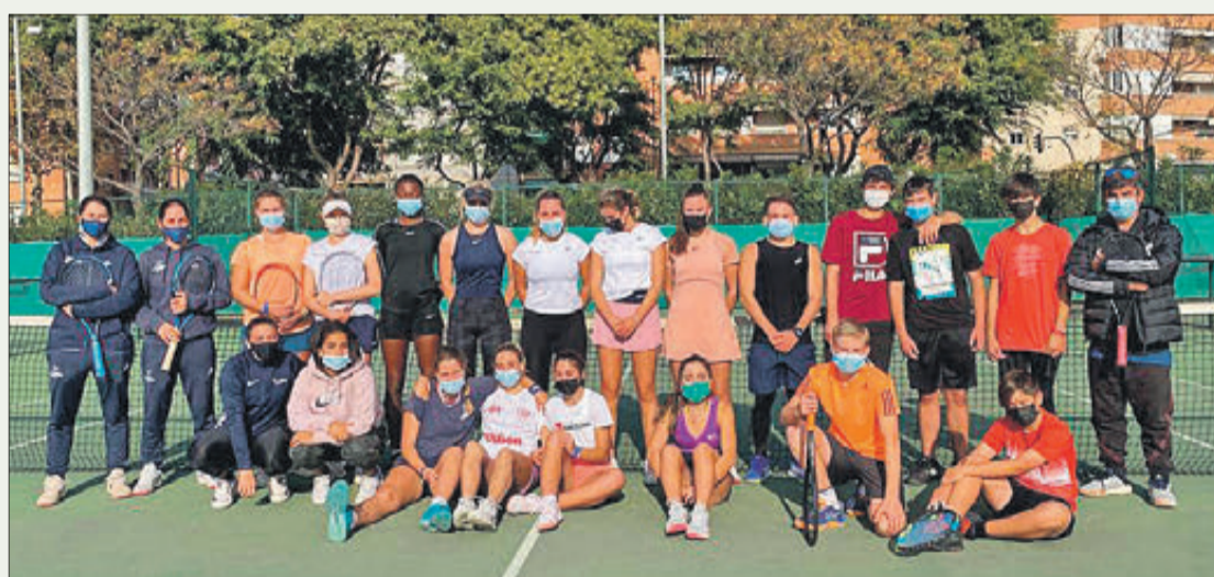
Integrants del Club Pla Roig amb altres participants en l'esdeveniment.

VAN ENTRENAR AMB MEMBRES DE L'ACADÈMIA DE RAFA NADAL