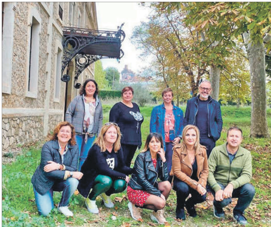
Nascuts en 1971 formen la junta dels Reis Mags.