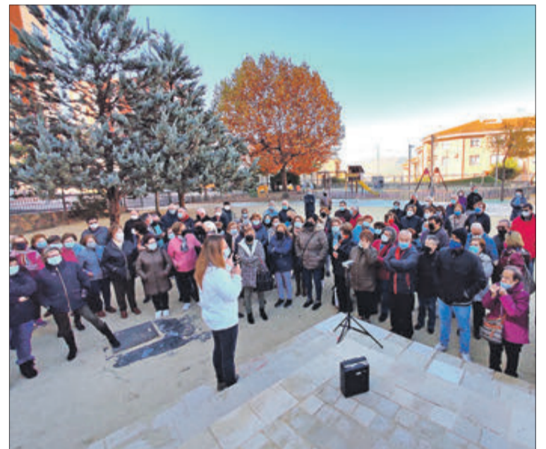
Una educadora ambiental explicant com serà el seu treball.