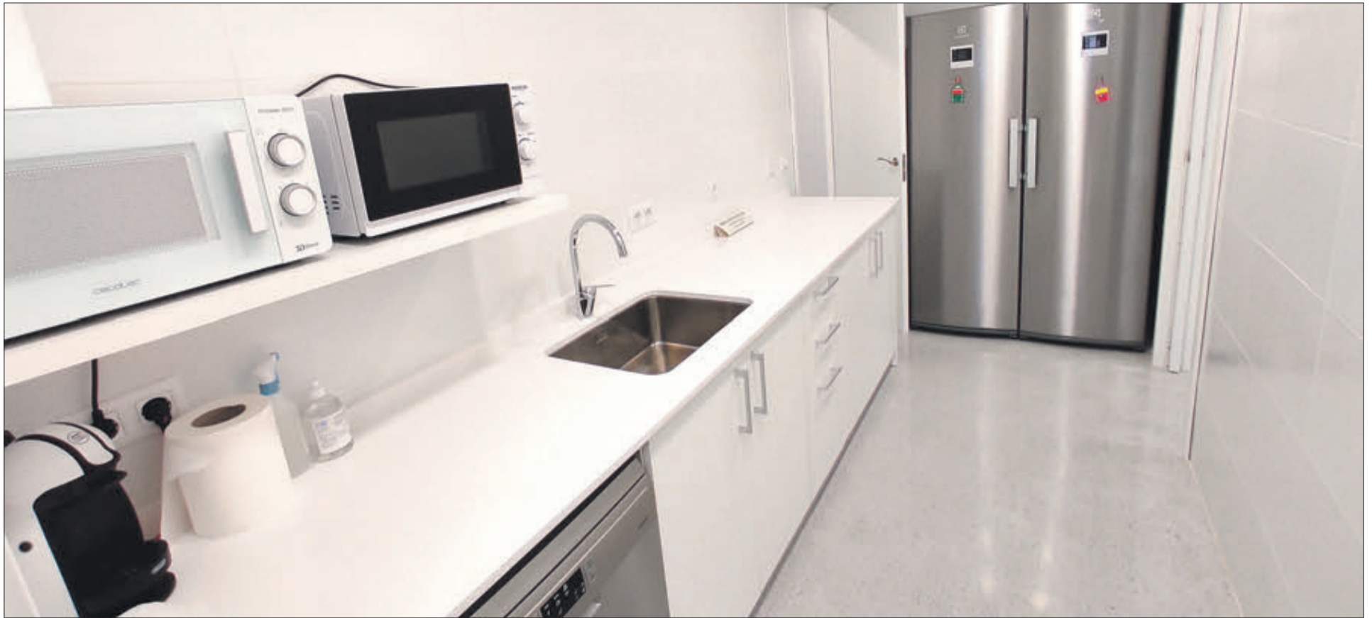
Zona de cuina.