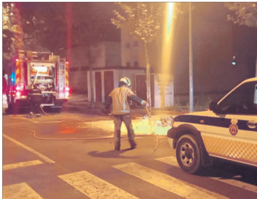
Bombers i Protecció Civil en l'extinció d'un contenidor.

Dos contenidors es van cremar a Banyeres en la segona quinzena d'octubre. Els successos es van produir de manera semblant en un contenidor situat en les proximitats del Poliesportiu Municipal i en un altre que estava molt prop de l'IES Professor Manuel Broseta. En el primer cas es van ocupar de l'extinció components de l'Agrupació Municipal de Voluntaris de Protecció Civil. En el segon, Protecció Civil va requerir la presència dels bombers per la virulència de les flames.