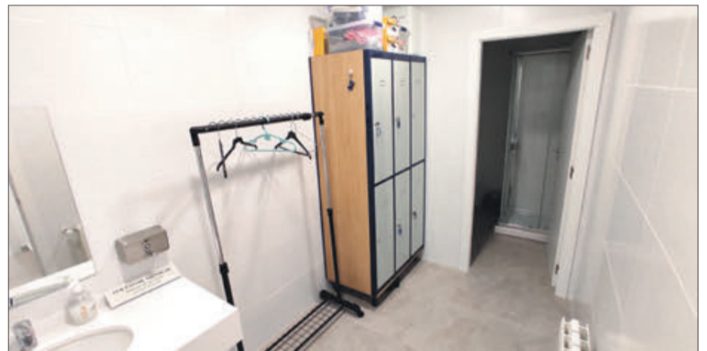
Espai destinat a vestuari del personal.