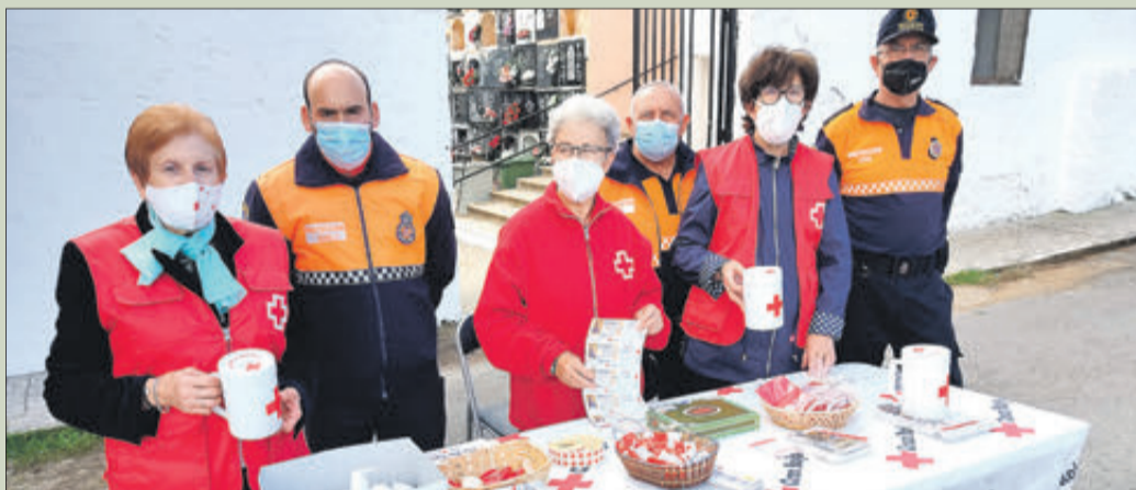
Voluntaris de Creu Roja i de Protecció Civil en una taula instal·lada en els accessos al cementeri.

Amb els fons recaptats l'entitat cobreix una part del pressupost amb el qual finança les despeses de manteniment, els projectes i les activitats benèfiques que desenvolupa en diferents àmbits.