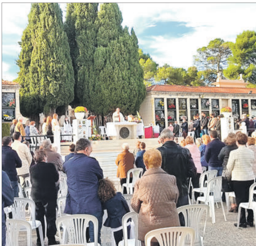
Missa celebrada en el cementeri el dia de Tots Sants.

La confraria de la Verge del Carme, amb la col·laboració de l'Ajuntament, va ser la que es va ocupar de l'organització de l'acte religiós.