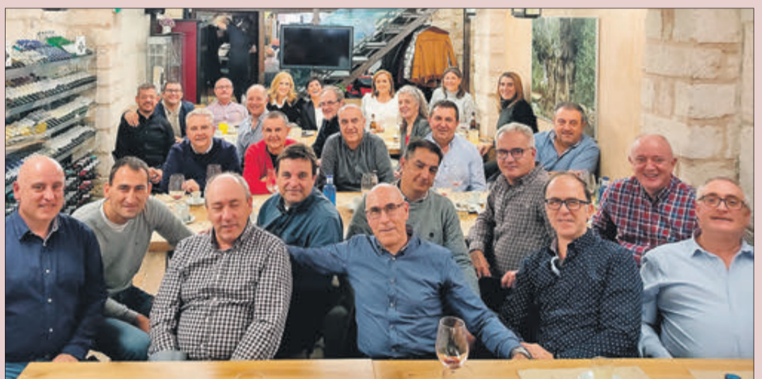
El dinar es va celebrar en el restaurant l'Aljubet.