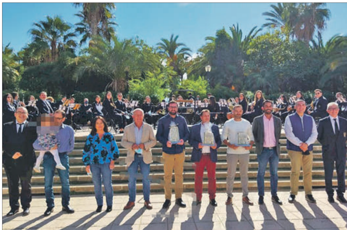
Premiats i membres del jurat.