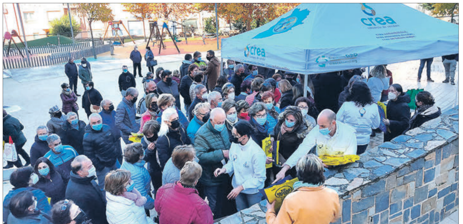
Es van distribuir bosses per a separar residus als assistents.