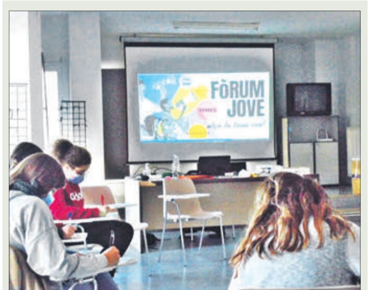
La sessió es va realitzar a la Casa de Cultura

Aquestes accions estan incloses dins del Pla Local de Prevenció d'Incendis Forestals.