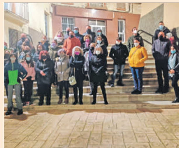
El grup es va reunir en la plaça de l'Ajuntament.

El col·lectiu Mariola Violeta va promoure una concentració el dia 26 de novembre a les 6 de la vesprada en la plaça de l'Ajuntament per a commemorar el Dia Internacional de l'Eliminació de la Violència contra la Dona. Després de la lectura d'un manifest, en el qual es va deixar patent la crua realitat que suposa, entre altres conseqüències, l'assassinat de 37 dones a les mans de les seues parelles o exparelles des de principi d'any, es va guardar un minut de silenci per les víctimes.