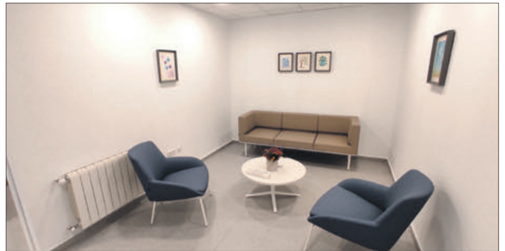
Zona d'espera de visites