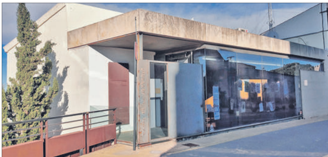
Casal de la Joventut de Banyeres.

d'algun tiquet de compra realitzada en algun dels comerços adherits que siga superior a 20 euros. En aquest tiquet es consignaran les dades de la persona (nom i cognoms, adreça i telèfon de contacte) i es dipositarà en la bústia habilitada en la Plaça Major. Qualsevol tiquet de compra que estiga defectuós, danyat o amb indicis de falsificació no serà admès. La campanya s'estendrà fins al 4 de gener pròxim.