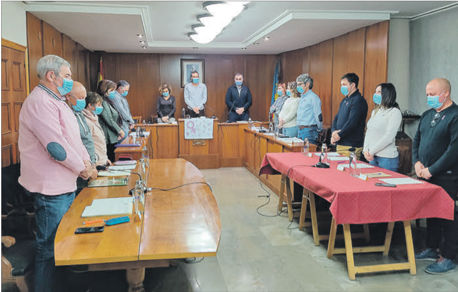
Els membres de la Corporació durant el minut de silenci.

EN EL DIA INTERNACIONAL DE L'ELIMINACIÓ DE LA VIOLÈNCIA CONTRA LA DONA