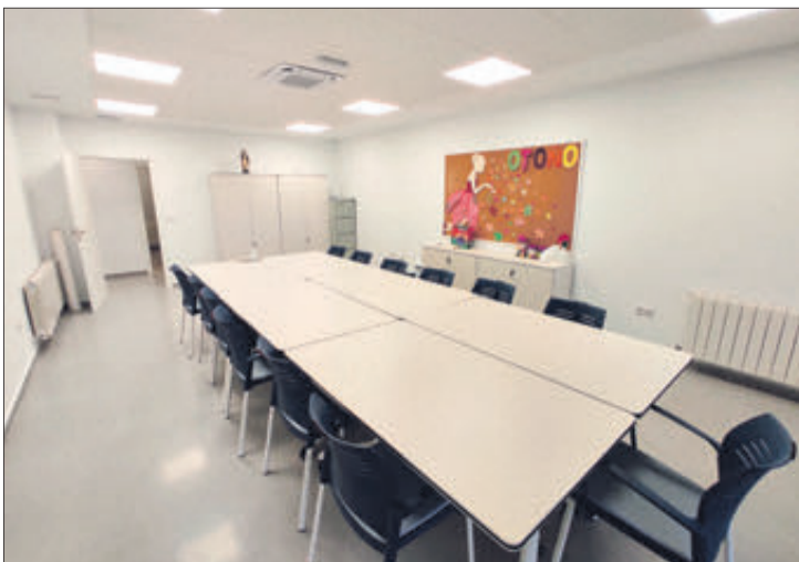
Àrea de tallers.