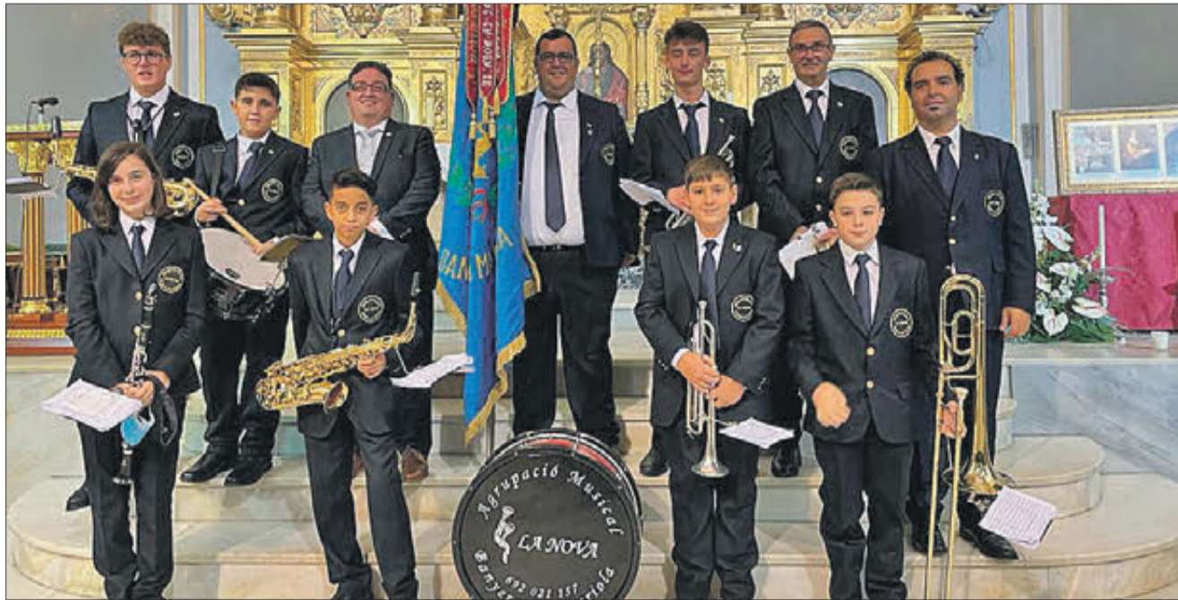
Els educands 2020-2021 que han passat a ser músics en La Nova.