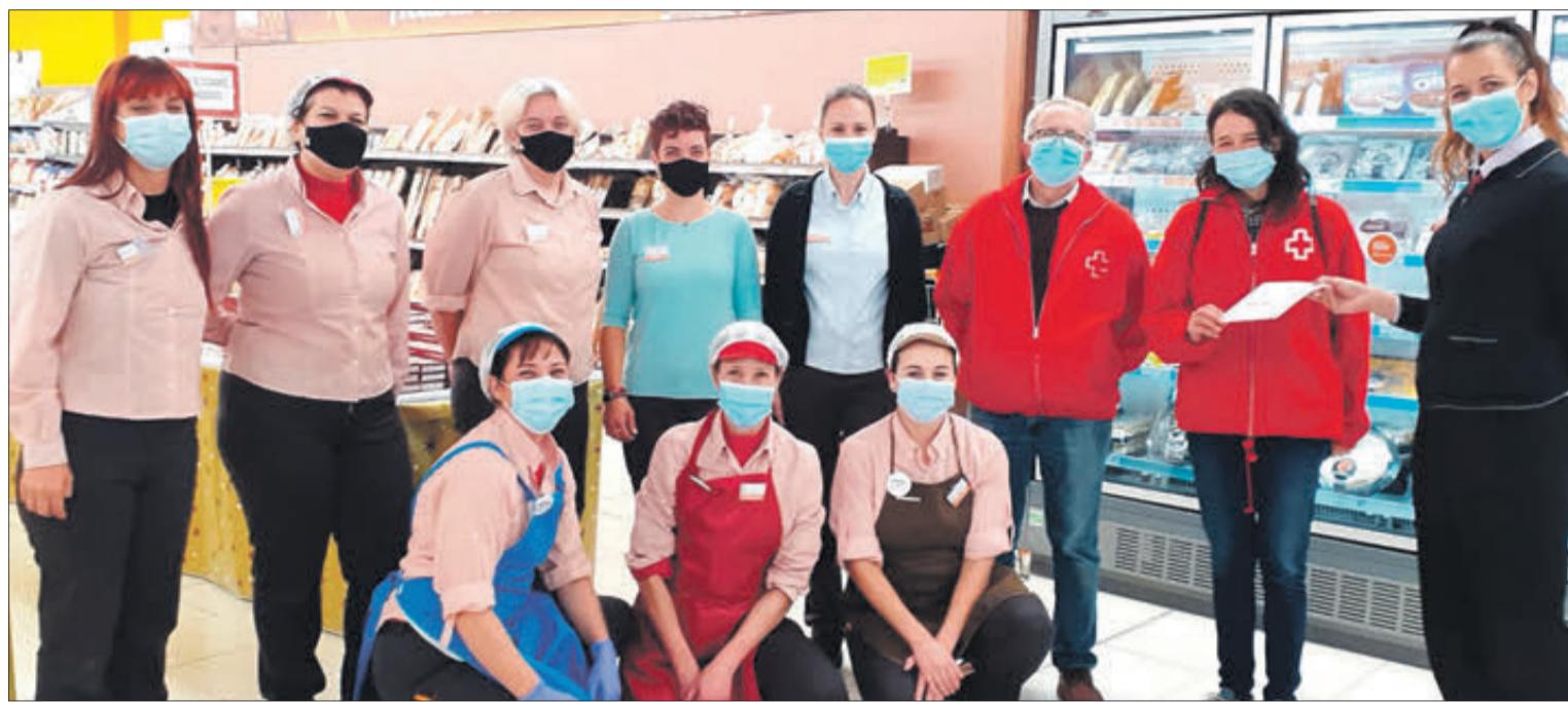
Lliurament d'un 'xec d'aliments' a Creu Roja.

Segons informació facilitada per Creu Roja, gràcies a aquesta iniciativa, en l'actualitat es distribueixen aliments a vint famílies a Banyeres i a onze a Bocairent, número que quasi es va duplicar durant els mesos més durs de la pandèmia.