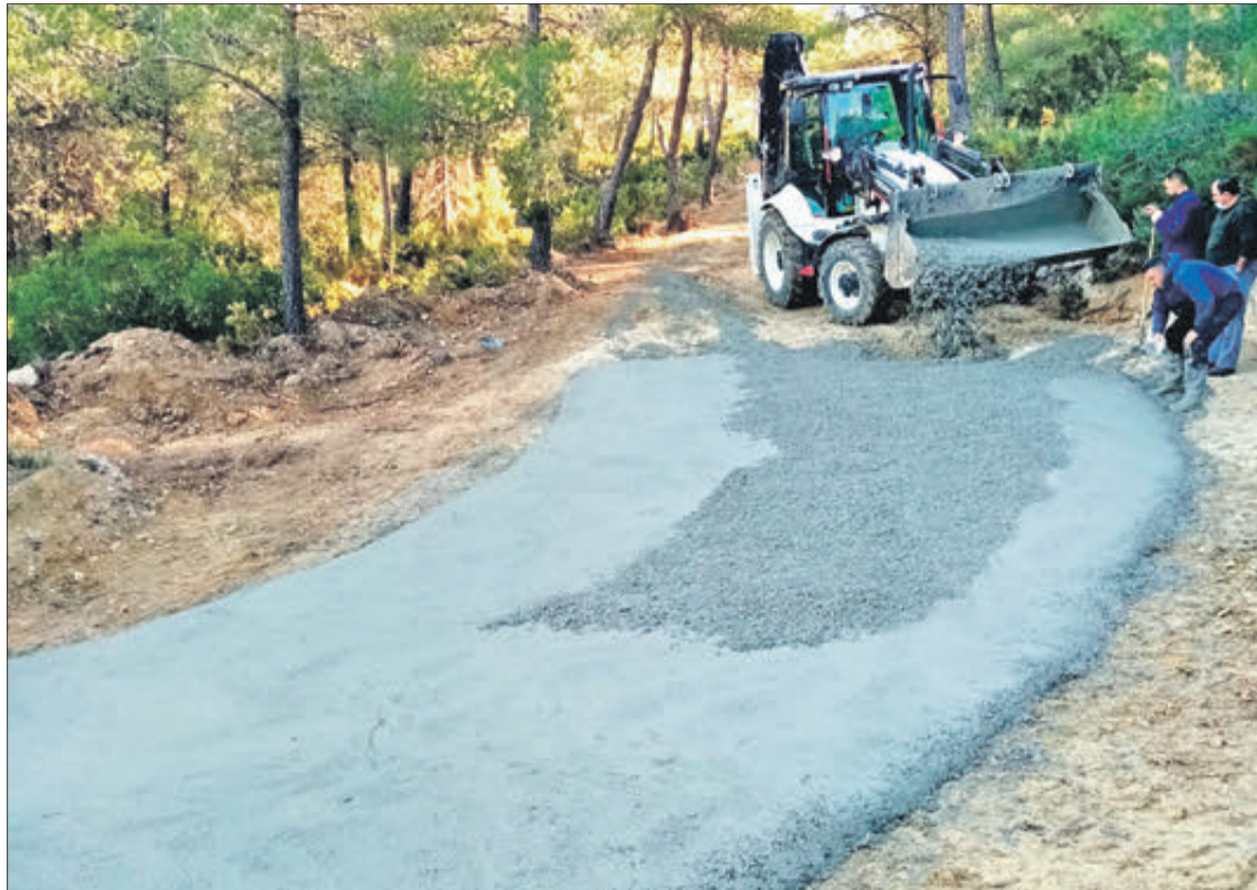
Obres en camins per a facilitar el pas dels bombers.

PER A PERMETRE EL PAS DE VEHICLES D'EXTINCIÓ D'INCENDIS