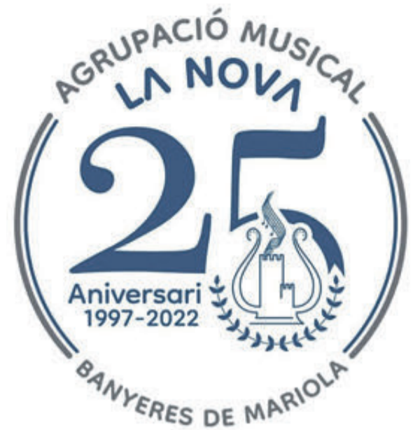
Logotip per a commemorar el 25 aniversari de la banda.