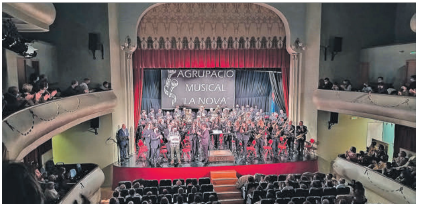
Concert de Santa Cecília de la Nova en el Teatre Principal.

La Nova ha fet públic també el logotip de les commemoracions del 25 aniversari de la institució, un programa que està perfilant-se i que en pròximes dates es farà públic per l'entitat. En ell apareix el Castell, del qual ix una lira; unes notes musicals per a simbolitzar els orígens de la banda, l'any de fundació (1997) y l'any del 25 aniversari.