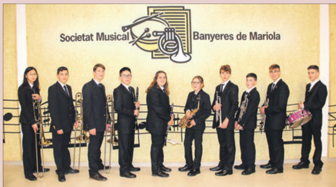
Les noves incorporacions a la Societat Musical.