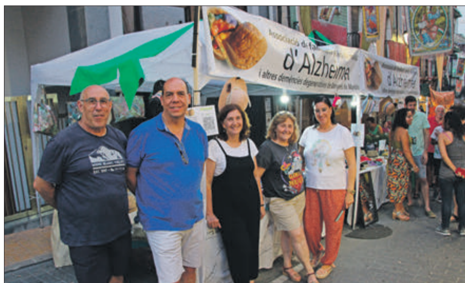
Estand de l'Associació d'Alzheimer.