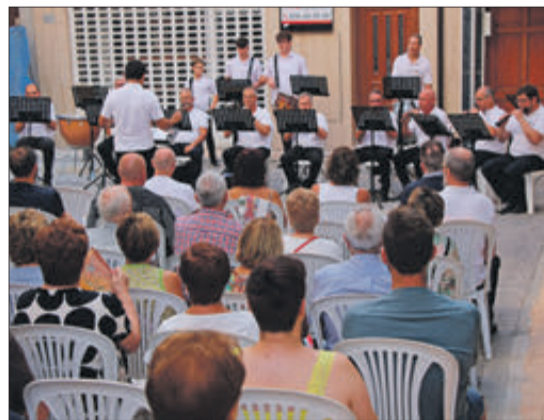
Concert de música tradicional de la Colla el Braçal.