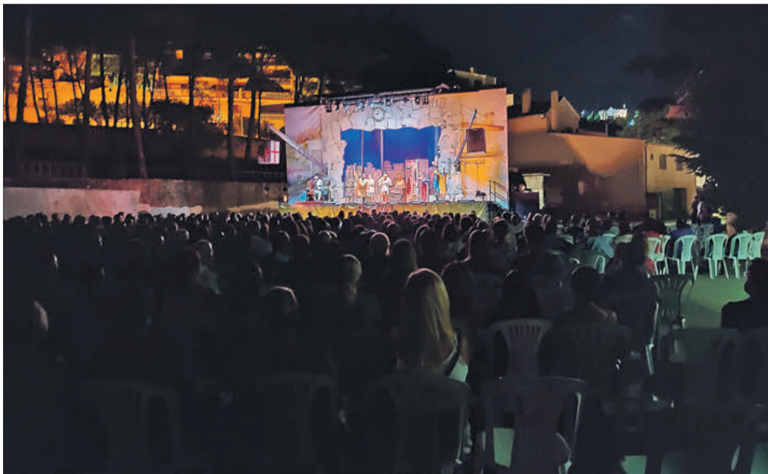
L'actuació es va oferir al parc Vil-la Rosario.

Al setembre de l'any passat es va estrenar al poble el documental "Cicle de vida i rituals de dol". Dos mesos després, coincidint amb la festivitat de Tots Sants, el documental, el cinquè realitzat des del Museu de la Paraula de Banyeres de Mariola, va ser publicat en les xarxes socials. Ara ha tornat a ser actualitat després que s'anunciara que el dia 18 de juliol es presentaria en l'Institut Alacantí de Cultura Juan Gil-Albert, una de les principals institucions d'àmbit cultural amb què compta la província. Com es recordarà, el documental versa sobre els costums i rituals heretats de segles passats que s'han mantingut durant el temps i que han de veure amb la mort i, per consegüent, el ritual del funeral.