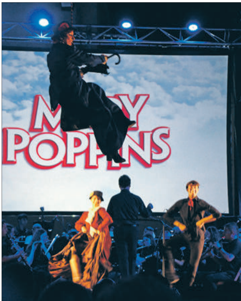
Mary Poppins "va volar" sobre el públic complementant una coreografia.

La major part de les interpretacions musicals van comptar amb la projecció d'escenes de les pel·lícules. Així mateix, es van acompanyar amb l'execució de diferents coreografies a càrrec de components del Ballet Masters d'Ontinyent, combinació que va resultar especialment atractiva per al públic assistent. Una de les més destacades va ser la que es va complementar amb el vol sobre el públic del personatge de Mary Poppins, detall que va ser possible amb l'ús d'una tirolina.