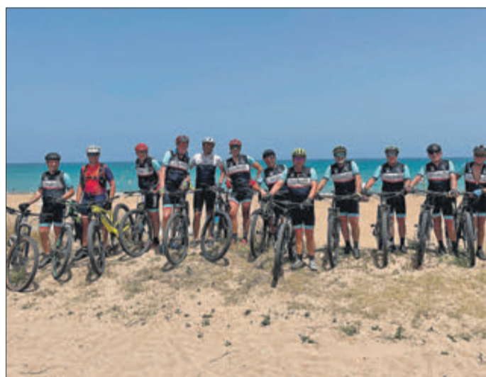
Bany obligat a la platja de la capital de la Marina Alta.

Un grup format per dotze ciclistes del poble va fer la ruta Banyeres-Dénia en bicicleta de muntanya, una experiència que fan any rere any. L'itinerari mou al poble i es fa completament per camins, sendes i pistes forestals. Des de Banyeres es va per la via verda fins a Muro, Beniarrés i l'Orxa, on es creua el riu Serpis. A continuació es travessa la serra fins a arribar a Benissili, a la Vall de Gallinera. Allí està el punt elegit per a recuperar forces amb l'esmorzar i tot seguit es puja al Mirador del Xap, des d'on es veu una fantàstica panoràmica de la Vall de Gallinera i la Vall d'Ebo. Després s'ascendix fins a les proximitats de l'Alt del Miserat des d'on comença el descens fins a Pego. Finalment, a través de les marjals, s'arriba a El Verger i més tard a Dénia, on espera un bany a la platja i un dinar de germanor.