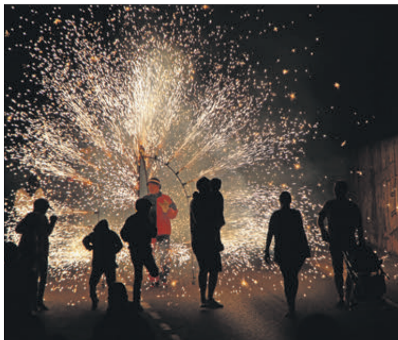
El correfoc és una de les cites més esperades de l'any.

amb l'espectacle de les bengales, els coets i l'olor de pólvora. Estructures pirotècniques, efectes especials, dimonis estimulants al personal, gent ballant sota les bengales... van fer que la nit es convertira en màgica i que una multitud de persones gaudira d'un espectacle inigualable. La festa va acabar amb una apoteosi final en l'avinguda del 9 d'octubre i amb una revetla popular que es va prolongar fins a la matinada.