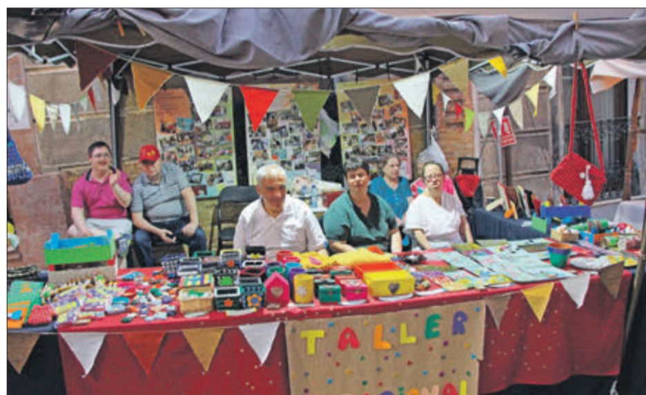
Zona del Taller Ocupacional.