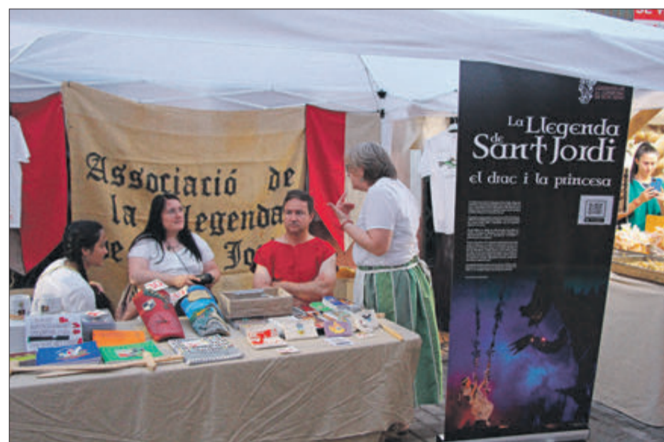
La Legenda de Sant Jordi també va estar representada.