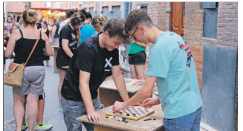
Joves en la zona de jocs de la fira.