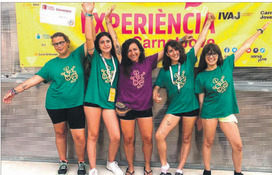
Joves corresponsals del poble a la Trobadra Autònoma.

va registrar major participació va ser la del districte 2 secció 1 taula B, situada en la Llar del Jubilat, amb un 86,55%, seguida de la taula única situada en la Fundació Ribera, que va registrar el 85,58%.