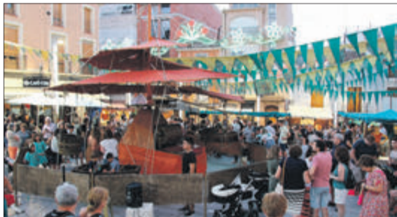
Aspecte que presentava la plaça en les hores centrals.