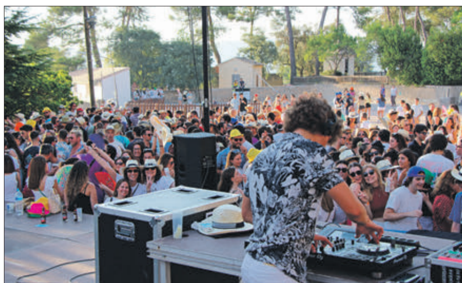
Festa en Vil·la Rosario després de les paelles de les filaes.