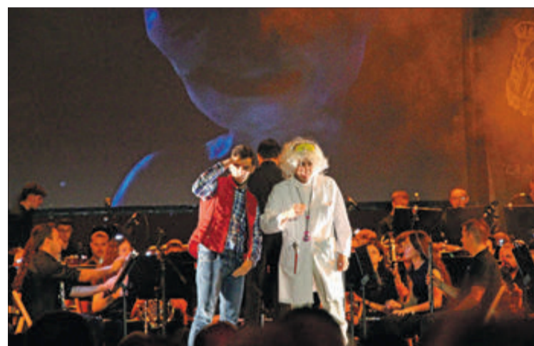
Els conductors de l'acte durant la presentació d'una de les composicions.