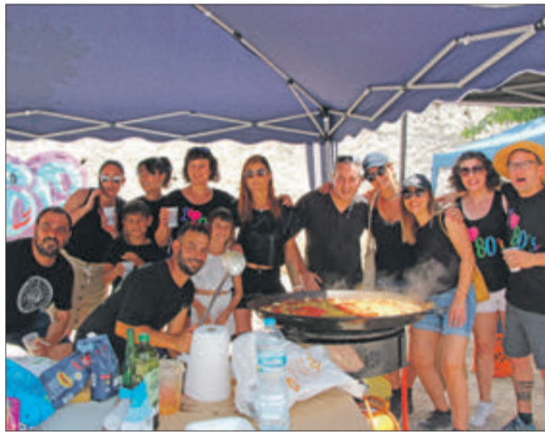
La calor no és impediment per a gaudir.