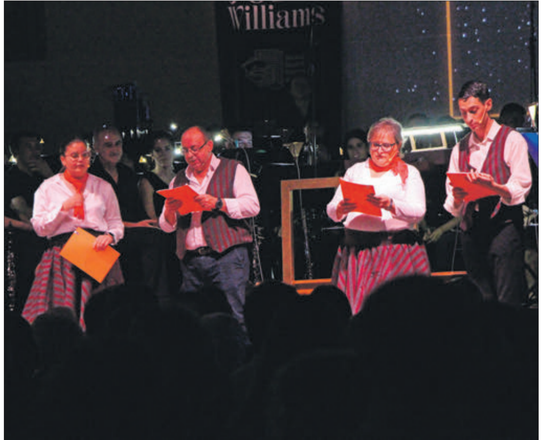
Els presentadors van aportar un toc divertit a l'espectacle.

AMB UN REPERTORI DE BANDES SONORES DE CONEGUDES PEL·LÍCULES