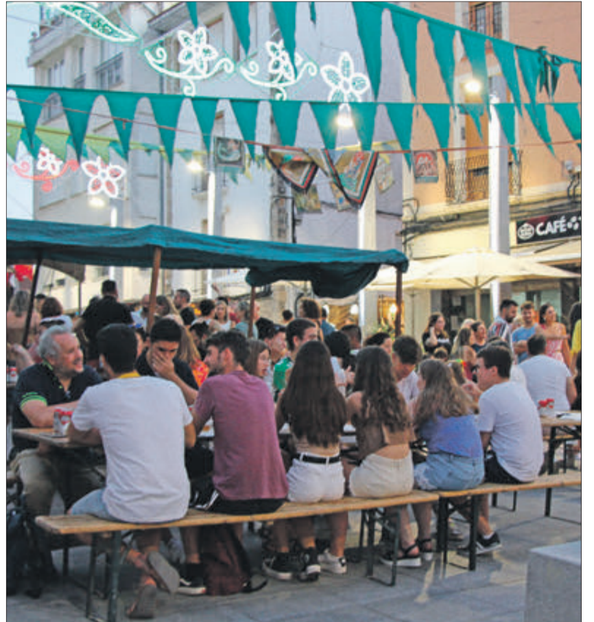
Zona de bars en la plaça Major.