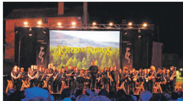
La Nova sobre l'escenari del parc Vil-la Rosario.