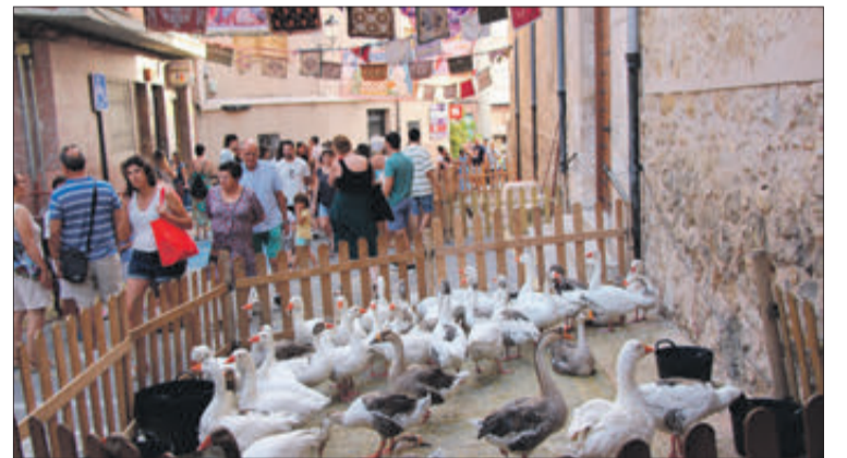
Zona en la qual estaven els animals de granja.