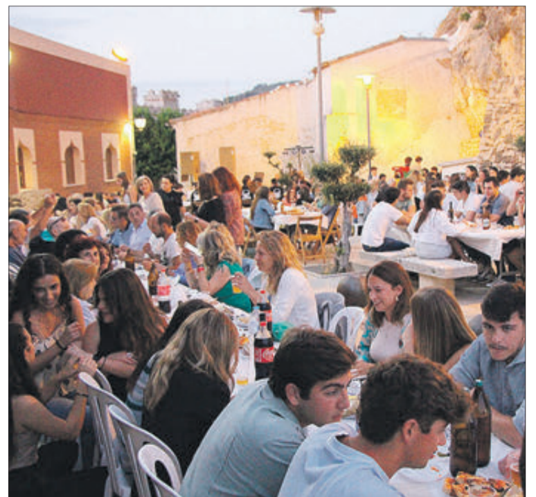
Un moment del sopar.

Al voltant de tres-centes persones dels filaes de Moros Vells i Maseros es van reunir el 30 de juny, últim divendres del mes, per a celebrar el "Sopar a la sombra del Castell". El sopar, de cabasset, es va complementar amb la beguda i l'aperitiu que van oferir els organitzadors i les copes que es van reservar per a més tard. En un ambient d'alegria el sopar va estar acompanyat per una xaranga que va estendre la seua actuació fins més enllà de les postres, la qual cosa va suposar l'inici del ball posterior. Més tard la música disco va prendre el relleu fins al final. Els assistents van acudir al sopar amb bona cosa de jaquetes -que no van sobrar- advertits pel fresc que ha caracteritzat a aquest esdeveniment en ocasions precedents, donat el seu emplaçament d'altura, en la placeta que hi ha al peu del Castell, enfront del maset dels Moros Vells, on és normal que bufe el vent.