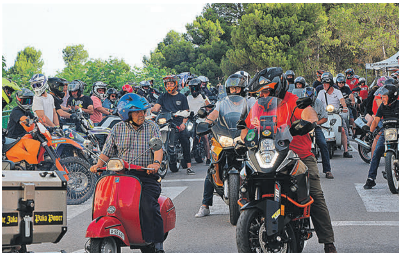
Motos en el moment de l'inici de la ruta.

San Cristóbal és representat portant al Nen Jesús. D'ahí ve que fóra pres com a patró, en un primer moment pel gremi dels carreters, després dels camioners (el seu equivalent modern) i per últim de tots els conductors.