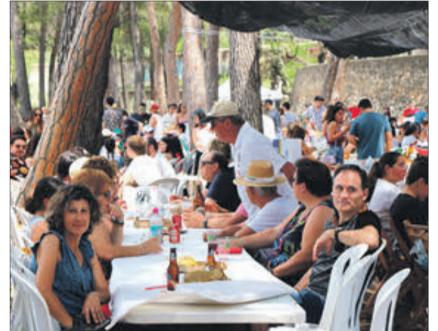
Més de mil persones es reuneixen eixe dia per a dinar.

UNA JORNADA FESTIVA AMB UN AMBIENT INIGUALABLE