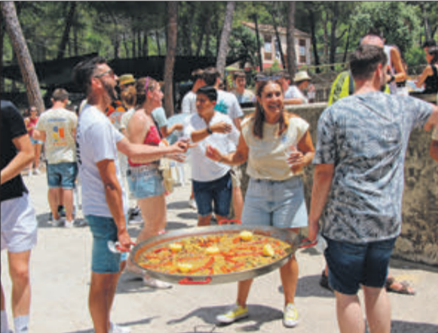
Una jornada caracteritzada pel bon ambient.