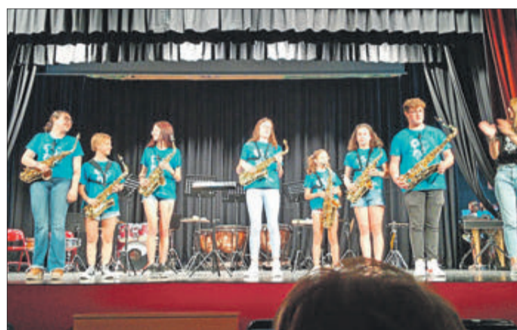
Alumnes de saxofon del centre Tina Ferre.

A més dels finals de curs dels col·legis i de l'institut, dels que es va fer referència en l'última edició del periòdic, altres centres educatius van celebrar actes de cloenda de l'any acadèmic 2022-2023 per tal de tancar una etapa i donar pas al que s'iniciarà després de les vacances estivals. Entre ells està l'Escola de Música Tina Ferre, que va organitzar distintes audicions en les quals van participar els alumnes en funció de l'instrument que estudien. Va ser els dies 27 i 28 de juny en el Teatre Principal.