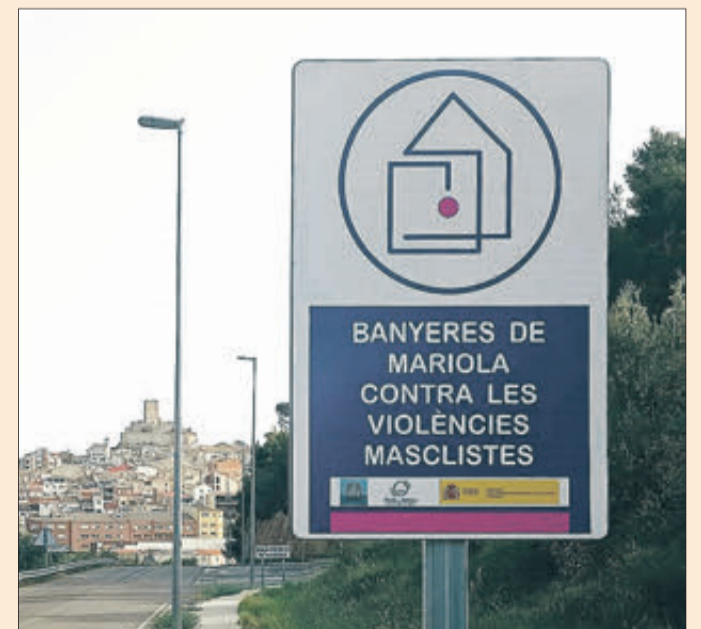
Una de les senyals que s'han instal·lat.

L'Ajuntament ha situat a les entrades del poble senyalització al·lusiva a estar en contra de la violència masclista. S'identifica, d'aquesta forma, que el poble és membre de la Xarxa de Municipis Protegits contra la Violència de Gènere. Aquesta iniciativa té com a finalitat aconseguir una acció més eficaç en la prevenció, detecció i eliminació de qualsevol forma de violència contra les dones, possibilitant que es pugui portar a terme una acció coordinada i transversal que asseguere una resposta eficaç i ràpida en casos de dones víctimes de maltractament.