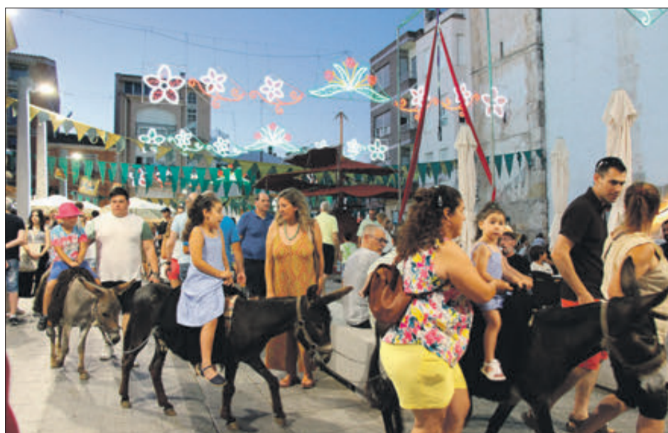
Activitats de diversió per als més menuts.