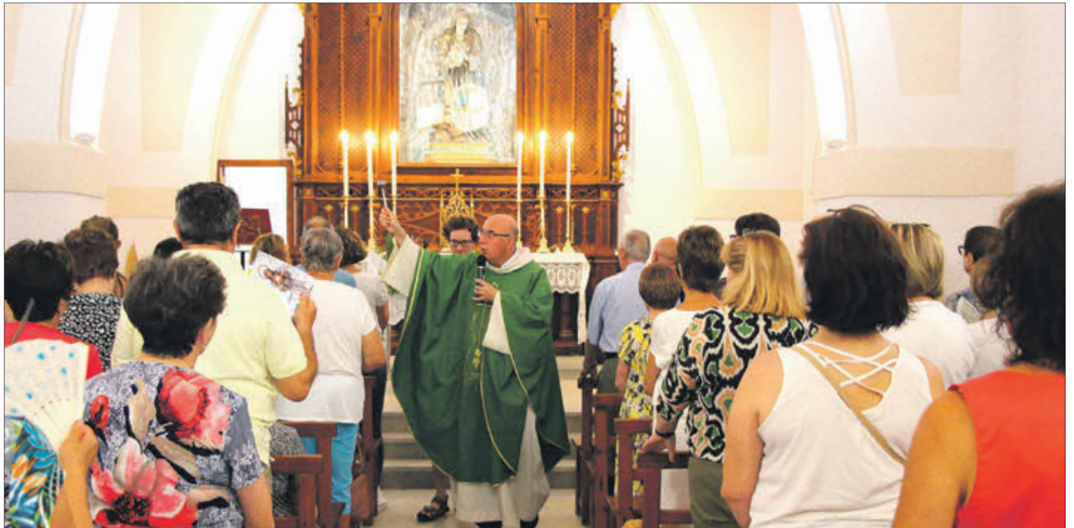
Benedicció de les obres de millora.

La rondalla i el grup Aires de Mariola van obsequiar una vesprada d'aquest calorós mes de juliol amb una vetlada de balls tradicionals als usuaris del Centre Geriàtric, una actuació que va dur els residents a revivir tradicions i evocar grans records. Vestits amb els trages regionals i amb la seua passió per preservar les arrels culturals, els balls i la música de la rondalla van omplir l'ambient d'una atmosfera festiva i plena d'alegria, propiciant el divertiment dels residents i el record i la nostàlgia de temps passats.