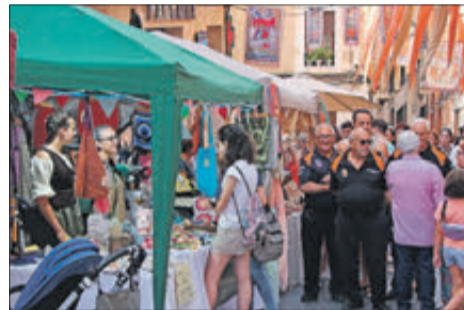
El mercat va aportar gran animació.

LA FIRA REMEMORA L'ANTIC MERCAT QUE SE CELEBRAVA AL POBLE