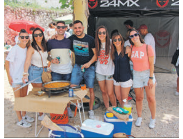
L'esdeveniment reuneix grups d'amics i quadrilles.