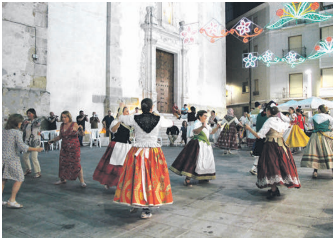
Danses en la plaça Major.

EL FLOKLORE LOCAL VA ESTAR PRESENT EN LA FESTA