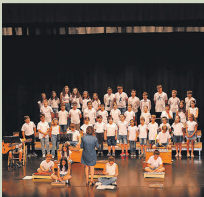
La fi de curs va incloure interpretacions musicals.

El Conservatori Elemental de Música, igual que altres centres educatius, va programar una activitat per a acomiadar el curs 2022-2023. L'esdeveniment es va dur a terme el dia 21 de juny en el Teatre Principal. En la primera part van participar els alumnes de l'assignatura de Llenguatge Musical de primer a quart curs, així com el grup de majors, que va interpretar un repertori de cançons. La segona va incloure l'acte de comiat dels alumnes de quart curs, que finalitzen els seus estudis elementals. En la tercera part van intervenir el director del centre i l'alcalde per a clausurar l'acte.