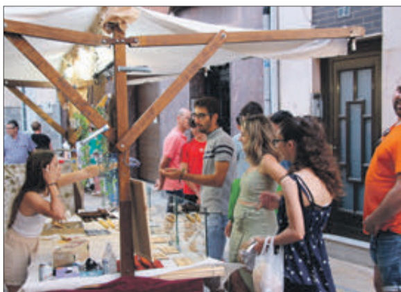
Un grup realitzant compres en una de les paradetes.