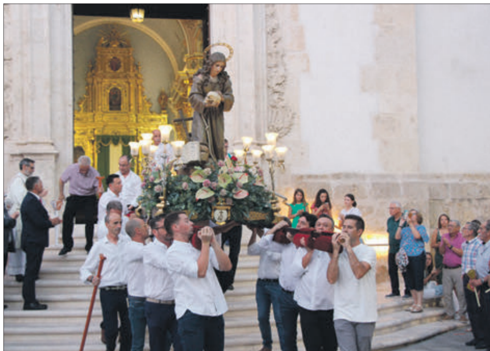
La imatge de Santa Maria Magdalena eixint de l'església.