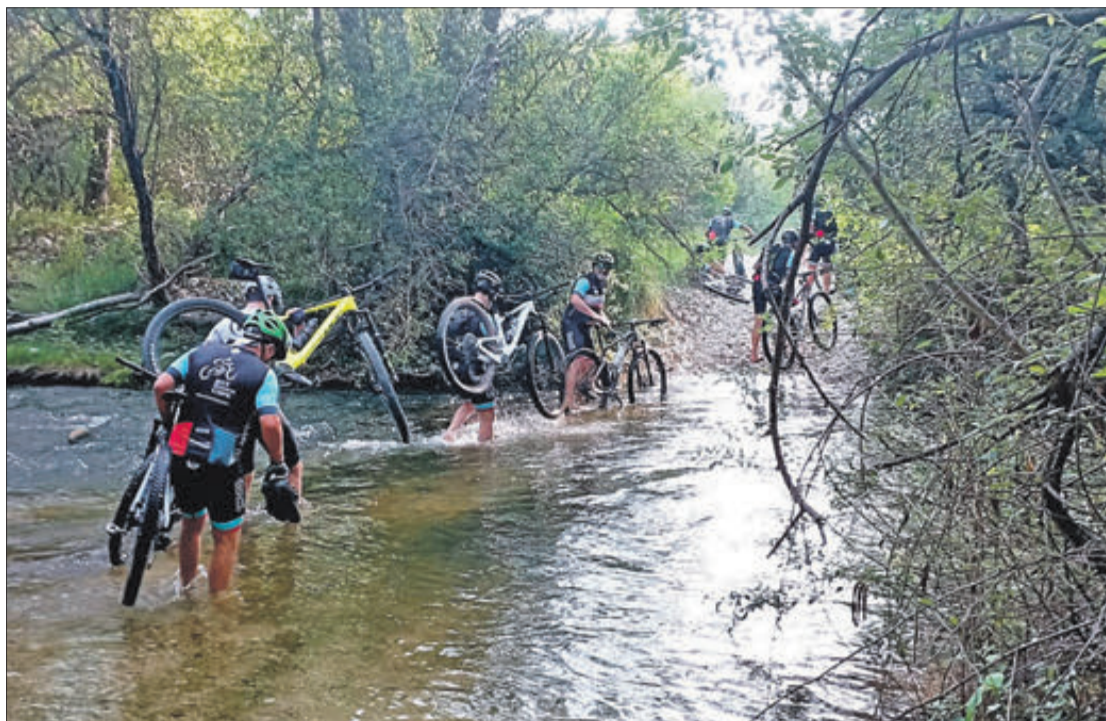
Moment en què es creua el riu Serpis.

EL GRUP REPETIX L'EXPERIÈNCIA ANY RERE ANY