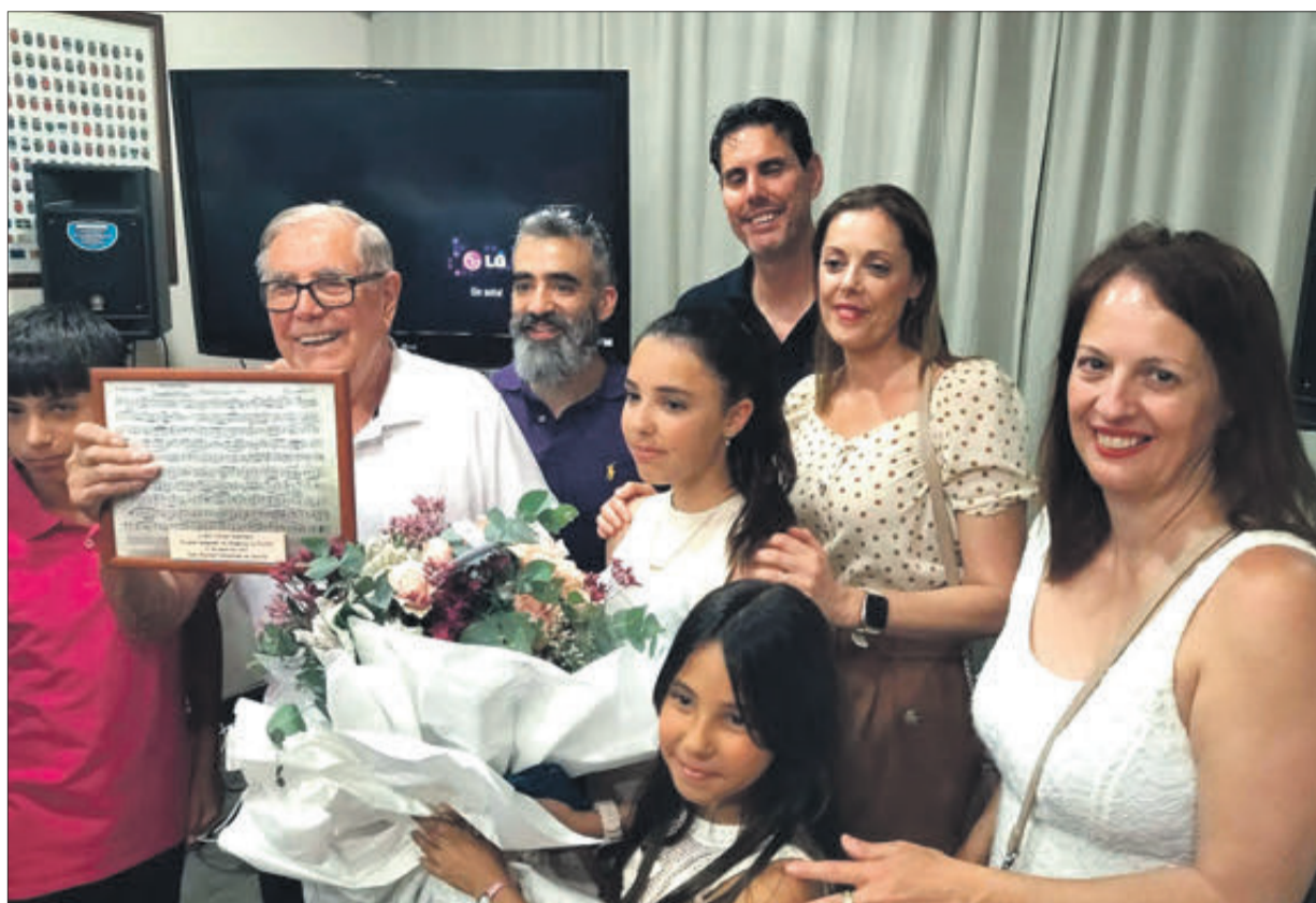
L'homenatjat amb la seua família.