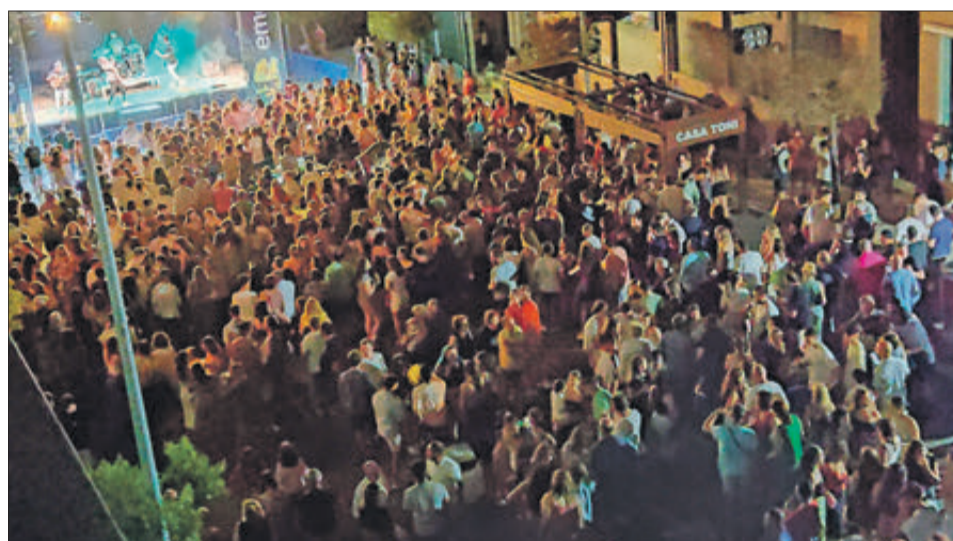
Revetla en l'avinguda del 9 d'Octubre.