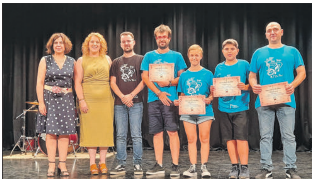
Cloenda de l'Escola de Música Tina Ferre.