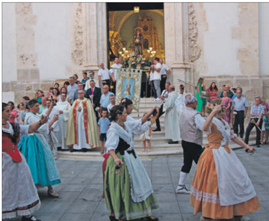
Balls folklòrics en honor de la Patrona.