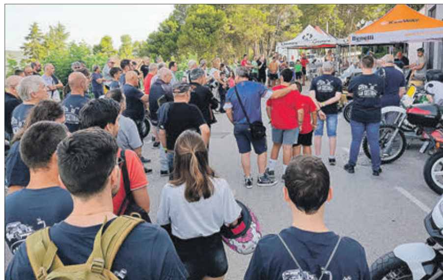
Instant del rés de l'oració abans de partir.