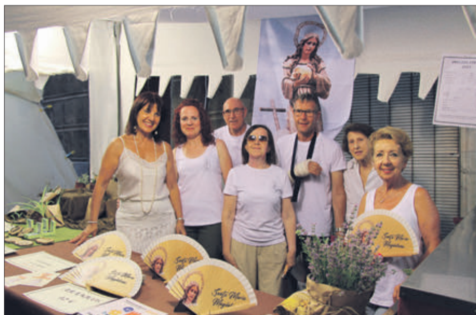
Components de la Confraria de la Malena.