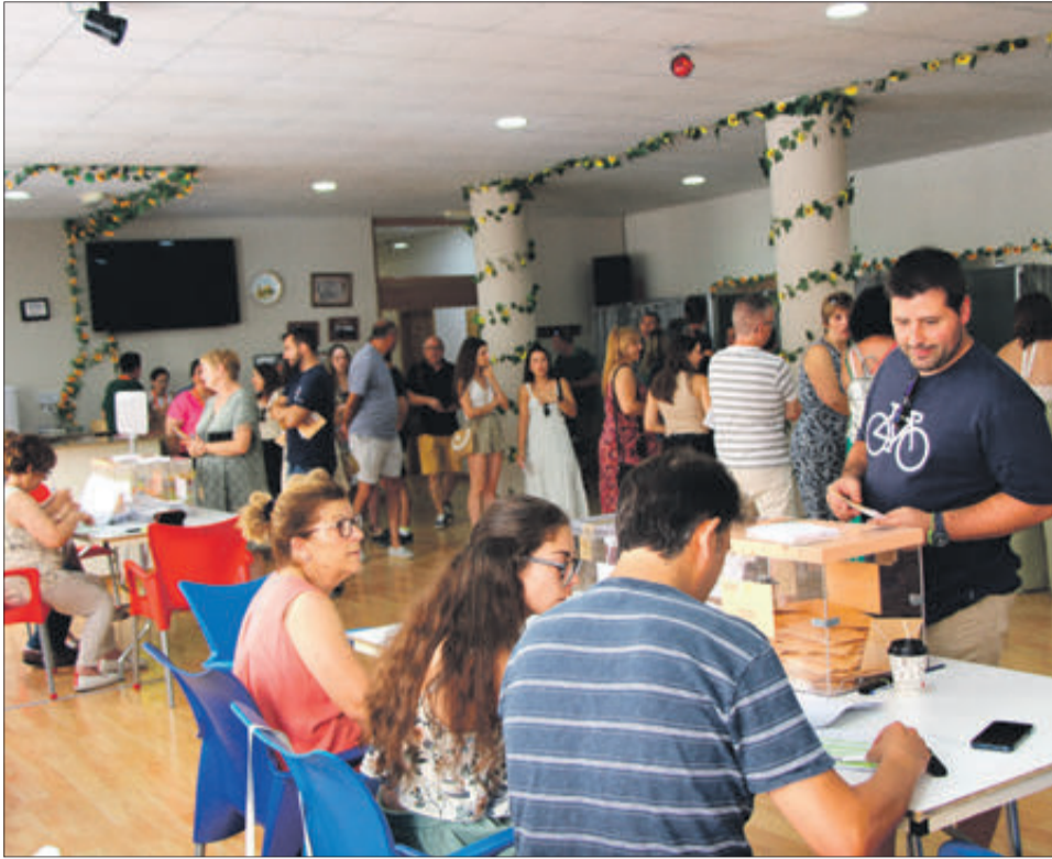
En la Llar del Jubilat es concentren quatre meses electorals.