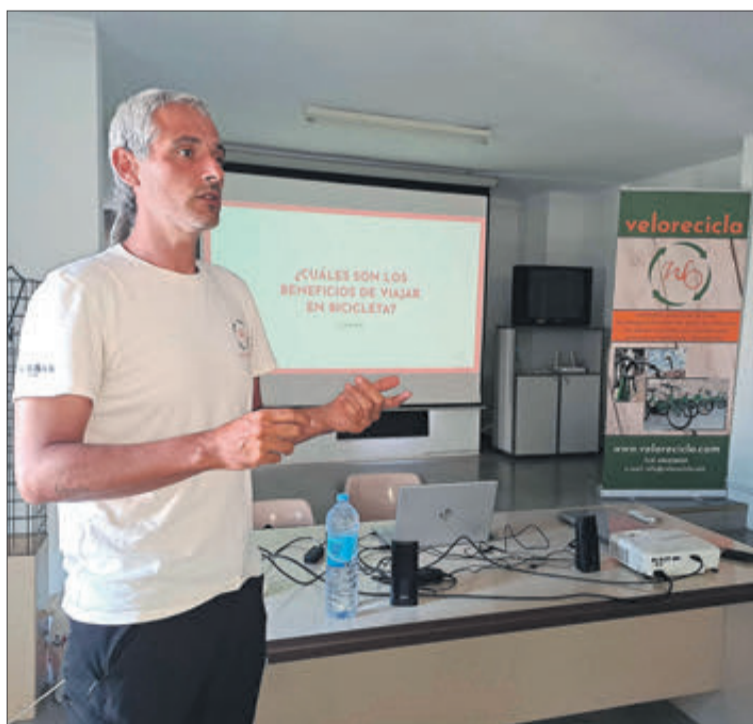
Un moment de la xarrada.

Un grup format per dotze ciclistes del poble va fer la ruta Banyeres-Dénia en bicicleta de muntanya, una experiència que fan any rere any. L'itinerari mou al poble i es fa completament per camins, sendes i pistes forestals. Des de Banyeres es va per la via verda fins a Muro, Beniarrés i l'Orxa, on es creua el riu Serpis. A continuació es travessa la serra fins a arribar a Benissili, a la Vall de Gallinera. Allí està el punt elegit per a recuperar forces amb l'esmorzar i tot seguit es puja al Mirador del Xap, des d'on es veu una fantàstica panoràmica de la Vall de Gallinera i la Vall d'Ebo. Després s'ascendix fins a les proximitats de l'Alt del Miserat des d'on comença el descens fins a Pego. Finalment, a través de les marjals, s'arriba a El Verger i més tard a Dénia, on espera un bany a la platja i un dinar de germanor.