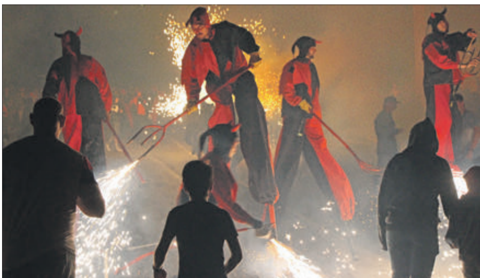
Correfoc de la Colla de Dimonis la Quarantamaula.

a l'ermita i a continuació es va celebrar l'homenatge als majors, en el que va participar el grup de danses Aires de Mariola. Amb aquest acte va finalitzar la programació de les festes de la Malena d'enguany.