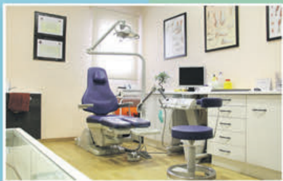
Cites de podologia Tf 660335448

afisiona't FISIO I MÉS Fisioteràpia, Osteopatia, Pilates