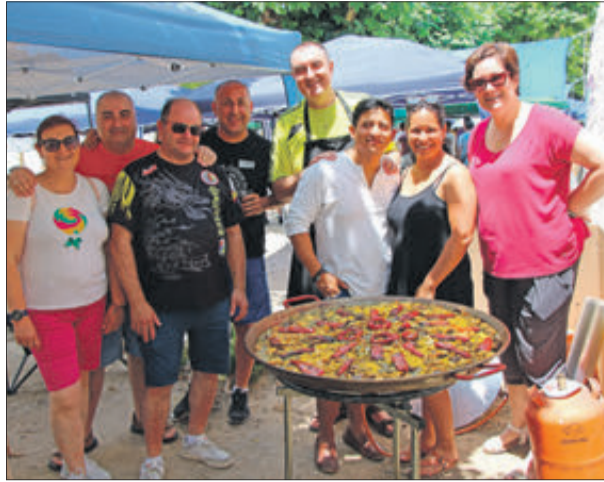
El concurs posa en lliça les habilitats culinàries dels xefs.