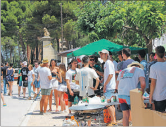
El Dia de les Paelles és un clàssic de la festa de la Malena.