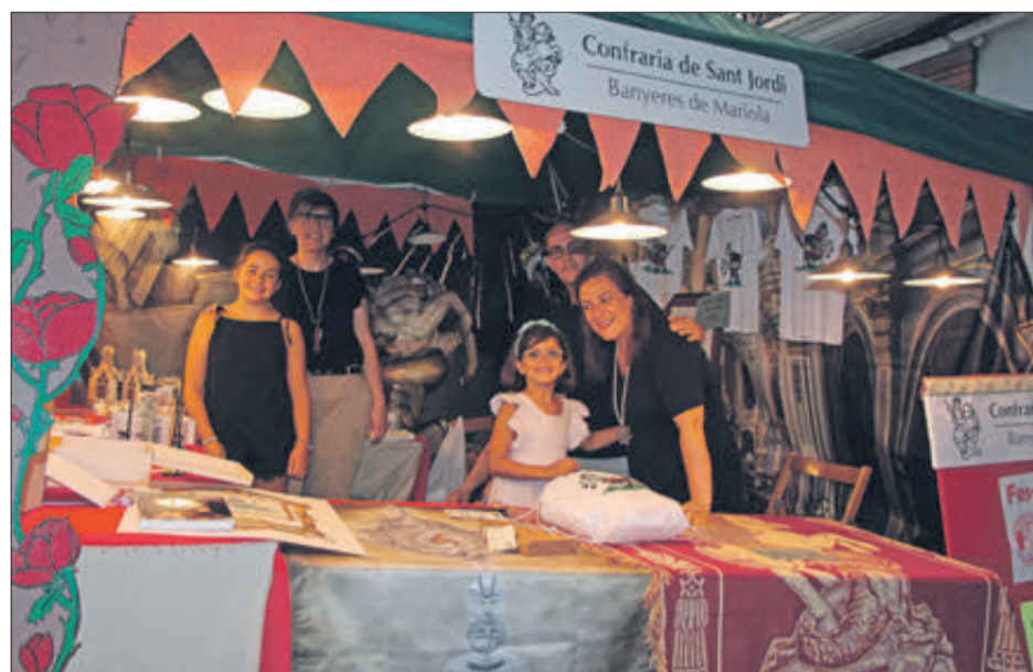
Espai de la Confraria de Sant Jordi.