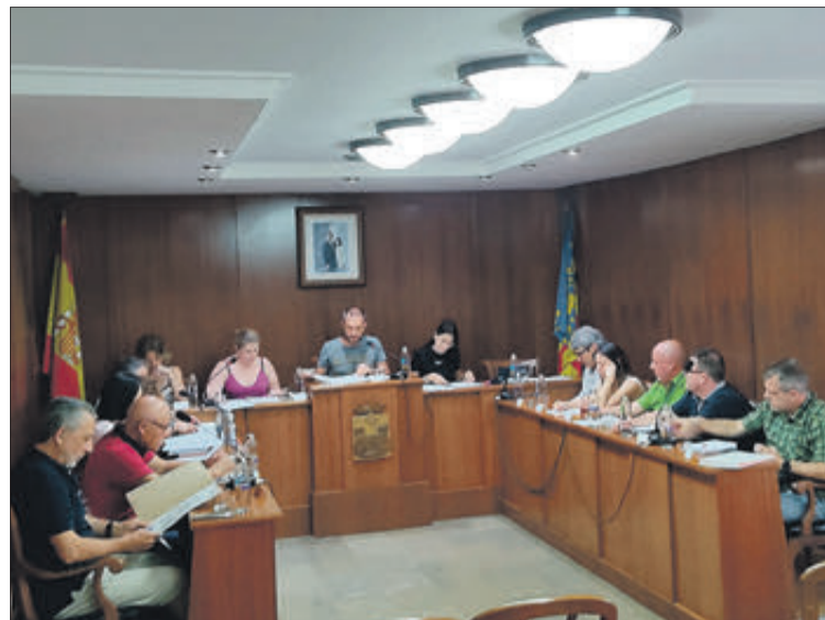
La Corporació va celebrar el Ple d'Organització.