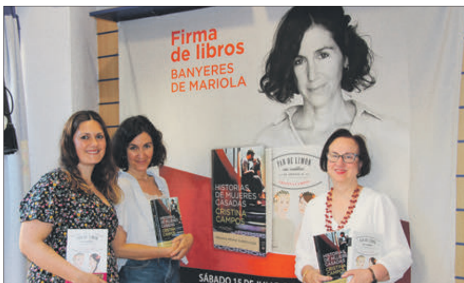
Signatura de llibres en la libreria Món Màgic.