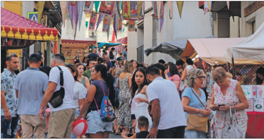
El mercat medieval va omplir de gent els carrers.