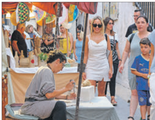
Articles i oficis tradicionals en el carrer Major.