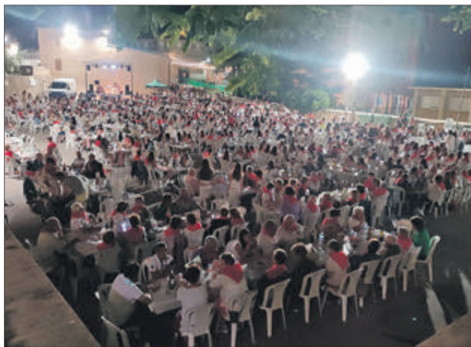
Sopar temàtic en el dia de Sant Fermí.

E l bon ambient ha sigut la constant de les activitats que ha organitzat la Comissió de Festes de la Malena, formada pels joves que enguany complixen els 25 anys. Cal destacar, entre altres i a més a més del Dia de les Paelles, els sopars a la fresca "Àngels i dimonis" que es va fer encara en juny, el que es va fer el 7 de juliol inspirat en la festa de Sant Fermí, així com el cerca tasques, els músics de carrer que es van fer un dia després, així com les diferents revetles programades, activitats que en tot el seu conjunt han aprofitat per a animar moltíssim aquests dies de les festes patronals. Enhorabona.