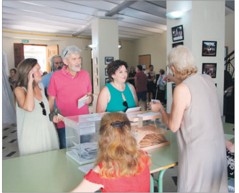
La Fundació Ribera és la mesa amb el cens més nombrós.

LA PARTICIPACIÓ VA SER DEL 82,40 PER 100