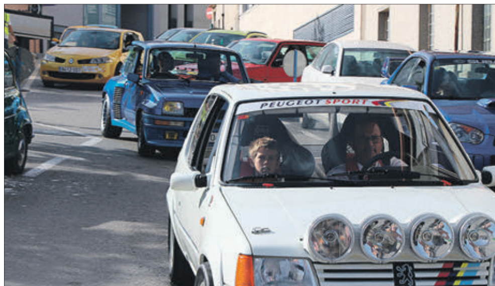
També van participar un bon nombre de turismes.