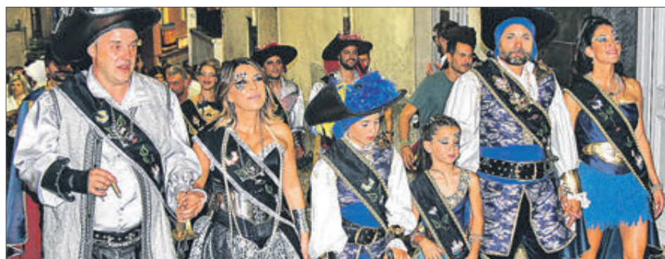
Capitania filà Pirates.