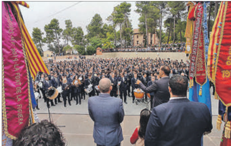
Interpretació de 'Banyeres' per 800 músics.

Abans de l'actuació conjunta l'Alcalde i el president de La Nova van agrair a tots l'assistència i col·laboració en un acte tan significatiu del 25 aniversari de l'entitat, en especial als músics de tots els pobles que van participar. També es va posar un corbatí commemoratiu a la bandera de la nova i es van entregar plaques en record del dia a l'Ajuntament i a la Federació de Societats Musicals.