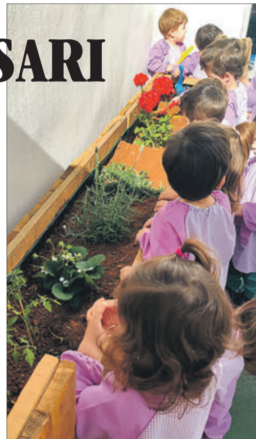
Alumnes durant una activitat al pati del centre.