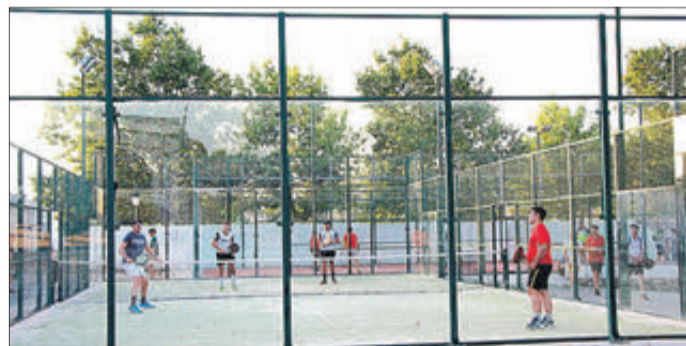
Partida de pàdel.