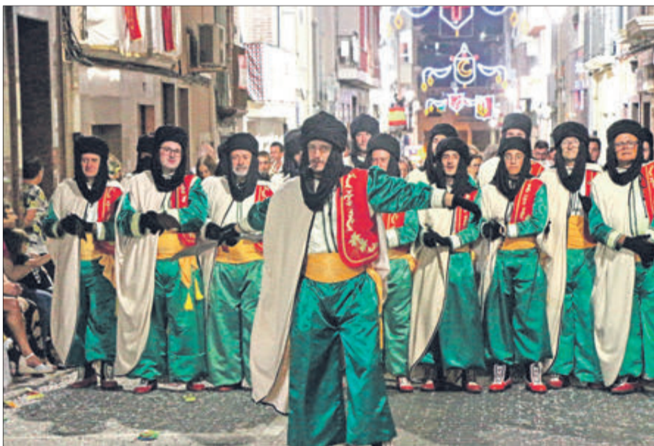
Califes pel carrer La Creu.