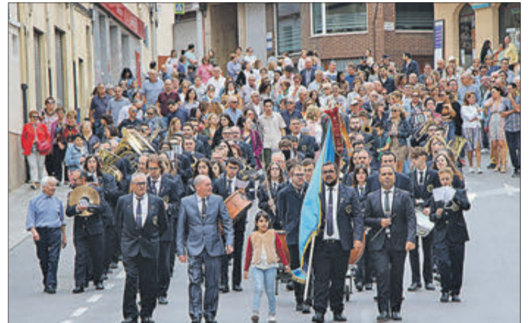
La Nova durant la desfilada.