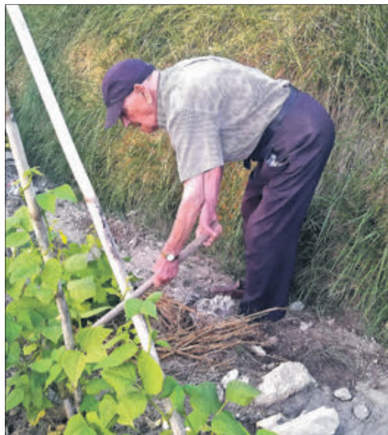
Cuidar l'horta és una de les seues aficions.

un partit de futbol, per citar alguns exemples, i té, al mateix temps, una extraordinària memòria. Però el millor de tot és la seua visió positiva sobre l'existència i sobre la importància de saber quedar-se amb les coses bones, viure feliç i deixar de costat el