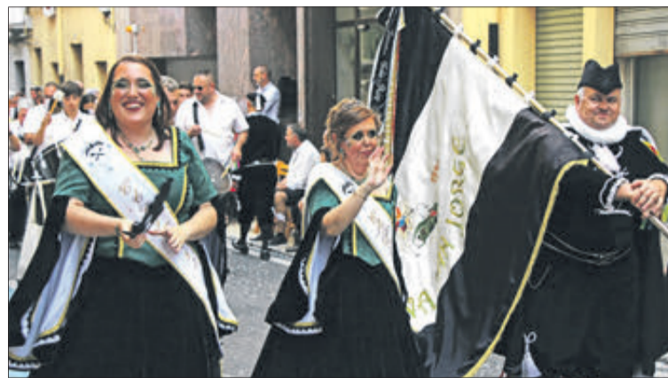
Capitania filà Estudiants.