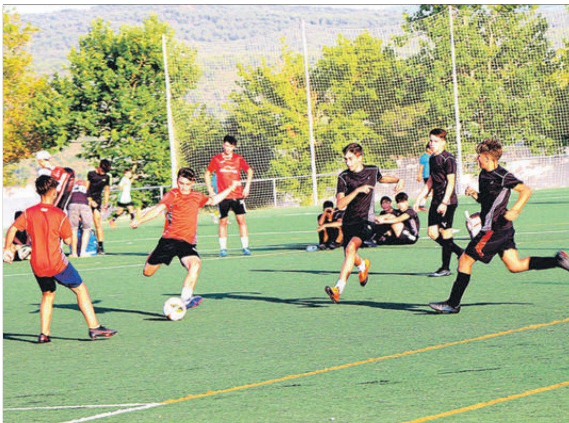
Finals de futbol.