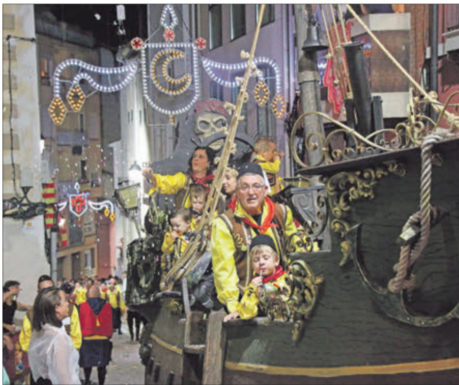
El vaixell dels Pirates.