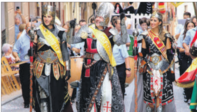
Capitania filà Cristians.