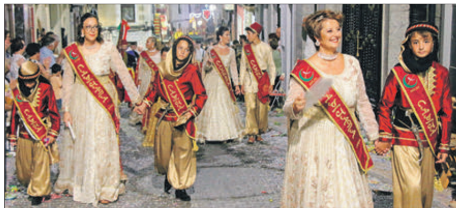
Capitania filà Marrocs.