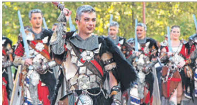
Cabo i esquadra dels Jordians.