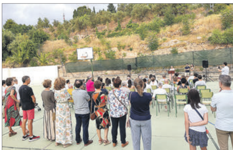
L'homenatge sorpresa es va fer al col·legi.