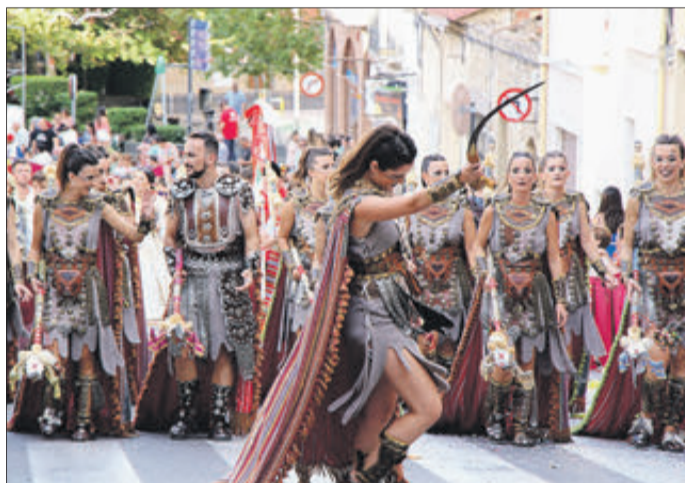
Esquadra del boato dels Maseros.