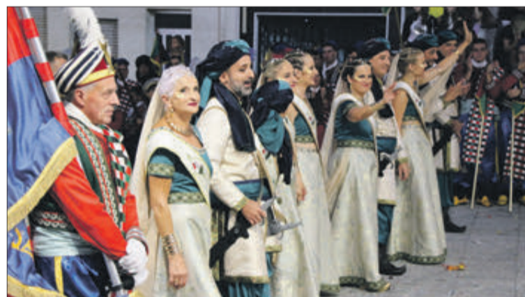
Capitania filà Moros Vells.