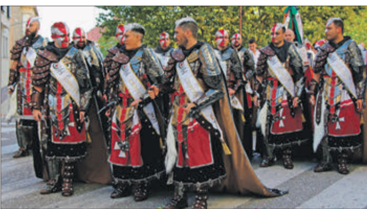
Capitania filà Jordians.