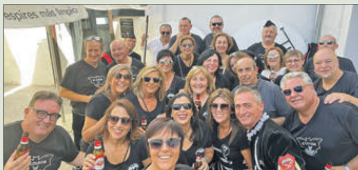
Festers dels Estudiants a Villena.