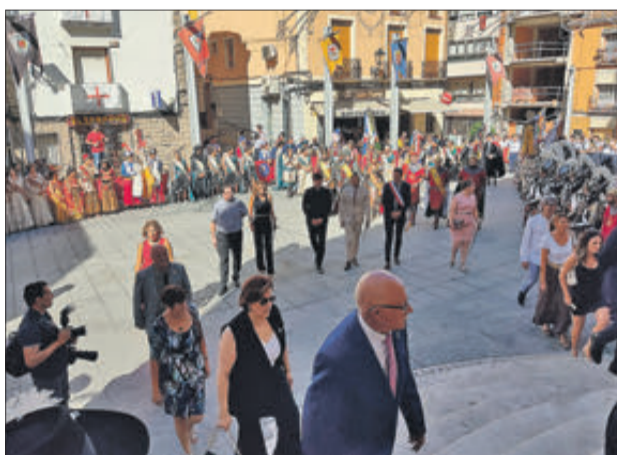
Autoritats, C. de Festes i Capitans anant a la Missa Major.