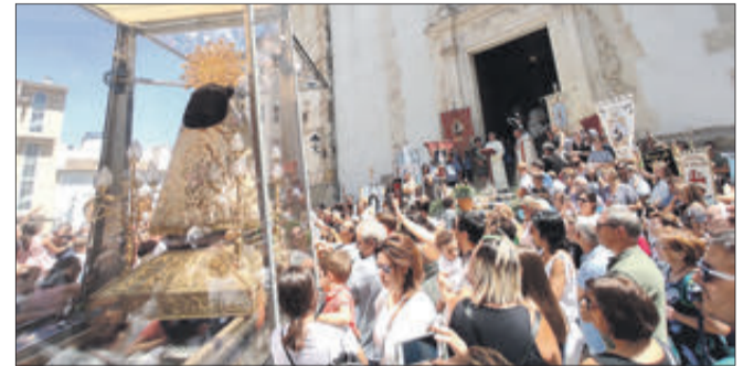
Fervor popular davant la Mare de Déu dels Desemparats.