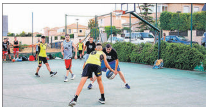
Joc de bàsquet.