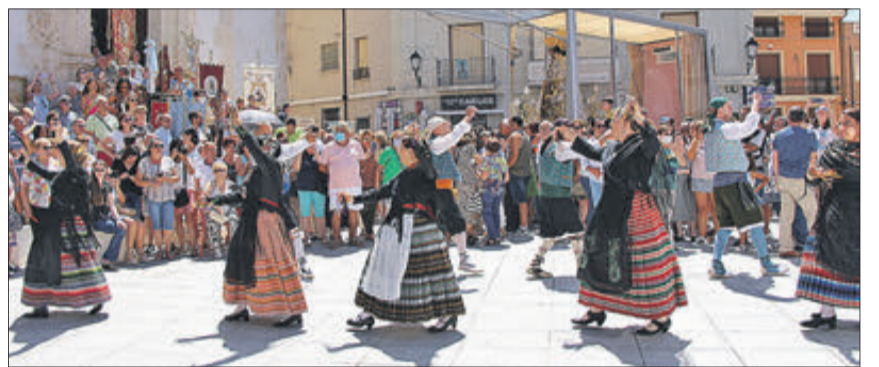
Danses en homenatge a la Mare de Déu.

LA VERGE DELS DESEMPARATS VA VISITAR BANYERES