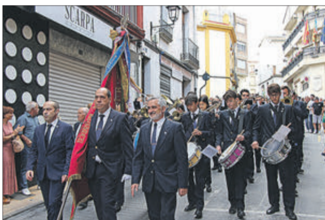
La Societat Musical també va participar.