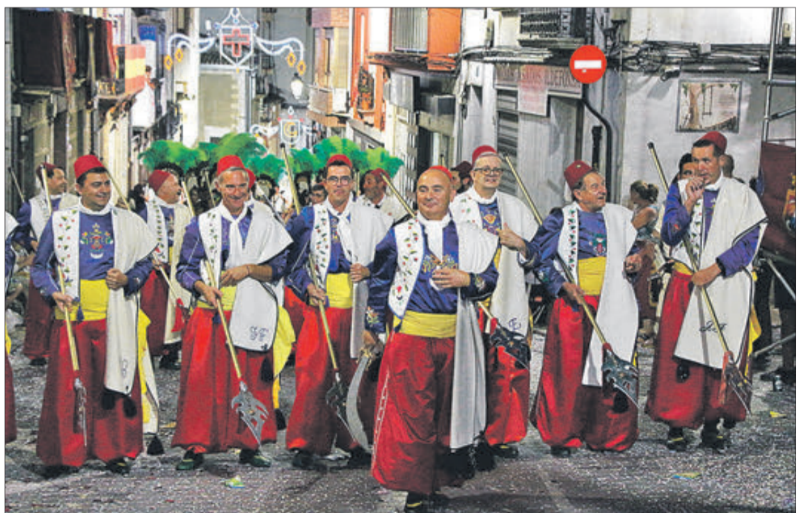
Moros Nous arribant a l'Ajuntament