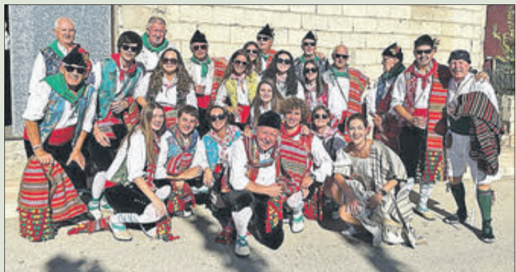
Maseros en l'Entrada de Beneixama.