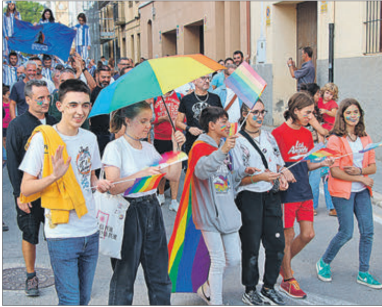
Desfilada pels carrers del poble.