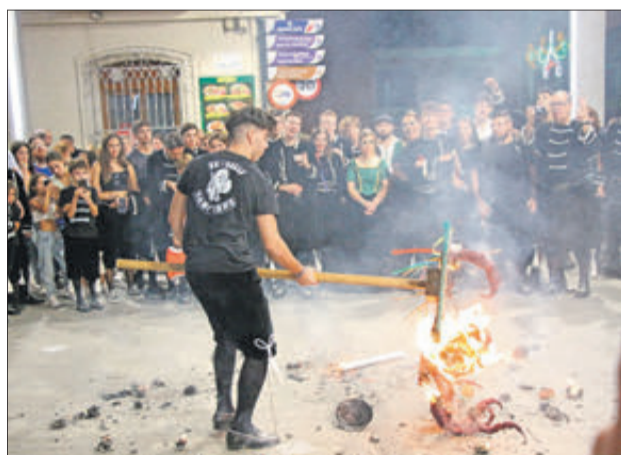
La cremà de fanals festers.