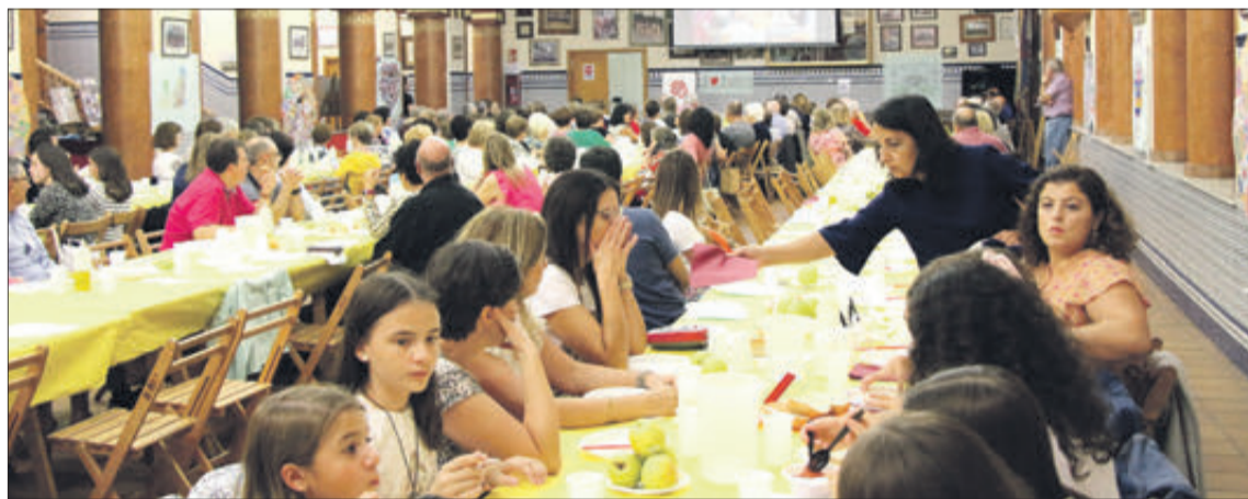
Més de dues-centes persones van assistir al sopar.