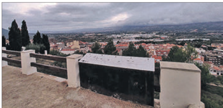
La instal·lació ofereix informació turística al visitant.

L'Ajuntament ha instal·lat en el mirador de l'ermita del Sant Crist un plafó informatiu que ofereix una panoràmica dels elements que poden veure's des d'aquest lloc privilegiat gràcies a les seues immillorables vistes. Aquest element és molt útil perquè les persones poden identificar alguns dels llocs més significatius que des d'allí s'aprecien, com l'itinerari del Calvari des de la plaça de la Malena al Sant Crist, el Castell, el curs dels rius Vinalopó i Marjal, la Torre de la Font Bona, zones com el Morer, el "Pinar del Parat", la Font Santa o El Cabeço, muntanyes com el Capollet de l'Àguila, la Penya la Blasca i les serres de la Rambla i la Solana, o la ruta que descrivia l'antic ferrocarril del Xixarra, entre altres. A més a més, també delimita les zones dels vents predominants en aquell lloc: ponent, mestral, tramuntana i gregal.