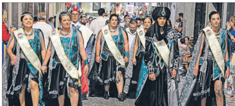
Capitania filà Moros Nous.