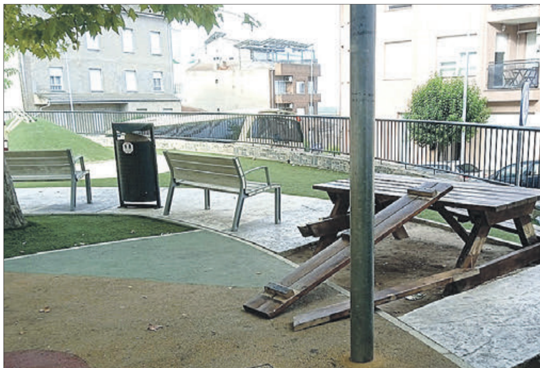
Taula de pic nic trencada en la plaça del 9 d'Octubre.

En el comunicat que va fer públic el consistori va dir que "entenia que la major part dels veïns estiguen enfadats amb les persones que embruten el poble de manera deliberada, perquè això va contra la imatge del municipi i de les persones que viuen en ell". Així mateix, confiava que "cada vegada hi haja més rebuig social a aquestes formes de conducta perquè la gran majoria del veïnat fa ús correcte del mobiliari i dels espais comuns".