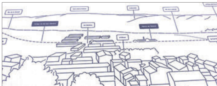
Detall dels elements que exposa.