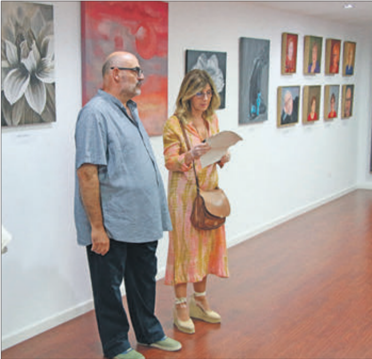
Moment de la inauguració de l'exposició.