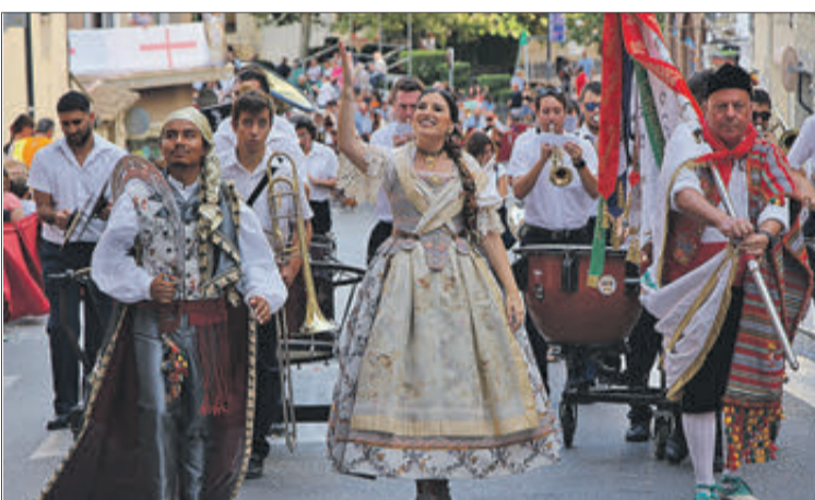
Capitania filà Maseros.