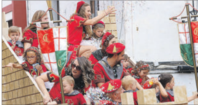
Carrossa de la filà Cristians.

A la vesprada va ser el torn de la desfilada infantil i de la Processó de la Relíquia, en la qual van tornar a participar desenes de centenars de festers. La festa va concloure amb l'arribada de la Relíquia de Sant Jordi a l'església i un castell de focs artificials.