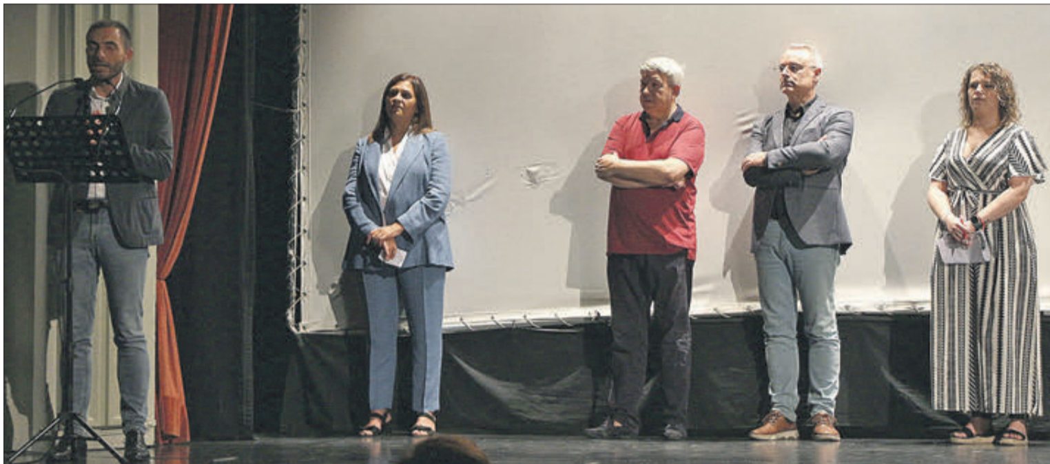
La presentació es va fer al Teatre Principal.

El Museu de la Paraula compta amb un nou documental en el qual es plasmen les vivències i els costums de Banyeres de Mariola al llarg del temps. En aquesta ocasió el treball rep el títol "Cicle de vida i rituals de dol". Va ser estrenat el dia 23 de setembre en el Teatre Principal.