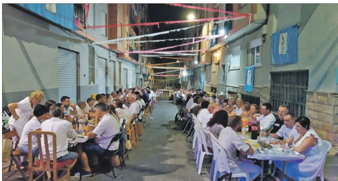
Multitudinari sopar al carrer Ruperto Chapí.

destacar la seua participació en la Fira de la Malena, on va instal·lar un estand, i en la qual va aprofitar per a unir-se a la campanya proposada per la Federació Valenciana d'Associació d'Alzheimer (FEVAFA) denominada "Mans per l'Alzheimer", en la qual fent ús de pintura, cartolina, guants i, sobretot, de la imaginació, internet està omplint-se de mans verdes que continuaran inundant les xarxes fins al dia 21 de setembre, en el qual es commemora el Dia Mundial de l'Alzheimer.