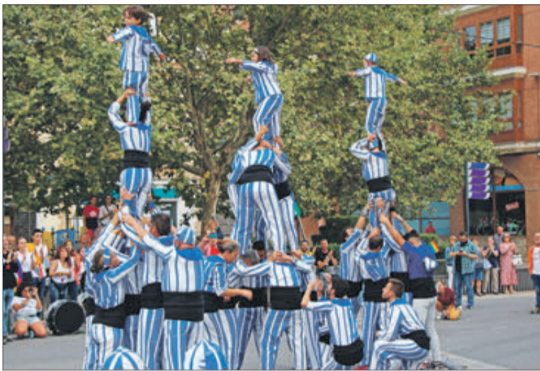
Participació de la Muixeranga d'Alacant en la desfilada.

ES VA COL·LOCAR UN PENDÓ AMB ELS COLORS DE L'ARC DE S. MARTÍ