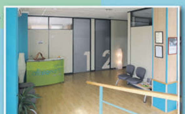
Cites de fisioteràpia Tf 695692689