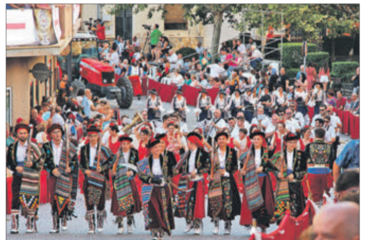
Contrabandistes per l'avinguda dels Furs.