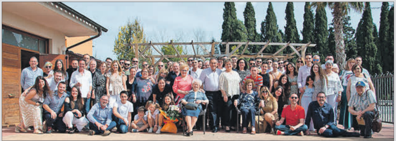
Quasi huitanta persones es van reunir en la Venta el Borrego.

AMB LA COL·LABORACIÓ DE LA CONSELLERIA D'EDUCACIÓ, INVESTIGACIÓ, CULTURA I ESPORT DE LA GENERALITAT SEMPRE TEUA La teua llengua