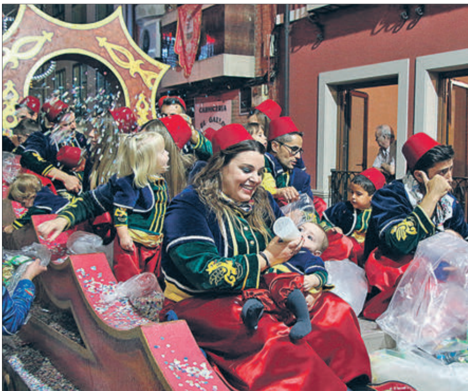
Mare, fill i biberó en l'Entrada dels Marrocs.