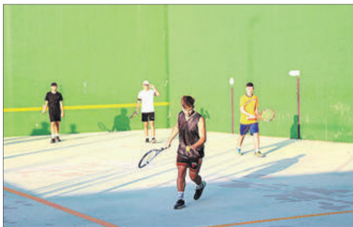
Partida de frontenis.

Es els dies 29, 30 i 31 de juliol, coincidint amb l'últim cap de setmana del mes, es va celebrar la XXXIX edició de les 24 Hores Esportives. Era el colofó a una llarga temporada repleta de competicions en què han participat les distintes entitats i clubs esportius del poble. En l'última edició va ser impossible plasmar imatges i resultats de l'esdeveniment per coincidir en l'edició del periòdic. En aquesta s'inclou un xicotet testimoni gràfic amb algunes de les imatges de l'event que es van facilitar. Enguany va haver-hi competicions de voleibol, bàsquet, tennis, frontenis, tennis taula, pàdel, futbol sala, futbol-8, escalada en bloc, pilota valenciana, ciclisme, tir al plat, bàsquet, triatló, motociclisme i tir olímpic, així com exhibicions de karate i patinatge.