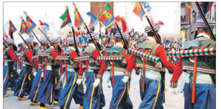
Oficial dels Moros Vells entrant en la plaça.