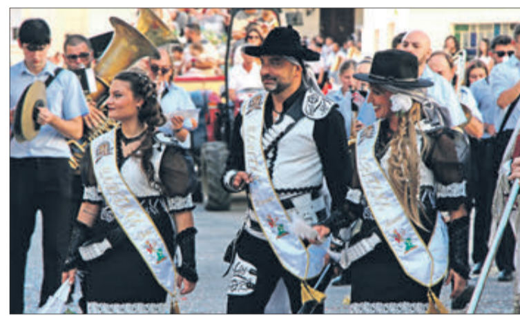
Capitania filà Contrabandistes.