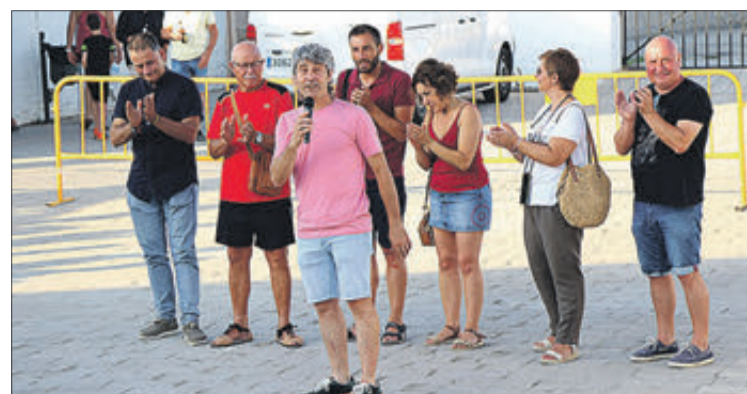
Acte de presentació.