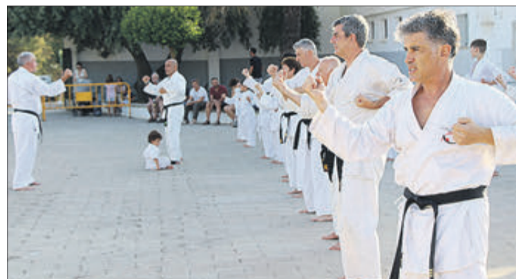
Exhibició de karate.

FI DE FESTA AMB ELS ACTES RELIGIOSOS EN HONOR DE LA PATRONA