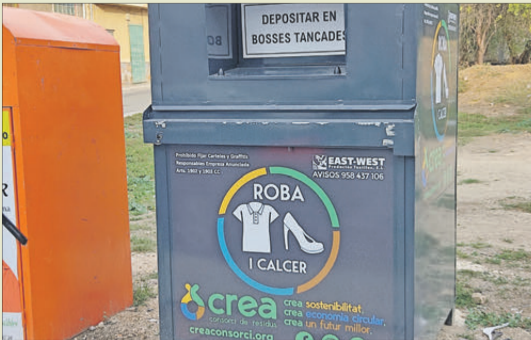
Un dels contenidors instal·lats per a articles tèxtils.

En la seua visita a Banyeres Climent va signar en el Llibre d'Or de l'Ajuntament i va estar acompanyat per l'alcalde Josep Sempere i regidors dels tres partits amb representació municipal. El conseller va tindre ocasió de conèixer en primera mà alguns dels projectes del seu departament en el municipi, entre ells les millores previstes en els polígons industrials, així com els relacionats amb alguns dels programes d'ocupació que s'estan desenvolupant, entre elles el programa "Emerge" de conservació de muntanyes. Així mateix, des del PP es va informar que s'havien plantejat al titular d'Indústria aspectes com els increments del preu de l'energia amb el problema que això implica per a particulars i indústries o l'estat que presenten alguns edificis municipals com L'Estació o el Molí Sol.