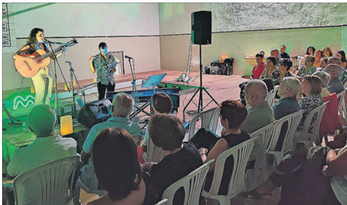
Era la primera volta que es feia un concert en l'edifici del Llavador.

També es va prohibir circular per pistes i camins forestals al parc natural, excepte comptades excepcions; l'organització de proves esportives per terrenys forestals i la suspensió de les quals pogueren estar autoritzades durant el període indicat. Aquesta mateixa mesura es va aplicar a àrees d'acampada i campaments gestionats per la Generalitat i els albergs, campaments i camps situats en terrenys forestals.