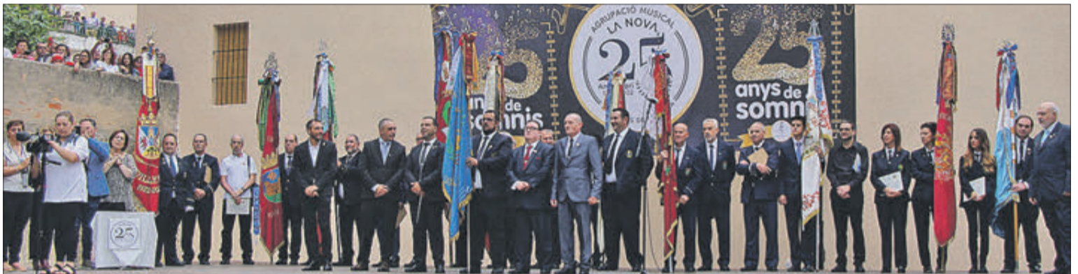
Autoritats i representants de les entitats musicals participants.