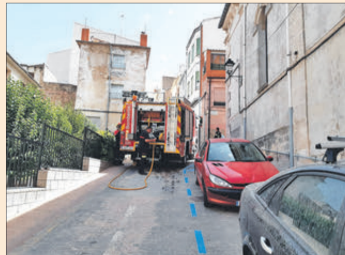
Vehicle de bombers en el carrer de la Malena.

Dos incendis de reduïda dimensió es van produir a Banyeres durant la primera quinzena d'agost. El primer va ser a la Rambla el dia 10 i va afectar al voltant de 800 m 2 . L'altre va ser el dia 14 en els terrenys que hi ha en la part de darrere de la Biblioteca Pública. Tampoc va revestir importància, però, igual que l'anterior, va requerir la intervenció dels equips d'extinció.