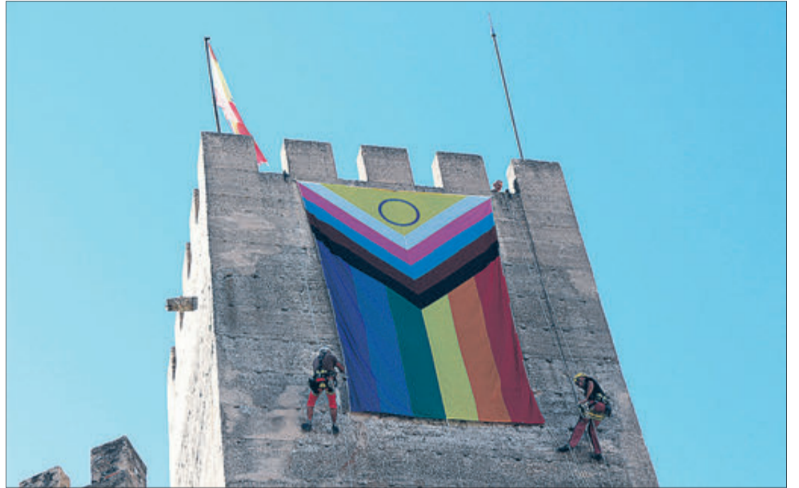
El pendó penjat del castell.