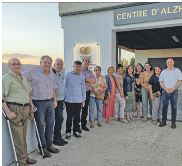
Components de l'anterior i actual junta.

Les diferents seccions del grup scout Edelweiss han celebrat els tradicionals campaments d'estiu. El grup de tropa ha estat al Pirineu de Lleida, concretament en Espot, havent realitzat diferents itineraris pel parc nacional d'Aigüestortes i l'Estany de Sant Maurici. El grup de pioners ha fet el camí de Santiago tenint com a punt de partida la localitat de Sarrià.