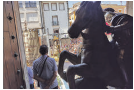
Sant Jordi i la Geperudeta.