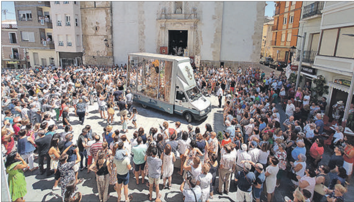
Arribada a la plaça Major de Banyeres.