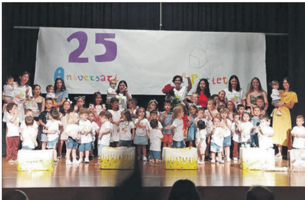
Celebració del 25 aniversari del Patiet.

“El Patiet” disposa de tres aules: una de 0-2 anys, una altra de 2-3 anys i una més de caràcter “polivalent” que pot ser utilitzada com a menjador,