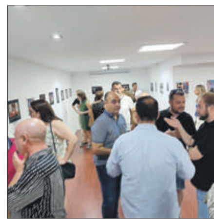
La mostra es va poder visitar en l'espai expositiu del Teatre.