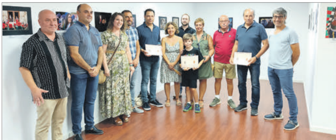
Autoritats i part dels guanyadors del concurs.

Una representació de la filà Maseros va participar en l'Entrada de les festes de Moros i Cristians de Beneixama. Ho van fer convidats per la filà de Llauradors d'aquella població, que està de celebracions amb motiu de la celebració del 50 aniversari de la institució. També un grup de la filà Estudiants va estar desfilant a les festes de Villena, en aquest cas amb motiu de la celebració del 175 de la fundació de la filà estudiantil d'aquella població. Per últim, dos festers dels Moros Vells van participar en la desfilada que va culminar les celebracions del bicentenari de la filà Moros Vells de Petrer, on van participar representants de municipis festers de tota Espanya.