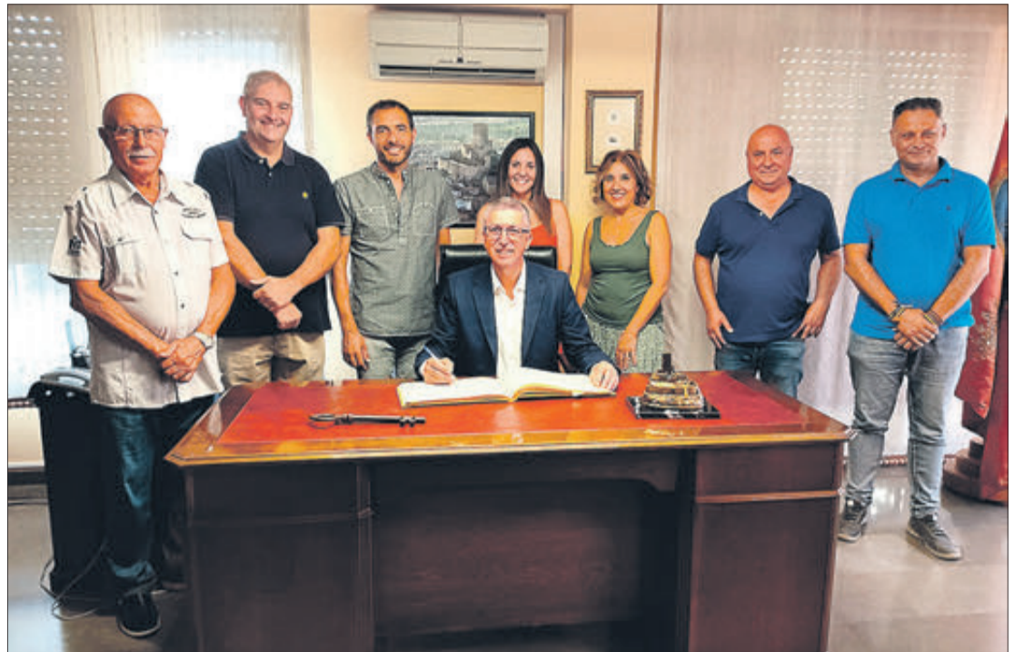
El conseller d'Indústria firmant en el Llibre d'Or.