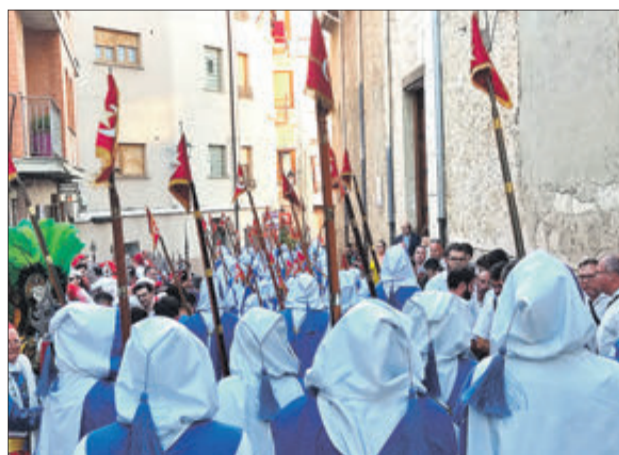
Inici de la processó pel lateral de l'església.