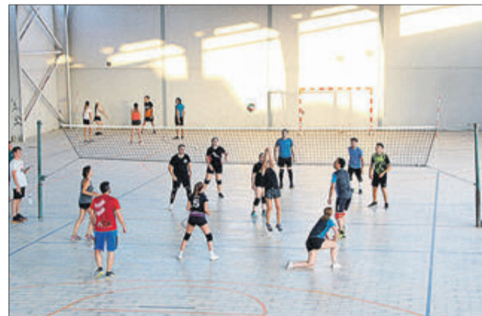
Competició de voleibol.