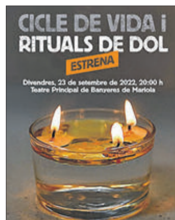
Portada del documental.

Comentar, per altra banda, que l'anterior documental del Museu de la Paraula "Els treballs i les dones" ha estat seleccionat pel Festival Cinema Ciutadà Compromés que organitza l'Associació Ciutadania i Comunicació de València.