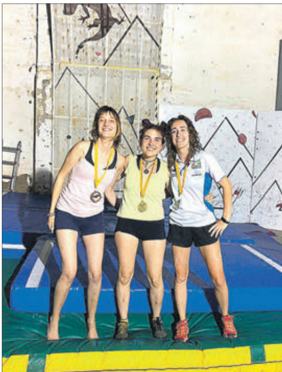
Escalada en el rocòdrom.