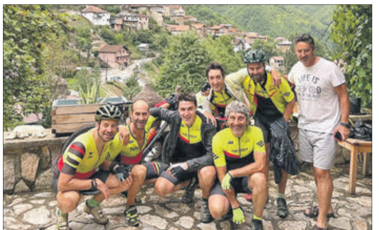
Els expedicionaris van passar per Bulgària, Macedònia i Albània.

■ Els vents han sigut normals amb ràfegues màximes de 38,6 km/h