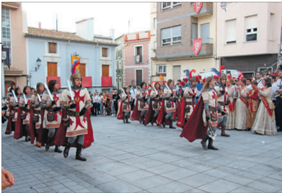
Començament de la Diana.