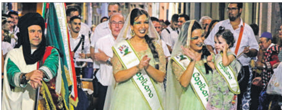
Capitania filà Califes.