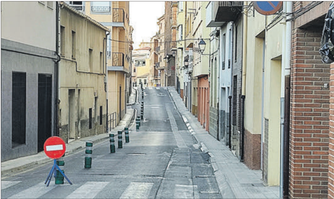
Tram del carrer Laporta amb un únic sentit.