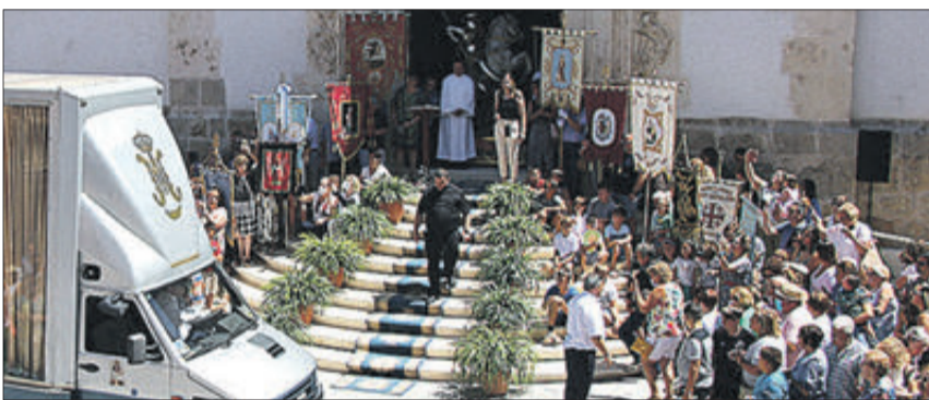
Escalinata engalanada per a rebre a la Verge.