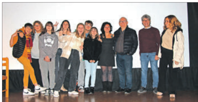
En l'elaboració han col·laborat grups de joves.