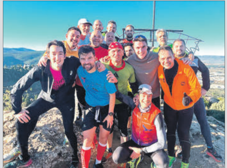
Part dels participants en el Capollet de l'Àguila.