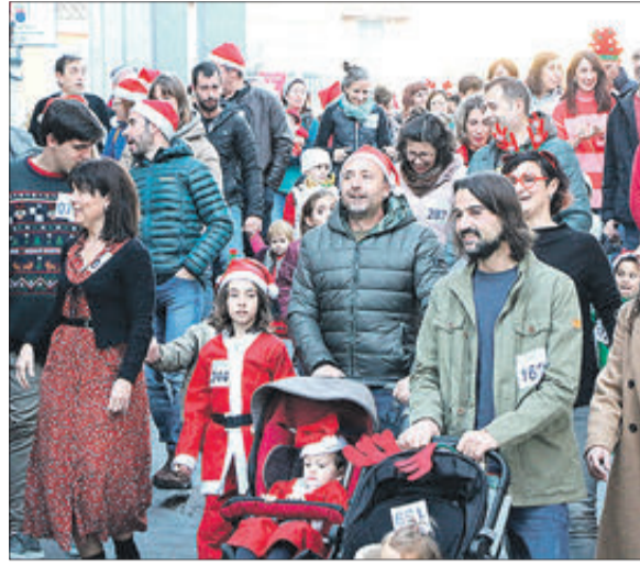
S'uneixen a la iniciativa persones de totes les edats.