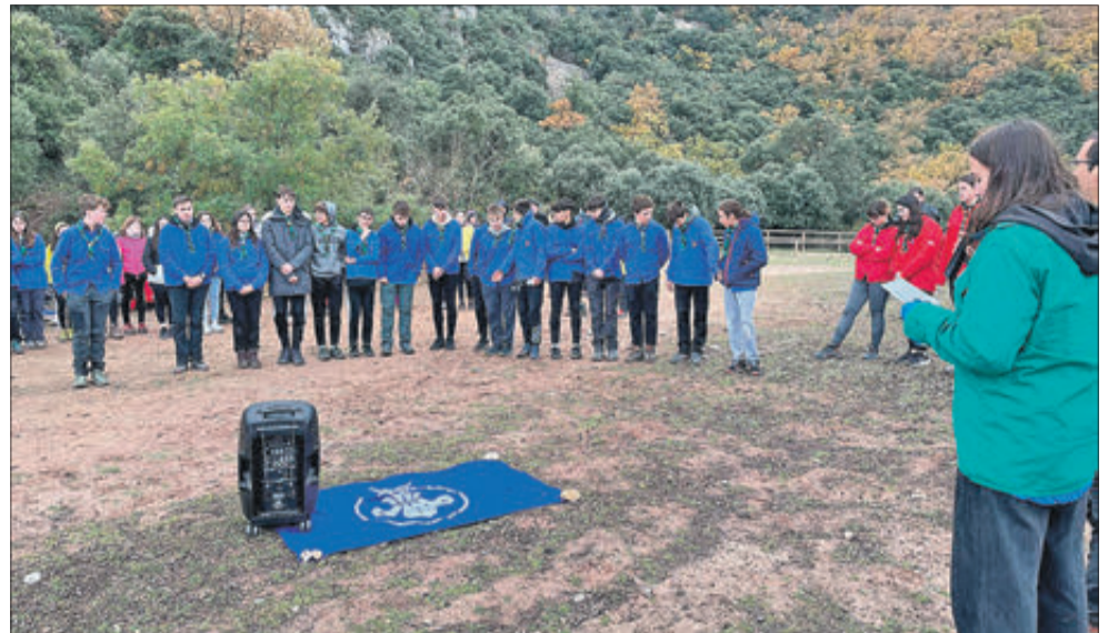
Acte de canvi de seccions i promeses.