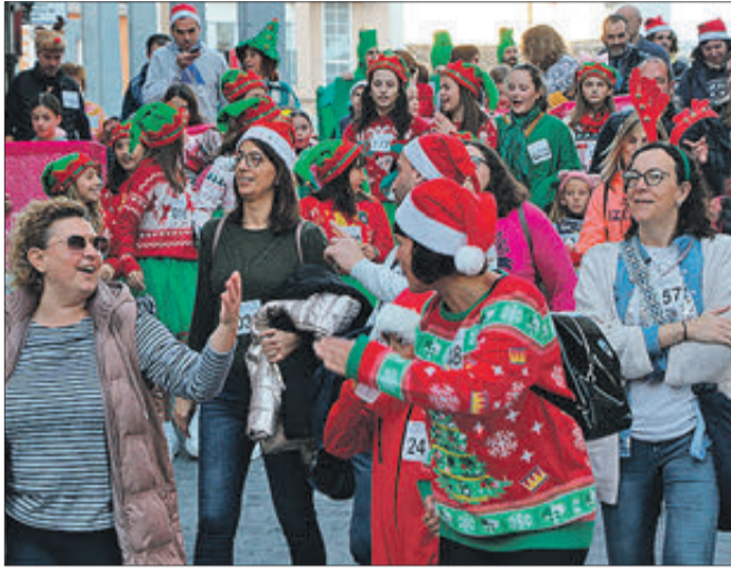
Participar, encara que siga caminant, és solidaritat.