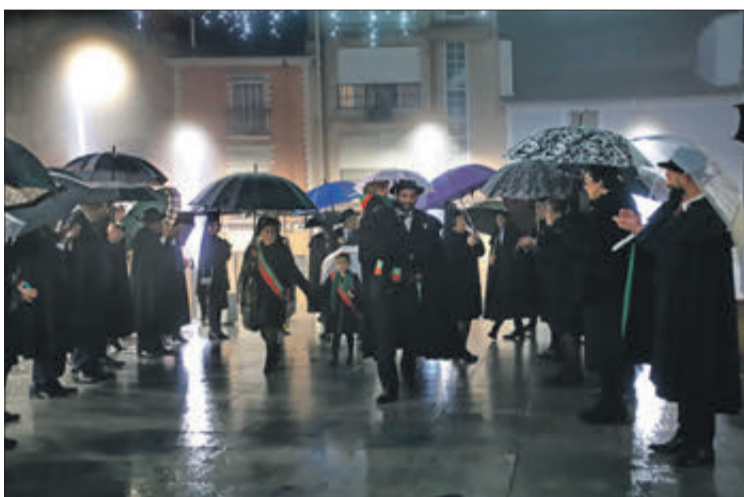
Arribada dels Clavaris a l'església.