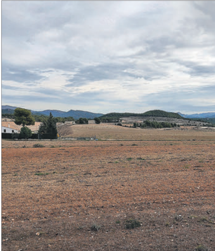
Zona de Polop al costat de la carretera Alcoi-Banyeres.

El partit polític "Guanyar" amb representació a l'Ajuntament d'Alcoi ha demanat que el consistori s'opose a aquesta actuació i que s'insti a la Ge-