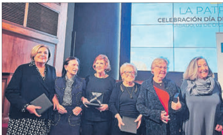
Grup de sis farmacèutiques de la província que han rebut reconeixement.