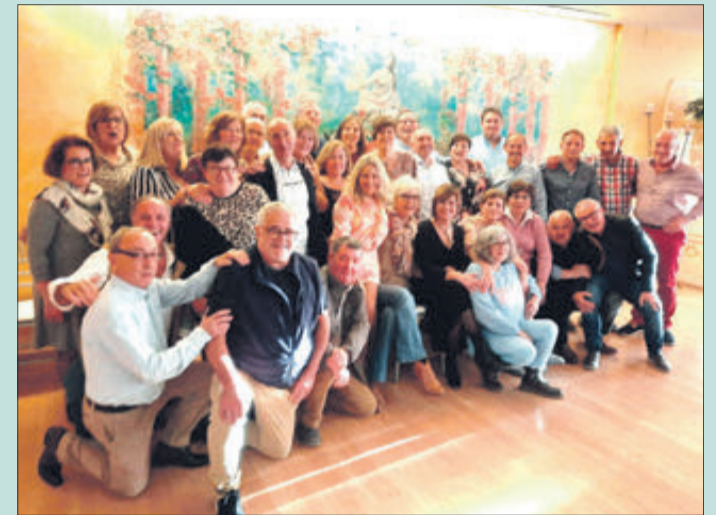
El grup va fer un dinar en la Venta el Borrego

Igual que han fet distintes quintes per aquestes dates, recentment es va reunir també un grup dels nascuts l'any 1962 per tal de celebrar que al llarg de l'any 2022 han complert els 60 anys. La cita va ser en la Venta el Borrego, on van fer un dinar de germanor. Sols se'n van reunir trenta-sis, d'una "quinta" de més de huitanta, però a pesar d'això l'ambient va ser molt bo i van aprofitar per a recordar anècdotes i vivències.