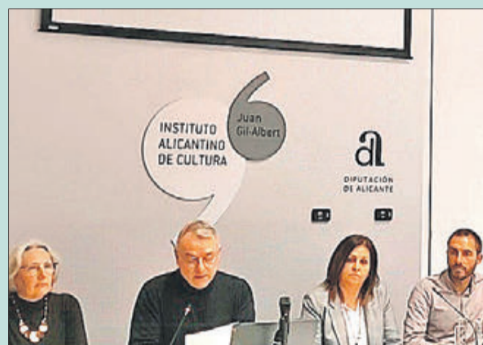
Acte de presentació del documental.

El dia 1 de desembre es va presentar a la Casa Bardín de l'Institut Alacantí de Cultura Juan Gil Albert el documental "Els treballs i les dones de Banyeres de Mariola". El document, que es va projectar per primera vegada el passat 5 de març en el context dels actes programats a Banyeres per a commemorar la celebració del Dia Internacional de la Dona Treballadora, és un dels projectes duts a terme pel Museu de la Paraula i no tracta solament de donar veu a les dones que tradicionalment s'han vingut a dir 'dones treballadores', sinó de recuperar la memòria de totes les