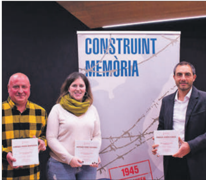
Es va homenatjar tres persones de Banyeres.