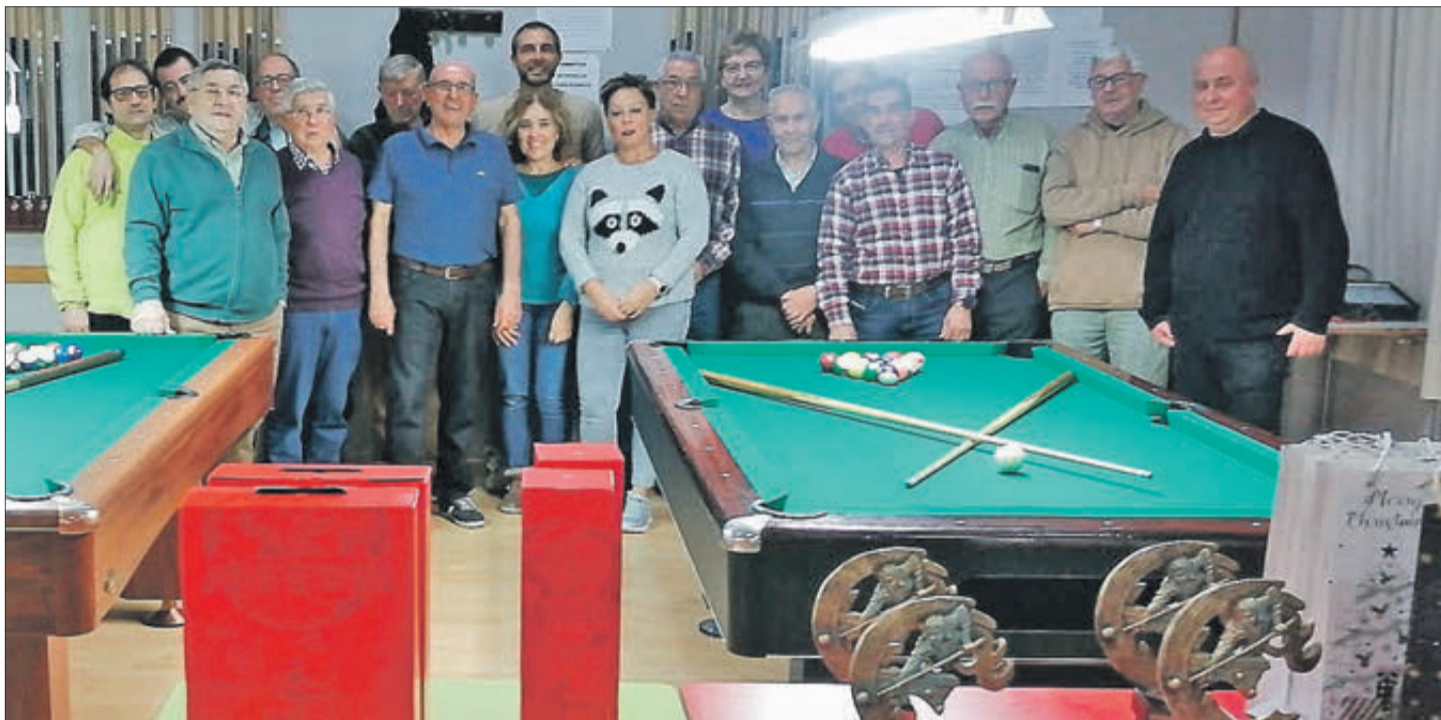
Autoritats i participants en el torneig