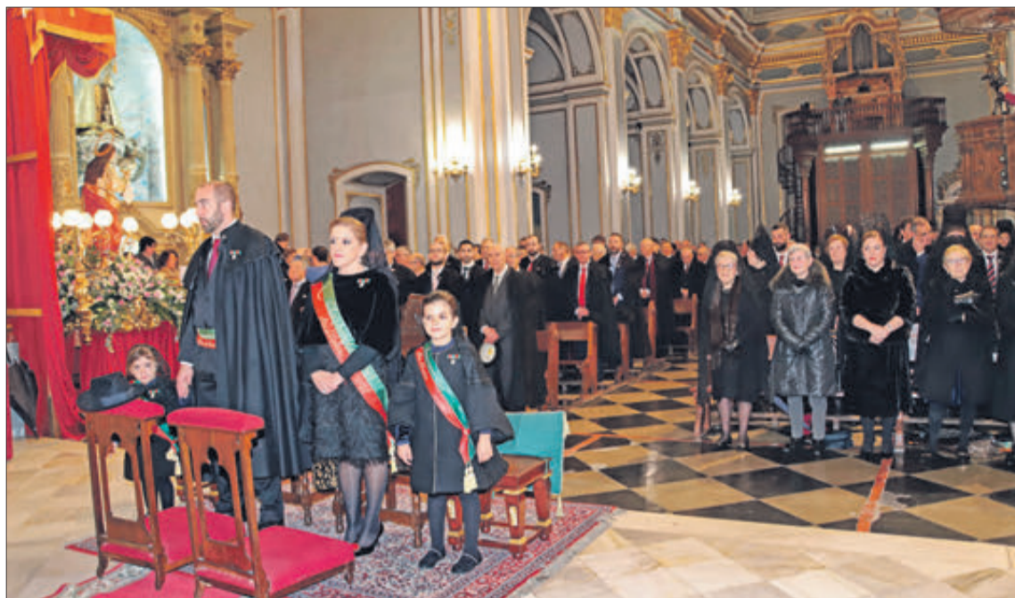
Els Clavaris en la Missa Major a Santa Llúcia.

LA PLUJA VA DESLLUIR ELS ACTES DEL DIUMENGE