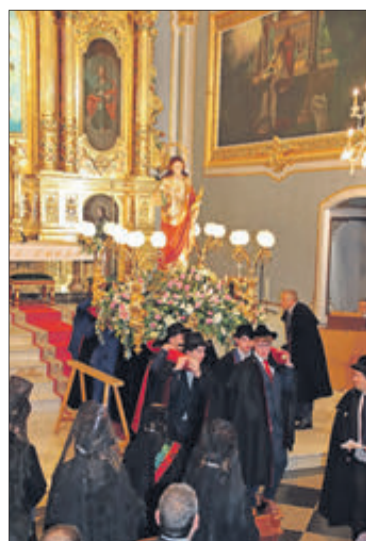
Processó a l'interior del temple.