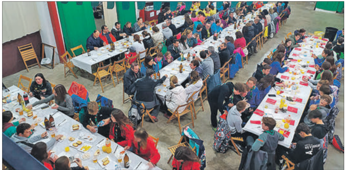
Dinar de germanor en el maset de la filà Cristians

El 8 de desembre, jornada en la qual es celebra la festivitat de la Immaculada Concepció, el grup scout Edelweiss va organitzar la cita anual per a commemorar el seu aniversari. En aquesta ocasió s'han complit 47 anys des de la seua fundació. Es va celebrar, com és habitual, amb un esmorzar a la Font Roja, l'ascensió al pic del Menejador -lloc en el qual es va crear el grup-, el tradicional acte de canvi de seccions i promeses, i un dinar de germanor en la seu de la filà Cristians.