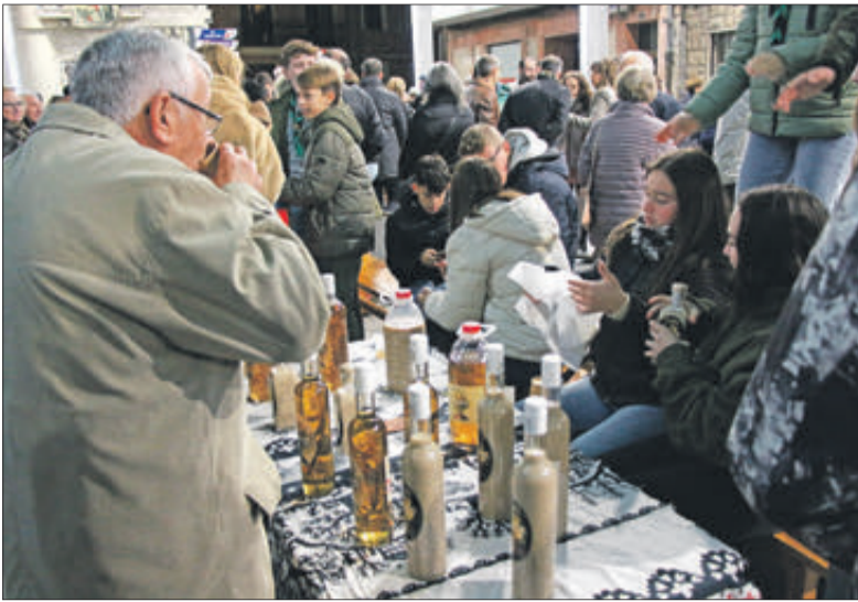
Es van oferir productes típics.