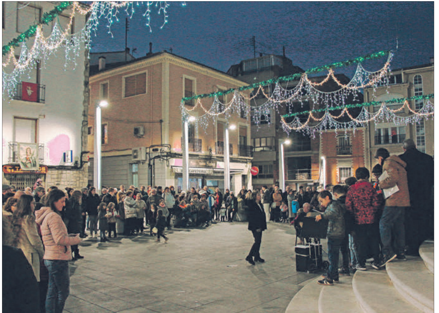
Nombroses persones van assistir a l'encesa de les llums de Nadal.

Des del departament de Benestar Social de l'Ajuntament s'ha fet públic que s'ha habilitat una Oficina de Denúncies d'Assistència a Víctimes de Violència de Gènere. Aquest servei està disponible a Alacant, de dilluns a diumenge, de 9 a 21 hores, tots els dies de l'any, en les dependències del Palau de Justícia de Benalua, a l'avinguda d'Aguilera núm. 53, 03007 d'Alacant, i que pot contactar-se telefònicament cridant al 689 895 856.