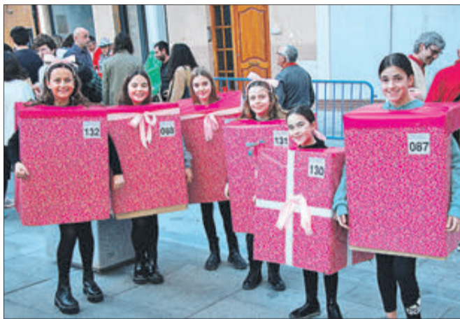
Grup de xiquetes disfressades de regals.