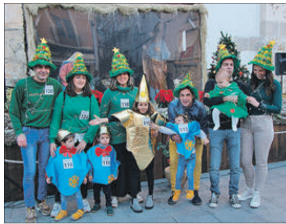
Mares, pares i fills que s'uneixen a la iniciativa.