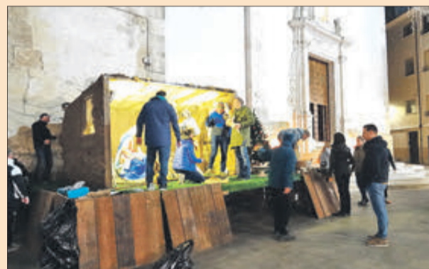
Muntatge del Portal de Betlem.