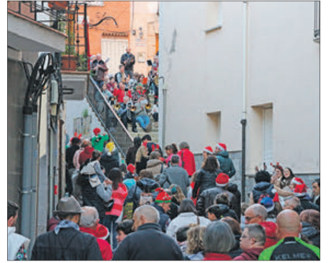
La banda de la Societat Musical animant el pas.