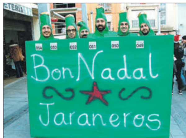
Hi ha qui aprofita l'ocasió per a desitjar un bon Nadal.

distància de 2,5 km per l'itinerari que comunament es coneix com la "volta de la processó". Molts dels participants van fer la prova caminant i abillats amb disfresses. La prova va comptar amb l'animació de grups musicals de la població i en meta es van oferir dolços i begudes nadalenques. Va concloure amb el lliurament de trofeus als millors classificats així com a les millors disfresses. Els articles recollits formaran part de l'enviament anual que fan diferents associacions solidàries amb el poble sahrauí.