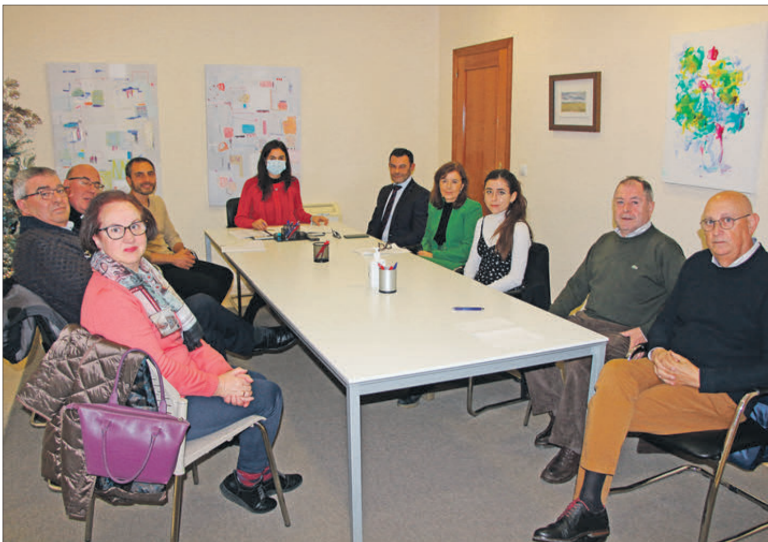
La donació es va formalitzar en la Notaria de Banyeres.

CROS DE LA CONSTITUCIÓ. Escolars dels centres educatius de la Fundació Ribera, el CEIP Alfonso Iniesta i l'IES Professor Manuel Broseta van participar en un dels pocs actes que queden a la comarca per a commemorar la Carta Magna. Pàgines 18 i 19