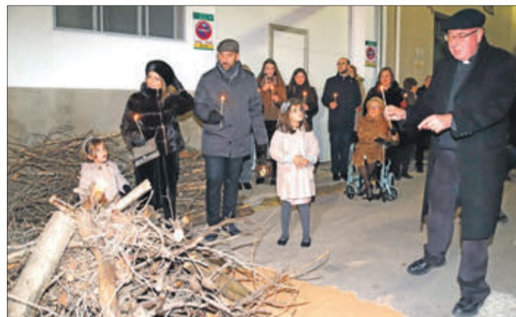
Encesa de la foguera al carrer Santa Llúcia.