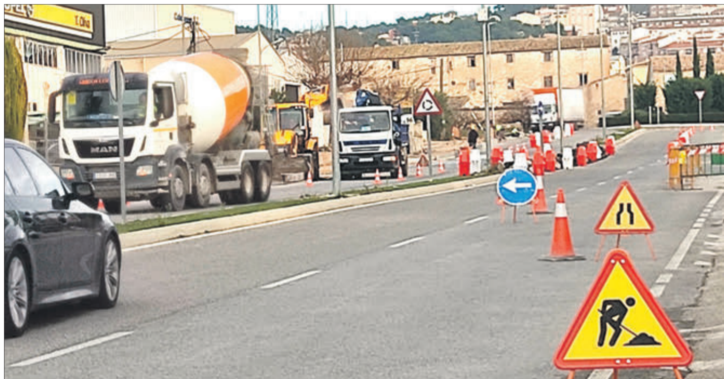
Part de les obres s'han fet al costat d'un tram de la carretera CV-795

Pel que fa al polígon de Les Barraquetes, on el cost de les obres s'ha fixat en 180.290 euros, s'ha contemplat també la instal·lació de conductes per a poder ampliar el sistema de fibra òptica. D'igual manera s'inclou la renovació de fanals dotats amb el sistema LED per a millorar l'eficiència energètica, la instal·lació de nous hidrants, la reposició de la senyalització de trànsit, la creació d'una zona esportiva de cal·listènia i la instal·lació d'una marquesina de parada d'autobús que donarà servei al polígon així com a l'IES Professor Manuel Broseta.