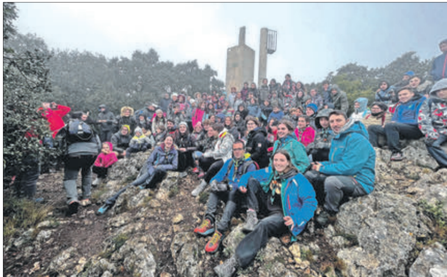
Components del grup en el cim del pic del Menejador.