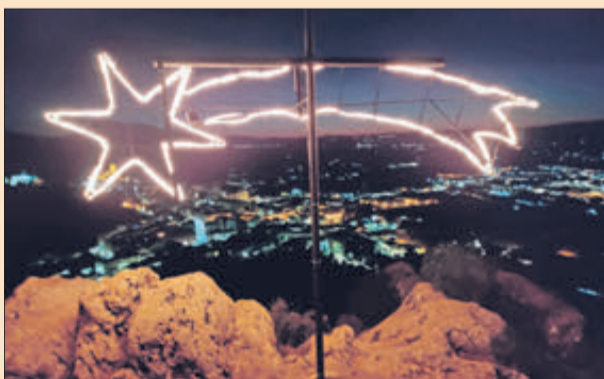
L'estrela que marcarà el camí dels Mags d'Orient.

Els xiquets i xiquetes que es preparen per a rebre la Primera Comunió van celebrar l'últim dia de catequesi, abans de les vacances de Nadal, visitant algun betlem, cantant nades, fent una ofrena d'aliments a Càritas i gaudint d'un berenar consistent en una xocolatada amb xurros. Després van anar a la plaça Major on es van fotografiar amb el pesebre.