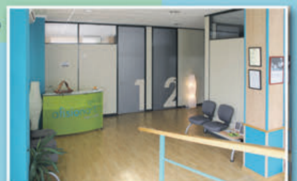
Cites de fisioteràpia Tf 695692689

Avda. Ramón y Cajal, 30, Banyeres de Mariola (Alacant)