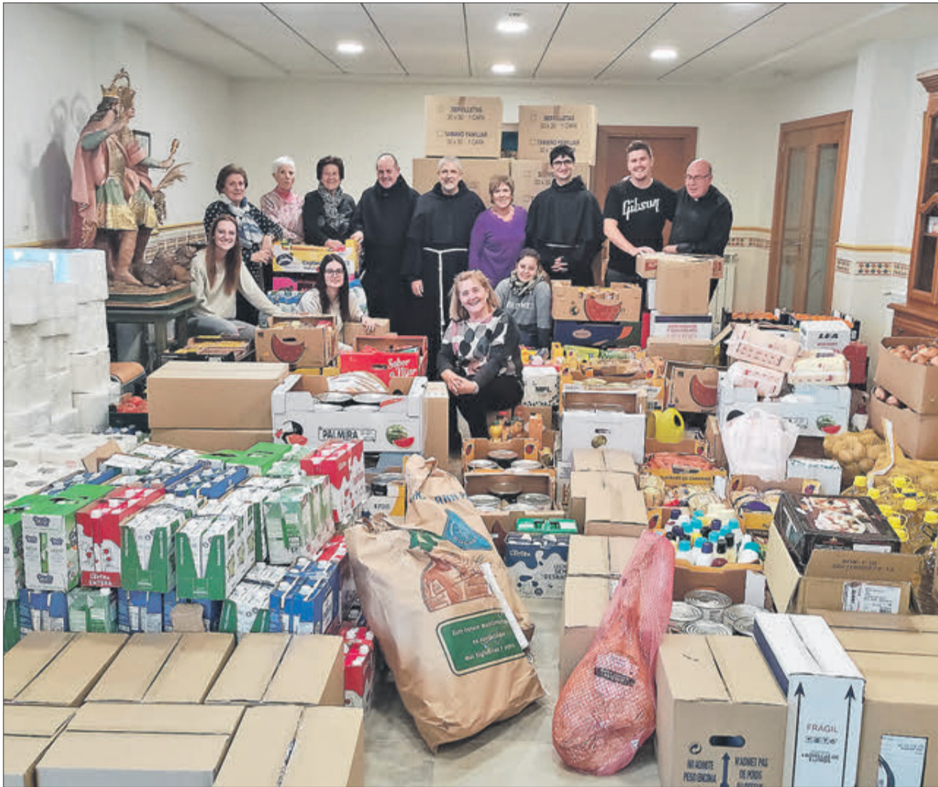
Desenes d'aportacions han permès fer una gran donació.