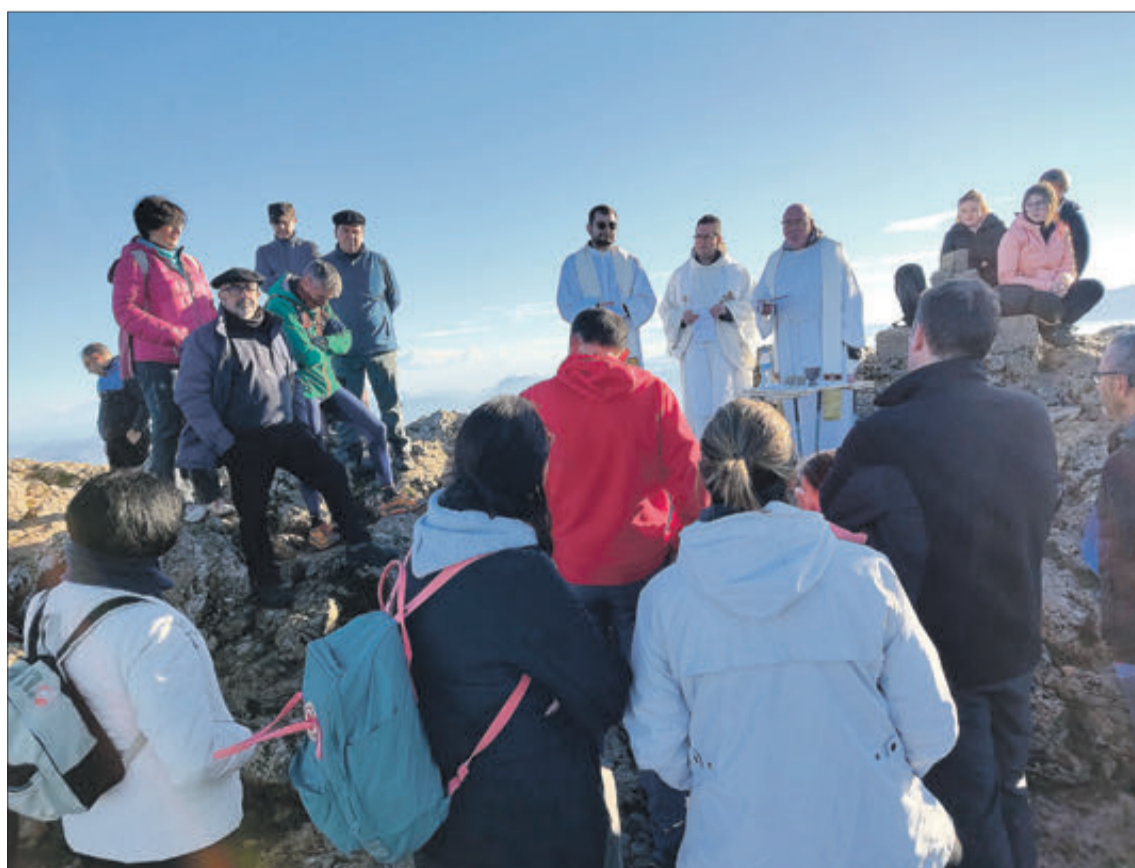
Moment de la missa.