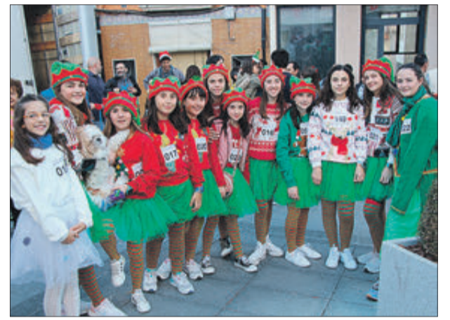
Un altre dels grups participants.