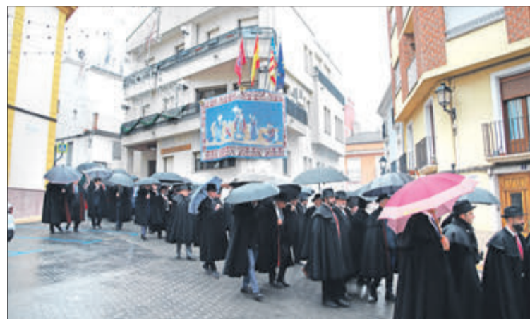
Majorals amb els paraigües.