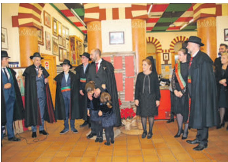
Imposició de bandes als Clavaris de l'any que ve.

El diumenge es va poder fer la diana, encara que afectada per un plugim que més tard es convertiria en pluja persistent, qüestió que va obligar a fer que els actes previstos hagueren de fer-se amb el paraigua. Tots excepte la processó, que no va poder eixir al carrer, motiu pel qual es va fer a l'interior de l'església, suspenent-se el castell de focs artificials. La celebració va acabar amb la imposició de bandes als Clavaris del pròxim any, càrrec que ostentarà la família Ferre Alberó.