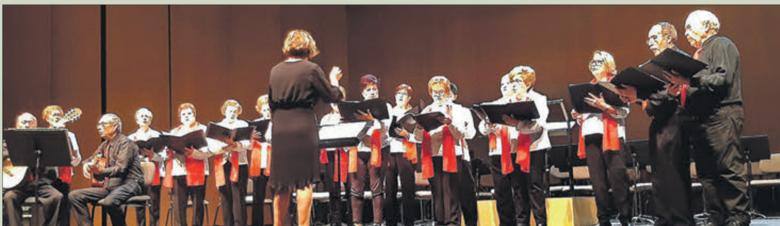
Actuació a l'auditori de Torrent.