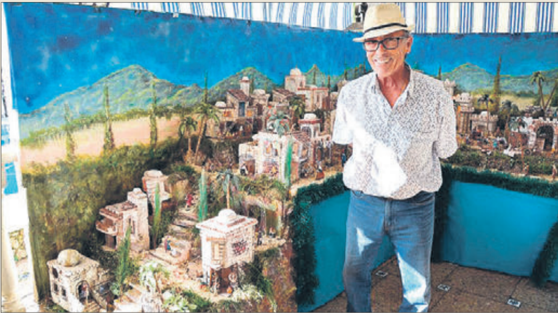
Betlem guanyador en la categoria d'adults.