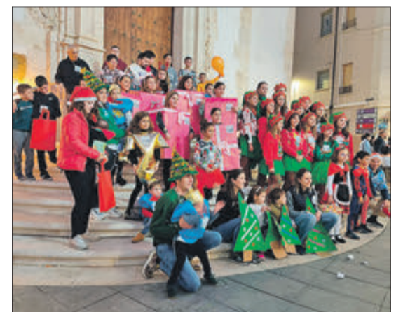
Grup de premiats en l'escalinata de l'església

AlMatic Automatismos, puertas y montajes