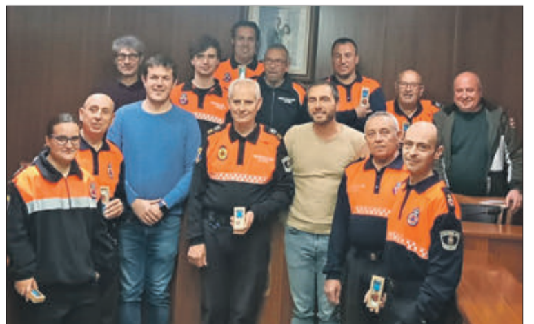
L'acte es va fer al saló d'actes del consistori.

■ Els vents han sigut normals amb ràfegues màximes de 74 km/h.