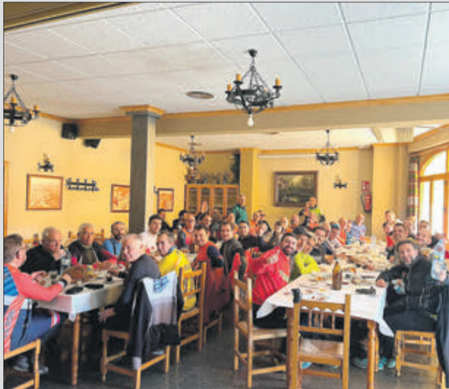
L'esmorzar va ser en el Mesón el Castillo.