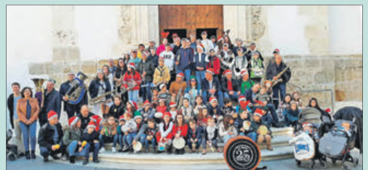
La Nova en l'escalinata de l'església.