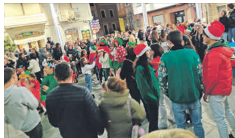
Flashmob dels alumnes de la F. Ribera en la plaça Major.