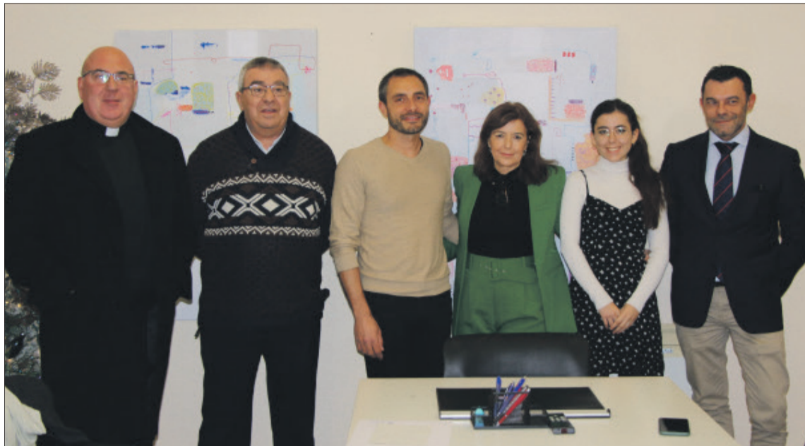
La donació es va formalitzar en la Notaria.

VA SER NOTARI DE BANYERES I UN DELS PATRONS DE LA INSTITUCIÓ