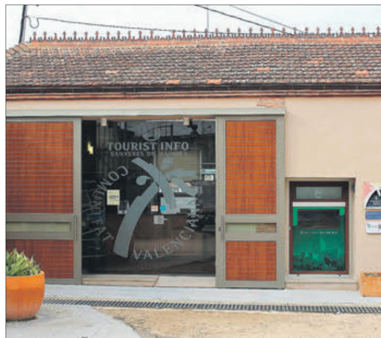
Dependències de l'Oficina de Turisme.

Aquest substitueix als fullets i mapes -més de sis documents- que fins ara s'entregaven a les persones que sol·licitaven informació, amb el que es redueix l'ús de paper. Així mateix, s'incentiva la seua reutilització, ja que bústies situades en la Tourist Info i al Castell permeten que els usuaris puguen deixar el mapa després de la seua utilització.