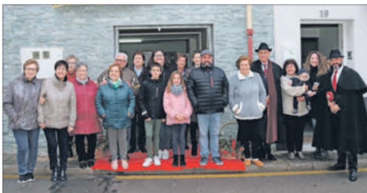
Veïns al carrer Sant Llúcia.