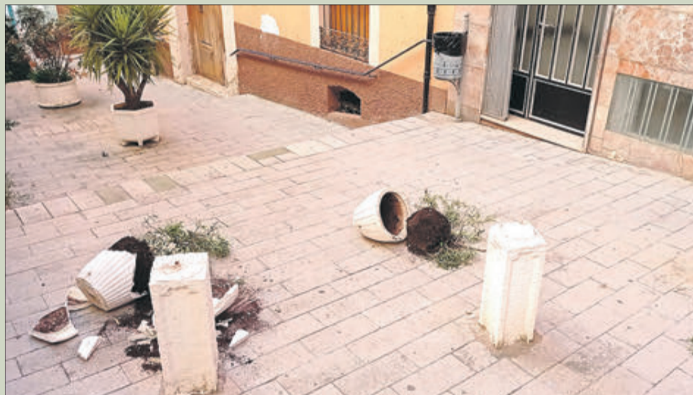
Danys provocats en el carrer de la Verge dels Desemparats.

La realització de destrosses en alguns carrers ha motivat el rebuig dels veïns, que no comprenen com pot haver-hi gent que es dedica a fer actes vandàlics d'aquest tipus. Des de l'Ajuntament s'ha sol·licitat responsabilitat i s'ha dit que el mobiliari públic és de tots i maltractar-lo perjudica el conjunt del veïnat.