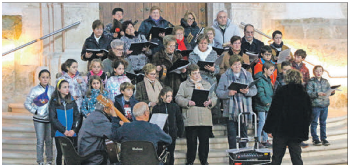
El Cor Joiós va interpretar un repertori de nades.