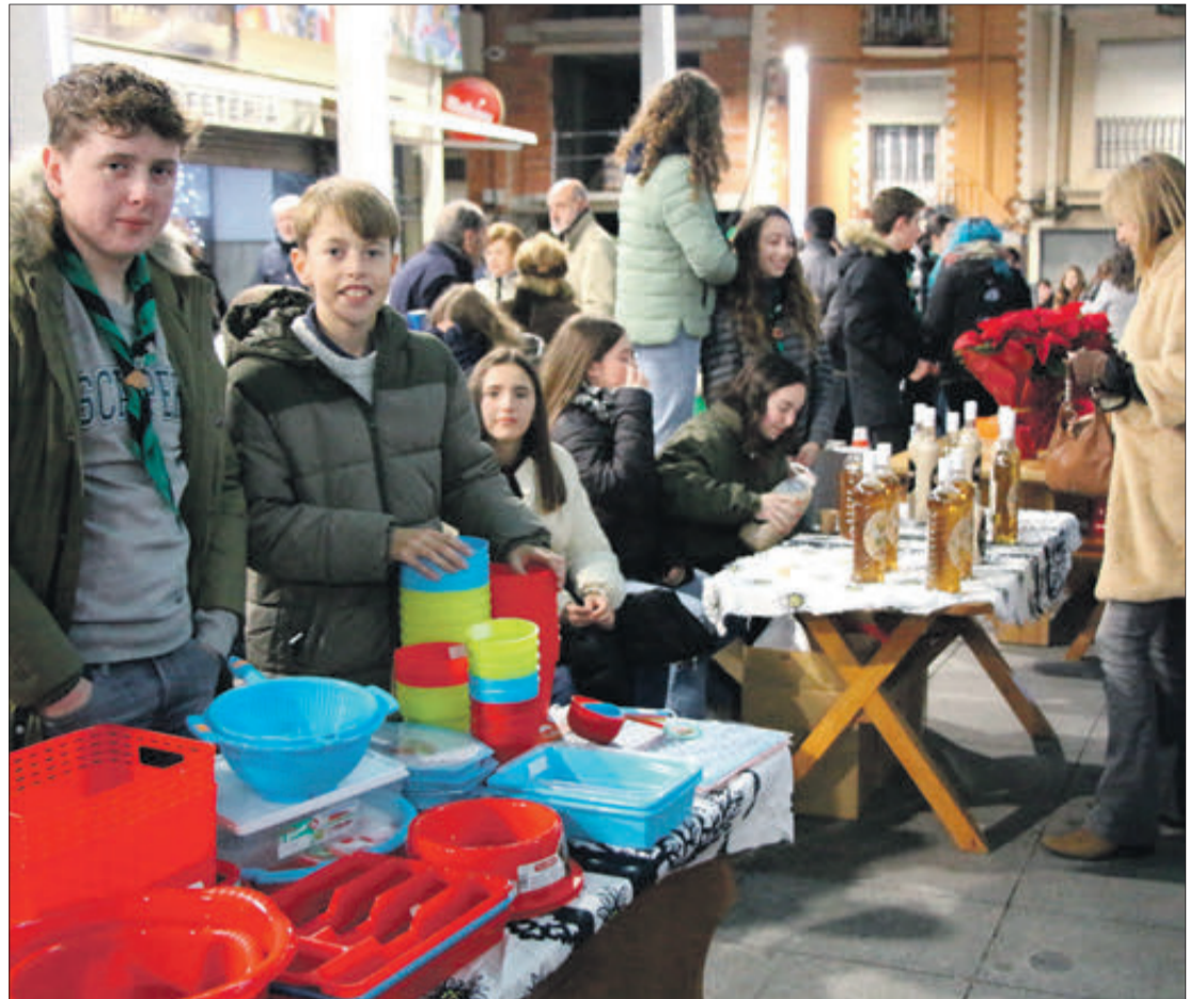
El Mercat de Nadal es va situar a la plaça Major.