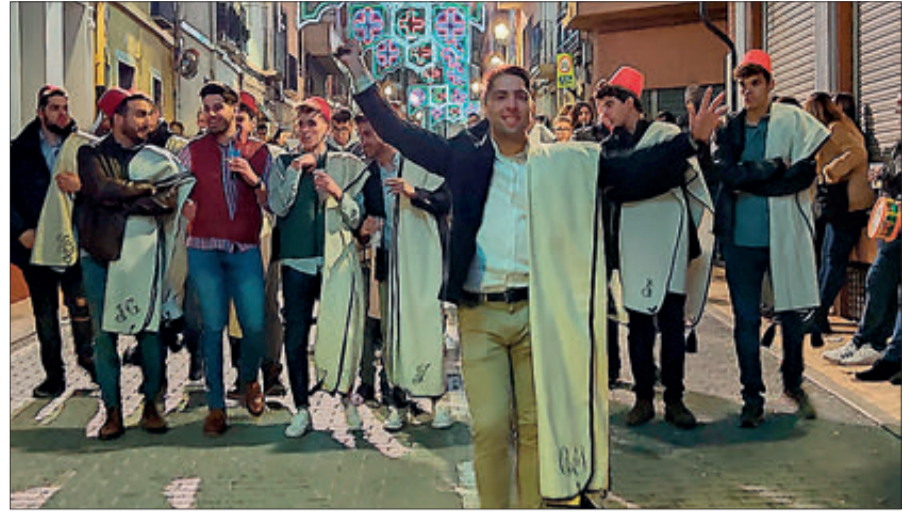
La fila Moros Nous va protagonitzar la primera entraeta.