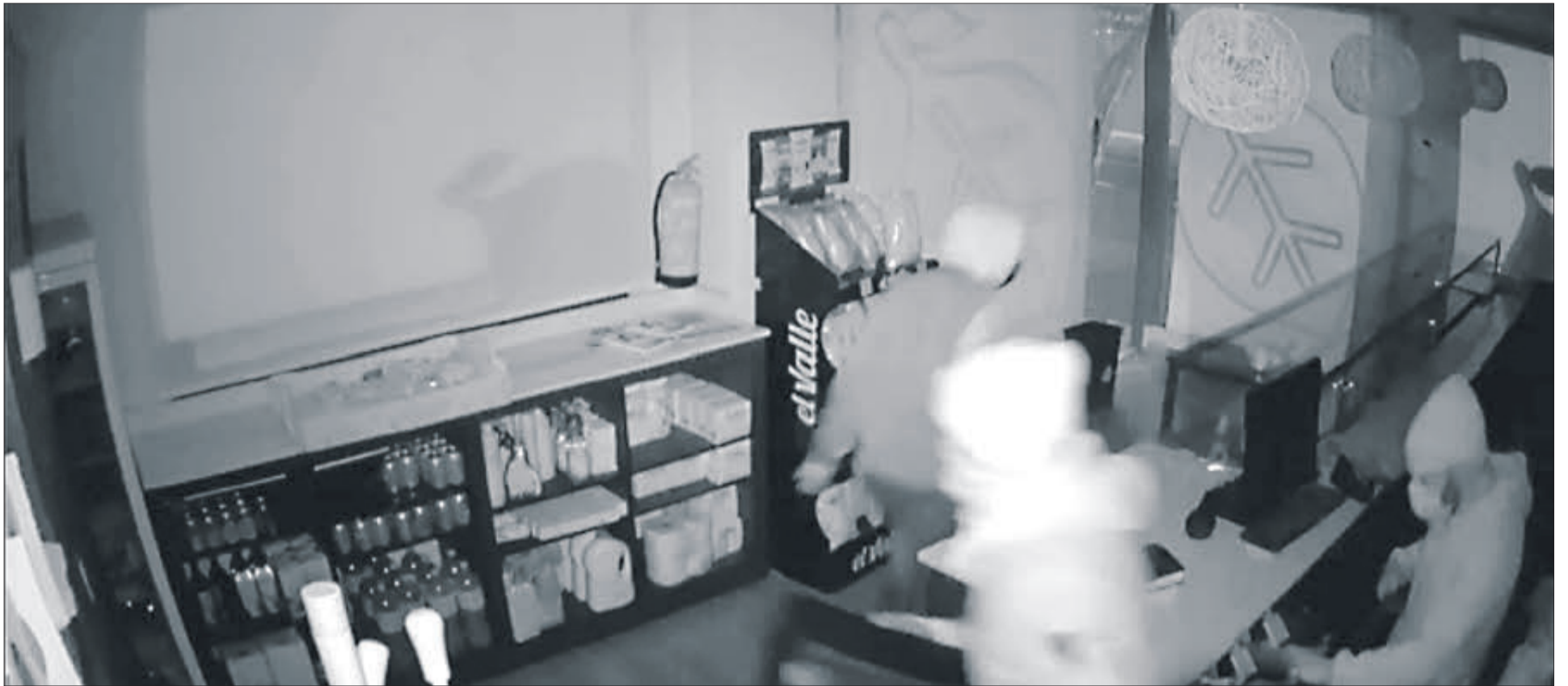
La càmera de seguretat va gravar tota l'escena.

ES VAN EMPORTAR LA CAIXA REGISTRADORA I ALGUNS ARTICLES