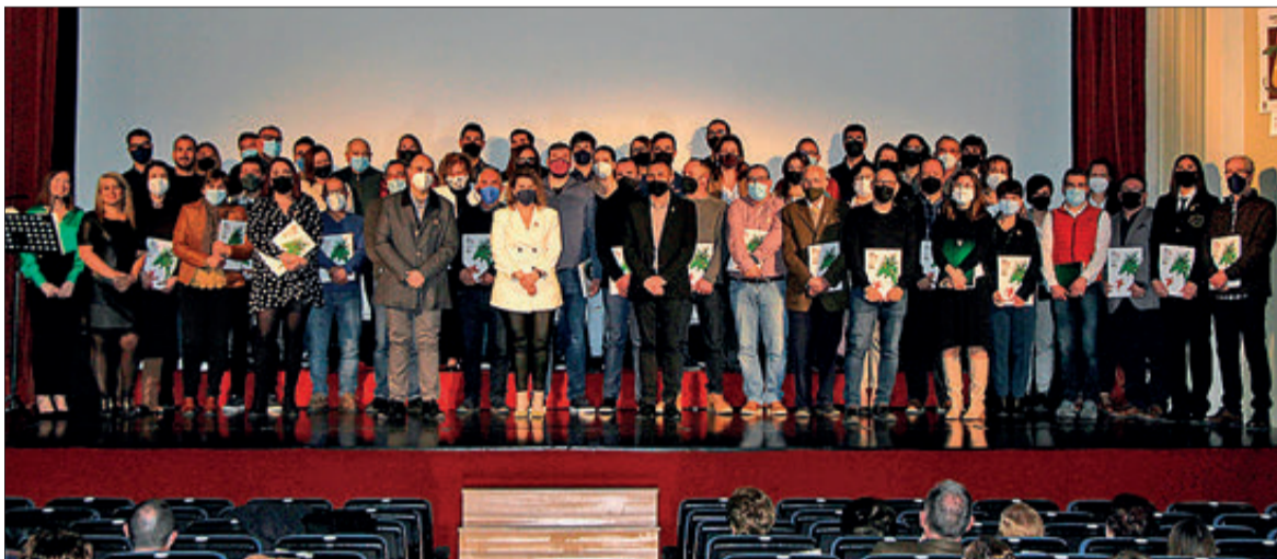
Representants del món de la festa van rebre la Revista-Programa.