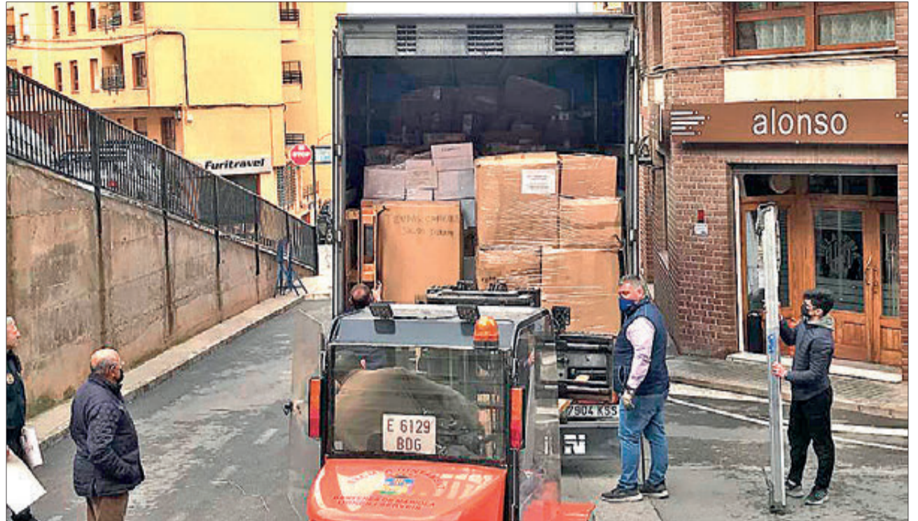
Moment en què es carrega el material en un tràiler.

GRAN RESPOSTA DE LA POBLACIÓ A LA PETICIÓ D'AJUDA