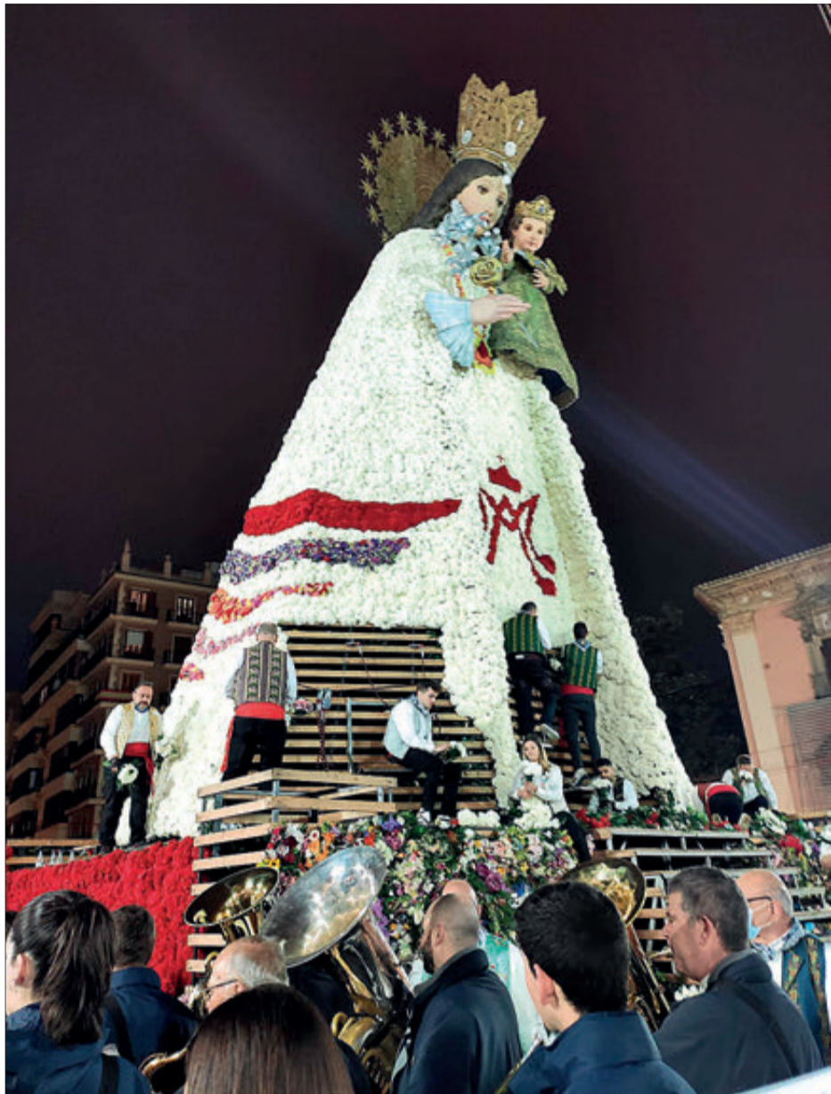
Moment en què La Nova va arribar a la Plaça de la Verge.