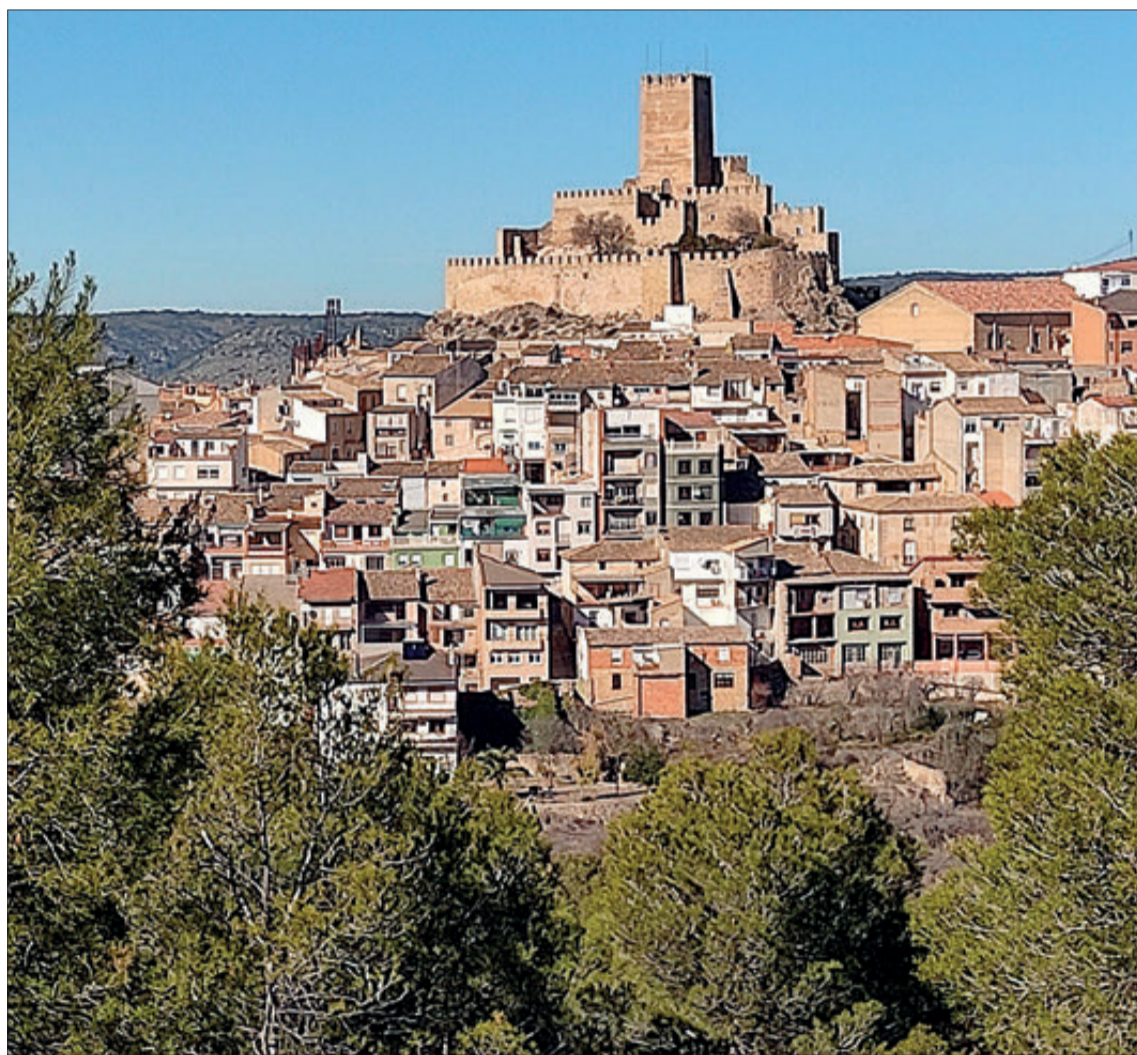
Han pujat els habitants respecte a l'any anterior.