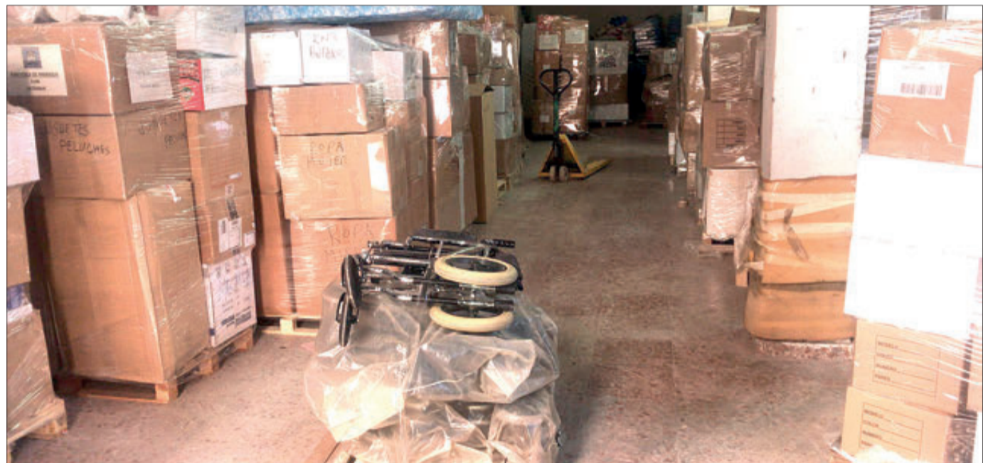
Més de 7 tones d'articles per a ajudar a la població ucraïnesa.

Des de l'Ajuntament s'ha agraït a empreses, associacions, persones voluntàries, Protecció Civil i, en definitiva, a tota la població, per la seua gran col·laboració i resposta davant aquesta campanya de suport a Ucraïna.