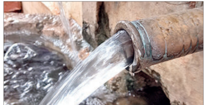
Aspecte de la Font del Cavaller.