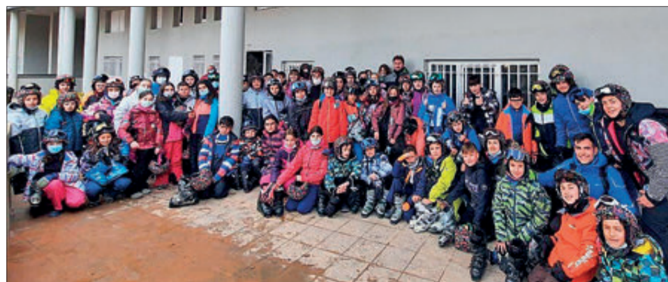
El viatge va ser suspès l'any passat per la pandèmia.