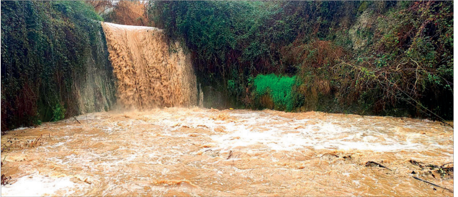
El riu a l'altura de l'assut del Molí Roig.

EN ALGUNS PUNTS ES VAN SUPERAR ELS 400 LITRES PER METRE QUADRAT