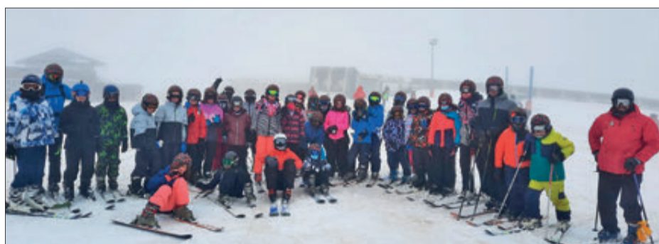
Van practicar esports d'hivern

Prop de seixanta alumnes del col·legi Alfonso Iniesta han participat en un viatge a la neu organitzat pel centre entre el 21 i el 24 de març. El destí va ser l'estació d'esquí de Sierra Nevada, on van tindre ocasió de practicar esports d'hivern (esquí i patinatge sobre gel) i reprendre una activitat que l'any passat va haver de suspendre's a causa de la pandèmia. Inicialment, el viatge estava previst que s'haguera fet al mes de gener, però l'alta incidència de Covid que hi havia en aquell moment va obligar a retardar-lo al mes de març.