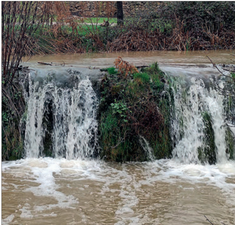
El Vinalopó pel Molí l'Ombria.

En l'estació meteorològica del Barranquet es van arreplegar (de l'1 al 26 de març) 322,6 litres per metre quadrat mentre que en la situada en l'IES Professor Manuel Broseta les quantitats arribaven fins a 320,6 litres. A l'estació situada en el Molí Sol, l'aigua acumulada durant el mes de març era també molt considerable, amb 302 litres. L'estació d'Ull de Canals també assenyalava bona cosa d'aigua, marcant 260,9 litres per metre quadrat. Però on més se'n va registrar va ser en l'estació de la Venta el Borrego, on constaven, a data 26 de març, de 407,7 litres per metre quadrat.