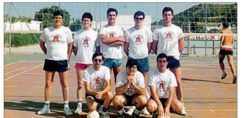
Alfa sempre ha donat suport a l'esport local

"Han sigut anys molt enriquidors. Per l'acadèmia de brodat van passar les que ara són àvies dels nostres últims clients. Per casa han passat tres generacions i de tots hem après. Amb els majors hem organitzat excursions, viatges de fi de curs, sopars de Nadal, xocolatades... Amb els xicotets hem gaudit veient-los créixer, tontejar, casar-se i fins convertir-se en pares i mares".