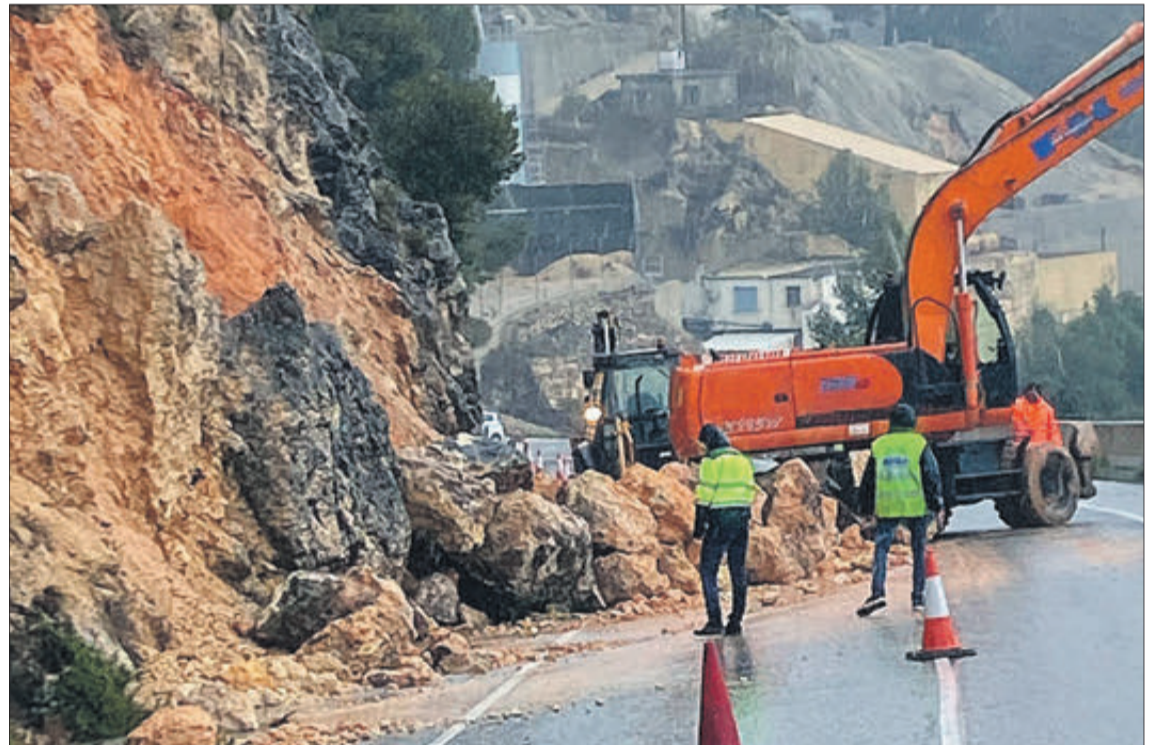
La caiguda de pedres i material va obligar a tallar un carril.