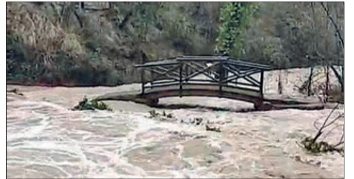
Les pluges van incrementar el nivell d'aigua.