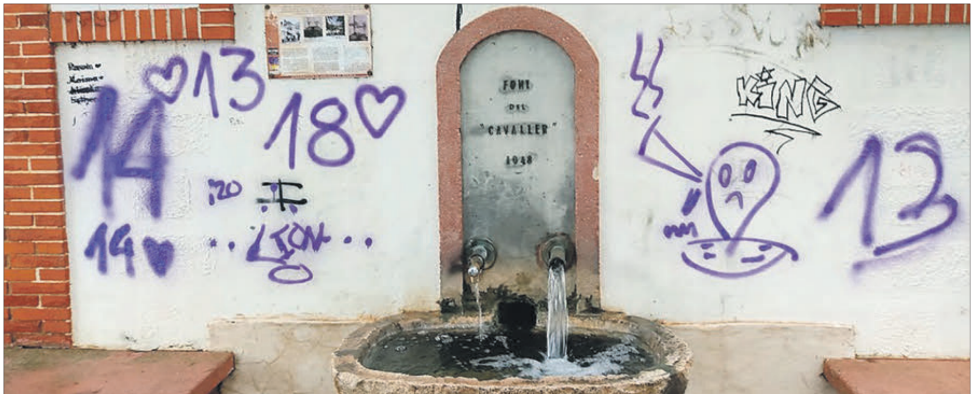
Pintades en el frontal de la Font del Cavaller.

L'APARICIÓ DE PINTADES DETERIORA L'ENTORN URBÀ