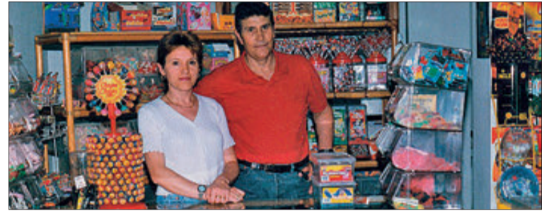
El matrimoni, en Alfa al convertir-se en tenda de llepolies

El matrimoni no dissimula el seu content per com ha transcorregut tot.