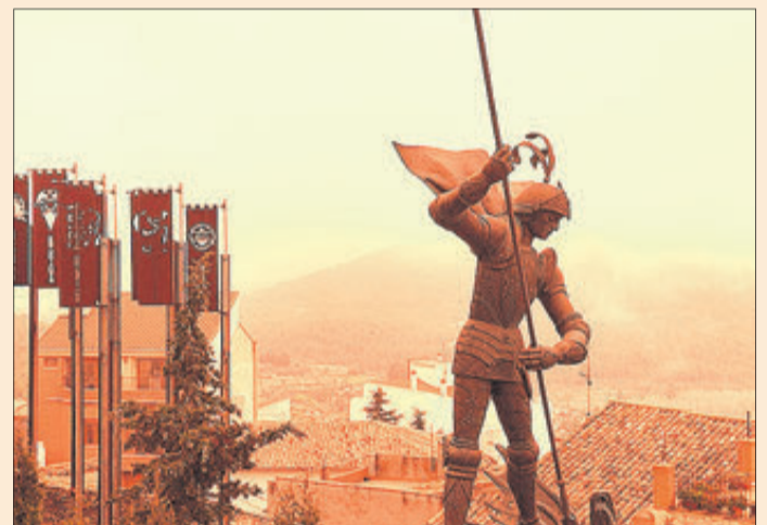
El monument a Sant Jordi rodejat per la calima.

La calima produïda per la borrasca Cèlia va fer acte de presència a Banyeres igual que en àmplies zones del país. El fenomen, originat per la gran quantitat de pols en suspensió en l'atmosfera procedent del desert del Sàhara, va estar present durant alguns dies, però va ser durant la vesprada del dia 7 quan es va apreciar de forma més notable, omplint de tons ataronjats el cel. Les pluges dels dies següents van acabar per netejar l'ambient, si bé va tornar a apreciar-se la presència de pols desèrtica entre els dies 23 i 24, encara que amb menor força que en l'episodi anterior.