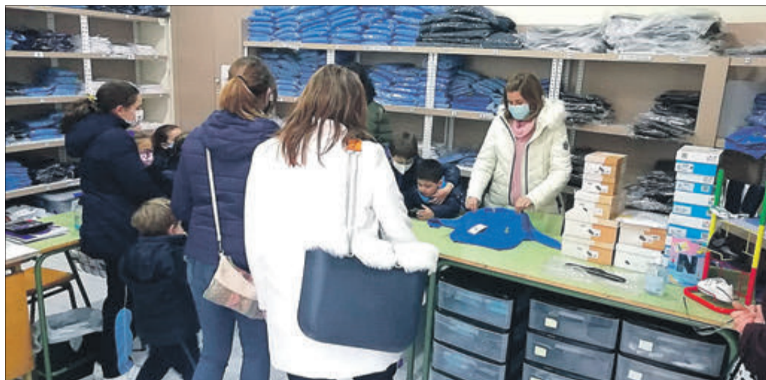
El banc d'uniformes pretén allargar la vida i l'ús de la roba.

INICIATIVA DE L'AMPA PER A FOMENTAR LA REUTILITZACIÓ