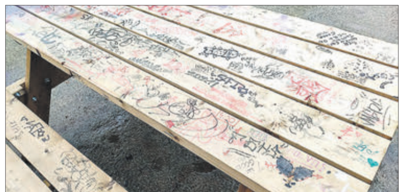
El mobiliari urbà també ha sigut deteriorat.

aspecte a tot l'entorn, i que obligarà el consistori a haver d'efectuar l'oportuna reparació. També han sigut deteriorades algunes de les taules i bancs que es van instal·lar recentment.