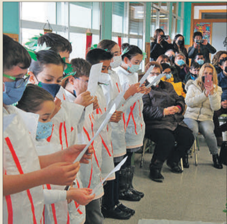
Mares, pares i familiars van assistir a la celebració.

Alumnes del col·legi Fundació Ribera han donat per finalitzats els projectes d'aprenentatge que han dut a terme des de l'etapa d'Infantil fins al curs de 6é de Primària. Per a celebrar-ho, el dia 18 de març es va organitzar un esdeveniment al que van convidar mares, pares i familiars per a mostrar-los tot el que els alumnes havien estat treballant durant tot aquest temps. Cal destacar que els projectes de l'últim trimestre es van localitzar en el transcurs de la història, començant per l'edat antiga, apresada pels més menuts fins a l'edat moderna, estudiada pels alumnes més majors de Primària.