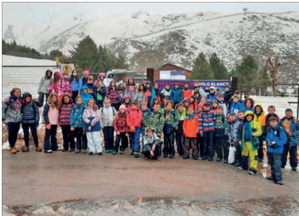
Grup d'alumnes i al fons l'estació.