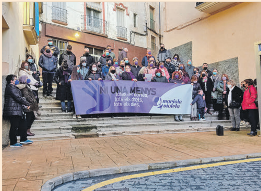
Concentració en la plaça de l'Ajuntament.