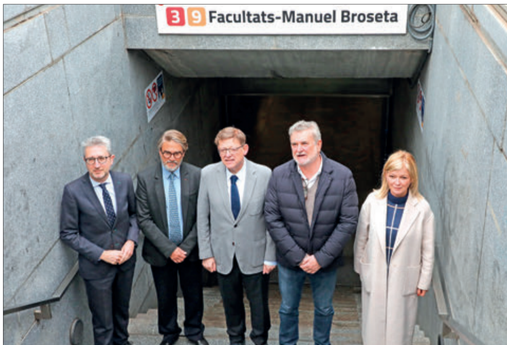
El president Ximo Puig, junt a altres autoritats, a les portes de l'estació de metro.