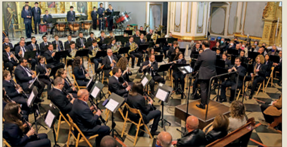
La Nova va interpretar el concert a l'església de Santa Maria.

El 18 de març, divendres, la Agrupació Musical la Nova va participar en l'Ofrena de Flores de les festes de les Falles de València. La banda va acompanyar a la Falla Sagunt Pare Urbano de la capital, entrant en la plaça de la Verge quan eren les 19,30 hores. L'itinerari es va realitzar amb gran emoció, especialment la part final que va incloure l'arribada a la plaça. Era la primera vegada que la Nova participava en aquest acte.