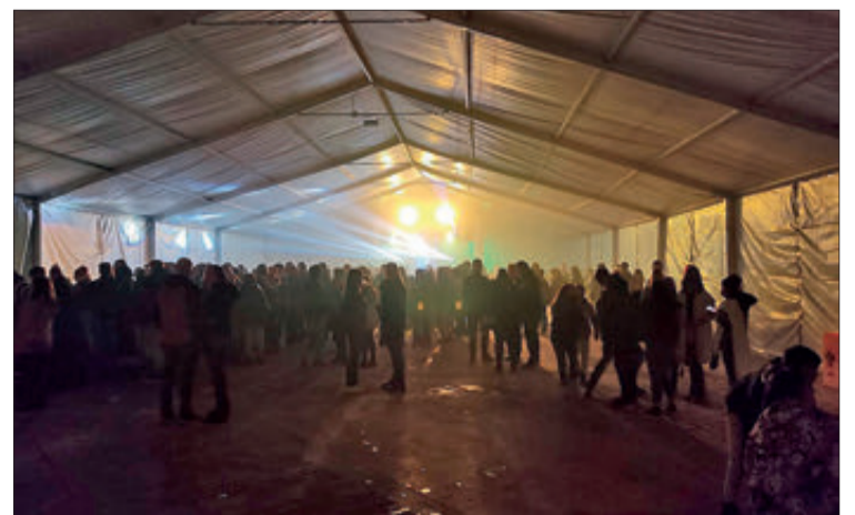
Cloenda de les entraetes amb discomòbils.

■ Els vents van ser normals. Les ràfegues més fortes van arribar a 69,2 km/h.