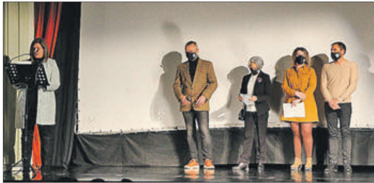
El documental es va presentar en el Teatre Principal.

nunciant a la possibilitat d'haver cursat estudis, assumint horaris interminables, adaptant-se a cada moment, compaginant el treball de la casa amb el del camp o el de les fàbriques i assumint, pràcticament al cent per cent, els rols de criar als fills, les dones han sigut determinants en el desenvolupament de la societat.