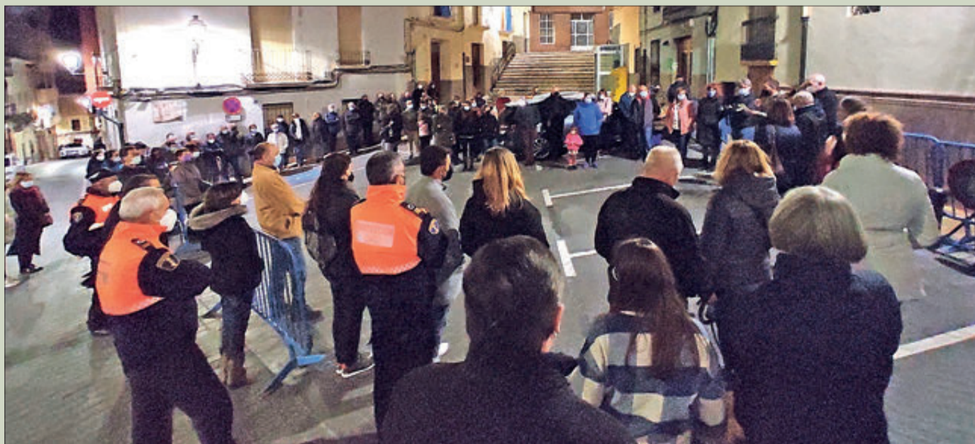
La concentració va reunir un centenar de persones.