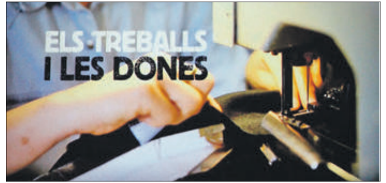
És un nou treball del "Museu de la Paraula".

El documental aborda tots aquests aspectes a través de les declaracions directes i sinceres de les protagonistes i trau a la llum, de manera explícita, la manera en què les dones han contribuït a l'evolució de la comunitat sense dedicar temps a si mateixes, de manera invisible i sense protagonisme.