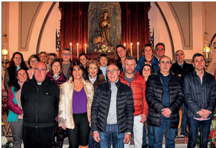
Junta de la Confraria de la Malena.