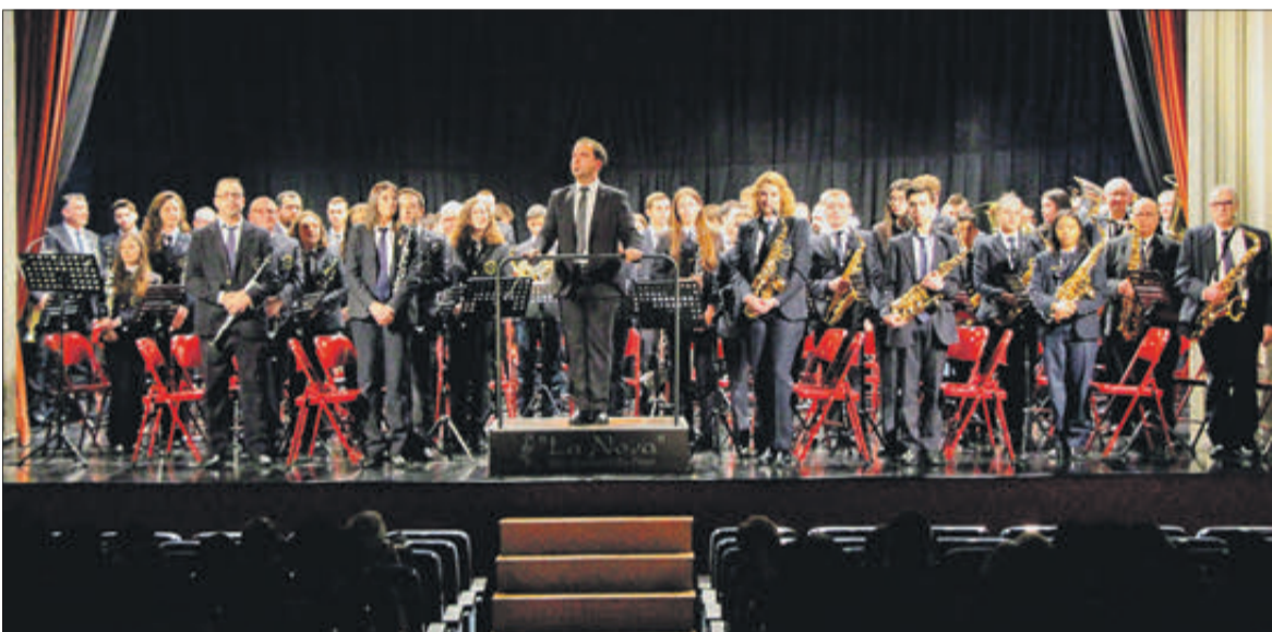
L'Agrupació Musical la Nova va oferir un repertori de música festera.