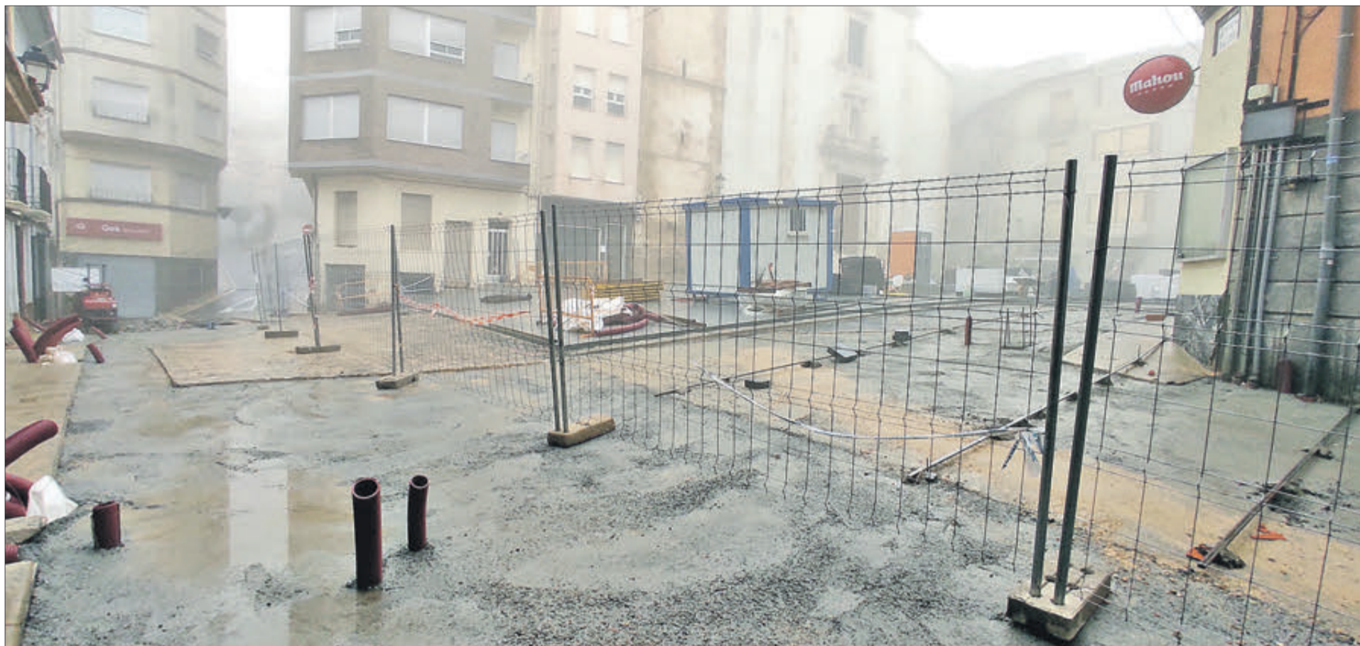
La Plaça Major continua en obres.