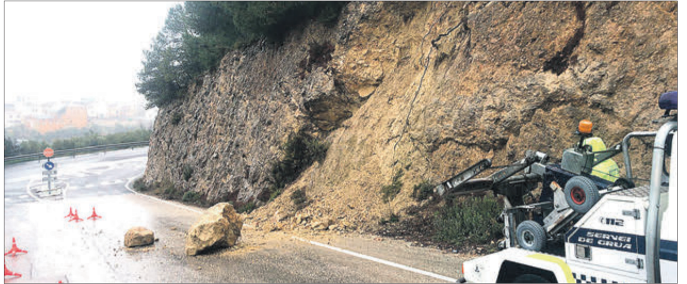
Despreniment en l'accés a la carretera d'Alcoi des de la Pedrera.

Circumstàncies paregudes van passar en la carretera que va des de la Pedrera fins a les proximitats de la Font del Sapo, per tots coneguda com la del 15%, pel desnivell que té. Allí, a pocs metres de l'encreuament amb la carretera d'Alcoi, també es va produir un despreniment i efectius policials i de la brigada municipal van haver de resoldre la situació per a evitar que la cosa no anara a més. D'igual manera tampoc es va haver de lamentar que en eixe moment passara algun vehicle o persona.