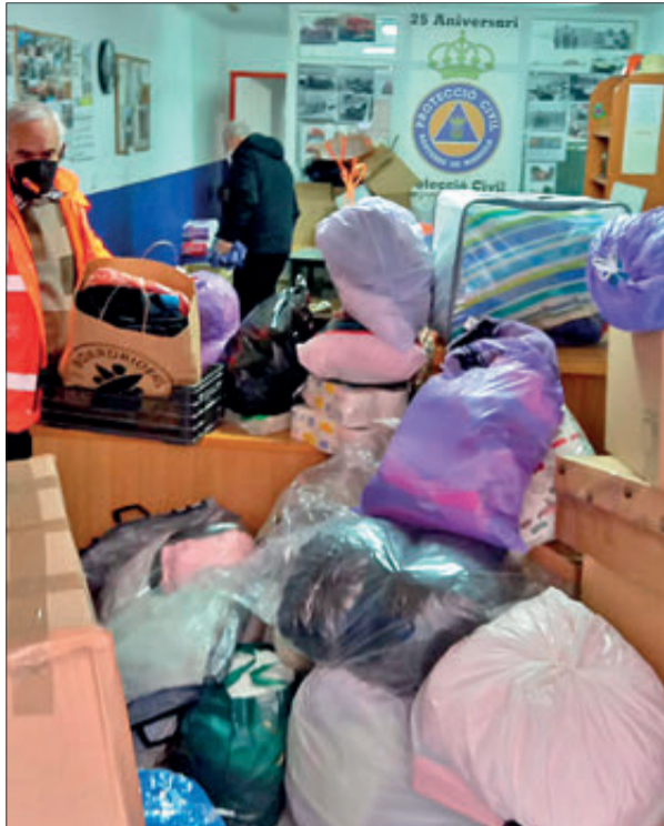
Personal voluntari classificant i empaquetant el material.