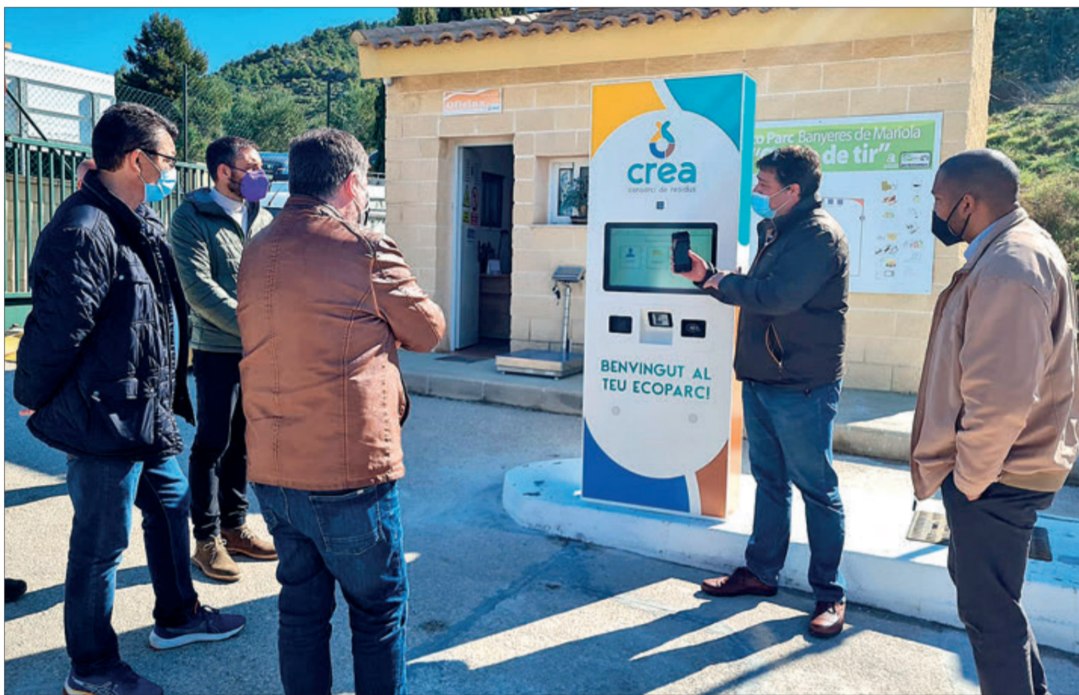
La presentació del sistema informàtic es va fer en l'ecoparc de Banyeres.

Aquest procés d'informatització és el que fa possible establir compensacions a la ciutadania mitjançant els comptes "CreaEconomíaCircular" que es van començar a generar al desembre passat, inscrivint a les