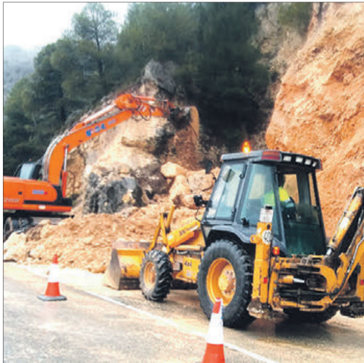
El despreniment no va afectar cap vehicle.