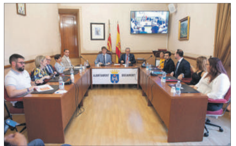
La sessió extraordinària del passat 17 de juny.