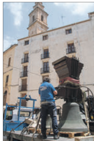
BLAI VAÑÓ VICEDO