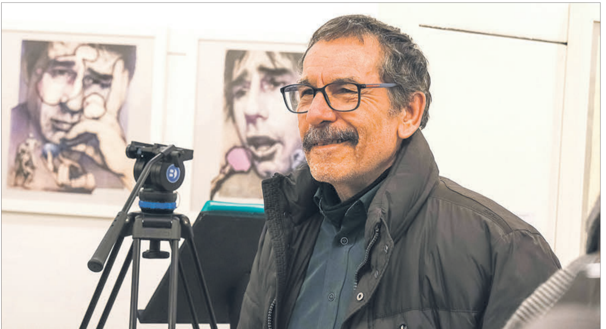
El autor del cartel de las próximas Fiestas durante la inauguración de una exposición en el Centre Ovidi Montllor, a principios de este año.