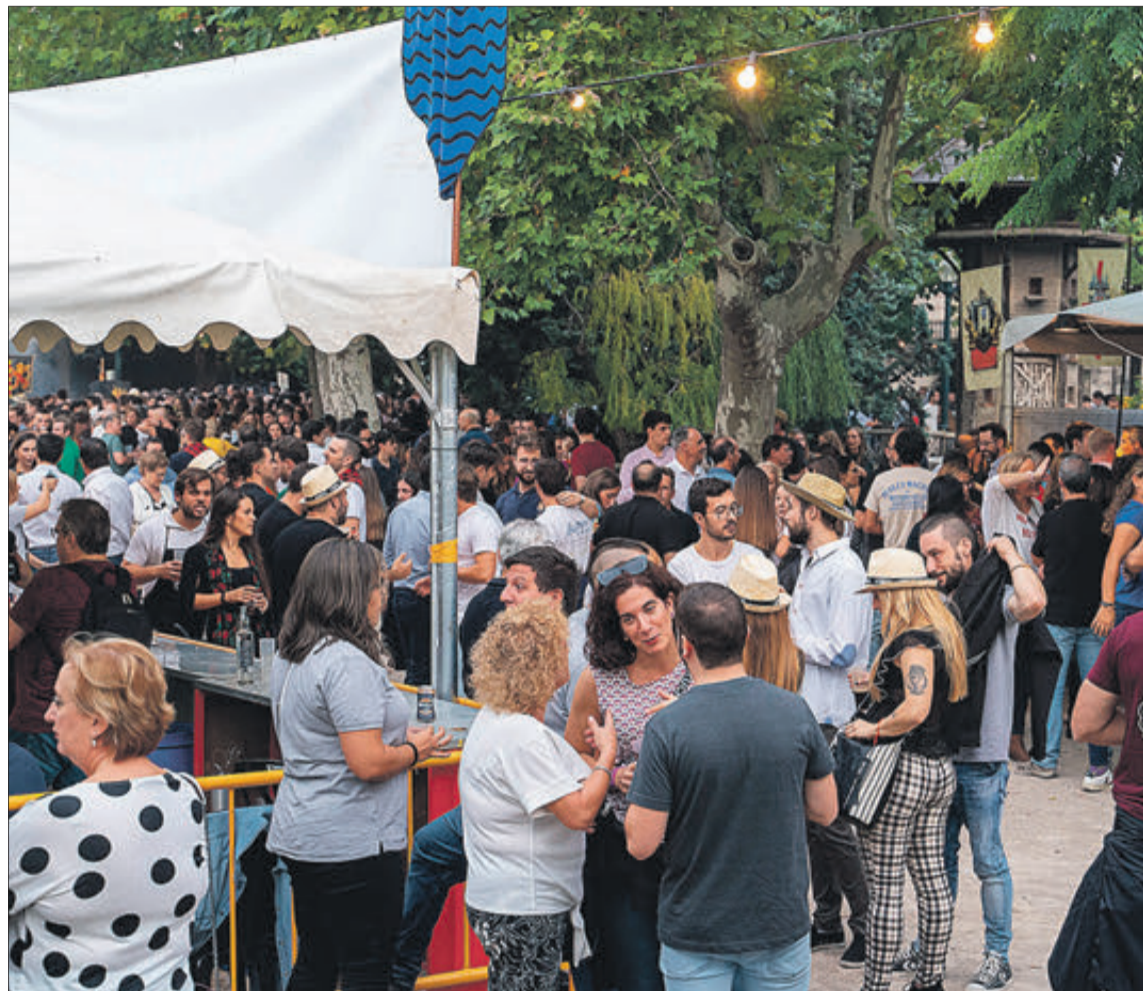
Arriba, y a la derecha, imágenes del concurso de Olleta y de 'entradetes' del año pasado.