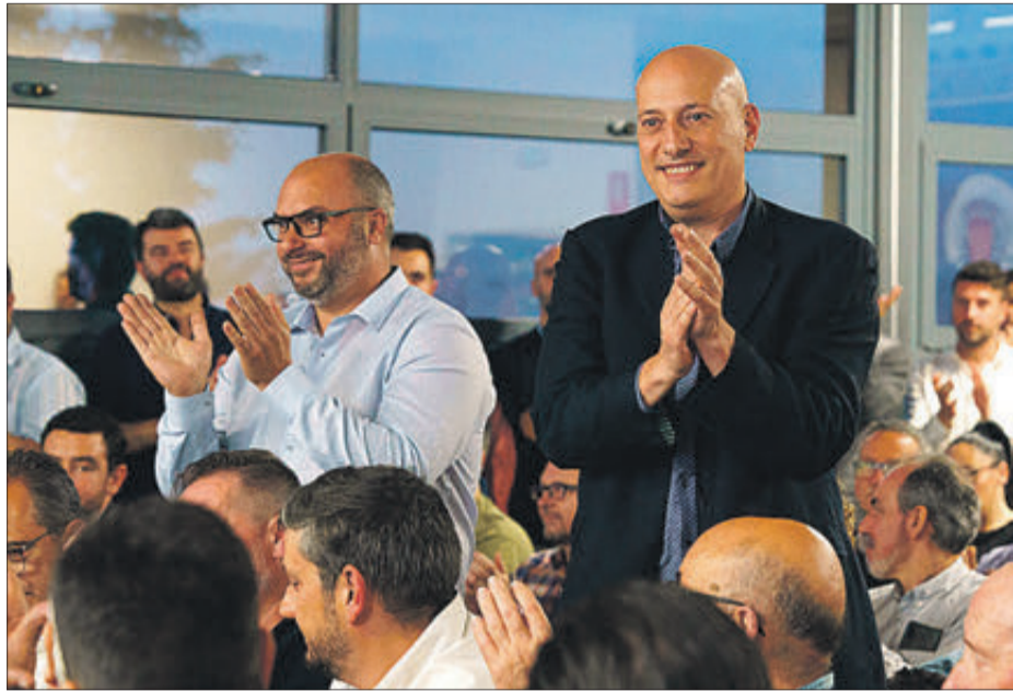
El próximo capitán moro en la asamblea del Casal del pasado junio.