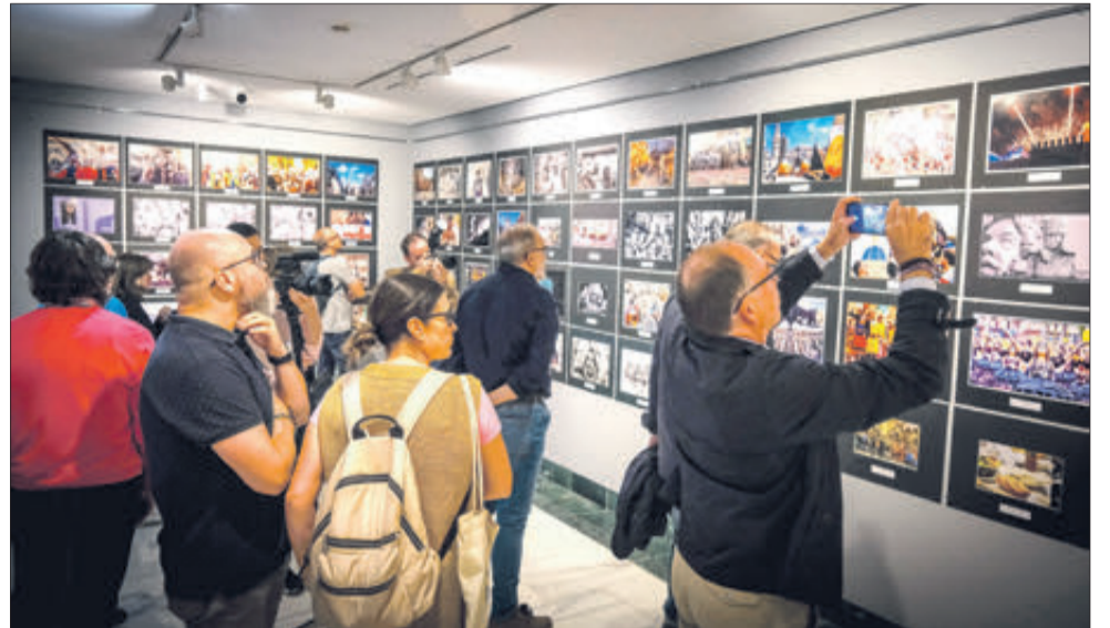
En la exposición se muestran las 247 fotografías presentadas al certamen.