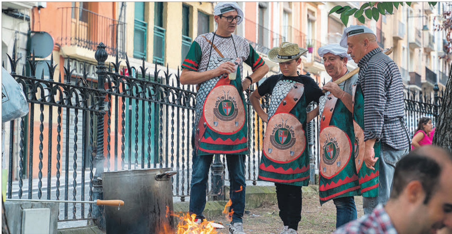
Imagen de archivo del concurso de Olleta celebrado el año pasado.

A l igual que ocurrió en el año 2021 —en esa ocasión debido a las restricciones de la pandemia de la Covid-19—, el concurso de Olleta de hoy transcurrirá por la mañana y está previsto que se conozca el nombre del ganador a partir de las 14 horas en la Glorieta.