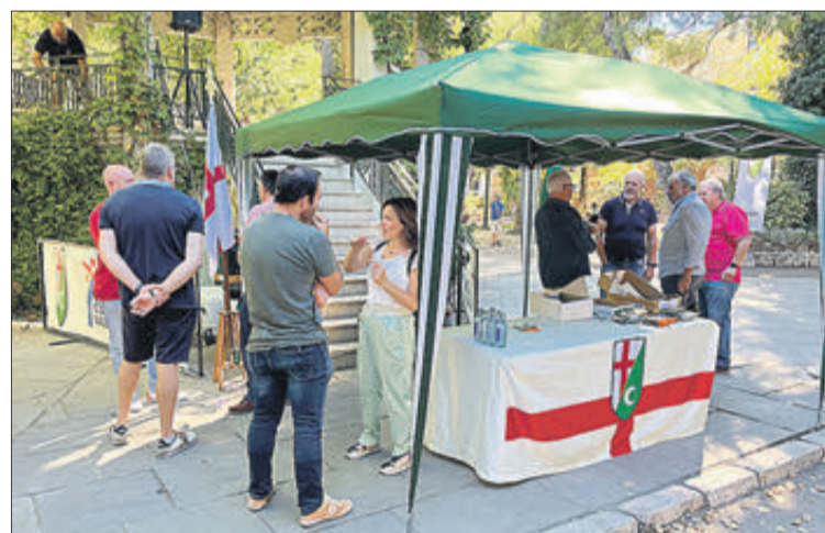
El concurso de pintura abrió la programación del Mig Any.