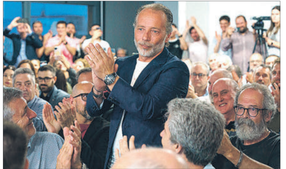
El alférez cristiano es arropado por la filà en el momento de dar a conocer el cargo.