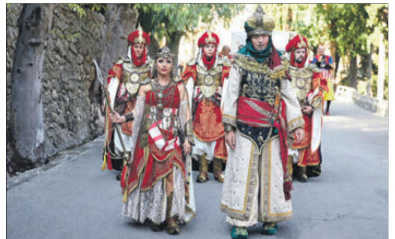
Los cargos festeros de este 2023 en la visita a Fontilles.