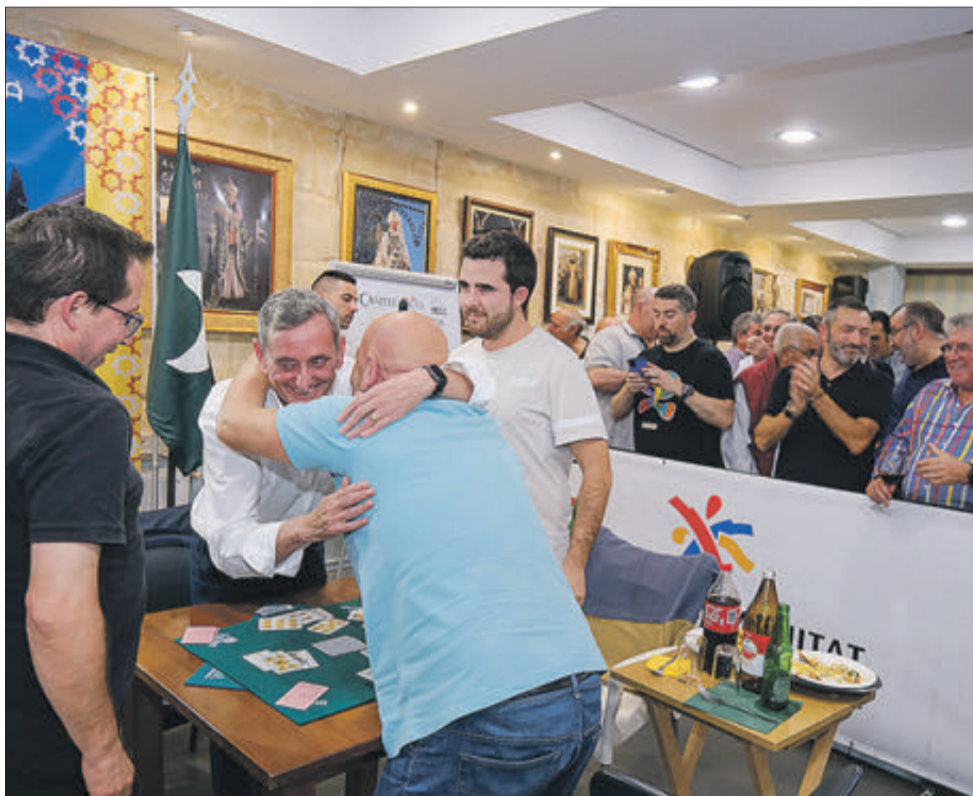
Los ganadores, celebrando la victoria.