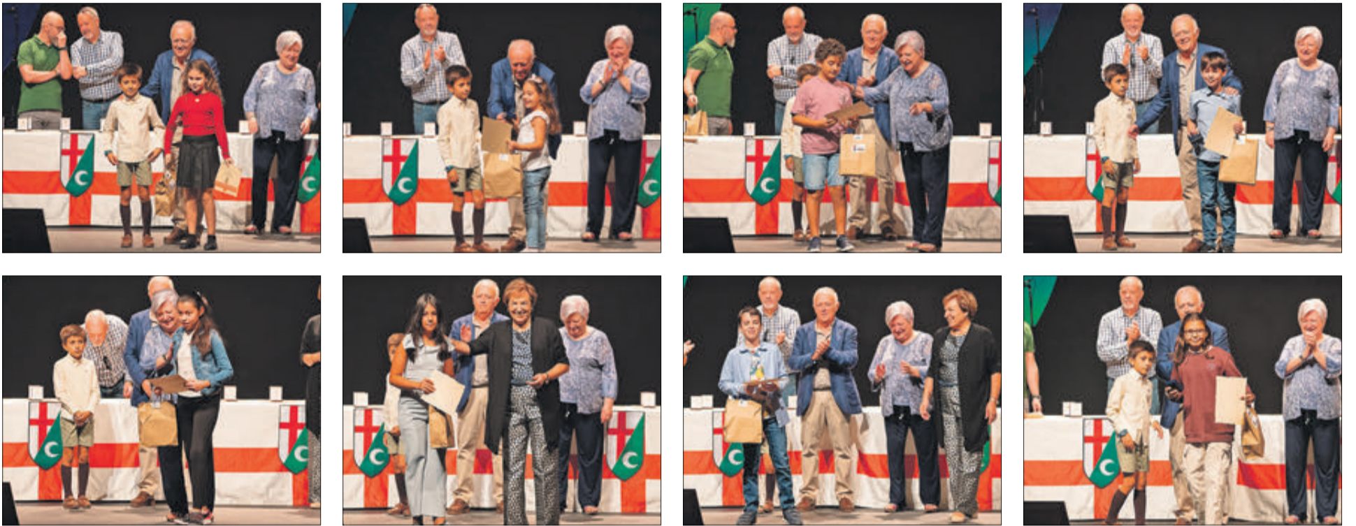
Algunos de los premiados de los concursos.

El Teatre Calderón ha albergado este año la matinal infantil, aprovechando que este espacio estaba reservado para por la tarde hacer la presentación de cargos. Los más pequeños volvieron a ser los absolutos protagonistas de esta cita con la entrega de premios de los distintos concursos infantiles convocados por la Asociación de Sant Jordi (ASJ) y también con la proyección de un audiovisual centrado en los actos festeros en los que participan los niños y niñas.