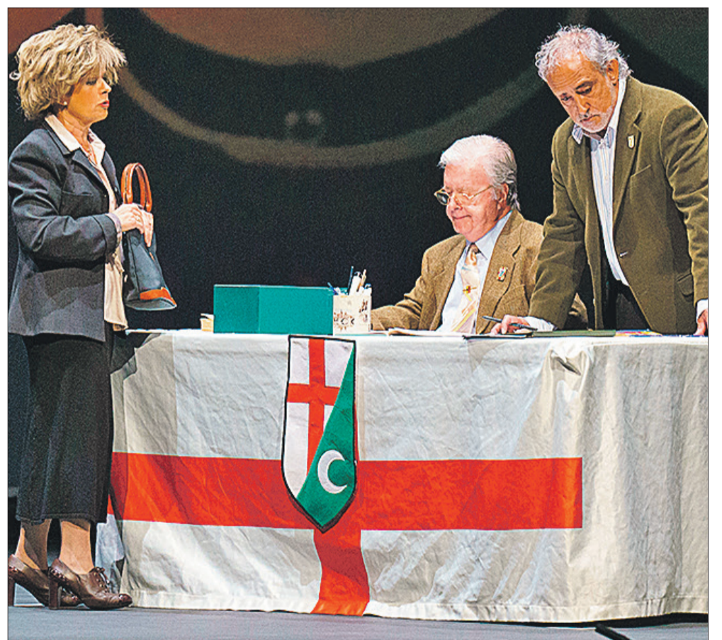
Un momento de una de las funciones del sainete de este mes de octubre.

En el elenco aparecieron tanto actores como actrices con una amplia experiencia en el mundo teatral y del propio sainete festero, como otros que han debutado en este homenaje para recordar a la mítica Luisa Gonzálbez Moncho.