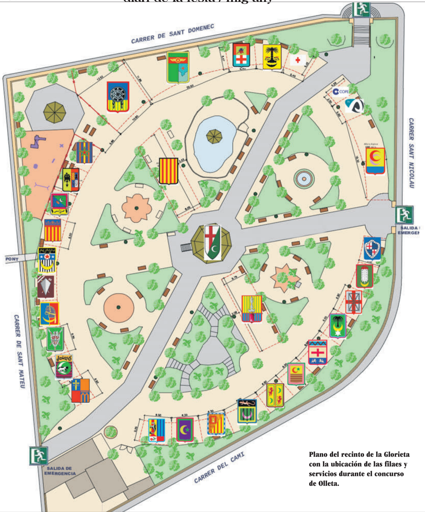
Plano del recinto de la Glorieta con la ubicación de las filas y servicios durante el concurso de Olleta.