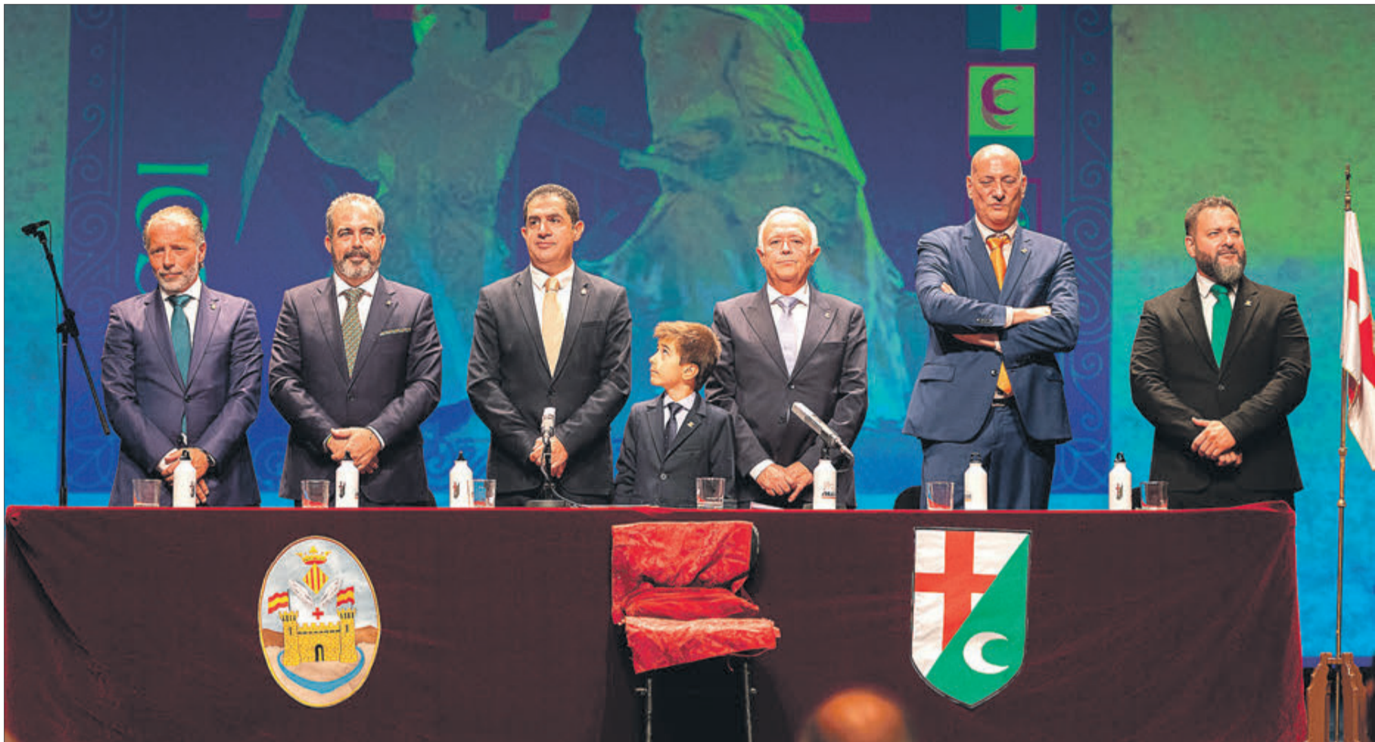
Los cargos festeros, alcalde y presidente de la ASJ, durante el acto celebrado en el Teatre Calderón.

le llegó el pasado mes de junio y que le permitirá representar al patrón de la ciudad en las próximas fiestas. Será el cuarto Sant Jordiet de los Judíos y el primero primero de la filà en 60 años.