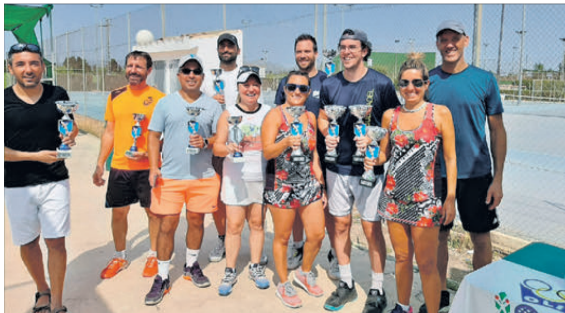
Els guanyadors en les diferents categories.

El text complet de la convocatòria es pot consultar a la web: https://www.oliva.es/va/pagina/convocatòria-subvencions-esportistes-delit