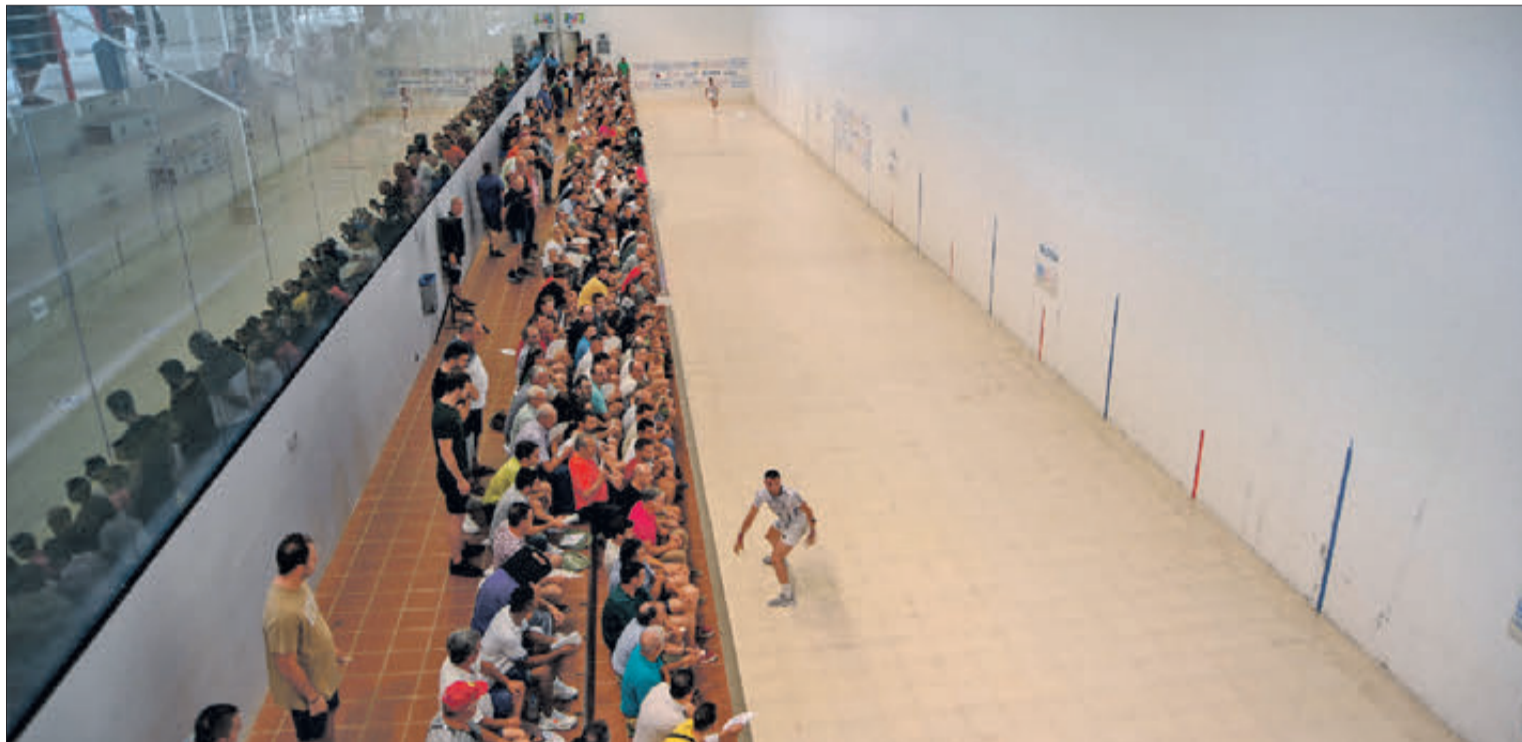
Oliva compta amb destacats esportistes en nombroses modalitats.

La regidora d'Esports ha explicat que: "Seran subvencionables els programes esportius presentats i realitzats pels esportistes d'Oliva en la temporada esportiva de l'1 de juliol de l'any anterior al de la convocatòria fins al 30 de juny de l'any en curs, amb càrrec als pressupostos d'aquest mateix any, és a dir, de l'1 de juliol del 2021 al 30 de juny del 2022. No obstant això, en cas que es funcione per any natural, prèvia sol·licitud justificada, el període tem-