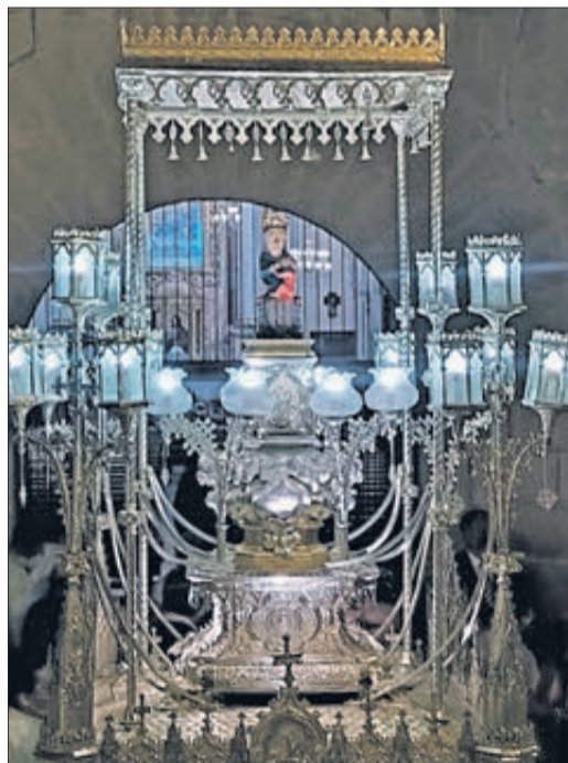
La Verge del Rebollet amb les seues andes d'argent.