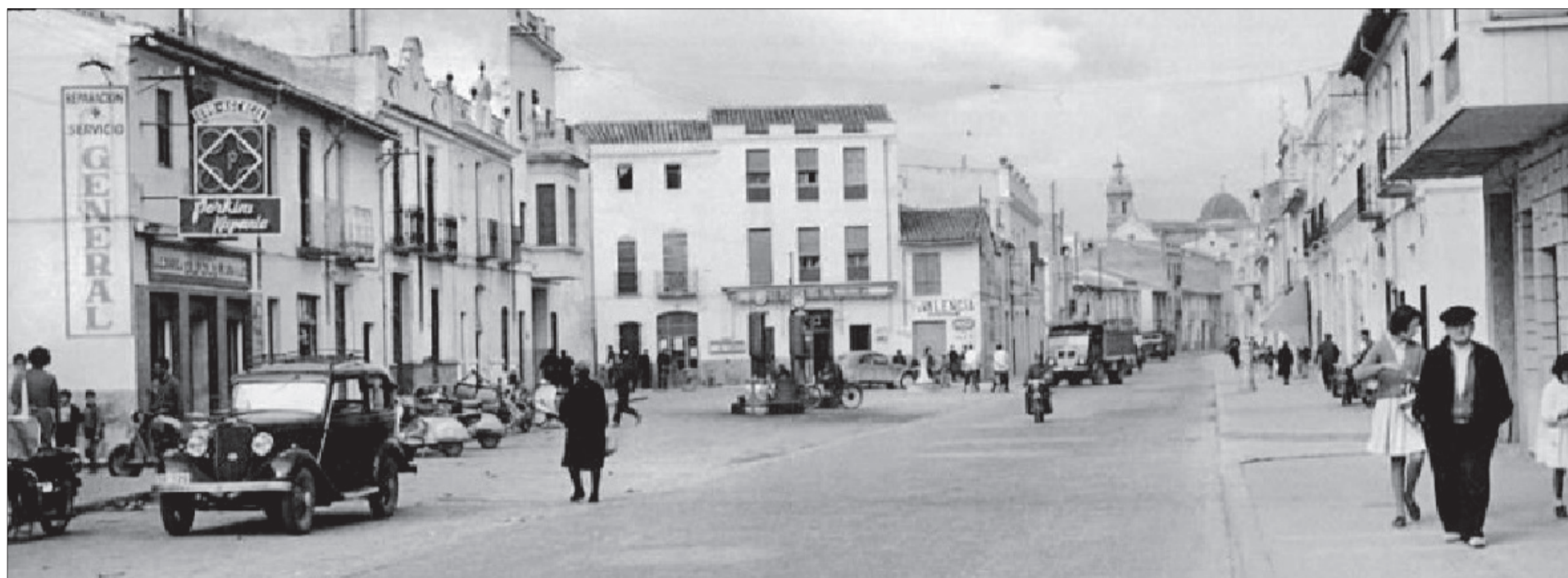
La Raconada de les Ermites al segle XX.