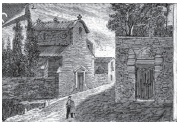
Il·lustració 'Entrada al pueblo de Oliva', del llibre 'La Ilustración Española y Americana' de 1877.