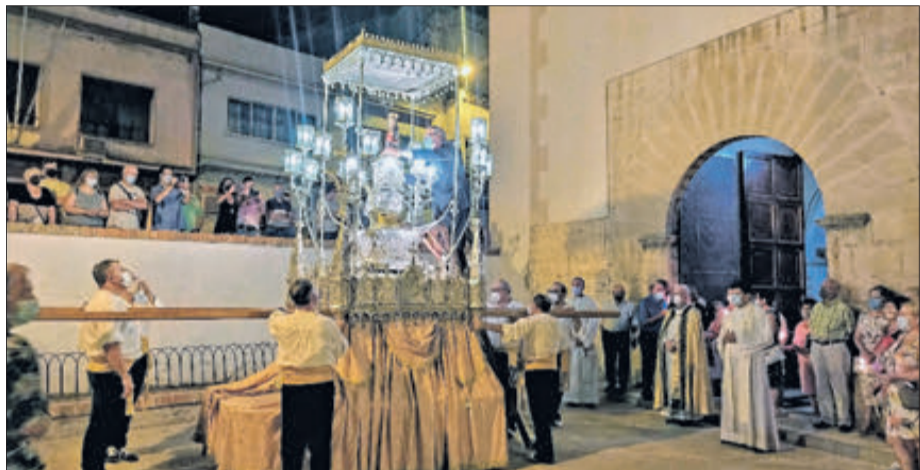
Trasllat en 2021.