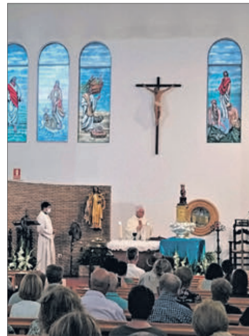
Visita de la patrona a la platja d'Oliva 2022.