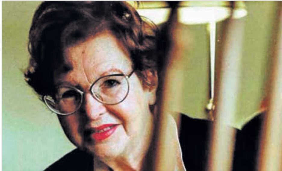
L'escriptora Maria Beneyto.