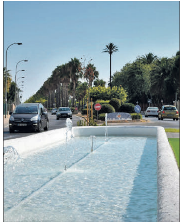
Dues imatges de la intervenció realitzada per a la recuperació de la font.