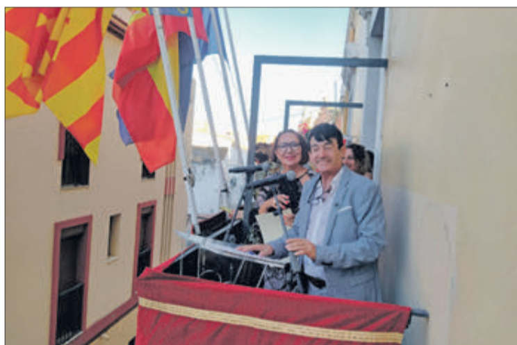
Els pregoners van reivindicar la importància de les festes.