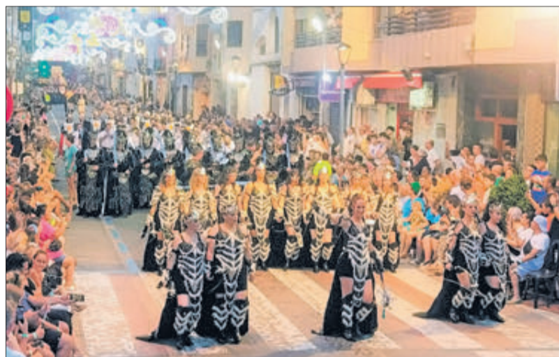
Filà Jaume I.