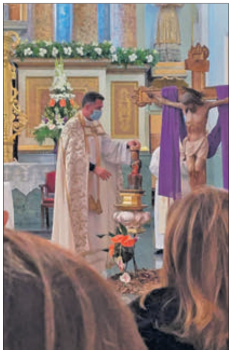
En Sant Roc.

En resum, segons l'anterior arxiver de la parròquia de Santa Maria José Castell assenyalava que "el clergat, Ajuntament i ciutat veneren a la Santíssima Verge, sota el títol del Rebollet, ja des d'antic per tots els avantpassats. El Papa, assessorat per l'arquebisbe de València i pel Prefecte de la Sagrada Congregació de Ritus, la declara Patrona principal d'Oliva amb tots els honors i privilegis". El decret està signat a Roma el dia 8 de març de 1922 per