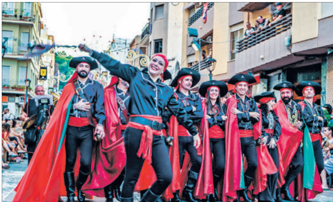
Les Entrades van ser els actes més esperats i espectaculars de la festa 2022.