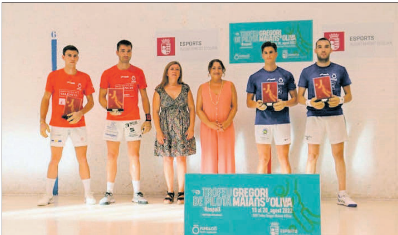
Campions i finalistes del Trofeu Gregori Maians de pilota.