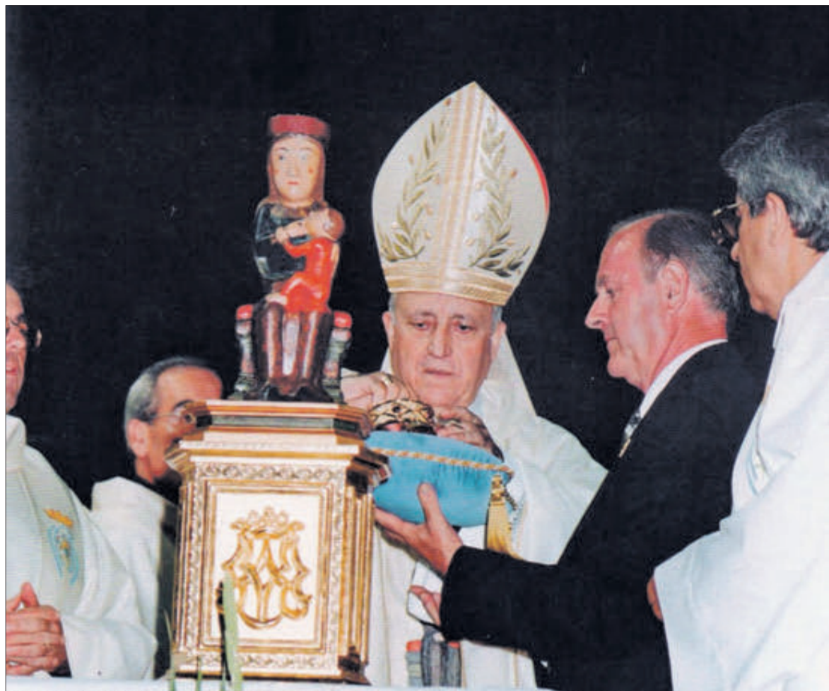
Coronació de la Verge del Rebollet (8 de setembre 1999. Parc de l'Estació).