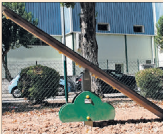
Detall del parc caní.

L'alcalde d'Oliva ha volgut afegir que "programes tan ambiciosos com aquest sempre són molt ben rebuts al nostre poble i més quan Oliva és un dels quals es beneficiarà en la primera fase. Treballarem braç a braç amb les dues conselleries, la d'Educació i la d'Agricultura, perquè tot aquest procés s'esdevinga amb totes les facilitats possibles".