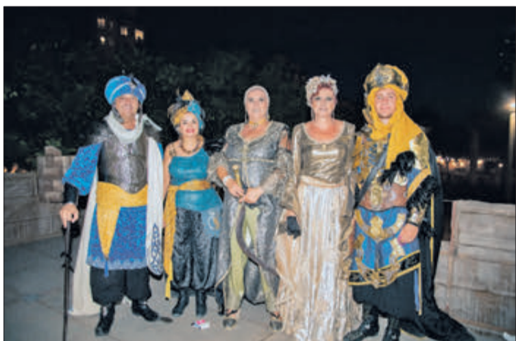
Els càrrecs festers en l'acte de la Reconquesta