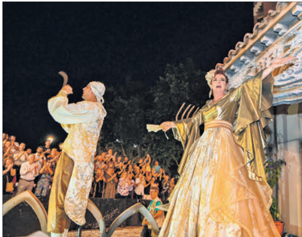
L'Ambaixadora cristiana durant l'Entrada.