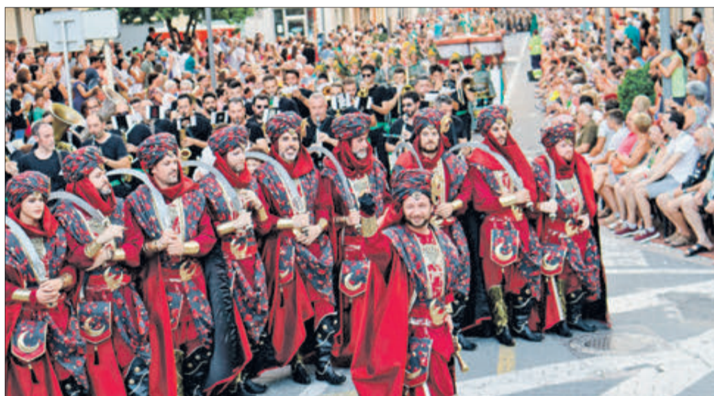
Esquadra mora baixant Loygorri