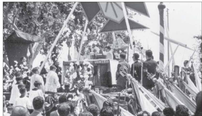
Imatge antiga de les festes del Rebollet