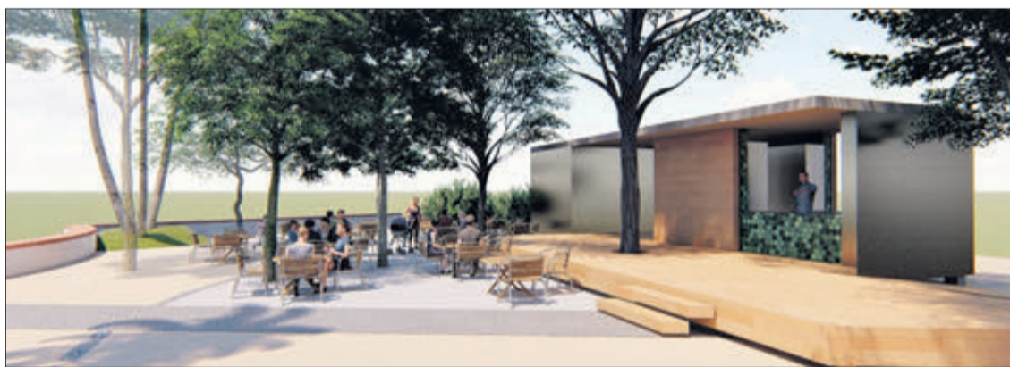
Aspecte que tindrà el quiosc projectat.

Amb anterioritat ja es va fer una consulta prèvia on es va assenyalar què eren les intencions i previsions de l'ajuntament per a regenerar la zona i construir un quiosc, el qual dotarà al parc dels serveis necessaris per a fer