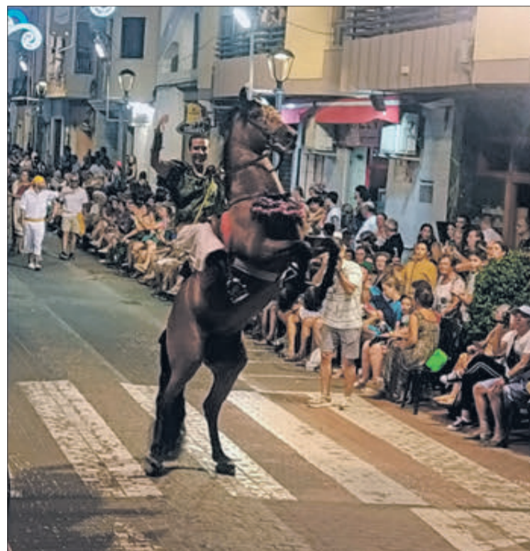
Un cavall i el seu genet durant la desfilada de l'exèrcit de la creu.