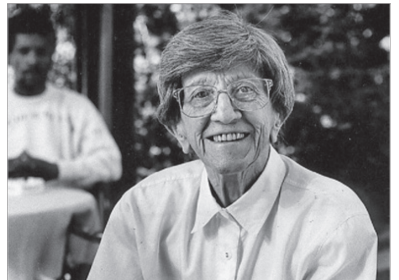
L'activista política i pacifista noruega Nini Haslund.

Testzaroli. 'El va riure ve crescut', va ser Premi València 1960, 'La dona forta', Premi Joan Senent 1965, 'Antiga pàtria', Premi Ciutat de Múrcia 1969.