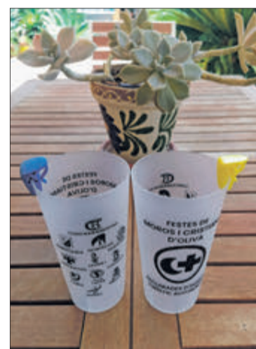
El got fester.