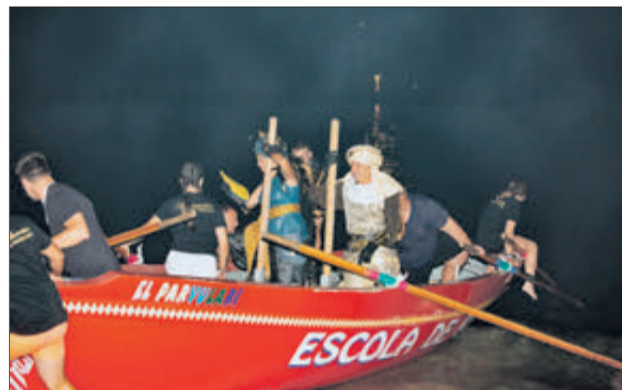
El Desembarcament, un dels actes més singulars i destacats de la festa.

A DESTACAR LA GRAN QUANTITAT DE PÚBLIC QUE VA ASSISTIR ALS ACTES, ESPECIALMENT LES DUES ENTRADES