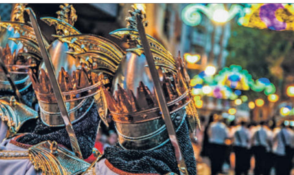
vestits d'una esquadra del bàndol cristià.