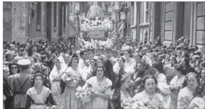
La Verge del Rebollet processonant a València.