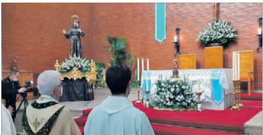
En Sant Francesc.

que ho dia de la festa del dit Pare S. Francesc la tinguen de guardar”.