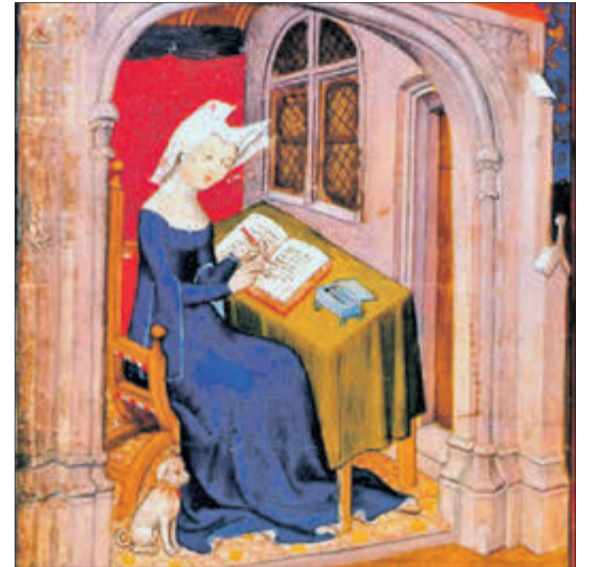
Christine de Pisan.