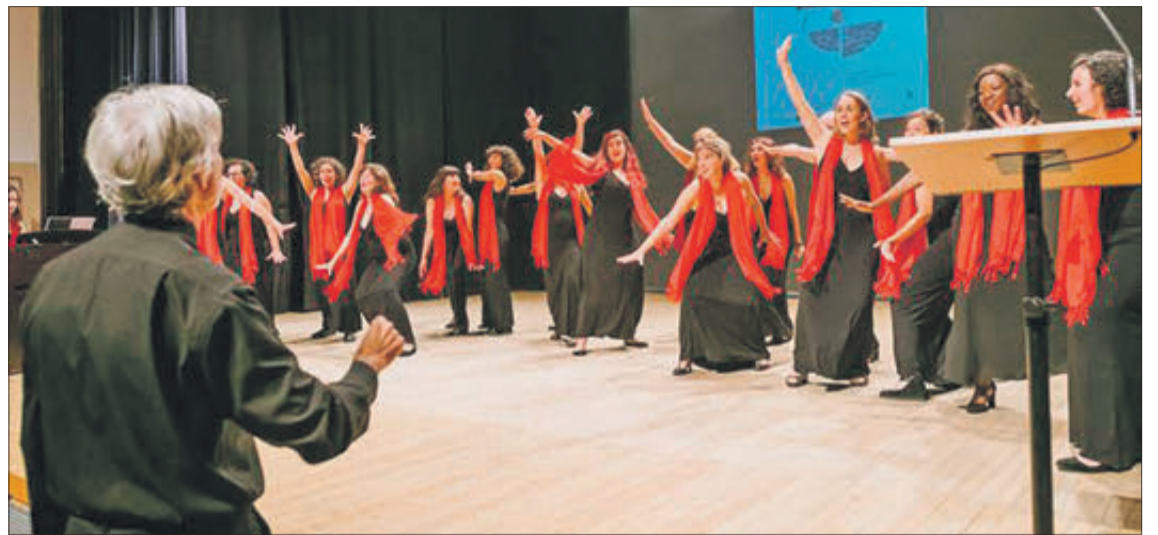
El grupo ganador de la pasada edición.