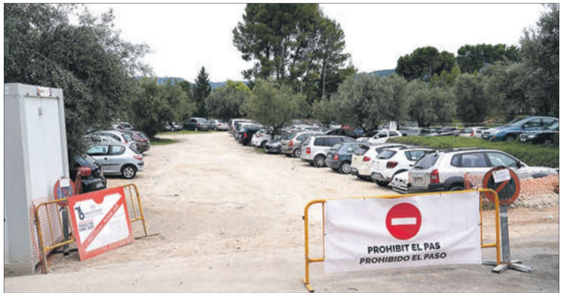
Una de las zonas habilitadas para el aparcamiento, en una pasada edición.

Desde hace ya varias ediciones, la Fira no ha dejado de evolucionar para incorporar en su oferta una amplia gama de servicios que hacen que el recorrido por las calles contestanas sea más cómodo de cara al visitante. Para la 677 edición, se han previsto 123 puntos de WC que se reparten por puntos concretos del área que alberga superficie expositiva al igual que se han previsto espacios para cambiadores o lactancia de bebés en el entorno de la Plaza Alcalde Reig o la calle Santa Bárbara. Junto a ello destacan cuatro grandes puntos de información en los accesos al recinto ferial sin olvidar 10 áreas de descanso que permiten al turista tomar un receso antes de seguir recorriendo todo lo que se ofrece en las calles contestanas durante estos días. Por último, en los mencionados stands de información, habrá también servicio para las personas con movilidad reducida; las cuales podrán adquirir prestados bastones, planos en braille o sillas de ruedas que les ayudarán a disfrutar de la Fira sin ningún tipo de barrera.