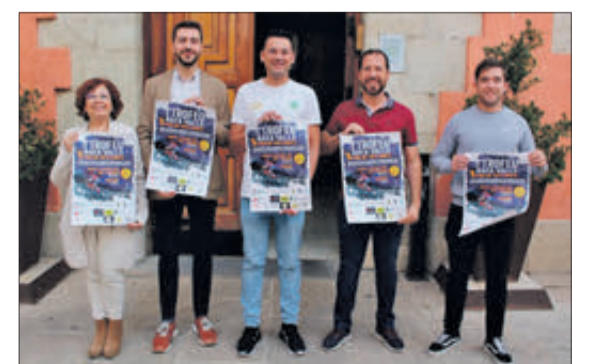
El Trofeu Rafa Valls se celebra por primera vez este año.

La última de las novedades en materia deportiva es la celebración del I Trofeu Rafa Valls en la modalidad de ciclocrós, una cita organizada por el Club Ciclista Contestano en estrecha colaboración con la organización de la Fira. Se espera la participación de unas 500 personas en todas las categorías, desde los cuatro años hasta más de setenta, en una cita que se ha previsto para el 2 de diciembre.