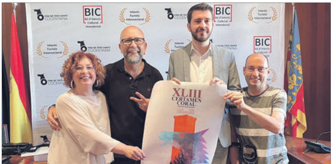
El Certamen Coral se presentó el pasado mes de septiembre