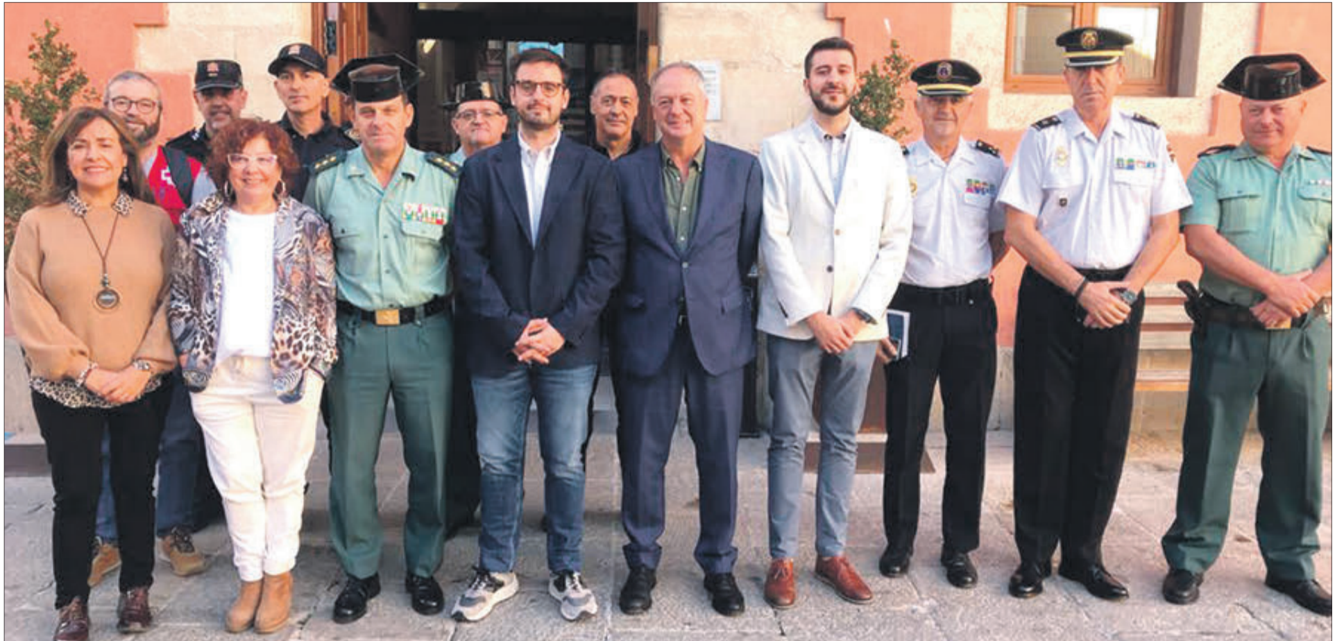
Participantes en la Junta de Seguridad celebrada días atrás, a las puertas del Ayuntamiento de Cocentaina.

El operativo se perfiló a mediados de octubre en la Junta Local de Seguridad