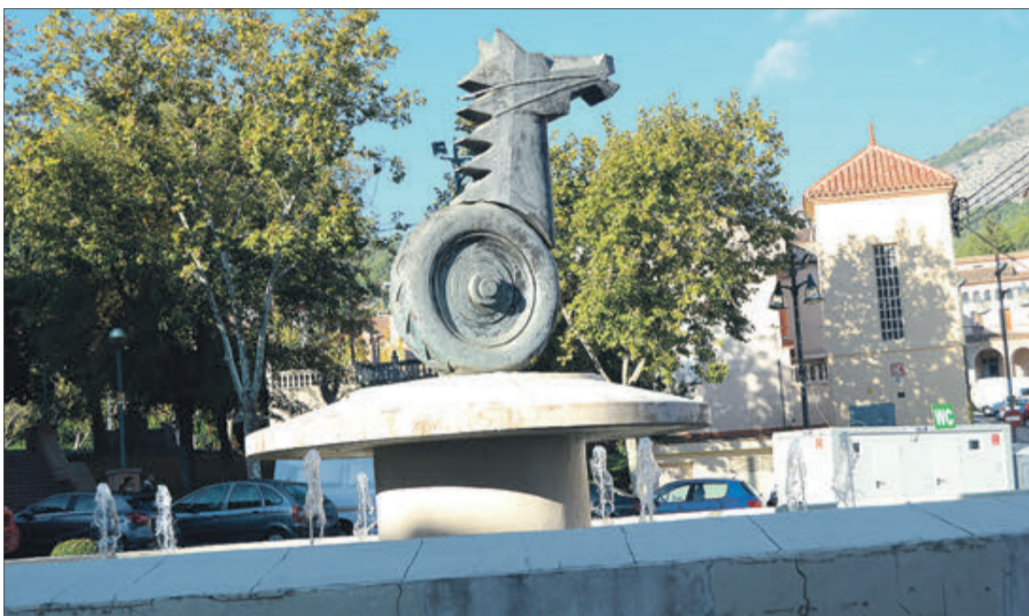
Un monumento con el logotipo de la Fira, en una de las rotondas de la travesía de Cocentaina.

Un logotipo que cumple este año sus bodas de oro y al que se le rinde homenaje por medio del cartel anunciador de 2023 que ha creado el escultor contestano Moisés Gil Igual, una obra singular que rediseña esta icónica imagen de la Fira con un toque innovador acorde a los tiempos que corren entrado ya el siglo XXI.