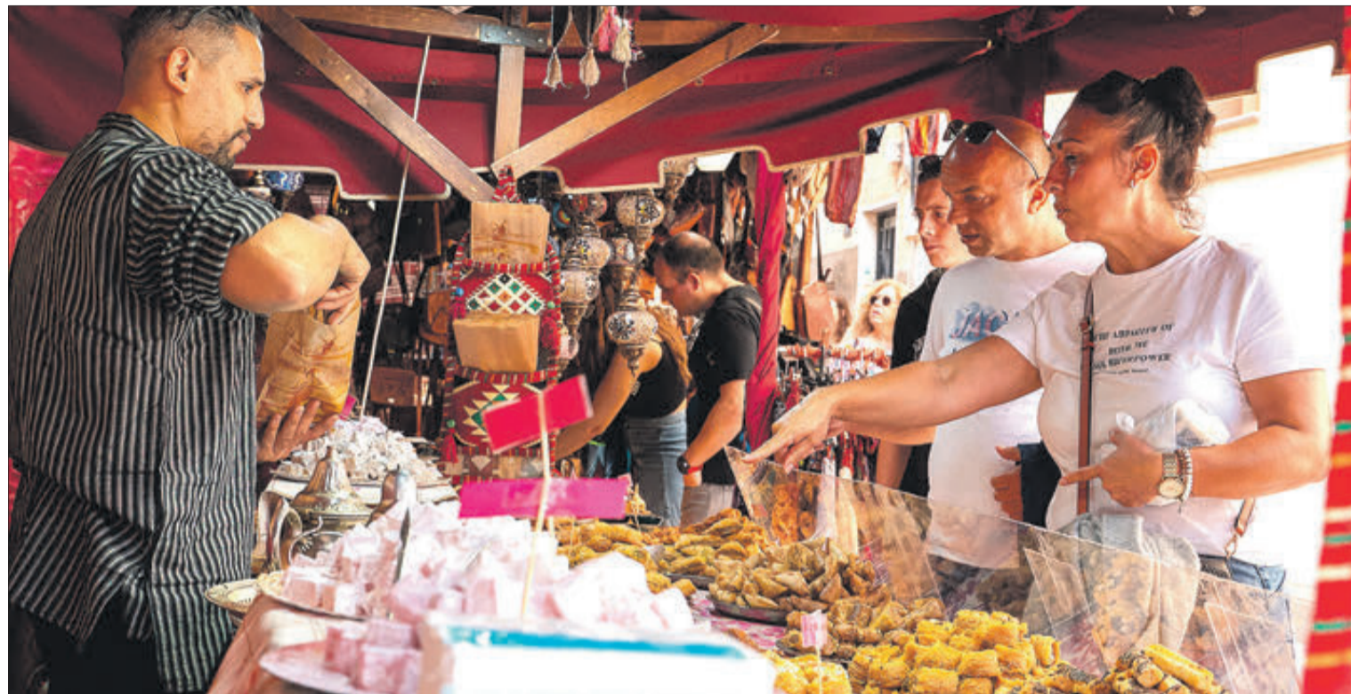
Uno de los cientos de puntos de venta que llenan las calles contestanas durante la Fira.

Las previsiones para este 2023 son muy buenas y si la climatología acompaña en las cinco jornadas, volveremos a estar ante una edición de récord que superará el medio millón de visitantes", afirmaba esta semana Jordi Pla. Con la inauguración oficial de este miércoles, dará inicio una de las ediciones de la Fira de Cocentaina más longevas de los últimos cinco años en la que más de 800 expositores vuelven a mostrar en la calle una amplia oferta comercial que se reparte por casi 140.000 metros cuadrados de exposición. De nuevo la capital del Comtat obra el milagro de hacer que sus calles sean, por Tots Sants, un espacio de sensaciones único que sin olvidar sus raíces agrícolas avanza con éxito por la modernidad presumiendo también de ser Bien de Interés Cultural (BIC) y Fiesta de Interés Turístico Internacional.