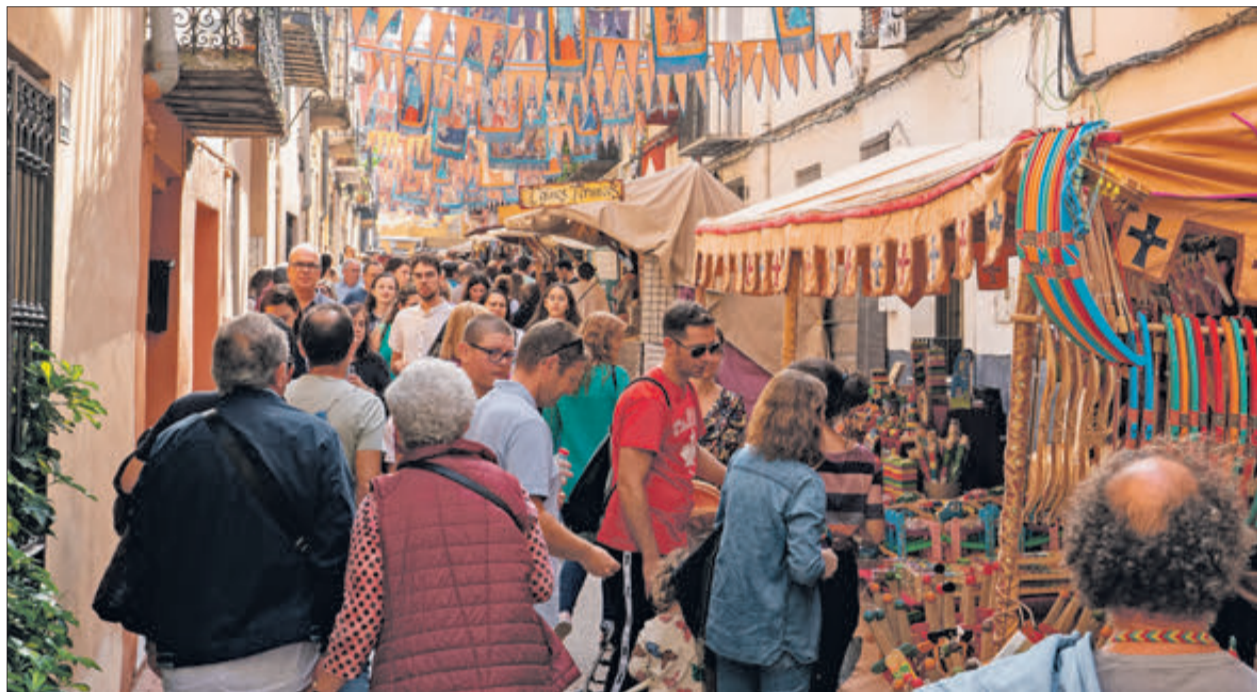
Una calle del casco antiguo con puestos de artesanía y visitantes.

Recordar que la Fira de Tots Sants de Cocentaina, como miembro activo de la Asociación de Ferias Españolas (AFE), está liderando un avance significativo hacia la sostenibilidad en su edición de este año implementando diferentes medidas que le permitan cumplir con los ODS. Por una parte, destaca la puesta en marcha de nuevas normativas para promover la gestión de re-