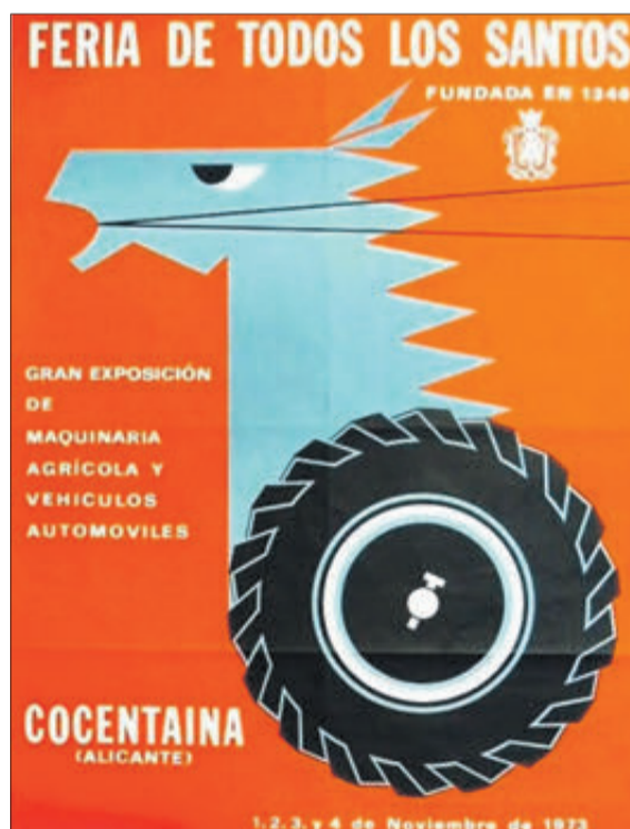
Primera publicación en la que apareció el logotipo de la Fira hace cincuenta años.