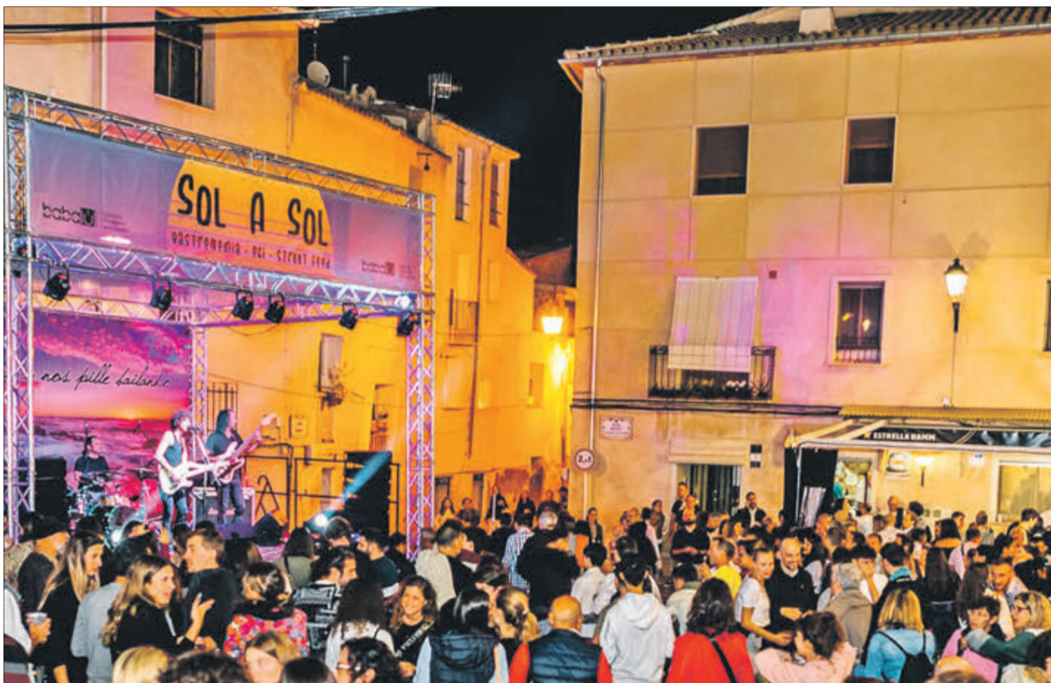
Espacio Sol a Sol en el que se celebran conciertos y se ofrecen otros servicios. (Foto: Departament de Fira).

El 'Sol a Sol' cuenta finalmente con oferta gastronómica, puntos de degustación y zonas de descanso de cara a que toda esta área sea el complemento perfecto para disfrutar después de haber recorrido todo lo que presenta la 677 edición de la Fira por las calles contestanas. Junto a esto, destaca el regreso del espacio 'Fira i Festa' con oferta de ocio noc-