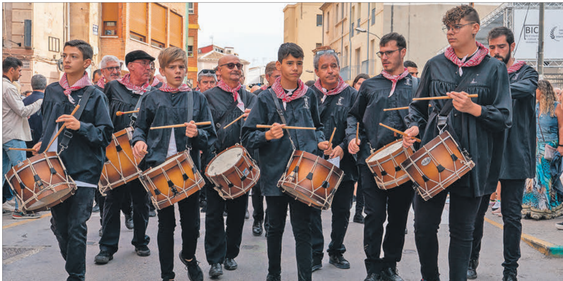
La Colla Mal Passet interpreta cada año el Himno de la Fira en la inauguración oficial.

Las dos bandas locales han vuelto a programar conciertos en homenaje al certamen