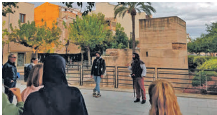
Las visitas guiadas se han celebrado desde finales de septiembre

Las visitas teatralizadas se repetirán durante dos días del certamen, concretamente el 2 y 3 de noviembre, y para participar en ellas se puede reservar por medio del número de teléfono 649 53 96 65 o por correo electrónico: visitesguiades@firadecocentaina.org .