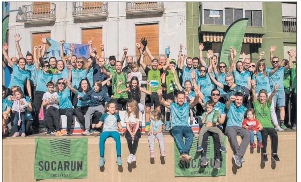
Participantes en la edición del pasado año (Foto Depart. Comunicación Fira).