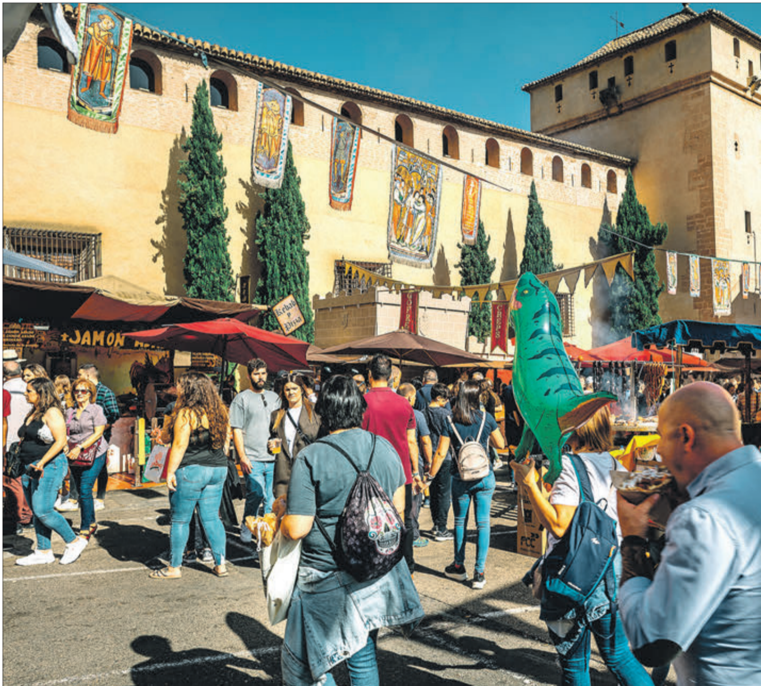
Una concurrida plaza El Pla y el Palau al fondo, durante la Fira de Tot Sants.