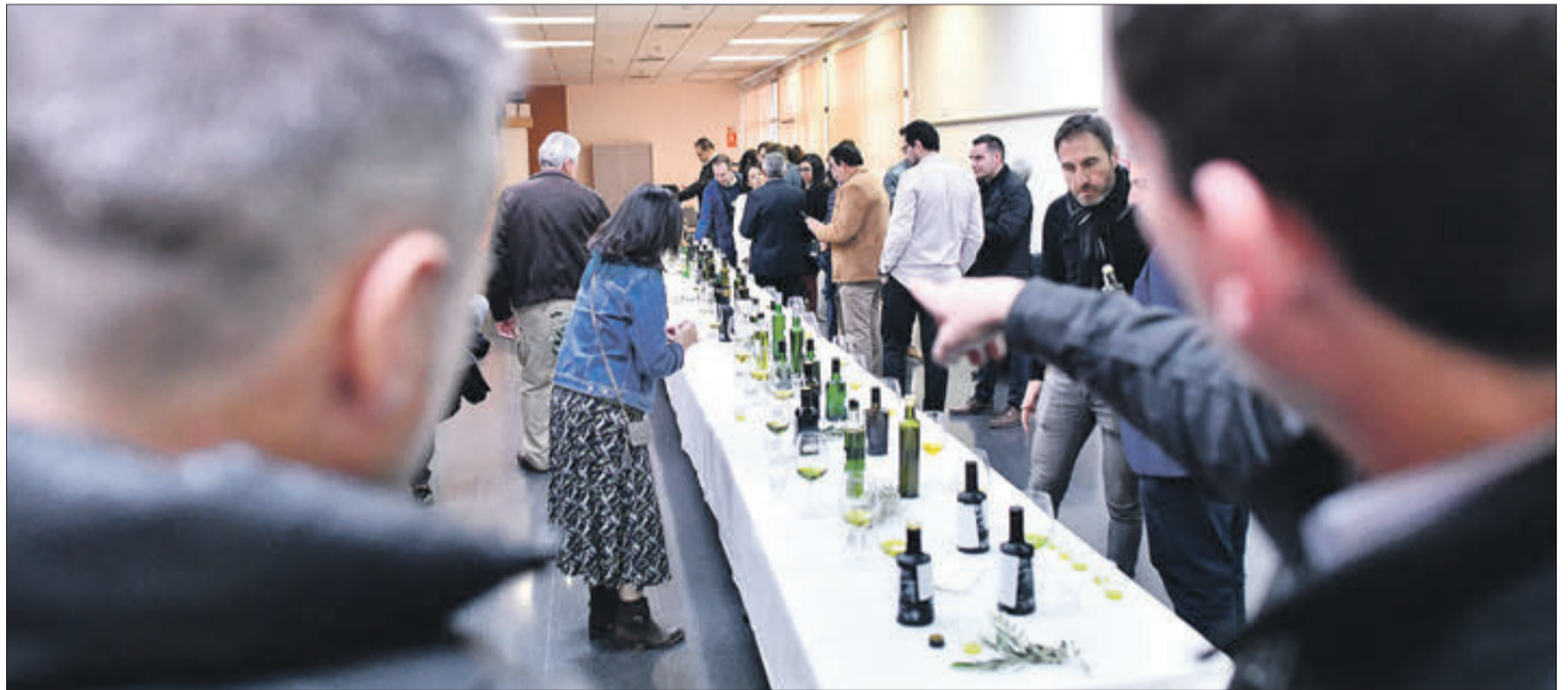
La cita premia al mejor aceite de oliva virgen extra.

Por su parte, la misma Cooperativa Agrícola Católica destacó que, más allá del concurso; habrá conferencias, catas o mesas redondas para acompañar un certamen que también otorgará galardones significativos "ofrecemos un premio de aceite ecológico, al mejor de la Comunidad Valenciana y también hemos incluido un reco-