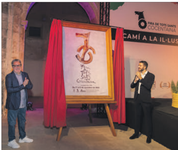
El cartel rinde homenaje al logotipo de la Fira.

Esta pieza era antaño habitual entre los tratantes, e incluso comerciantes, que acudían por Todos los Santos a la capital del Comtat a comercializar sus productos o vender animales para el campo