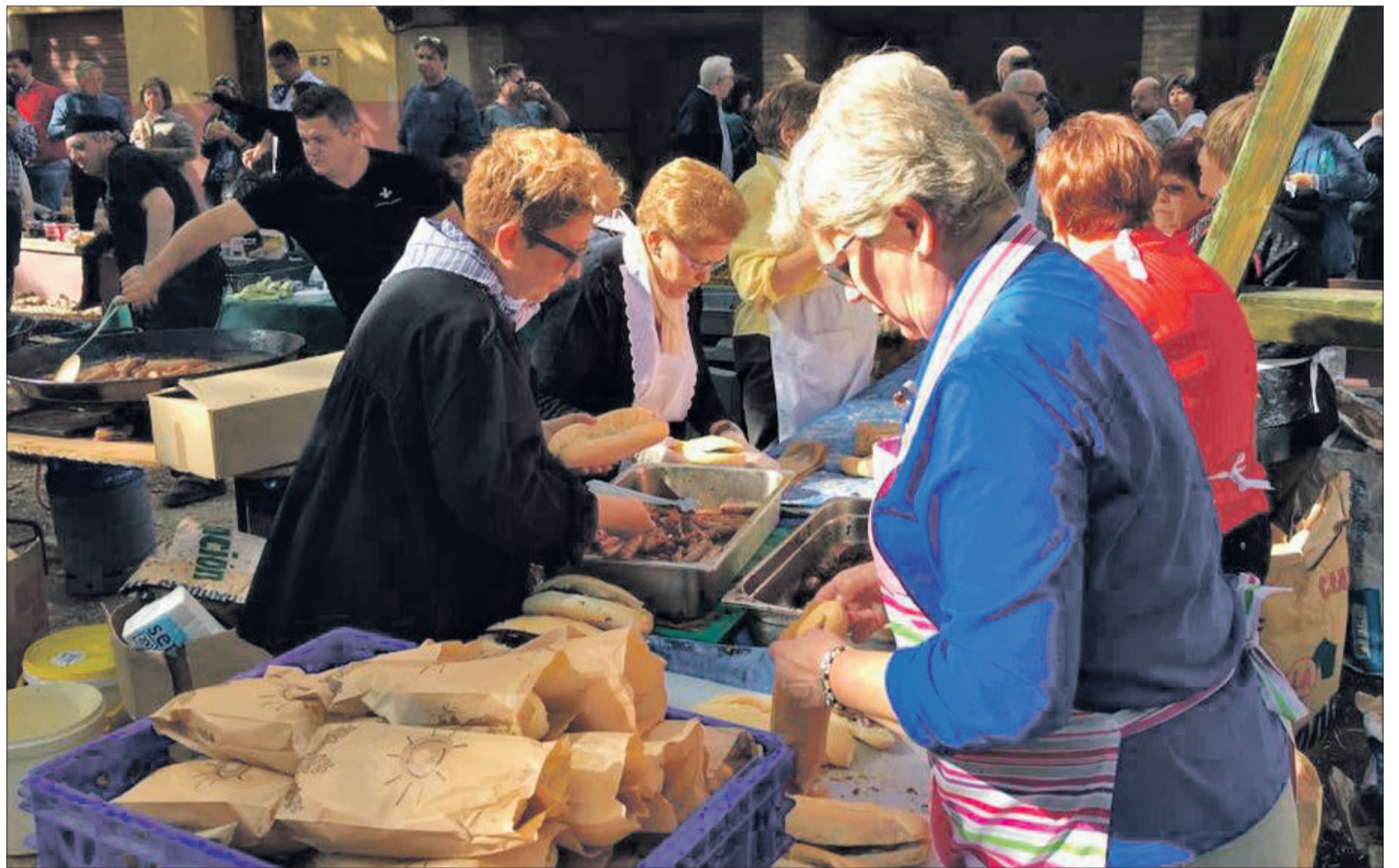
La Asociación de Amas de Casa, junto al Ayuntamiento, preparan cada año el típico almuerzo.

Este 'Esmorzar de Fira' cuenta cada año con la colaboración de la Asociación de Amas de Casa de la Villa Condal y en el mismo suelen servirse hasta más de tres mil bocadillos preparados con dos ingredientes fundamentales que no pueden faltar en el pack "los bocatas están elaborados con longanizas y morcillas de las carnicerías locales, y todo ello lo acompañamos con vino regado con gaseosa. Además, servimos las primeras 'olives