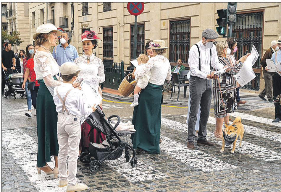
Distintos momentos del ambiente modernista que se registró durante el fin de semana en Alcoy.