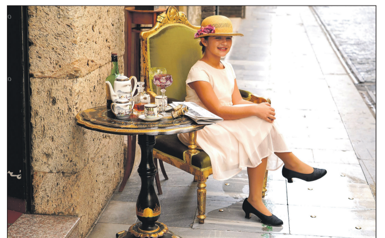
Una niña posa sentada a las puertas de un edificio de Sant Nicolau.