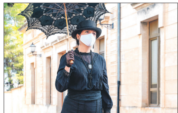
En la mañana del domingo hubo una visita tematizada 'La ruta de los animetes', en el cementerio.