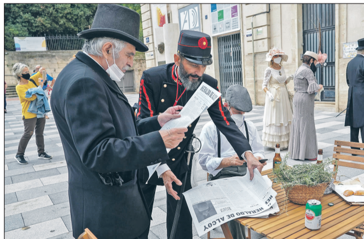
Se repartió la tercera edición del Heraldo de Alcoy, un periódico de la época. Y puesto de charlatán montado por la Asociación Cultural Samarita.