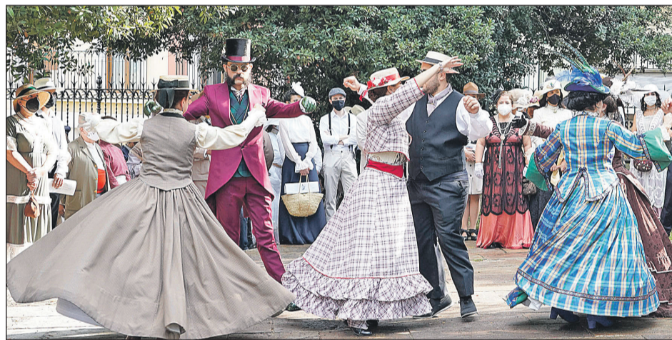
El Carrascal, en el acto inaugural.