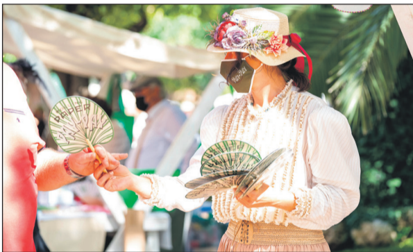
El centro de la ciudad se 'trasladó' al siglo pasado a través de la indumentaria y la ambientación de distintos espacios.