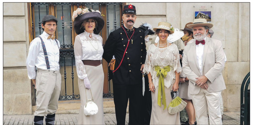
Algunos concejales ataviados para la ocasión, en la plaza de España.