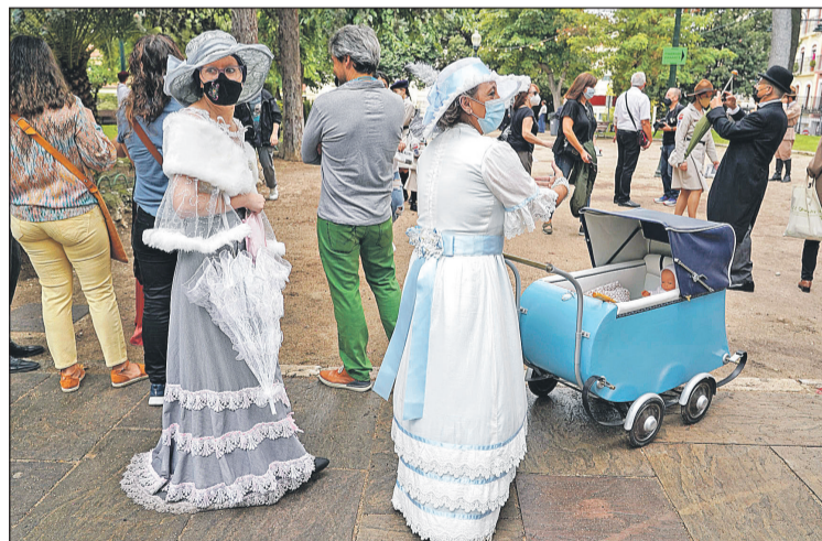
Participantes en la Semana Modernista.