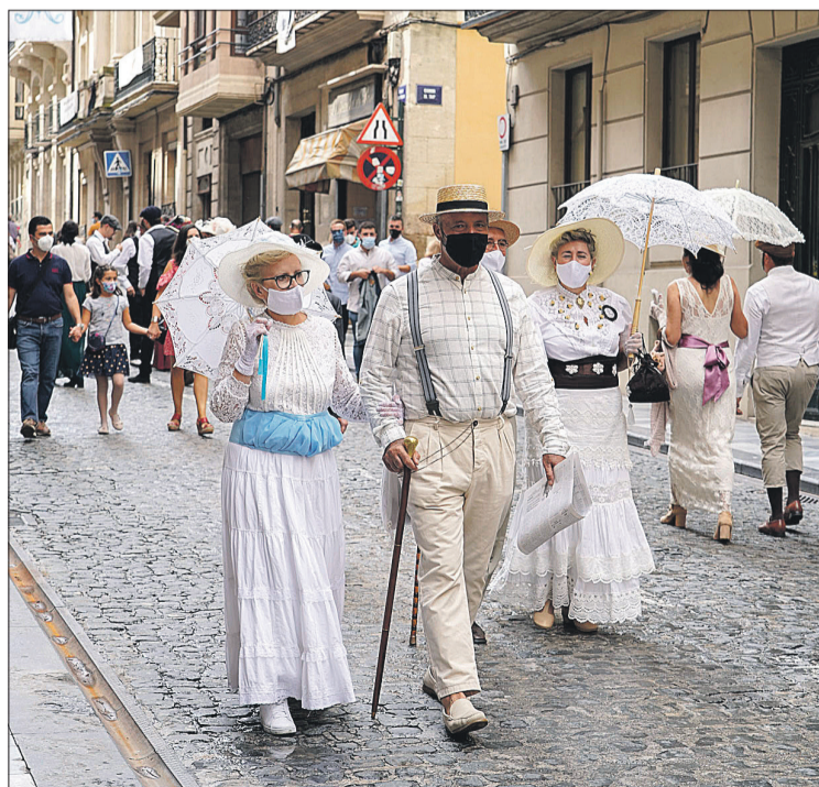
La calle Sant Nicolau, animada y concurrida.

El viernes no hubo pregón, pero sí un espectáculo de magia, la magia que ha rodeado en su argumentario este retorno del Modernismo. Fue el primero de los dos espectáculos que se desarrollaron en una plaza de España habilitada para la excepcional situación, con 650 sillas desde las que los asistentes —con la preceptiva distancia de seguridad— disfrutó de los actos. El aforo se completó en ambas ocasiones.