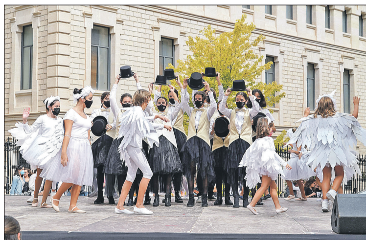
Bailes y canciones populares, en la plaza Ferrándiz y Carbonell.