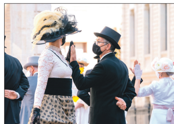
Bailes en el escenario de la EPSA.