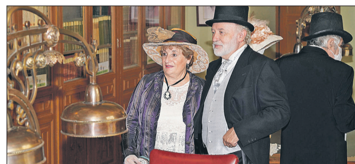
El modernista Círculo Industrial acogió numerosas visitas.