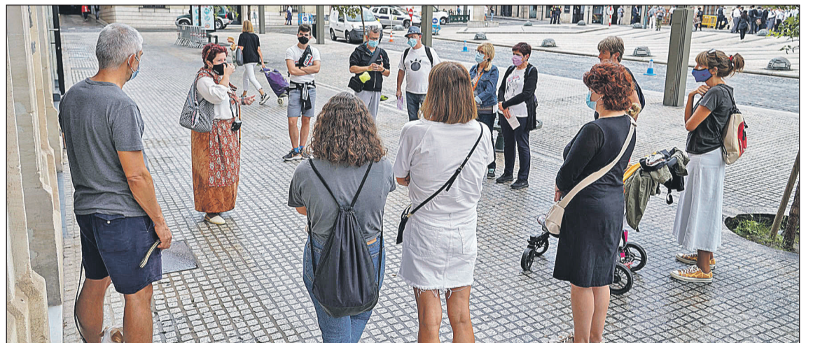
Se organizaron rutas turísticas por la ciudad.