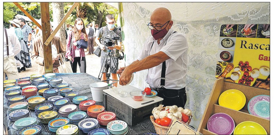
Uno de los puestos de artesanía instalado en la Glorieta.