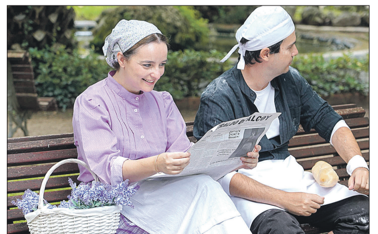
Pareja sentada en un banco.