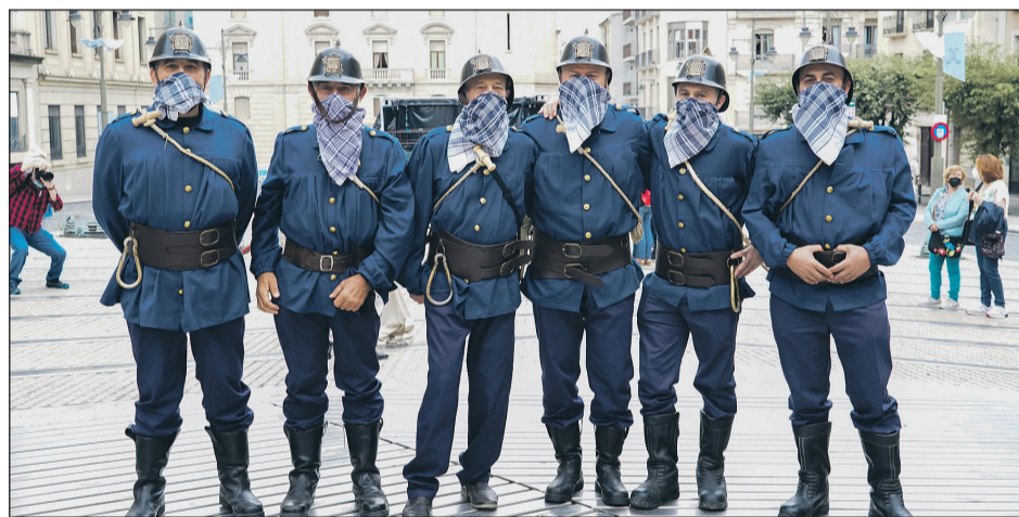
Los bomberos ofreciern una 'Salida de emergencia'