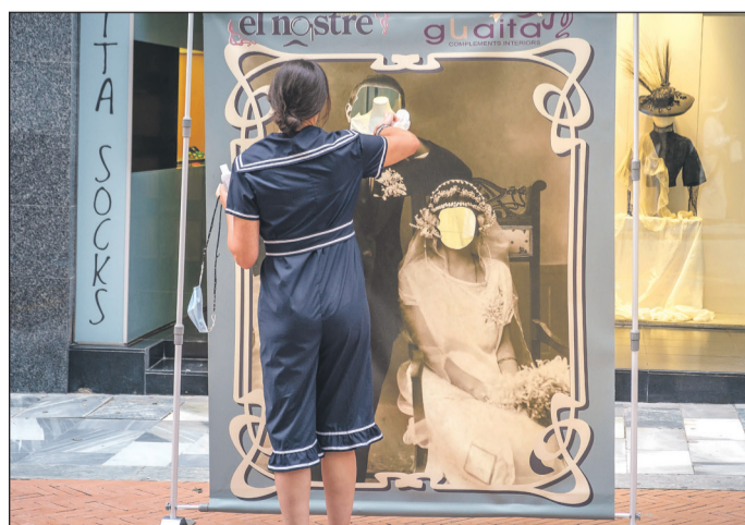
El comercio del Centro llevó a cabo distintas iniciativas en la calles y los escaparates