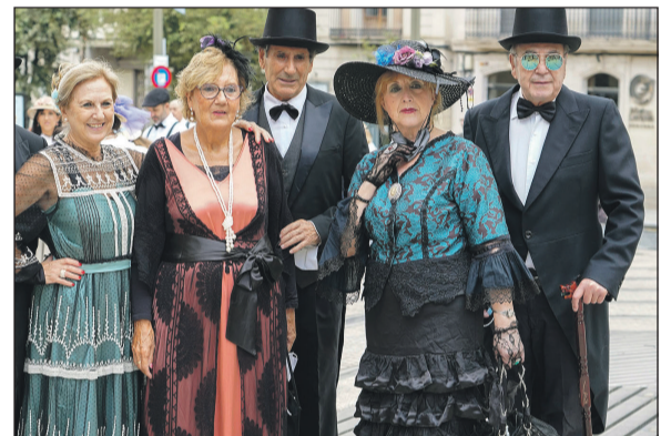
Grupo de participantes en la Feria Modernista luciendo sus atuendos en la calle.

Una póliza puede parecerse modernista, llena de líneas curvas y asimétricas.