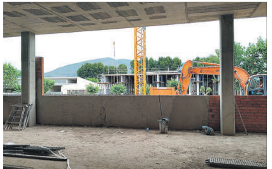
En aquest curs ha començat també a ser una realitat el nou Bracal.

També una notícia important en aquest curs que acaba és l'inici de les obres del nou col·legi Bracal, que marxen a molt bon ritme segons van confirmar des de Conselleria recentment. De fet, ja és perfectament visible l'estructura que albergarà les noves aules d'aquest necessari projecte valorat en 5'3 milions d'euros. D'aquesta manera, els terminis de l'actuació s'estan complint segons el que es preveu i si no hi ha cap imprevist més, després de tretze mesos d'obres El Bracal tornarà a ser el centre educatiu que mereixen els escolars murers.