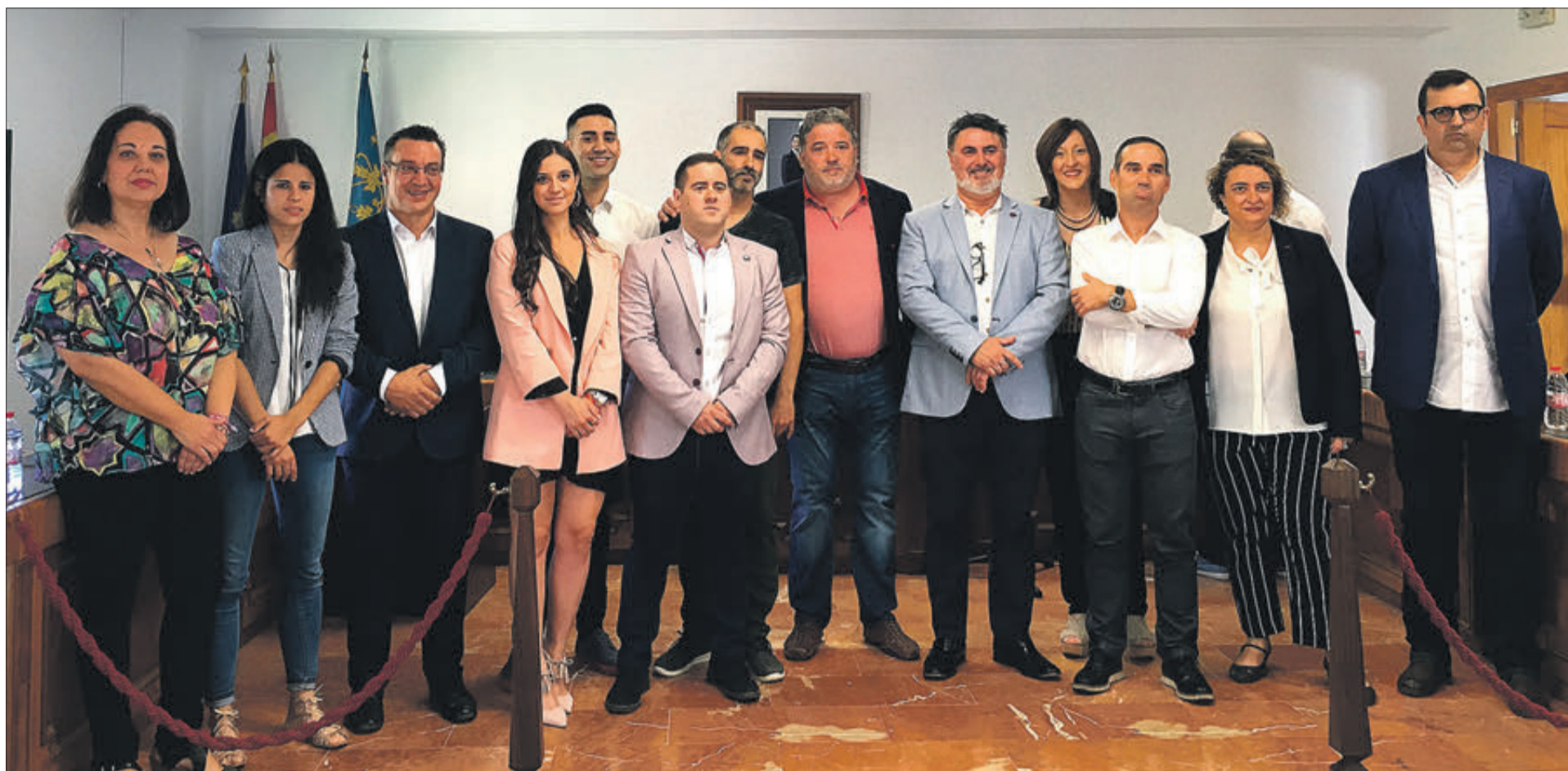
Integrants de l'actual corporació municipal de Muro.

ES COMPLEIX L'EQUADOR DE LA LEGISLATURA I LA VALORACIÓ PER PART DE L'EQUIP DE GOVERN ÉS MOLT POSITIVA