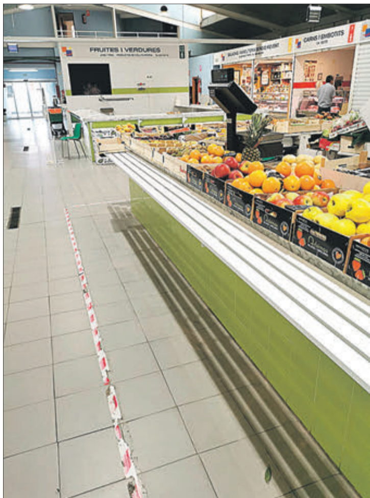
El projecte havia sigut proposat pels comerciants del mercat.

Indicar que la conselleia d'Economia Sostenible que dirigeix el murer Rafa Climent, destinarà 733.000 euros a 30 Ajuntaments de la Comunitat perquè duguen a terme la reforma dels seus mercats. Muro ha resultat beneficiari d'aquesta convocatòria i percebrà 8.519 euros, el 100% de l'ajuda, per a la remodelació total del mercat.