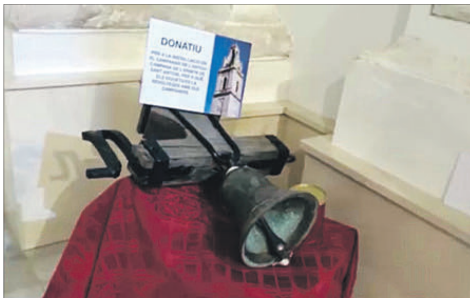
La campana de Sant Antoni ha sigut exposada dins de l'església.

La campana de Sant Antoni ha sigut exposada dins de l'església al costat d'una guardiola perquè tots aquells que ho desitgen facen un donatiu que anirà destinat a la consolidació de la citada peça. La intenció és que el bronze estiga col·locat en el campanar de Muro per a la pròxima Fireta de Sant Antoni, amb la finalitat de poder ser ja voltejat pels més xicotets en el dia de la festivitat del patró dels animals.