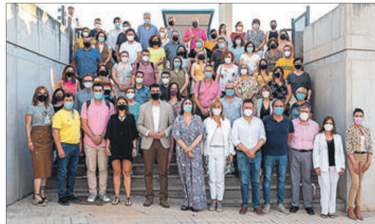
Foto de família dels assistents a l'assemblea el passat mes de juny.

Respecte als projectes aprovats per a 2021, el disseny d'aquests ha estat marcat per la situació pandèmica global provocada per la COVID-19 i en les seues conseqüències en matèria d'acció i prevenció. El Fons Valencià durant 2021 durà a terme un total d'11 projectes, dels quals 7 són de cooperació internacional al desenvolupament. Per altra banda, l'àrea d'Educació per al Desenvolupament del Fons realitzarà un total de 4 projectes de sensibilització a la Comunitat Valenciana, amb la col·laboració dels