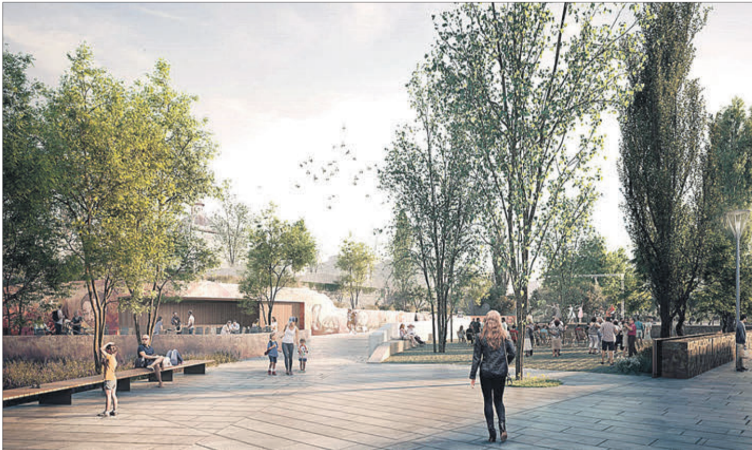
Recreació de la proposta, que atén qüestions importants com l'accessibilitat al recinte, la incorporació de vegetació i la sostenibilitat del nou espai.