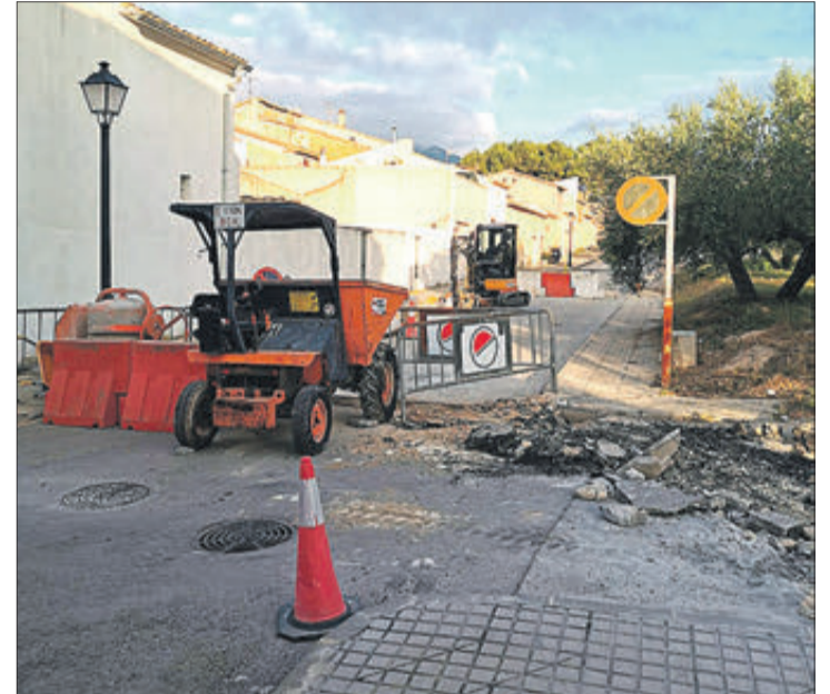
Les obres permetran frenar inundacions quan plou amb força.

El projecte ha sigut desenvolupat per l'empresa Aqlara S.A, amb un cost de 13.722,71 euros, IVA inclòs.