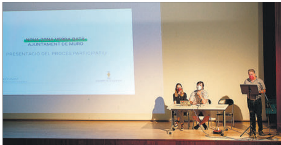
Un moment durant l'acte de presentació de la proposta eixida del procés participatiu.

Així mateix, s'han previst aspectes com la creació de banys públics, una cafeteria, un jardí sensorial, un escenari per a actuacions amb una zona d'òrbita que tindria cabuda per a unes 800 persones, una àrea de jocs intergeneracionals, la posada en valor de l'antiga séquia del Batà, i fins i tot mobiliari funcional que es desmuntaria en el cas