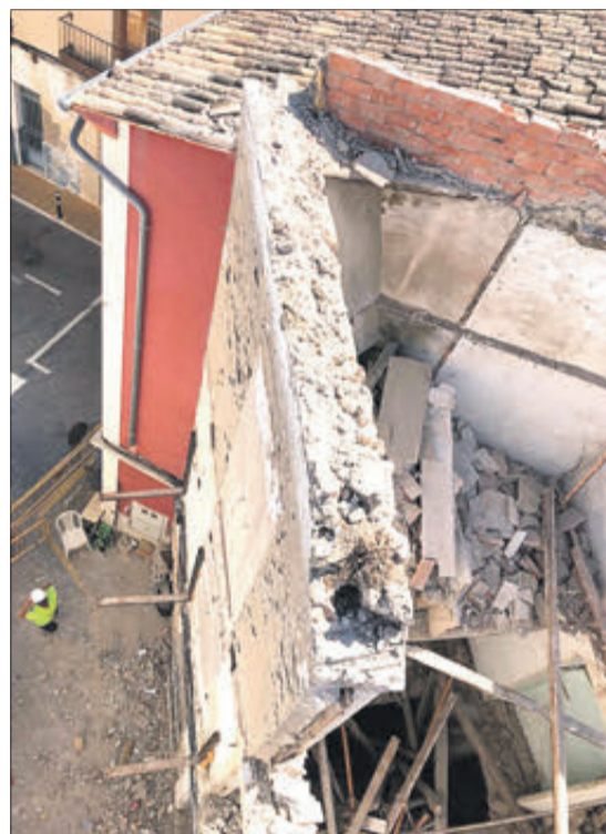
Imatges de les ruïnes del carrer Àngel que han estat objecte del projecte de demolició.

bens i espais protegits no sols siga un element que en el seu moment va ser pioner a Muro, sinó fer-ho complir. Per això tenim que explicar-ho molt bé, tant a tècnics