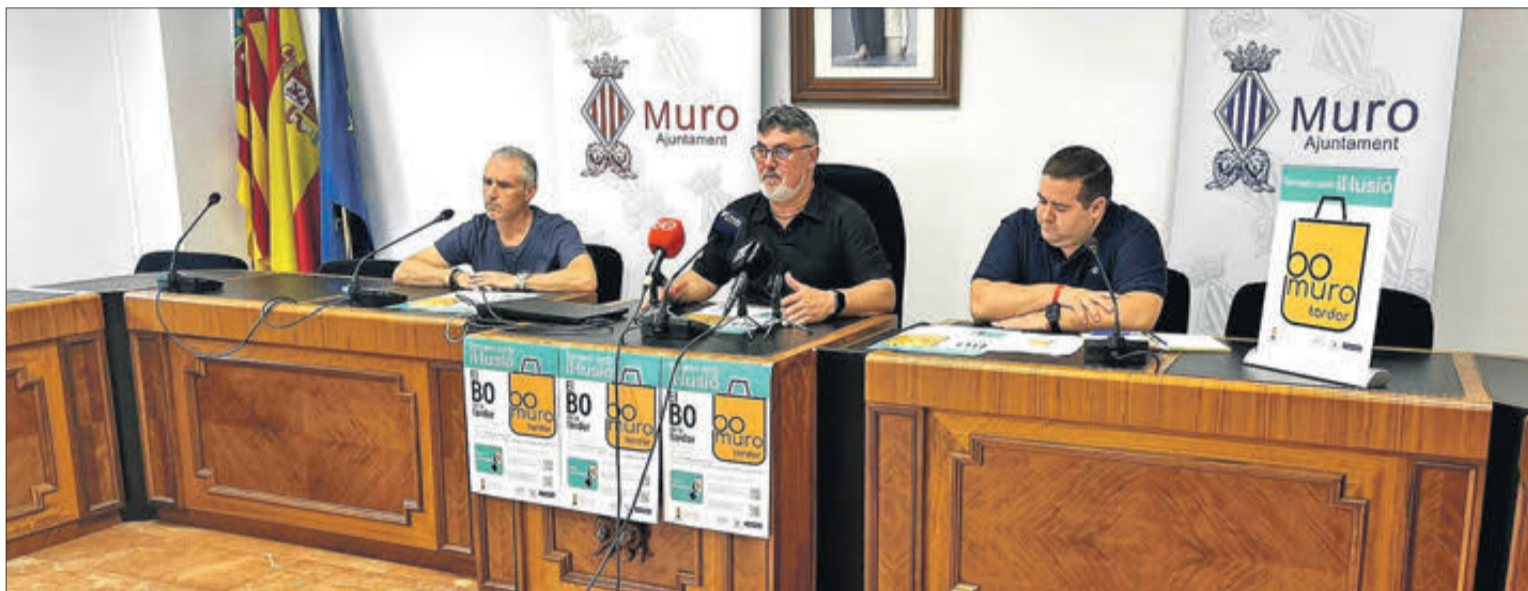
La campanya es va presentar a la fi de juliol a l'Ajuntament de Muro.

Cal destacar que, en la presentació de la campanya, a la fi de juliol, es va insistir des de l'Ajuntament que el bo consum de tardor perseguia fer efectiva una important injecció econòmica per al comerç local, en una època que està marcada per la tornada a la normalitat després de les vacances d'estiu i el retorn al col·le. "A més, comptem amb una ajuda de la Direcció de Comerç de la Generalitat Valenciana per import de 50.000 euros per a poder portar avant un projecte tan important", explicava