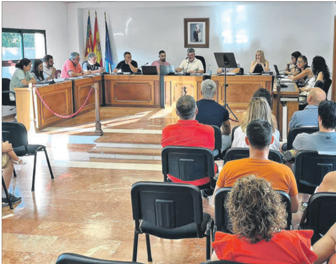
El ple es va celebrar en l'última setmana del mes de juliol.