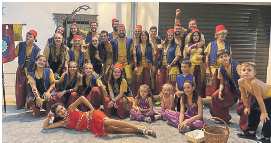
A Benàmer hi va haver campionat de cotos i entrada de moros i cristians, entre altres moltes activitats.