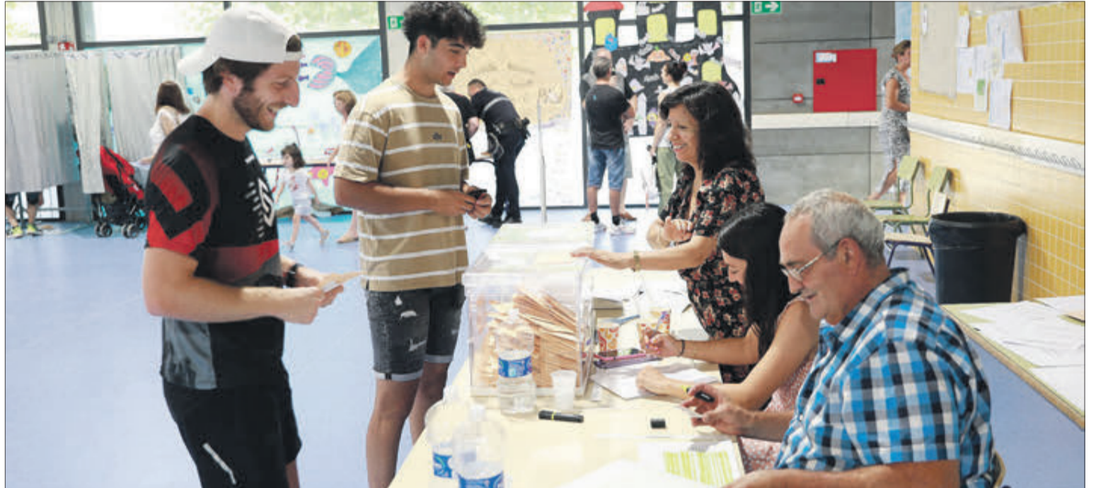
La participació va augmentar respecte a l'anterior cita electoral de fa quatre anys.

Per la seua part, Vox es va haver de conformar amb quedar en quart lloc, en tindre 612 sufragis, i la cinquena opció més votada en el municipi va ser el PACMA, amb 35 suports. Per darrere