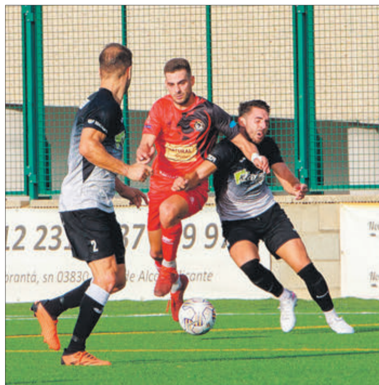
Jugada durant el partit davant de l'SB Ontinyent.