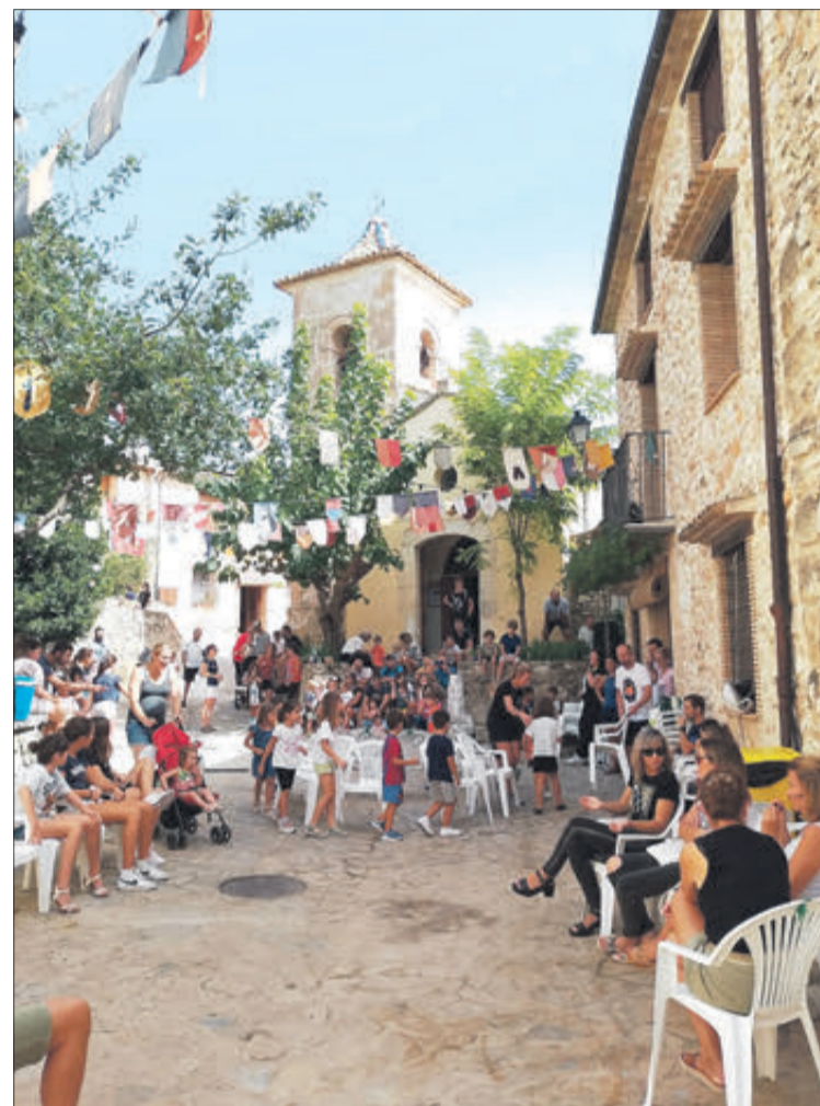
Dues imatges dels actes celebrats a Turballos el passat cap de setmana.