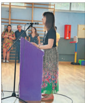
Intervenció de la directora.

A hores d'ara, el centre té formalitzades més de 1.250 matrícules distribuïdes entre 95 grups d'alumnat, i tot i que encara està oberta la matrícula en horari de secretaria, perquè encara hi ha places en alguns ensenyaments, hi ha molts tallers que estan complets i cal apuntar-se a la llista d'espera.