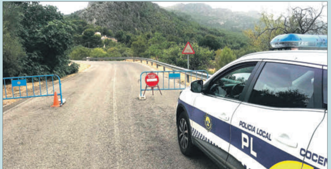
El 10 d'agost es va tancar l'accés als parcs naturals de la comarca com a mesura de prevenció front a la calor.

D'altra banda, els últims dies de l'estiu han estat marcats per la pluja i les tempestes amb forts ruixats que van deixar importants registres a Muro. Al tancament d'aquesta edició, les estacions de l'IES Serra Mariola o la Font del Baladre tenen recollits fins a uns 500 litres al 2023.