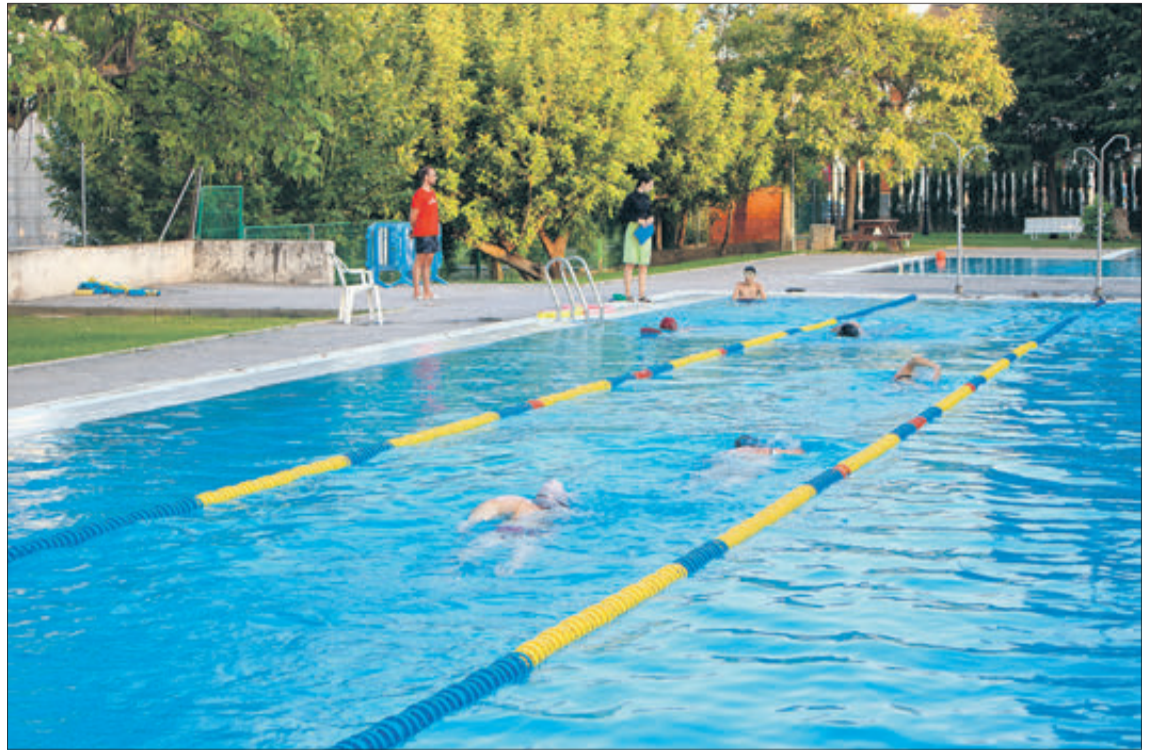
Al principi de l'estiu la instal·lació va acollir els curssets de natació.

No obstant això, el govern local reitera que ha sigut una temporada que ha transcorregut amb destacada normalitat i en la qual apenes s'han produït incidents ressenyables més enllà que alguns usuaris no han tingut en compte les indicacions del personal. Així ho va assegurar el regidor d'Esports en declaracions a Radio