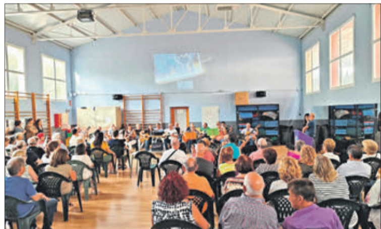
Acte d'inauguració del nou curs.