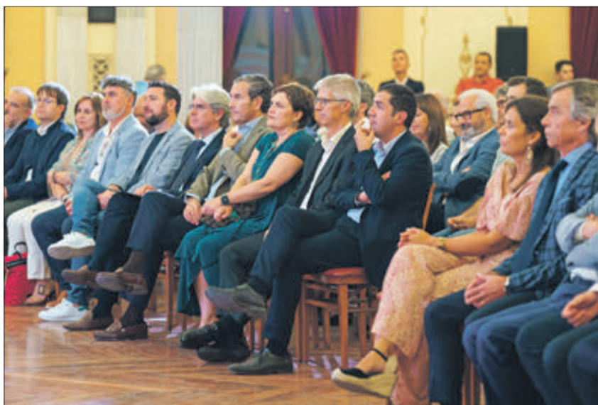
El Círculo Industrial d'Alcoi es va omplir de gom a gom per a la gala.