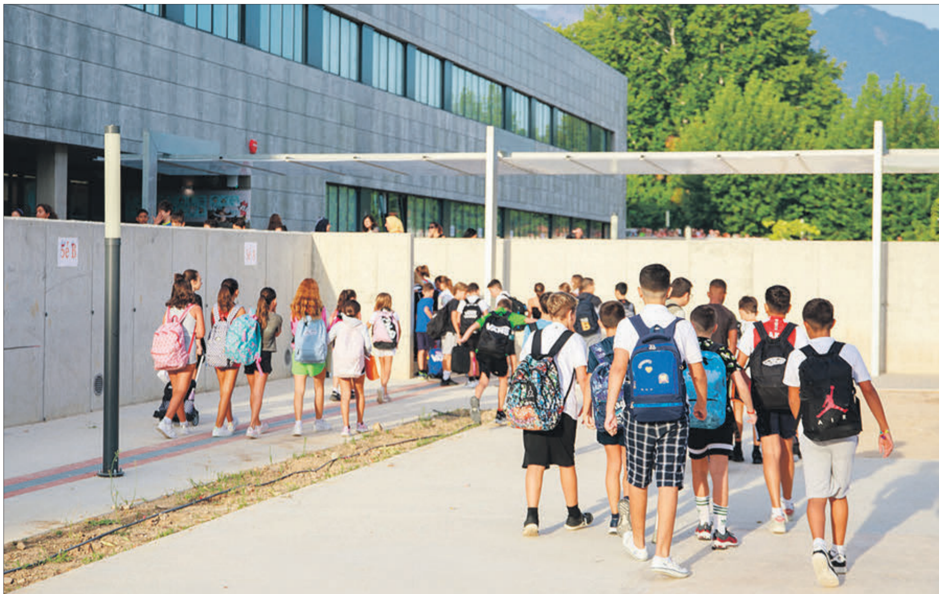
Diferents imatges de l'inici del nou curs per als alumnes d'Infantil i Primària als centres públics del municipi.

NORMALITAT EN L'INICI DEL CURS EN ELS DOS COL·LEGIS I L'INSTITUT