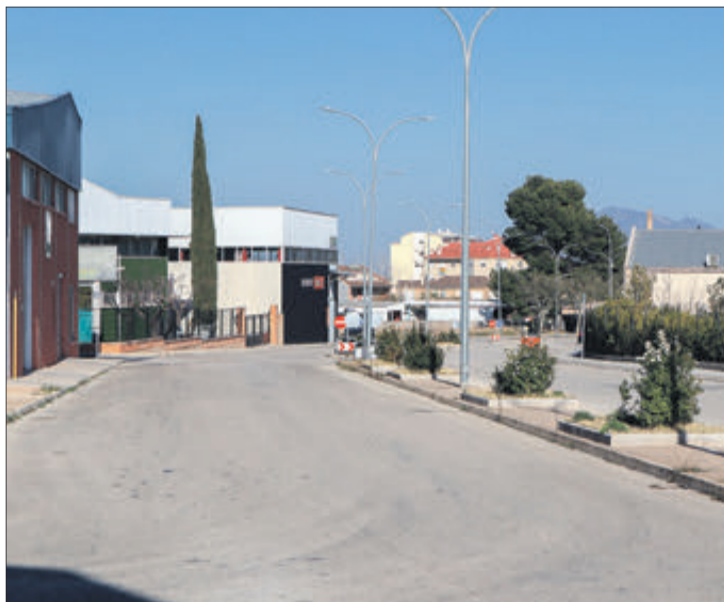
Polígon El Pi de Muro.

El polígon mancomunat, del qual tant de temps es porta parlant, és hui dia