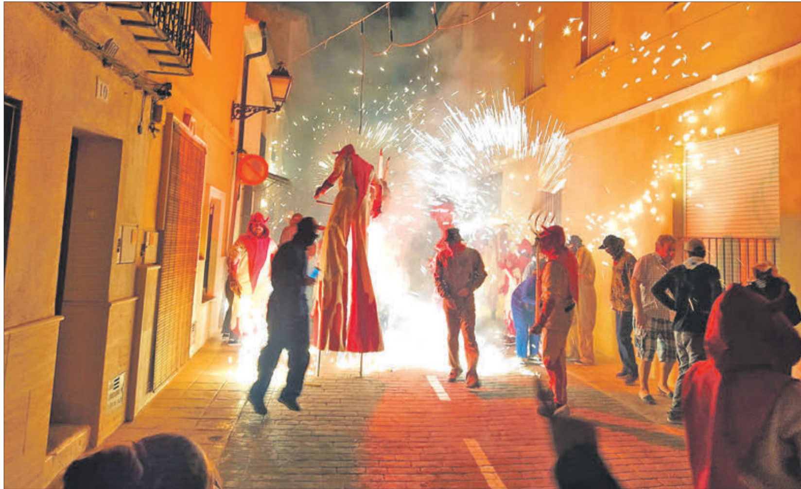
El correfoc a càrrec dels Dimonis Rafolins va ser una de les atraccions de les festes de Setla de Nunyes.

Pel que fa a Turballos, enguany les festes s'han celebrat el cap de setmana del 16 i 17 de setembre. Dissabte a mig dia, la programació es va iniciar amb un di-