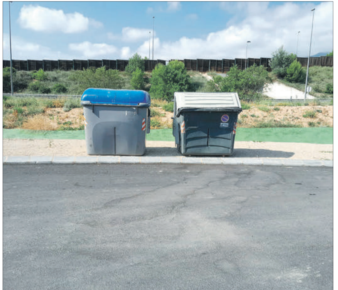
Durant l'estiu s'ha netejat a fons l'entorn dels contenidors.

"Ens agradaria fer també unes jornades de conscienciació, quan apliquem aquest nou sistema de recollida del fem, perquè la gent estiga ben informada i tinga clar tot el procés. El primordial és que els nostres carrers estiguen nets i això també és tasca de