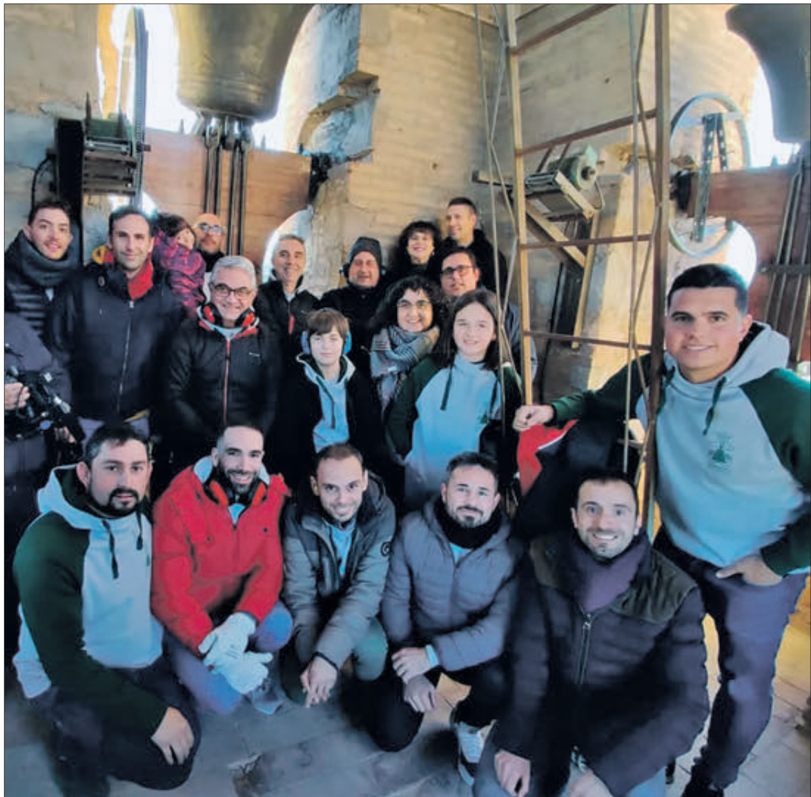
Bona part dels integrants de la Colla en les activitats del passat cap de setmana.

Cal destacar que les activitats organitzades per la Colla de Campaners del Comtat no van quedar ací i en la vesprada del dissabte la Colla va donar opció a que molts visitants veren els repics previs a la missa de la vesprada o els voltejos que van efectuar. Finalment, el diumenge van seguir els tocs manuals tant al matí, abans de la missa de Sant Antoni, com a la vesprada per a anunciar l'inici de la romeria que va acompanyar a la imatge del sant fins a la seua ermita. En total, segons la informació facilitada, van ser més de 100 persones les que van conèixer els secrets d'un llenguatge universal que des de finals de 2022 està declarat com a Patrimoni Immaterial de la Humanitat per part de la UNESCO.