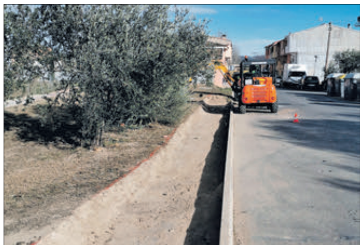
Treballs de manteniment de carrers.

Recordar que les Jornades tornen a tindre com a plat fort la clàssica Volta a les Pedanies, que partirà des de la Casa de Ferro a les 8'45 hores del diumenge 5 de març, una proposta per a la qual només necessitem portar el bocata ja que la beguda se servirà en arribar a Turballos, a càrrec de l'organització.