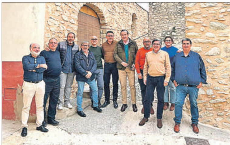
Alcaldes i portaveus del PP a les comarques de l'Alcoià i el Comtat.

Assenyalar que al gener, el conjunt de la comarca va experimentar un lleu augment de la desocupació (22 aturats més), la qual cosa situa la xifra total en 10.298. Unes dades que reflecteixen un estancament en l'evolució de la creació d'ocupació a l'Alcoià i el Comtat, segons el sindicat UGT.