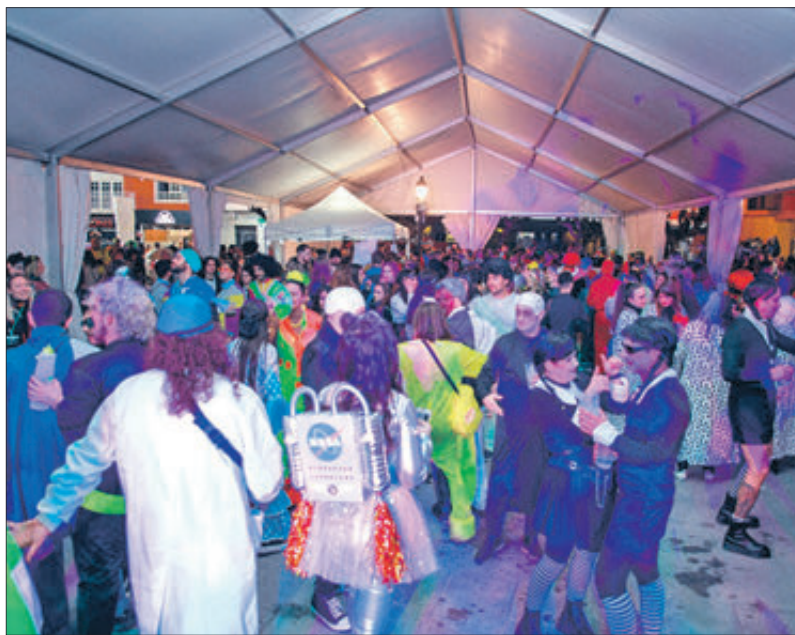
Zona de discomòbil en la plaça del Matzem.

La comitiva la van obrir un simpàtic grup de mexicans, portant unes grans màscares a manera d'estandards, i després d'ells es va poder veure una gran exhibició de disfresses en la qual la Família Adams, amb el seu personatge de Dimecres, va tindre un paper més que destacat en ser una de les caracteritzacions més presents en el Carnestoltes d'aquest 2023. No van faltar els mims, animals de tota