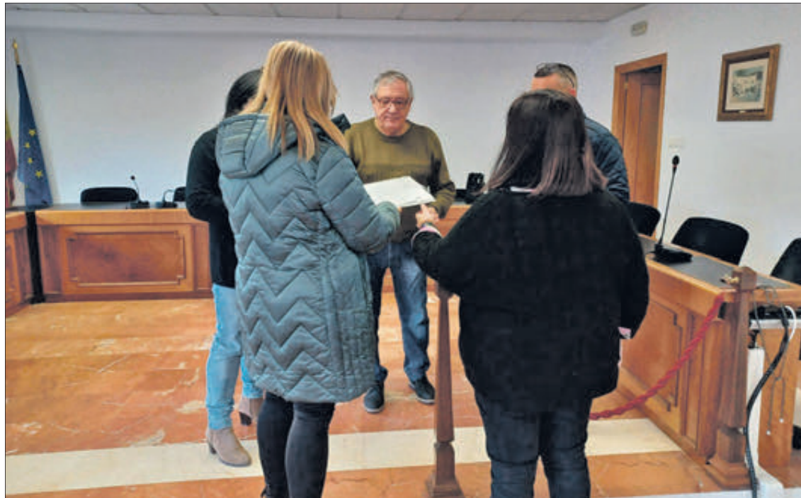
Moment en el qual s'efectuava l'elecció del cartell.

Està previst que el citat cartell es descobreisca en la vesprada del dissabte 1 d'abril, en el transcurs de l'acte de presentació dels càrrecs i de la revista de festes que es realitzarà en el Centre Cultural. "Una vegada passen els Carnestoltes, i fins que no concloga la Pujà, ja no parem quant a actes es refereix, perquè tots els caps de setmana tenim activitats prèvies excepte el que coincideix