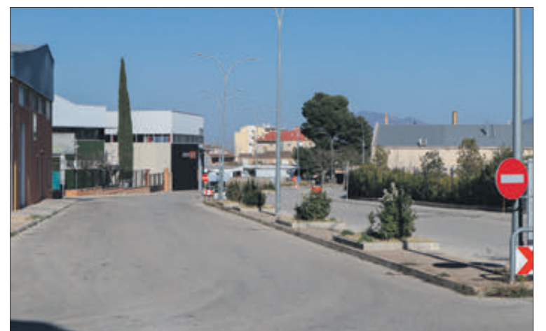
Imatge del polígon industrial El Pi.

L'alcalde va explicar durant la sessió plenària que aquesta zona industrial no té actualment separativa de les citades aigües pluvials i que això es tradueix en acumulacions d'aigua en el nucli urbà quan plou amb intensitat. Gabriel Tomás va insistir que urgeix buscar solució a una problemàtica que ja es va tractar l'any 2017. "Aquella obra va ser un desastre i això implica que ara s'haja de fer de nou, encara que haurem de fer-ho per fases perquè la subvenció que ens arribarà només ens permet cobrir 200.000 euros, aportant-se la quantitat restant d'arques municipals a través del romanent del mateix Ajuntament. En pròximes convocatòries continuarem presentant aquest projecte fins que estiga finalitzat per complet amb la finalitat d'aïllar definitivament al poble de possibles