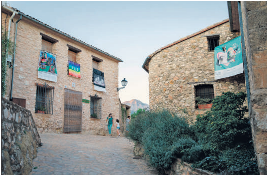
La present edició inclourà la clàssica Volta a les Pedanies, que arribarà a Turballos el diumenge 5 de març.

D'altra banda, el carrer Papa Joan XXIII acollirà una exposició de gran format sobre l'entorn de la Serra de Mariola, promoguda des de l'Associació Fotogràfica de Bocarent, una