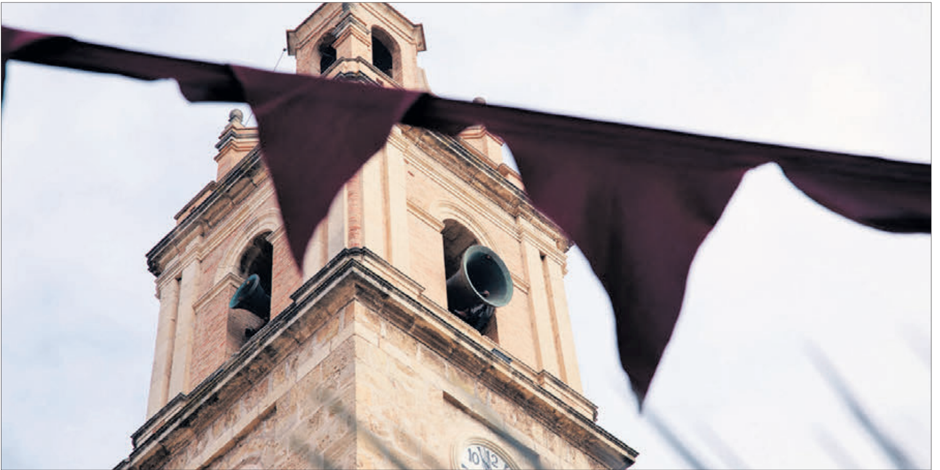
Fotografia del campanar de la parròquia de Sant Joan Baptista durant la Fireta de Sant Antoni.

MÉS DE 100 PERSONES VAN PASSAR PER L'EMBLEMÀTICA TORRE EN LA JORNADA DEL DISSABTE