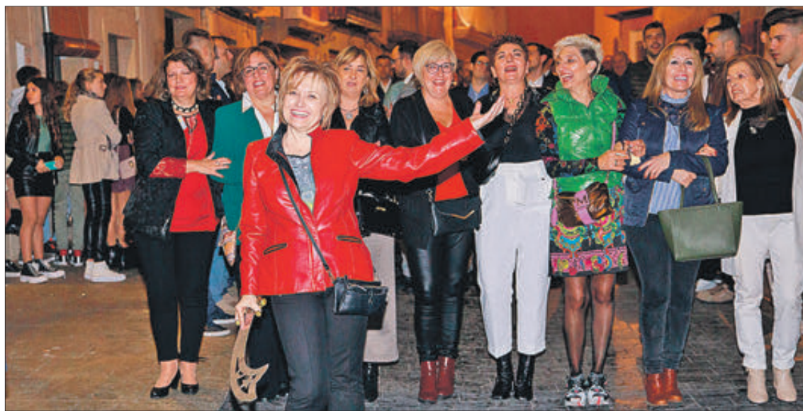
Un moment de la desfilada de l'any passat, pels carrers del barri antic.

Ja a la vesprada serà el torn de la música festera, amb el clàssic concert del Mig Any que protagonitzen sempre per aquesta època de l'any la Unió Musical de Muro i l'agrupació de música tradicional La Xafigà. La cita començarà a les set de la vesprada i tindrà lloc, com és habitual, en el Centre Cultural.