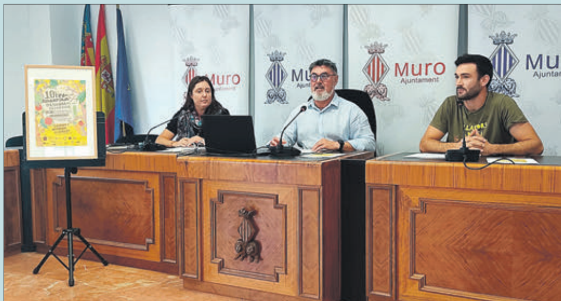
La cita tindrà lloc els dies 27, 28 i 29 d'octubre amb un ampli programa d'actes.

Per la seua part, l'associació Llavors d'Ací, com a organitzadora de la Fira, va remarcar la importància de defensar les nostres llavors i de tota la cultura associada a elles. "Volem conscienciar a la gent del perquè de la defensa de les nostres llavors, encoratjar als més joves i retornar l'esperança a la gent gran