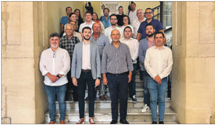
Muro va assistir a la constitució de l'ens per a la nova legislatura.