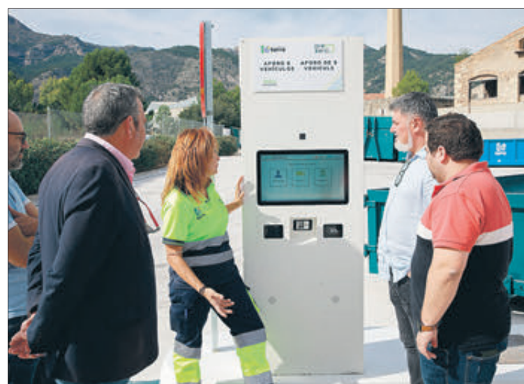
Representants del Consorci Terra i autoritats municipals durant la inauguració de les noves instal·lacions.