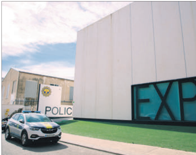
Dues fotografies dels exteriors i l'interior de les modernes dependències, que ja estan en funcionament.

La nova seu policial es va estrenar dies arrere, coincidint pràcticament amb la festivitat del 9 d'Octubre, i el propi alcalde de Muro, Vicent Molina, ha convidat "a la ciutadania a que acudisca i pugui gaudir de les garanties i comoditats de les noves dependències, així com dels serveis prestats". Recordar que entre aquests serveis figuren la intervenció en conflictes privats, incidències i regulació del trànsit urbà, temes relacionats amb els animals de companyia (documentació, infraccions i problemes de convivència); violència domèstica i de gènere, molèsties veïnals, tot el que afecta a menors quant assetjament (bu-