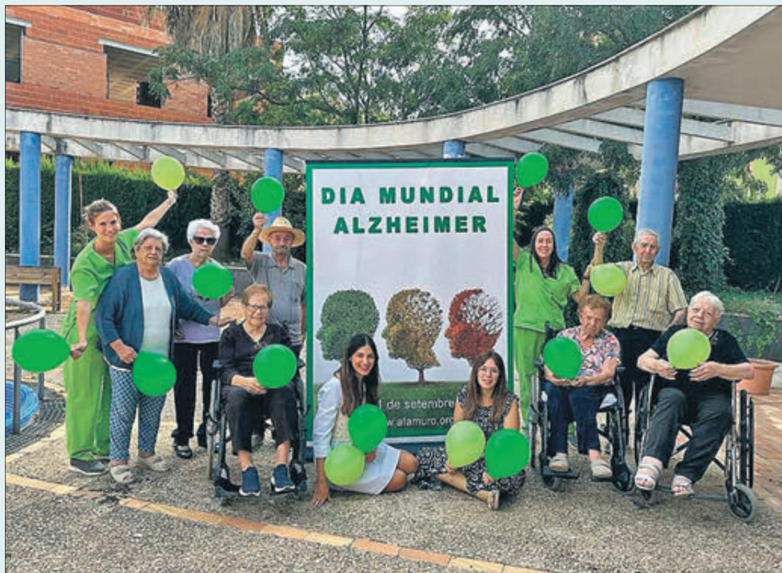
La lectura del manifest i una globutada van marcar el 21 de setembre.

Una globutada, amb el color verd com a protagonista, va posar fi a una jornada que també va incloure un esmorzar amb els usuaris tant del Centre de Dia com de la mateixa Casa Nicolau. Els actes van finalitzar el divendres 22 de setembre amb la instal·lació de taules informatives davant el Mercat Municipal de Muro, però també en la plaça de l'Església de Beniarrés. Allí es va informar sobre la malaltia i es van explicar tots els serveis que es presten des d'AFA, tant per a persones amb Alzheimer com els propis familiars.