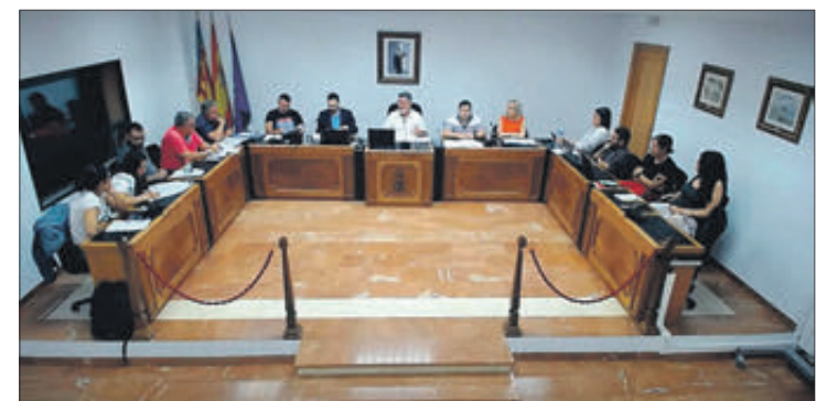
El Ple va tindre lloc el passat 5 d'octubre.

En aquest sentit, cal destacar que amb la quantitat esmentada es definirà el Pla Estratègic de Regeneració Urbana, igual que es materialitzaran iniciatives