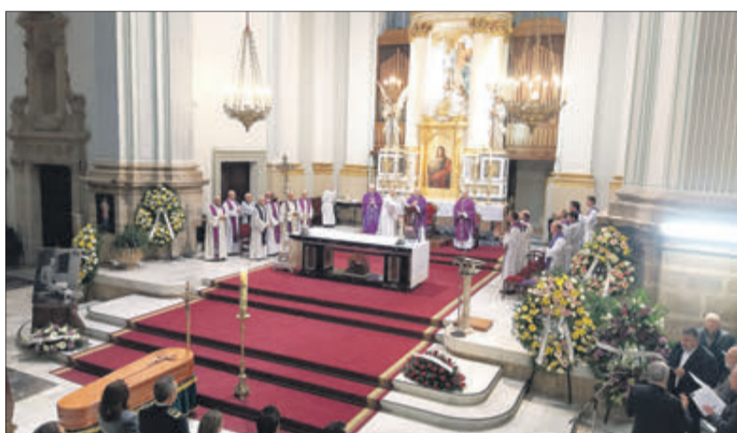
Vista general de l'església.