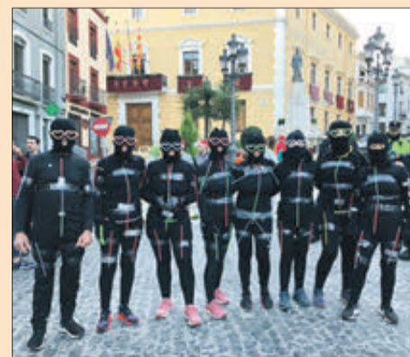
Diferents imatges de la prova que va partir des de la plaça de l'Ajuntament.