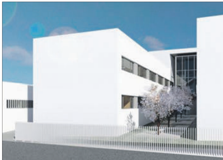
Part traser del nou centre de salut.

de salut disposarà d'una àrea de recepció i treball social; sis consultes de medicina de família, altres tantes d'infermeria; dues consultes de pediatria i una d'infermeria pediàtrica; àrea d'ex-