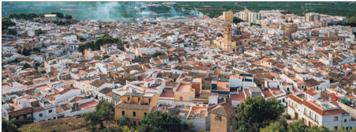
La localitat d'Oliva.

a Sardenya (Monteacuto, Anglona, Marghine, Ósilo i Coghinas) va continuar després que en 1720 el Regne de Sardenya passara a la sobirania del Piemont, amb seu a Torí. De Borja van passar als ducs de Benavente i als ducs d'Osuna, fins a l'abolició del règim feudal a Sardenya en 1836. En Ozieri (denominada "Otieri" en llen-