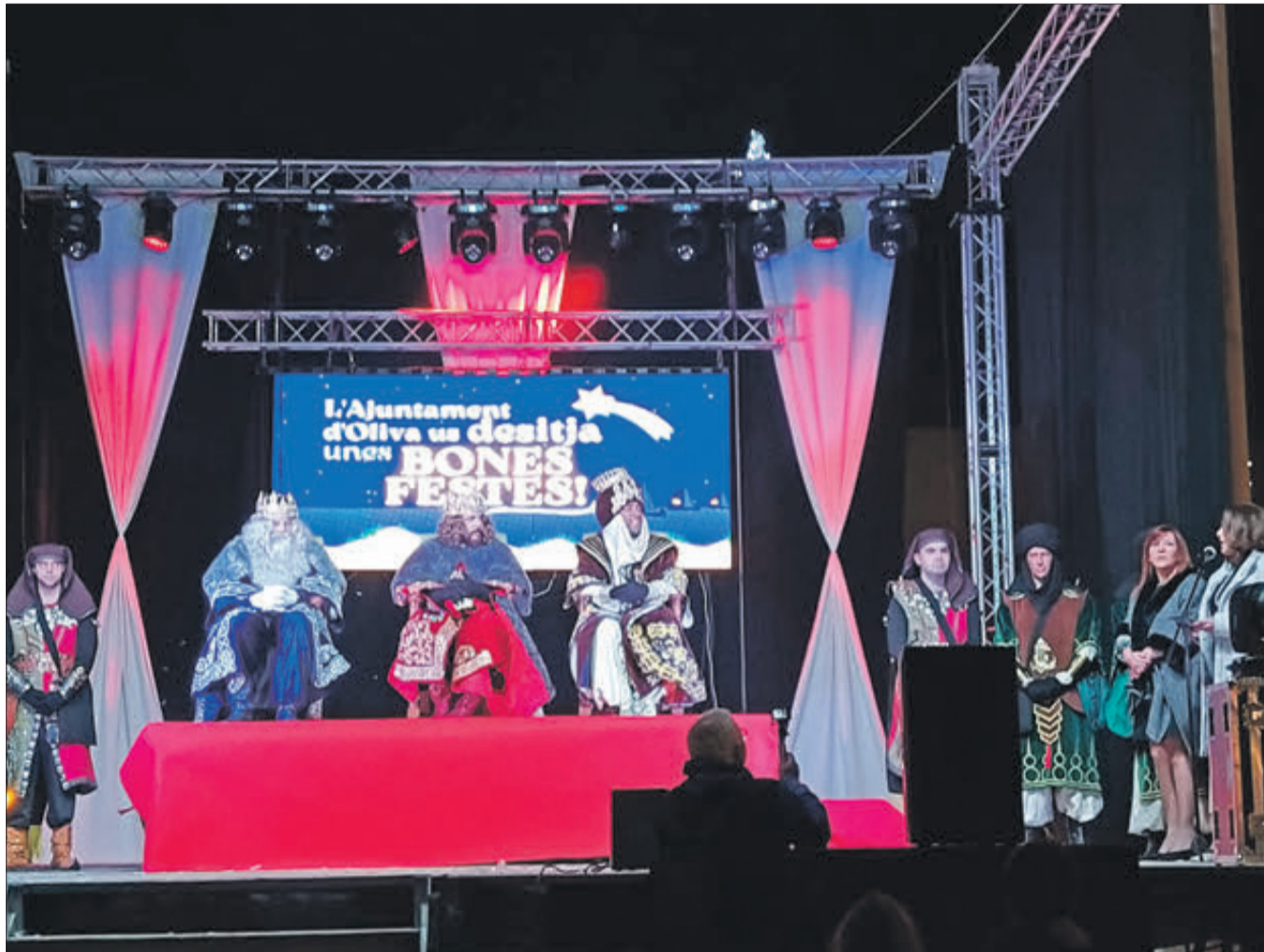
Els tres Reis al final Cavalcada.