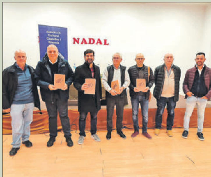
Responsables de la publicació autoritats, en la presentació.

Per la seua part el tercer treball de la publicació es denomina "Tres