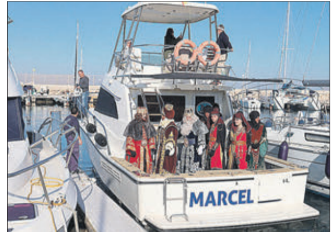
Van arribar per mar.

LA GENT S'HA BOLCAT EN TOTS ELS ACTES ORGANITZATS