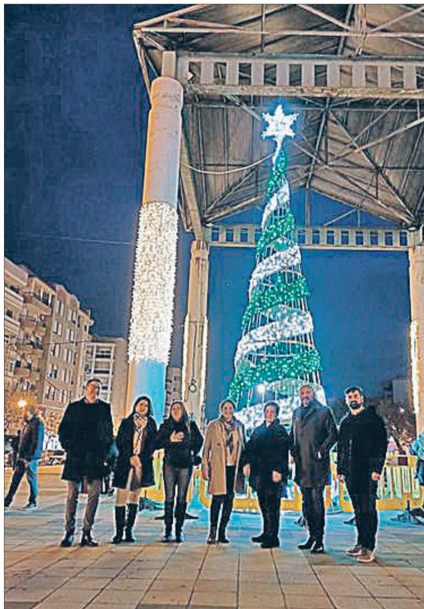
Encesa de llums i arbre nadal al Parc de l'Estació.