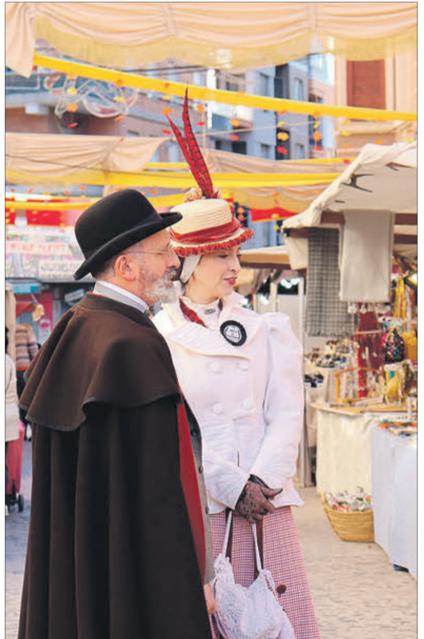
El Porrat de Sant Antoni d'Oliva també ha comptat amb la Fira Modernista.