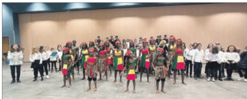
Concert 'Voces por Benin'.