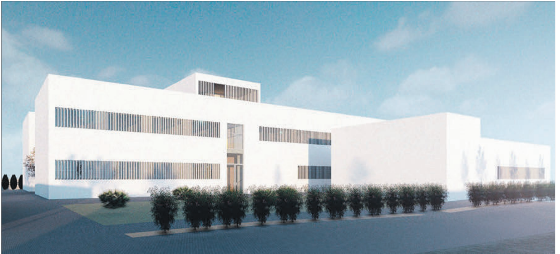
Vista General nou Centre Salut Sant Francesc.

EL TERMINI D'EXECUCIÓ ÉS DE 15 MESOS I LA NOVA INFRAESTRUCTURA SUBSTITUIRÀ L'ACTUAL CONSULTORI AUXILIAR