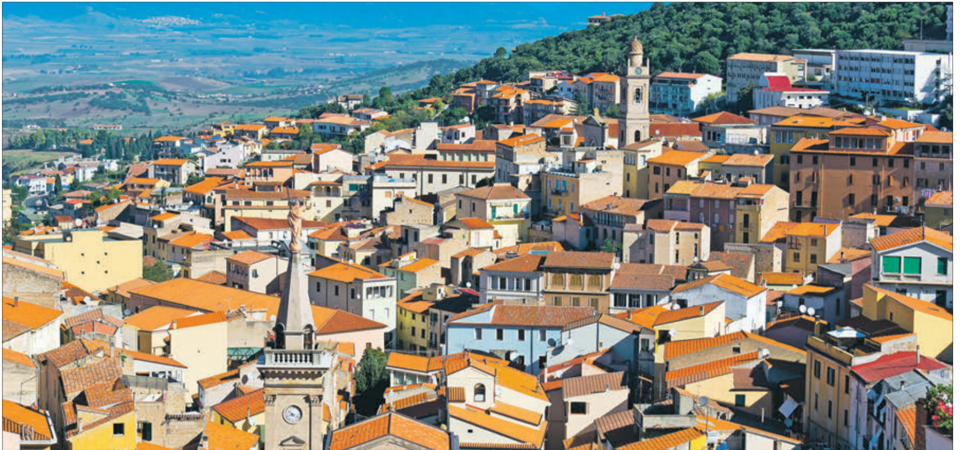
Vista panoràmica de la ciutat d'Ocier.

L'ASSOCIACIÓ CULTURAL CENTELLES-RIUSECH HA CONSTITUÏT UN COMITÉ D'AGERMANAMENT AMB LA CIUTAT D'OCIER