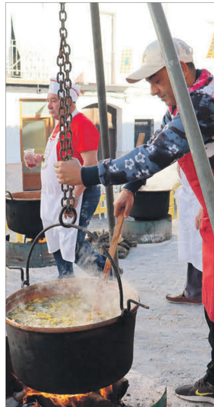
Moment de la preparació de les calderes.

S'HA POGUT GAUDIR DE LA FIRA MODERNISTA, DE TALLERS, ATRACCIONS, VISITES GUIADES I ACTUACIONS DIVERSES