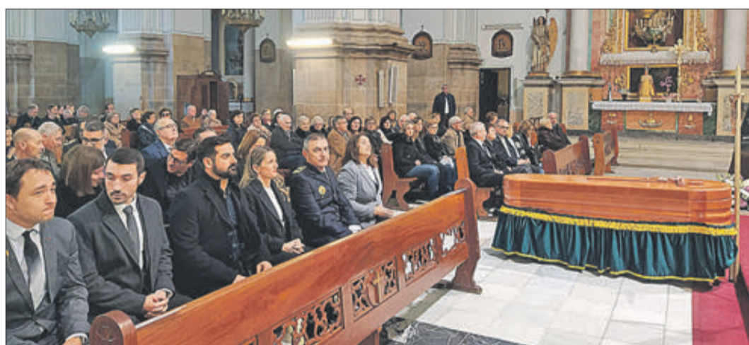
Assistents al sepeli.

MÉS DE MIL PERSONES VAN PASSAR PER LA TROBADA QUE ES VA DESENVOLUPAR EN EL CENTRE POLIVALENT