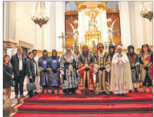
Melchior, Gaspar i Baltasar van visitar les parròquies.