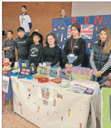
Un dels estands de la Fira.

En aquest projecte l'alumnat de 1r d'ESO del centre ha comptat amb la col·laboració de l'alumnat dels Cicles Formatius de Grau Superior de Gestió d'Al·lotjaments Turístics i del Cicle Formatiu de Grau Mitjà de Jardineria i