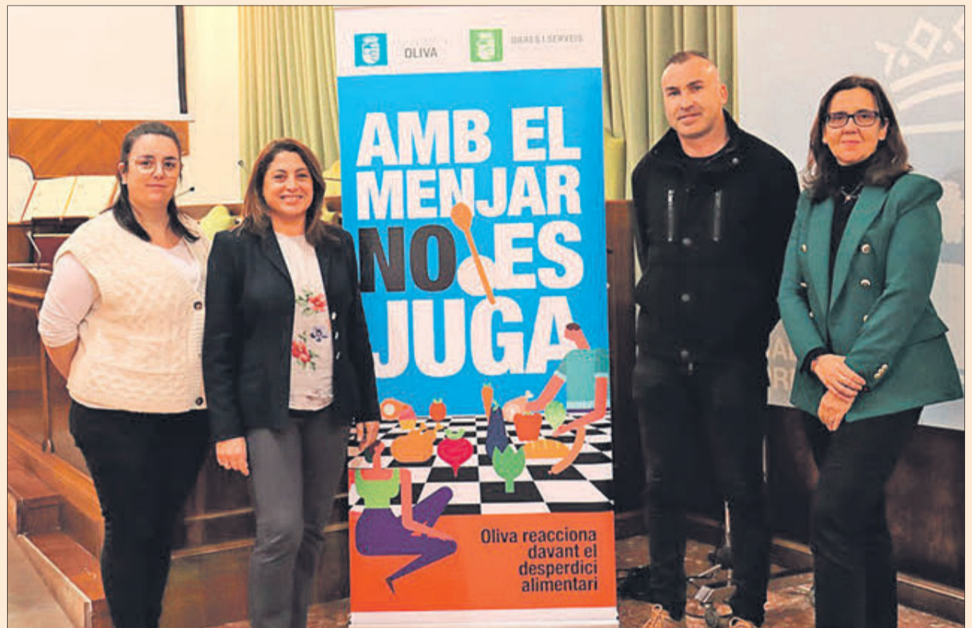
Presentació de la campanya a l'Ajuntament d'Oliva.

El Pla Local de Residus d'Oliva advoca per un consum responsable, prevenció i reutilització. Prevenció en la generació, promoure l'economia circular, participar en el desenvolupament d'accions sostenibles que contribuïsquen a la consecució dels objectius del desenvolupament sostenible, disminuir les pèrdues i el desaprofitament d'aliments en tots els sectors de la cadena agroalimentària. Però també per sensibilitzar i informar i fomentar la redistribució d'aliments. L'estratègia local contra el desaprofitament alimentari inclou una primera fase de reunions de treball amb els diferents agents de la cadena alimentària per a recopilar les actuacions que ja es realitzen relacionades amb la prevenció del desaprofitament alimentari, la segona de presentació dels eixos estratègics i línies de treball així com la tercera de presentació de l'estratègia per a la prevenció contra el desaprofitament alimentari.