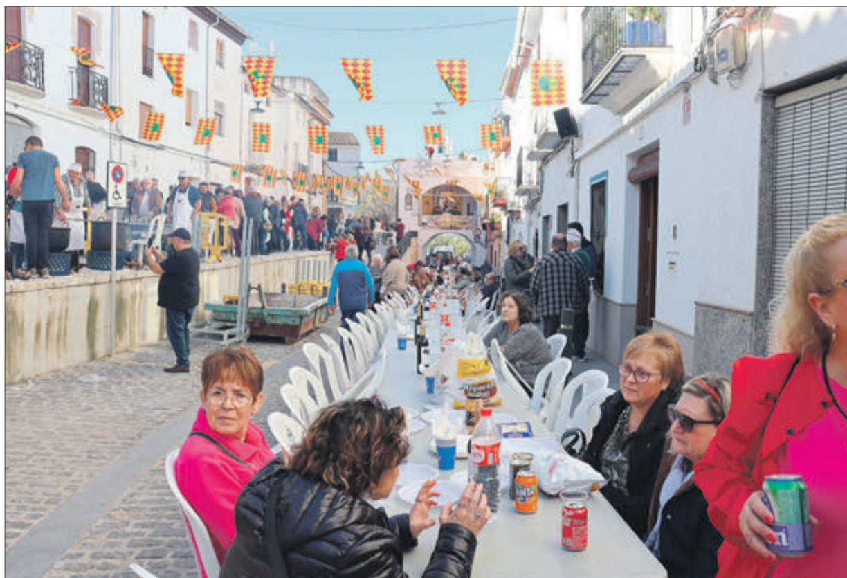
La celebració va propiciar un gran ambient al carrer Sant Vicent.