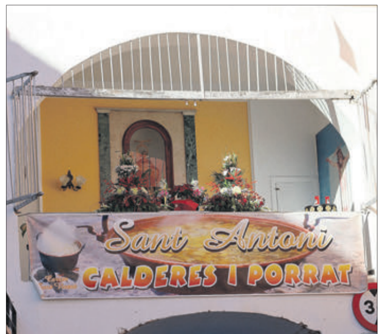
Diferents imatges de la tradicional celebració de Sant Antoni.