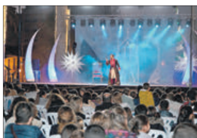
El Pare Noel i el musical 'La princesa del Hielo'.