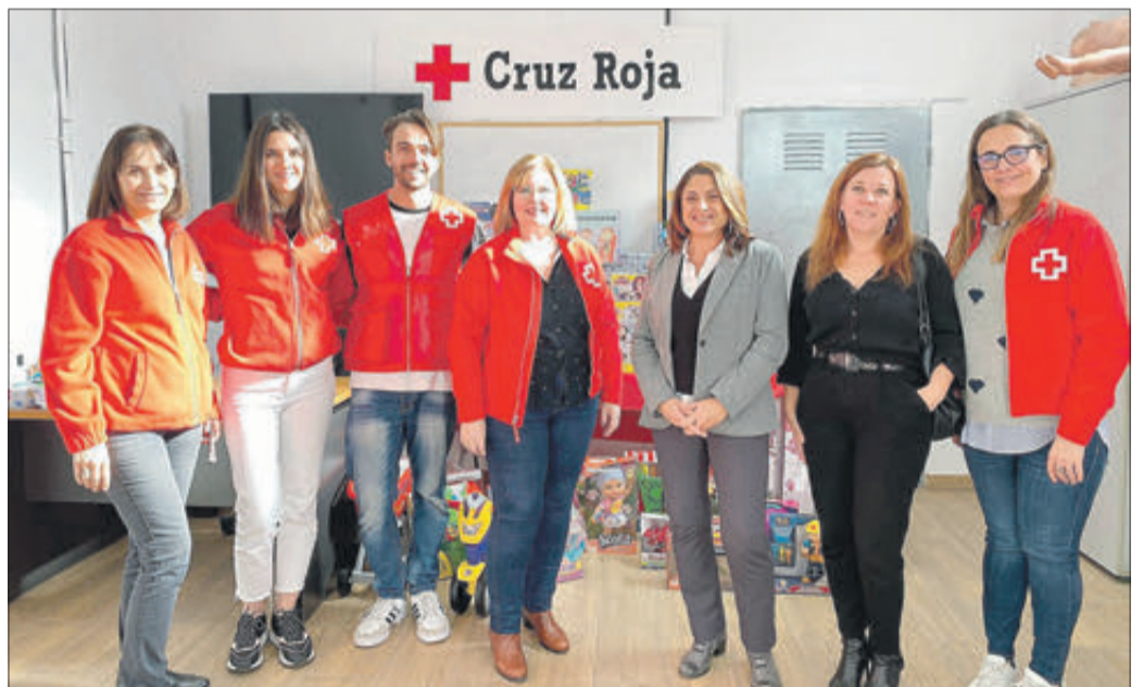
La convocatòria fue aprovechada para una sesión de trabajo con Primeros Trons.