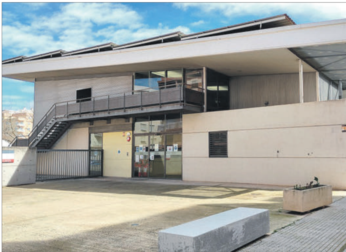
Edifici del Conservatori, un dels quals està previst remodelar en el Pla Edificant.

Concretament per a la "Construcció d'un aulari d'infantil, gimnàs/ sala d'usos múltiples i reparar l'actual pista poliesportiva del centre en el CEIP Alfadalí a Oliva (València)" siga de