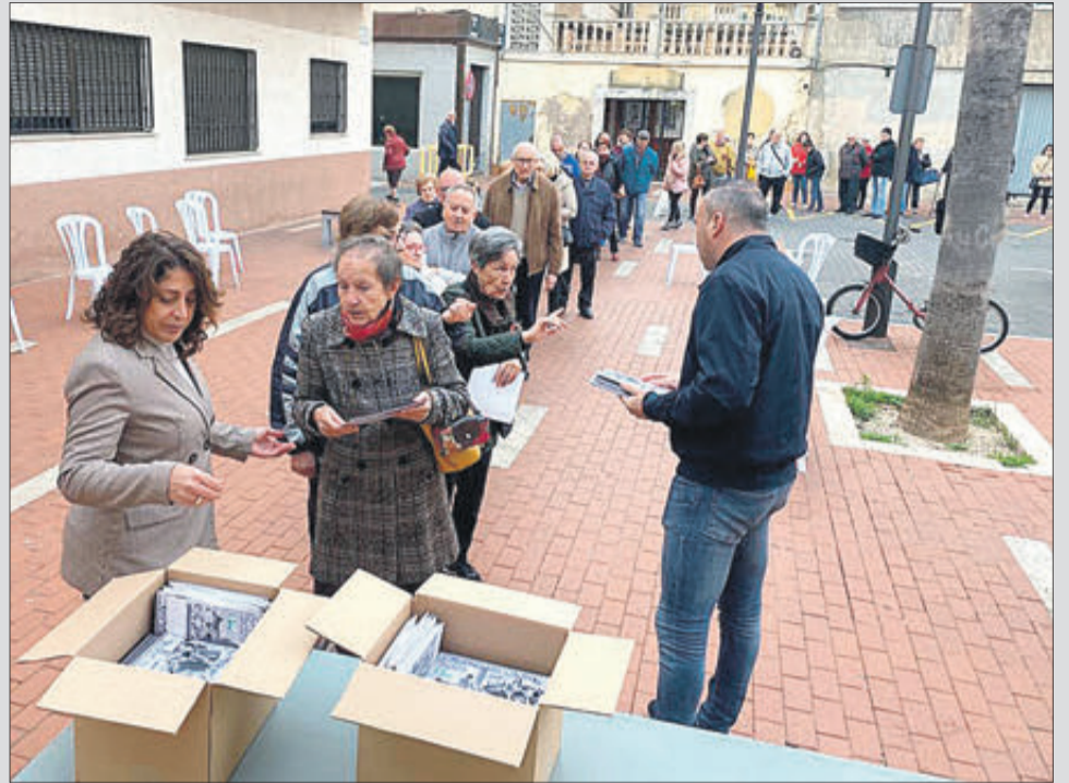
Repartiment del calendari.