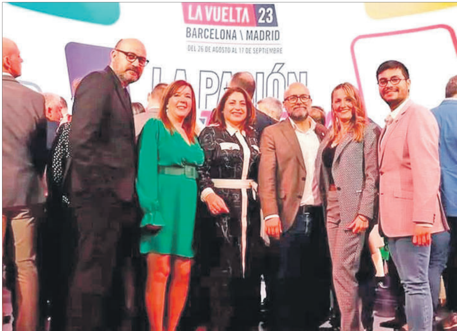
Una representació del consistori d'Oliva va assistir a l'acte de presentació de la prova ciclista.

La jornada prevista per a l'1 de setembre, sobre una distància de 188,8 kilòmetres, començarà a Utiel per a acabar a Oliva, passant per València, El Perelló, Cullera i Gandia. Serà la primera vegada en la història que una etapa de La Vuelta concloga a Oliva, el dia següent l'eixida serà desde la veïna localitat de Dénia.