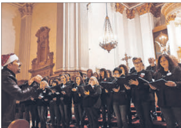
Els concerts de Nades i de Tubes.