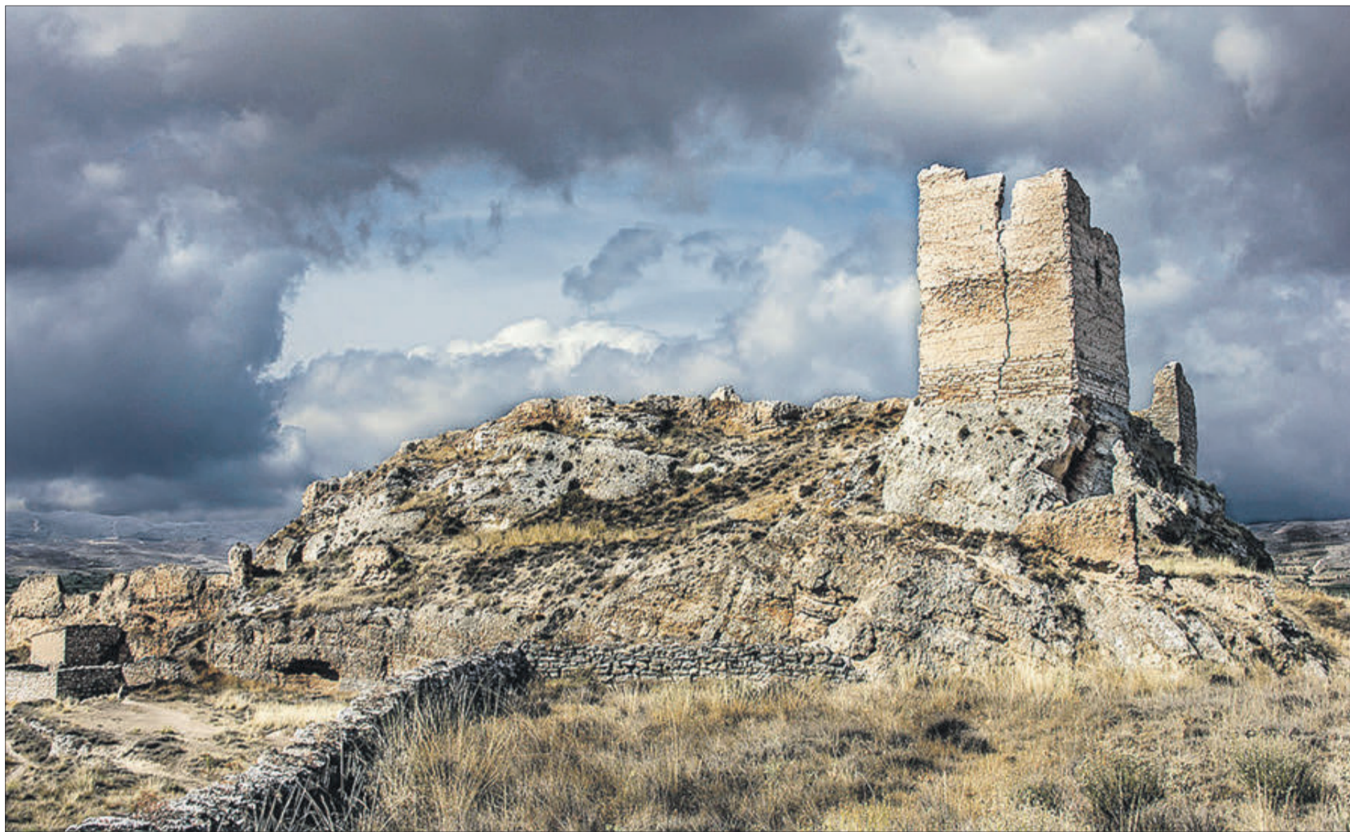
El castell de Malonda, nom amb el qual era conegut en època musulmana.