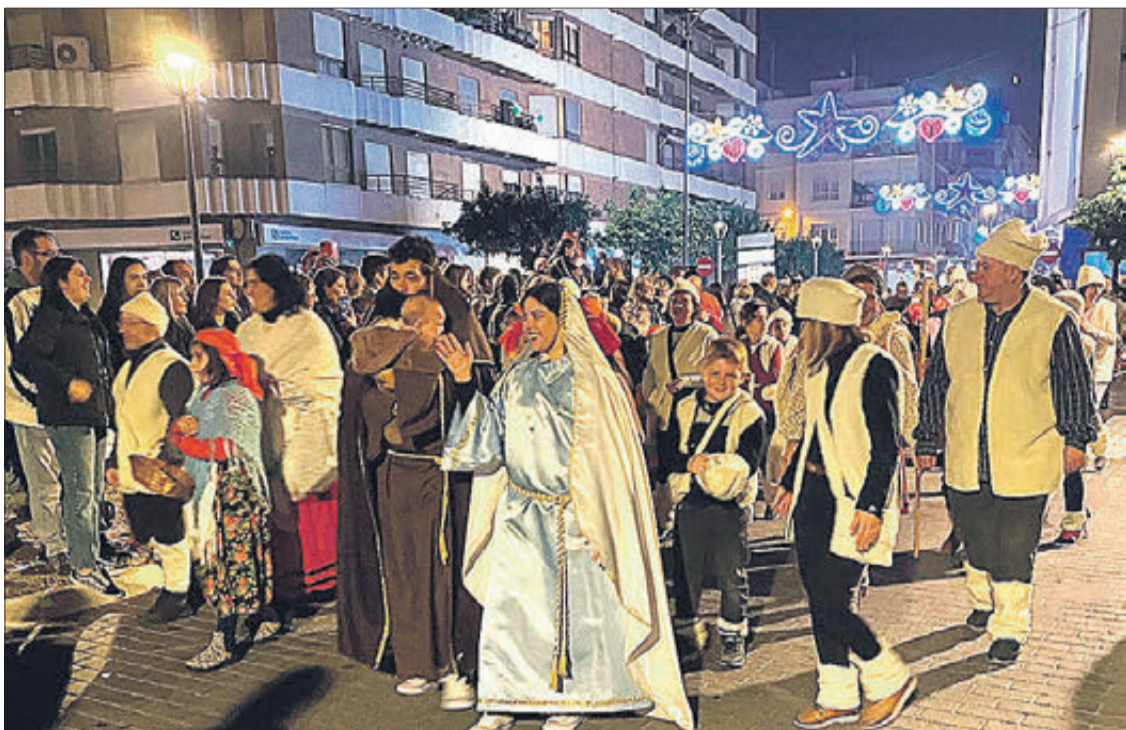
Un moment de la Cavalcada.