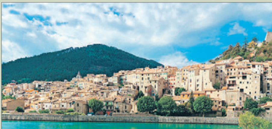
Sisteron és una ciutat francesa agermanada amb Oliva.

També hi ha relacions d'amistat amb la ciutat alemanya d'Herbolzheim, agermanada amb Sisteron, malgrat que no s'ha produït en aquest cas el pas de constituir-se un comitè oficial en cap dels dos municipis i iniciar-se la tramitació oficial.