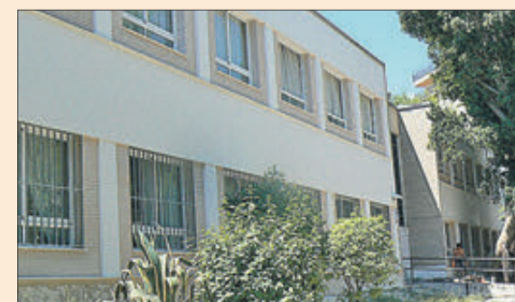
El Centre de Formació d'Adults Joanot Martorell.

El Centre de Formació de Persones Adultes Joanot Martorell d'Oliva ha informat del període d'inici del Curs 2022-23. La matriculació tindrà lloc entre els dies 1 i 30 de setembre en horari de 9 a 13,30 hores de dilluns a divendres en les seues instal·lacions de l'antic institut de batxillerat situat en el Passeig de Jaume I número 6 d'aquesta localitat de la Safor. El centre ofereix formació bàsica i reglada d'alfabetització, neoelectores, graduat en ESO amb flexibilitat horària, també espanyol per a estrangers en els seus nivells A i B, i curs per a la preparació de la prova del certificat d'espanyolitat que es demana a persones estrangeres residents a Espanya. A més dels tradicionals cursos de valencià en els seus nivells A, B i C tant en versió normal com en versió intensiva, per a preparar-se per a les proves de coneixements de valencià de la Generalitat Valenciana i altres proves oficials. Així com els habituals cursos d'informàtica un i dues i tractament d'imatge. Un altre dels cursos clàssics és el d'anglès en les seues línies de nivell A, B i C dependent dels coneixements de cada alumne. Cursos de dibuix i pintura també adaptant-se als coneixements dels seus alumnes.