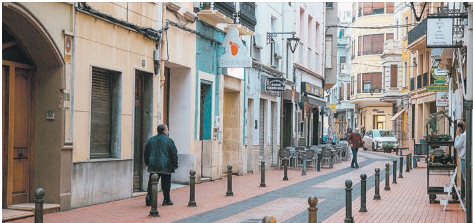
Un carrer comercial del centre d'Oliva.

L'Ajuntament d'Oliva destinarà, en aquesta tercera fase, 50.000 euros del pressupost municipal a aquesta fase de la campanya dels xecs #Comptemambtu d'activació del comerç local, la qual cosa suposarà uns ingressos de més de 120.000 euros al sector comercial d'Oliva.