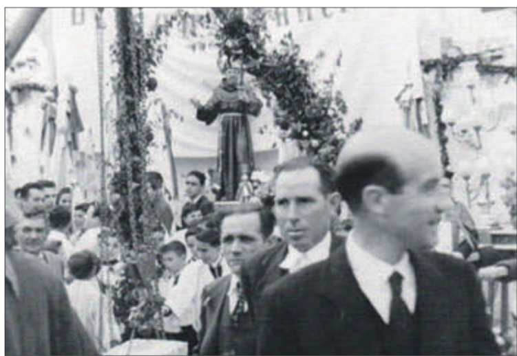
Festa amb motiu de la primera pedra de l'església