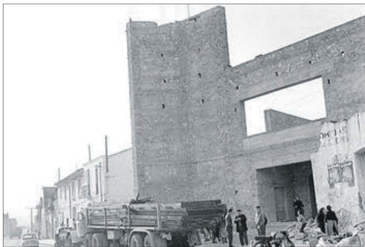
Construcció de l'església.