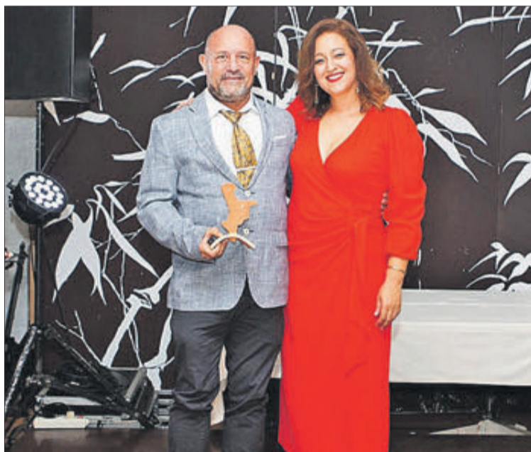
Premi Hermes especial al programa 'Fem Comboi' de Radio Safor.

en la mateixa gala de la música de la Safor.