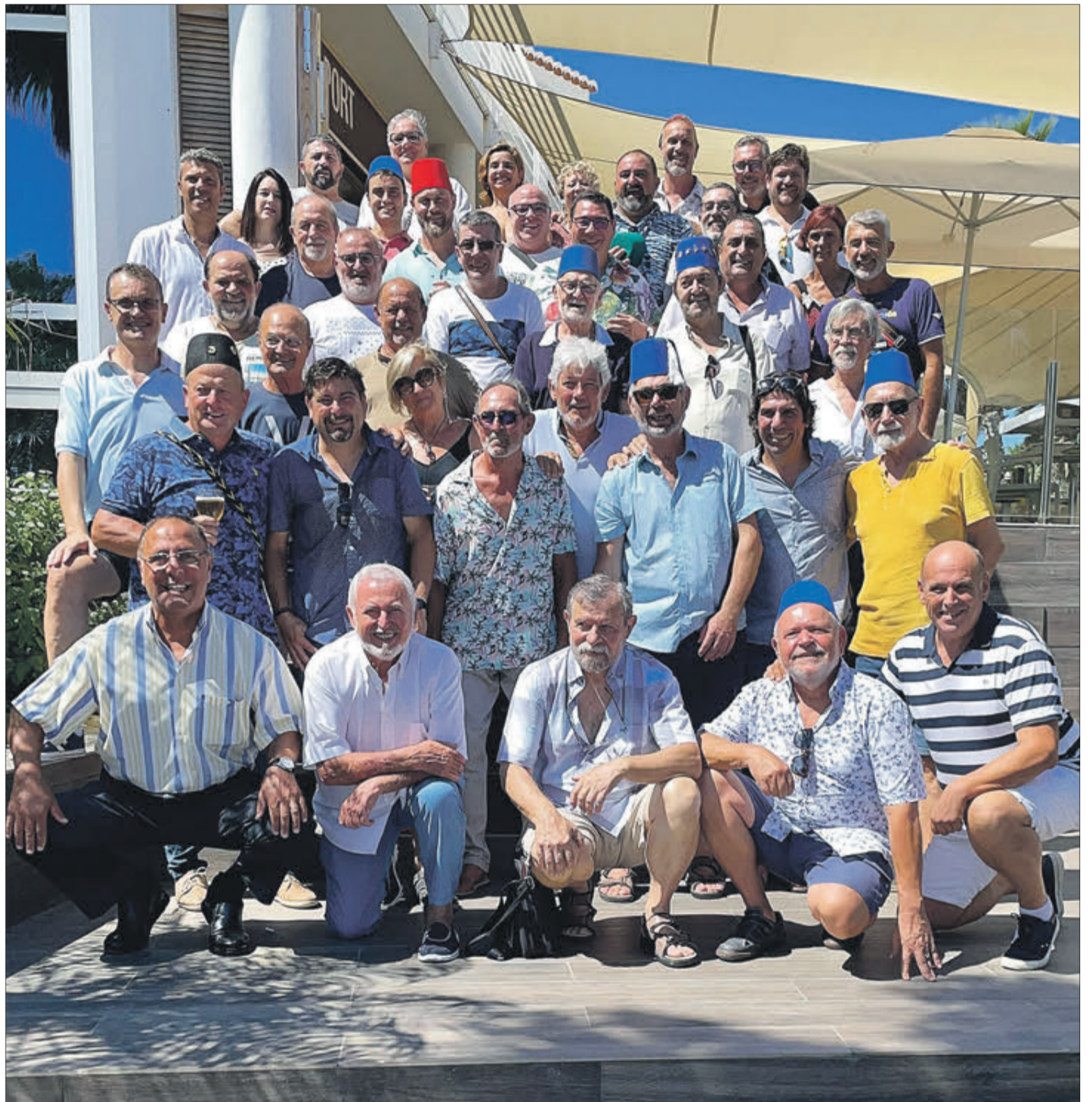
Grup de capitanes i capitans que van participar en la trobada.

Endavant els càrrecs de la Festa de Moros i Cristians d'Oliva!