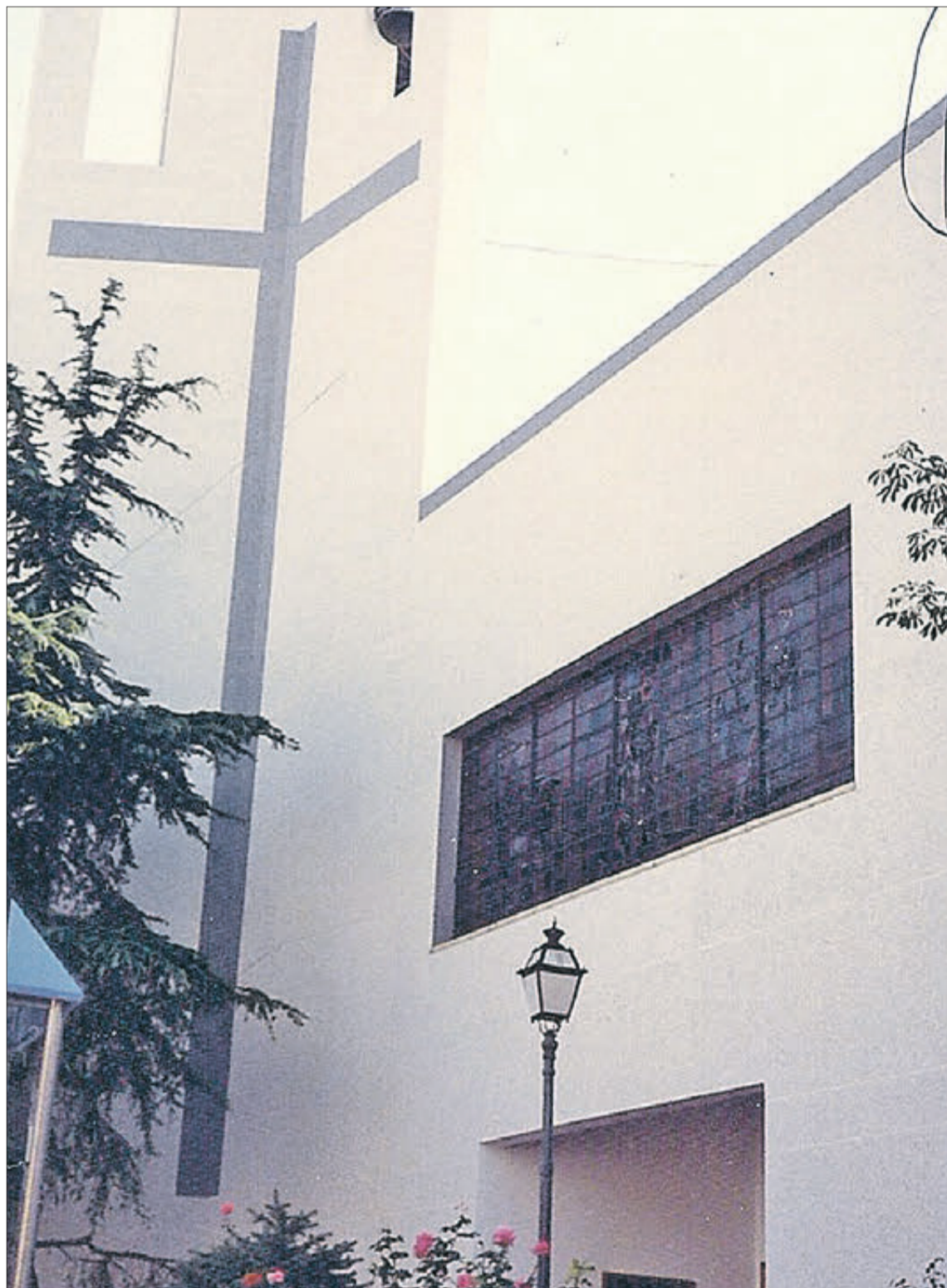
Façana de l'església de Sant Francesc.

SANT FRANCESC, PRIMER PATRÓ DE LA CIUTAT