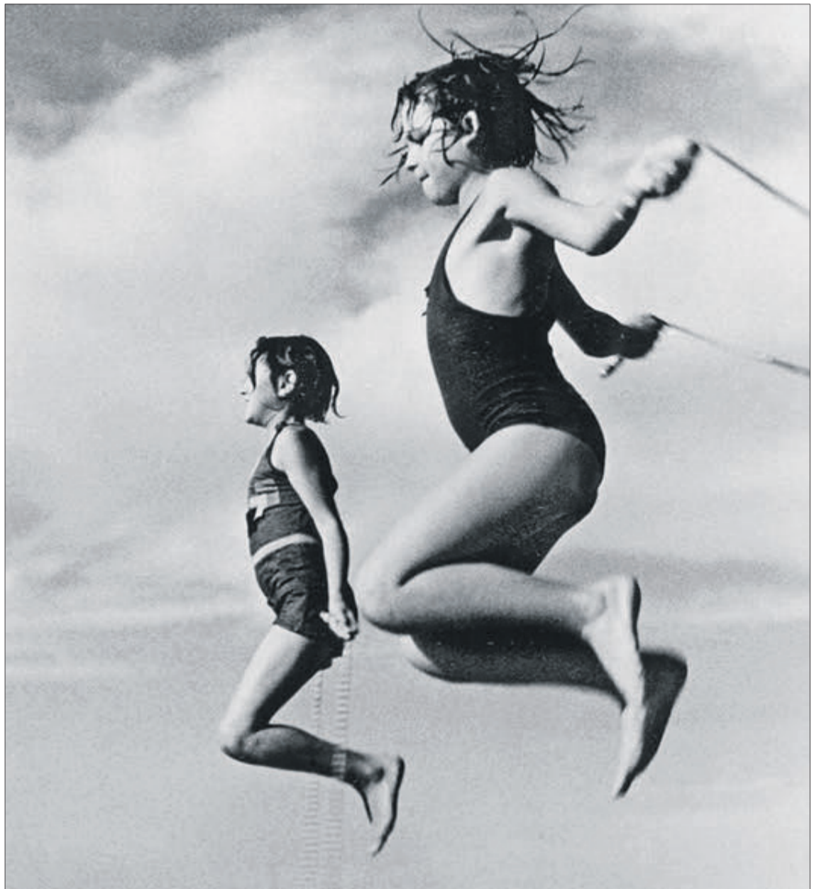
Estiu de 1937, xiquetes de la colònia Mare Nostrum