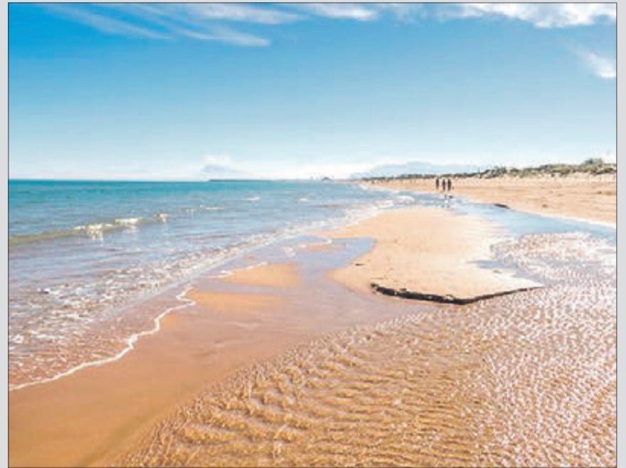
Platja de Terra Nova.

L'objectiu d'aquesta iniciativa era i és conscienciar i mobilitzar a la ciutadania per a mantindre els espais naturals lliures de fem i que puguem, d'aquesta manera, alliberar molta més vida en favor de la biodiversitat. Aquesta és la gran recollida col·laborativa que LIBERA convoca anualment per a alliberar la naturalesa de la brosaleta que uns altres van tirar i no van retirar.