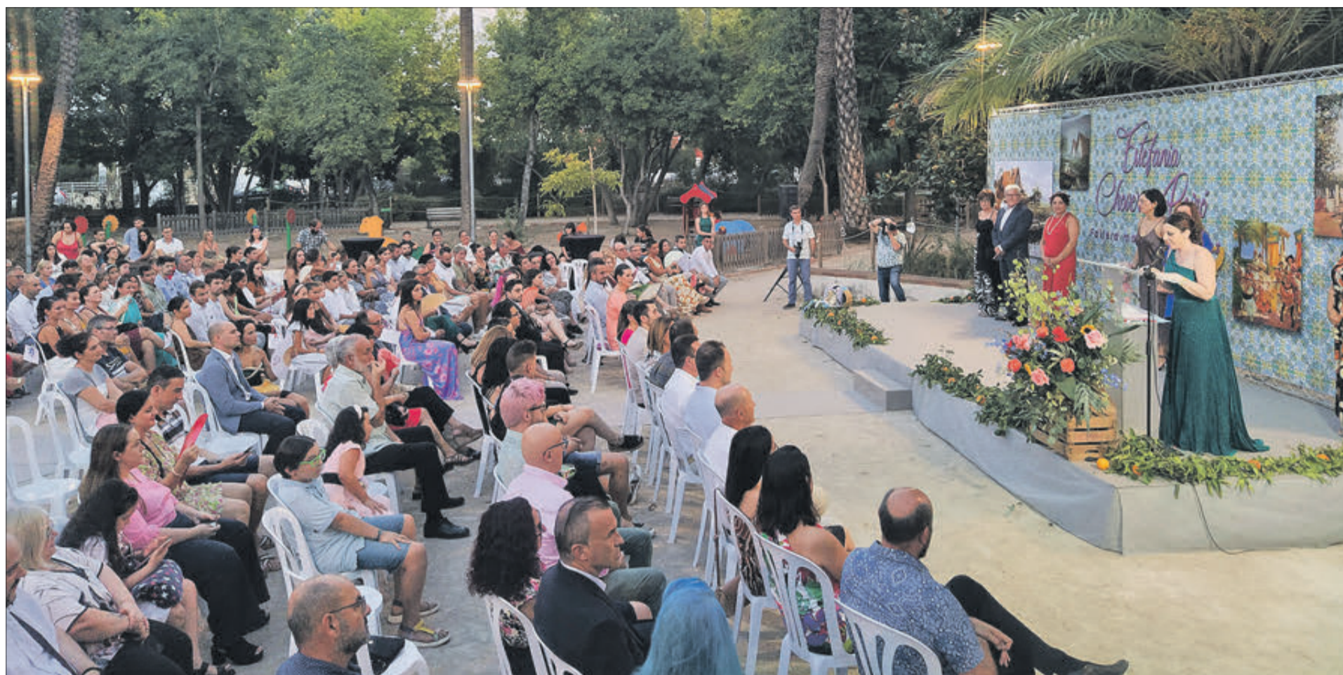
Un moment de l'acte de la 'demanà'.

L'ACTE, CELEBRAT AL PARC DE L'HORT DE LA BOSCA, SUPOSA EL PUNT DE PARTIDA DEL NOU EXERCICI FALLER