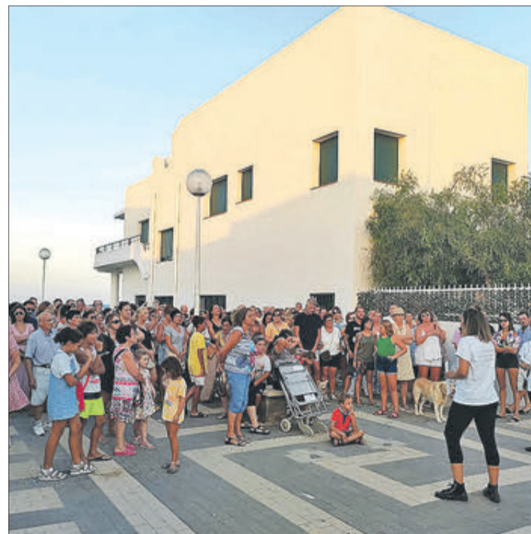
En arribar a l'antiga colònia Mare Nostrum.