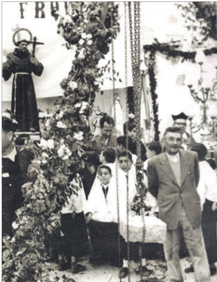
Col·locació de la primera pedra de l'església Sant Francesc.