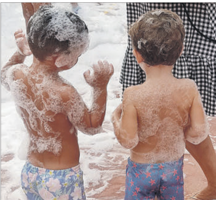
Dos xiquets participant en la Festa de l'escuma

Al CEIP Santa Anna, s'entén que cal eixe acostament, que la transició de les vacances a l'aula ha de tindre eixa dosi necessària de joc i on les famílies hi estiguen presents, especialment aquelles que porten per primera vegada els seus fills o filles al centre i que no es relacione la paraula «Col·le» amb avorriment, tedi, ansietat... Per això, el CEIP Santa Anna ha preparat una festa molt estiuenca per rebre els seus estudiants: la festa de l'escuma, que ha estat valorada