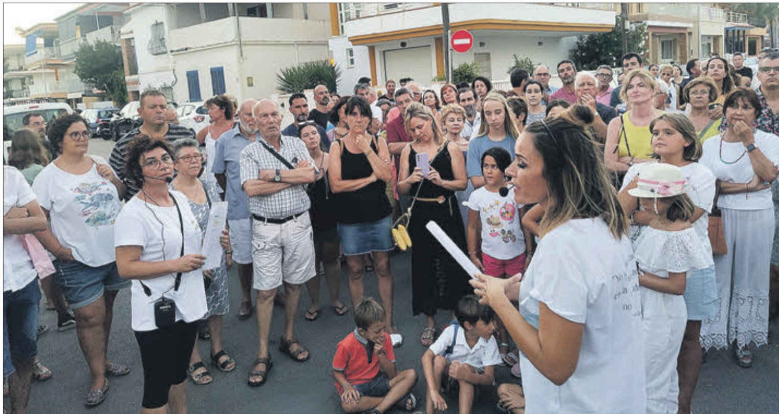
La ruta, en el carrer Canyonades.

En el Camí de les Canyonades es va recordar la fisonomia de les cases, similars a les del barri antic, sense cases ni patis perquè la gent feia la vida al carrer. "Potser ací va haver-hi un nucli poblacional antic. Hi ha dades d'època