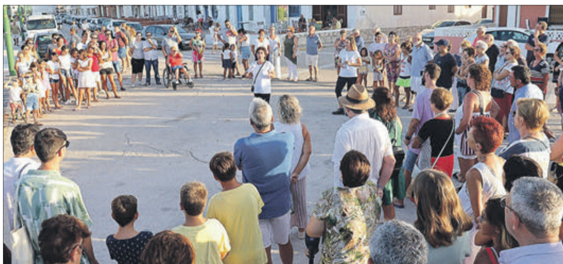
Els participants escoltant les explicacions de la guia.