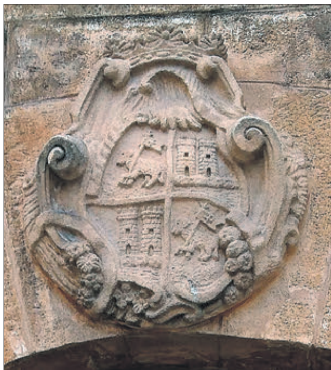
Blasó dels Pasqual.