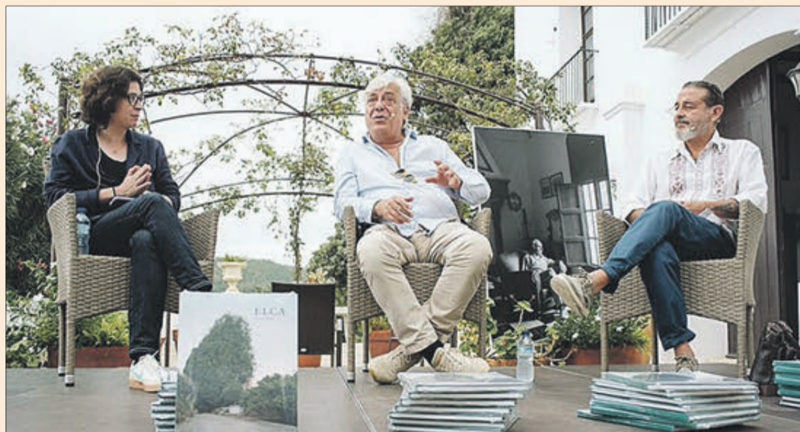
L'acte de presentació, amb el llibre en primer terme.