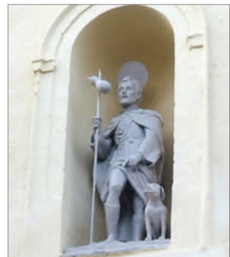
La imatge de Sant Roque després de ser col·locada en la façana de la parròquia del Raval.