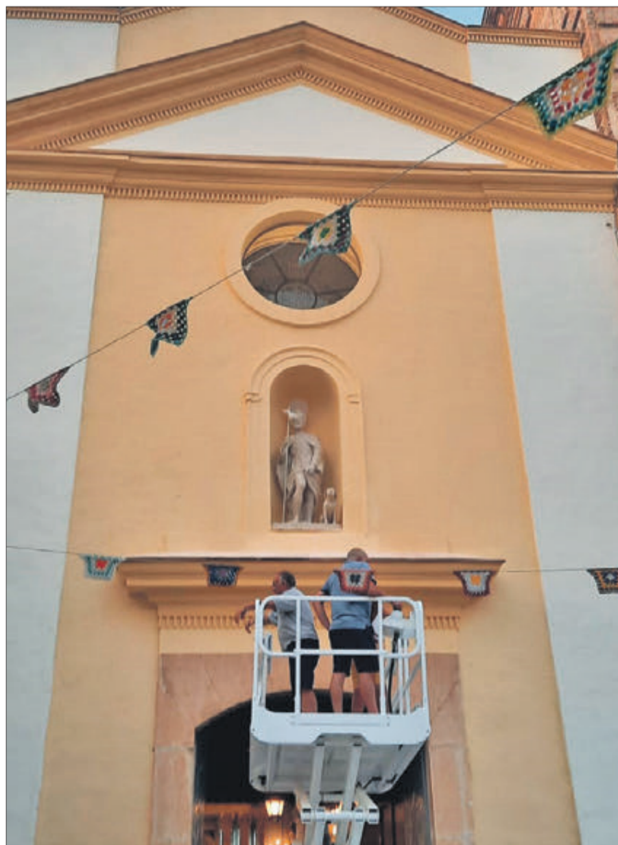
Mitjançant una plataforma elevadora es va pujar l'escultura fins al lloc definitiu.