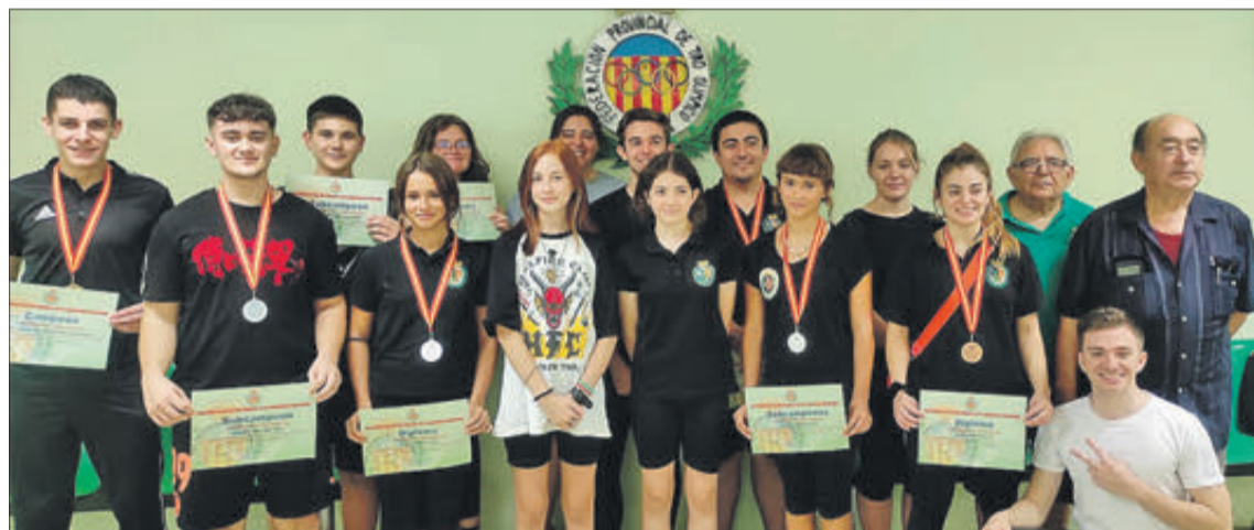
Components del club que van participar en la competició provincial.

L'Associació també va informar que encara es pot concursar, però cal haver efectuat la preinscripció abans del 15 de setembre a través de la pàgina web d'Ornigestion. Per a efectuar el pagament el número de compte és: ES28 3159 0044 5525 3780 8129. Per a garantir l'organització els grups estaran detallats en la mateixa web. A més, el col·lectiu informa que si la inscripció d'una raça no arriba a una quantitat viable per a l'assignació d'un jutge alternatiu. L'aforament serà limitat. I els preus seran per a inscripció individual de 3,50 euros i per equips de 12 euros.