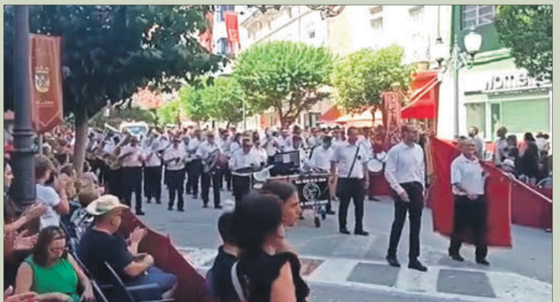
La banda de Villena, desfilant en les festes del municipi alacantí.

La peça olivera està sonant moltíssim en diversos actes festius de la Comunitat Valenciana, tant en actes de falles, com de moros i cristians i festes locals interpretada per diverses agrupacions musicals valencianes, el qual és un goig per a la família Fenollar Soler.