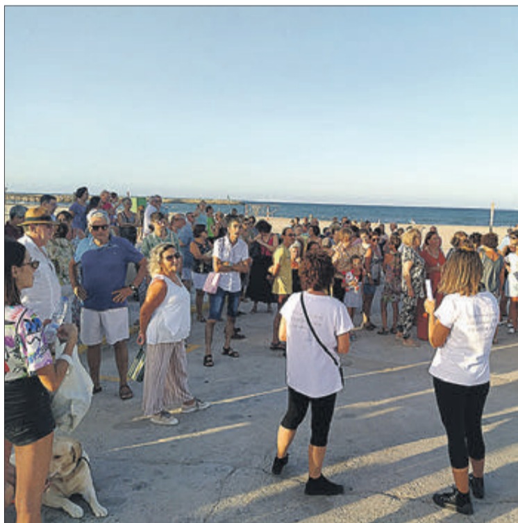
Imatge corresponent a l'inici de la ruta a la platja.