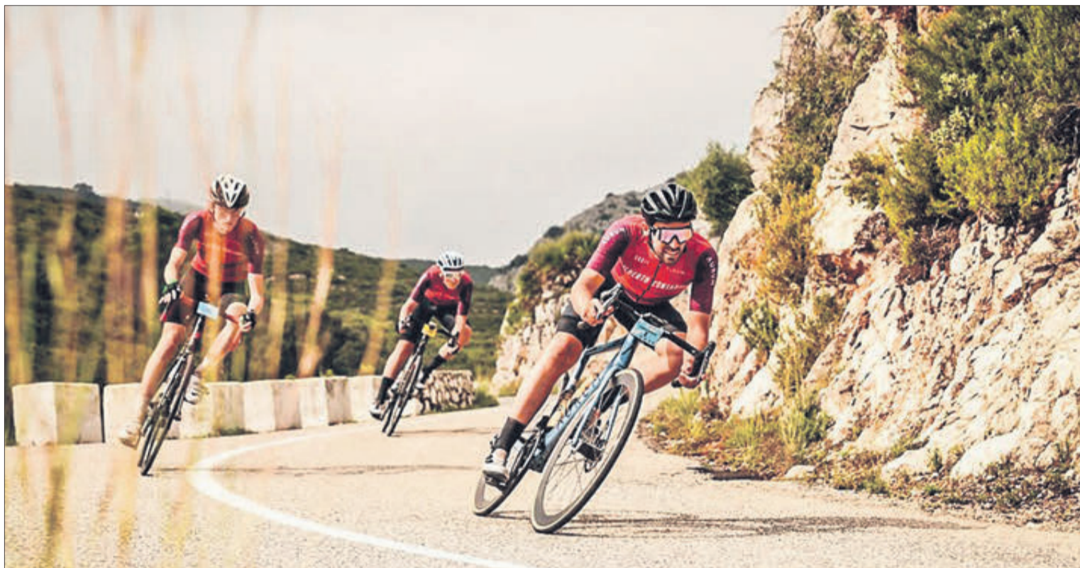
Imatge d'una passada edició de la prova.