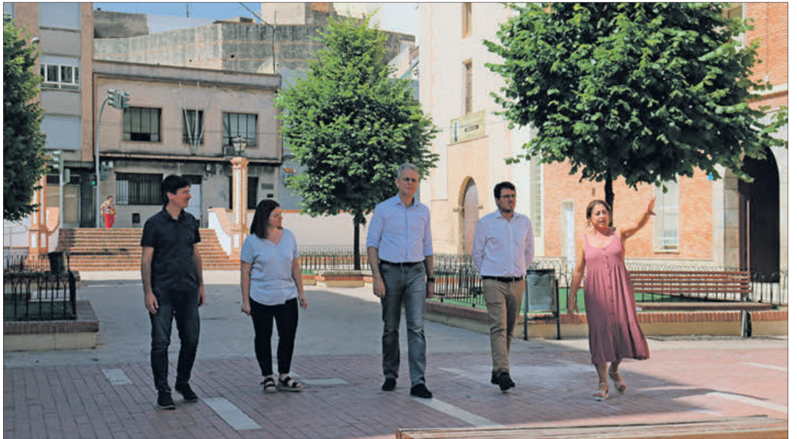
L'alcaldesa Yolanda Balaguer i la regidora de vivenda, Ioana Sintimbrean, amb els tècnics.

El projecte de millora de l'entorn urbà subvencionat pels fons europeus consistirà en la reurbanització del carrer Comtessa Maïans pel valor de 400.000 euros. El nou disseny buscarà la sostenibilitat ecològica i social alineant-se als objectius establerts pels Fons Next Generation. Es preveuen actuacions per fer més amable i acollidora la zona d'àmbit públic mitjançant la incorporació d'espais d'estança de qualitat al llarg del vial i la seua adequació als nous estàndards d'accessibilitat.