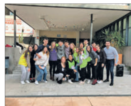
IES Gabriel Ciscar.