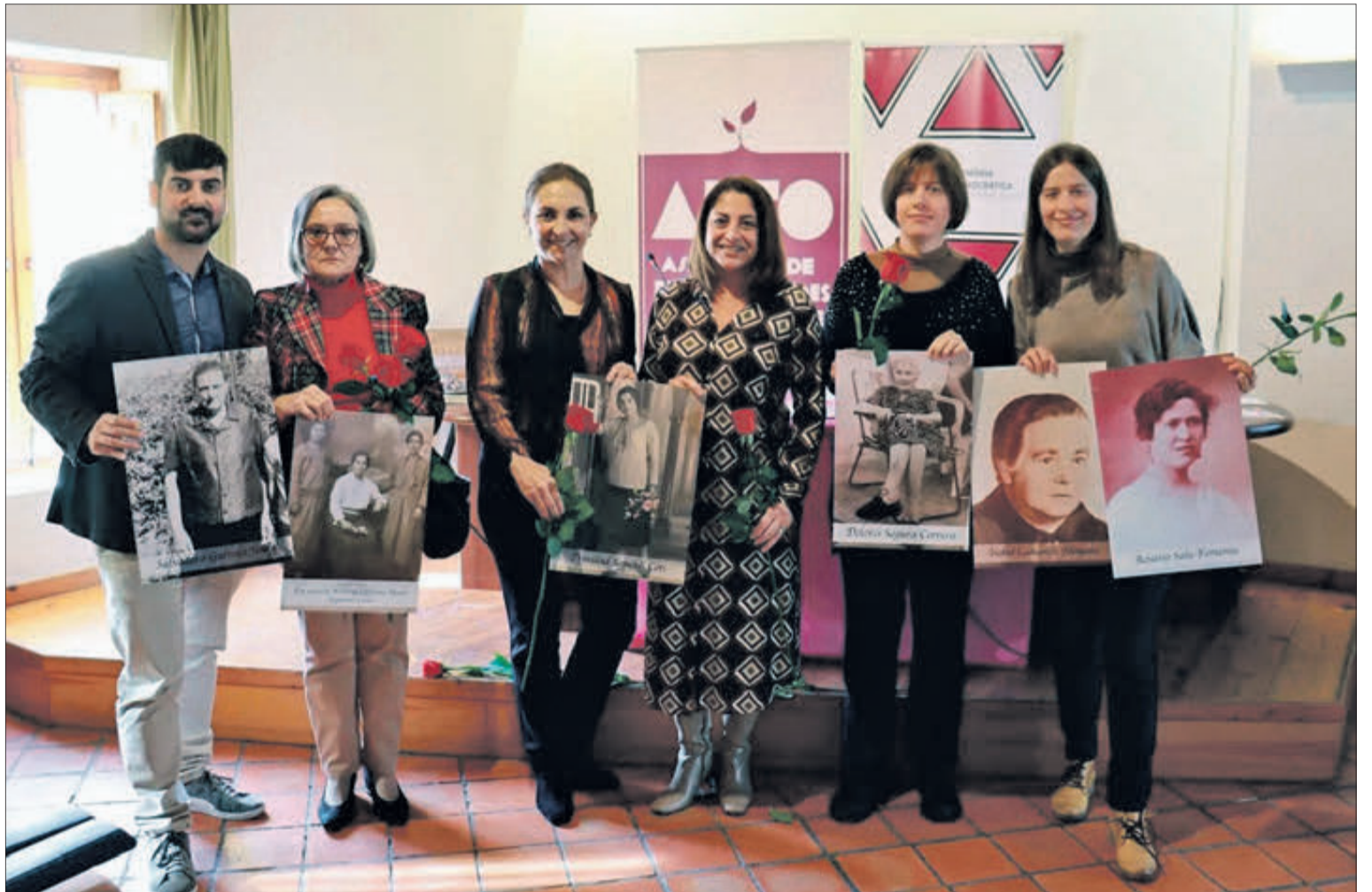
Oliva ha celebrat un acte homenatge a les dones rapades pel franquisme.

Una jornada molt emotiva en la qual es va reconèixer públicament, de part de les famílies, a aquestes 23 dones que van ser sotmeses a una sèrie de represàlies amb l'objectiu d'estigmatitzar-les.