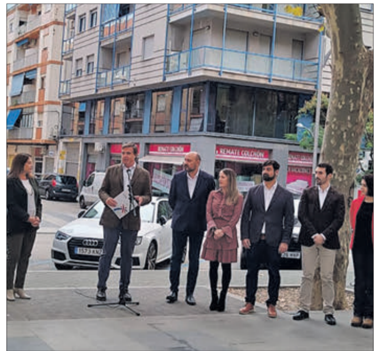
Les autoritats assistents a l'acte.