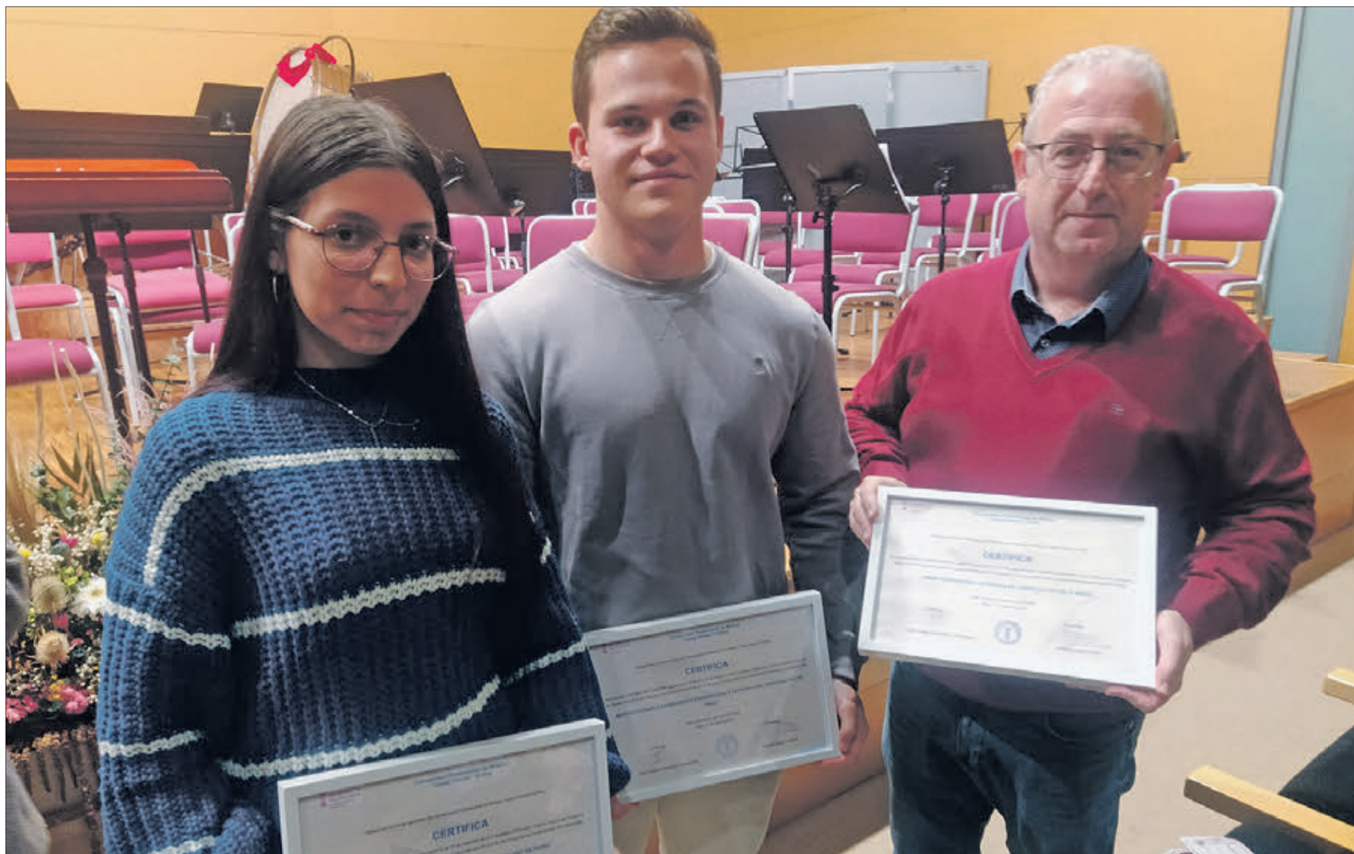
Els tres alumnes premiats.

L'OBERTURA DEL NOU CURS I INICI DEL ANIVERSARI VA CONCLoure AMB UN CONCERT EXTRAORDINARI