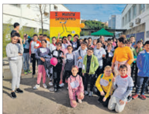
CEIP Verge dels Desemparats.