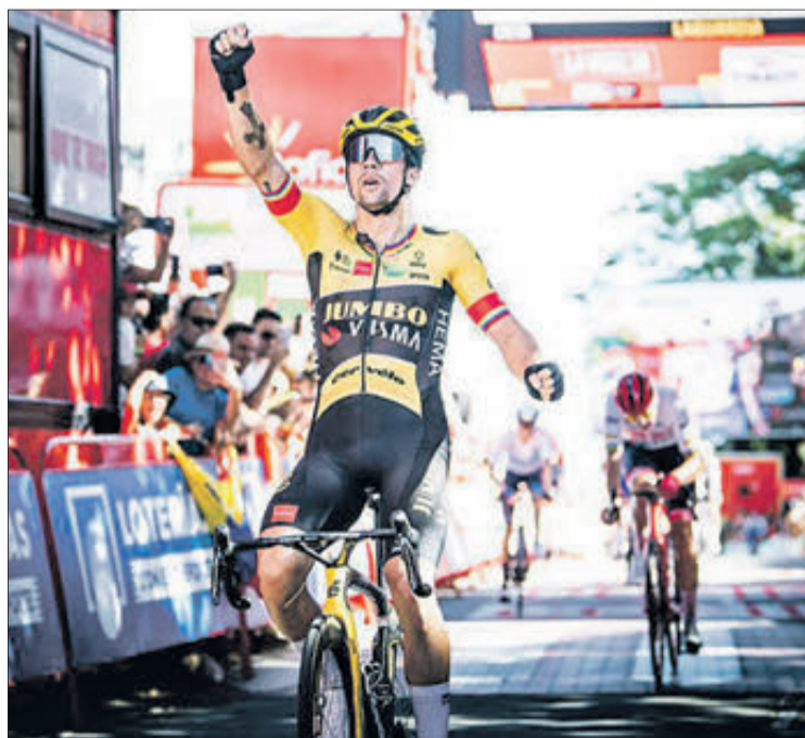
Un ciclista celebra la victòria en un final d'etapa de La Vuelta

Per les carreteres valencianes ja han transcorregut cinc de les últimes huit edicions de la Volta, des de l'etapa entre València i Castelló de 2015. Amb posterioritat, la carrera ha tornat en 2016 i 2017, amb les etapes entre Requena i Gandia, i Lliria i el Port de Sagunt. Amb posterioritat, La Vuelta ha visitat la província en anys alterns, en 2019 amb l'etapa amb eixida a Cullera i final en el Monestir de Santa Maria del Puig, en una edició que també va veure partir una etapa des de