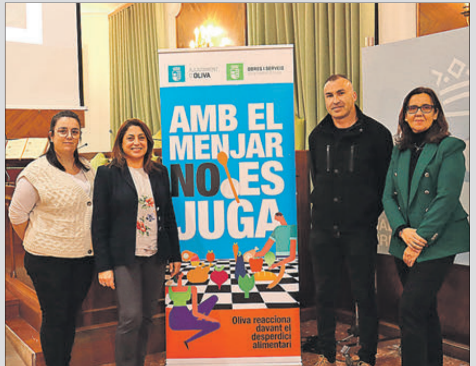
Presentació de la campanya.

La campanya busca la conscienciació a través del sector educatiu, el canal HORECA i de les diverses associacions i organismes públics i privats del municipi. La problemàtica del desperdici alimentari suposa un greuge social i econòmic a més d'ètic que cal erradicar el màxim possible i per això és imprescindible la implicació d'aquests actors.