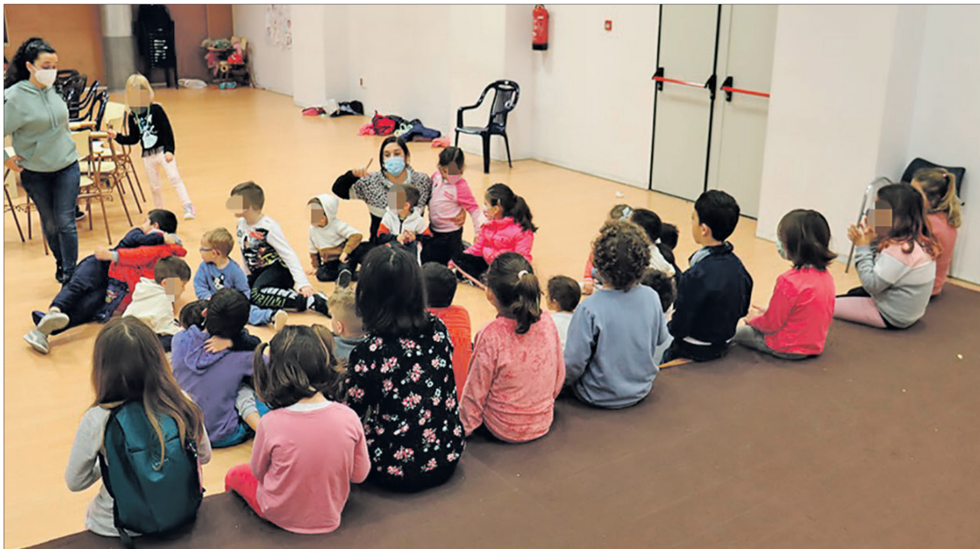
Xiquets i xiquetes en una sessió de la ludoteca.

«NADAL OLIVIA» S'EMMARCA DINTRE DEL PROGRAMA OLIVIA CONCILIA