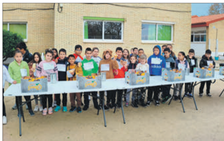
CEIP Lluís Vives.