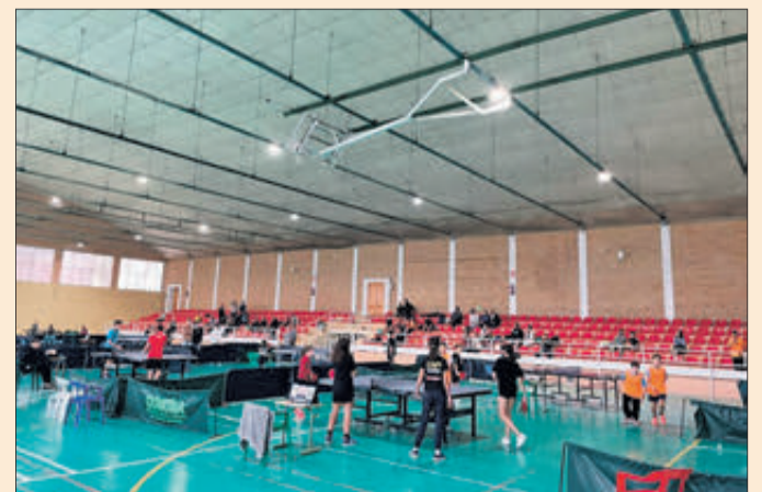
Competició del Top Provincial de Tennis Taula.

Grans resultats per a les joves promeses del tennis taula d'Oliva en aquesta important competició d'esport de base a la Comunitat Valenciana.