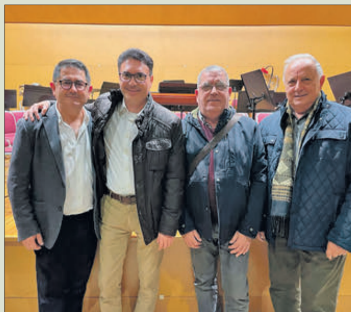
Els quatre directors que ha tingut el centre.