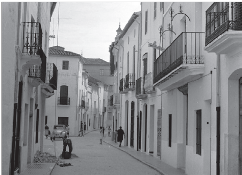
Carrer Les Tendes, anys 60.