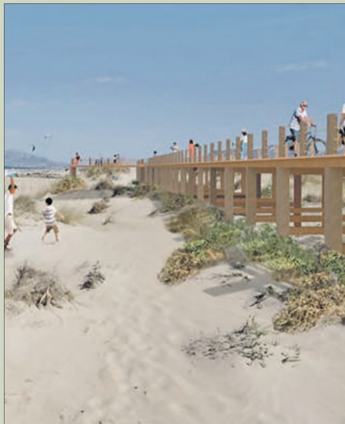
Recreació del projecte del Passeig Dunar.

nicipal». En definitiva, «s'ha dissenyat un projecte d'abast global per a tots els comerços d'Oliva entorn de la digitalització i la sostenibilitat com a eixos fonamentadors d'un projecte que afavorirà la competitivitat d'aquest sector i potenciarà el desenvolupament econòmic i social del municipi» ha conclòs l'alcaldeessa i regidora de Comerç Mercats i Consum Yolanda Balaguer.