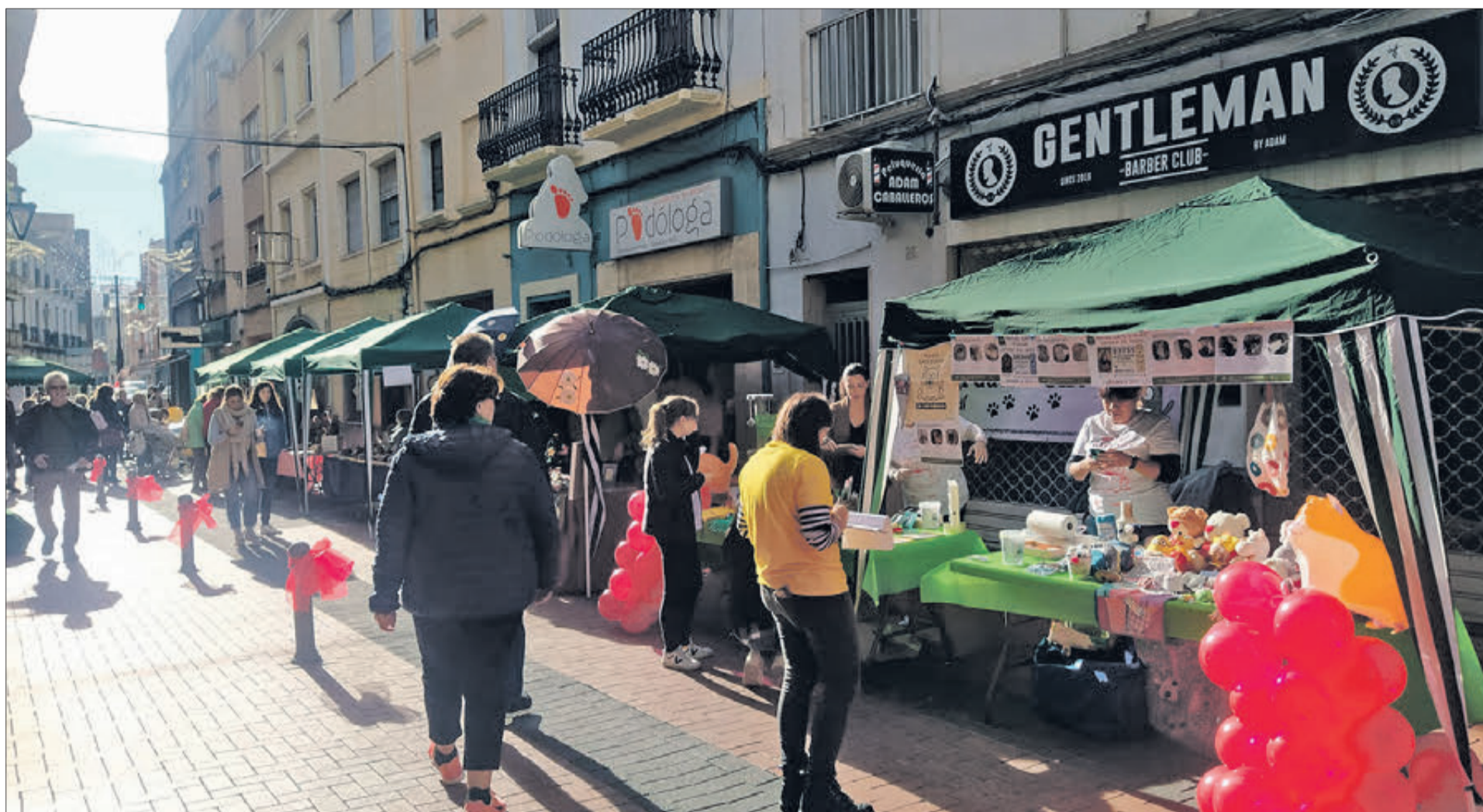
El Mercat de Nadal es va instal·lar al carrer Major i adjacents.

EL COMERÇ D'OLIVA CELEBRA EL PRIMER NADAL "NORMAL" DESPRÉS DE LA PANDÈMIA