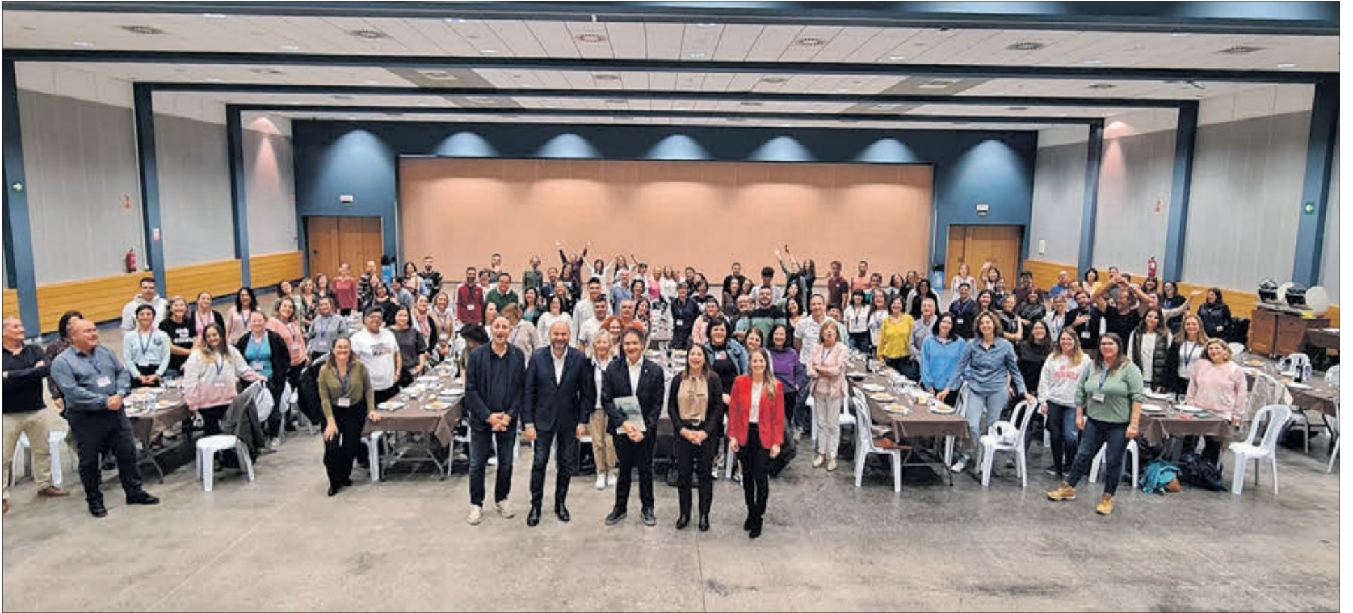
El dinar de les jornades es va celebrar al Centre Polivalent.

MÉS DE 150 PROFESSIONALS DE LES MÉS DE 200 OFICINES VAN CONÈIXER LA RICA I VARIADA OFERTA TURÍSTICA D'OLIVA