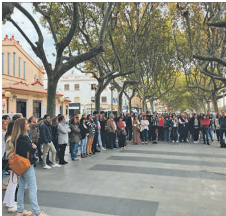
Imatge de la benvinguda als participants.