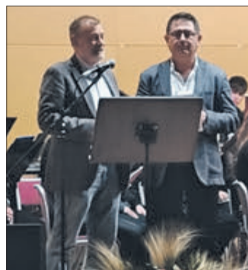
El director general i director del centre.