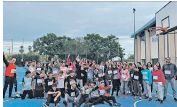
CEIP Hort de Palau.