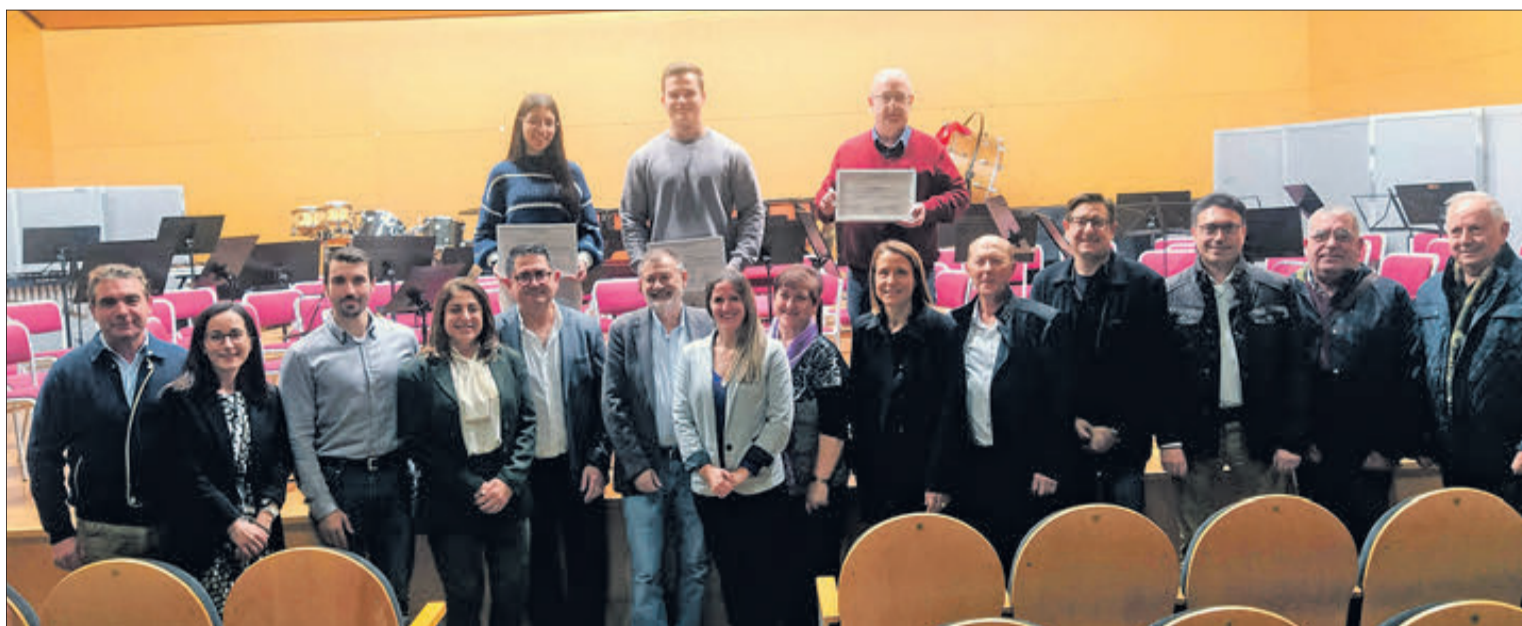
Apertura del 25 aniversari del Conservatori.

Gomicia, en el seu parlament, va reconèixer que "el Conservatori té la sort de celebrar els 25 anys, és important per a Oliva i per a la Safor i això és sobretot gràcies a la labor de l'equip de profes-