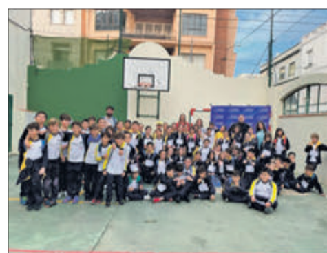
Col·legi Rebollet 1