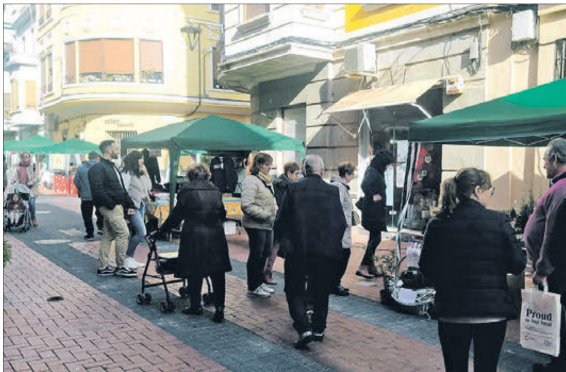
Gent visitant el Mercat de Nadal.

En un tram del mateix va haver-hi un Mercat solidari, amb la participació de diverses associacions d'Oliva. I també la tradicional venda d'EurAccos, pagant 20 euros i podent gastar