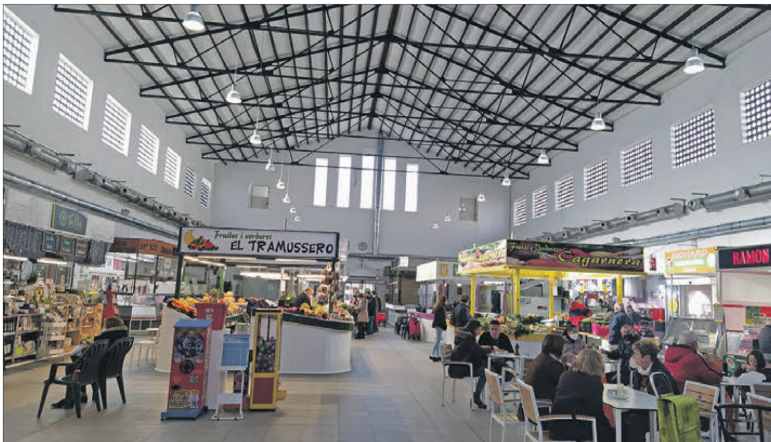
El Mercat Municipal d'Oliva.

Amb el nom «Nou Mercat d'Oliva, sostenible i Digital», el projecte d'Oliva valorat en 2 milions d'euros planteja una actuació tractora sobre el Mercat Municipal que pretén prioritzar la sostenibilitat econòmica i mediambiental de l'espai. Es plantegen millores estructurals, de pavimentació, estètica corporativa, increment