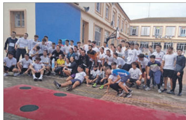
CEIP Santa Anna