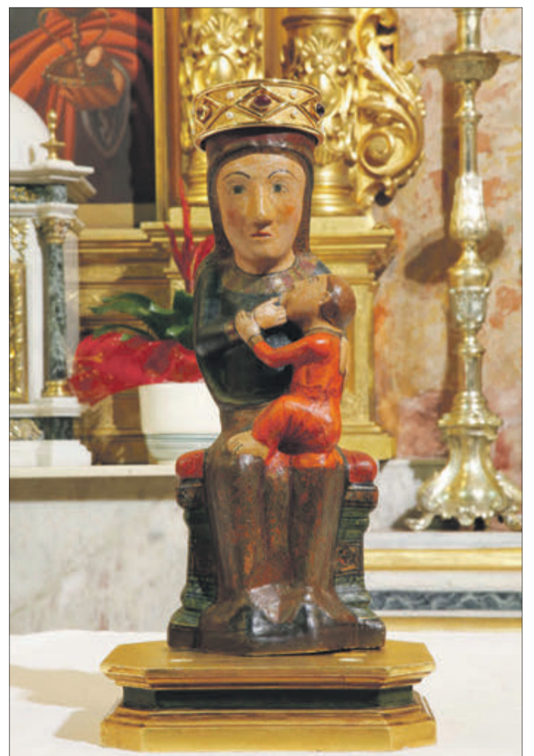
Verge del Rebollet.

La fundació d'Oliva va tindre lloc amb unes 40 cases i una església dedicada a Sant Francesc "Santa Maria durant uns dos-cents anys va estar dedicada ja a Sant Francesc perquè era un sant italià al qual tenien molta devoció els Carròs i després el van heretar també els Centelles". La fundació va ser aproximadament entre 1.249 i 1.255. El primer document que apareix de la fundació de la Vila d'Oliva és del 13 de febrer de 1.249 l'endemà de la guerra amb Al Azraq i la seua victòria. Carròs no sols va fundar Oliva sinó també va tindre la responsabilitat de repoblar Dénia i tota la zona de la Marina Alta i va col·laborar amb la fundació de Gandia "era com un virrei de la zona de la Safor i la Marina Alta en la seua època".