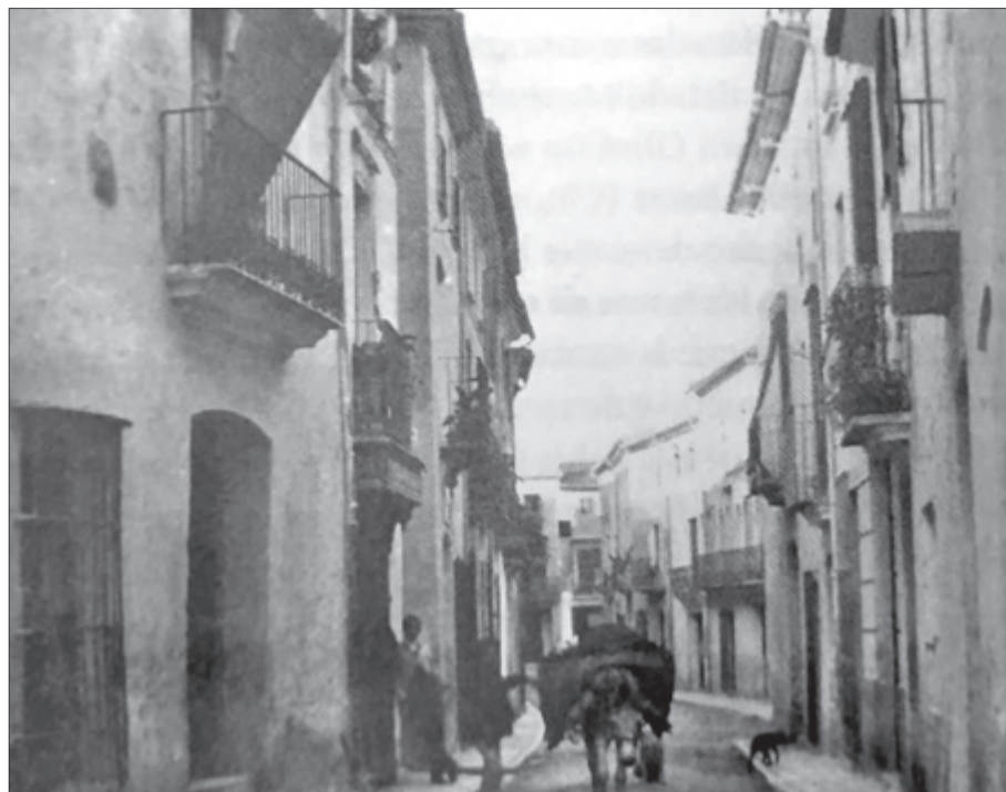
Carrer Les Tendes, anys 30.