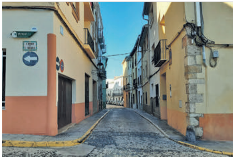
El Carrer de les Tendes vist des de la Raconada d'Alonso.

A la primitiva denominació de carrer del Trapig li va seguir, almenys des del segle XVI, la de carrer de les Tendes, encara que no queda clar el perquè d'aquest nom. Tal vegada era per haver-hi un elevat nombre de botigues, qui en sap? Però, durant segle XX, els tripijocs polítics van començar amb les malifetes de «qui mana fa el que vol». Llavors, les autoritats locals es van encabotar a deixar el seu segell en el nomenclàtor