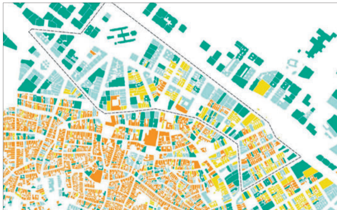
Mapa de la Zona on es va a actuar.

Per a la gestió de les ajudes i assessorament a les famílies es destinaran 287.000 euros d'aquesta subvenció per a la contractació d'una oficina tècnica. Serà l'Ajuntament d'Oliva qui es posarà en contacte amb veïnat de la zona per a informar-los del procediment a seguir.