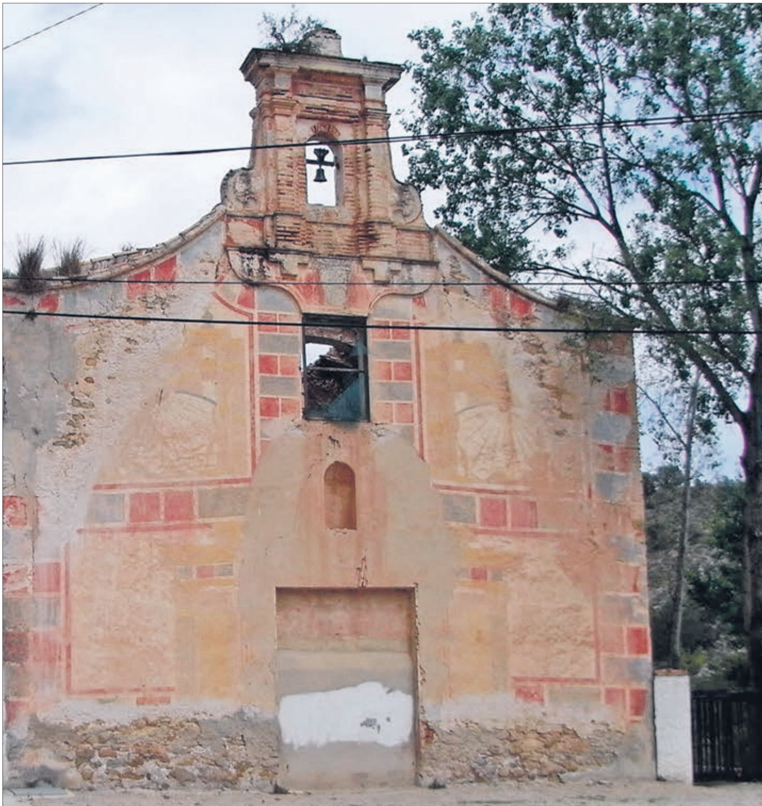
L'Ermita de Sant Antoni, formava part de l'antic Convent de Santa María del Pi.

Els moviments tel·lúrics es van repetir des del fatídic 26 de desembre de 1598 fins al 30 de gener de l'any següent. A conseqüència del terratrémol, el castell del Rebollet també es va veure afectat i