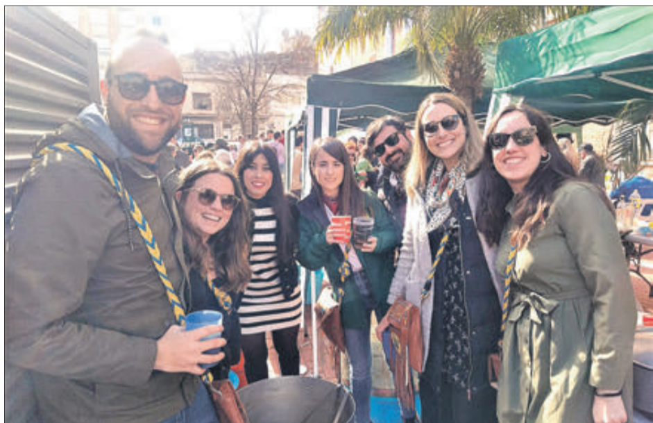
Membres de la filà Tuareg.