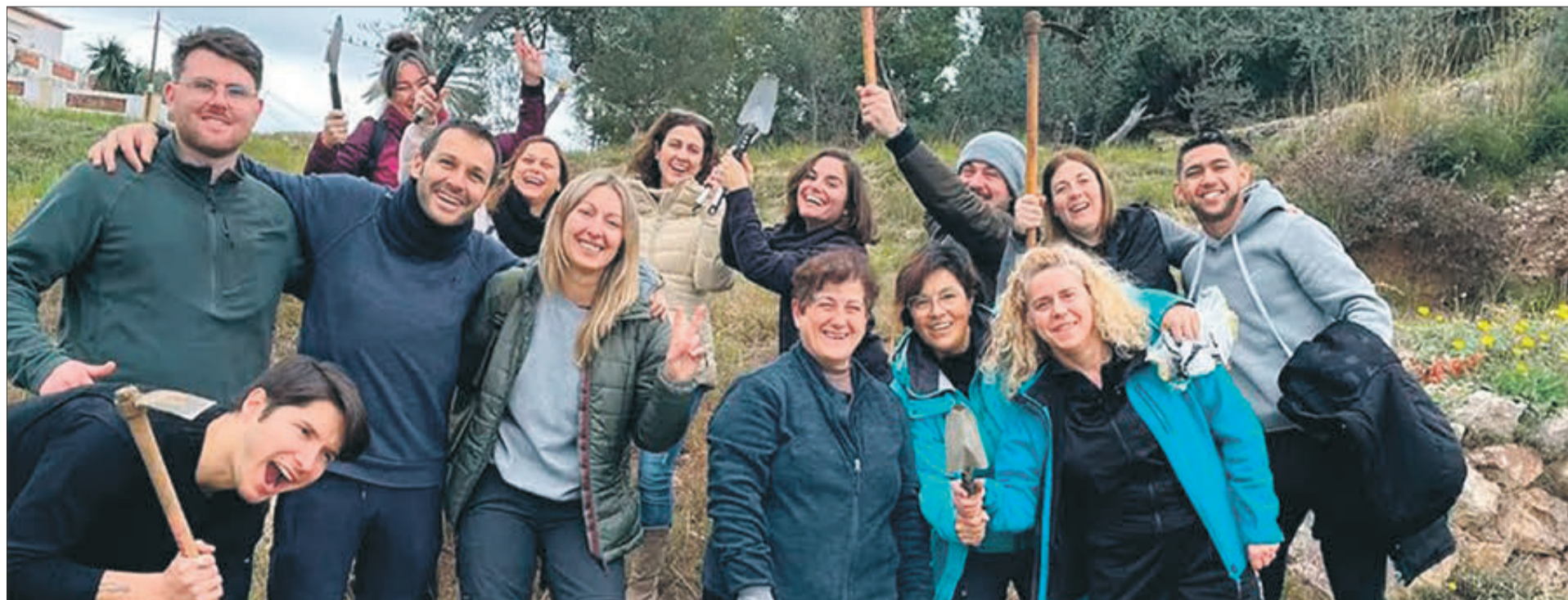
Grup d'alumnes que va participar en la reforestació.

TAMBÉ ALTRES ZONES CASTIGADES PER L'INCENDI DE 2020