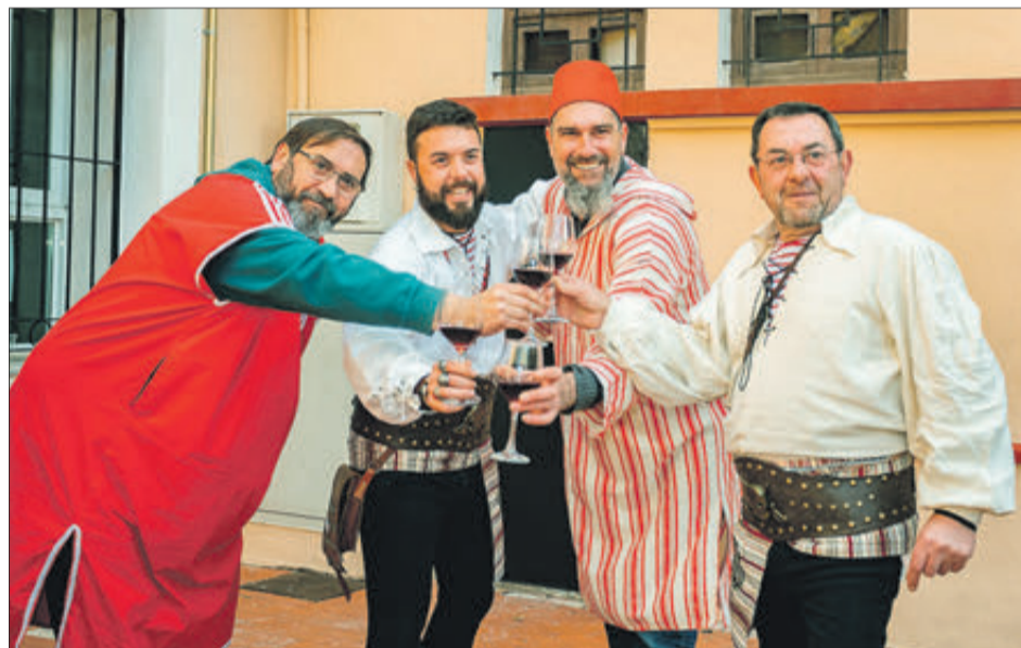
Capitans i ambaixadors de les festes de 2023.