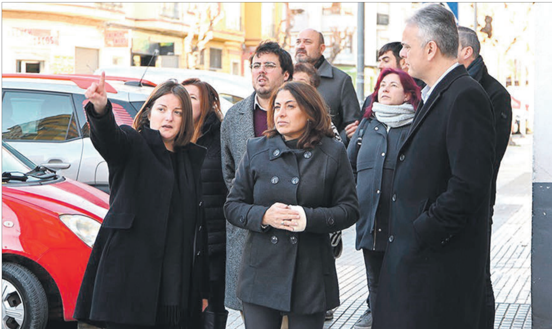
Un moment del recorregut de les autoritats per l'antic barri de l'institut.

S'ACTUARÀ A L'EIXAMPLE DEL VELL INSTITUT DE LA LOCALITAT I MILLORARÀ 359 HABITATGES DE LA ZONA