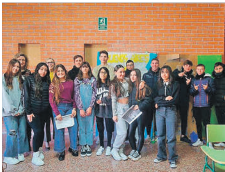
Alumnes de tercer d'ESO de l'IES Gregori Maians.

L'alumnat present de l'IES va participar i va debatre sobre les causes i conseqüències que aquest fenomen social i mediambiental pot tenir en el nostre dia a dia. La ponent, va destacar el gran interès mostrat per aquest grup d'alumnes i va agrair al centre l'oportunitat de "poder establir contacte directe amb un col·lectiu de persones que de segur en el present i en un futur no molt llunyà podran