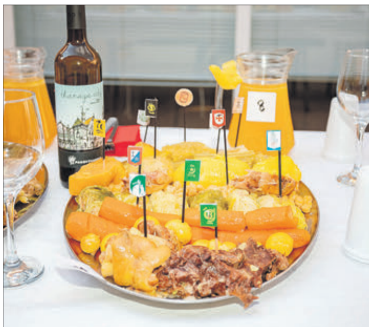
El putxero del primer premi.