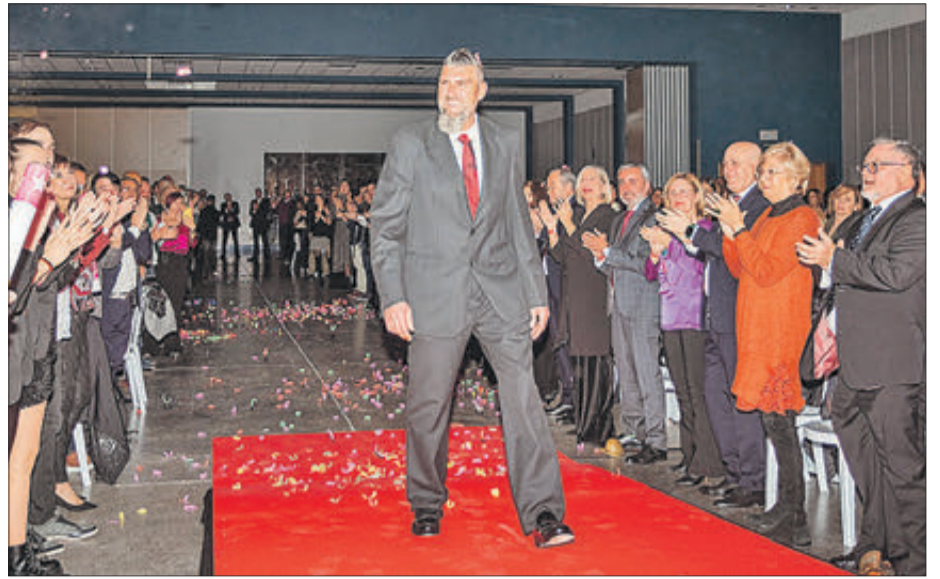
L'Ambaixador moro, Pasqual Mollà.