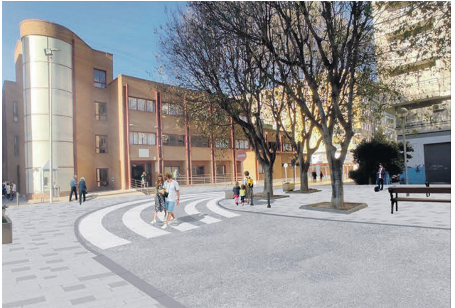
Recreació de com quedaran els voltants del Centre de Salut després de la intervenció.

comprehen els embornals necessaris per a la recollida de les aigües pluvials de superfície i la seua connexió a un col·lector nou que connectaria amb la xarxa general. Un problema històric que finalment quedarà resolt. Seguidament, es col·locarà el vial nou amb els nivells que marquen les voreres perimetral. I, finalment es procedirà al pintat del pas per vianants.