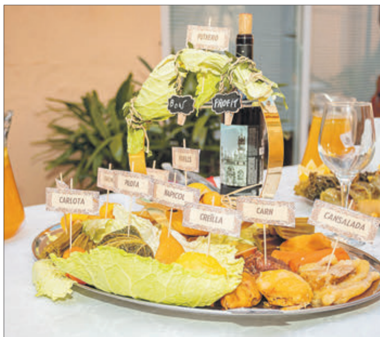
El putxero del segon premi i millor presentació.