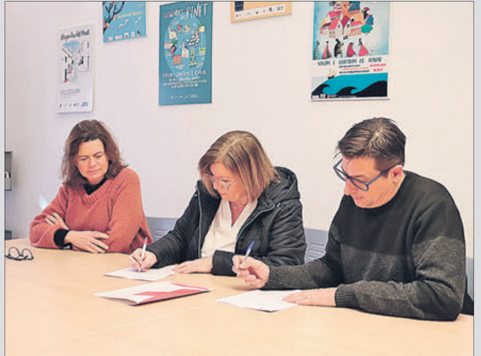
Moment de la signatura del conveni.

El Departament de Biblioteques d'Oliva i Creu Roja han signat un conveni de col·laboració amb l'objectiu d'apropar la lectura i el Servei de Biblioteques als usuaris i usuàries del Pla de Formació de Creu Roja. En aquest sentit, s'ha apostat per un club de lectura fàcil, per al qual el Servei de Biblioteques ha adquirit diversos lots de llibres, els quals es llegiran en la mateixa sessió amb el suport del personal bibliotecari i d'una persona voluntària de Creu Roja. Com bé ha assenyalat la tècnica, "la forma de treball utilitzada en aquesta ocasió és distinta de la de la resta de clubs de lectura, perquè se'ls fa un acompanyament personalitzat i en el moment, s'adapta la dificultat de la lectura als membres i després es comenta conjuntament". Pel que respecta al Servei de Biblioteques d'Oliva també s'ha fet una donació important de llibres a Creu Roja per al seu Programa de Formació.