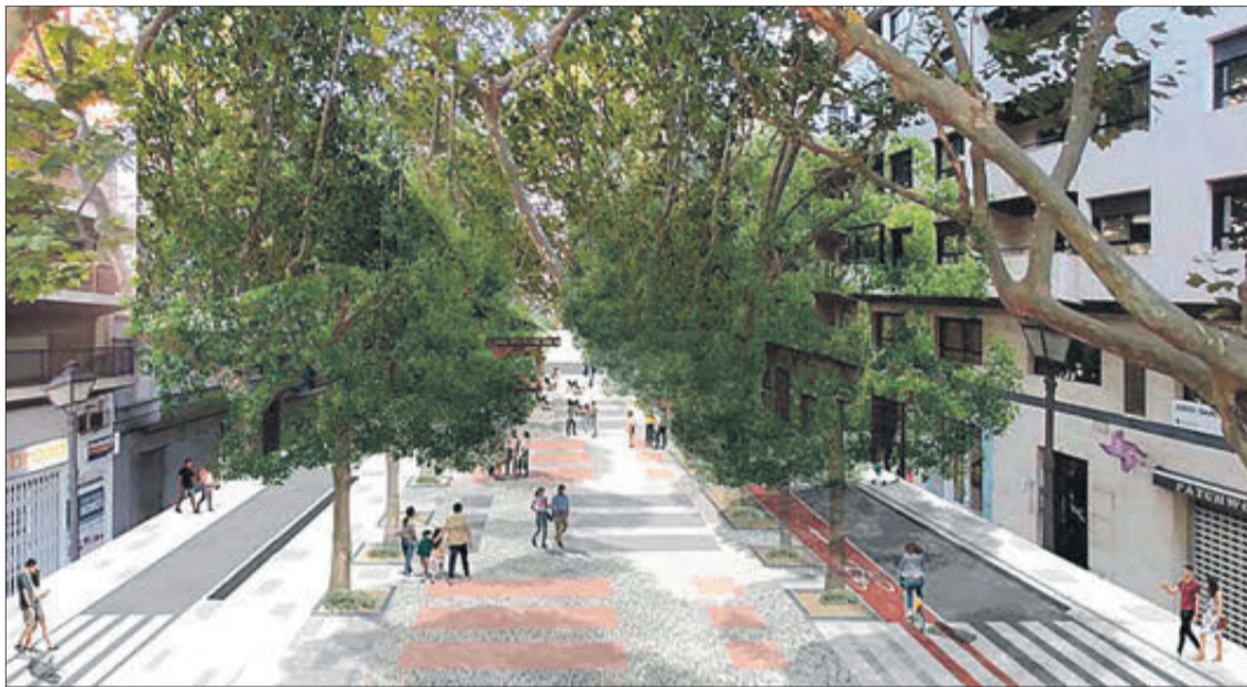
Projecte de remodelació del passeig Gregori Maians.

Amb la signatura de l'acta de replanteig que va tindre lloc a finals de gener, en la mateixa ubicació on s'iniciaran les obres i amb la presència de totes les parts implicades: els responsables de l'empresa adjudicatària, els tècnics municipals responsables de l'obra i de la seua execució i els representants polítics de l'Ajuntament d'Oliva, es va procedir a l'acte protocol·lari.