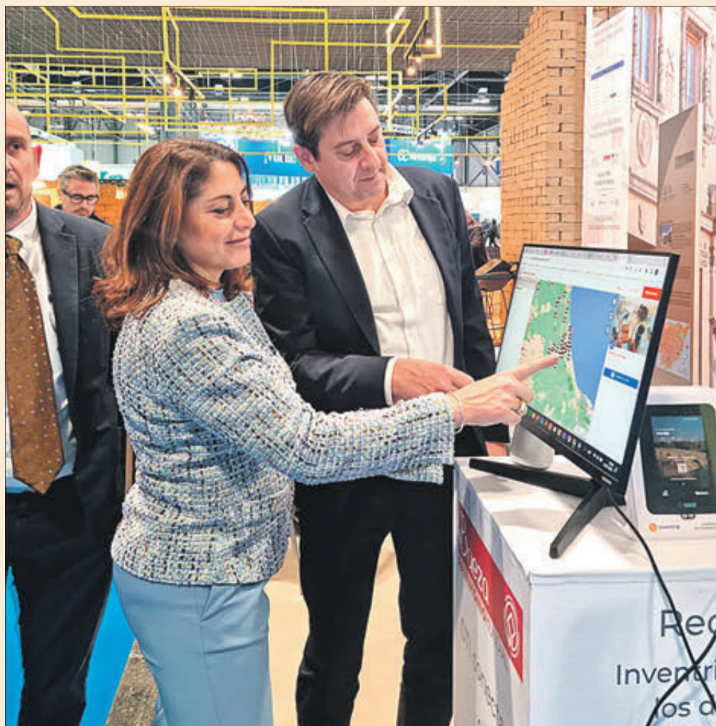
Promoció cultural d'Oliva a Fitur 2023.

La Conselleria d'Educació, Cultura i Esport va iniciar els tràmits per a declarar la casa Elca de Brines Bé d'Interés Cultural el novembre de 2021 i avui, la Vicepresidenta, Consellera d'Igualtat i Polítiques Inclusives i Portaveu del Consell ha anunciat definitivament l'acord pres al Ple del Consell. El decret es publicarà en el Bolletí Oficial de l'Estat i entrarà en vigor l'endemà de la publicació en el Diari Oficial de la Generalitat Valenciana.