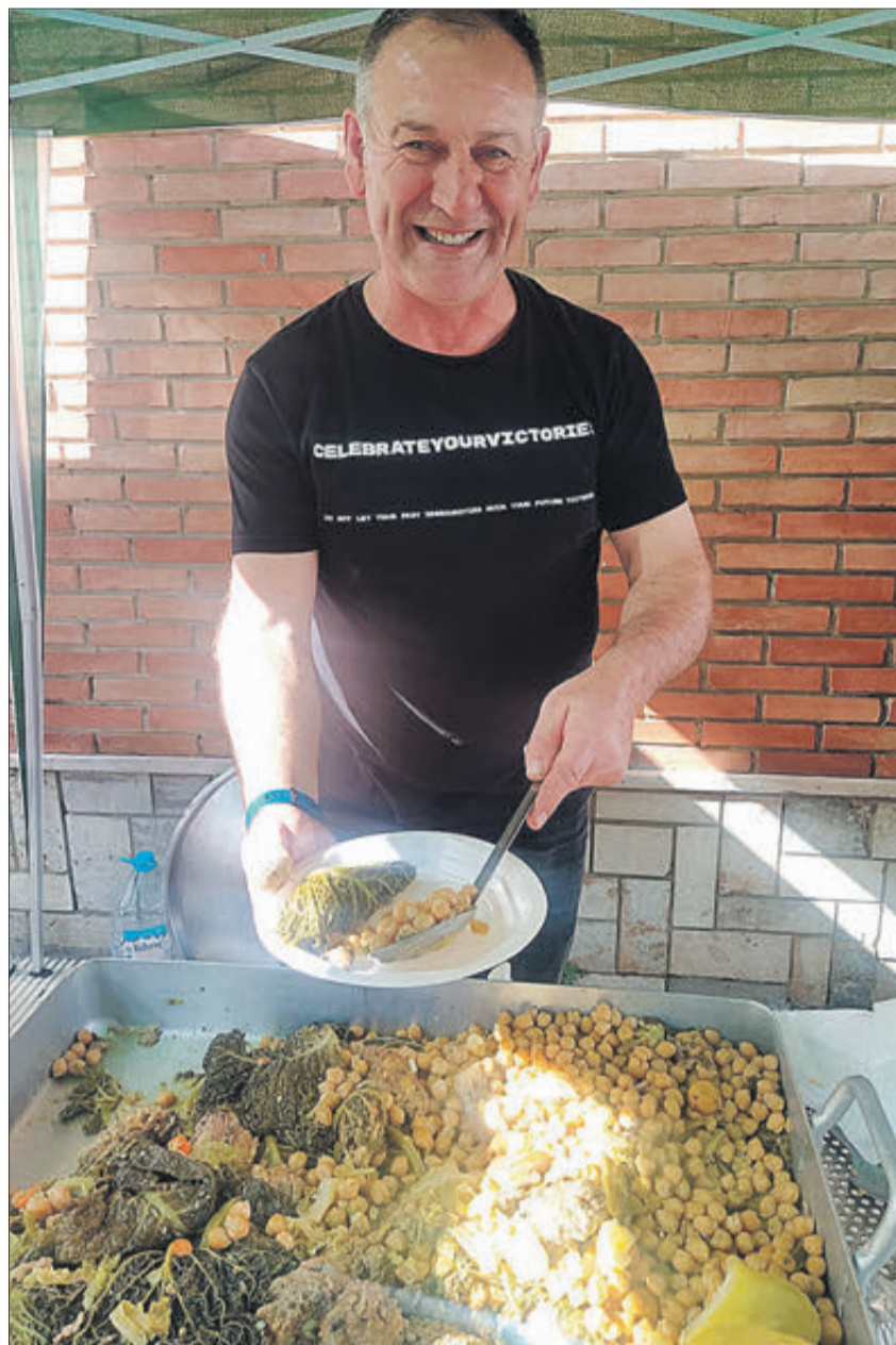
El putxero dels Almoràvits.