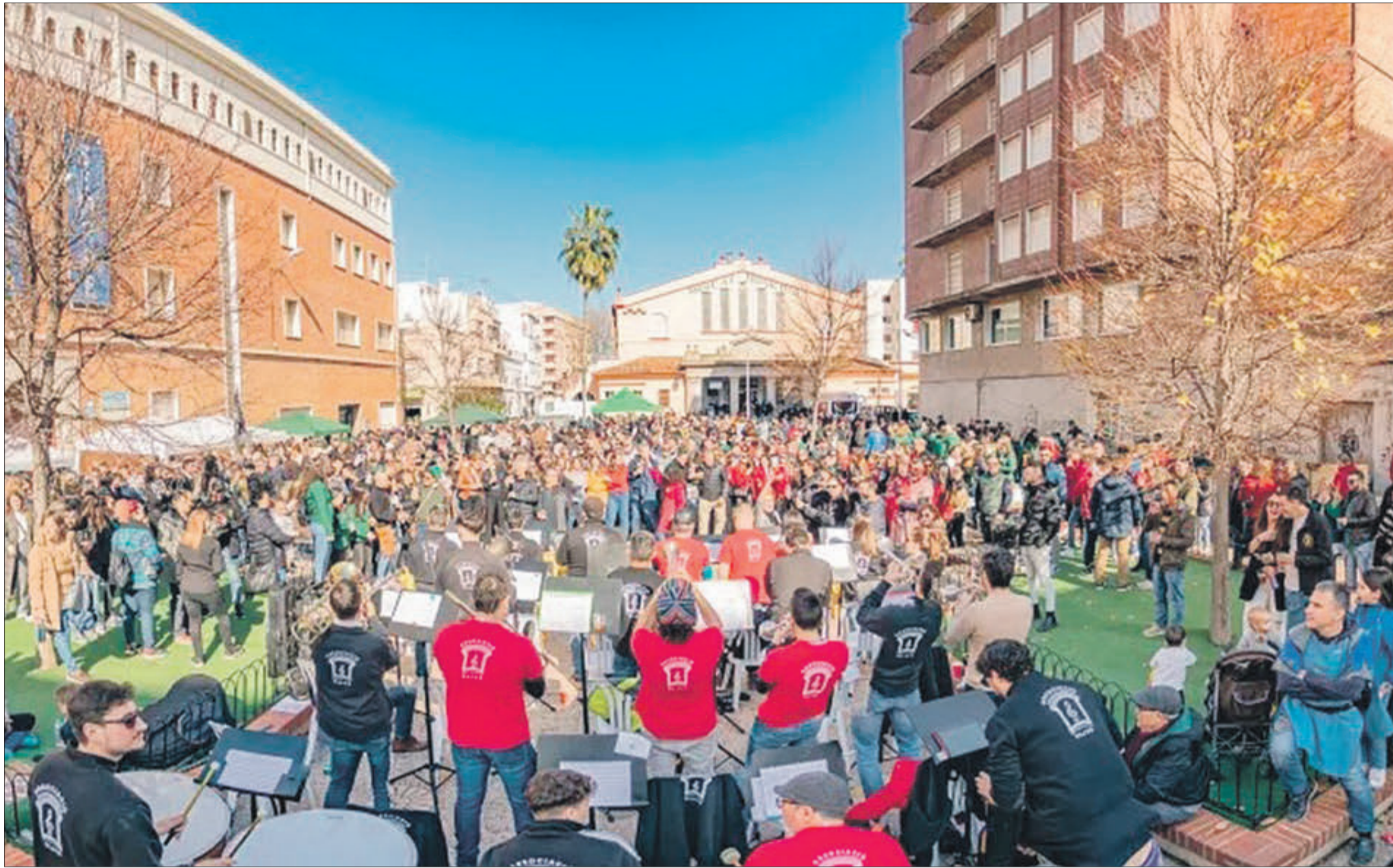
Gran ambient de la Plaça Joan Baptista Escrivà.