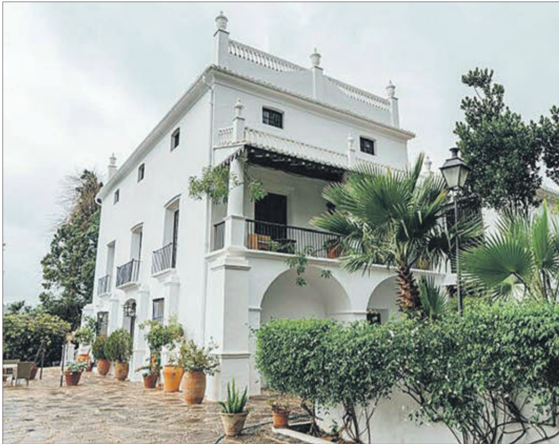
La casa de Francisco Brines, Premi Cervantes 2020.

Per a la declaració de Bé d'Interés Cultural en la categoria de Lloc històric no sols s'ha tingut en compte el valor arquitectònic de l'edifici de l'Elca sinó també altres elements com el seu jardí, el llegat bibliogràfic del poeta, calculat en més de 15.000 exemplars adquirits en llibreries d'arreu del món i col·leccions de revistes literàries i de poesia i la seua col·lecció pictòrica, amb pintures, escultures, fotografies i altres objectes. Tanmateix la casa i el jardí tenen un pes important en l'obra del poeta, on a través dels seus versos es pot comprovar la influència que ha tingut l'entorn