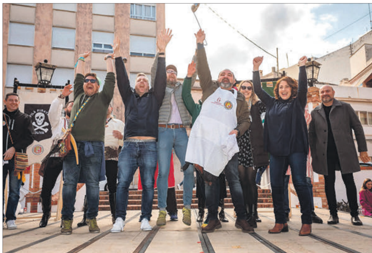
Els Tuàreg celebren la victòria en el concurs de Putxeros.