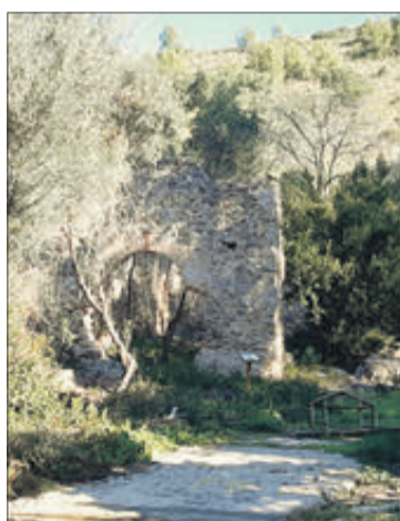
Estat actual de la Casa Calapatar.

Es pot visitar, devorada per la vegetació, a la riba esquerra del riu del Vedat. En efecte, ací estigué el vedat de caça i