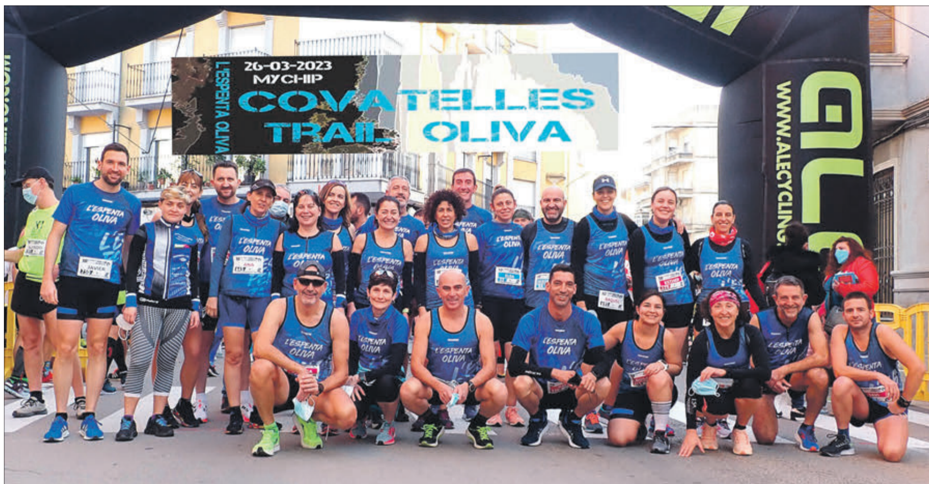
Integrants del club organitzador del trail.