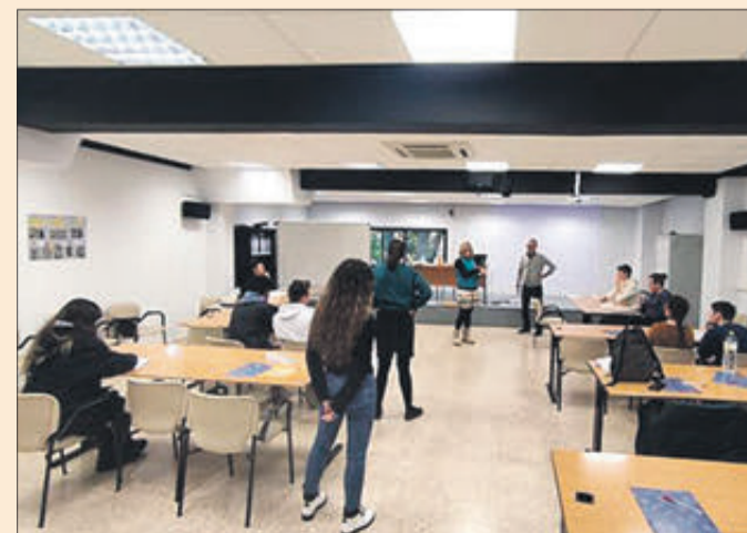
Alumnes del departament de turisme de l'IES Gregori Maians.

Gràcies a les explicacions i el role play els alumnes olivers s'estan preparant per a enfrontar-se al seu futur laboral quan acaben properament l'actual etapa de formació en el centre educatiu.