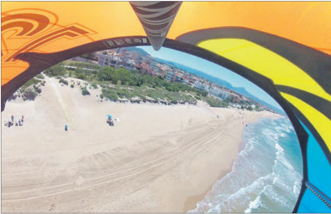
Vista de la platja d'Oliva des d'una línia de kite surf.