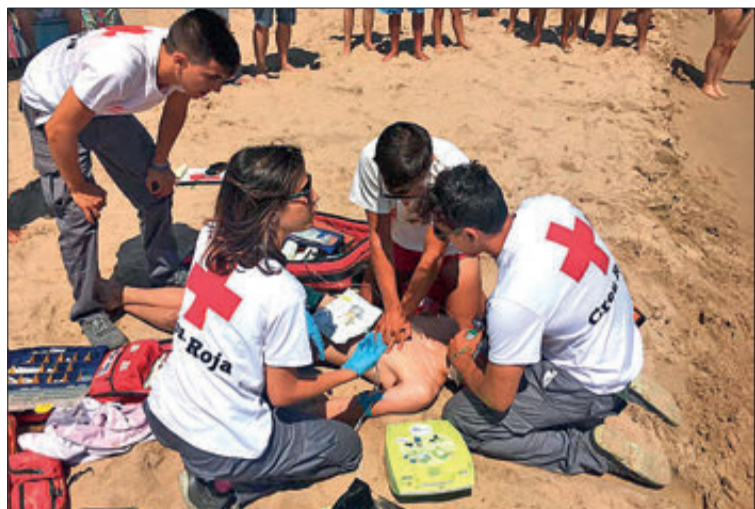
Imatge d'un simulacre de rescat realitzat a la platja d'Oliva.

endins. En cas que això passe, la recomanació és el de nadar cap a un costat per tal d'aconseguir eixir de la zona.