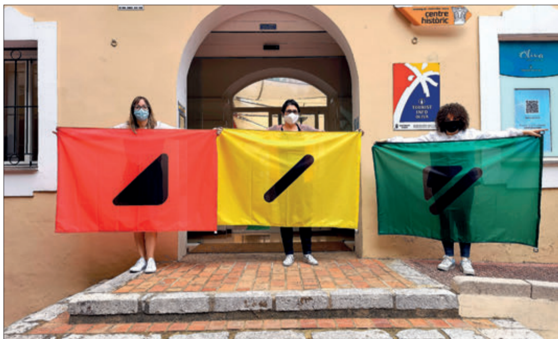
OLIVA, PIONERA EN ADOPTAR AQUESTA MESURA