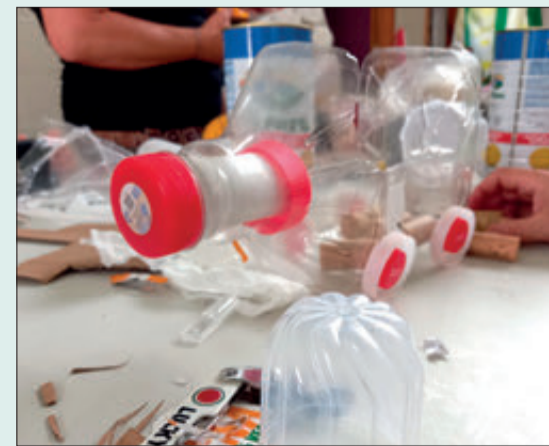
Algunes de les maquetes presentades i el procés per a la seua construcció amb materials reciclats.