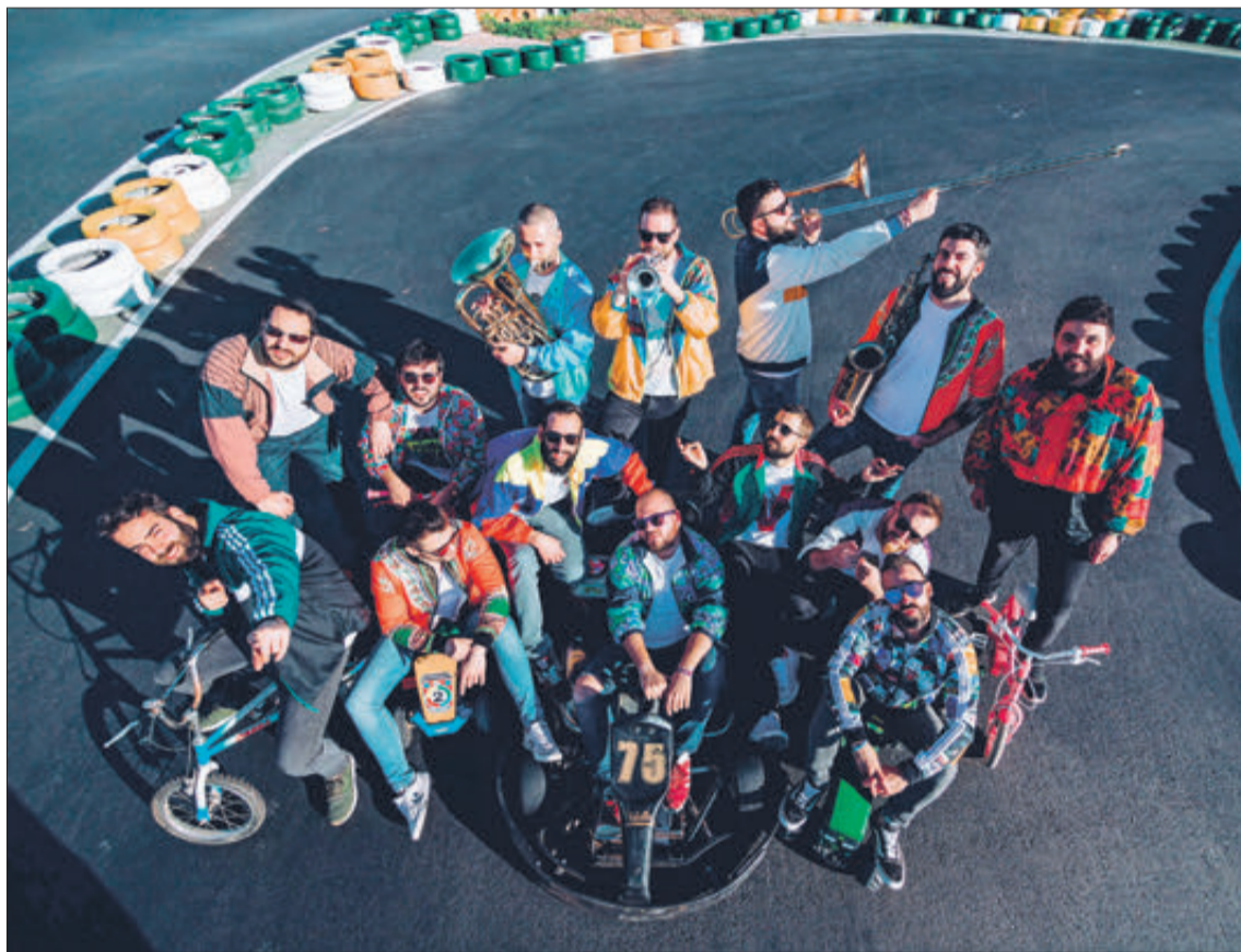
El grup d'Alzira actuarà el proper 18 de juliol a l'aparcament del poliesportiu municipal.

Una setmana després, la música tornarà a ser la protagonista, en aquesta ocasió amb l'actuació del grup La Fúmiga. El concert s'ha previst per al dia 18 de juliol a les 21.30 hores, just quan el capità moro hauria d'estar protagonitzant la seua entrada a la ciutat. L'actuació servirà així per a recordar una de les dates més esperades pels festers d'Oliva,