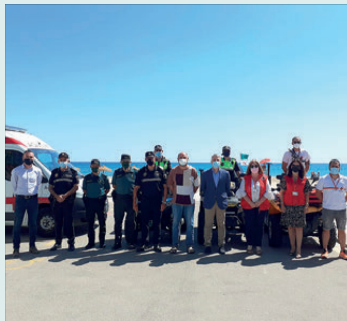
Una imatge amb els diferents cossos que integren el dispositiu.