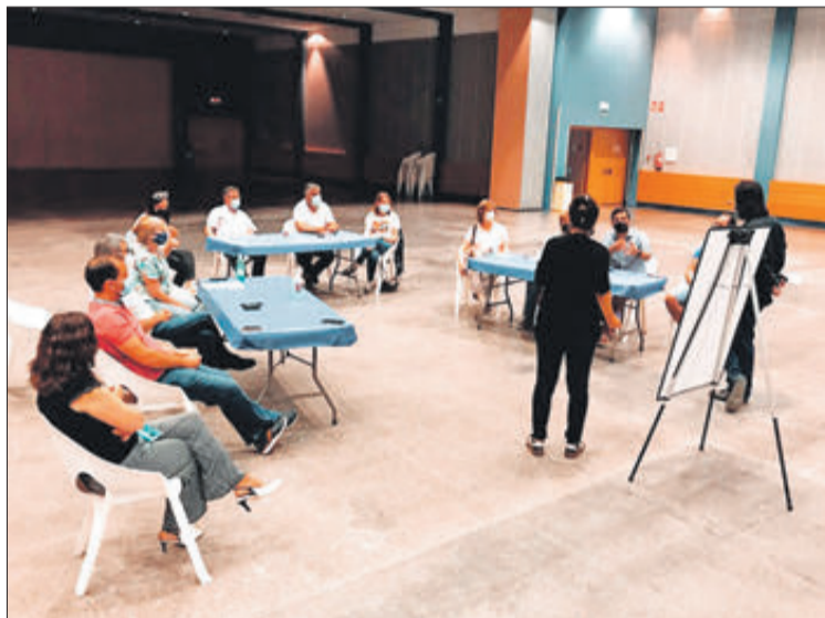
Les jornades van tindre lloc al Centre Polivalent.

Una de les propostes que millor acollida va tindre va ser la de posar en marxa uns pressupostos participatius per tal que la ciutadania pugui triar en quins