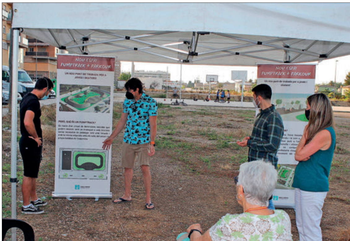
Un moment de l'acte de presentació amb els veïns i usuaris.

En aquest sentit, la intenció del Govern, que ha pressupostat més de 228.000 euros per a aquest projecte, és el de comptar amb tantes veus com siga possible per tal que el resultat siga l'esperat. De moment, la iniciativa ja ha comptat amb aportacions d'experts que apunten, entre altres coses, la possibilitat que hi haja una persona encarregada de regular l'ús de la infraestructura i d'oferir entrenaments a aquells usuaris que hi puguem estar interessats.