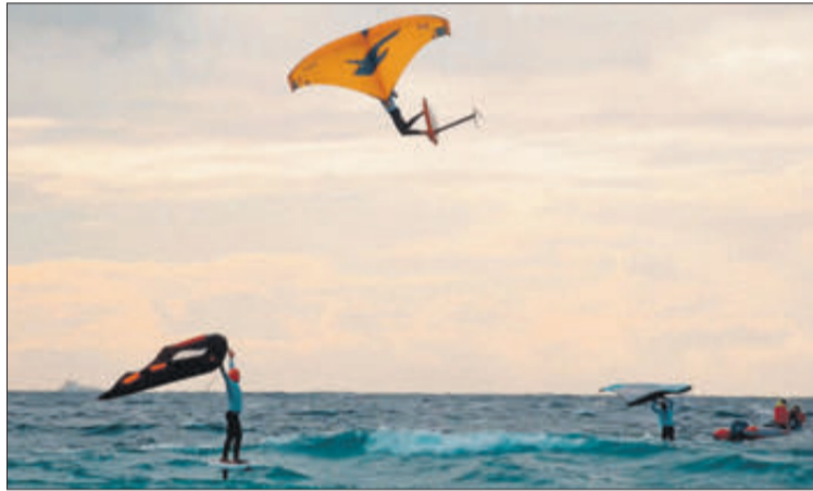
El wing foil és un esport que combina el windsurf amb el kitesurf.

Per la seua part, el wingfoil és una modalitat esportiva a mig camí entre el kite surf, el surf i el wind surf que per-