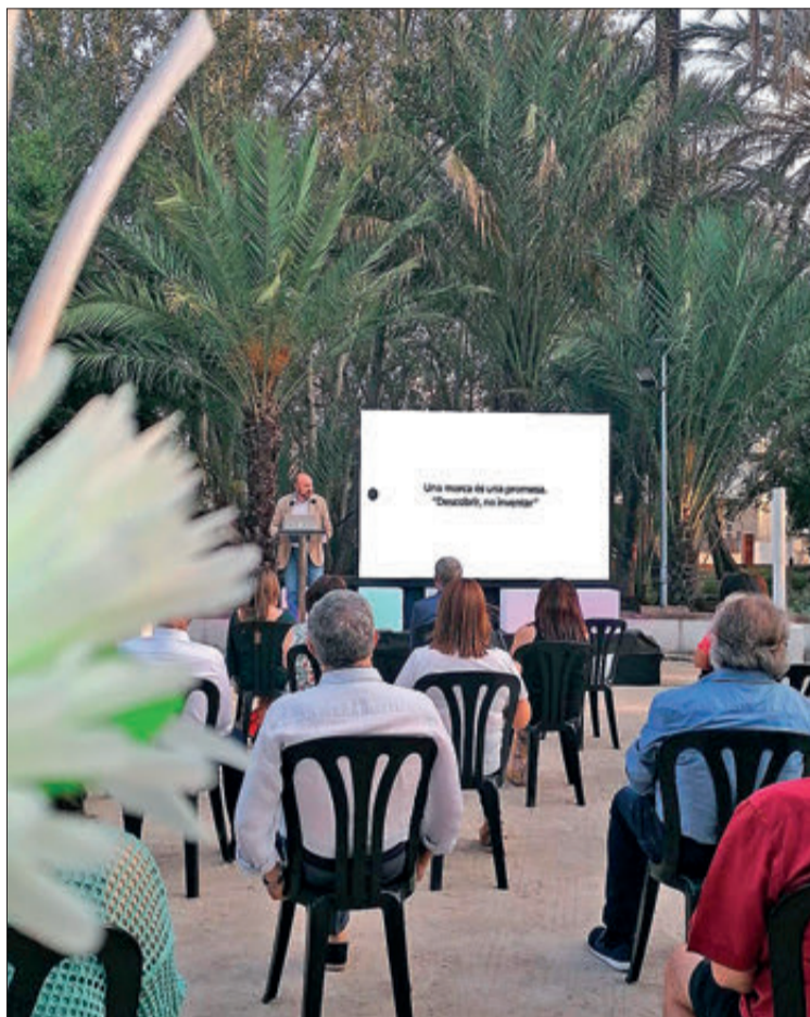
La presentació de la marca va tindre lloc a l'Hort de la Bosca.