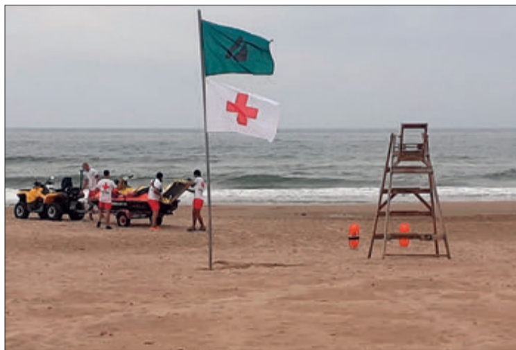
Creu Roja compta amb una vintena de punts de vigilància.

Més enllà de la vigilància i el socorrisme, Creu Roja s'encarrega també del servei del bany adaptat, una iniciativa que des de fa anys permet a les persones amb dificultat de mobilitat disfrutar de la platja. Aquest servei arranca l'1 de juliol amb el començament de la temporada alta i compta amb personal i dispositius especialitzats per a atendre els possibles usuaris, que tenen a la seua disposició, llocs d'aparcament reservats i rampes per a facilitar l'arribada a la platja.