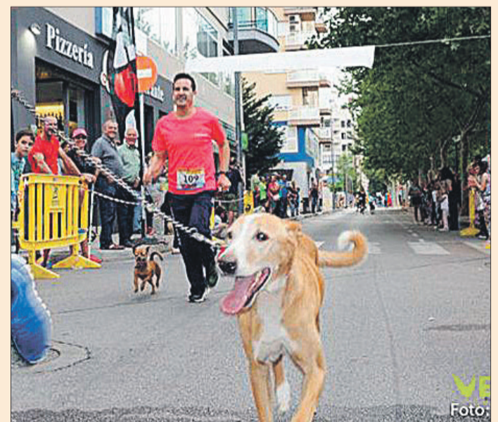
Imatge d'arxiu de la Cursa Solidària d'ADAMA

A més el dia 29 hi haurà un Taller Monogràfic d'Estudio Era, Espacio de Bordado sobre 'Bordado libre floral según la obra de Elisabetta Sforza' amb inscripcions previes al correu hola@estudio-era.com o al telèfon 722435597.