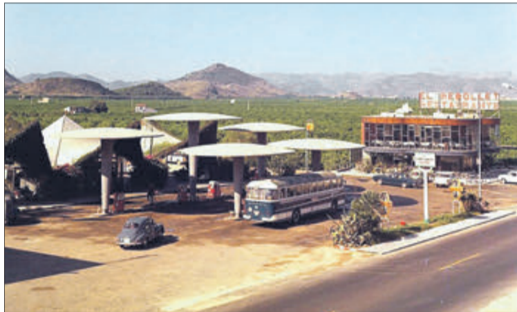
El *Rebollet en una imatge dels anys 70 i en l'actualitat.

de l'època mitjançant bastimentades amb taulons, corretjans per a pujar els cabassos de formigó a la part superior dels bolets i tot el forjat de ferros que es