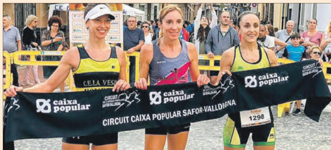
El podi de categoria femenina.