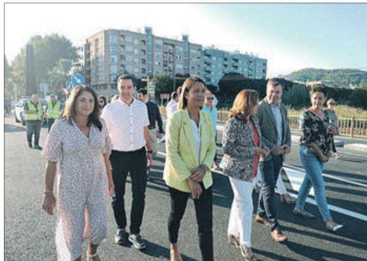
Autoritats en l'acte d'obertura del viari.

Per la seua banda la portaveu del PSOE expressava la seua satisfacció "és un dia gran per als veïns d'Oliva i Piles. Finalitza per fi una necessitat. Eixe vial va tindre molts accidents. El millor és veure com progressa la nostra ciutat. La legislatura passada, a pesar de ser complicada per la pandèmia, ens van centrar en millorar l'aïllament de la ciutat i la manca d'infraestructures que teníem.