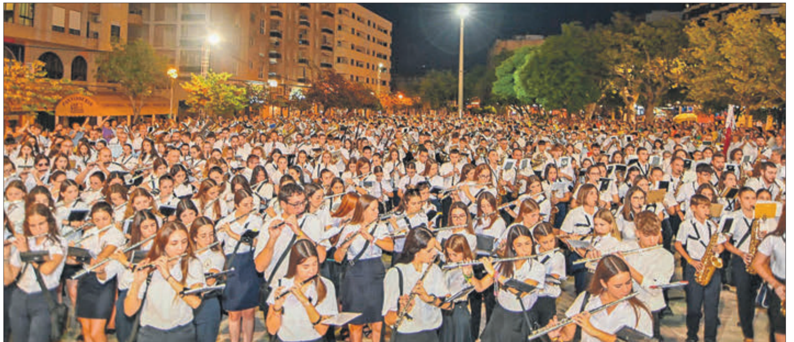
Els músics durant l'acte.