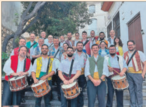
Components de la premiada Colla Sarabanda.

A més, la Associació Cultural Centelles Riusech va explicar que l'acte oficial de lliurament de la XII Distinció Honorífica va tindre lloc el passat divendres 20 d'octubre, a les 20.00 hores, en les instal·lacions del Centre Polivalent de la localitat. L'esdeveniment comptava, a més, amb un concert a càrrec de l'Orquestra Clàssica d'Oliva de la A.A.Musical d'Oliva.