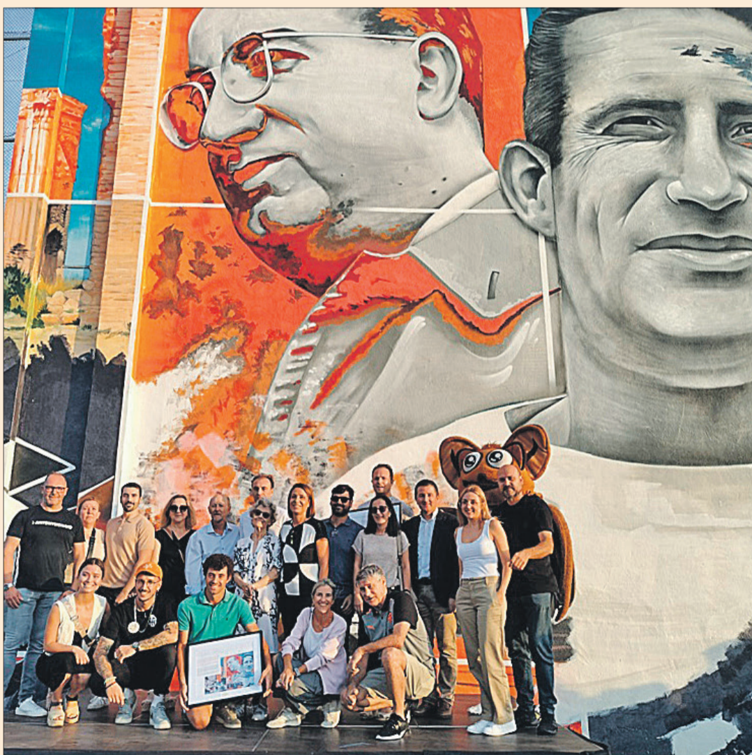
Inauguració del mural.

l'arribada tots els ciclistes van rebre la medalla commemorativa i van poder gaudir de la pasta party a l'Hotel Oliva Nova Beach & Golf Resort.