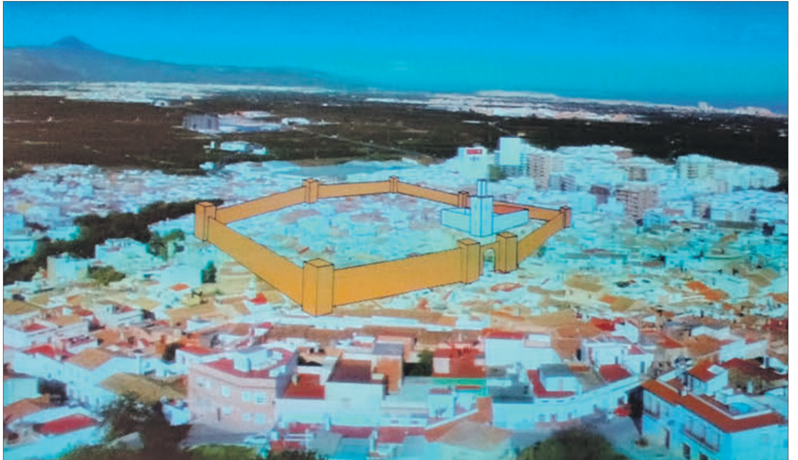
Ubicació de l'Oliva andalusina, segons els estudis que s'han dut a terme.