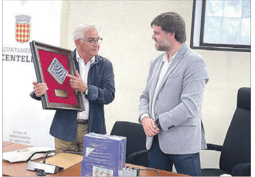
Membres de l'associació Cultural Centelles i Riusech a Osona i un moment de la recepció municipal.