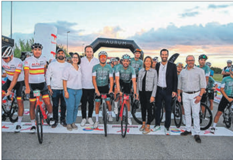
Moment previ a l'eixida de la prova.

Rivals i ara amics, Alberto Contador i Joaquim "Purito" Rodríguez van gaudir d'un matí de ciclisme amb tots els aficionats i van arribar junts a la línia d'arribada amb un atapeït esprint. Tots dos van ressaltar el bon ambient que van poder viure tot el dia al costat de tots els participants. "Ha sigut espectacular, el dia ens ha acompanyat en tots els sentits, i això és el que ens agrada ara que ja estem retirats, gaudir amb la gent", va declarar Alberto. Per part seua, Joaquim "Purito" Rodríguez va voler destacar el recorregut pel qual tantes vegades ha entrenat en la seua època de corredor professional. "Al principi per noms no em situava, però