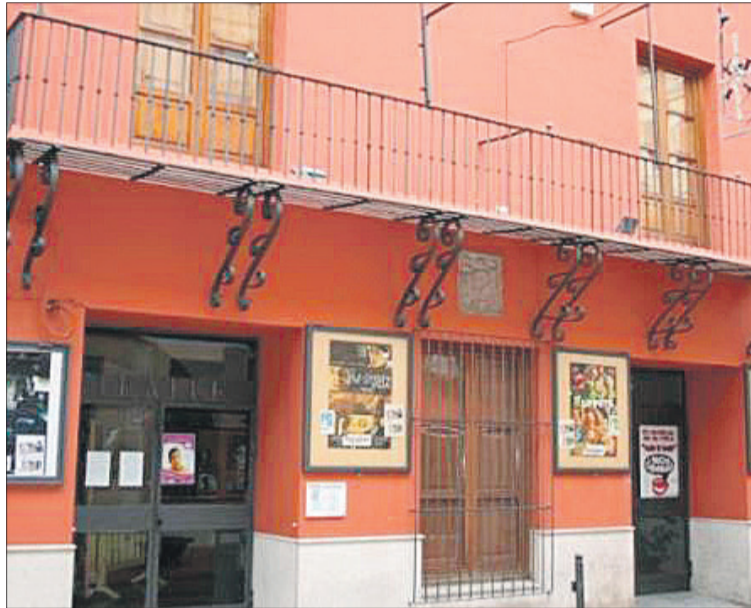
Interior de la sala de projeccions i exterior de l'edifici.