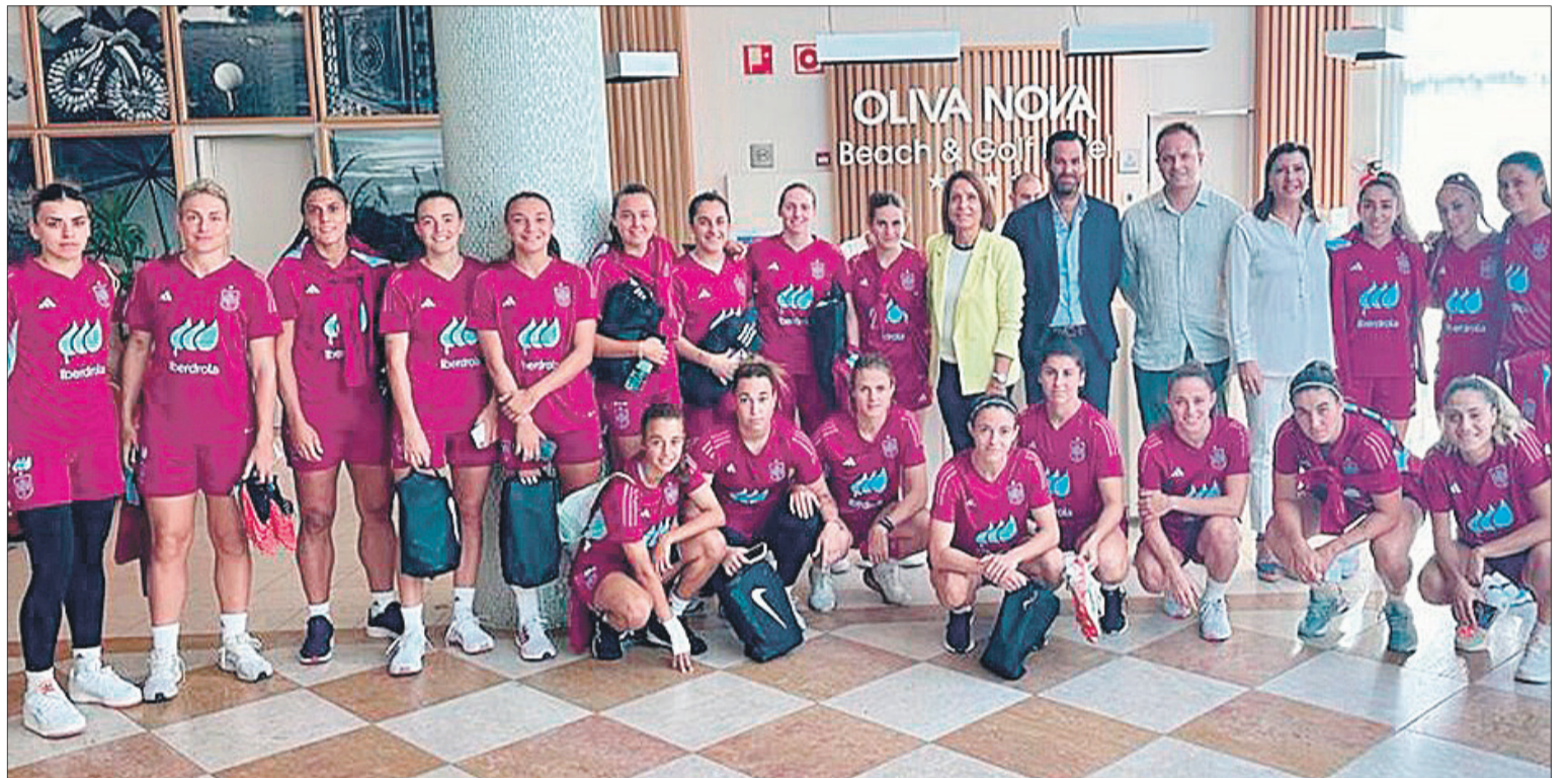
La selecció espanyola femenina de futbol, a les instal·lacions de Oliva Nova.