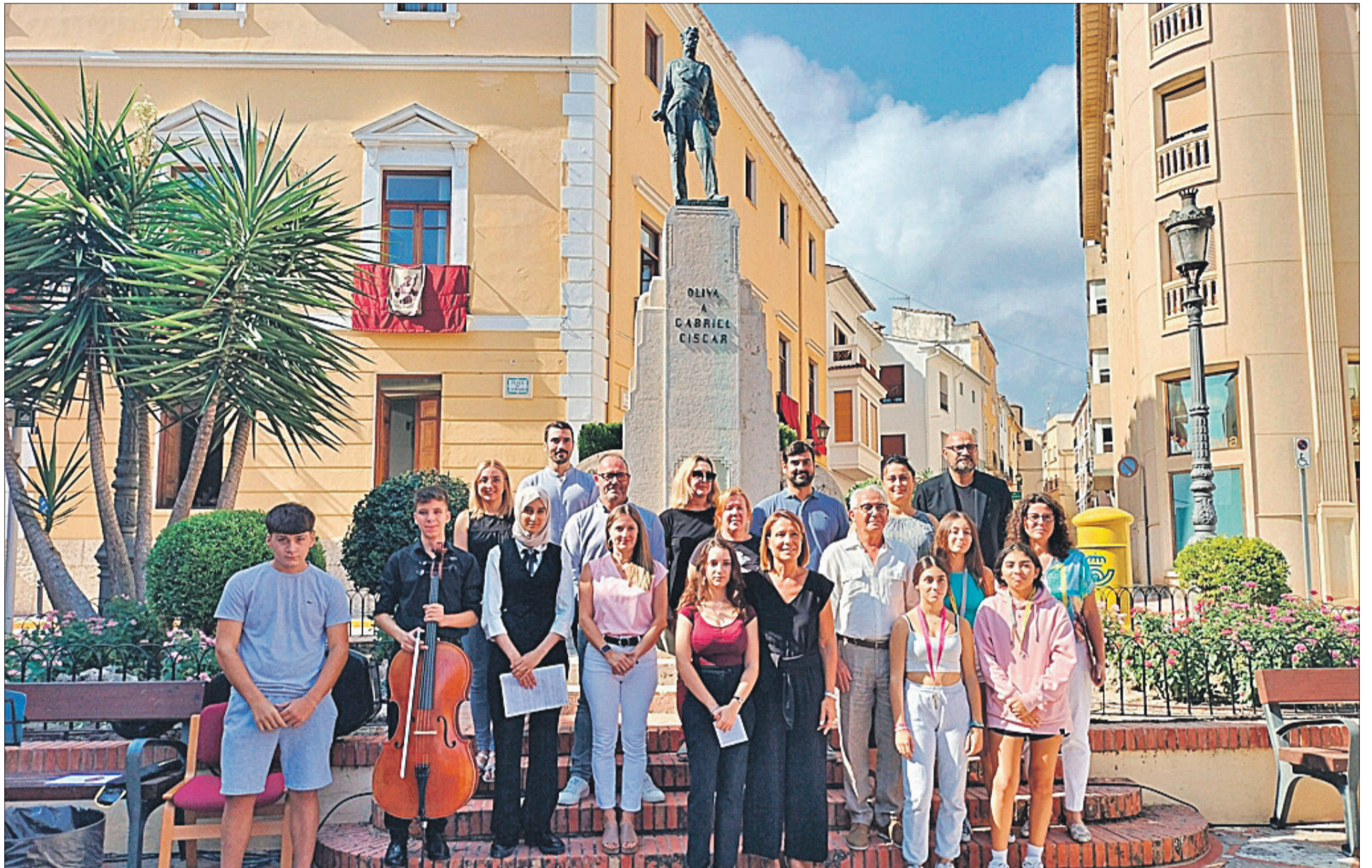
Al final de l'acte es va posar davant el monument a Gabriel Ciscar.