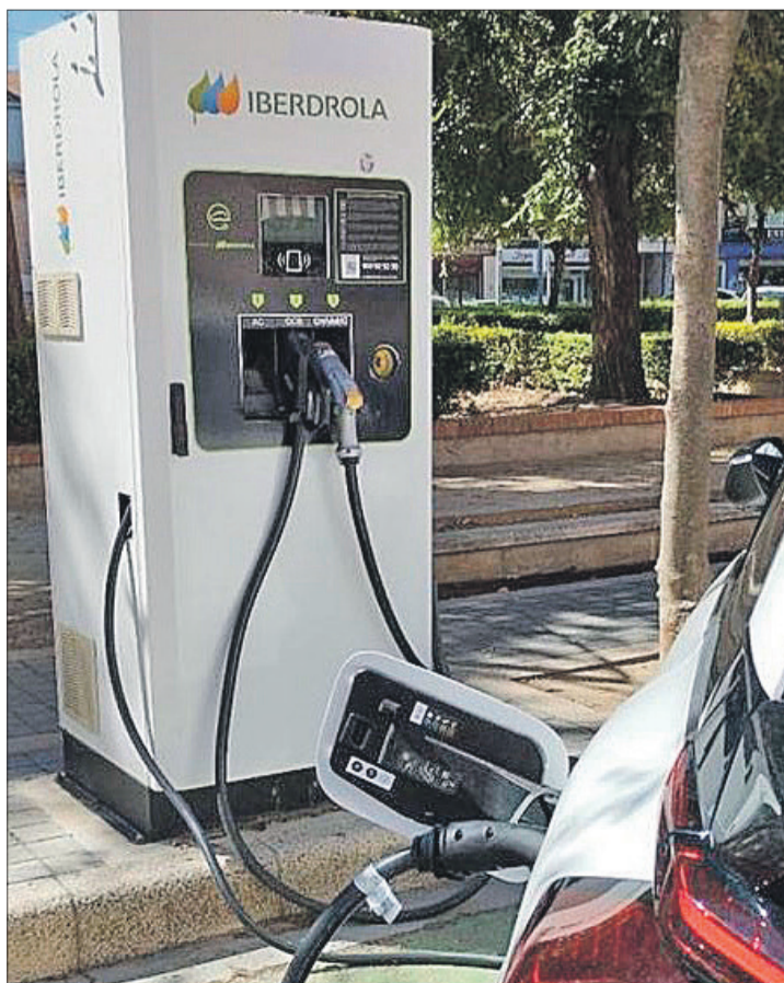
Punt de recarrega del carrer Padre Antonio Salelles.

EL SERVEI S'HA PRESTAT ALS USUARIS DE MANERA GRATUÏTA