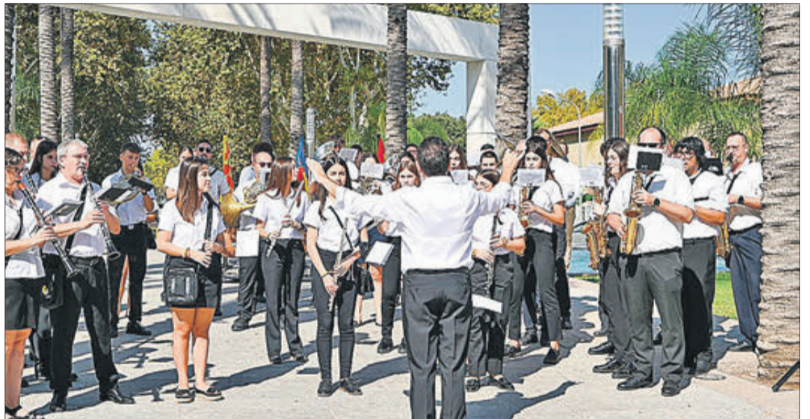
La música no va faltar en la celebració del Dia de la Comunitat.