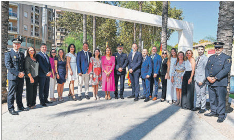
Imatges de la celebració del 9 d'Octubre a la ciutat.