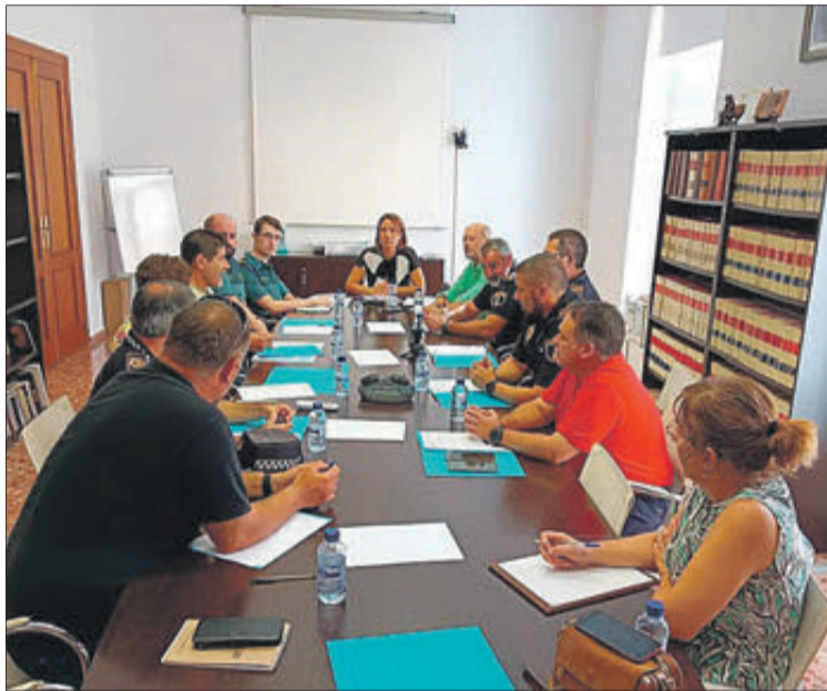
Imatges de la reunió i d'un camp de tarongers.