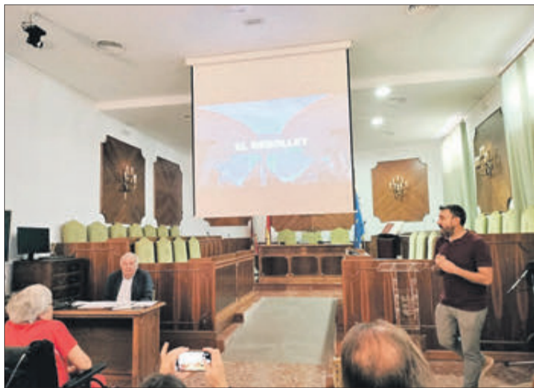
Xarrada sobre la construcció i acte de col·locació de la placa.

Les imatges són espectaculars amb les peculiars maneres de construcció