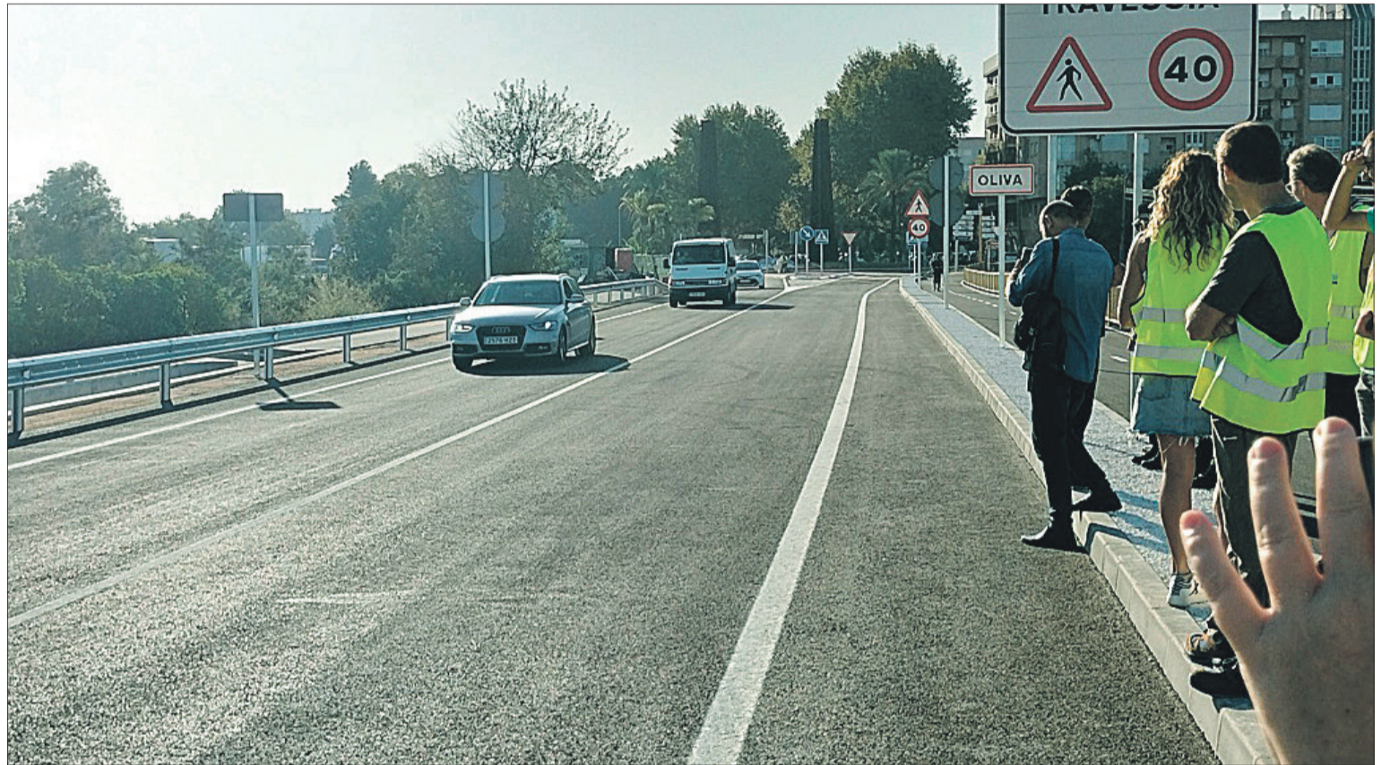
Vehicles transitant per la CV-670 després de ser oberta al trànsit.

Cristina Fornet va dir que "des de Piles també estem molt contents perquè aquesta carretera era supernecessària. És molt el trànsit que la travessa i era una necessitat palesa. Estem de doble celebració, perquè tenim també el compromís de Reme per a fer el desitjat pont d'interconnexió amb les platges del sud, a més d'obrir la mateixa carretera. Vull agrair la paciència dels usuaris perquè s'hagen pogut fer les obres i