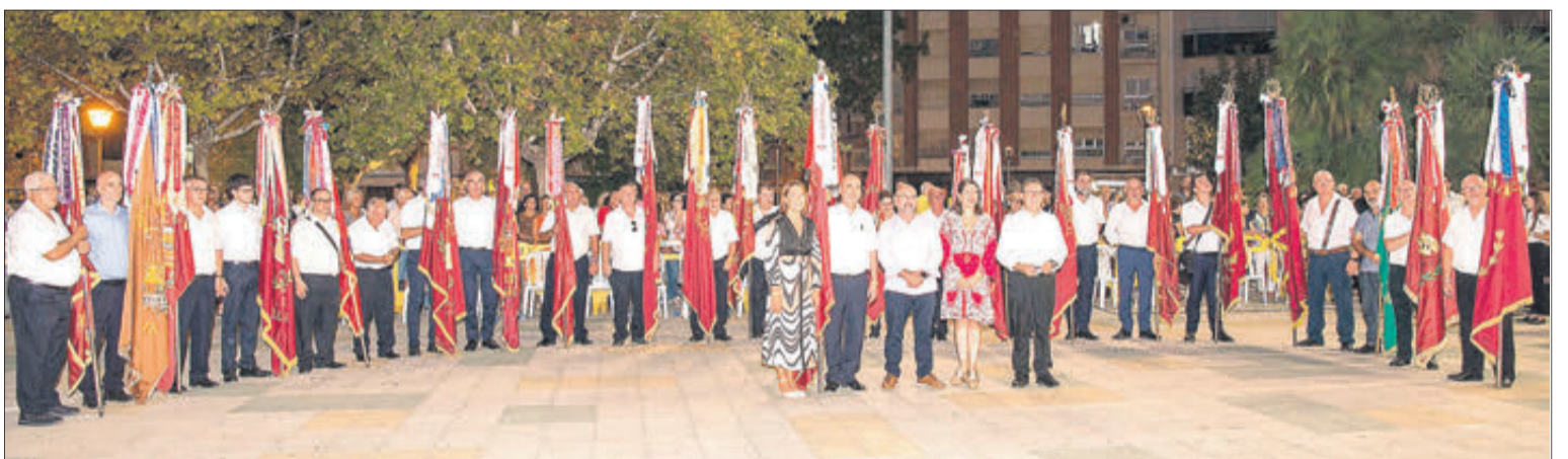
Les banderes de totes les societats musicals participants.