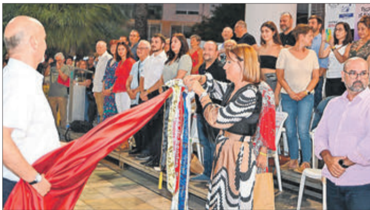
Col·locació del corbatí a la bandera de la banda d'Oliva i delegació local.