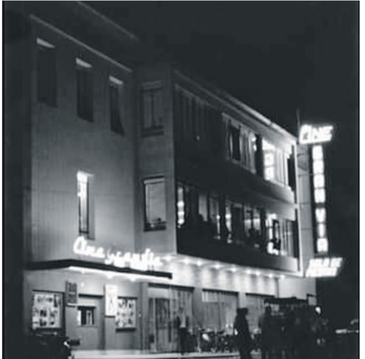
Una imatge antiga del cinema Olímpia.

L'EMPRESA CONCESSIONÀRIA COMUNICA EL TANCAMENT DE LA SALA