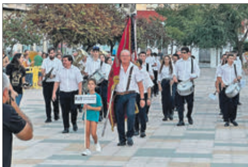
Les bandes de Tavernes, Xeresa i Ador