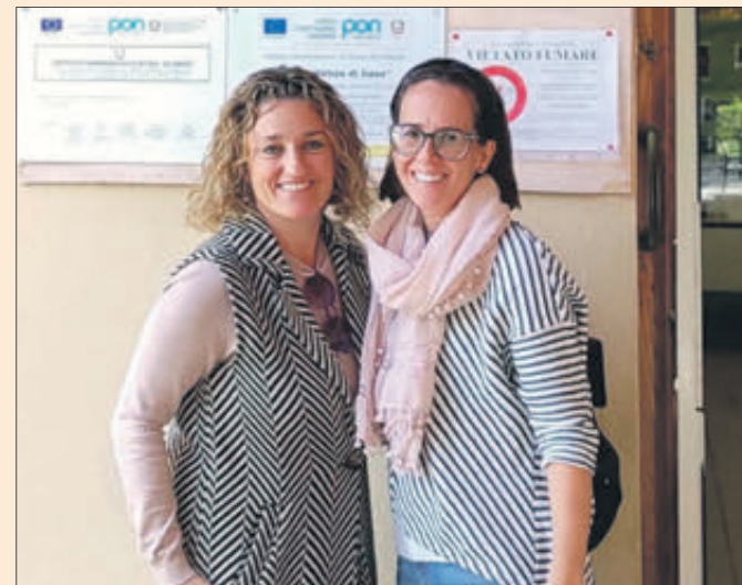
La directora del CEIP Santa Anna, a Itàlia.

"Estem en la primera escola pública on s'aplica aquest mètode i on les mestres estan formades i reglades per a impartir aquesta metodologia. Són experiències enriquidores que fan que la nostra escola, si cap, obrirà més la seua ment i la de la seua comunitat educativa", ha manifestat.