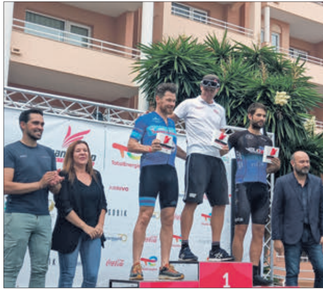
Primers classificats del Gran Fons masculí.

El bon temps va acompanyar la jornada ciclista en la qual va destacar la gran organització de la prova i tot el traçat, molt més dur que en edicions anteriors, però que van poder acabar molts dels corredors que van iniciar la mateixa.