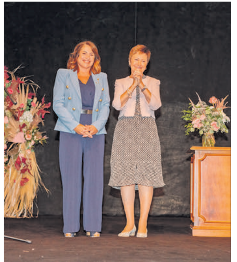
Mestre, emocionada, al costat de l'alcaldessa