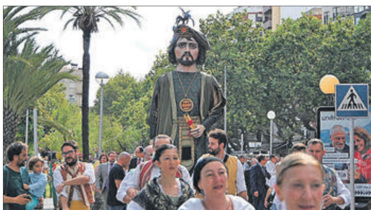
La corporació municipal i la processó cívica amb el gegant Serafí.