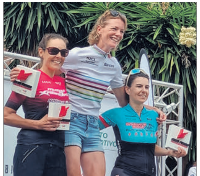
Podi femení del Mig Fons.