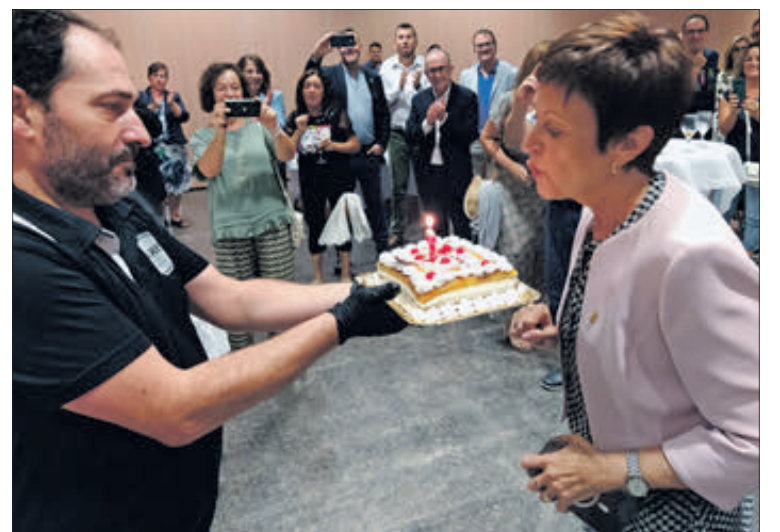
L'acte va coincidir amb el dia de l'aniversari de l'homenatjada.