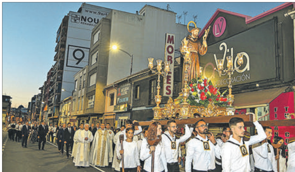
La imatge de San Francisco durant la processó.