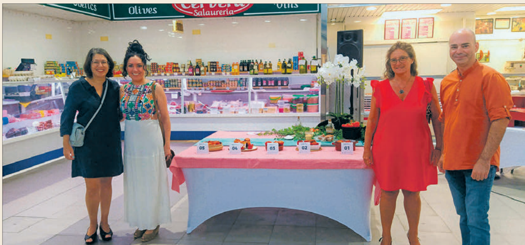
El Jurat amb les pebreres participants.