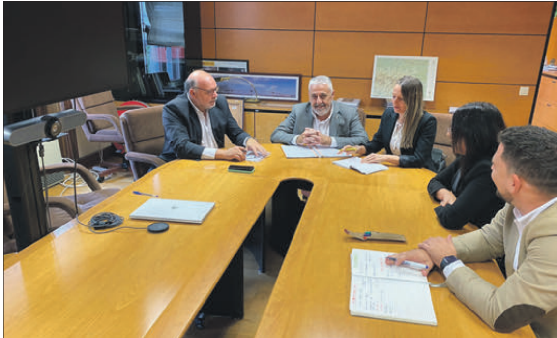
Un moment de la reunió mantinguda amb el director general de carreteres.

Aquest anhelat projecte consistirà en la supressió de la intersecció entre la N-332 i la CV-678, un dels punts negres de les carreteres de la Comunitat; i l'execució d'un nou enllaç a través d'un pas elevat. S'eliminaran a més nombrosos accessos directes existents des de