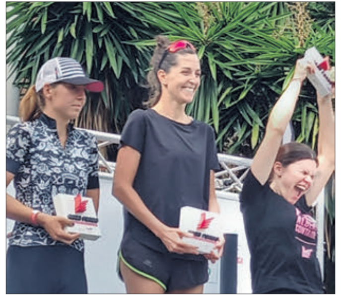
Podi femení del Gran Fons.