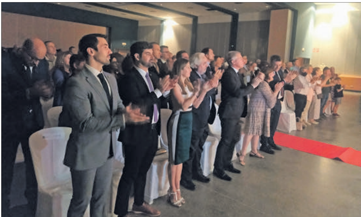
Vista general de la sala i els assistents, posats en peus, aplaudeixen el nomenament.