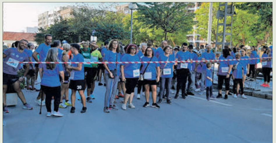
Els participants en la prova, a punt d'iniciar el recorregut.