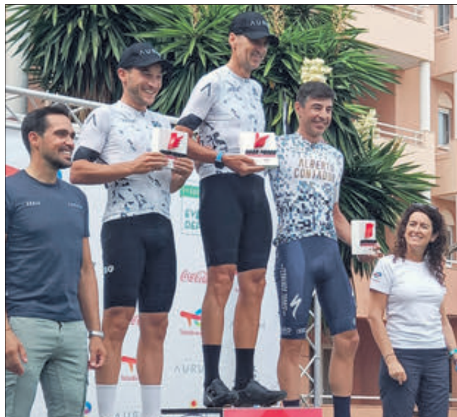
Primers classificats del Gran Fons masculí.