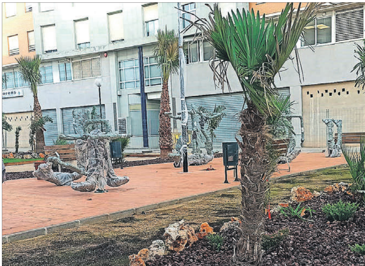
Aspecte de l'espai bio saludable.

L'objectiu és adreçar aquest projecte als joves olivers, especialment als skaters, ciclistes i que segueixen altres modalitats esportives semblants en pista esportiva que tindrà també un espai d'esbarjo per als usuaris i serà tot un referent no tan sols a la comarca de la Safor sinó en l'àmbit de tota la Comunitat Valenciana.