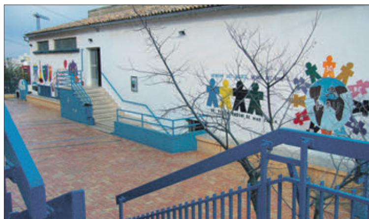
Vista general CEIP La Carrasca.

Aquesta necessitat ve motivada per la voluntat de la regidoria de millorar les condicions de seguretat en els treballs de manteniment i neteja de les cobertes dels esmentats centres educatius. Les línies de vida en coberta inclinada són uns mecanismes complementaris a la