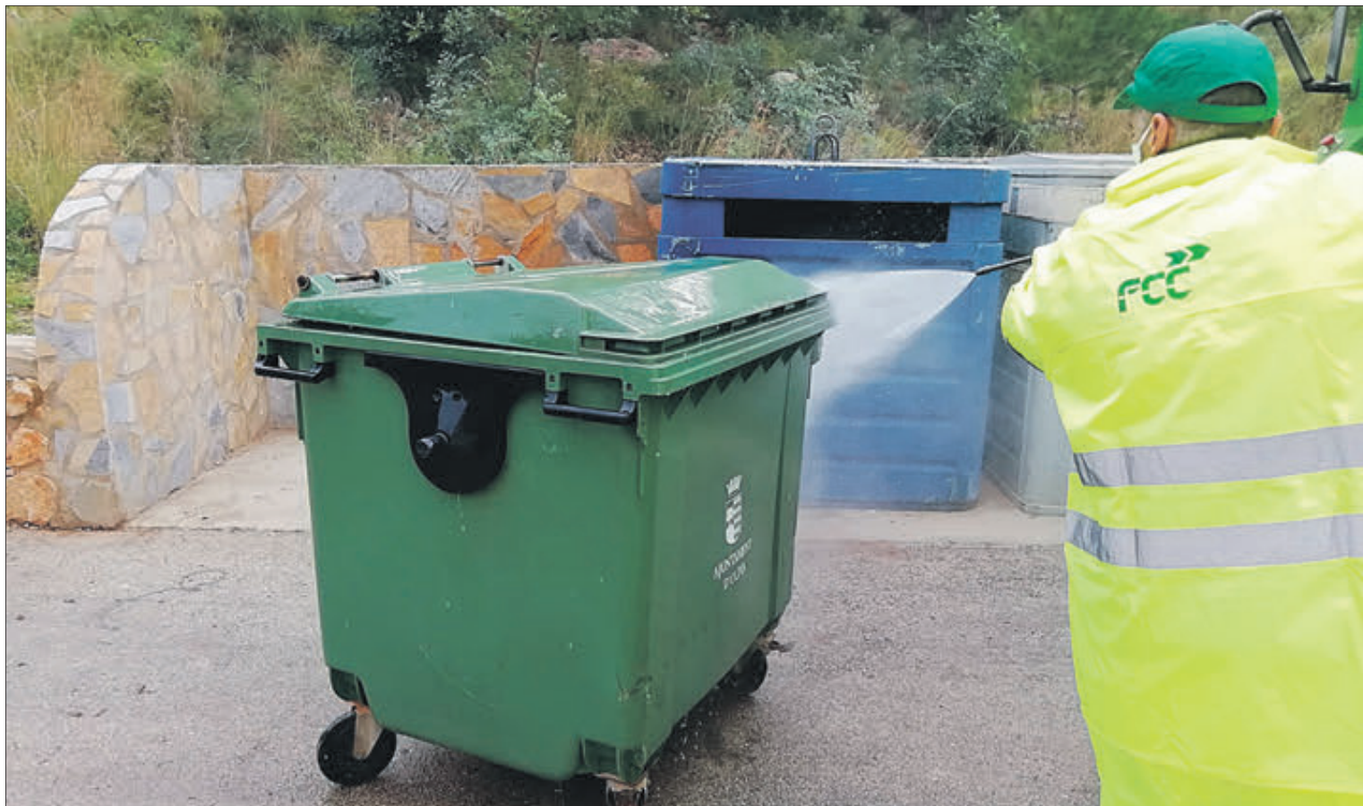
Un operari fa tasques de neteja en una zona de contenidors.

Com a novetat a destacar, l'Ajuntament d'Oliva ha dissenyat un nou model de residus que inclou la recollida domèstica porta a porta, de forma parcial en algunes zones, amb previsió d'ampliació, i comercial, industrial i grans productors. A més a més, la recollida de residus a la que es fa referència en el nou contracte s'esdevé segregada en fraccions: orgànica, paper i cartró, envasos lleugers, vidre, resta i bolquers, teixit sanitari i excrements d'animals domèstics. Per poder controlar de forma exhaustiva aquesta recollida fraccionada i garantir la neteja viària efectiva, el nou plec tindrà en compte els múltiples esdeveniments culturals, socials, esportius i festius de la ciutat, els mercats municipals i ambulants, xiringuitos a les zones marítimes, quioscos i altres zones d'oci, especialment en temporada estival, les