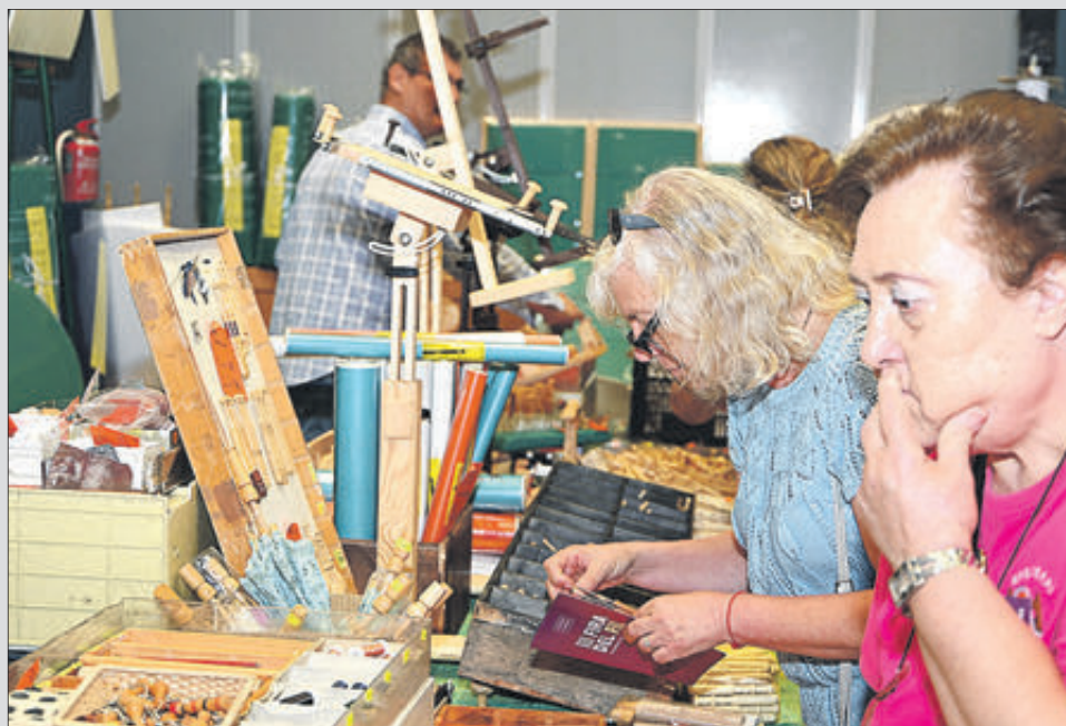
Boixeteres participants en la Fira del Fil.