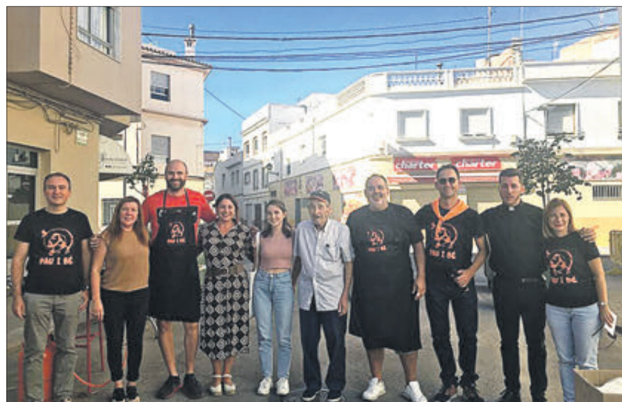
Els guanyadors del concurs de paelles i el jurat.

EL PRIMER PREMI DEL CONCURS DE PAELLES FOU PER A LA FAMÍLIA MORATÓ LEÓN