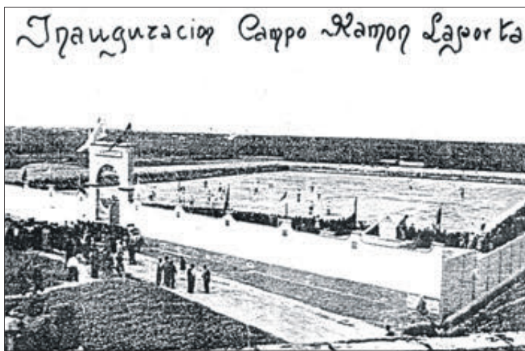
Inauguració del camp.