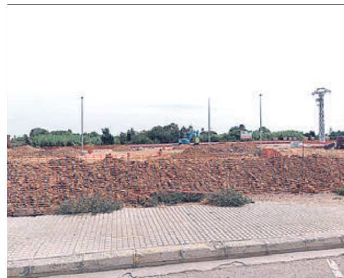
Obres de construcció del Pump Track.