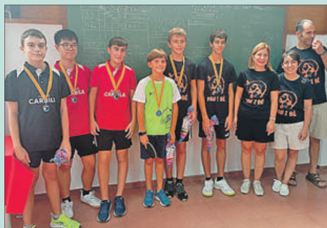
Guanyadors XXI campionat tennis taula festes de Sant Francesc.