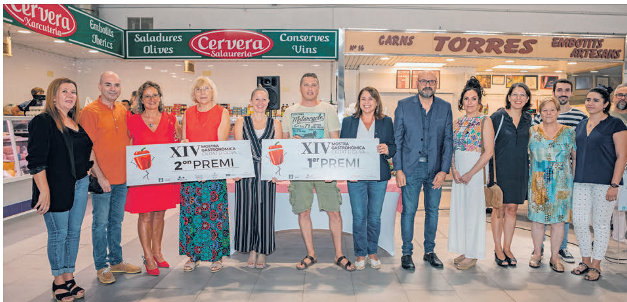
Foto de 'família' del concurs de Pebreres farcides d'Oliva.

VA SER EL GUANYADOR DEL CONCURS ORGANITZAT PEL DEPARTAMENT MUNICIPAL DE TURISME