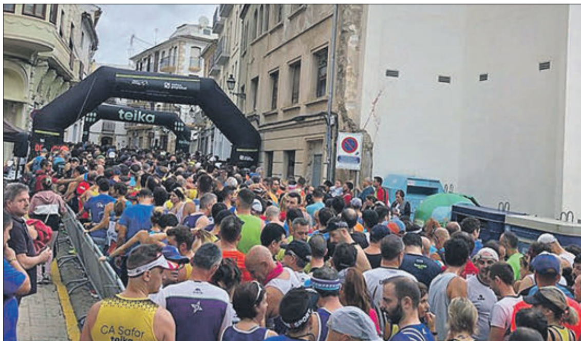
Extraordinari ambient en els prolegòmens de l'inici de la carrera.