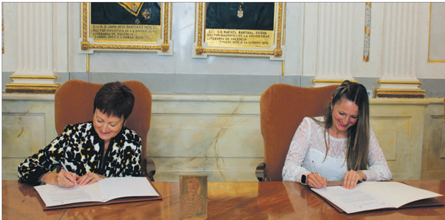
Moment de la signatura del conveni.

La bona sintonia entre la màxima institució acadèmica pública i l'administració municipal, personificades en les signatàries d'aquest conveni, ratifiquen la importància que té per