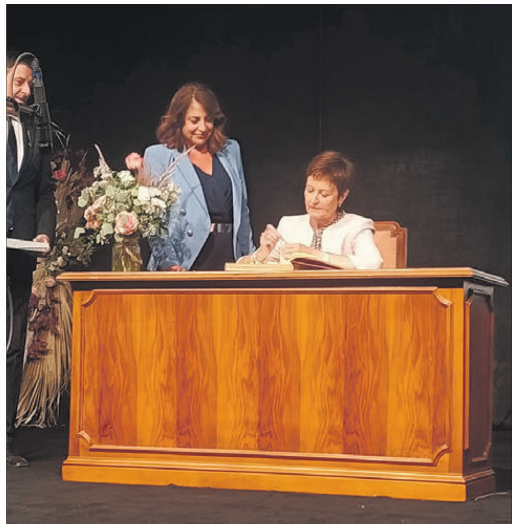
Va signar en el Llibre d’Honors de la localitat.