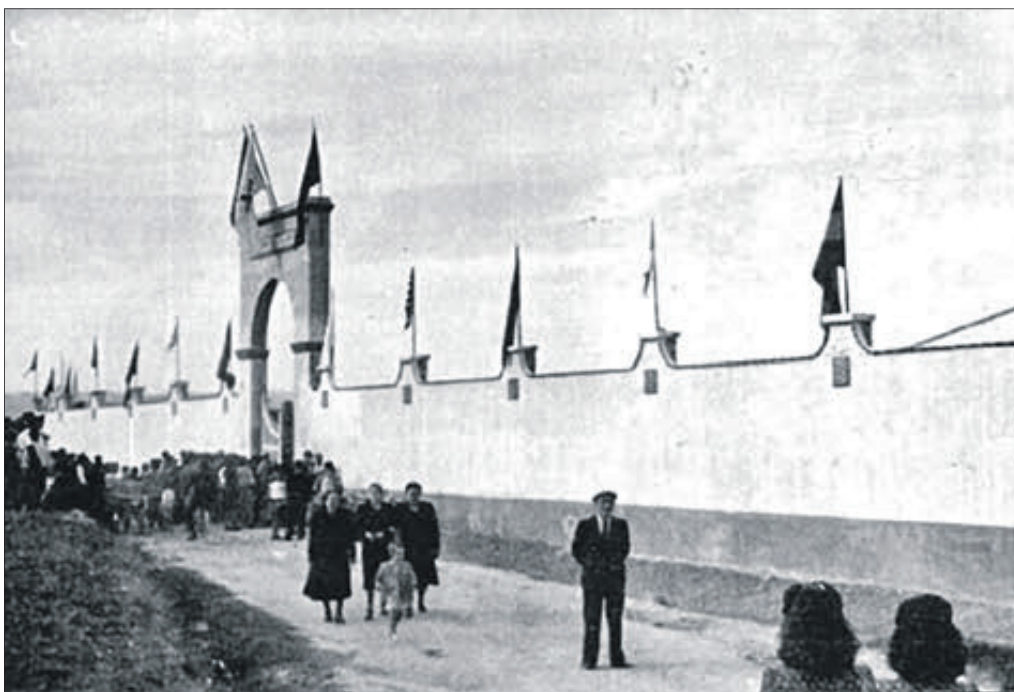
Imatge del Camp de Futbol Ramón Laporta.