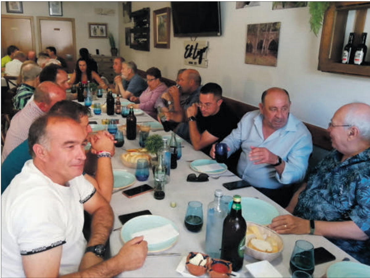
L'homenatge va estar acompanyat d'un dinar amb presència dels alcaldes del Xarpolar.