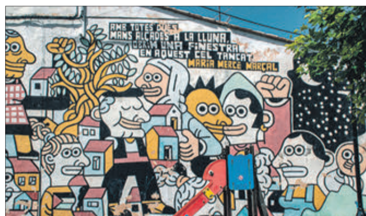
Mural en la façana d'un edifici.