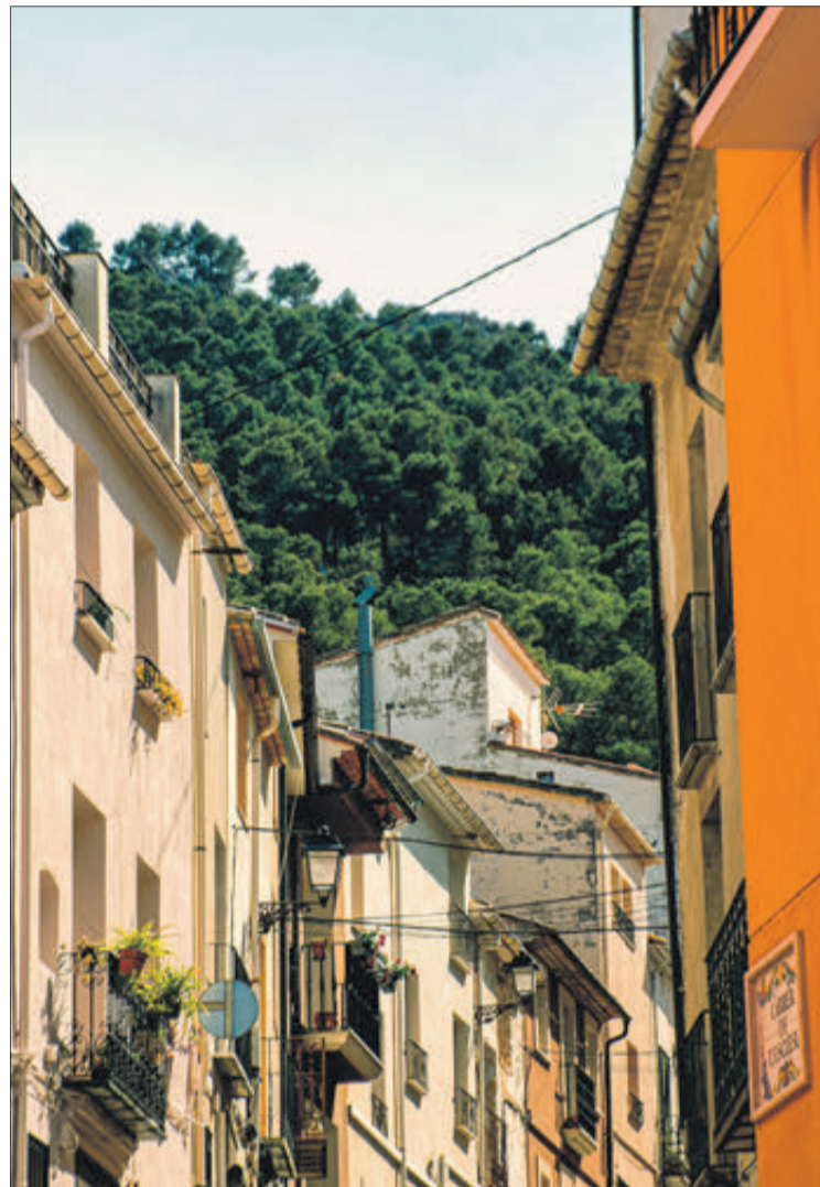
Un carrer d'Agres.

– Primer passejar-ho, perquè existeixen molts racons de gran bellesa. Veurà que les pujades són constants, amb carrers plens de fonts, els taulellets de ceràmica o a la pròpia gent del poble