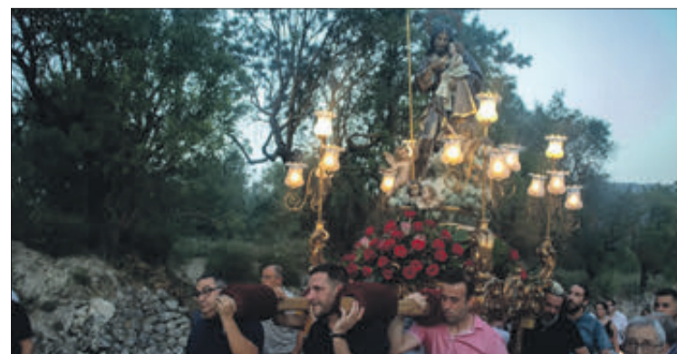
Un moment de la processó de Sant Josep.