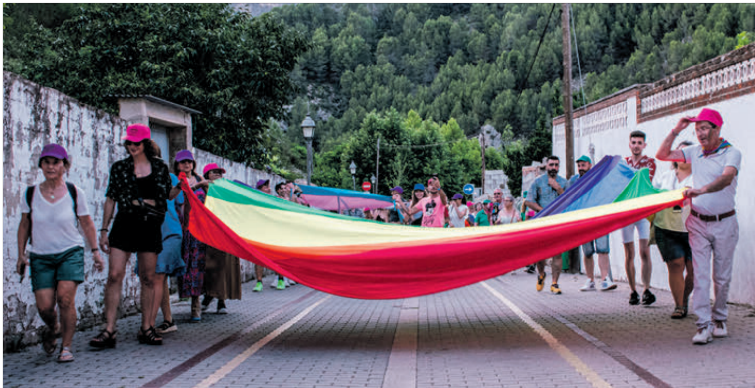
La bandera multicolor portada pels participants en la desfilada de l'Orgull.

LLIBERTAT DE SER DIVERSES Sens dubte, la bandera arc de Sant Martí del col·lectiu LGTBI+ és el de la llibertat de ser diverses, per a l'orgull lèsbic, trans, bisexual i de