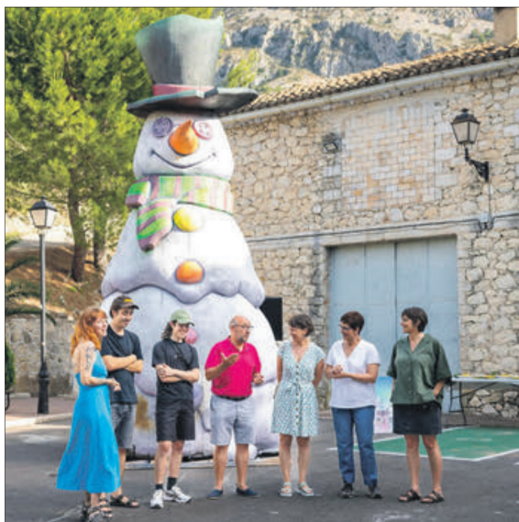
La visita a les quatre instal·lacions artístiques va finalitzar a Famorca amb una festa en què es van degustar gelats.