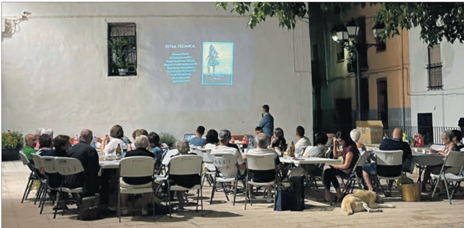
Durant els mesos de juliol i agost l'autor recorre diversos municipis de la nostra comarca.