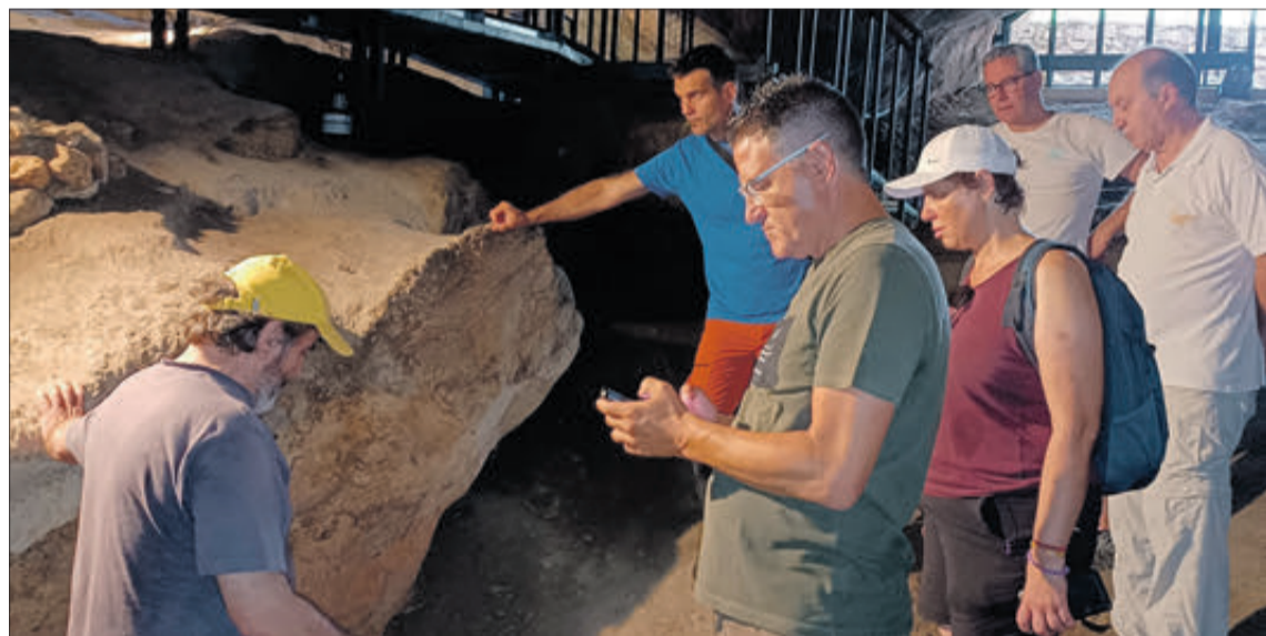
La intenció és ampliar el recorregut de la cova.

"quan possem al nostre rei de dolent hem d'estar molt ben documentats". En els últims anys, afortunadament, s'ha pogut traduir una gran quantitat de documents de l'Arxiu de la Corona d'Aragó, que complementa a la de Llibre dels Fets.