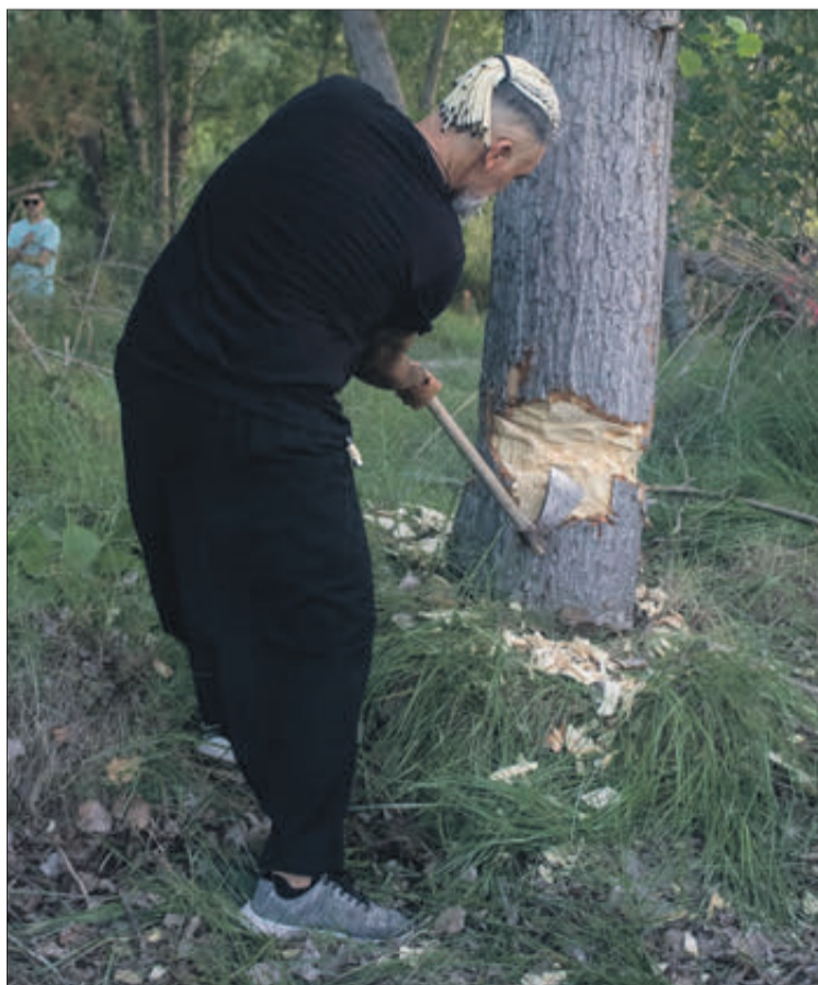
Tallà del Xop