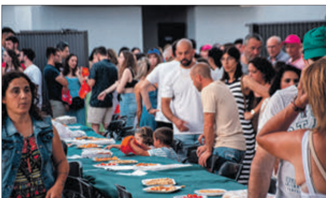
Activitats en la piscina i sopar popular.