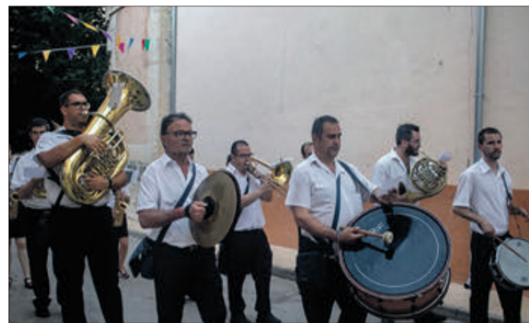
La banda de música animant la festa.