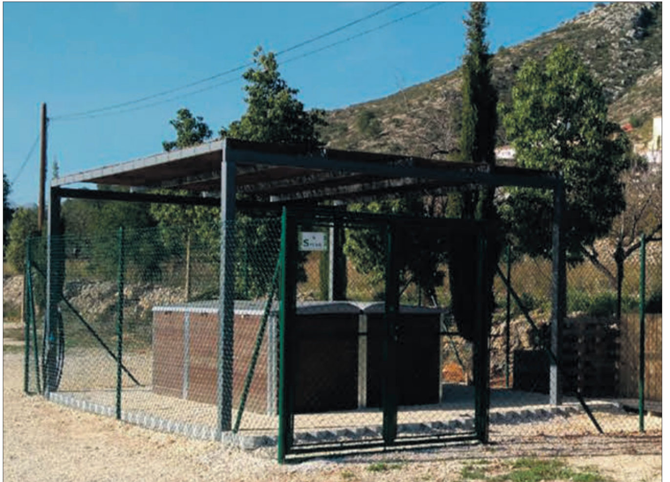
Un dels centres de compostatge que ja està en marxa, a Xaló.

El mateix Sánchez va insistir que l'entitat es va bolcar des del primer moment amb aquestes localitats, no sols amb l'extinció del foc, sinó també articulant diferents mecanismes d'ajuda per a millorar la coberta vegetal i la biodiversitat de la zona, evitant la pèrdua de sòl.