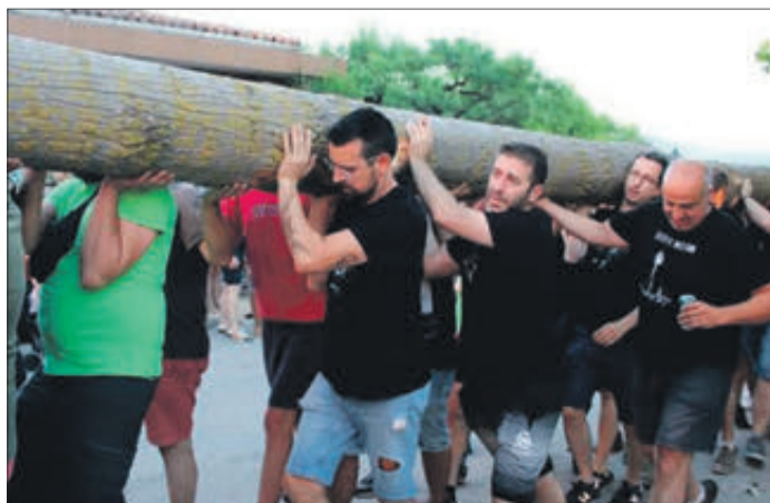
Un moment de la 'Puja del Xop'