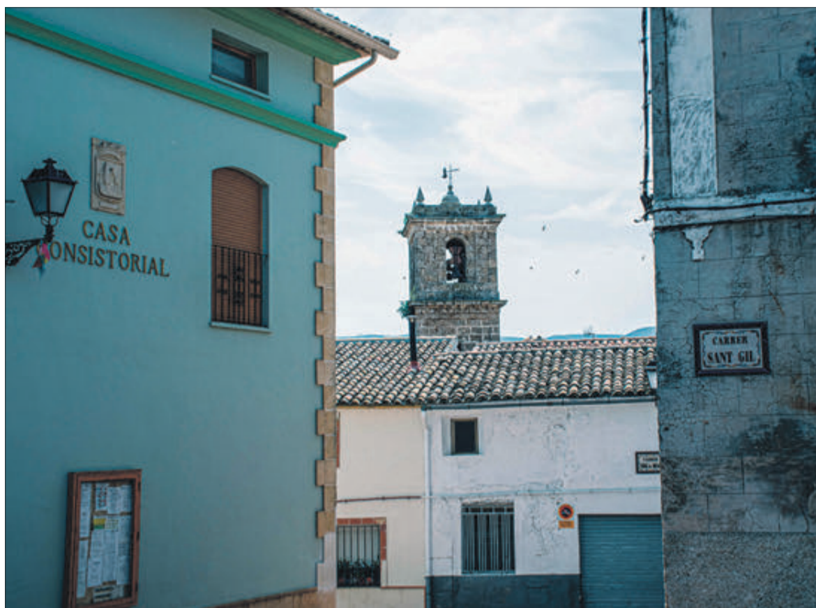
Edifici de l'Ajuntament i el campanar.