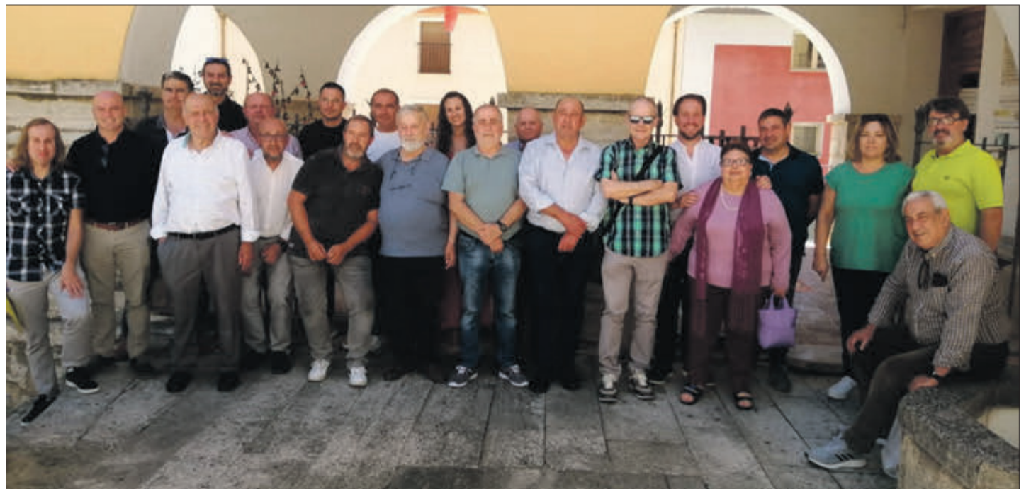
Alcaldes i representants dels ajuntaments, al costat del secretari homenatjat, posen davant l'Ajuntament de Planes.

Des d'aquesta publicació li donem les gràcies i li desitgem molta sort en els seus nous projectes personals.