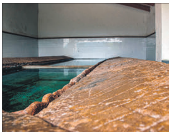
El llavador, la plaça del mercat i la piscina.