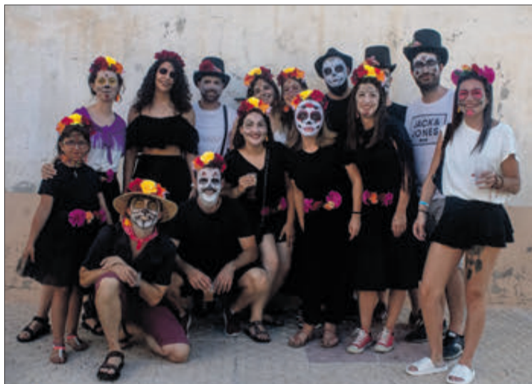
La festa de disfresses va comptar amb una notable participació.