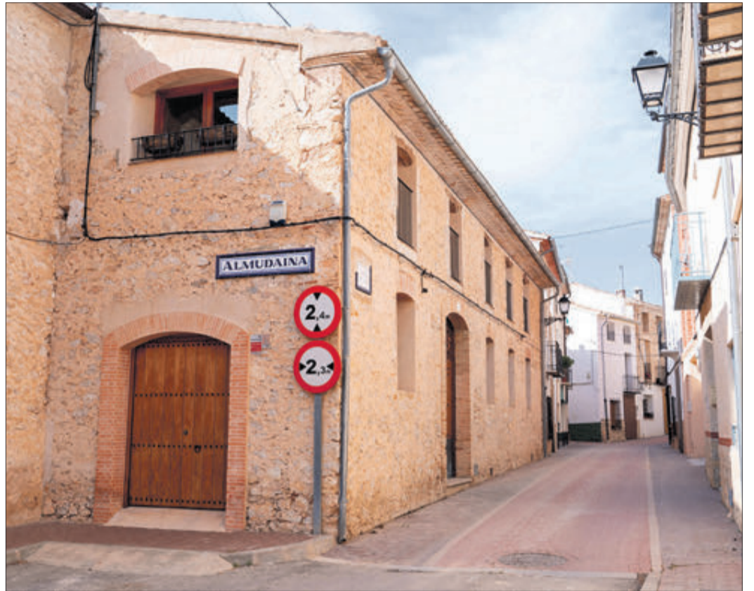
Almudaina és un dels municipis que es veurà afectat.

Assenyalar que a més de les localitats anteriorment esmentades pateixen aquest problema també Agres, Alfafara, Beniarrés, Gaianes, L'Orxa, Benimarfull, Plans i fins i tot Muro, localitat aquesta última el centre de salut de la qual es queda també sota mínims a l'estiu.