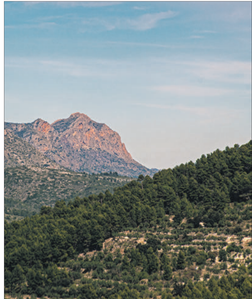
El Benicadell vist des d'Agres.