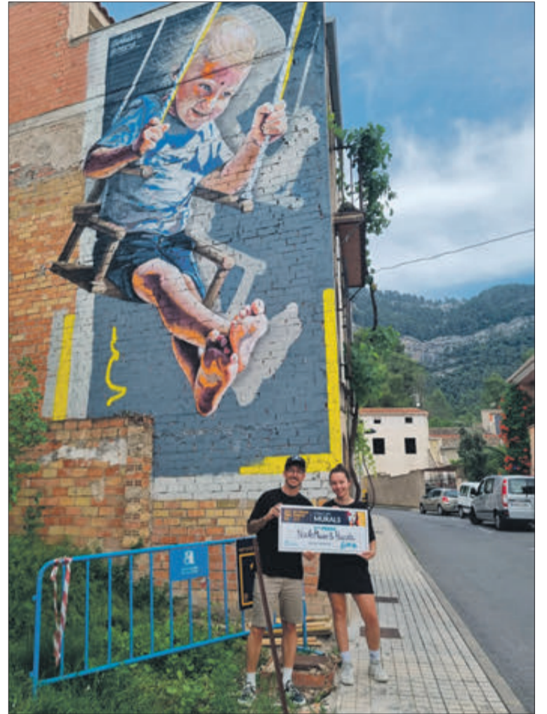
Yeko i Paucda&NachoMawe van aconseguir el primer i segon premi en el concurs de murals.