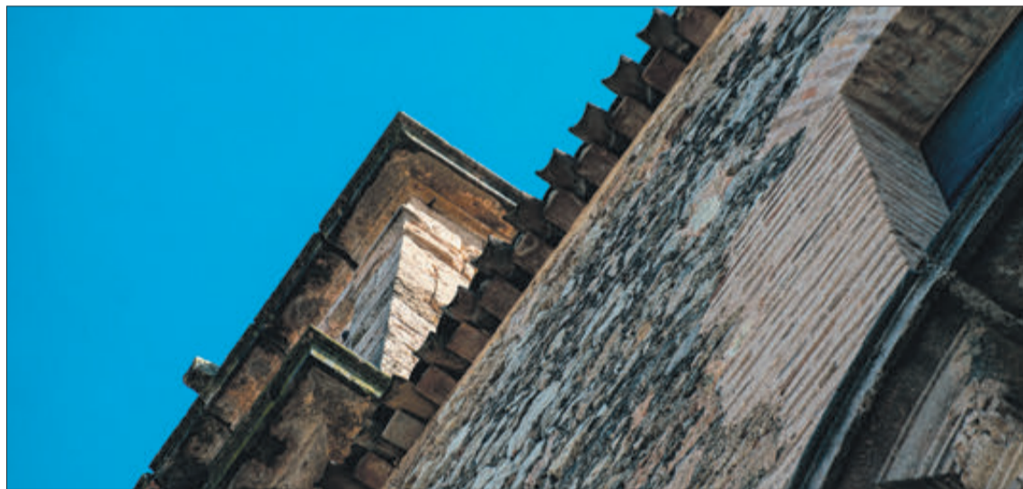
Part de l'església i el campanar.