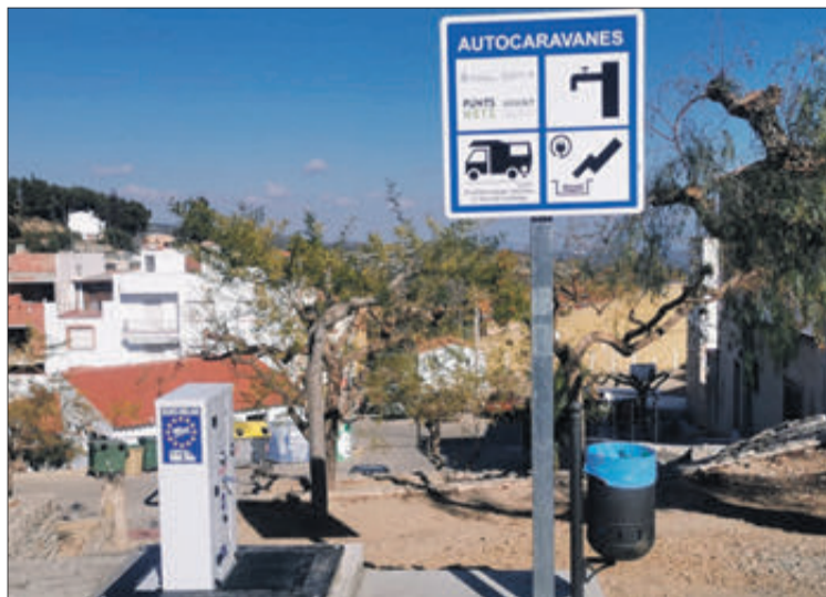
Un dels Punts Nets que ja està en marxa.

La Xarxa Punts Nets AVANT consisteix en àrees de servei, que estan geolocalitzades, en les quals les persones usuàries de les autocaravanes poden fer provisió d'aigua potable i buidar les aigües grises i les aigües negres, per a complir així amb les exigències mediambientals de tractament de residus. Aquestes ajudes estan dirigides a finançar despeses relacionades amb l'execució de les obres d'un nou punt