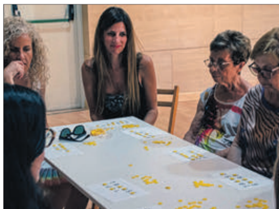
El Bingo temàtic.

totes les diversitats que representa el signe +. Els drets de les persones LGTBI com a drets humans, el respecte cap a ells i que no es poden retallar en les negociacions polítiques són uns altres dels punts a tractar. També un feminisme que lluita per la igualtat dels drets de totes les dones, el dret "inqüestionable" a la lliure determinació del gènere i la diversitat corporal, l'existència de persones no binàries i el seu reconeixement en les lleis, així com el dels drets de la infància trans.