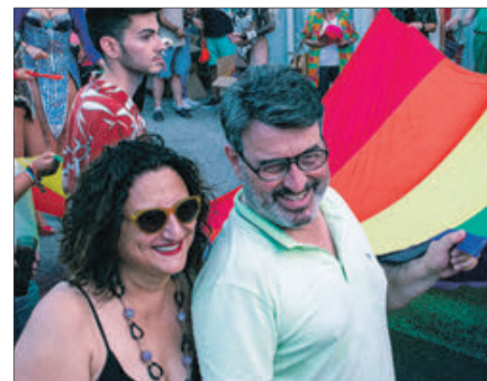
L'alcalde de L'Orxa, entre els participants.