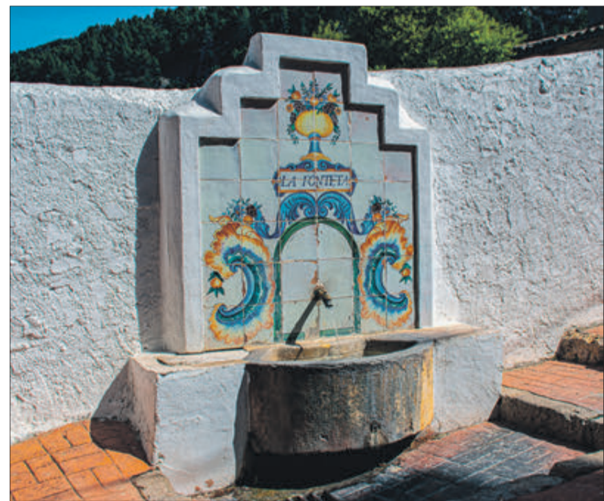
Una de les moltes fonts de la localitat.