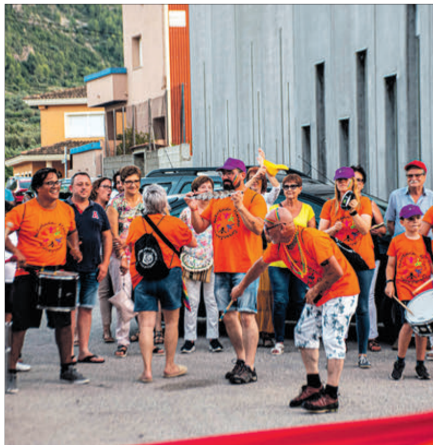
La batucada va posar ritme a la desfilada.

totes les diversitats que representa el signe +. Els drets de les persones LGTBI com a drets humans, el respecte cap a ells i que no es poden retallar en les negociacions polítiques són uns altres dels punts a tractar. També un feminisme que lluita per la igualtat dels drets de totes les dones, el dret "inqüestionable" a la lliure determinació del gènere i la diversitat corporal, l'existència de persones no binàries i el seu reconeixement en les lleis, així com el dels drets de la infància trans.