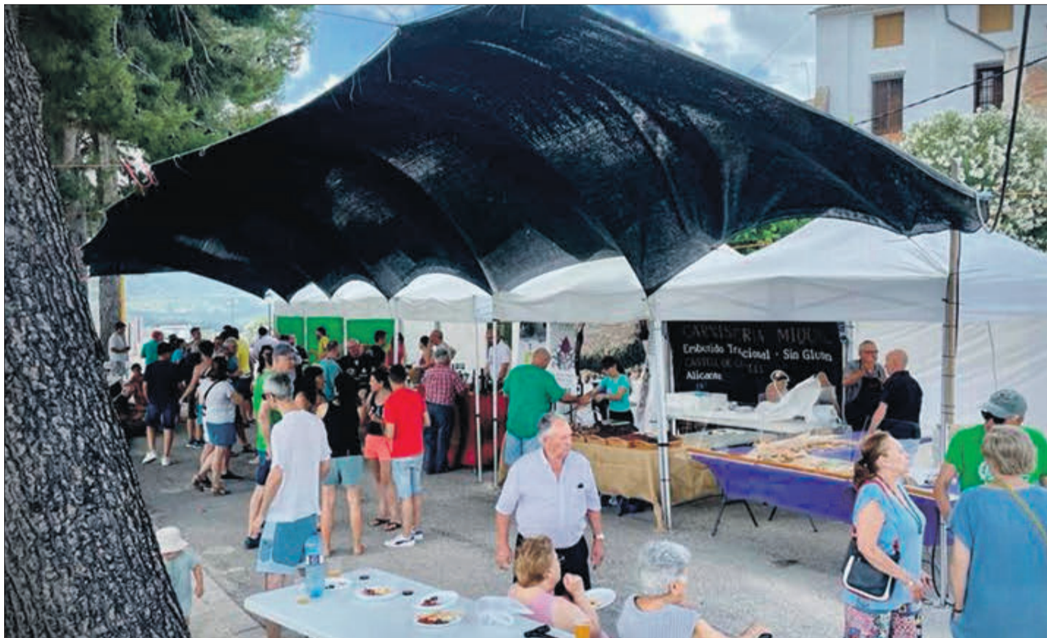
Aspecte que presentava la fira gastronòmica de Balones durant la seua celebració.