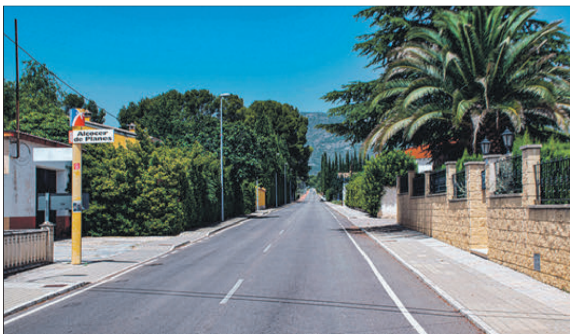
Carretera des de la qual s'accedeix i ix del municipi.

El poble és d'origen musulmà, com indica el seu nom, que procedeix de la paraula àrab al-qasayr, "fortalesa xicoteta". Conquistat a mitjan segle XIII