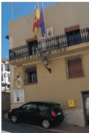
Ajuntament de Fageca

Per part seua, l'afectat lamenta haver acudit al Síndic de Greuges perquè faça la funció d'intermediari i se sent disconforme amb la resposta rebuda pel