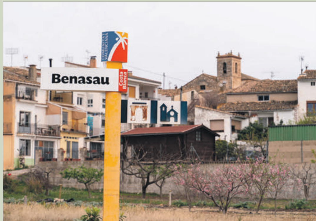
La tall per obres afecta a la carretera en el terme municipal de Benasau.

AL SEU PAS PER BENASAU, DURARÀ MÉS D'UN MES