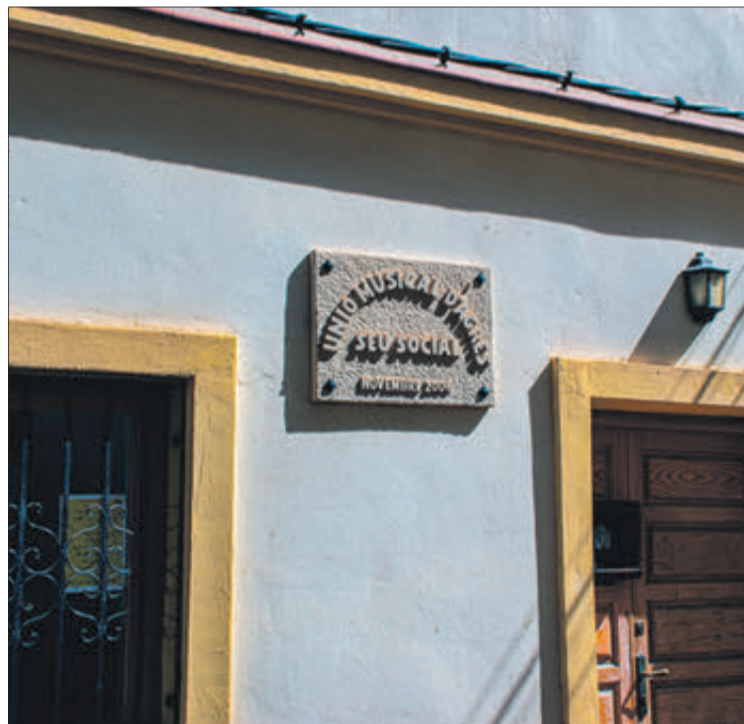
La seu de la Unió Musical.