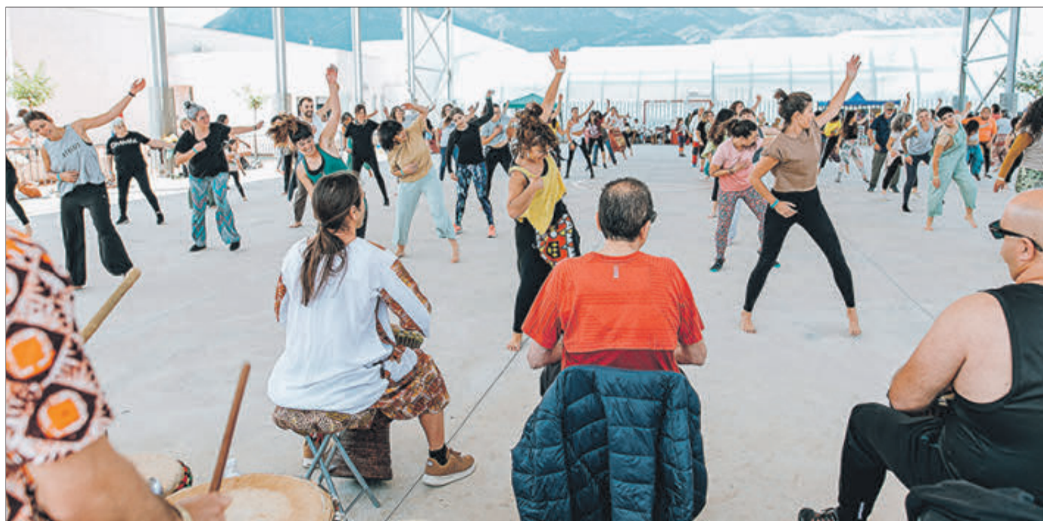
Diferents moments del festival 'Mujeres en movimiento'.