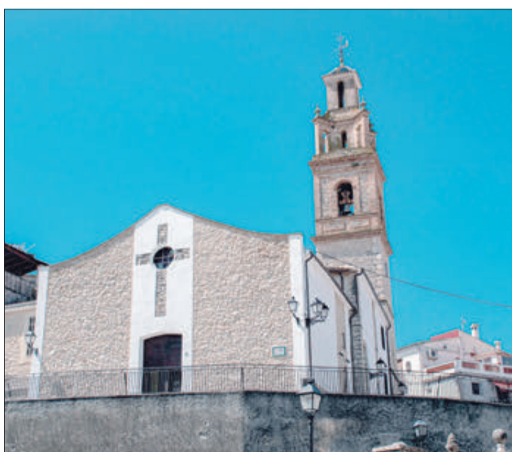
Església de Benimarfull.

Situat a la Vall de Travadell, està envoltat de muntanyes i pròxim a les localitats de Alcosser, Almudaina, Benillup, Cocentaina i Planes. Antigament va ser conegut com a Baños de Benimarfull.