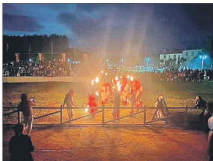
L'espectacle ofert pel grup de l'Alqueria d'Asnar.