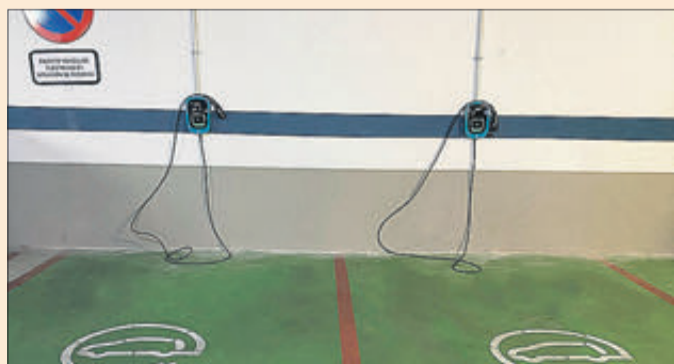
Punt de recàrrega de vehicles elèctrics.

Els municipis del Xarpolar que es podran beneficiar d'aquestes ajudes són La Vall d'Alcalà, Agres, Alfafara, Balones, Beniarrés, Benifallim, Benimassot, Benillup, Fageca, Fomorca, Gorga, L'Alqueria d'Asnar i Planes