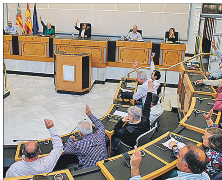
Plenari del Consorci Terra.

D'altra banda, s'ha modificat també el sistema de càlcul dels percentatges de rebuig a abocador, per a la determinació de la base imposable de l'impost estatal sobre el depòsit de residus en abo-