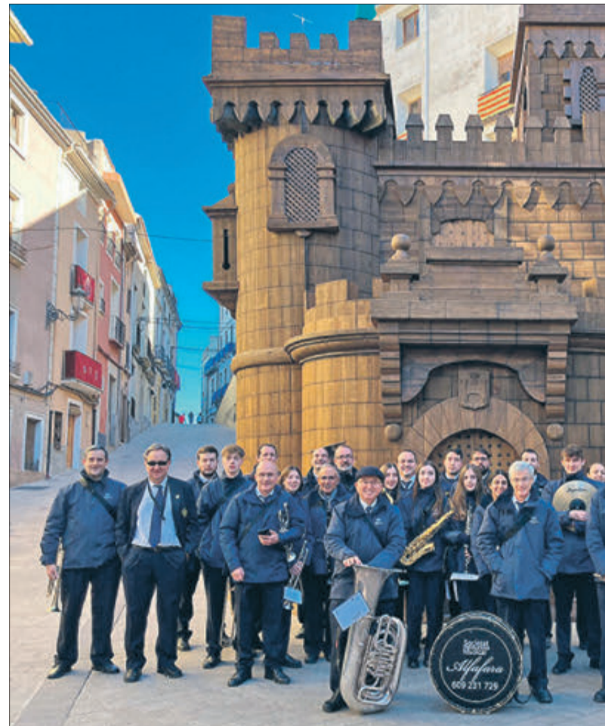
Davant del castell de festes de Bocairent.