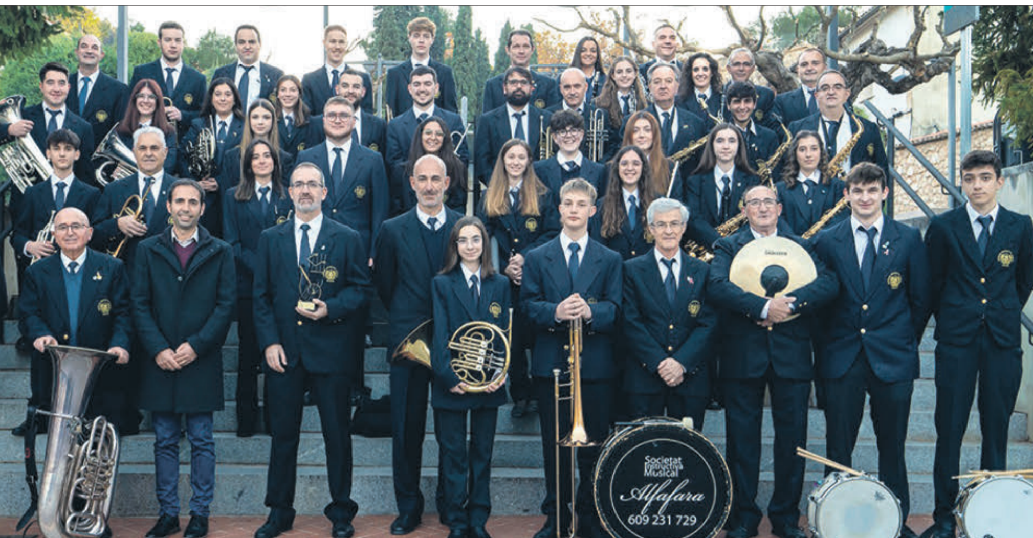
Els components de la banda, al parc de La Mateta.