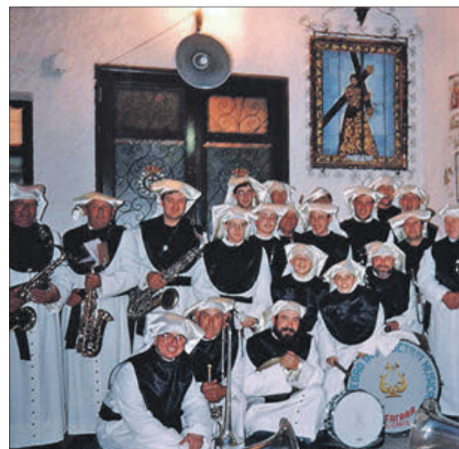
La SIM Alfafara, a Cartagena.

bè a La Safor) i la Banda Jove de la Unió Musical de Bocairent. Després de tretze anys exercint la direcció, aquest mestre continua, a dia de hui, dirigint la nostra banda i deixant la seua empremta en el bon funcionament de la SIM Alfafara.