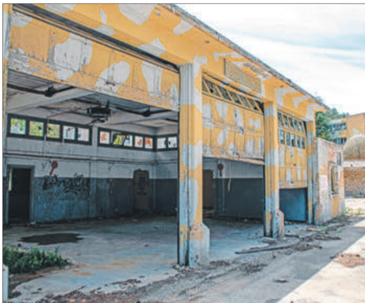
Estat actual de les instal·lacions militars de la Base Aitana.

Defensa va decidir retallar en 2007 el nombre d'efectius en la zona i concentrar-los en les instal·lacions situades en el cim de la serra, al costat dels radars. Al llarg dels anys s'han presentat diverses propostes per a donar un nou ús als terrenys i edificis, però cap va acabar sent acceptada. Fins ara, que el Ministeri d'Inclusió ha informat l'ajuntament d'Alcoleja la idoneïtat de la construcció d'un Centre de Primeres Arribades d'Atenció Humanitària en els terrenys de l'antiga base. En ell les persones romandrien un temps, després de recalar a Espanya, fins que es traslladen a un altre punt del país.