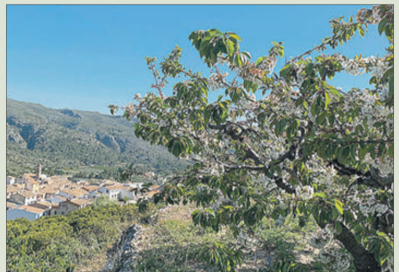
En primer terme uns terrenys on es cultiva la cirera.

Els camps, de fet, s'estan abandonant, amb la sensació real que el cultiu s'acaba.