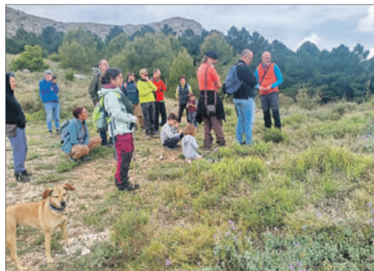
Dues imatges de la marxa