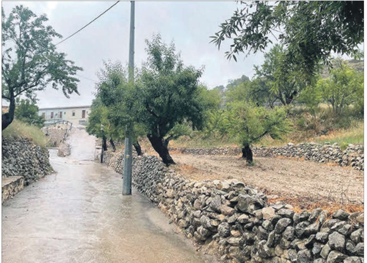
Un camí inundat per l'aigua de la pluja caiguda en les últimes setmanes.

No obstant això, per al cultiu de l'olivera aquestes pluges han sigut més positives que negatives. No hi ha més que per bé que venja, recita aquest.