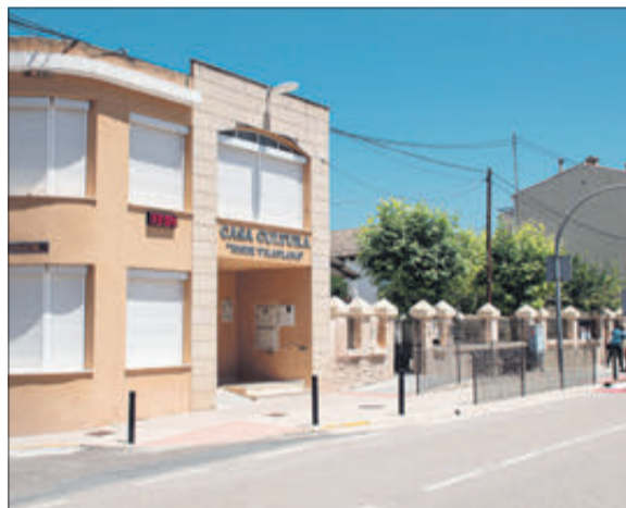
La Casa de Cultura, l'Ajuntament i la piscina del municipi.