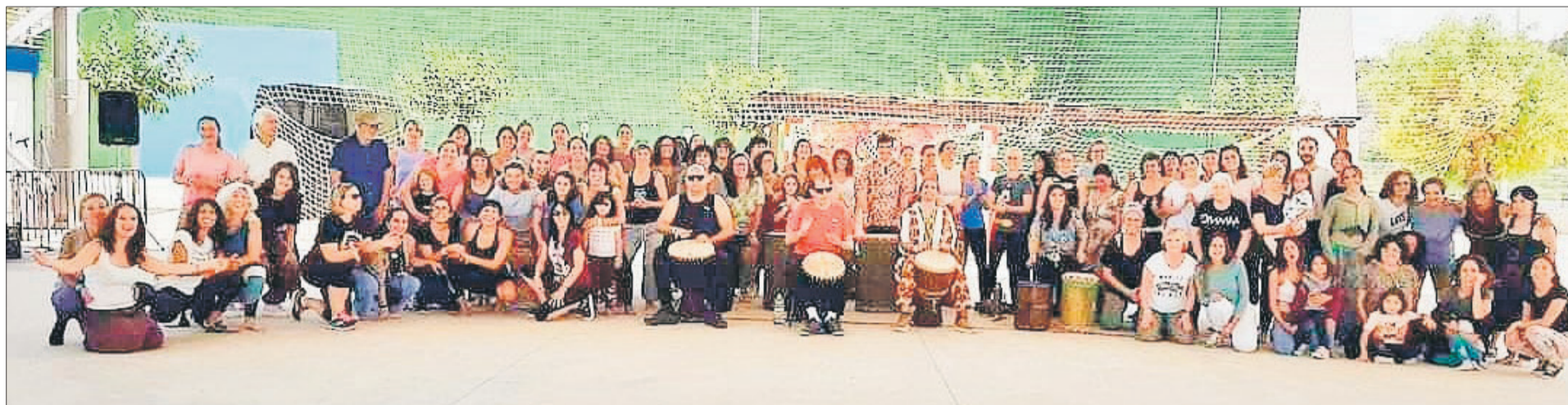
Participants en l'activitat que va tindre com a escenari el poliesportiu de L'Alqueria d'Asnar.