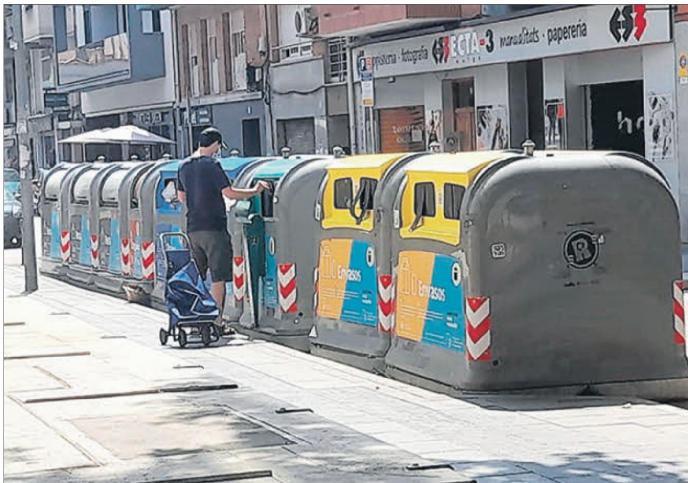
Contenidors per al reciclatge de residus.

"La separació en origen i el reciclatge és fonamental per a complir els objectius de l'Agenda 2030 i avançar en un model d'economia circular", considera. Sens dubte, l'educació ambiental és molt important i "per això, des del consorci estem realitzant accions a càrrec d'educadors ambientals en tots els municipis de manera ininterrompuda".