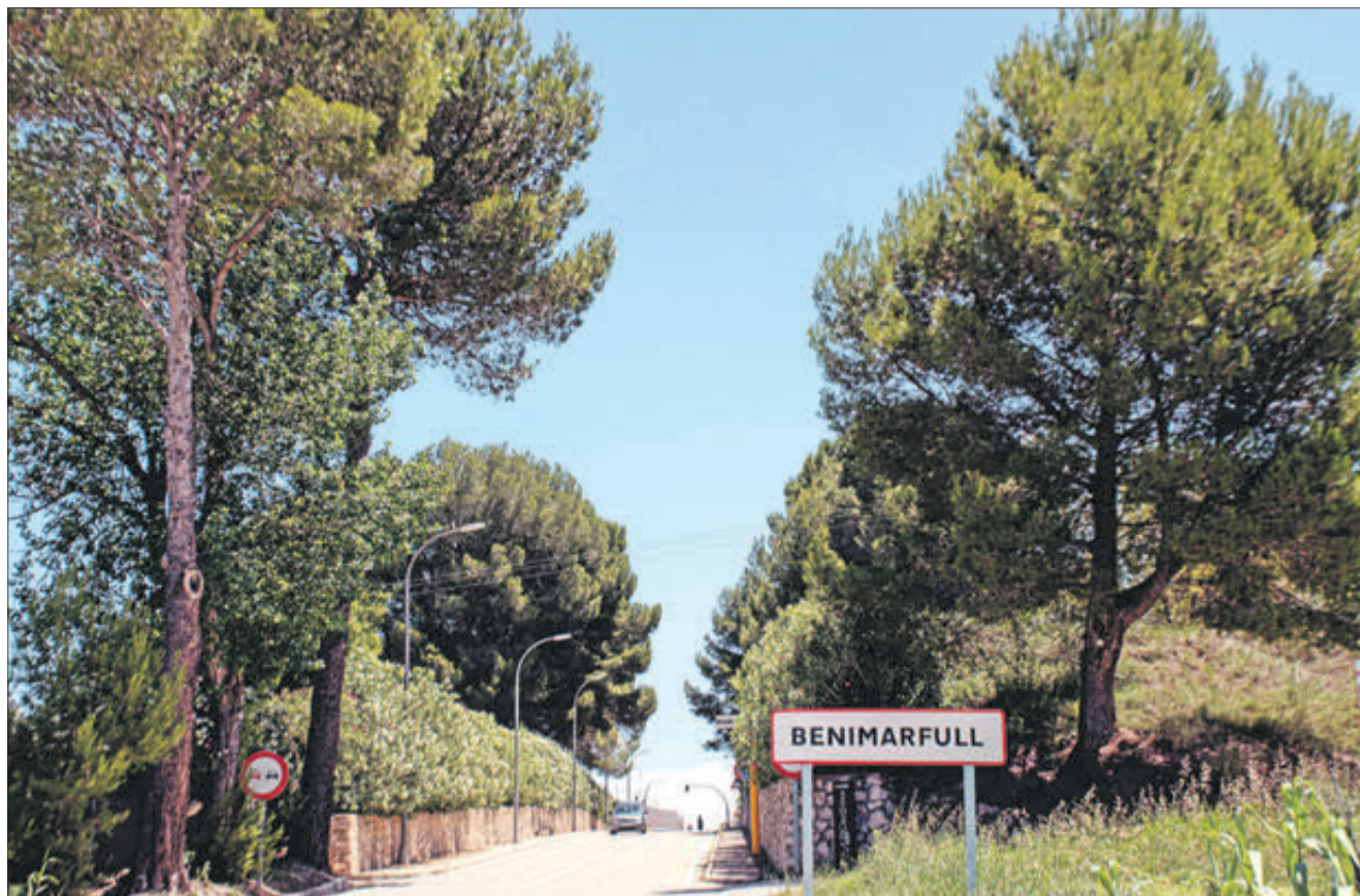
Carretera d'accés al municipi de Benimarfull.