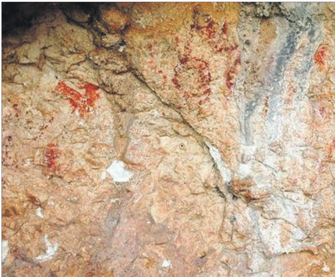
Pintures rupestres trobades en el terme municipal de Penàguila.

En paraules dels arqueòlegs és un dels jaciments més rellevants d'art rupestres neolític a la Comunitat Valenciana en les últimes dècades. "Pot ser l'inici de molts altres descobriments que han passat inadvertits per estar situats en zones de difícil accés", exposen.