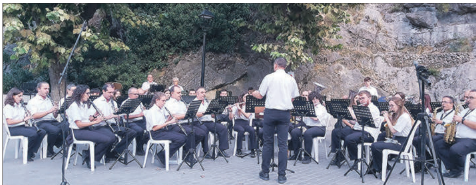
Durant un concert.