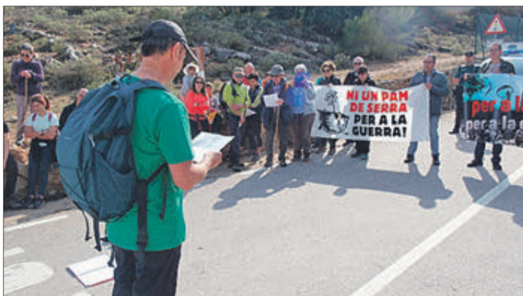
Moment de la lectura del manifest.

Igual que en anteriors edicions, la participació va ser diversa, amb persones de totes les edats. Alguns van passejar amb bici, uns altres van pintar en els seus rostres els dies de la invasió russa a Ucraïna i va haver-hi qui va amenitzar el passeig amb cançons i guitarres.