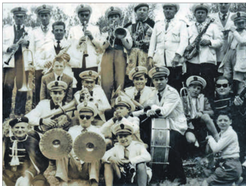
En Banyeres, en l'any 1956.