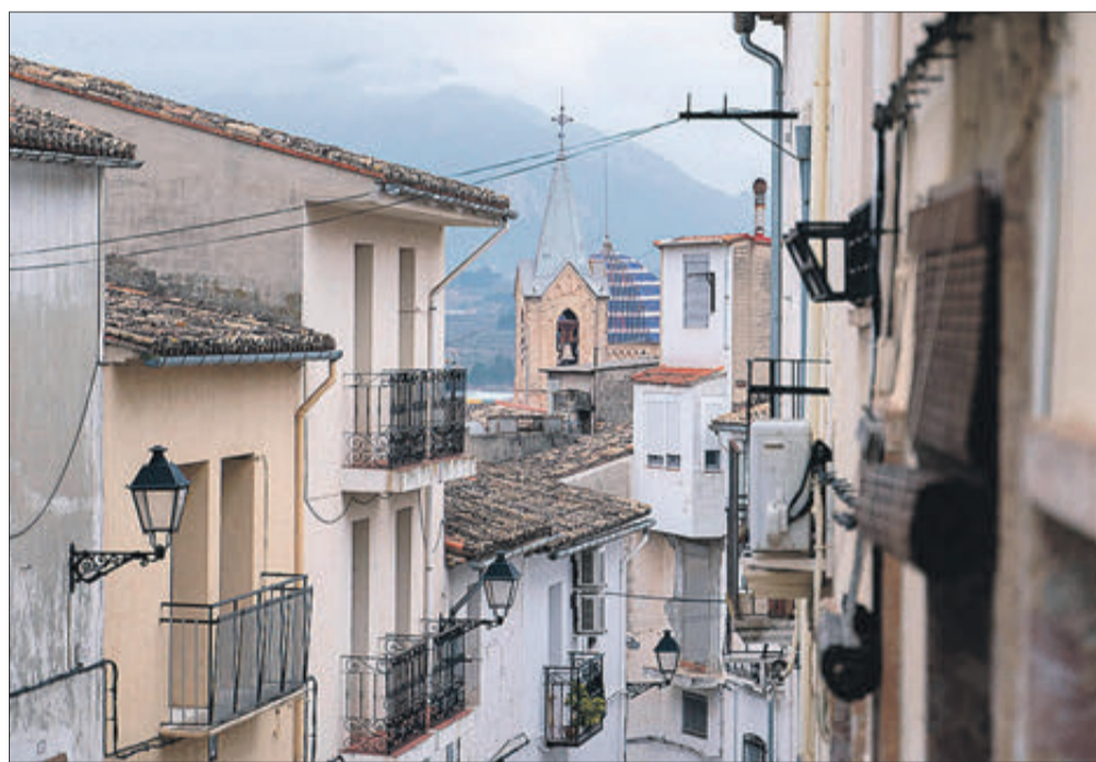
Beniarrés es la població més gran del Xarpolar i també la que té més parats.

Entre les notes positives les evidenciades a Alfafara (de 23 a 19), Almudaina (de 8 a 5), Benimarfull (de 15 a 13), Penàguila (de 20 a 18), Planes (de 32 a 30) i La Vall d'Alcalà (de 10 a 9). Beniarrés continua sent la població amb major atur. Precedeix a Benilloba (56), Agres, Gaianes (40), L'Alqueria d'Asnar, Planes i L'Orxa (29).