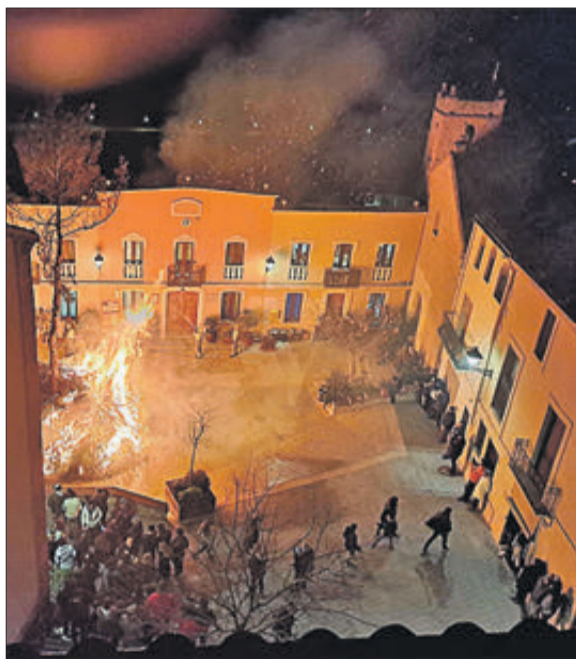
El dissabte 21 de gener es va cremar la foguera en la plaça.

"Es tracta d'una festa molt popular de la qual tots gaudim", va agregar tot seguint el dirigent.