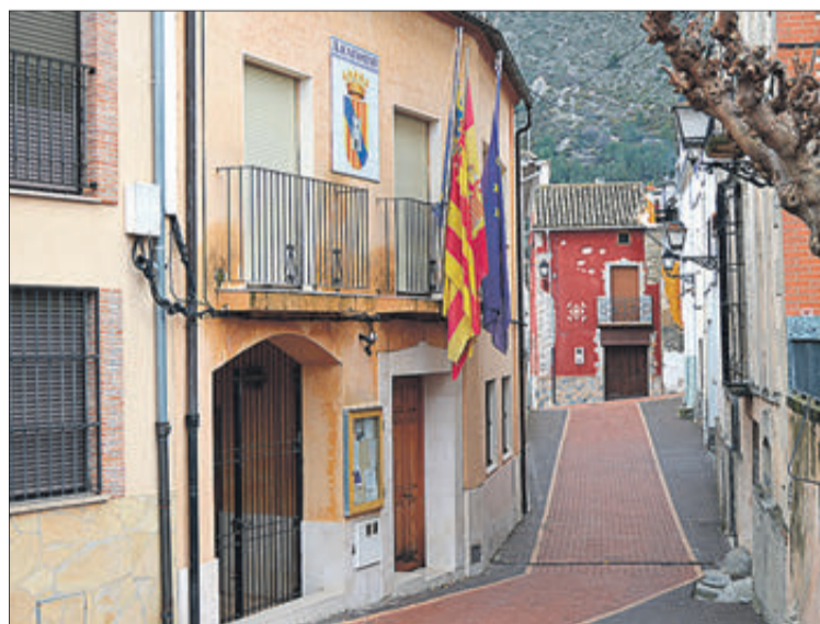
A l'esquerra, l'edifici de l'Ajuntament.

Lloc de moriscos, va formar part de la parròquia i baronia de Planes. Ja