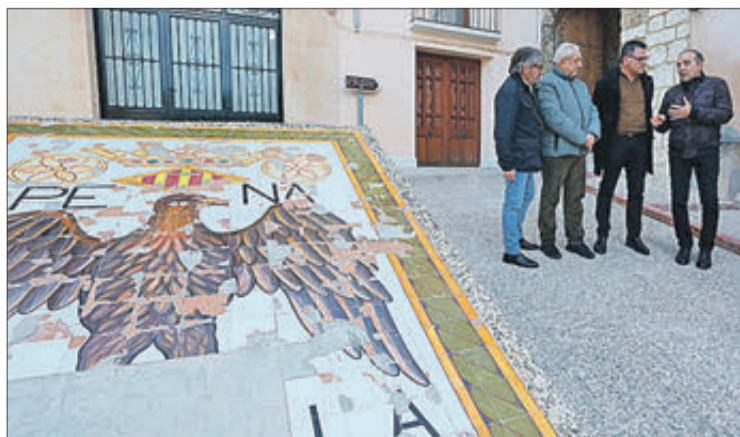
Diputats provincials i membres de la corporació local, a Penàguila.