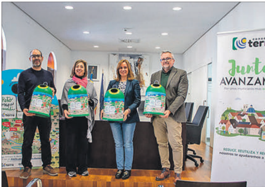
Presentació de la campanya d'Ecovidrio i Terra, a Xixona.

Els guanyadors de cada categoria seran aquells que major puntuació obtinguen atenent diversos criteris com són l'increment dels kg. de vidre, la