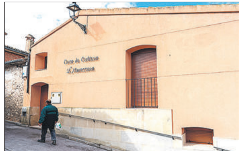
Un home camina per davant de la Casa de Cultura.