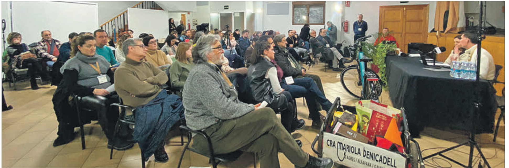
Agres ha acollit l'acte inaugural del primer Congrés d'Educació i Entorn Rural.

TAMBÉ SE CELEBRA A AIELO DE MALFERIT, BENLLOC, VILAFRANCA I ARAS DE LOS OLMOS