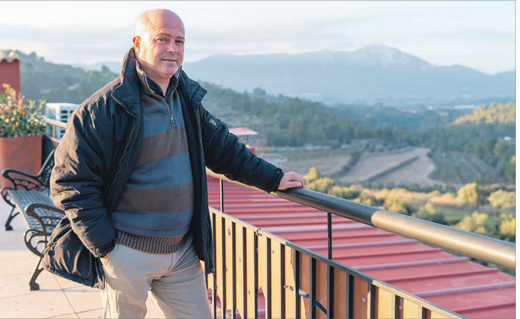
L'alcalde i al fons l'esplèndid paisatge que es pot albirar des de Benillup.