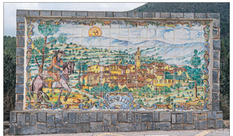
Un bonic panell ceràmic, que reproduïx el poble de Benillup.

Portem més de vint anys reivindicant que ens ajuden, què hem de fer? Abandonar la localitat? Als polítics se'ns unfla la boca dient que solucionarem els problemes del món rural, de la despoblació... i Confederació va ser l'única que va contestar, dient que no és competència d'ells, mentre la Conselleria