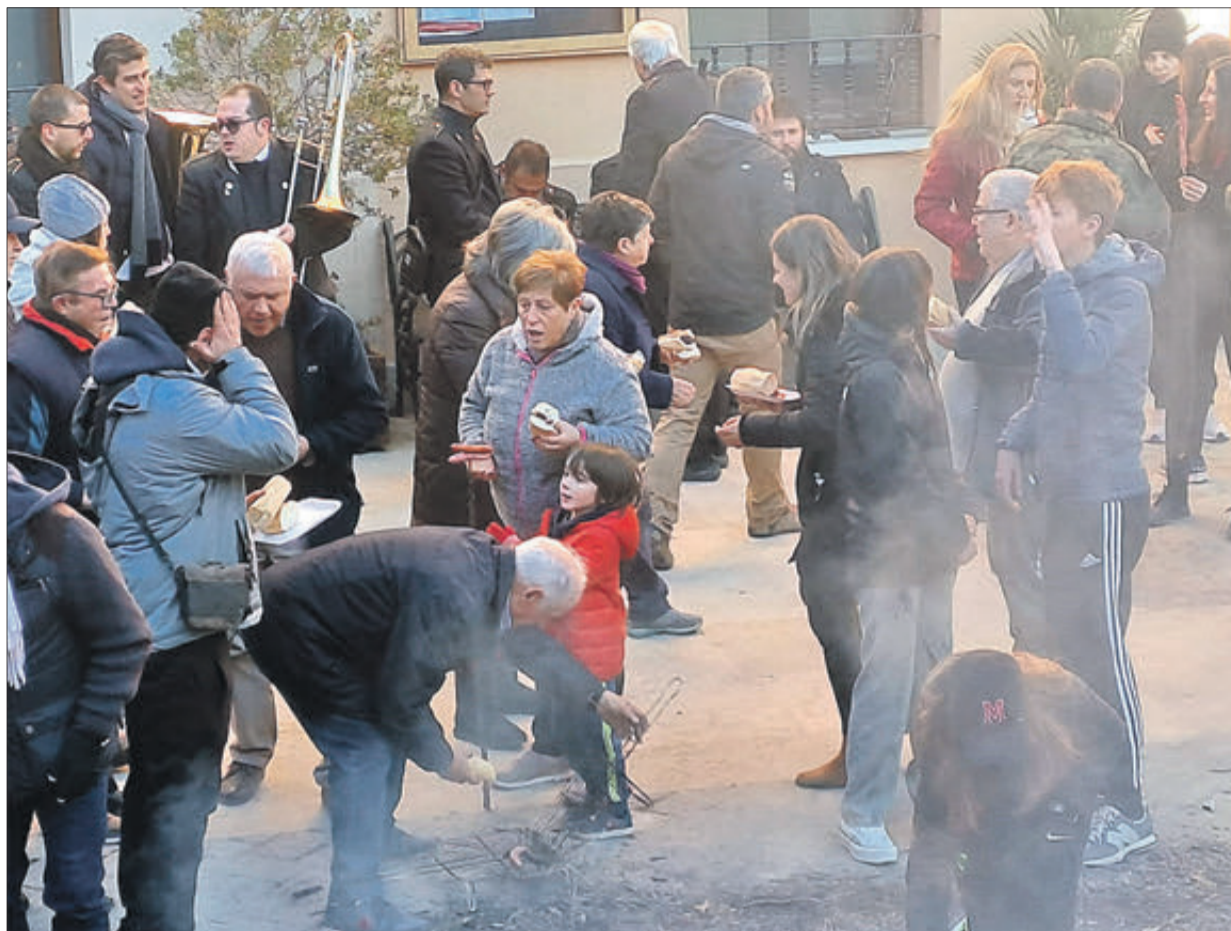
Els veïns van gaudir de la festa.