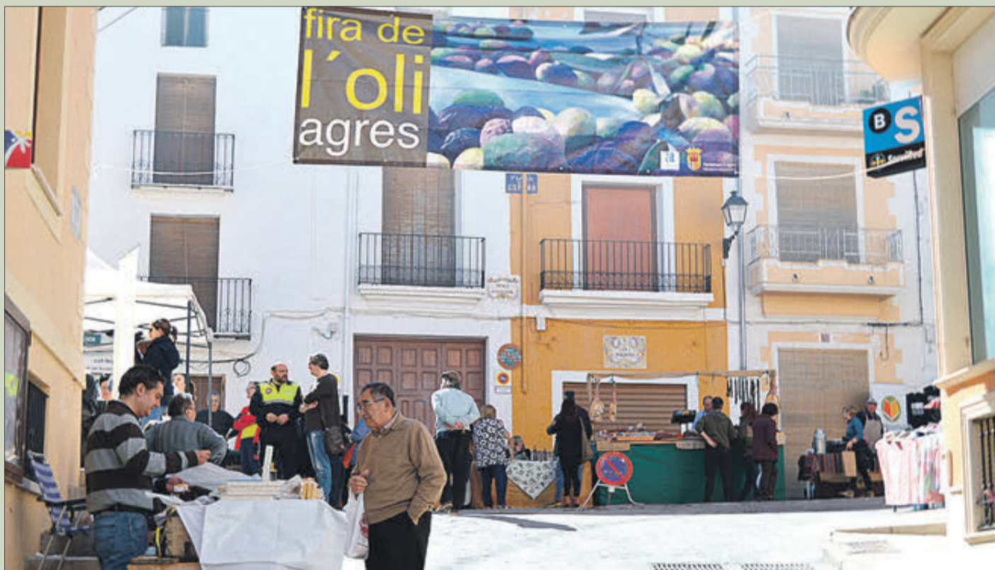
Una passada edició de la Fira de l'Oli d'Agres.