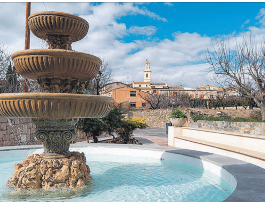
Un assortidor i el poble al fons.