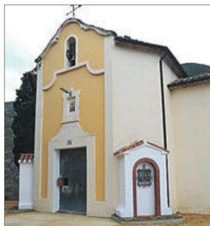
L'ermita del crist del Socorro.