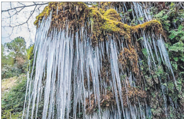
El Molino Mató a Agres gelat i teulades cobertes de neu a Tollos.