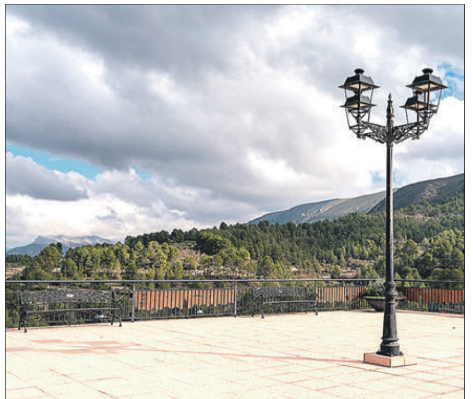
Mirador del Travadell.

Quan vaig arribar com a alcalde érem 94 i una de les circumstàncies que ens ha fet créixer ha sigut el Covid, perquè la gent gran que vivia a Alcoi, Cocentaina o Muro han decidit vendre's a Benillup, on se senten més tranquils, protegits i amb més possibilitats d'estar a l'aire lliure.