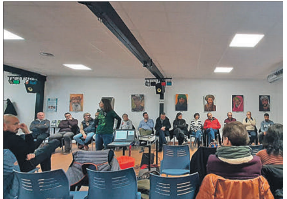
La jornada va comptar amb tretze ponents.