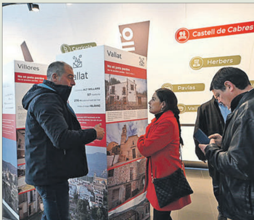
El projecte s'ha presentat amb una exposició a la Ciutat de les Arts i les Ciències.

PER A INCENTIVAR EL TURISME ALS POBLES MÉS XICOTETS