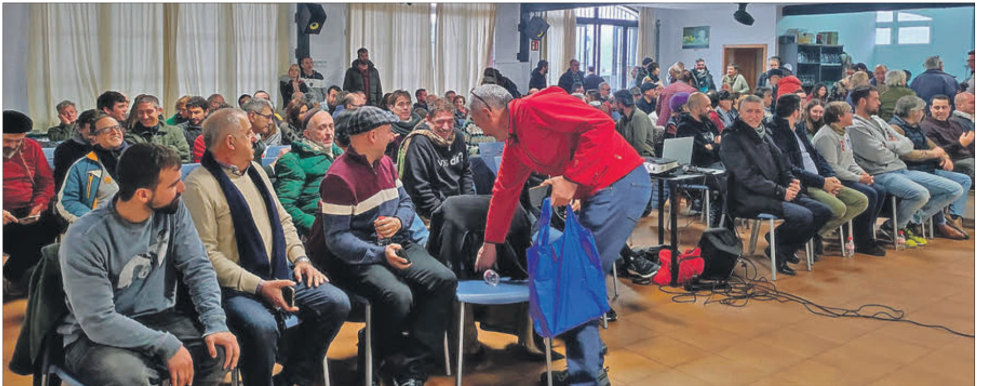
El format de la trobada, a més, va permetre que els assistents dialogaren amb els ponents.

ENORME AFLUËNCIA DE PÚBLIC PER A DIALOGAR AMB ELS PONENTS EXPERTS