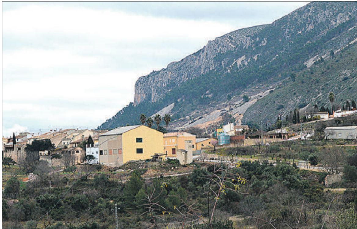
Vista panoràmica del municipi.