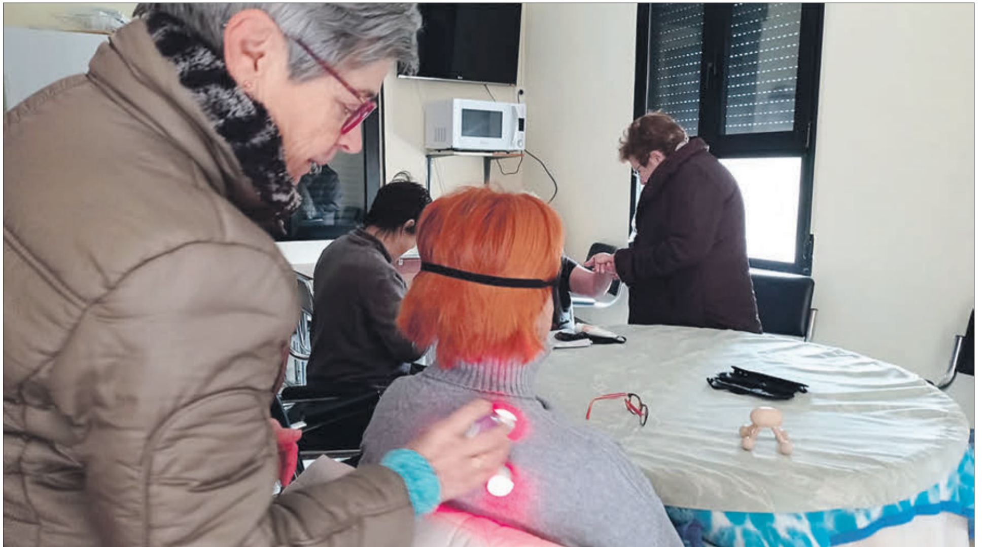
L'activitat s'ha desenvolupat en el municipi de Millena.

INICIATIVA PER A FOMENTAR LA IGUALTAT DE GÈNERE