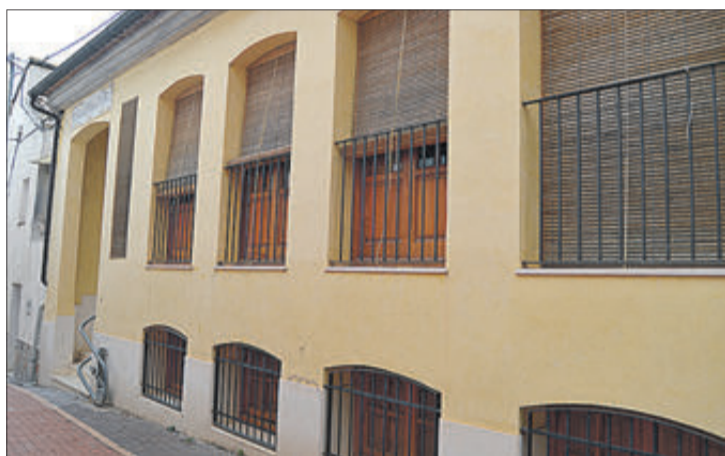
La Casa de Cultura del municipi.