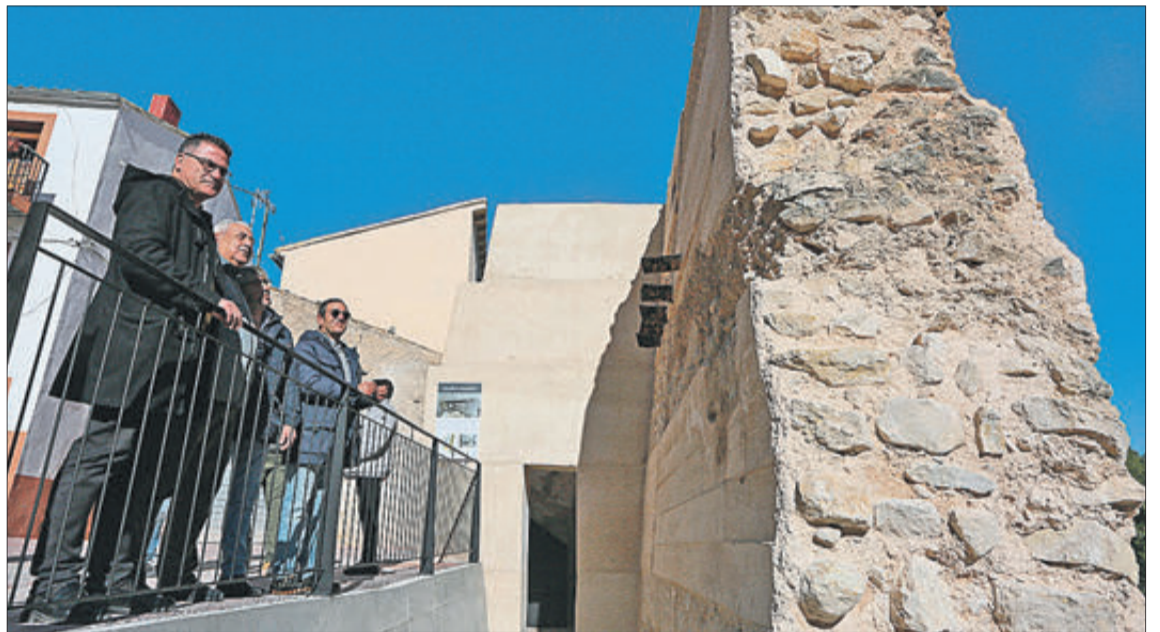
El diputat i les autoritats locals, en Penàguila.