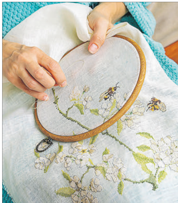
Una dona realitza un brodat artesanal.

Es podrà unir el brodat amb el de les altres companyes, d'una manera opcional, i el 8 de març es teixirà el resultat global, gaudint a més d'una trobada acompanyada de menjar, música i molta companyia.