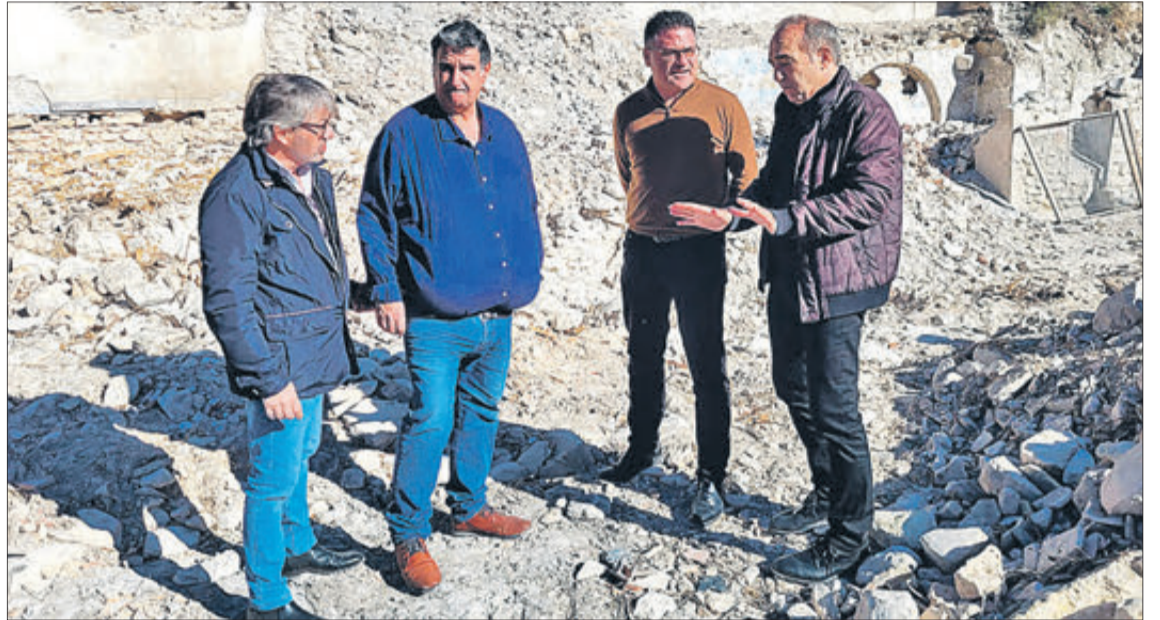
Durant la visita a les restes del molí fariner de Benimassot.

La instal·lació va ser abandonada pel seu últim propietari fa més de mig segle anys i actualment es troba en estat de ruïna, fet que fa, va apuntar González de Zárate, que "un dels principals objectius d'aquesta proposta siga frenar la seua deterioració i poder condicionar les restes per a fer-los visitables".