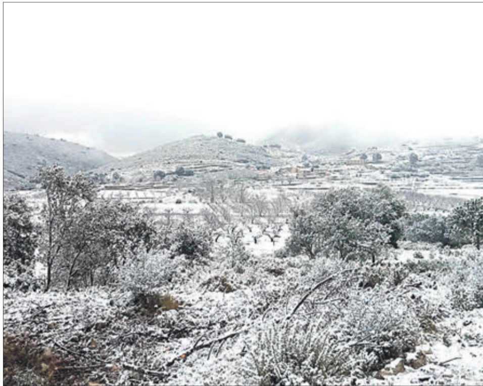
Paratges nevats als voltants de Castell de Castells i la cava nevada a Famorca.

El seu alcalde, Ismael Vallés, indica que "hem estat en contacte en tot moment amb els ciutadans, sobretot la gent gran, perquè no se senten sols i que