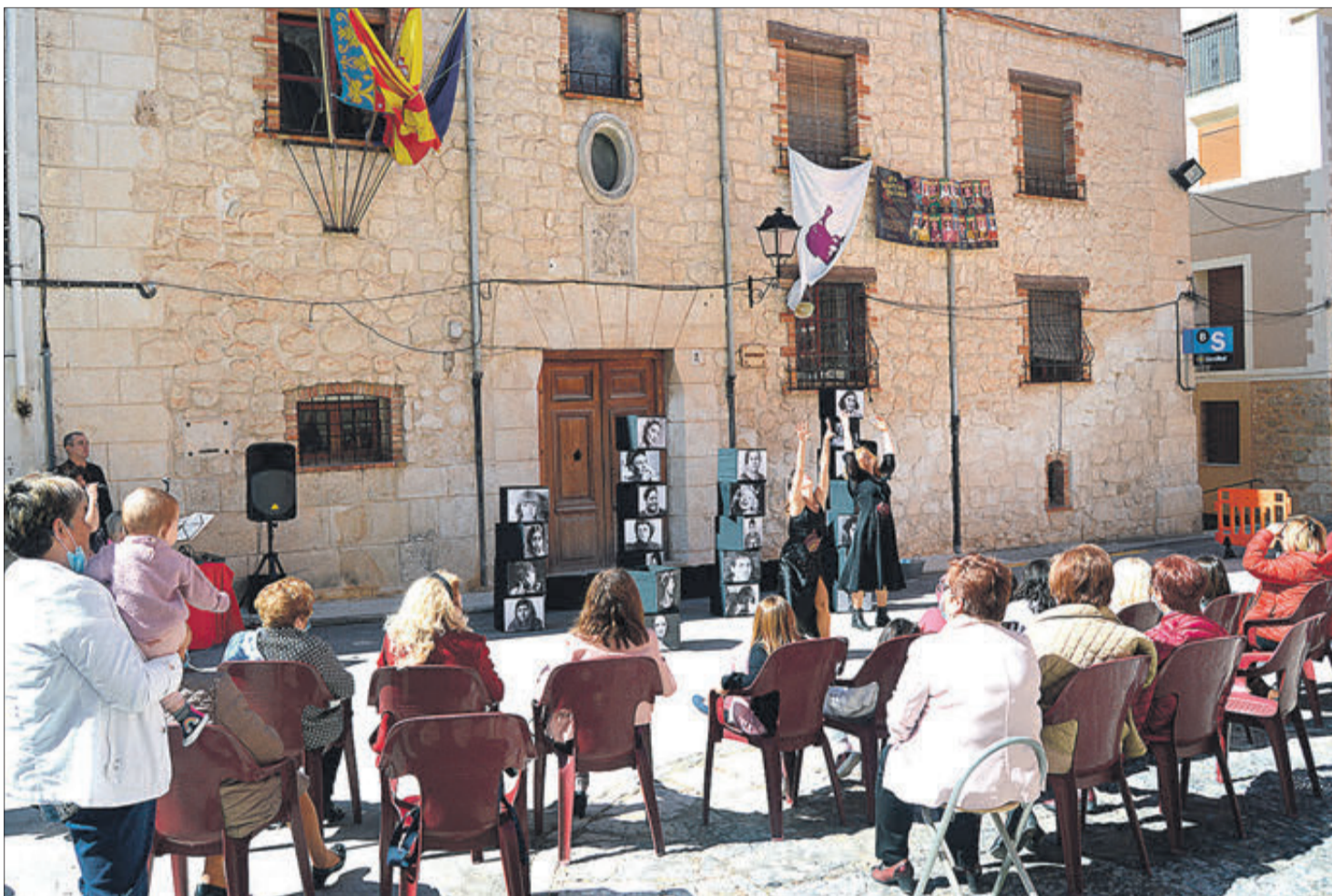
Espectacle celebrat l'any passat a Penàguila, amb motiu del Dia de la Dona.

És igualment un espectacle de música, teatre, poesia i dansa per a visibilitzar a les dones invisibles, "perquè el que no es veu, no existeix".