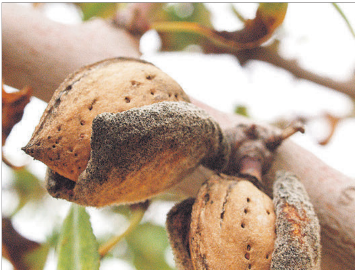
El cultiu de l'ametla és present a les nostres comarques.

En total, vint escrits s'han registrat davant la Conselleria d'Agricultura des de 2020 amb peticions per al sector de fruita seca, onze d'ells l'any passat. Però quasi no s'ha avançat,