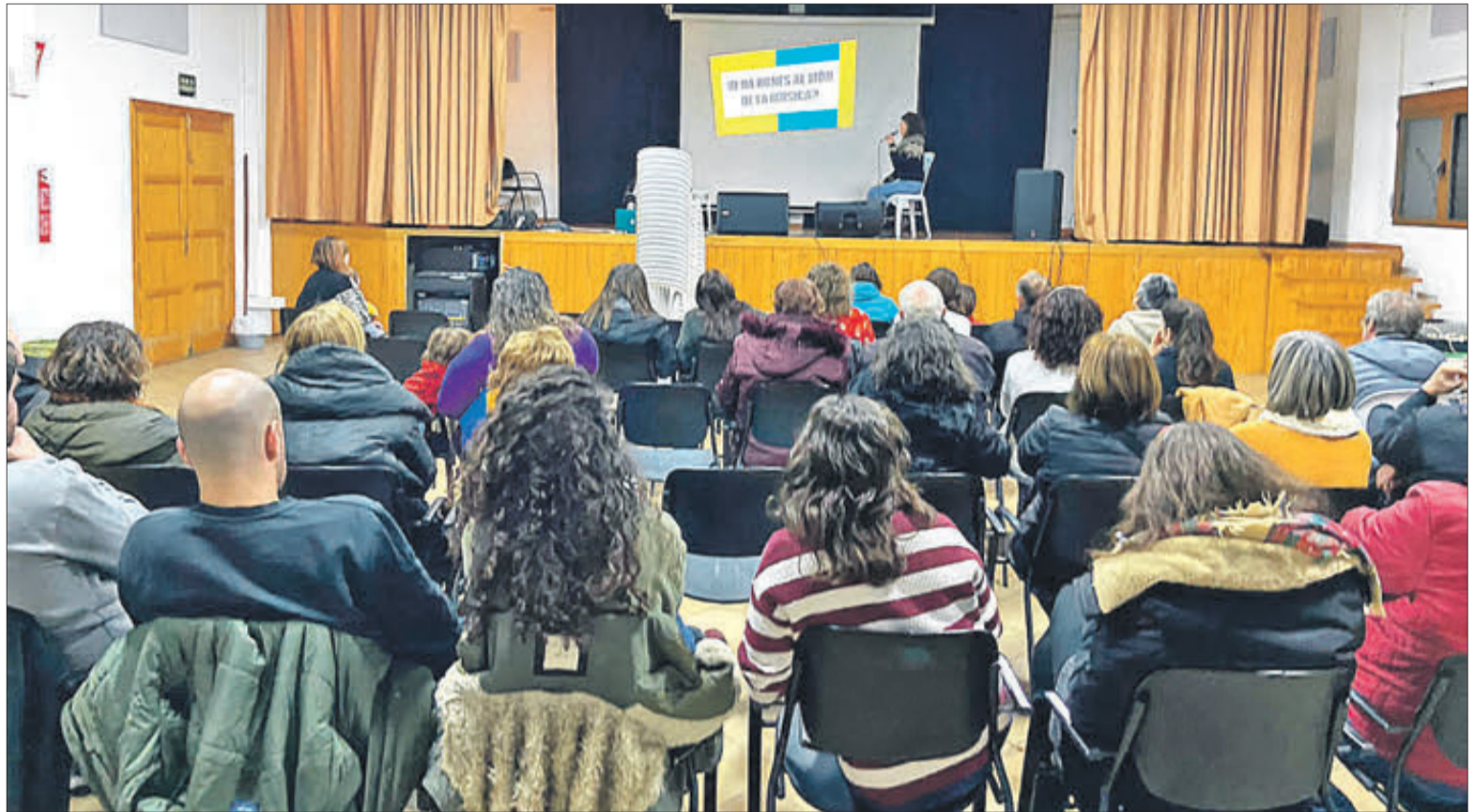
L'acte de presentació va tindre lloc a la Casa de Cultura d'Agres.

Sota el lema Arrelats a tu, la Generalitat ha centralitzat el Dia de l'Arbre amb un munt d'accions als parcs naturals i tres dates clau en cada província. La primera, el 27 de gener, a l'Albufera de Gaianes, on van participar prop de 150 escolars d'entre 2 i 12 anys de Gaianes, Agres i Alfafara, i on s'han desenvolupat tasques de repoblació i coneixement de la mateixa albufera