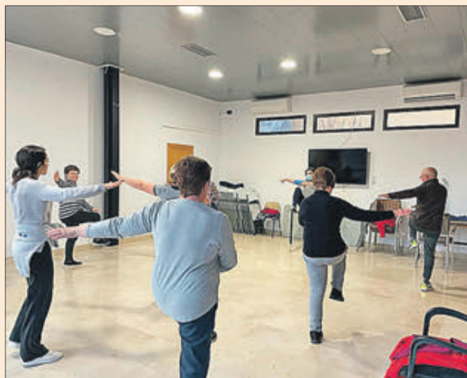
Una de les sessions celebrades a Fageca

Entre els seus diferents beneficis, la pràctica regular d'activitat física afavoreix un cor saludable, millora l'atenció, la memòria i el llenguatge, i millora l'estat d'ànim