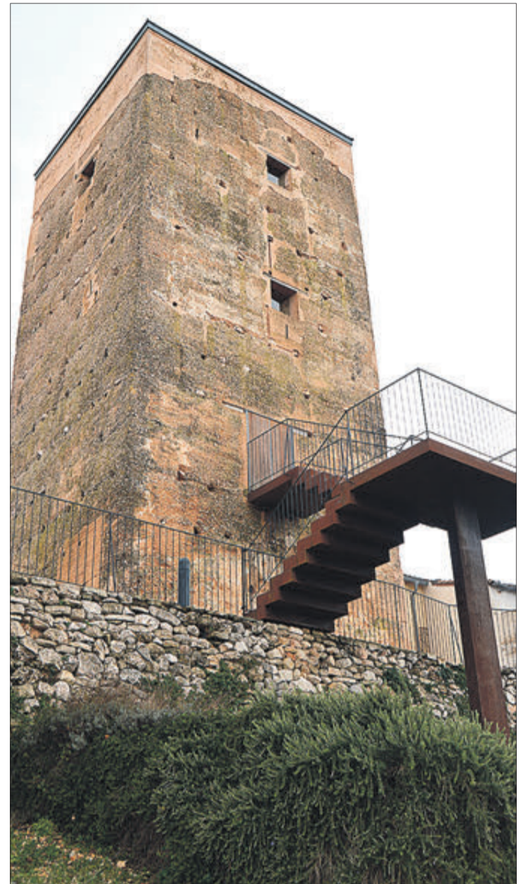
La torre d'Almudaina.

EL SEU PRINCIPAL RECLAM ÉS UNA TORRE D'ORIGEN ISLÀMIC