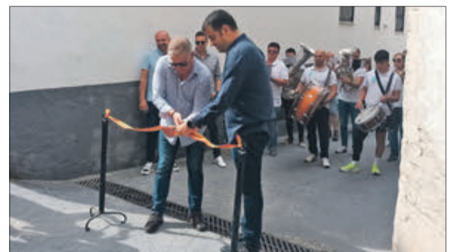
Moment de la inauguració.