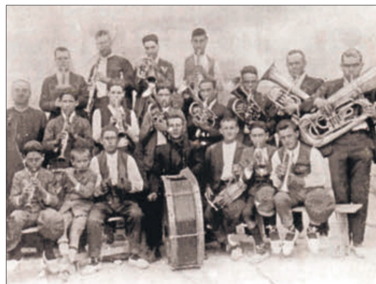
Una imatge de 1923.