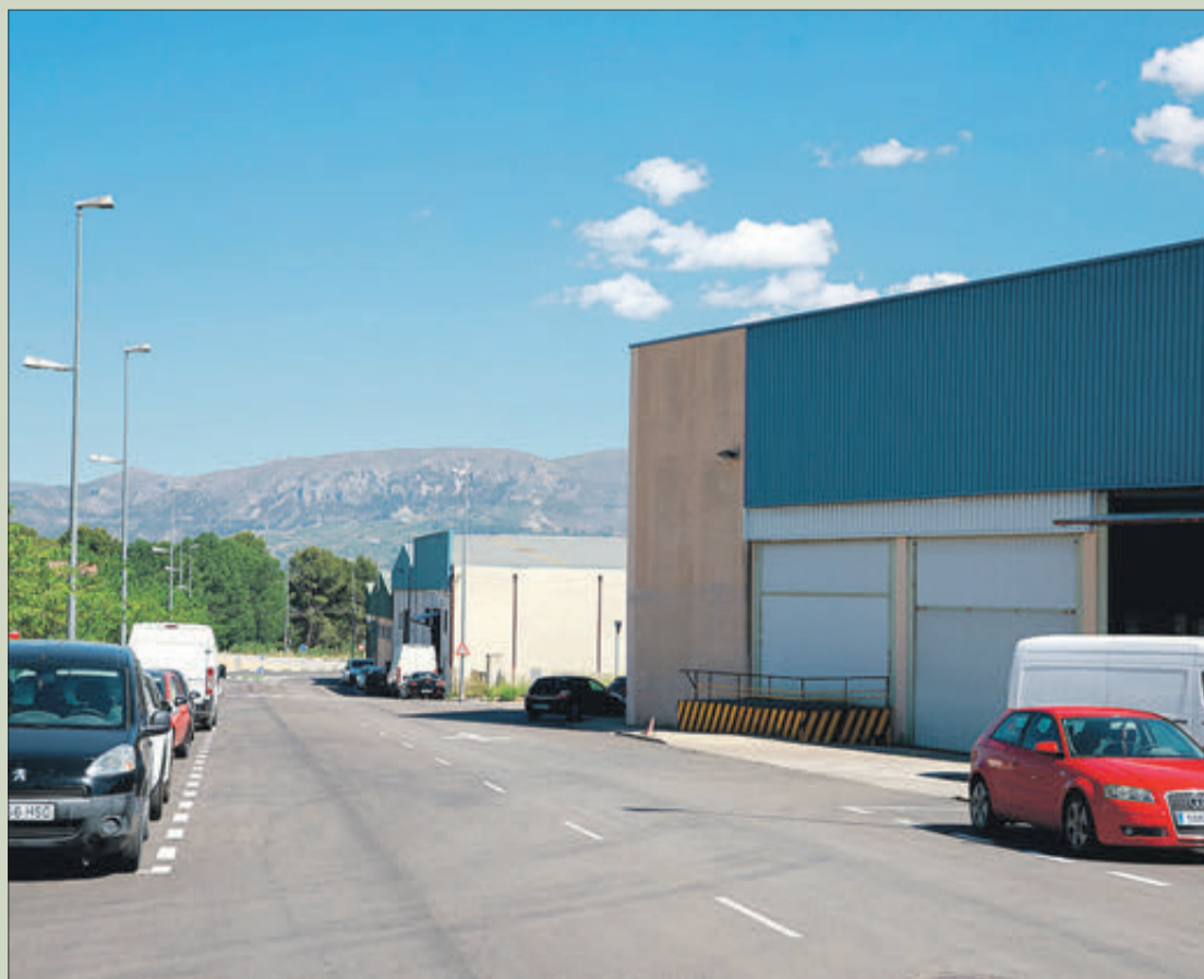
Una zona industrial en el municipi de Gaianes.

"Tot això consolida la presència de les empreses en les àrees i serveix com a atractiu per a aquelles empreses que desitgen implantar-se o créixer en el nostre territori", va concloure el dirigent. Quam tem co