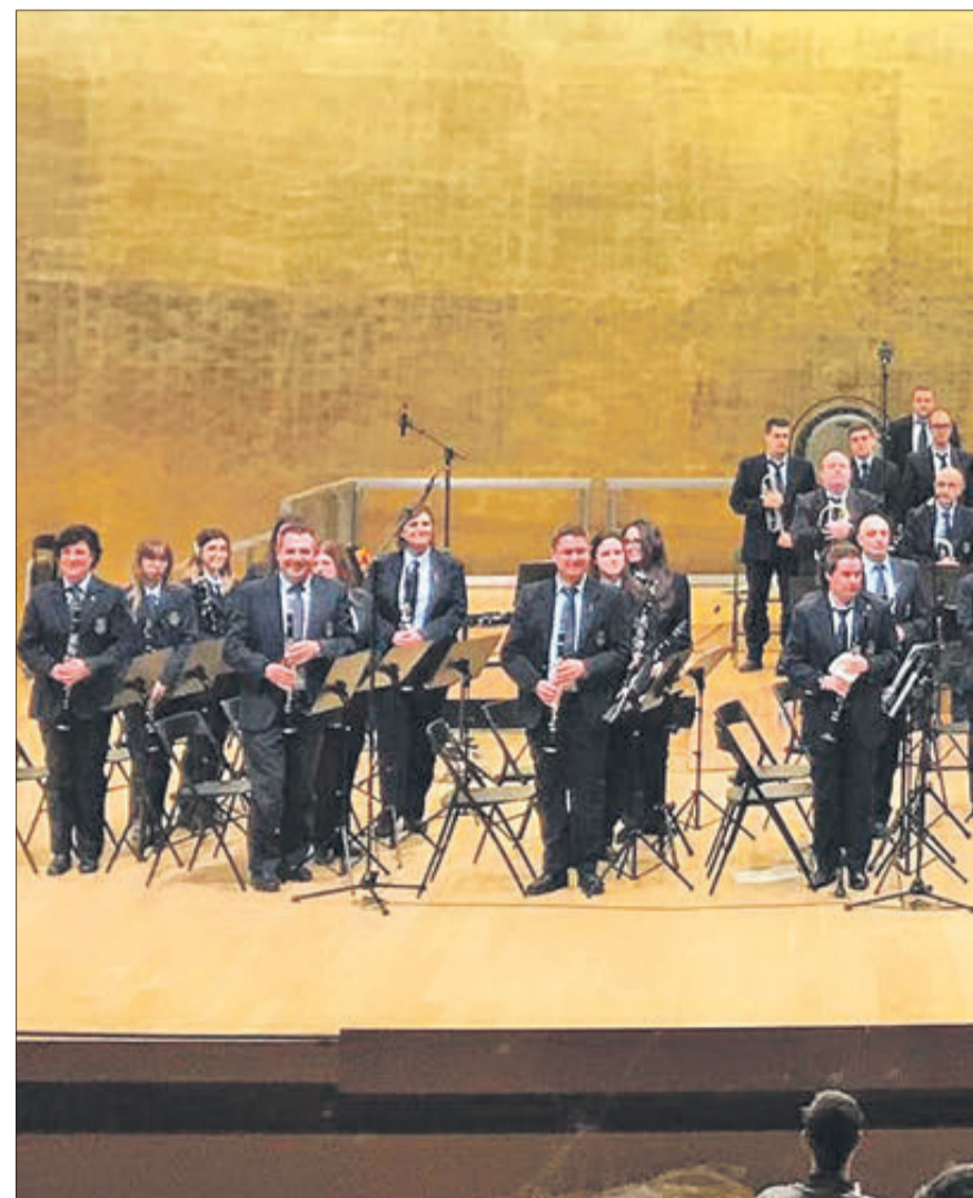
Un concert en l'ADDA d'Alacant.