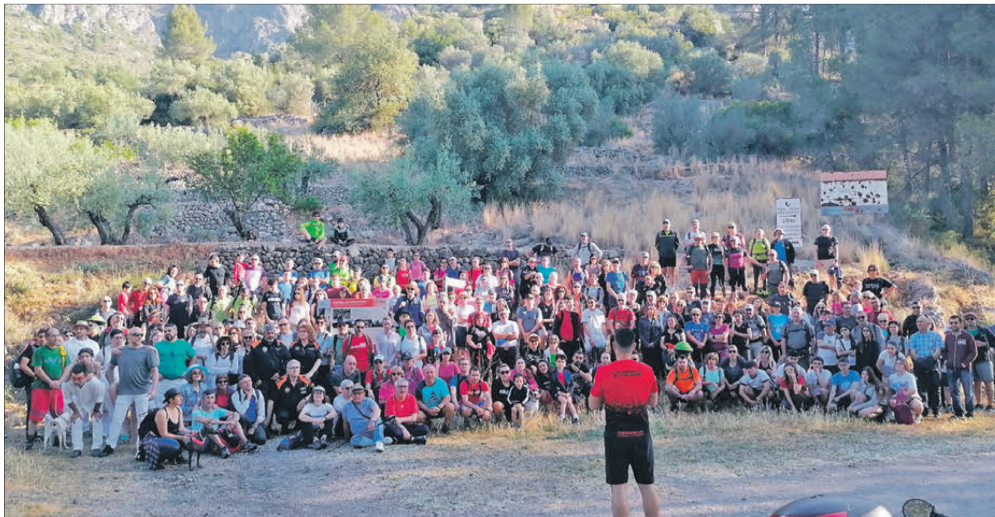
Els participants en la ruta es van fotografiar per a deixar constància de la trobada.