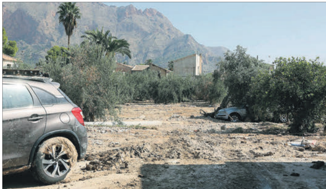
Camí afectat per les pluges.