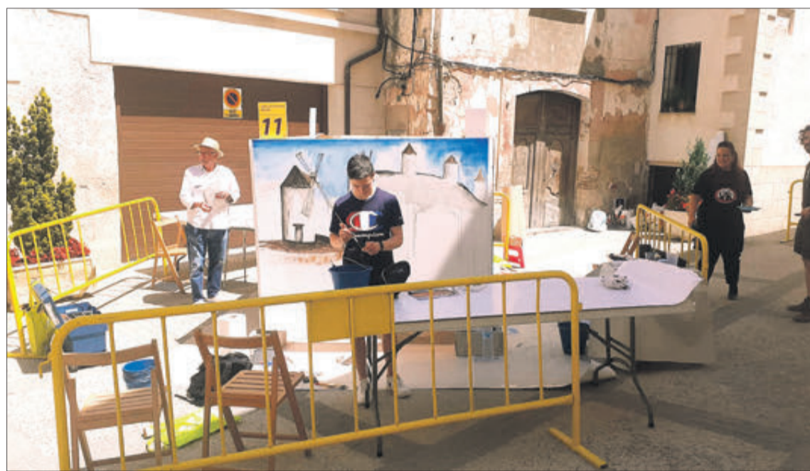
Artistes en plena tasca de creació, en la passada edició.

OFERTA CULTURAL I GASTRONÒMICA (3 I 4 DE JUNY)