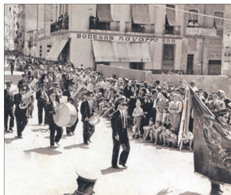
1953. A Alacant.