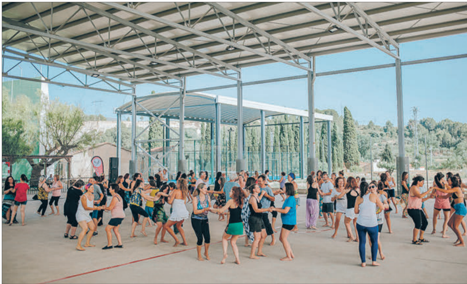
L’activitat ja va tindre l’any passat com a seu el municipi de L’Alqueria d’Asnar.

Aquesta sisena edició de ‘Mujeres en Movimiento’ tindrà lloc el 20 de maig en el poliesportiu de L’Alqueria d’Asnar,