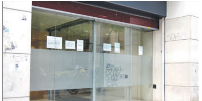
Oficina comarcal del SERVEE.

(de 6 a 10), Benimarfull (de 12 a 15) i Benasau (de 6 a 9). A més, la xicoteta Famorca, sempre amb un o zero desocupats, ara té dos. En canvi, l'alegria s'aprecia en municipis com Beniarrrés (de 67 a 63), Benilloba (de 57 a 55), Alfafara (de 25 a 23), Alcoleja (d'11 a 9) i Benillup (de 5 a 3). L'esmentada Beniarrrés continua sent la població amb major atur, seguit de Benilloba, Gaianes (38), Planes, Agres (tots dos amb 32), L'Alqueria d'Asnar (28) i L'Orxa (27).