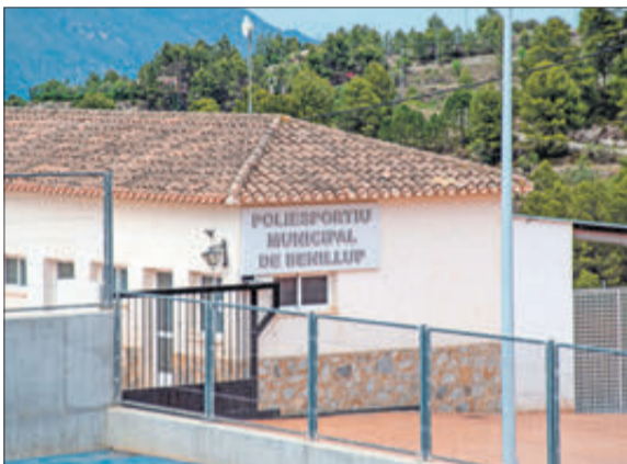
Entrada al poliesportiu, l'ajuntament i el museu etnològic.