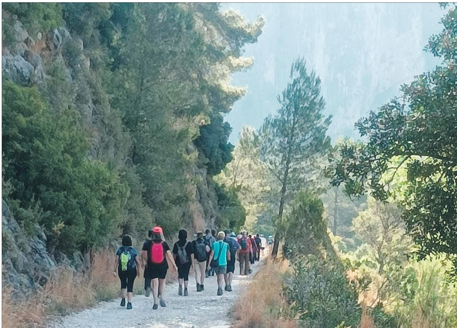
Fent camí per la Via verda.

Es tracta, ressalten els seus organitzadors, d'una jornada de cultura popular valenciana en l'epicentre de la Via Verda del riu Serpis. En l'esmorzar van poder degustar el plat típic de la zona, el blat picat, mentre el bon ambient es va mantindre al llarg de tot el dia.