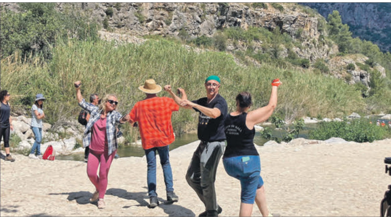
Actuacions diverses per a amenitzar la jornada.