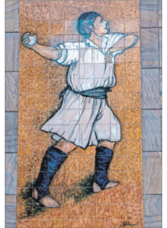
Mosaic d'un pilotari.