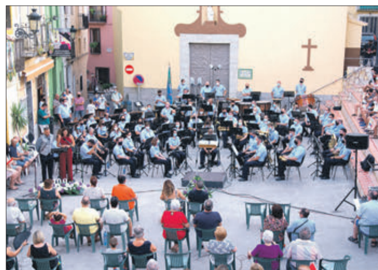
Concert a Castell de Castell, amb motiu del centenari.