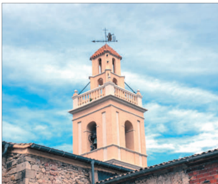
El campanar de l'església.

El seu nucli urbà s'alça sobre una lloma, tallada pel barranc del Sofre i pel de Caraita, que tan perillós s'ha tornat en els últims anys en períodes de pluja, Les vistes que es poden apreciar des de Benillup són excepcionals,