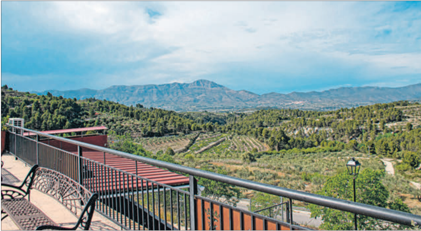
Magnífiques vistes des d'un dels miradors del municipi.