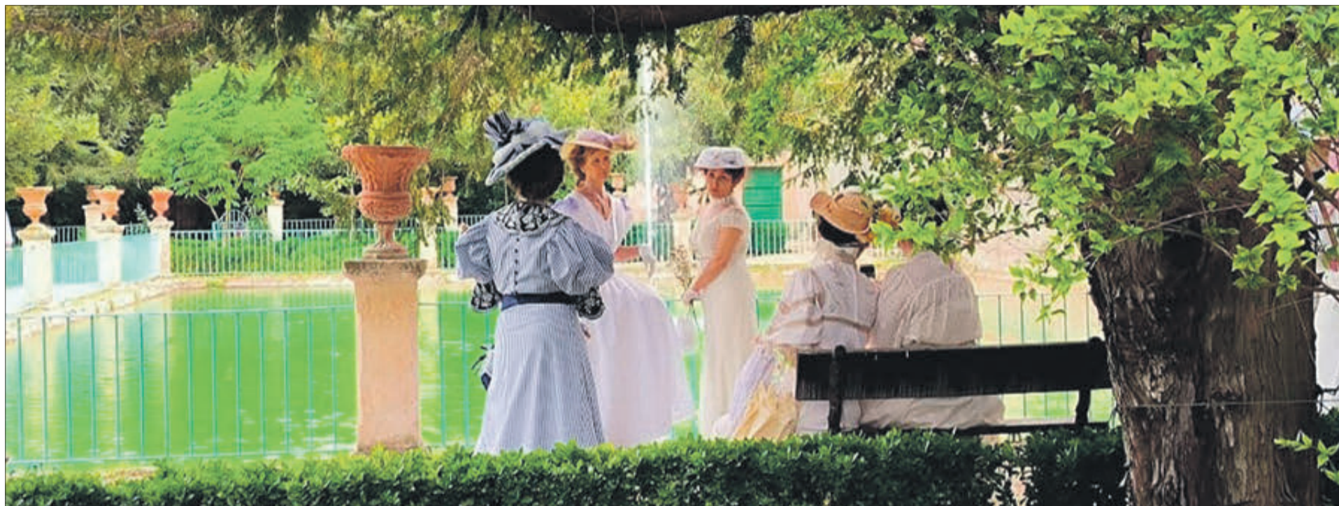
Membres de l'Associació d'Amics del Modernisme d'Alcoi, al Jardí de Santos.

PROPOSTA DE L'INSTITUT ALACANTÍ DE CULTURA JUAN GIL-ALBERT