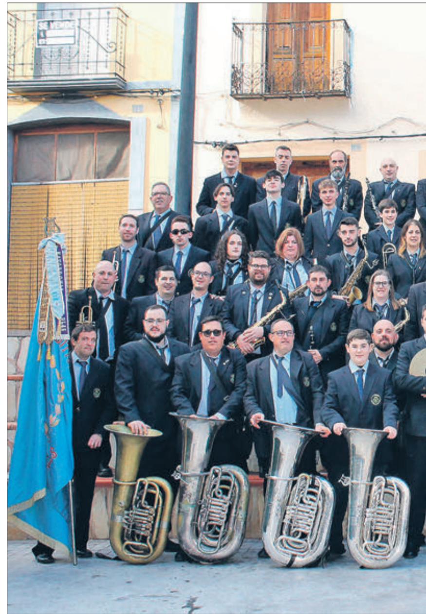
La banda de Castell de Castells, en una imatge de 2021 durant la celebració de Santa Cecília.