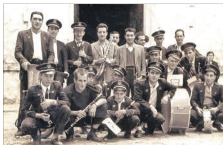
Músics a l'any 1953.