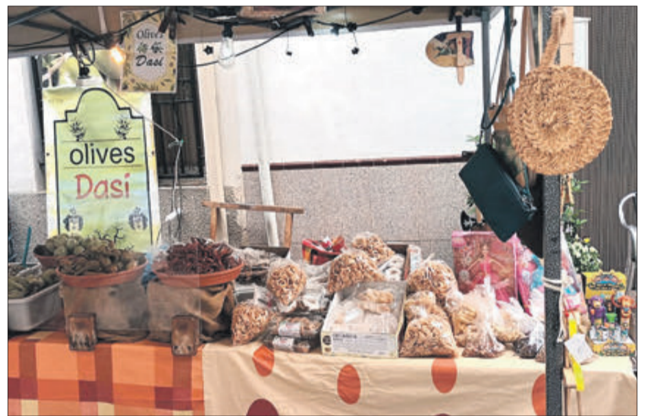
Nombroses parades de venda de productes es van instal·lar als carrers del municipi.