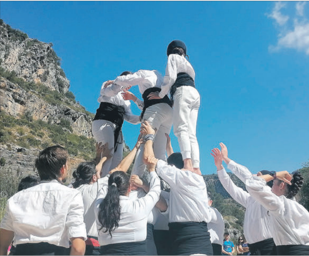
Va haver-hi participació de les muixaranges.