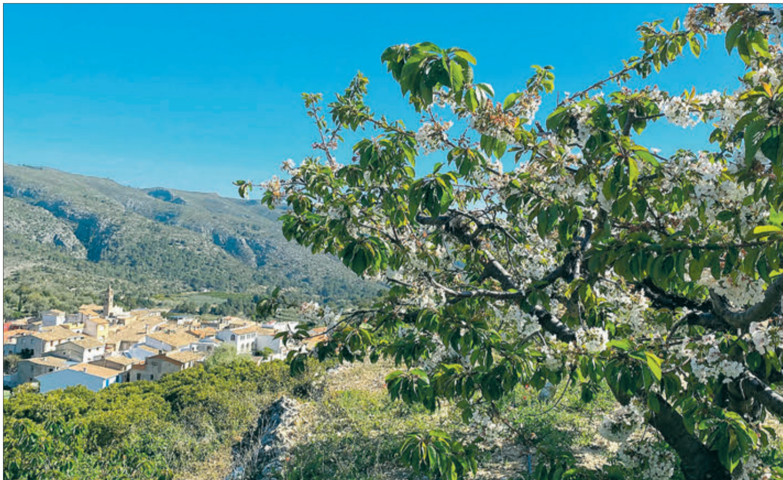
El canvi climàtic és una de les principals raons d'aquests anys tan desastrosos per a la cirera.

La problemàtica afecta a diversos municipis de la Mancomunitat del Xarpolar, els situats a la Marina Alta (La Vall d'Ebo i La Vall d'Alcalá),