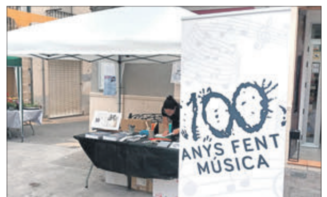
La banda va posar a la venda el llibre del centenari.