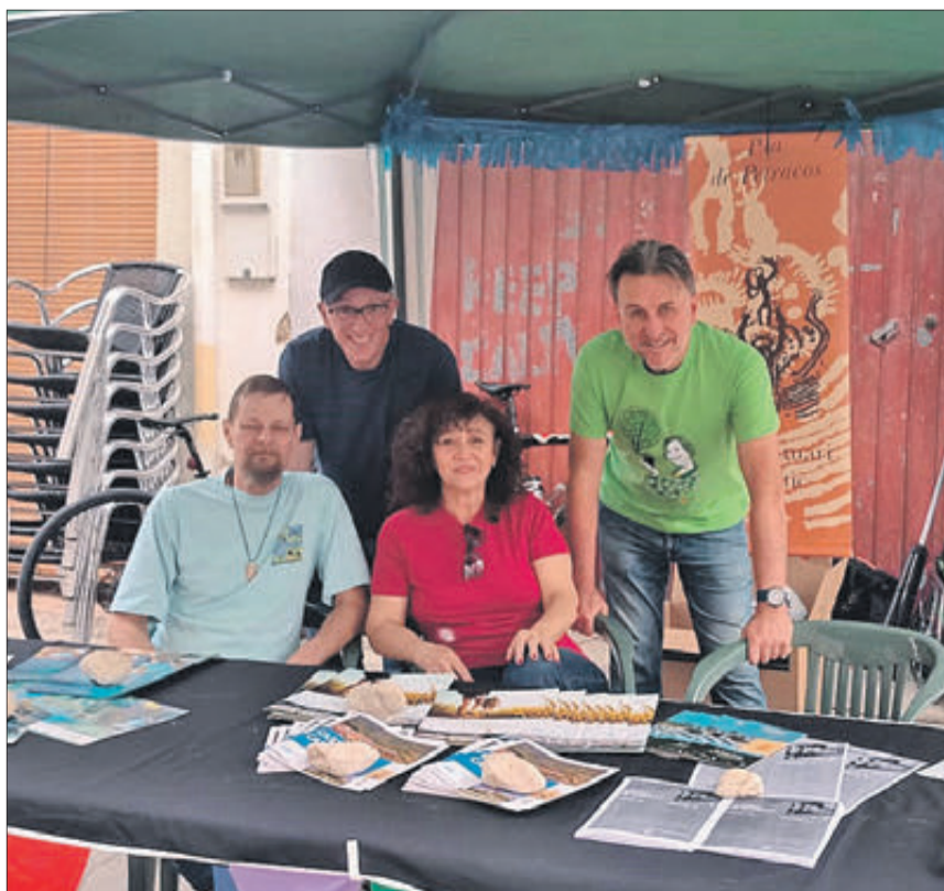
Uns dels participants a la Fireta 2023

Els actes dominicals van finalitzar amb un taller de màscares venecianes, l'actuació del duet 'Chill Factor' i del grup infantil 'Marcel El Marcià'.