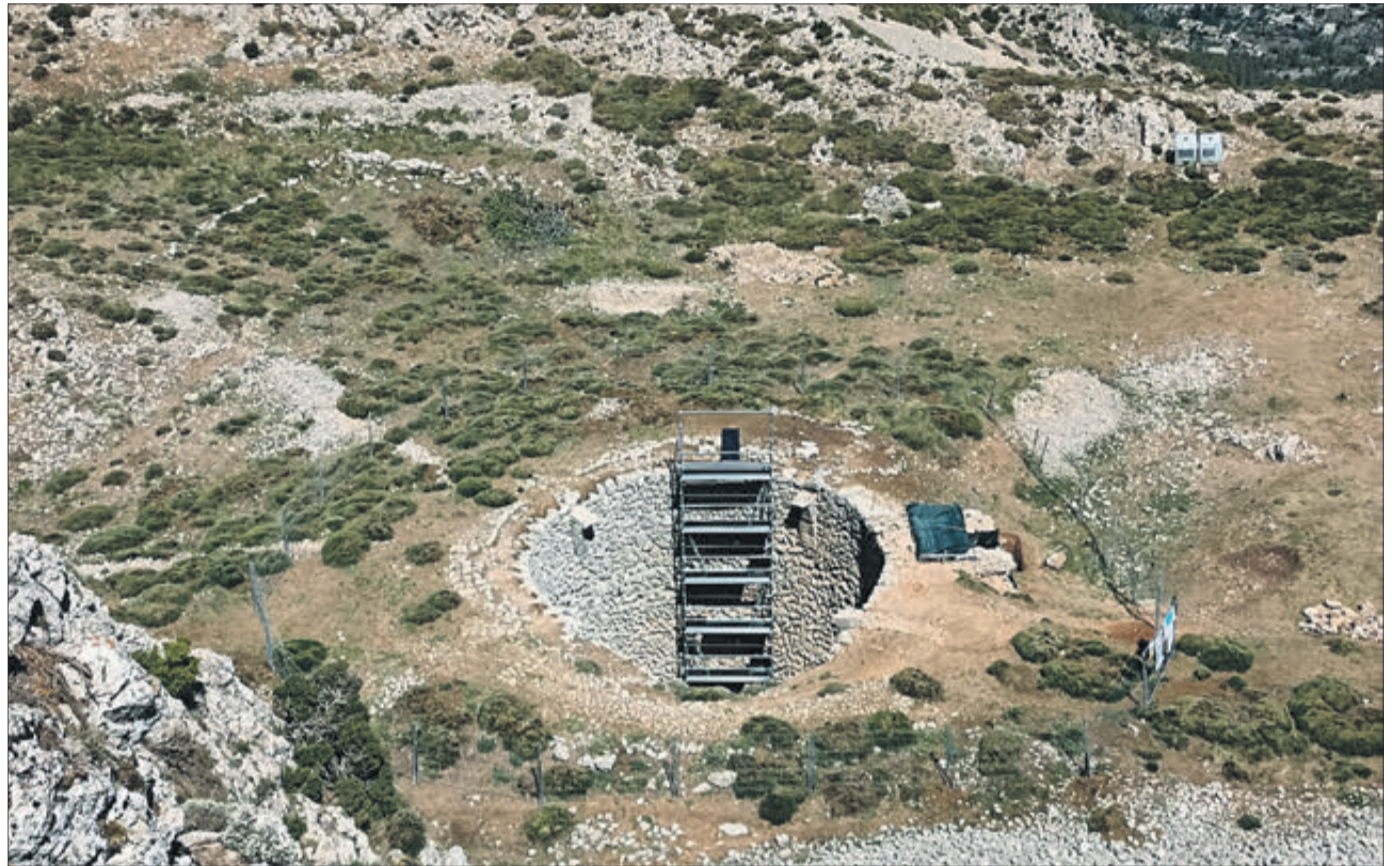
Vista aèria de la cava en la que serà rehabilitada.

Una vegada finalitzada la primera actuació, informen des del consistori, es treballarà en la redacció d'un nou projecte de restauració i rehabilitació de majors dimensions.