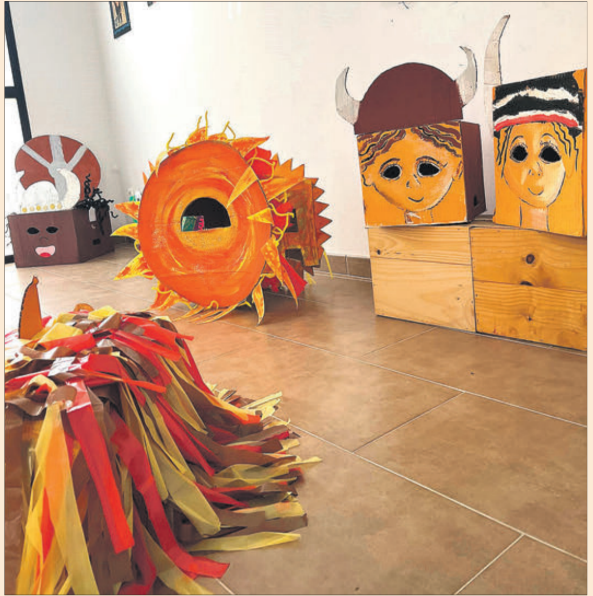
L'exposició es pot veure en la Casa de Cultura de Millena.