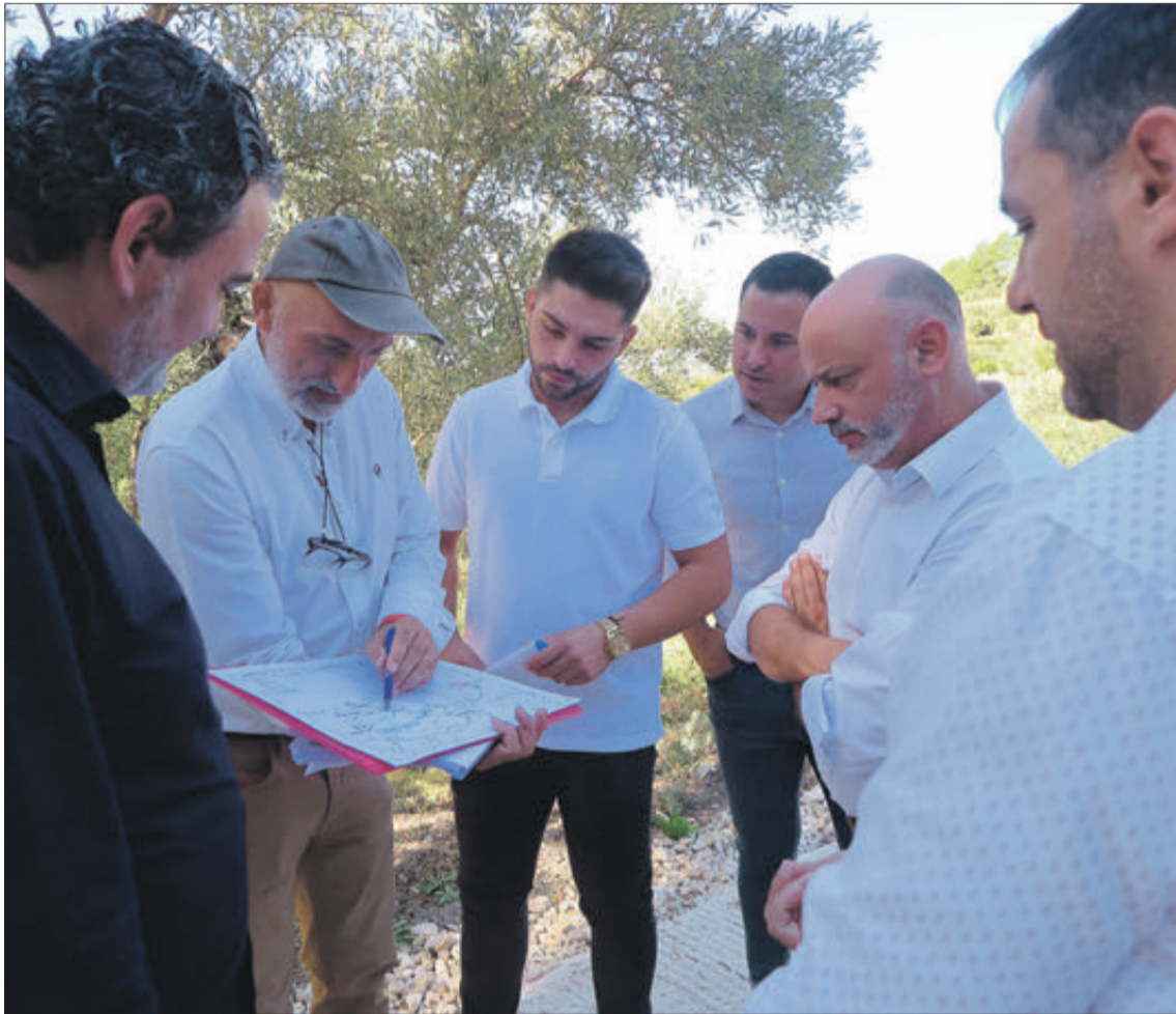
Assistents a la trobada que va tindre lloc en el municipi de Quatretondeta.

Per al portaveu socialista, la solució és fer una altra intervenció. "Els ponts estan plens de clivelles i haurien de tindre una grandària perquè passe una formigonera o un camió, o simplement fer més fàcil el pas de l'autobús escolar". Canviant el guarda rails es guanyaria en amplària.