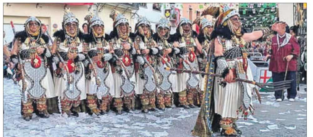
Una esquadra en la desfilada de les festes de Planes.