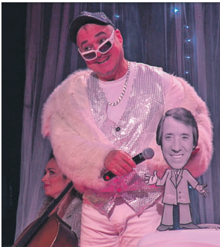
Escena d'una obra de Maracaibo Teatre.

La festa final serà a un municipi de la mancomunitat, amb música de DingoLondango Quartet i lliurament de premis de tots dos concursos.