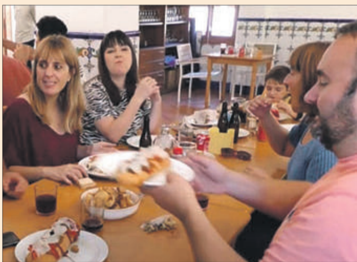
Participants en la jornada gastronòmica i un dels plats que es van poder degustar.

¡Volem ser més valencians i més lliures!