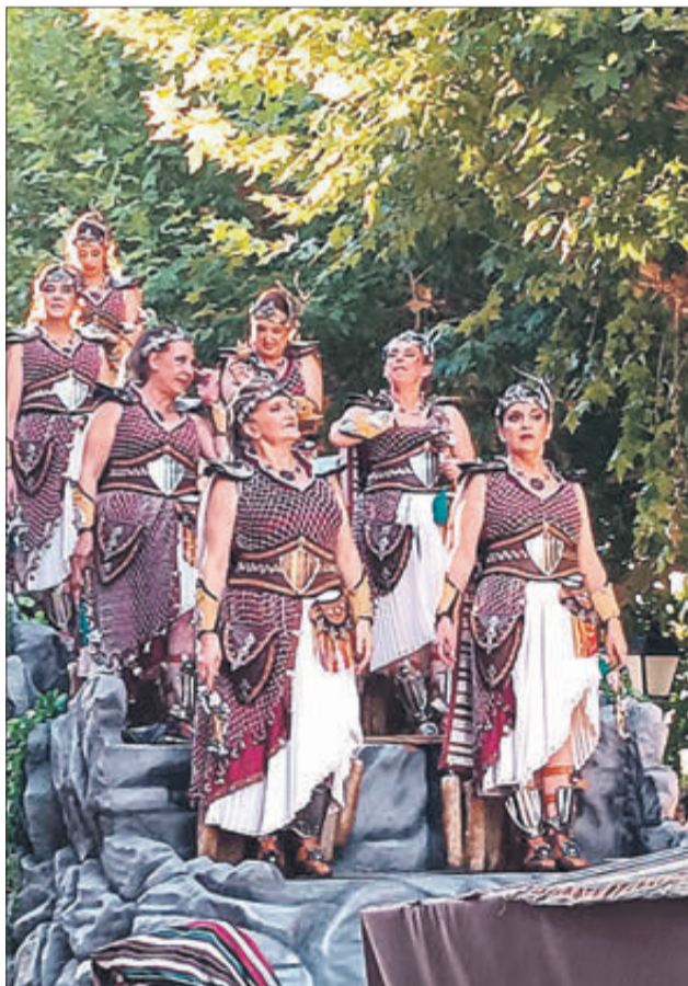
L'Entrada de Moros i Cristians va resultar espectacular.