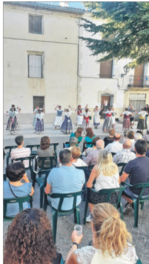
Les festes de 2023 seran recordades durant molt de temps a Benifallim.