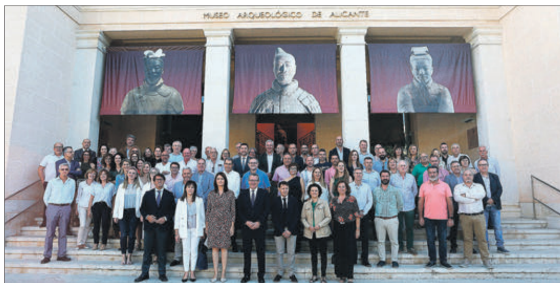
Els assistents a la jornada, fotografiats a les portes del MARQ.

Totes dues mancomunitats conviden a tota la ciutadania a participar d'unes jornades especials, amb l'intenció de remoure la consciència col·lectiva i gaudir d'un meravellós entorn que esperem torne a renèixer amb el temps.