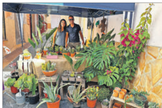
La Fireta de Fageca va estar molt concorreguda.