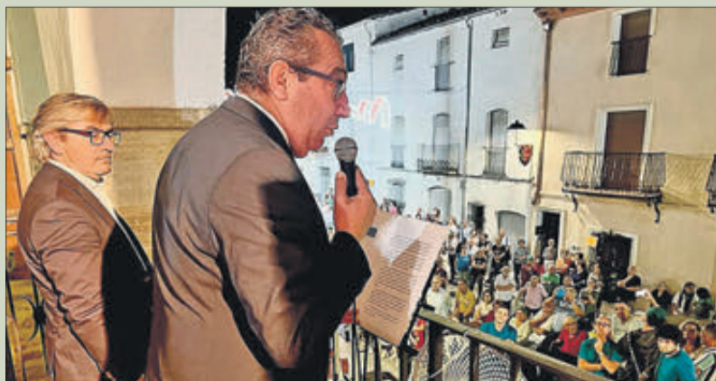
El president de la Diputació d'Alacant durant el pregó.