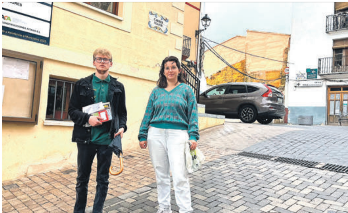
Els dos joves que realitzen pràctiques a Agres.

Els joves trien un projecte que els motive i quan es produeix una coincidència poden començar la seua activitat, pagada en tot moment per Europa: beca, viatges d'anada i tornada, allotja-