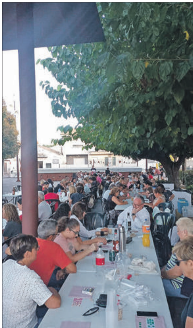
Diferents imatges de les festes de L'Alqueria.

Els actes festius van concloure el 29 de setembre, dia de Sant Miquel, amb una missa a les 19 hores per a rendir un sentit homenatge al patró. Final de festa amb concert de La Xafigà.