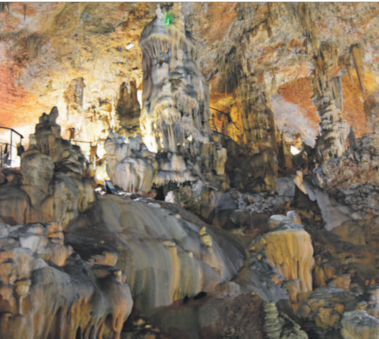
La Cova del Rull, un lloc per a visitar a Vall d'Ebo.