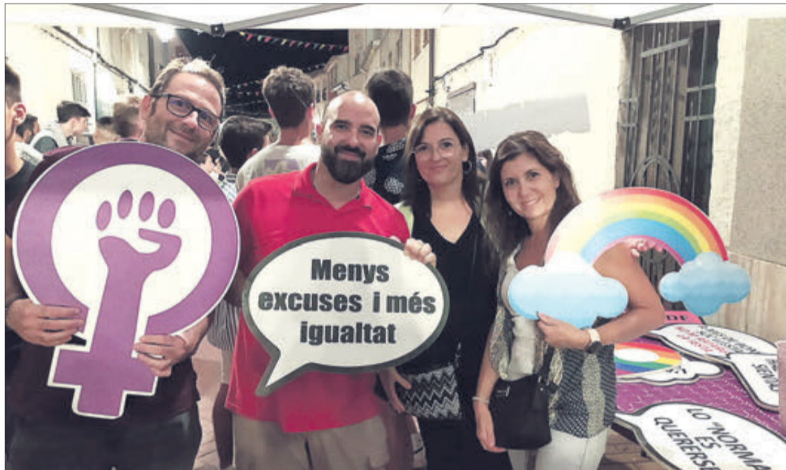
Un dels Punts Violeta instal·lats aquest estiu en les festes dels pobles.

En Alcosser es van produir tres intervencions en plena situació d'inseguretat per la tendència masclista de les