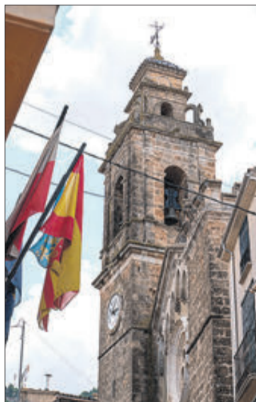
Alfafara acull un dels actes.

Les actuacions es duran a terme a diferents municipis entre els mesos d'octubre i novembre. La primera de les cites serà el 14 d'octubre, quan es passarà el documental a la Casa de la Cultura de l'Alqueria d'Asnar. La presó de les dones narra la història de preses valencianes a l'època franquista i recull els seus testimonis i la repressió de gènere que van patir. Després de la projecció, les persones assistents podran compartir les seues reflexions amb els directors. A més de l'Alqueria d'Asnar, Alfafara i Beniarrés també