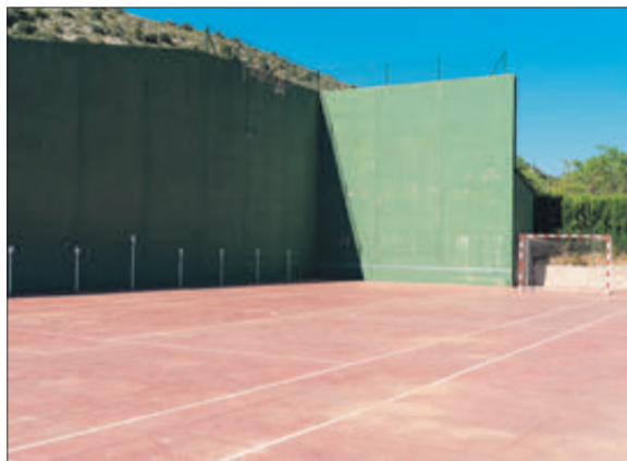
Frontó i pista poliesportiva.