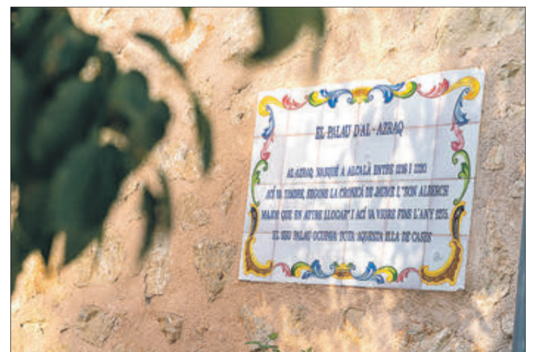
Un panell ceràmic dona compte del naixement d'Al-Azraq