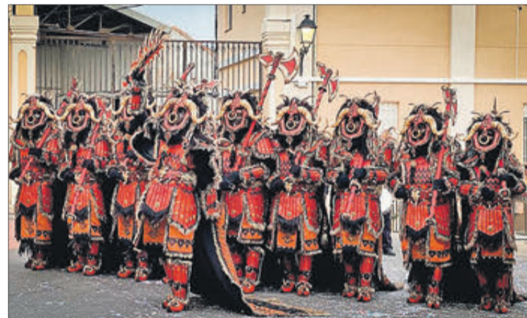
L'Entrada de Moros i Cristians va ser l'acte més destacat i seguit de les festes de L'Alqueria d'Asnar.