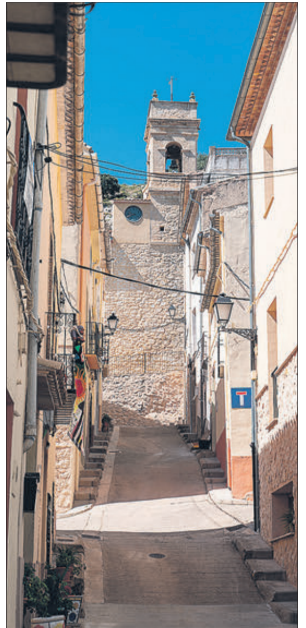
Un carrer del poble.