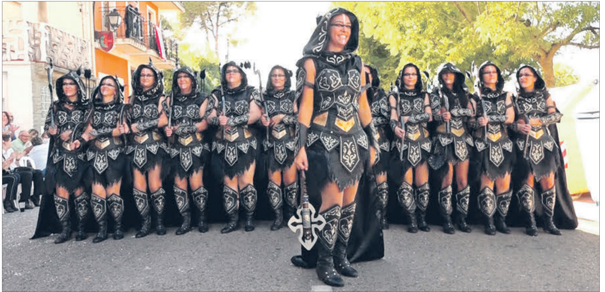
Una de les esquadres especials del bàndol cristià.

EL PLAT FORT VA ARRIBAR AMB L'ENTRADA DE MOROS I CRISTIANS, EN LA QUAL VAN PARTICIPAR UNES 300 PERSONES