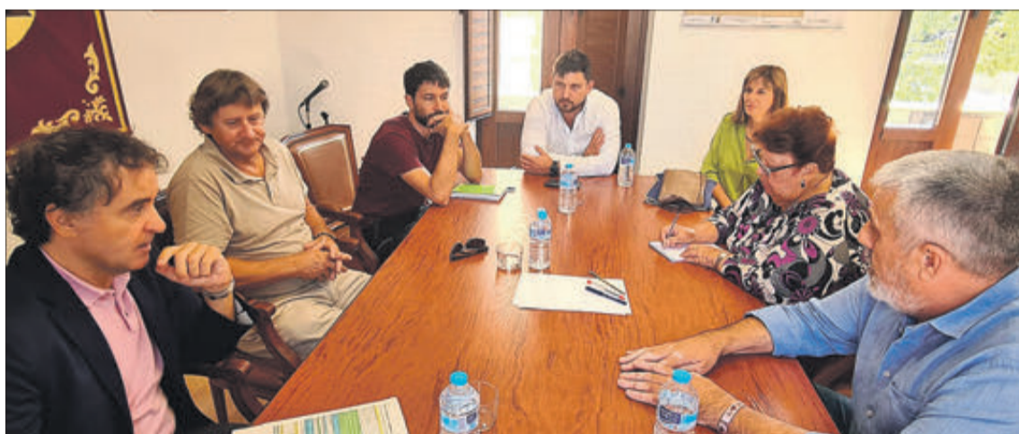
Un moment de la reunió mantinguda a Vall d'Ebo.