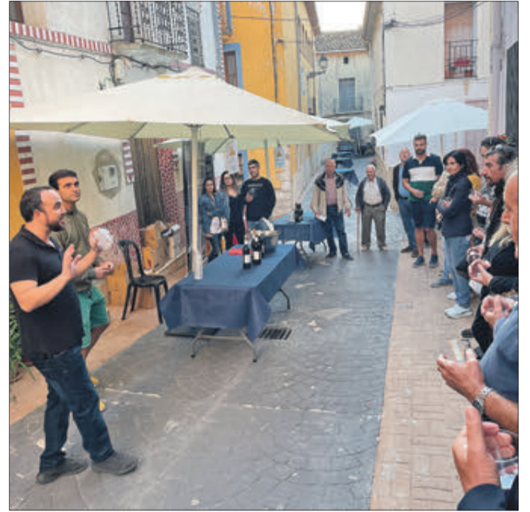
El públic que va poder gaudir de nombroses activitats i venda de productes típics.

AMB INFINITAT D'ACTIVITATS I VENDA DE PRODUCTES