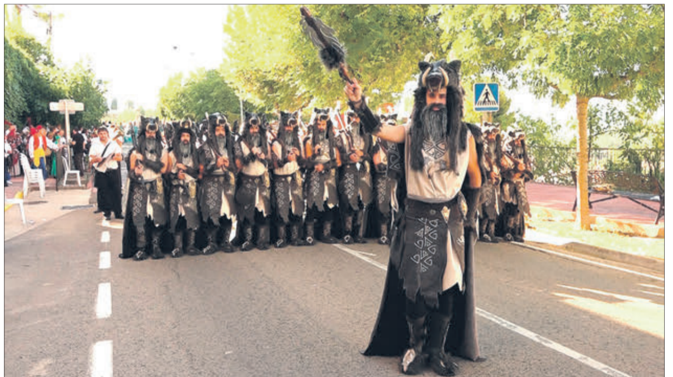
L'Entrada va estrenar un nou recorregut.

Van finalitzar els actes amb una processó a la vesprada-nit i castell de focs artificials.