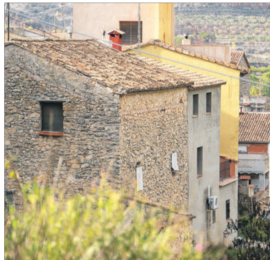
Vista del municipi de Vall d'Alcalà.

– Els serveis bàsics estan garantint i estem millorant en uns altres. Hi ha una xicoteta oferta de treball, en hostaleria sobretot. L'agricultura ara està malament pel greu incendi que hem