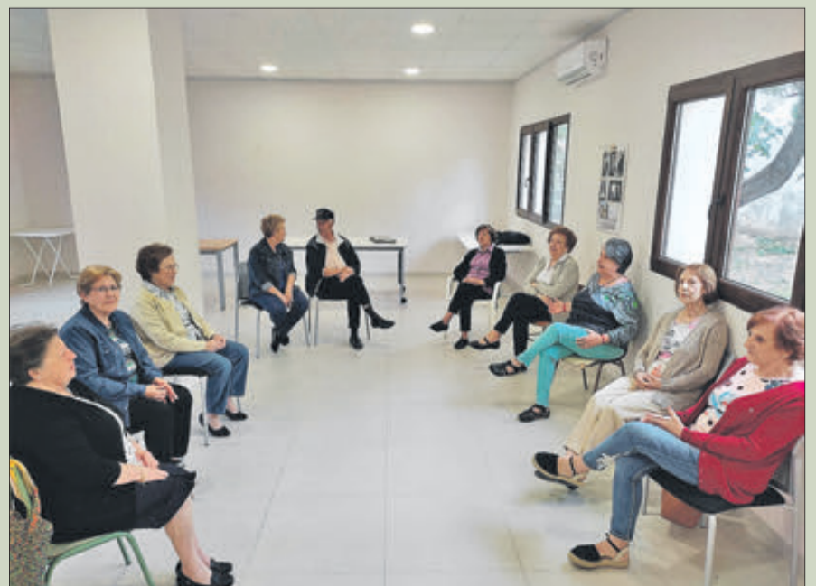
Participants en el taller de memòria activa.

Tota aquesta proposta s'enquadra dins d'un espai de seguretat, on expressar-se sense prejudicis i on no hi ha res que estiga bé ni malament, perquè tot és vàlid.