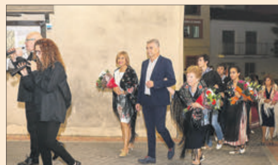
Alguns passatges de les festes de Benifallim.