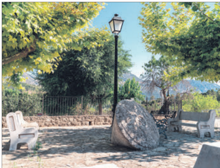
Una zona de descans.

El seu nom procedeix d'una sèrie de cavitats o depressions del sòl (tollos) i els seus orígens són mossàrabs. De fet, al llarg de la conquesta cristiana