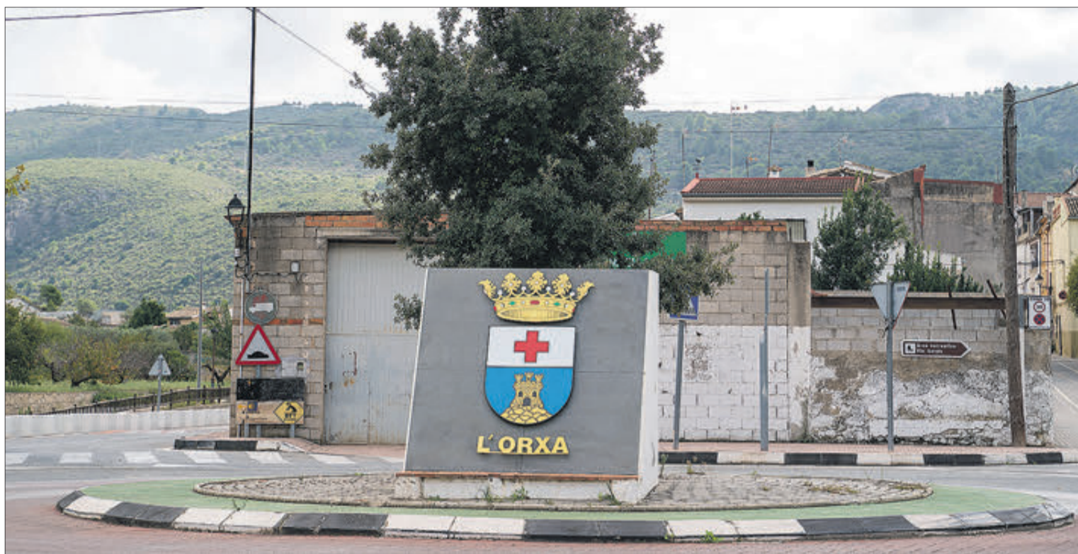
L'Orxa es un dels municipis beneficiats per les ajudes.

INVERSIÓ PRÒXIMA ALS 680.000 EUROS EN 32 MUNICIPIS, ALGUNS DEL XARPOLAR