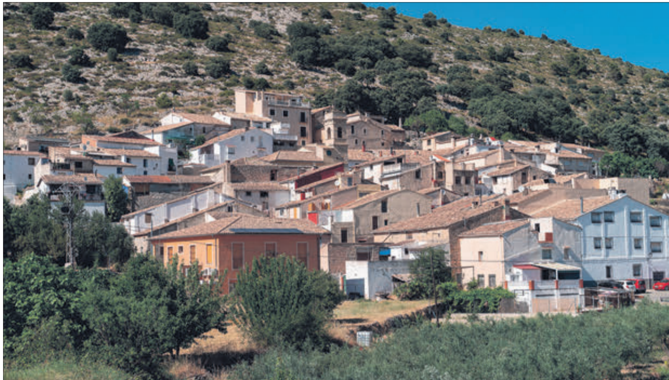
Vista panoràmica del municipi.