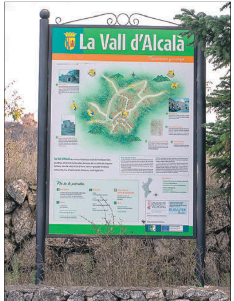
Un panell informa de rutes i paratges, en Vall d'Alcalà.