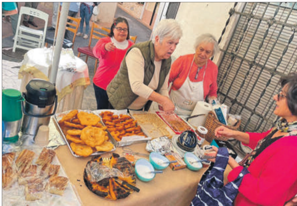
Als carrers del poble es van instal·lar nombroses parades de venda de tot tipus de productes.

La jornada del diumenge es va centrar en una xarrada amb el pastor i una ponència sobre els usos tradicionals de les plantes de Fageca.