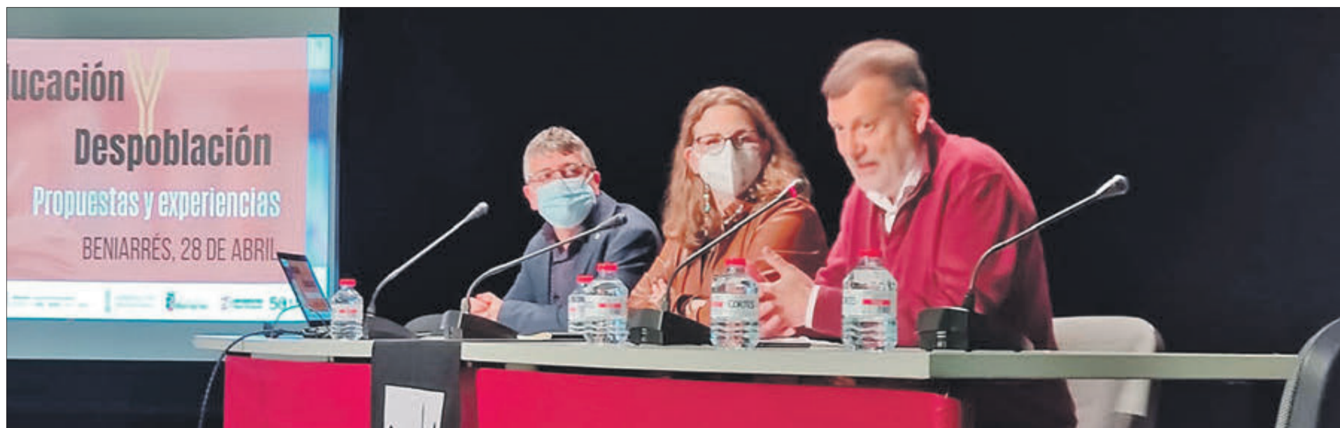
Ponents de la jornada 'Educació i Despoblació'.

EN UNA JORNADA CELEBRADA A BENIARRÉS I ORGANITZADA PER AVANT