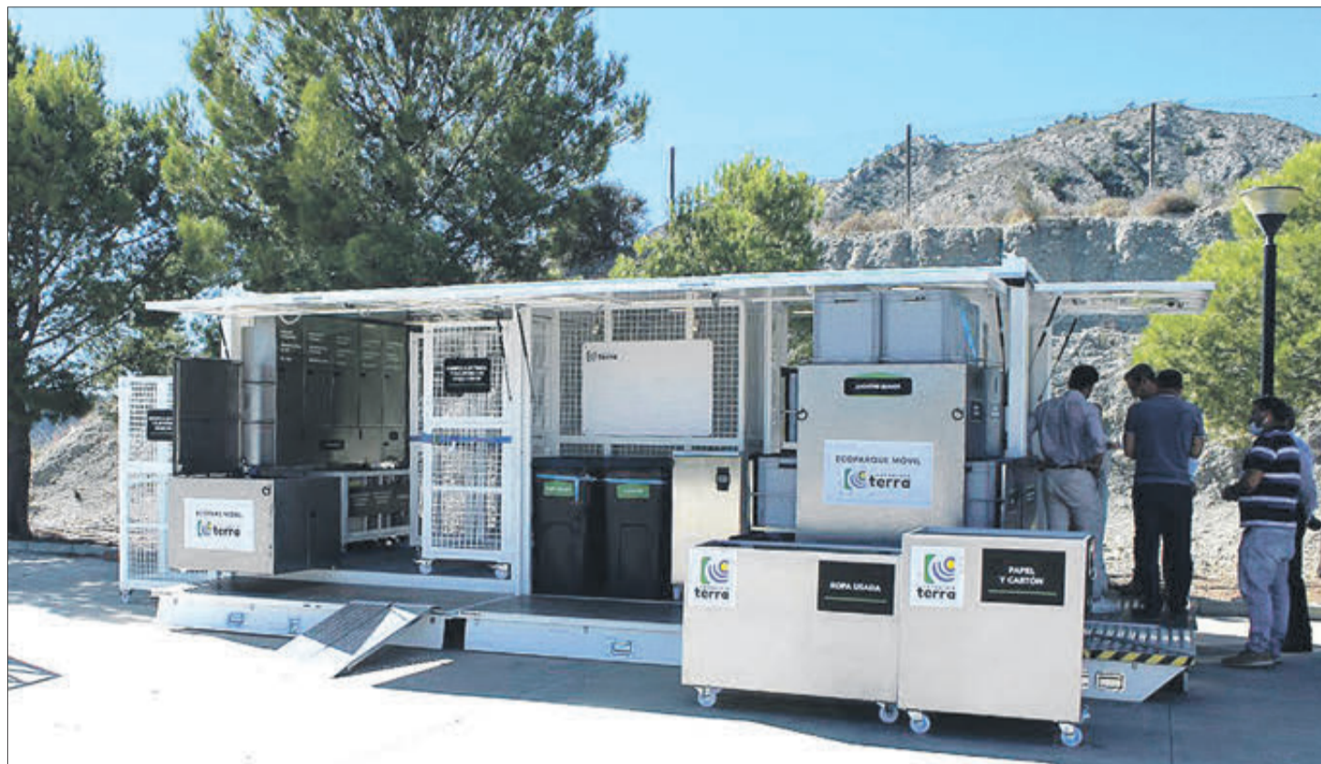
Ecoparc mòbil del Consorci Terra.

PEL CONSORCIO TERRA, FORMAT PER LA MAJORIA DE MUNICIPIS DEL XAPORLAR