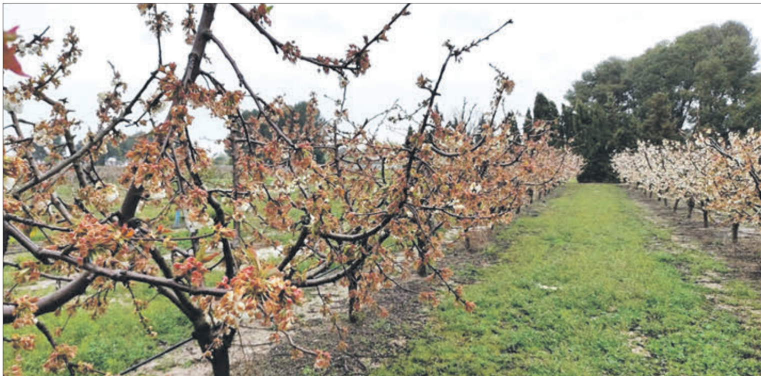
Diverses espècies que es cultiven en la zona s'han vist afectades

Les conseqüències de la gelada ocorreguda la matinada del 3 d'abril són desastroses, exposa el responsable d'Assegurances Agràries de ASAJA Alacant, Antonio Gascón, amb pèrdues de més de 22 milions d'euros per a l'agricultura alacantina. A més, molts agricultors no disposen de segur, lamenta el dirigent. Les temperatures la nit del 2 al 3 d'abril van ser molt baixes en molts punts de l'interior de la província, arribant a superar els -4 °C durant diverses hores. Aquesta circumstància va causar danys irreparables en les zones de cultiu de diverses comarques alacantines, entre elles El Comtat.