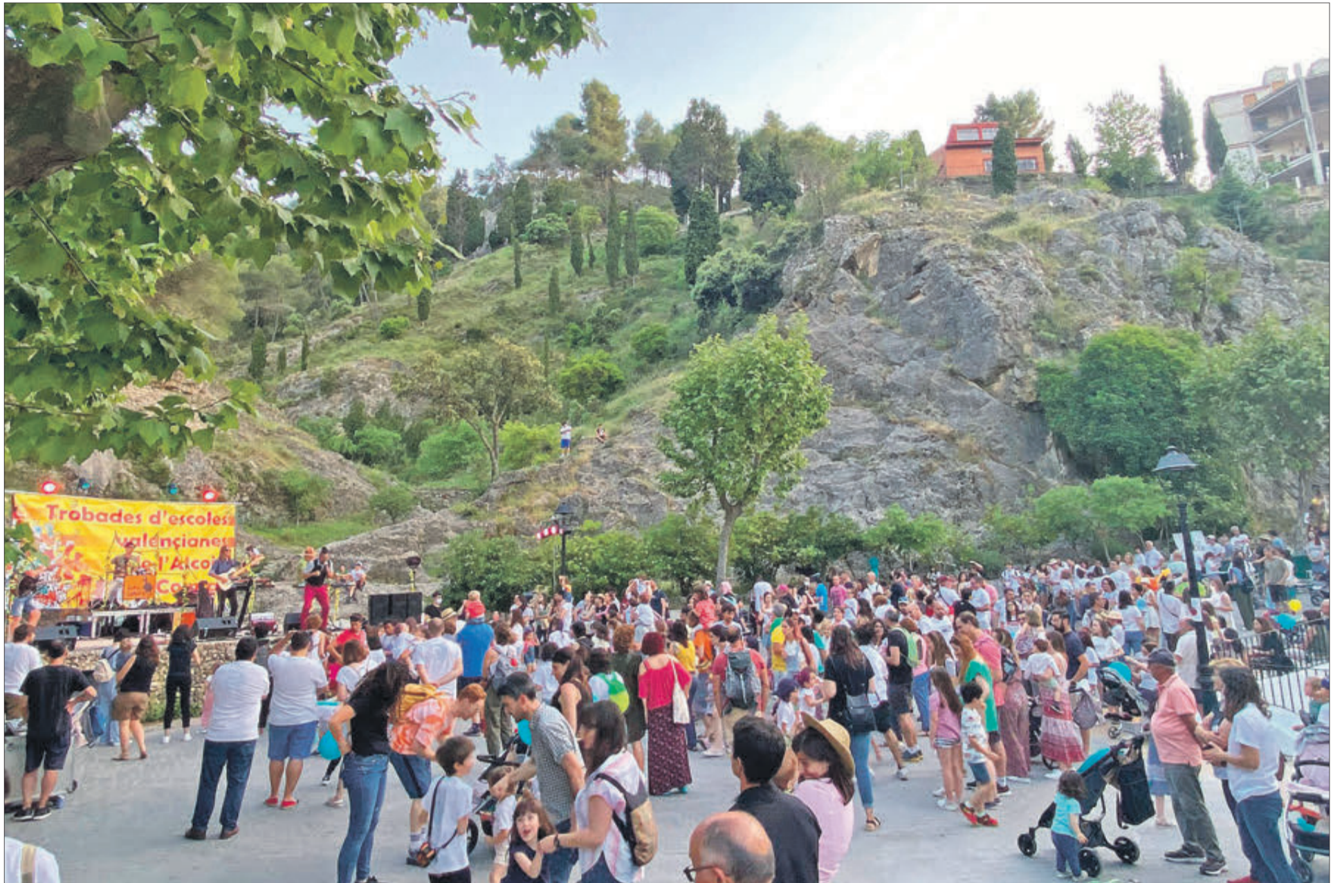
El municipi va rebre a gran quantitat de visitants durant la celebració.