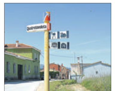
Un dels accesos al municipi.