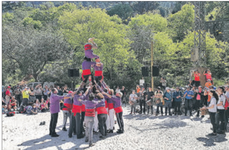
Els dos grups es van trobar en el paratge de la Fàbrica de la Llum, on va haver-hi música i activitats diverses.