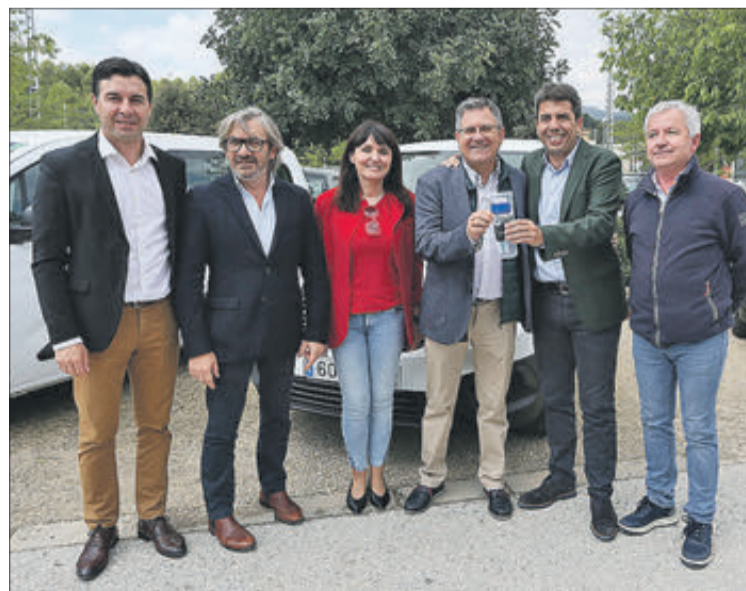
El president de Diputació entrega les claus.

El parc mòbil sostenible i els seus respectius punts de recàrrega, va concloure, "són la millor manera de lluitar contra la despoblació, donant serveis i fent que el dia a dia siga més amable, per la proximitat a les nostres comarques".