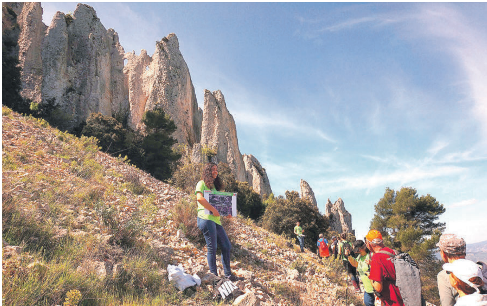
Es van donar a conèixer alguns dels esdeveniments que han ocorregut els últims 40 milions d'anys.