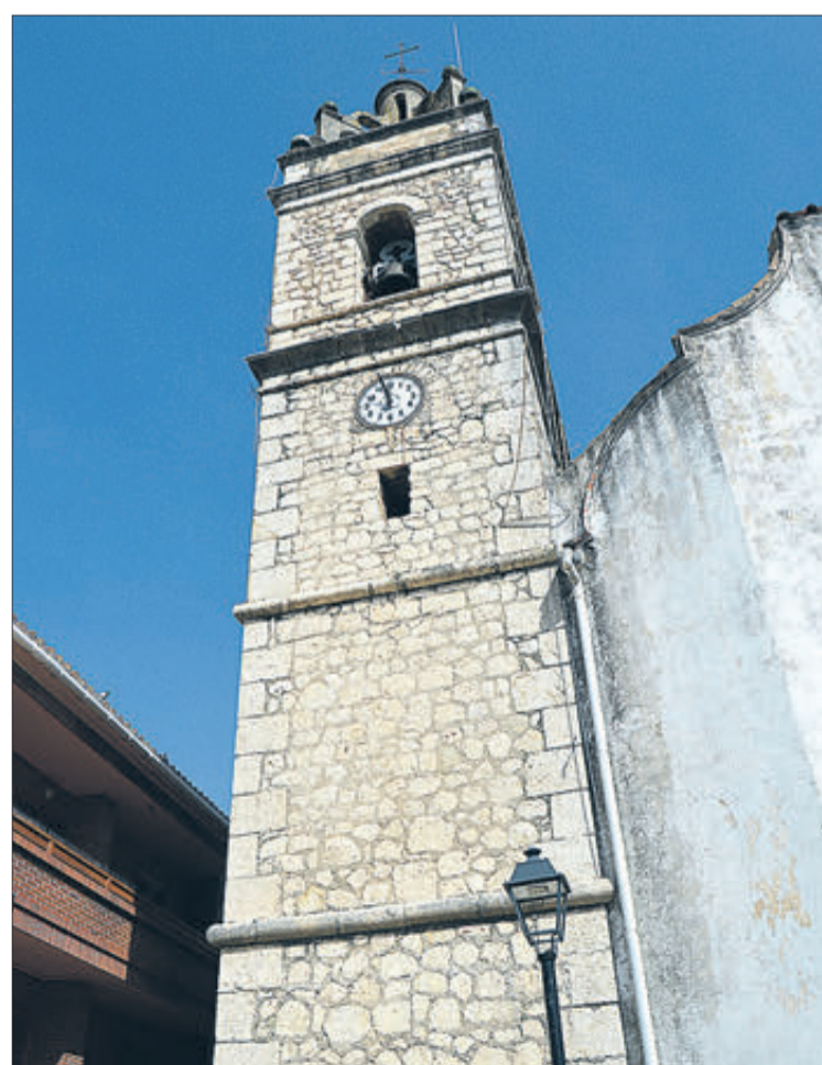
L'església i el Museu Etnològic.