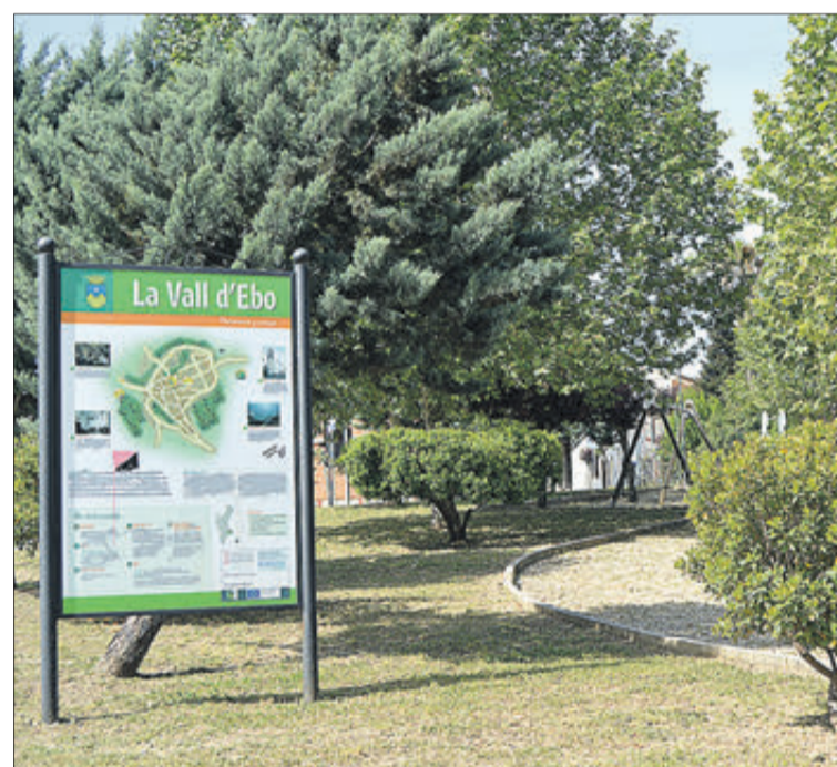
Una zona enjardinada, a l'entrada del poble.