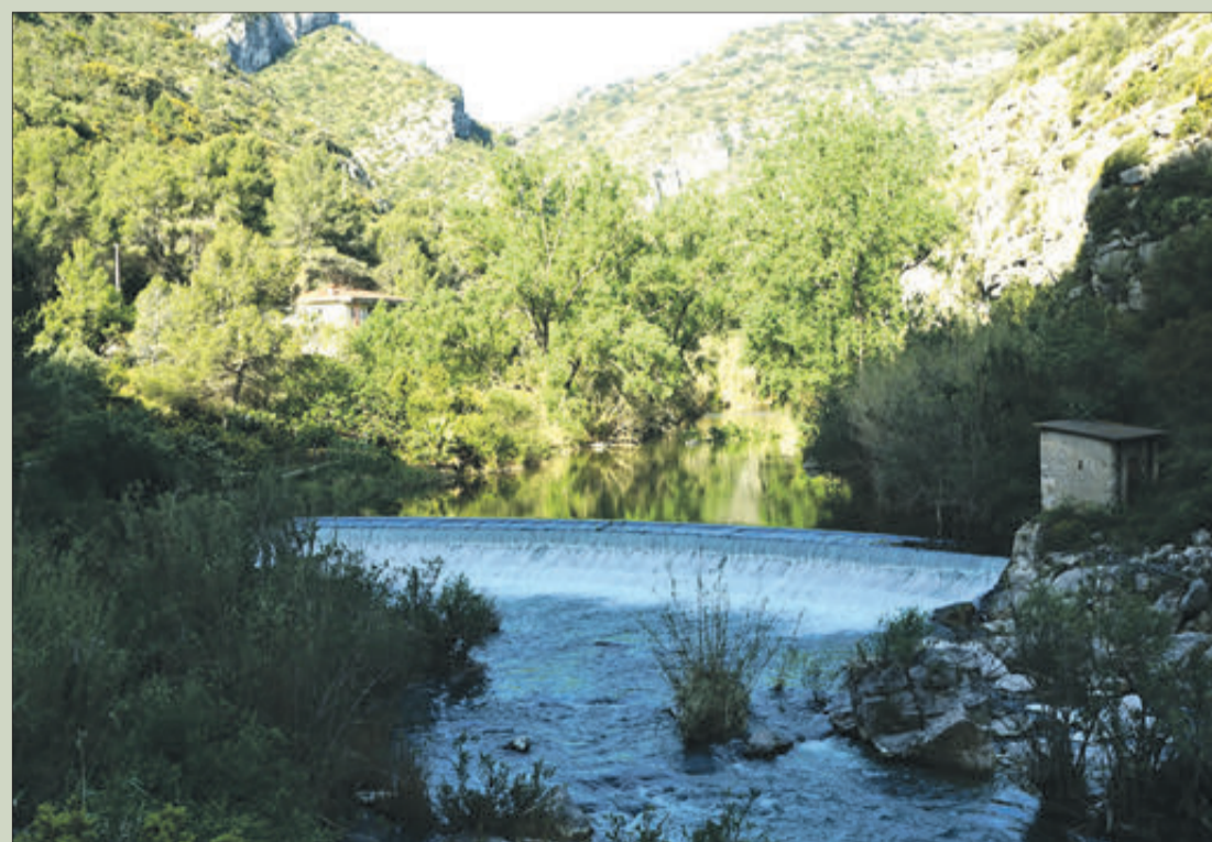
L'antic traçat ferroviari transcorre en gran part al costat del Serpis.