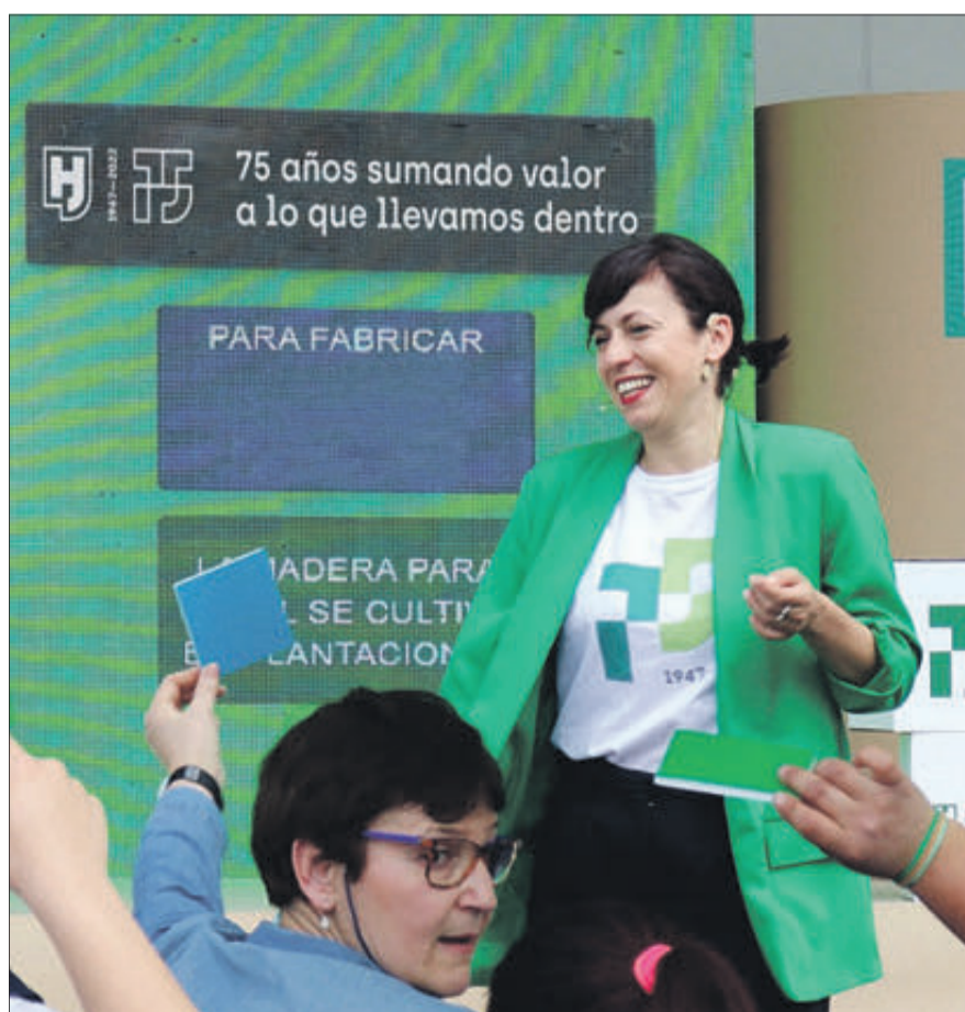
Acte de celebració del 75 aniversari.

A més, en 2021 Hinojosa Paper Alqueria es va convertir en la primera paperera a Espanya a aconseguir la certificació de 'Residuo Cero' de AENOR, segell que reconeix la labor de la planta a l'hora de reutilitzar, renovar i reciclar totes les matèries primeres que empra en la producció de paper per a la fabricació de cartó ondulat.