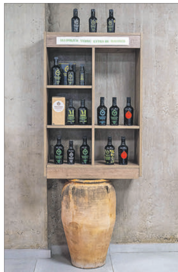
Expositor d'olis de Castell de la Costurera, de Balones.

El concurs de Millor AOVE Saludable del Món compleix la seua sisena edició i és pioner en el reconeixement als aspectes saludables d'aquesta mena d'olis. Destaquen pel seu rigor i independència en realitzar les analítiques, en un únic laboratori de referència, per a poder valorar els resultats amb un mateix criteri.