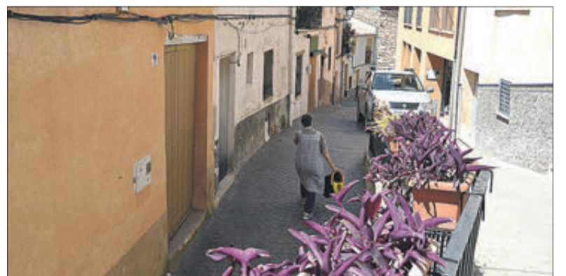
Un carrer del poble.