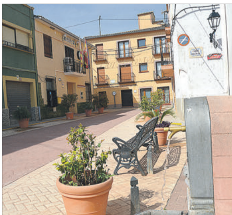
Una font i a fons l'Ajuntament.

“En un poble xicotet ens coneixem tots i els veïns ens exposen els seus problemes que intentem solucionar”