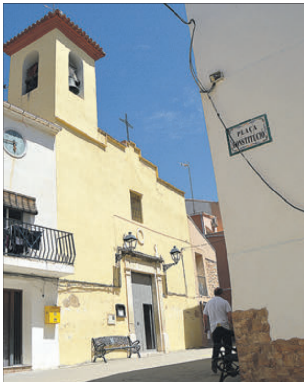
L'església i la plaça de la Constitució.