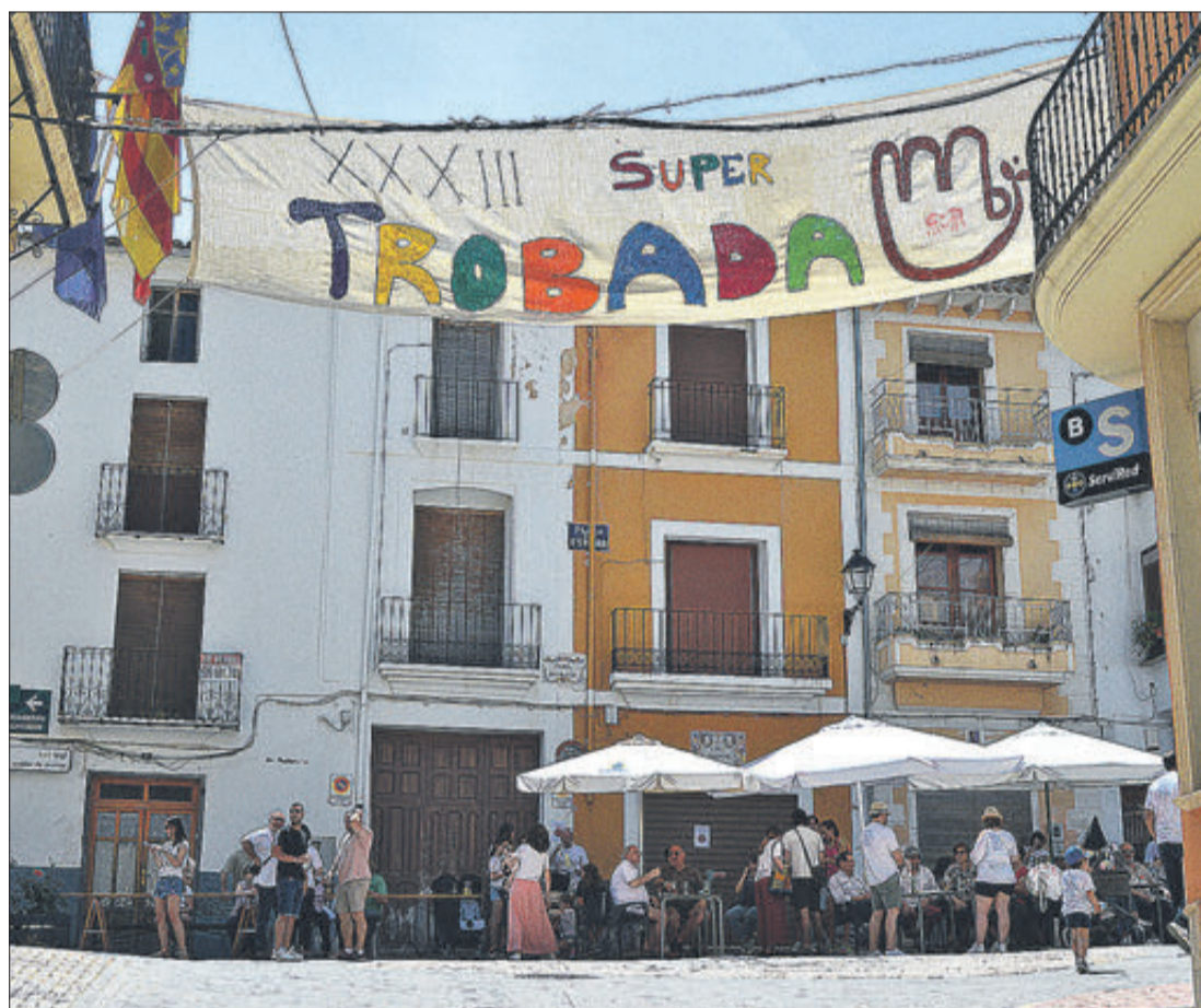
Diferents imatges dels actes que van tindre a Agres com a escenari amb motiu de la Trobada d'Escoles.