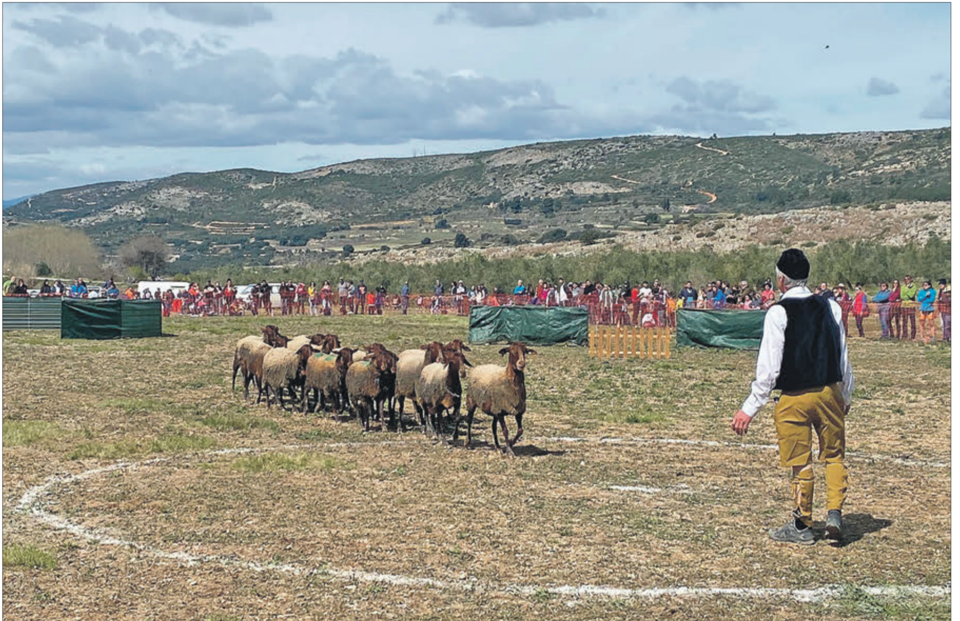
El concurs s'ha consolidat i compta amb molts adeptes.