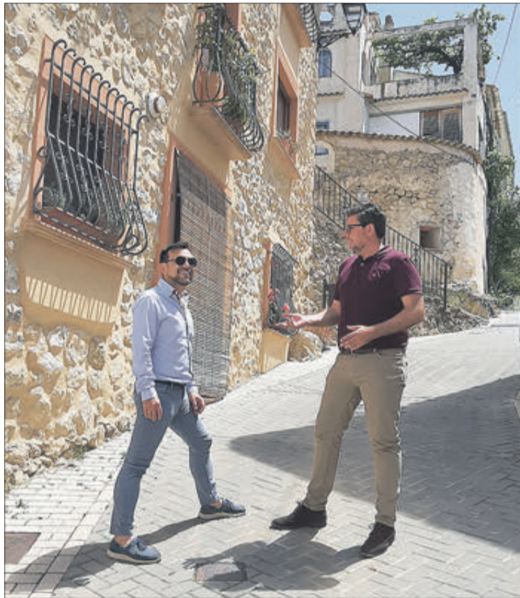
El diputat d'infraestructures en les visites fetes a Benasau i Benilloba.

Aquesta actuació entra dins del Pla Mas Cerca 2020 al qual s'han sumat també millores en el poliesportiu municipal, inversions en el sistema de proveïment i un pla d'informació i promoció turística amb assistència virtual. L'edil ha explicat, a més, els