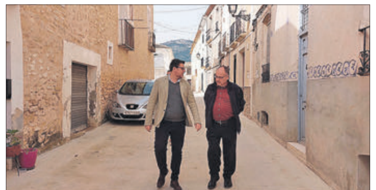
El diputat acompanyat dels alcaldes de Penàguila i Benifallim.