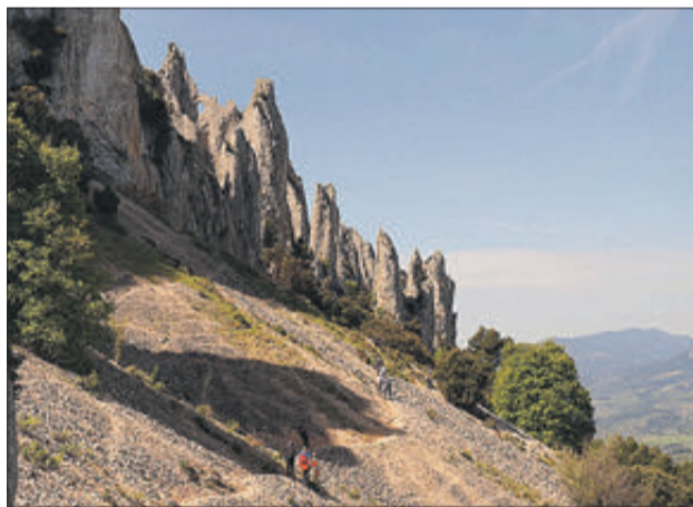
Les espectaculars formacions rocoses de Els Frares.