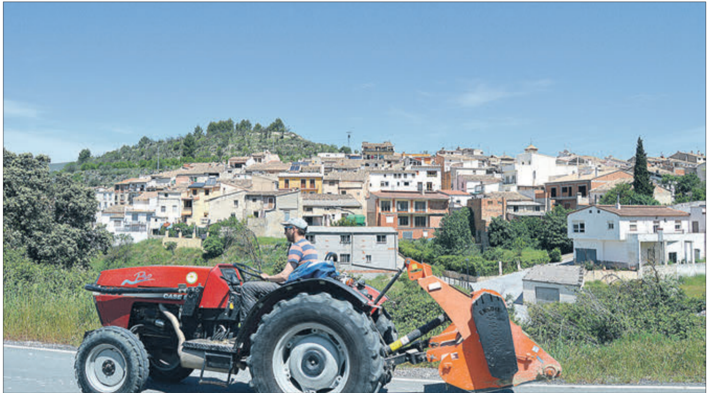
Vista de Quatretondeta des de la carretera.

Entre els seus plats típics, el “conill amb allada”, els “capellanets” o els “abisinis”, mentre les seues festes patronals se celebren al voltant del 26 de juliol.