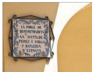
Placa que recorda a la primera alcaldessa d'Espanya.