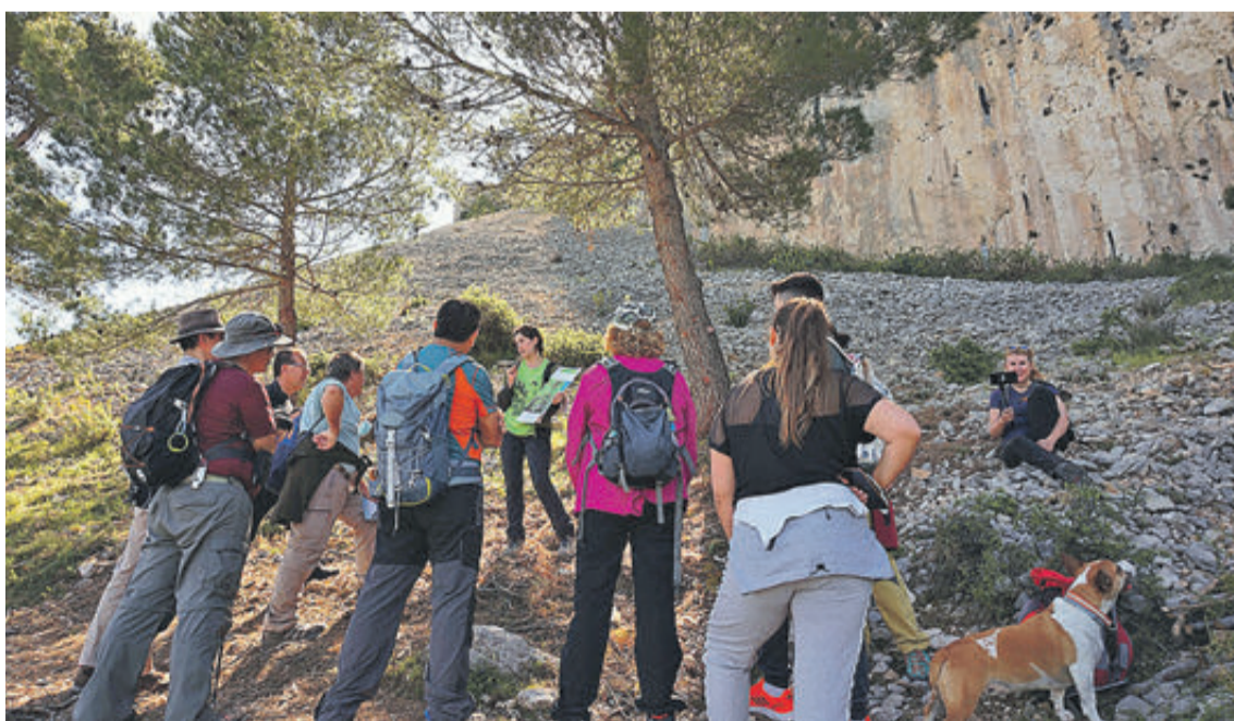
Alguns dels participants en la ruta.

Sota el títol 'Els Freres de Quatretondeta. Un viatge des d'una antiga mar fins a la muntanya de la Serrella', durant els quasi 7 quilòmetres de ruta circular amb inici i final en el municipi de Quatretondeta, els participants van poder descobrir en diverses parades explicatives, acompanyats de geòlegs i geòlogues de la UA, com s'ha format la Serrella i la vall de Seta, quan van emergir les muntanyes del nord de la província d'Alacant, els secrets paleontològics que amaguen les margues del Tap,