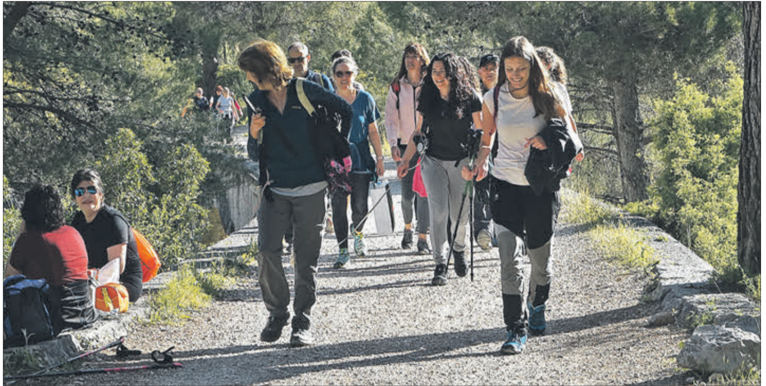
Alguns dels participants en la ruta per la via verda.

Finalment, el col·lectiu Fem Camí, de Vilallonga, va voler conscienciar als participants amb la necessitat de mantindre neta la zona, mostrant l'enorme treball que realitzen respecte a la neteja dels paratges.