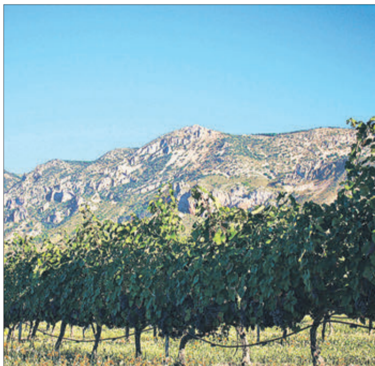
Els camps de cultiu es troben en meitat de la Vall de Seta.

■ Tres varietats de raïm autòcton: Cabernet, Monestrell i Giró.