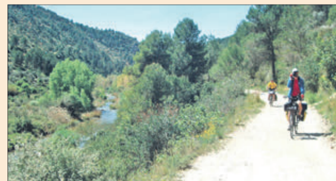
Via Verda del Serpis.

Indicar que, la transformació de l'antic traçat del tren entre les dues localitats anteriorment citades, està dividida en dues. D'una banda, s'inclou el tram entre Muro i L'Orxa, mentre que, l'altre, entre L'Orxa i Vilallonga. El primer tram està pressupostat en 1.545.740 euros, i el segon, en 1.581.830 euros. D'aqueixes quantitats, el pressupost de 2022 contempla 45.740 i 81.830 euros respectivament, quedant així pendent 3 milions d'euros en total, que s'inclouran en les dues següents anualitats.