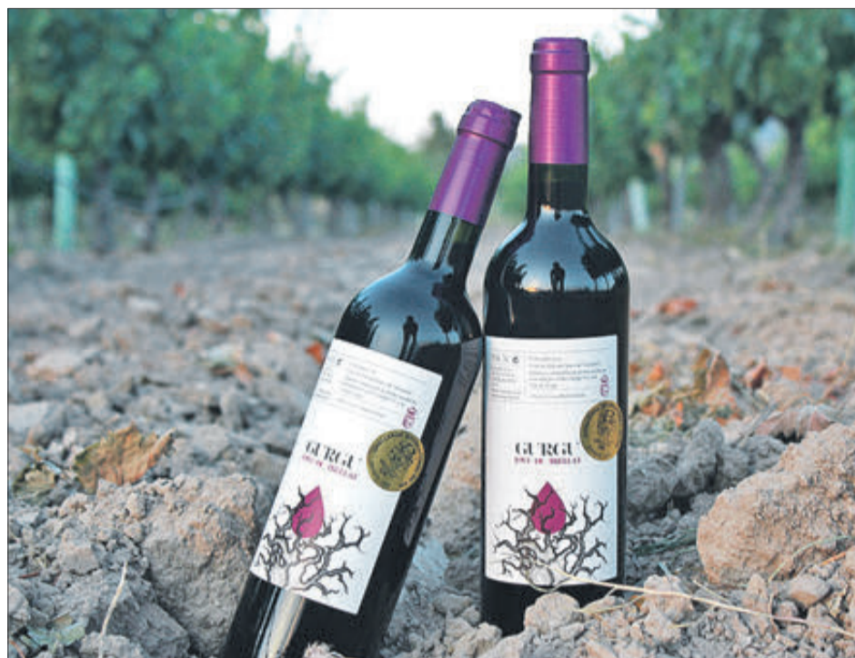
'Jove de Trelat' ha guanyat la medalla d'or en el primer concurs de vins del Mediterrani.

EL CELLER GURGU APOSTA PER LA PRODUCCIÓ ARTESANAL DE VI DES DEL BELL MIG DE LES VALLS DE TRAVADELL I DE SETA