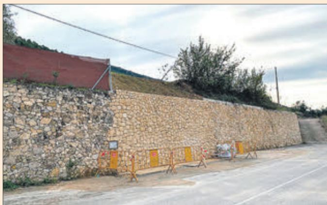
Aspecte del mur després de la intervenció.

Així, s'ha reconstruït el mur de l'Avinguda de Bonell, el nou aspecte del qual es veu en la imatge de baix. A més, també s'ha actuat en diversos camins que van ser danyats pel citat fenomen climatològic. Es tracta dels camins de la Mola, Caseta Alonso/Quinyons, L'Estret i Verdejo.