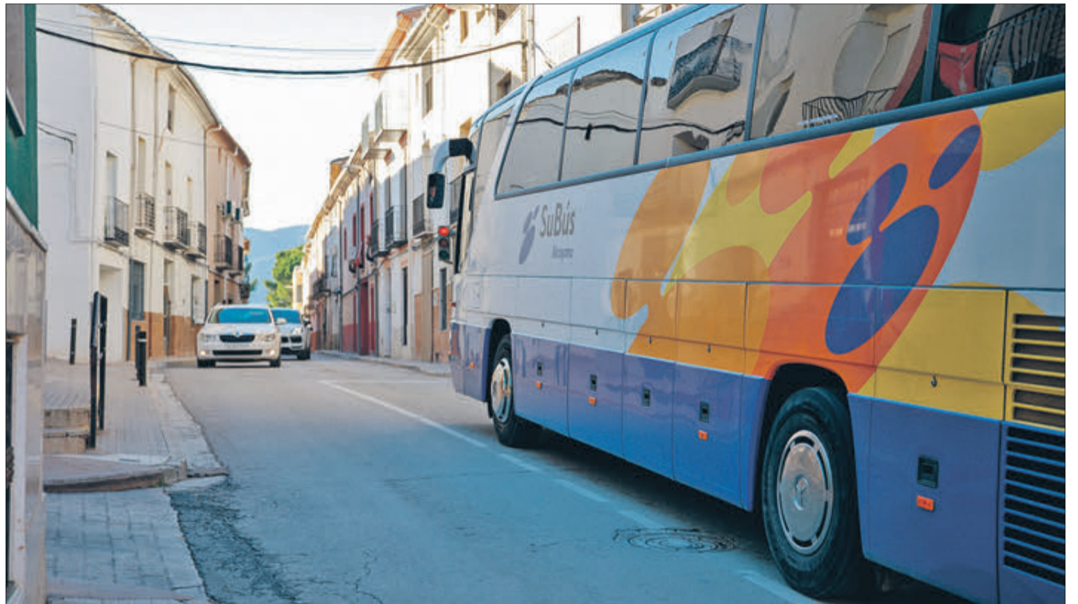
La carretera travessa el nucli urbà i s'ha convertit en un problema, especialment amb el pas de grans vehicles.