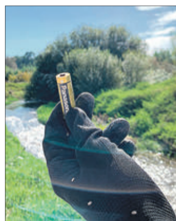
Alguns dels objectes abandonats en els més diversos llocs del municipi.

sols l'objectiu de deixar Alcosser molt més net, sinó el conscienciar a la societat de la necessitat de cuidar i protegir el nostre entorn.