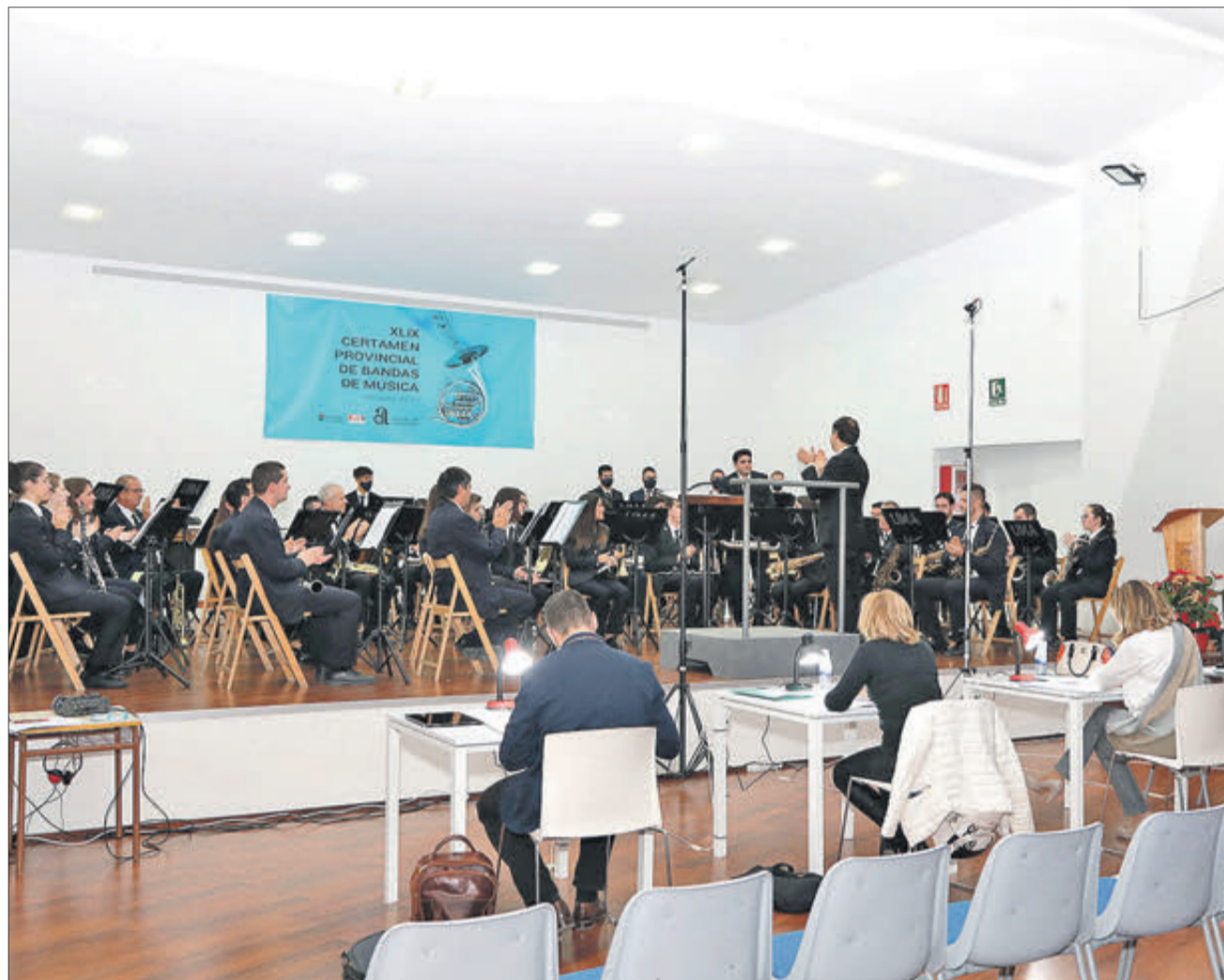
Un moment del Certamen Provincial de Bandes celebrat en l'auditori d'Algueña.