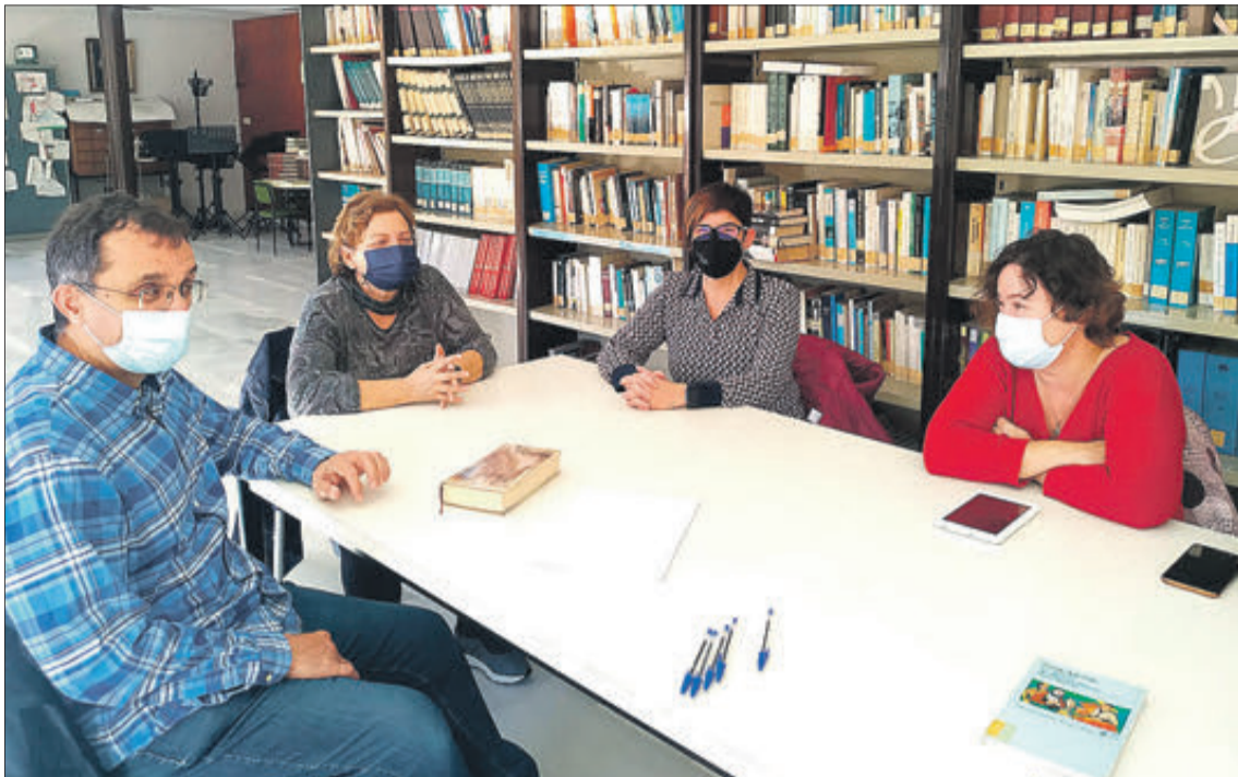
Imatges de dues de les últimes sessions de club de lectura celebrades.