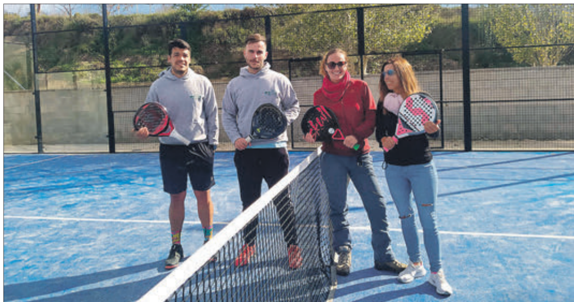
Els guanyadors van rebre un trofeu commemoratiu de la celebració d'aquest torneig.