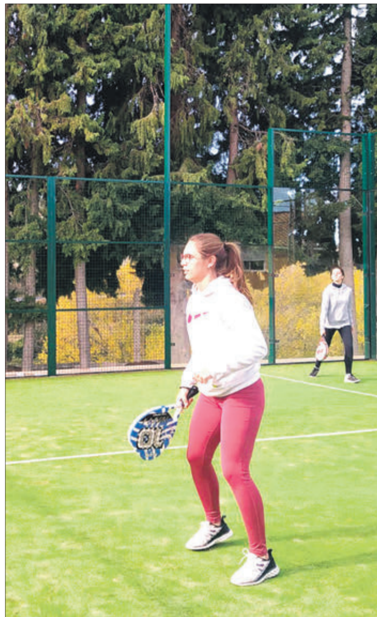
Una de les partides disputades durant el torneig.

S'HA DESENVOLUPAT EN CINC MUNICIPIS DE LA ZONA: GORGA, BENILLOBA, BENIMARFULL, PENÀGUILA I L'ALQUERIA D'ASNAR.