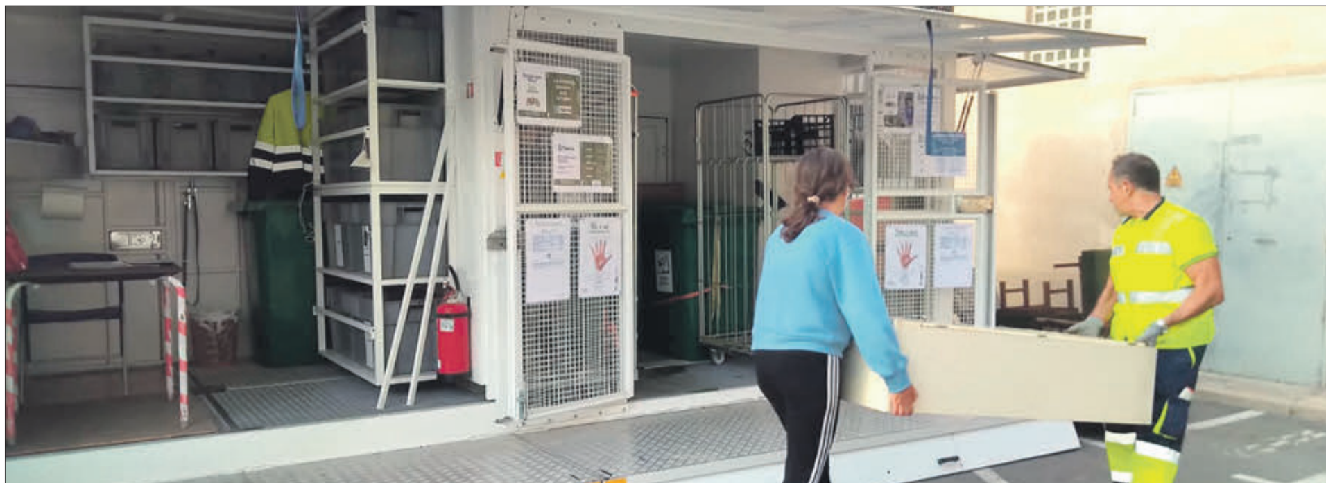
Gent fent ús de l'ecoparc mòbil.

RECULL 2.567 QUILOS DE RESIDUS EN UN SOL MES