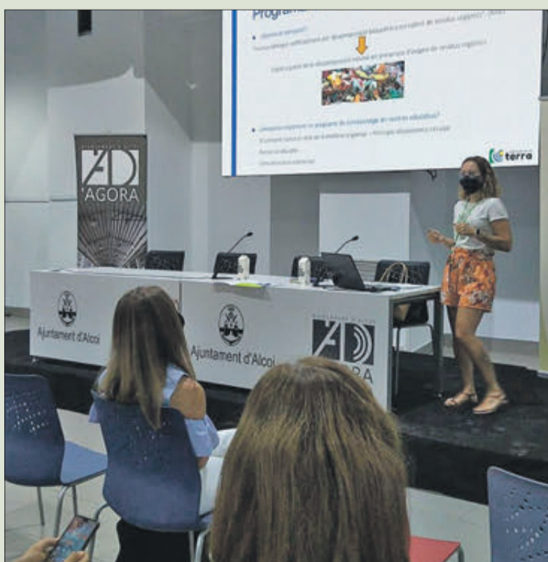
Presentació del programa a l'Àgora d'Alcoi.

El Consorci Terra està format pels municipis de: Agres, Alcoleja, Alcosser, Alfafara, Almudaina, l'Alqueria d'Asnar, Balones, Benasau, Beniarres, Benilloba, Benillup, Benimarfull, Benimassot, Cocentaina, Fachea, Famorca, Gaianes, Gorga, Millena, Muro d'Alcoi, l'Orxa, Planes, Quatretondeta i Tollos, així com Alcoi, Benifallim, Ibi, Penàguila, Tibi, Agost, Aigües, Busot, Mutxamel, Sant Joan d'Alacant, Sant Vicent del Raspeig, la Torre de les Maçanes i Xixona. A més d'aquestes 37 entitats locals, són membres del Consorci Terra, la Generalitat Valenciana i la Diputació Provincial d'Alacant.