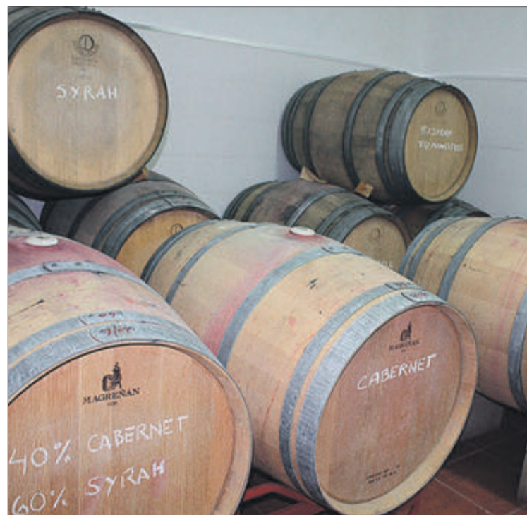
L'envelliment es realitza en barrils de roure francès i americà.

A pesar de no tenir la mateixa tradició vinícola que altres regions del País Valencià, des del cor del Comtat s'elabora un vi que durant els últims anys ha aconseguit diferents reconeixements internacionals. Parlem del caldo que elaboren des del Celler Gorgu, ubicat en el municipi de Gorga i on aposten per un mètode de producció completament tradicional.