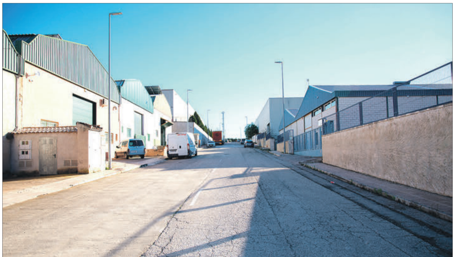
Es vol que la nova ronda comuniqui amb el polígon industrial.

i ací si que vam explorar la possibilitat de desenvolupar alguna cosa per atreure més famílies al poble amb xiquets i xiquetes per reactivar l'escola, però poc després en van néixer bastants i altres famílies de fora del poble van escolaritzar als seus fills i filles al centre, i ara ja no tenim eixe problema.