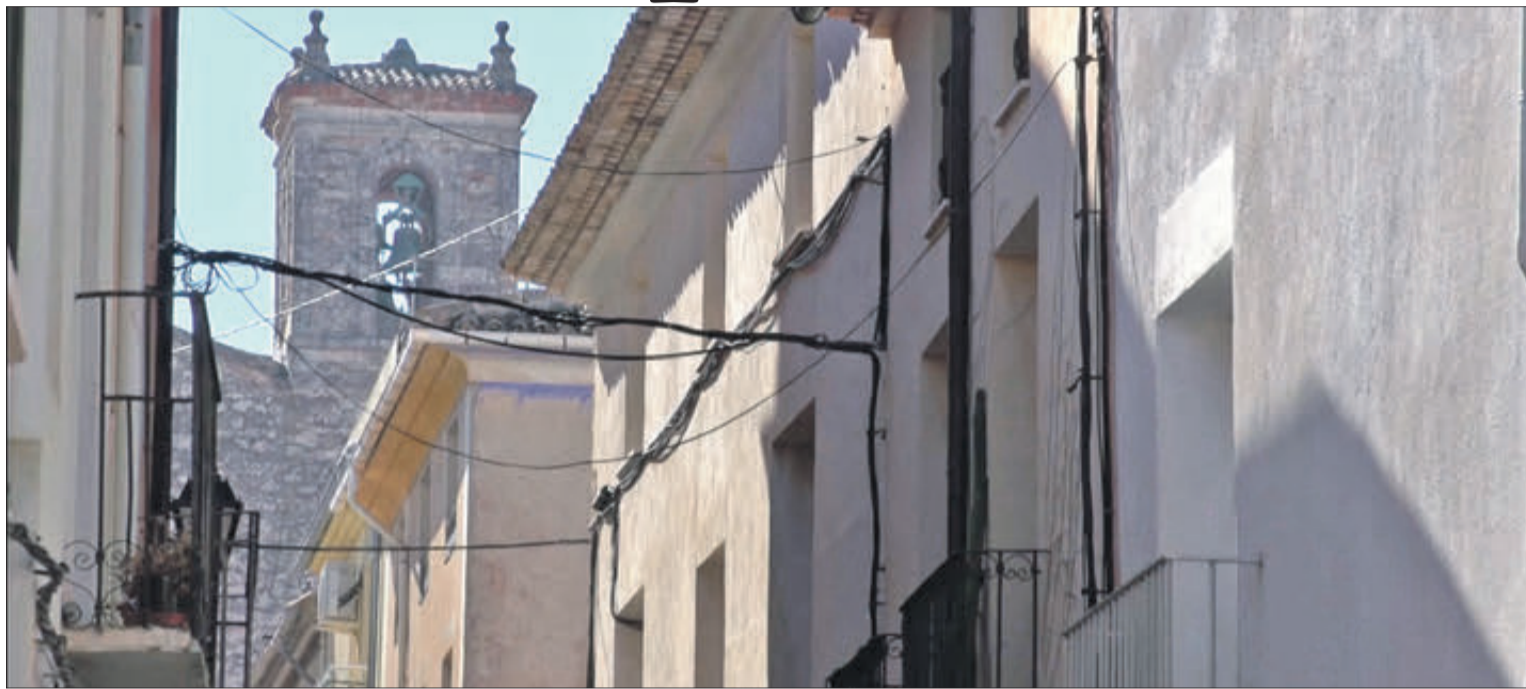
L'Església parroquial de Sant Pere es troba a un dels extrems del carrer Major.

'Benasau, entre la Serrella y Aitana'. José Cantó y Jorge Hermosilla. Levante el mercantil valenciano, edició digital.