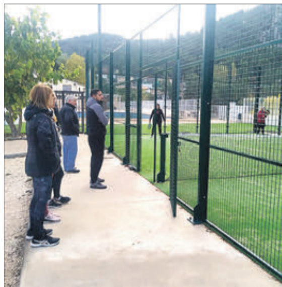
Imatges de la competició.