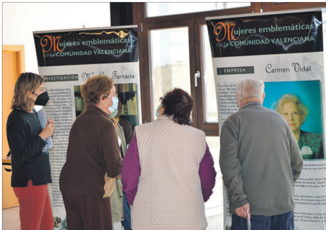
Visitants d'una exposició sobre dones, en el poble de Fageca.