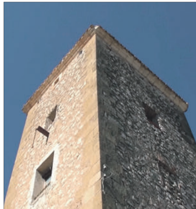
Torre Palau dels Barons de Finestrat.