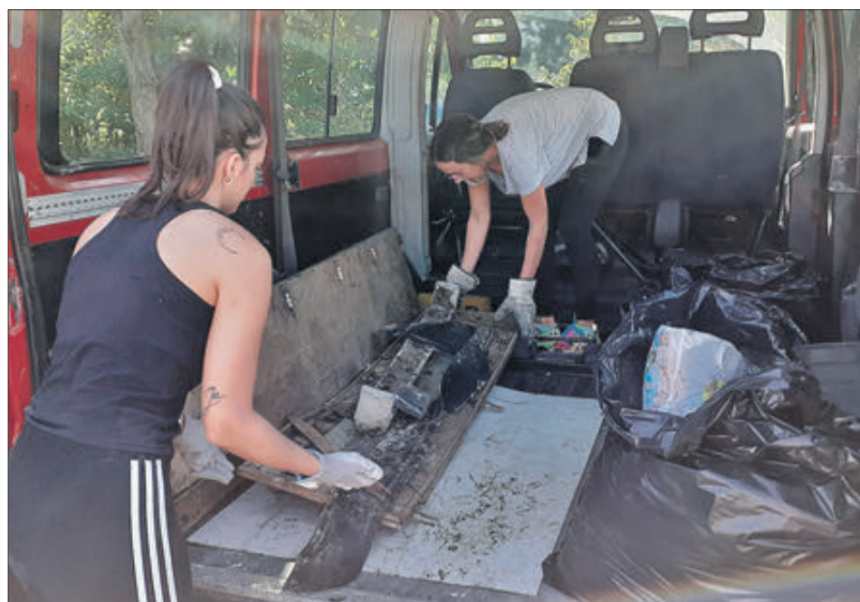
Els voluntaris junt alguns dels residus trobats.