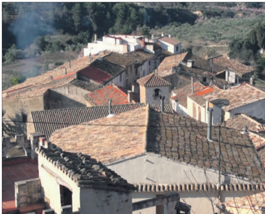
Nucli urbà d'Ares del Bosc.