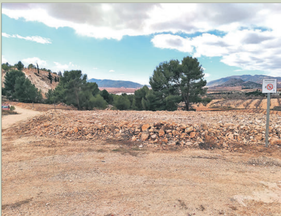
Una de les zones restaurades a través dels plans de Diputació.

La Diputació d'Alacant va crear aquesta convocatòria l'any 2017. Des de llavors, la institució provincial ha dut a terme 51 actuacions amb una inversió d'1.070.000 euros, gràcies a les quals s'han retirat més de 25.000 metres cúbics de residus. Amb la partida de 2022 s'arribarà a 1.470.000 euros.