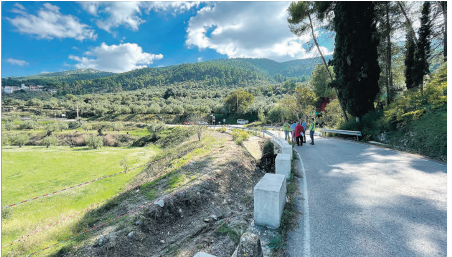
Es construirà una vorera que permetrà la mobilitat des del nucli urbà.

La nova vorera donarà continuïtat a la ja existent a l'eixida de la població i millorarà la seguretat dels vianants