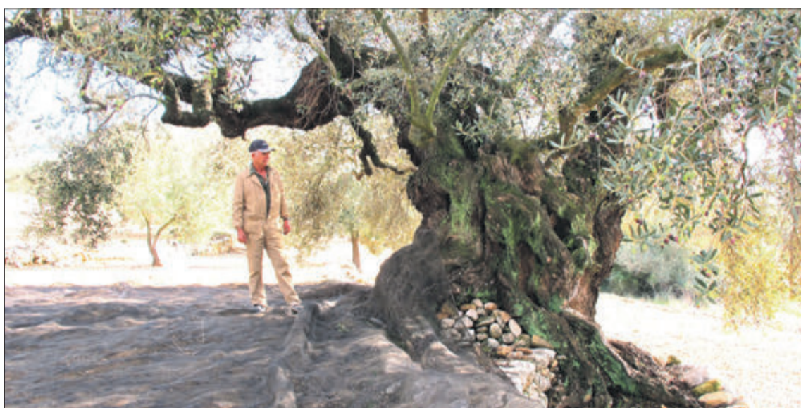
Els preus se situen en 3'5 euros el quilo d'oli verge extra.

Així, segons s'ha indicat, Alcosser, Almudaina, Balones, Benilloba, Benimassot, Benillup i Benimarfull, han renunciat; i Penàguila, La Vall d'Ebo i Millena, no han presentat la sol·licitud per a optar a aquesta convocatòria.