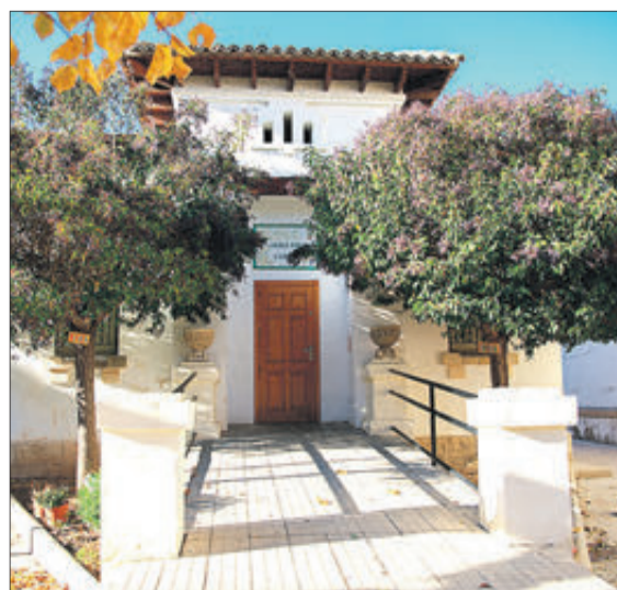
Benimarfull conserva el seu col·legi.

Però ens agradaria donar suport al sector primari que també és potent però menys.