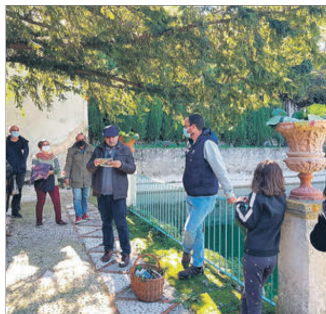
La ruta finalitza al jardí de Santos.

visió etnobotànica. Volíem combinar els dos elements a la ruta, literatura i etnobotànica. Belda ens va explicar la utilitat de moltes plantes medicinals presents en l'itinerari: el timó, la sàlvia, el poliol, la til·la, el fenoll... I ens contà anècdotes de plantes que anaven eixint al pas, com és el cas del raïm de pastor, les carrasques, el garrofer, els oms o, fins i tot, els bolets de riu. L'Ajuntament de Penàguila va obsessionar els assistents amb un pergami amb la rondalla “I queixalets també”. I la Coordinadora pel valencià regalà un llibre. En paraules d'una de les assistents, va ser tot un diumenjot.