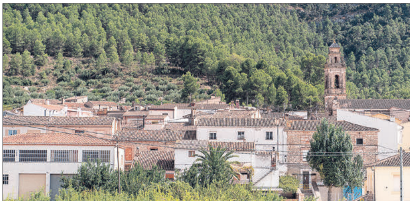
Alfafara serà el poble protagonista en la ruta senderista del mes de desembre.

Les bandes guanyadores que participaran en el Certamen de Bandes de la Comunitat Valenciana, organitzat per l'Institut Valencià de la Música.