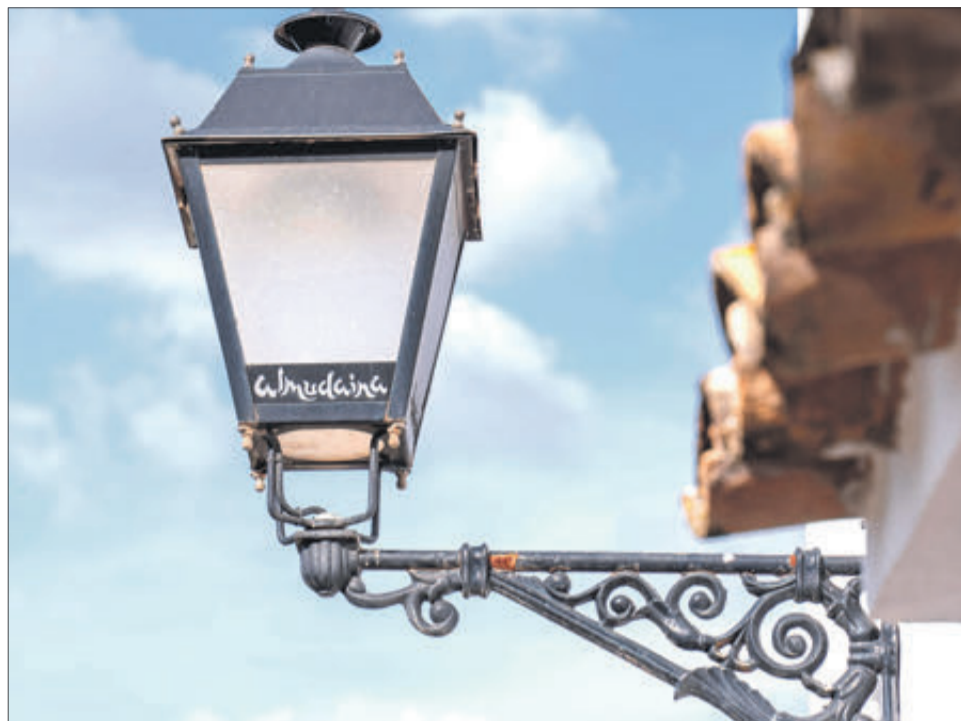
Una luminària d'un carrer d'Almudaina