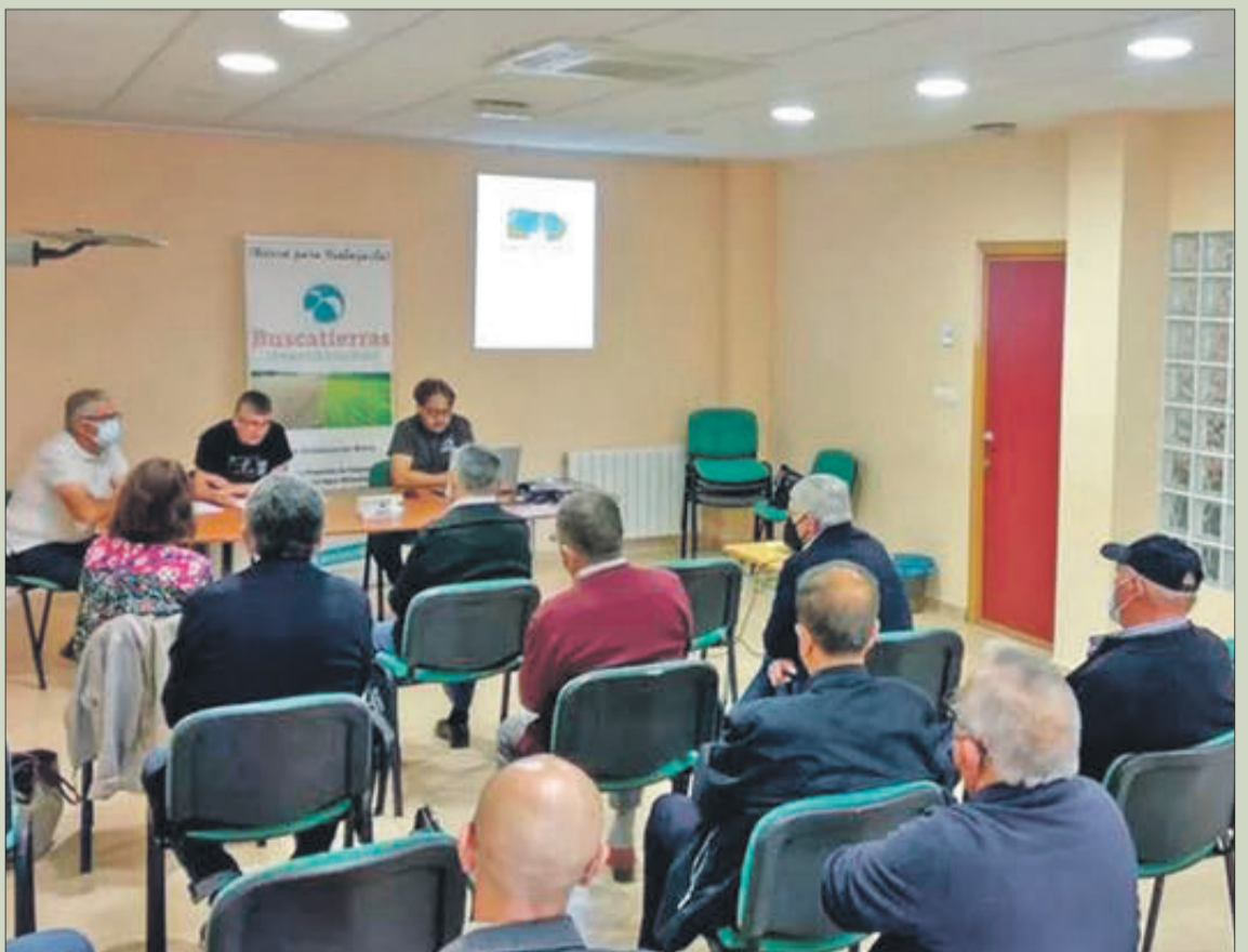
L'assemblea es va celebrar al Centre Cultural Joan Fuster.

Les terres en abandó són un problema econòmic per als seus propietaris i un santuari de plagues com els rosegadors o senglars i malalties com la Xylella fastidiosa. També són causa d'erosió i perill d'incendis forestals.