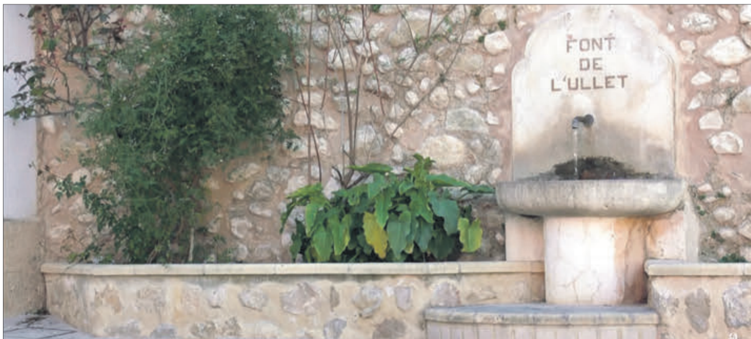
La font de l'Ullet s'ubica prop de l'església.