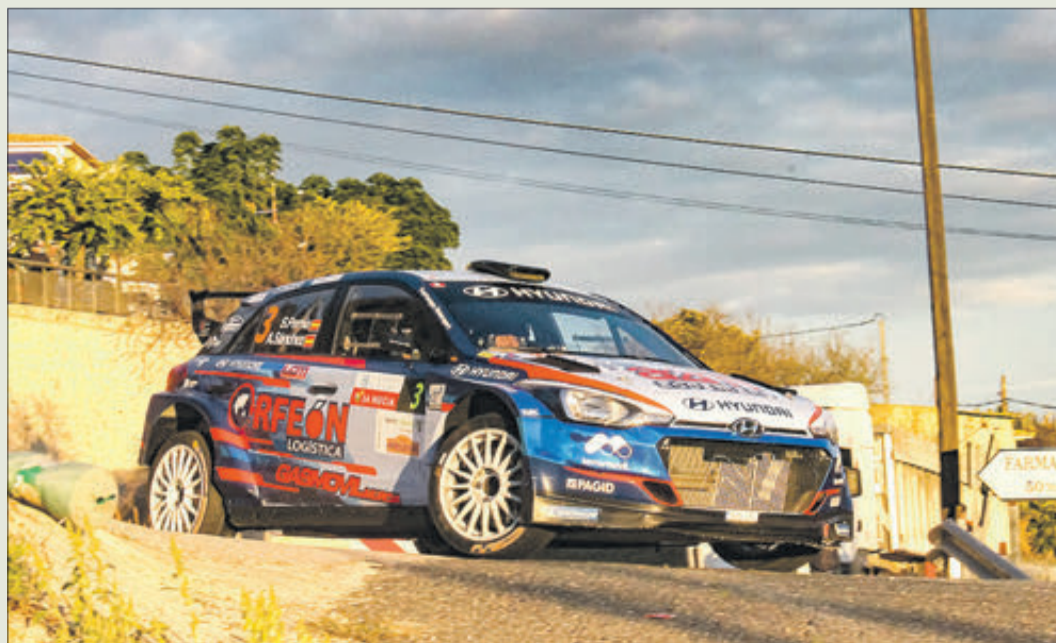
El guanyador del ral·li