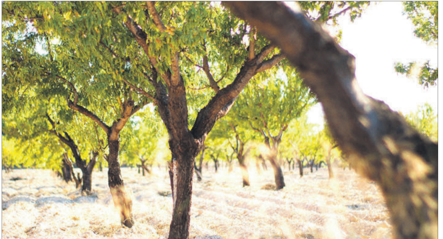
Terrenys en els quals es practica el cultiu de l'ametler.

Els agricultors que han vist afectats els seus camps d'ametlers per la Xylella fastidiosa denuncien que les mesures aplicades en els últims anys per a erradicar la plaga han posat en perill el futur del cultiu d'aquesta fruita seca a les comarques de l'Alcoià i el Comtat. En aquest sentit asseguren que la tala massiva d'arbres, com a mesura de contenció, ha resultat insuficient i detallen que aquesta situació està abocant a l'interior d'Alacant cap al monocultiu: "la Conselleria recomana la plantació d'oliveres en els terrenys que abans tenien ametlers una vegada passe el període reglamentari que permetia comprovar que ja no hi ha Xylella. Això trenca per complet el cicle agrari d'aquestes comarques de la muntanya perquè els productors es jugaran tot a una carta, alguna cosa que a més s'uneix al fet que en aquests moments l'oli no s'està pagant en relació als costos de producció", assenyala