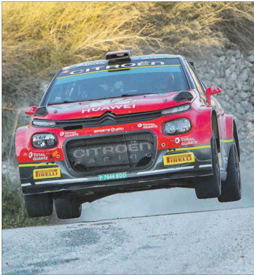
Pas dels vehicles pels trams de Penàguila i Gorga.

Els trams de la vesprada del divendres es van disputar, en bona part, de nit i amb un temps advers, amb una mica de pluja i fred. No va ser obstacle, perquè infinitat d'aficionats d'aquestes comarques i també vinguts des de diferents punts del país, seguiren a peu de carretera l'espectacular pas dels vehicles. Entre els 80 que van prendre l'eixida, assenyalar a manera de curiositat que tres