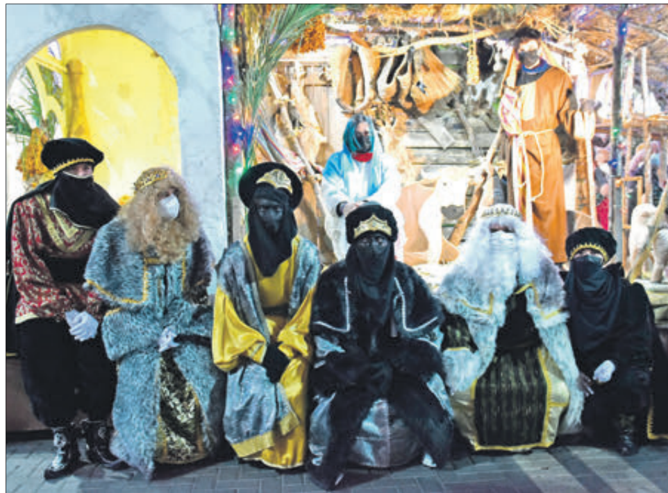
Dos moments de la visita de Ses Majestats.

En aquest 2021, el seguici i la música van tornar a acompanyar a Melcior, Gaspar i Baltasar en aquesta Cavalcada, que de nou, va estar a càrrec de l'Associació d'Amics dels Reis Mags i també de la regidoria de Festes de l'Ajuntament de Xixona.