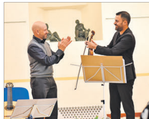
Imatges dels cinc concerts de la 17 edició del Festival de Guitarra.

LA PROGRAMACIÓ HA INCLÒS CINC CONCERTS QUE S'HAN DUT A TERME EN EL TEATRET DURANT EL MES DE GENER