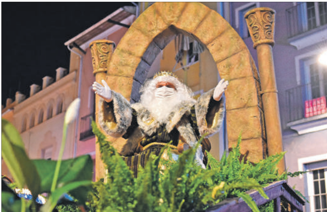
Melchior saludant a la gent en la desfilada.