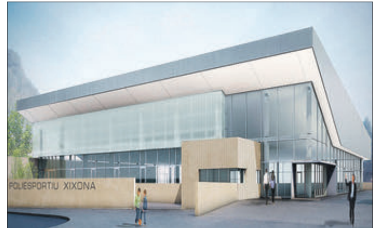
Projecte del pavelló esportiu.

La localitat de Xixona continua treballant perquè el pavelló esportiu siga una realitat. Després que s’arribara a adjudicar el contracte d’aquest projecte a l’empresa que va quedar en primer lloc en la licitació en el ple de setembre –gràcies a una modificació de crèdit–, aquesta va renunciar al projecte –al·legant que havien passat 2 anys des de la proposta i que els preus han augmentat notablement, sent aquest un projecte no rendible– i posteriorment, l’Ajuntament de Xixona va procedir, tal com marca la Llei de Contractes, a la imposició d’una sanció del 3%, sanció que l’empresa ha recorregut davant el Tribunal Administratiu Central de Recursos. Segons s’ha explicat en el ple de gener, després d’un intercanvi d’informes i explicacions, ja que l’empresa acusava l’Ajuntament de “afany recaptatori” amb la citada mesura, s’ha paralitzat el cobrament d’aquells 3% fins que hi haja una resolució per part de l’esmentat Tribunal.