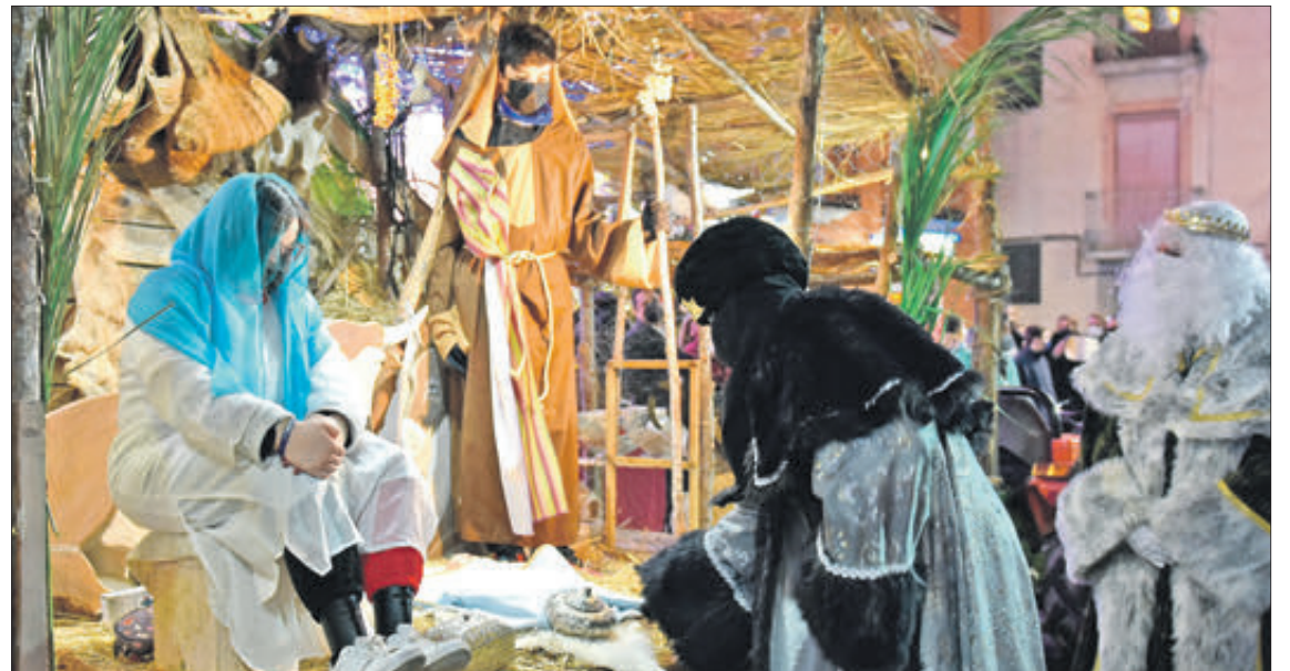
Ofrena dels Reis Mags.