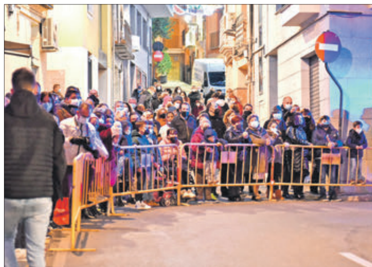
Público presenciant la desfilada.