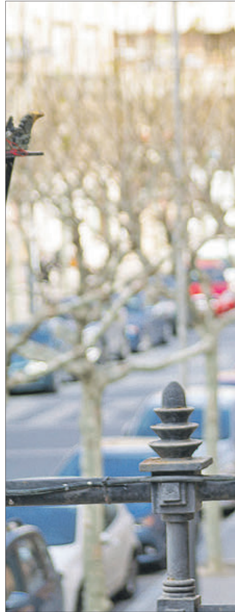
Isabel López, alcaldessa de Xixona.

“Per a les noves generacions és important que troben ací tot el que necessiten”