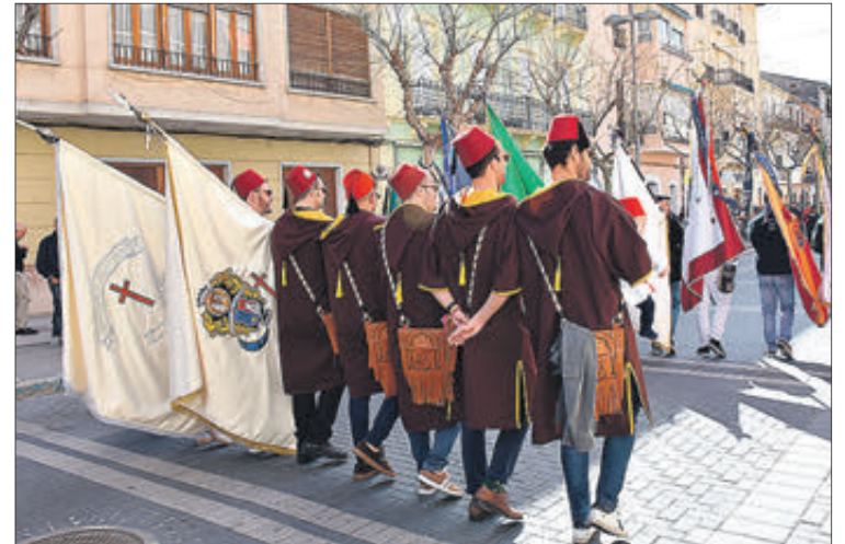
Mig Any celebrat al febrer de 2020.