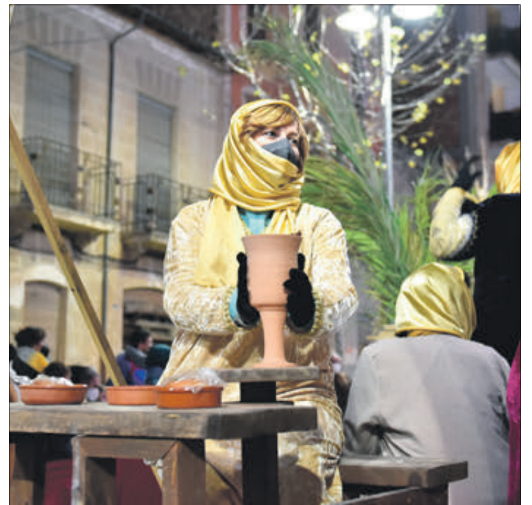
Part del seguici Real.