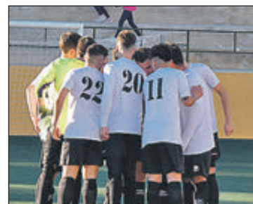
Equip sènior.

En el cas de l'equip sènior, l'aficionat, va penúltim en la classificació, amb 4 punts en els 16 partits disputats. Fins ara, ha guanyat i empatat un partit res-