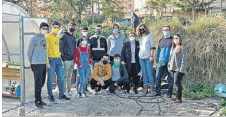
Alumnes de Batxillerat han desenvolupat el projecte.

La segona fase inclou el desenvolupament del projecte a grandària real i s'implementarà en l'hort municipal que, amb una superfície cultivable de 2.500 metres quadrats, es va posar en