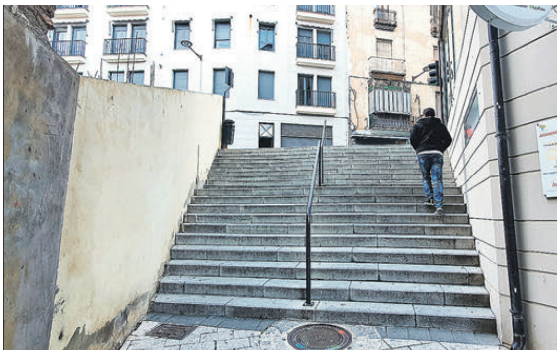
Escalas que uneixen el carrer Terradets i el carrer Alcoi, al costat de Cantó de Colometa.

Aquest pla, que compta amb una previsió de despesa de 2.784.500 euros, contempla quasi 70 actuacions que es duran a terme en un període de sis anys. La majoria se centren en l'ampliació de voreres estretes i en la supressió d'escalas, dues dels principals problemes urbanístics que dificulten l'accessibilitat universal de la localitat. D'igual manera, es millorarà el mobiliari urbà per a facilitar el pas dels vianants.