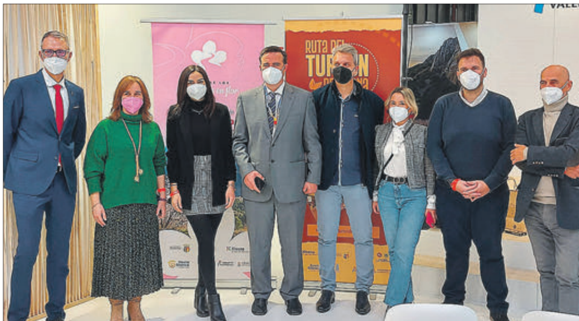
La nueva iniciativa turística se presentó en la feria de turismo.