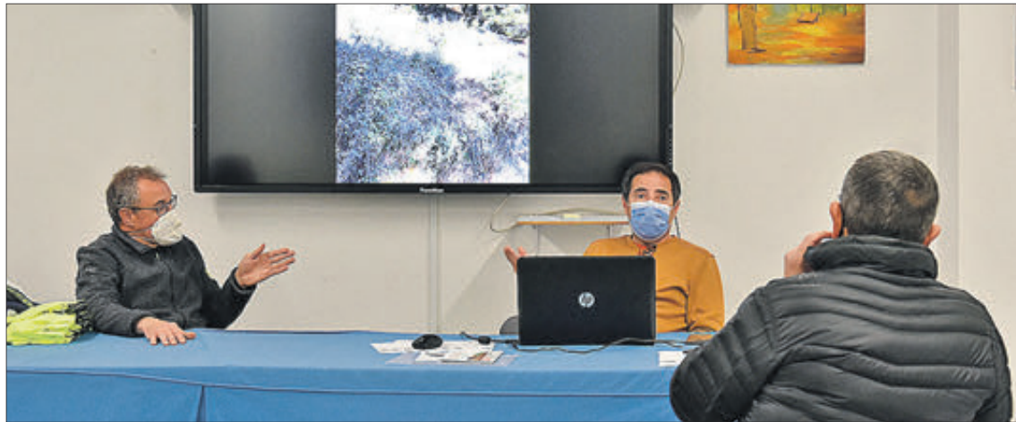
Presentació de la nova edició del circuit.

El Centre Excursionista de Xixona (CEX) ha presentat una nova edició del Circuit de Muntanyes i Sendes 2.0. L'edició de 2022 es va donar a conèixer a la fi del mes de gener a la Casa de Cultura i a més, es va fer lliurament dels premis als participants de les edicions de 2020 i 2021 que van completar tots els itineraris.