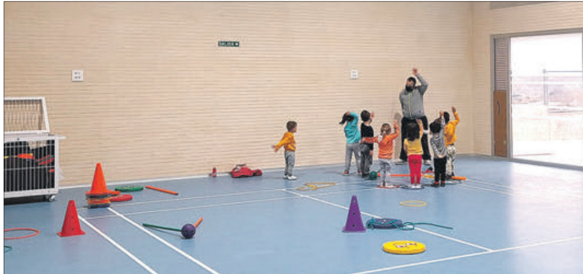
S'estan realitzant diverses activitats en el recentment estrenat gimnàs.

A més, apunta que "l'acceptació ha sigut molt bona" i que no sols s'està utilitzant aquest gimnàs per a les pròpies classes del col·legi, si no també "per a extraescolars o gimnàstica de manteniment", entre altres, i que es contempla