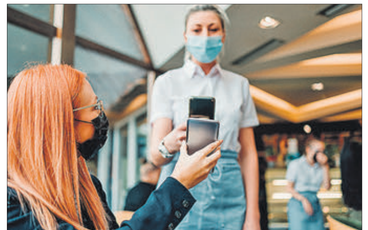
L’hostaleria és un dels àmbits en el qual el certificat és obligatori.

“susceptible d’aconseguir l’objectiu concret amb el que queda emplenat el judici d’idoneïtat”, segons consta en l’acte, i s’afeg que és “indispensable si es vol obtenir l’objectiu de reduir o -almenys- minimitzar l’increment de la transmissió”.