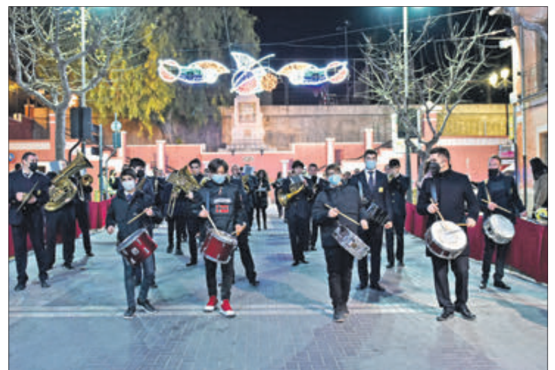
La música va tornar a formar part de la Cavalcada.