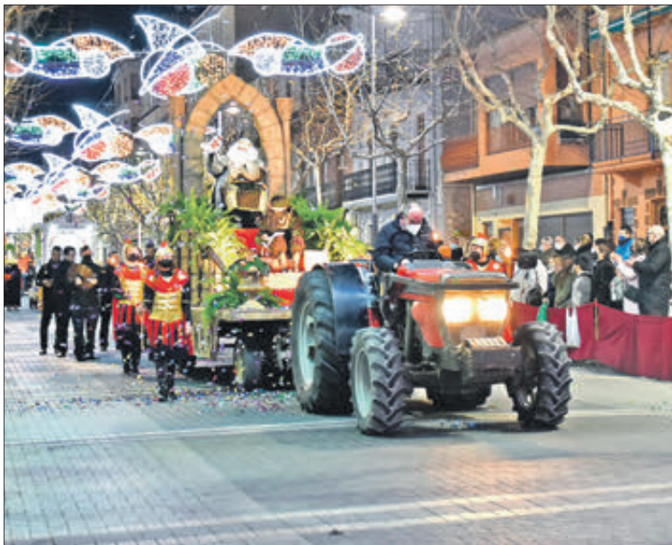
La Cavalcada va recórrer l'Avinguda de la Constitució.