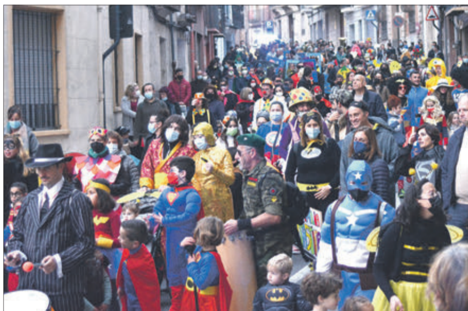
Imatges de la desfilada.