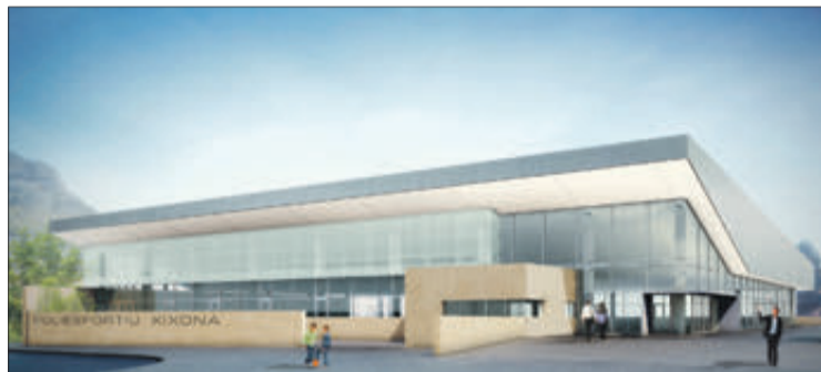
Render del pavelló esportiu.

L'alcalde recorda que aquest projecte "és una decisió de l'equip de