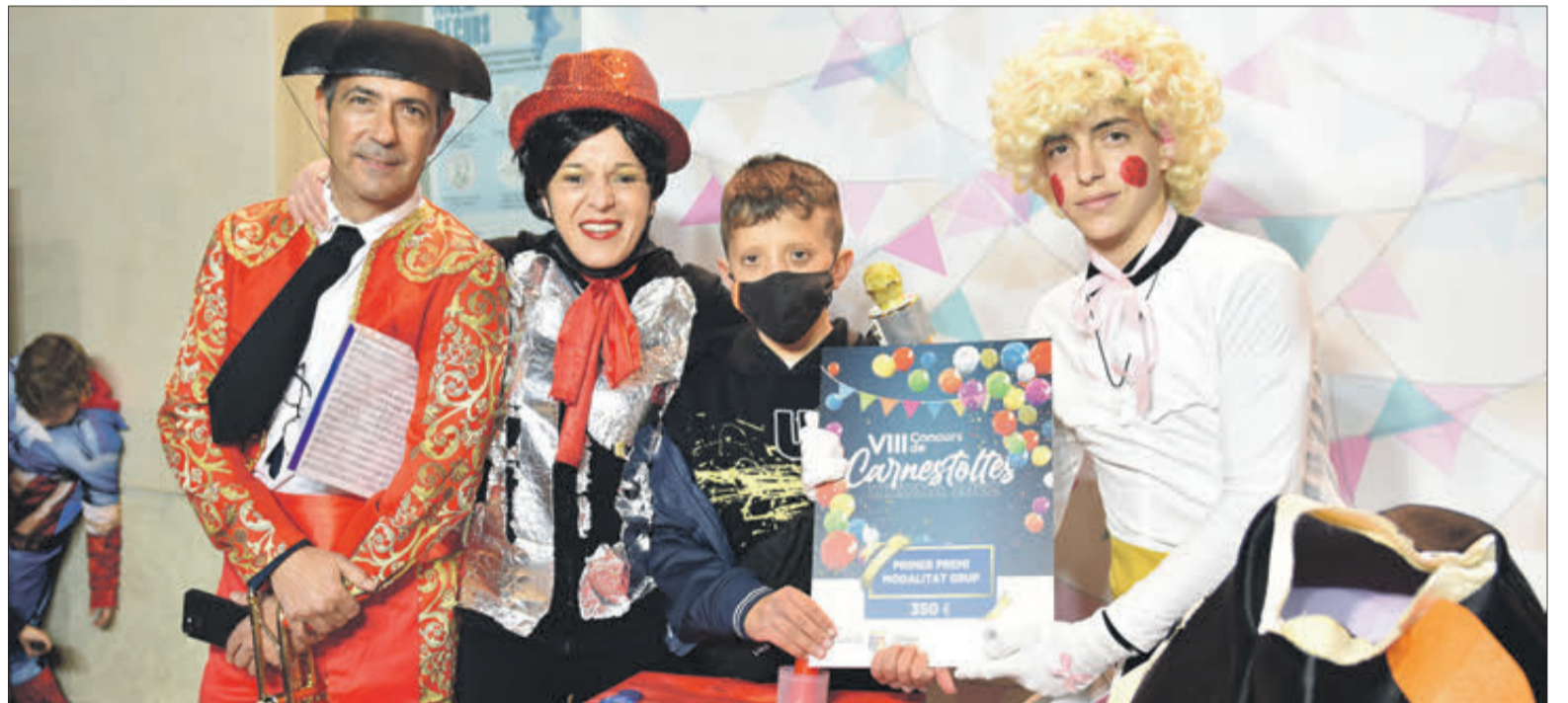
Primer premi grup.

Així, va ser una gran quantitat de gent la que no va voler perdre's l'oportunitat de disfressar-se i passar una gran vesprada de dissabte, des dels més xicotets fins als més majors, aportant colorit als carrers de Xixona un any més, i en aquesta ocasió, més acolorit si cap després de la complicada època que s'ha viscut.