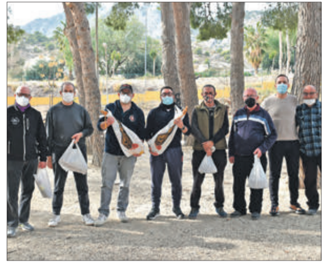
FACEBOOK VECINOS BARRIO SAGRADA FAMILIA