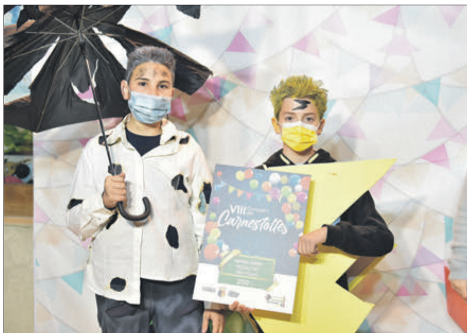
Primer premi individual-parella.