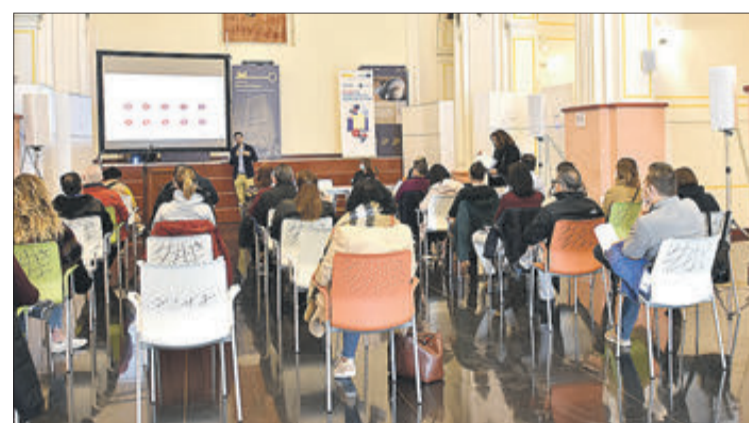
Sessió informativa sobre el programa Kit Digital.

mer edil ha mantingut una primera reunió de treball en Districte Digital –amb el qual hi ha un conveni de col·laboració signat–, en la qual es va parlar sobre el Programa Talent, projectes europeus, propostes de formació, esdeveniments per a joves, ciberseguretat i logística per a empreses o accions sobre digitalització.