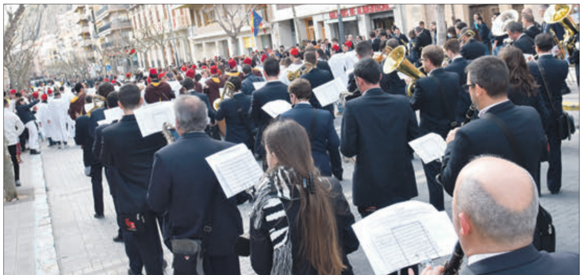
La música va tornar a formar part dels actes festers.