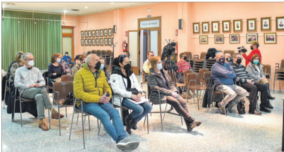
Diferents imatges del Mig Any i també de la resta d'actes celebrats.