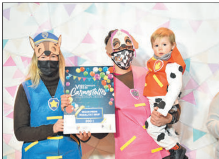
Segon premi grup.