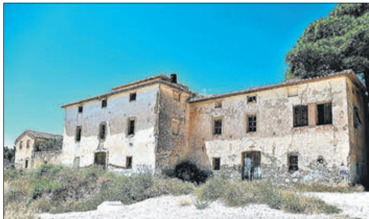
Imatge d'arxiu de la Casa Geralda.

Des de Compromís recorden que la formació també ha presentat sengles iniciatives en aquesta línia en les Corts Valencianes i a Madrid, en el Congrés, a través del diputat Joan Baldoví, qui ha destacat que "si els bancs no atenen les persones majors per humanitat, se'ls haurà d'obligar al fet que ho facen, per llei". Compromís per Xixona indica que "el diputat valencianista ha proposat el blindatge per llei de l'atenció presencial en sucursals bancàries als col·lectius més afectats per la brexa digital".