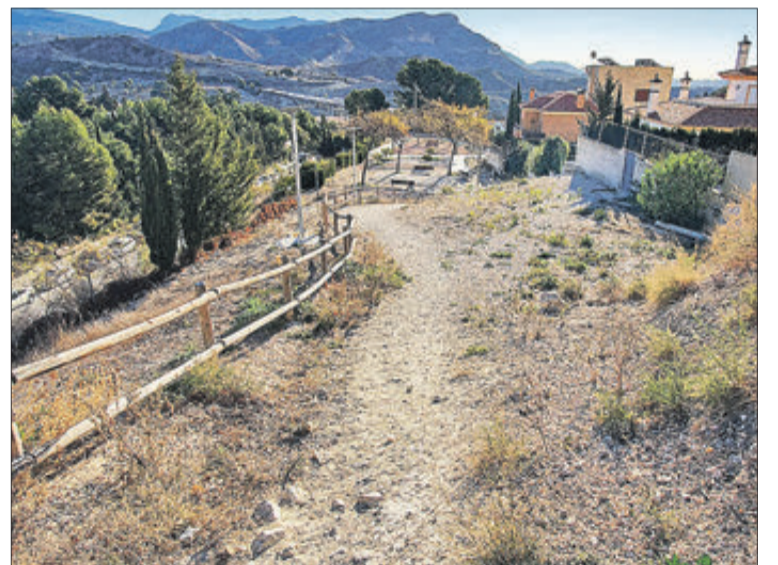
Zona de pas al costat del carrer Francesc Nicolau Mira.

Un dels murs la rehabilitació dels quals finalitzarà en breu és el dels carrers Sant Antoni i Nou, on s'ha posat l'accent principalment a evitar humitats.