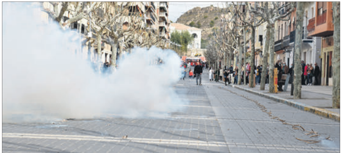
Fum d'una traca de Mig Any.

El regidor de Festes considera que "és imprescindible anar tornant a poc a poc a la normalitat, sobretot amb la recuperació d'esdeveniments que ens uneixen i ens reforcen com a societat, però sempre sent conscients que el virus segueix aquí i hem d'adoptar les mesures necessàries per a mantindre'l a ratlla".