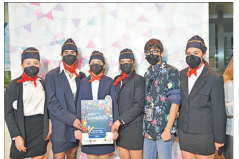
Tercer premi grup.