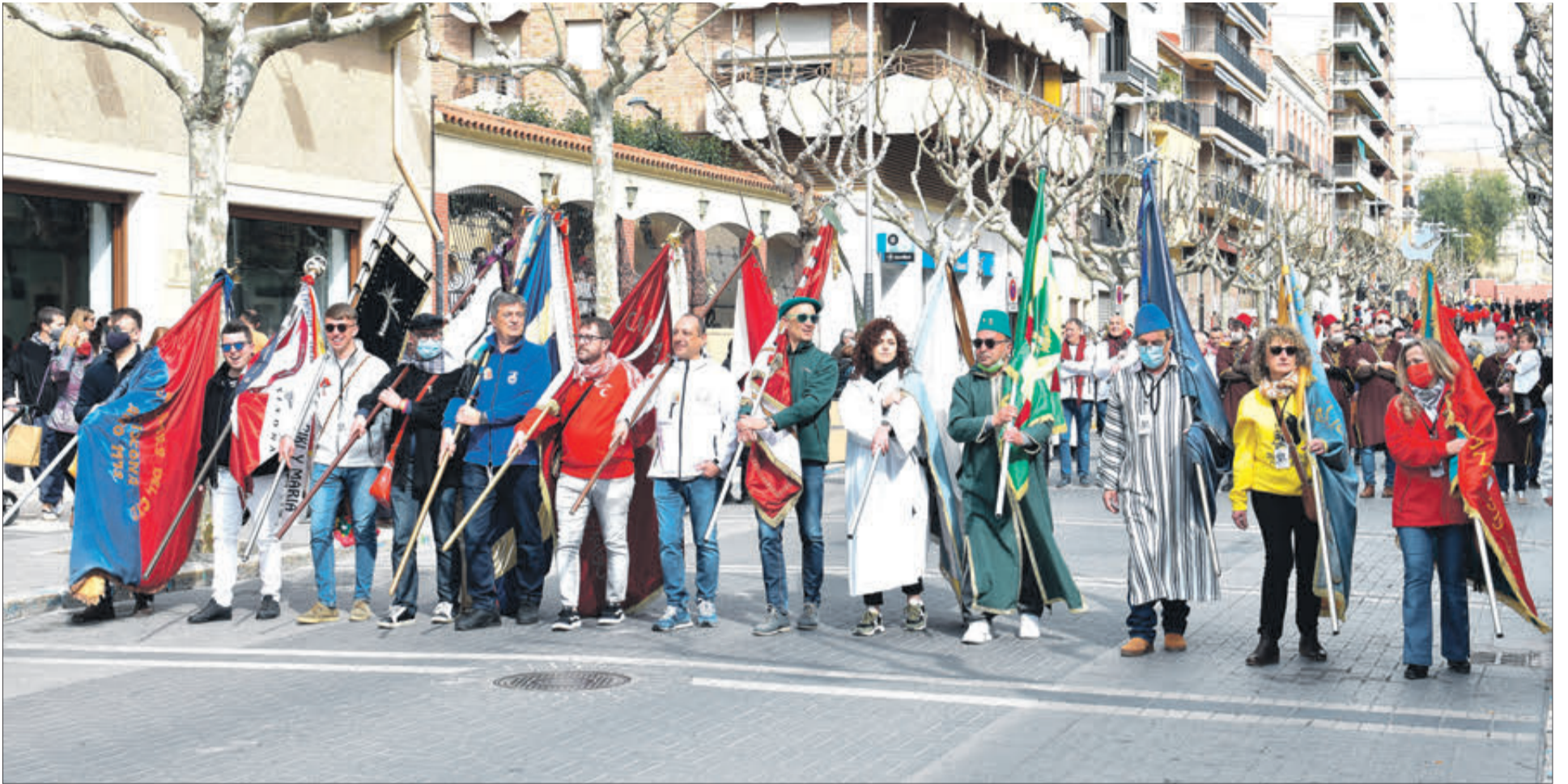
Les desfilades van transcórrer per l'Avinguda de la Constitució.

PER PRIMERA VEGADA EN LA HISTÒRIA, LES DUES FESTES QUE ES DUEN A TERME, HO HAN CELEBRAT CONJUNTAMENT