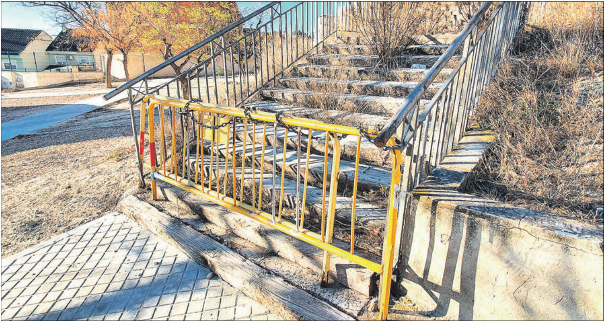
Escales de la zona del Safareig en les quals s'actuarà.

S'INTERVINDRÀ EN LES ESCALES QUE UNEIXEN ELS DOS APARCAMENTS SITUATS AL CARRER PRINCIPAL