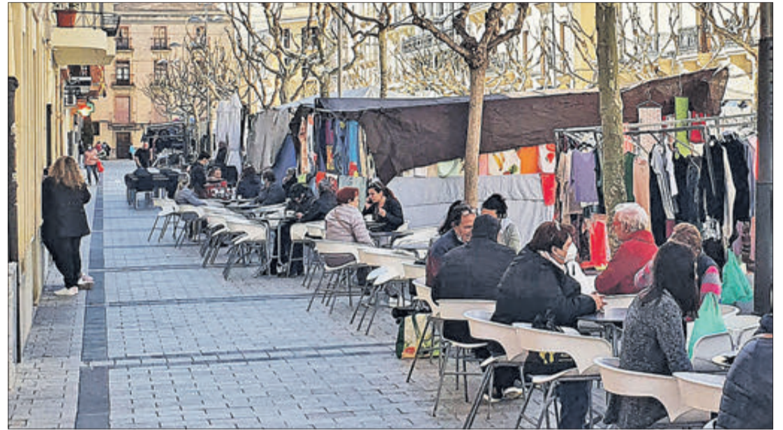
Terrassa d'un establiment de Xixona.

L'Ajuntament de Xixona ha decidit prorrogar durant tot l'any 2022 la mesura que permet que els bars, restaurants, cafeteries i gelateries del municipi que compten amb taules al carrer no hagen de pagar la taxa corresponent per ocupació de via pública.