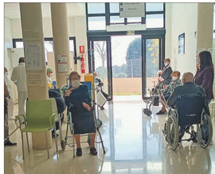
Inicio de la vacunación a los vecinos de Xixona.

Por otro lado, el President de la Generalitat, Ximo Puig, ha anunciado que está previsto que el 1 de abril comience la vacunación masiva en 161 municipios de la Comunitat. Aunque esta es la intención, Puig ha señalado que todo va a estar sujeto a la llegada de las dosis de las vacunas.