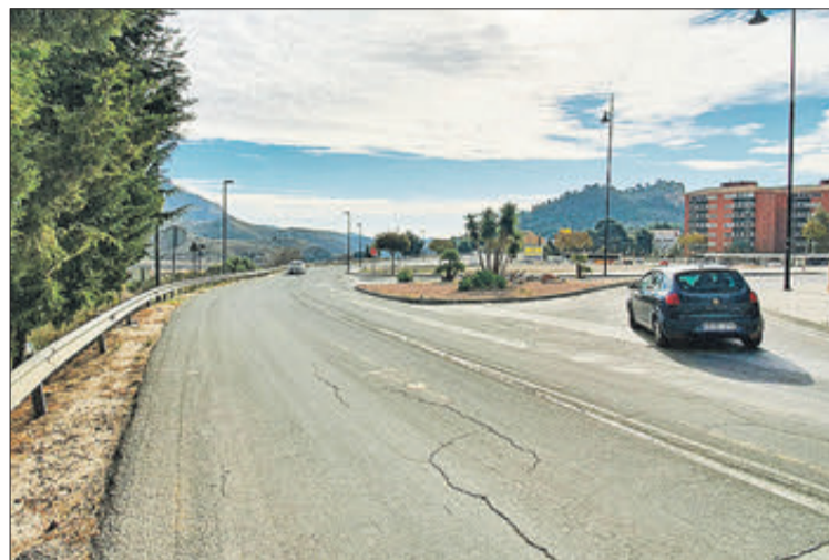
Zona on s'estan duent a terme les obres.

L'alcaldesa de Xixona, Isabel López, considera que amb aquestes obres, que tenen un termini d'execució de tres mesos, "s'aconseguirà donar un aspecte molt més urbà a l'entrada sud de Xixona i integrar el barri Sagrada Família amb la resta, a més de dotar al poble de més zones