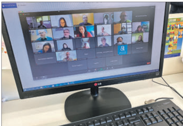
La jornada se celebró de forma telemática.

Los intervinientes pudieron transmitir en la jornada sus inquietudes y necesidades, y se hizo especial hincapié en que el Consorcio les dé cobertura con educadores ambientales en la implan-