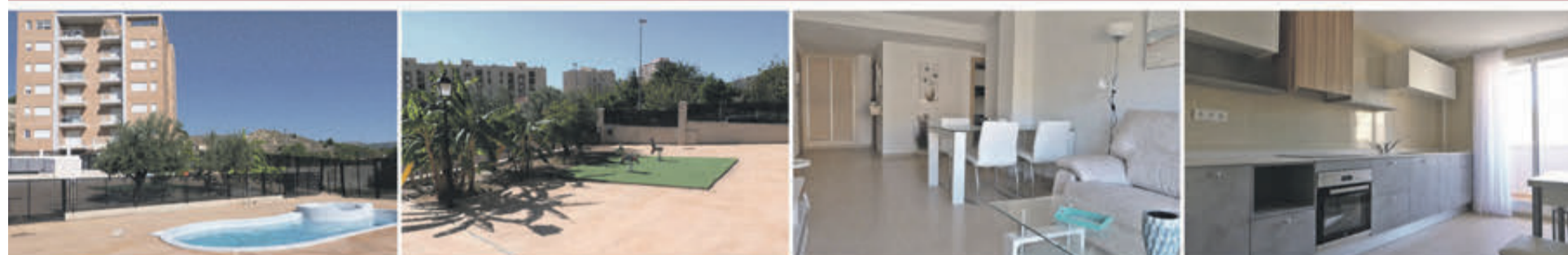
PISOS A ESTRENAR CON PLAZA DE GARAJE EN BARRIO ALMARX 68.400€ Ref. 00081 a 00099