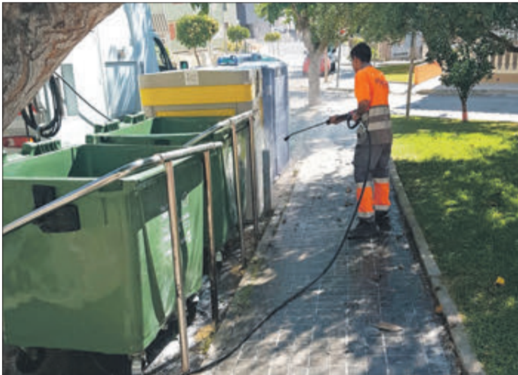
L'actual contracte venç al setembre d'enguany.

lladar a l'empresa totes les incidències que genere el servei de recollida de fem i neteja, així com donar resposta als dubtes i queixes que plantegen els veïns.