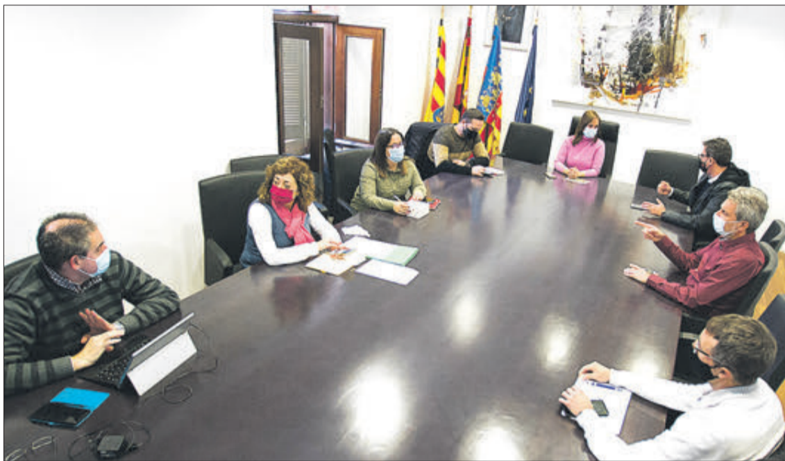
Reunió mantinguda per abordar el pressupost municipal de 2021.

D'altra banda, per a pal·liar els efectes negatius de la pandèmia, aquests pressupostos tindran un marcat caràcter social. Així, s'ha previst oferir ajudes a les famílies més afectades econòmicament i també a les