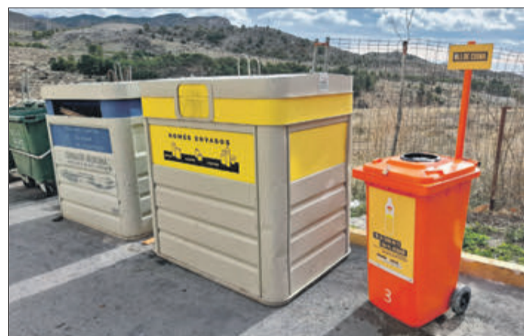
Els contenidors porten una bandereta identificativa.

L'Ajuntament realitzarà diverses campanyes perquè els ciutadans coneguen la importància de reciclar l'oli i evitar abocar-lo a l'aigüera, ja que es tracta