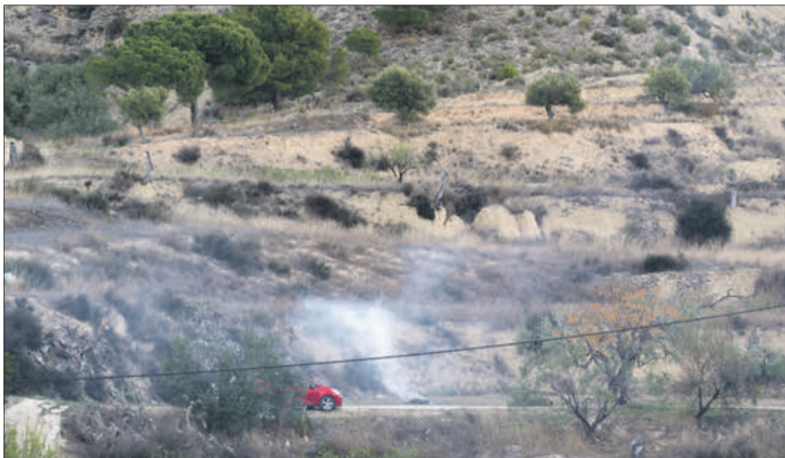
‘Control Foc’ ofereix informació a temps real relacionada amb les cremes agrícoles.

La citada app disposa de dues funcions: una per a indicar el moment