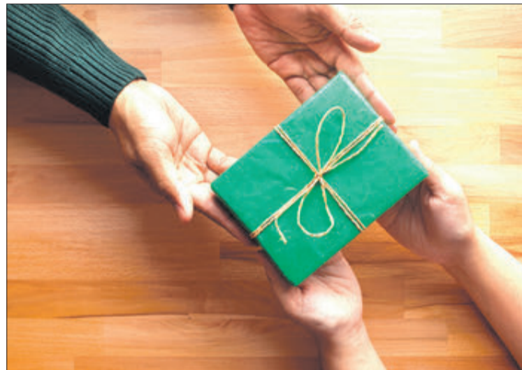
La campanya pretén potenciar el comerç local de Xixona.

La campanya se centrarà en un eslògan concret per a la celebració del Dia del Pare, però que estarà sota el paraguai de 'Xixona, l'has de voler', que s'ha convertit en el lema del comerç local i que el seu hastag va tindre gran repercussió en xarxes socials des que es va llançar públicament fa algunes setma-