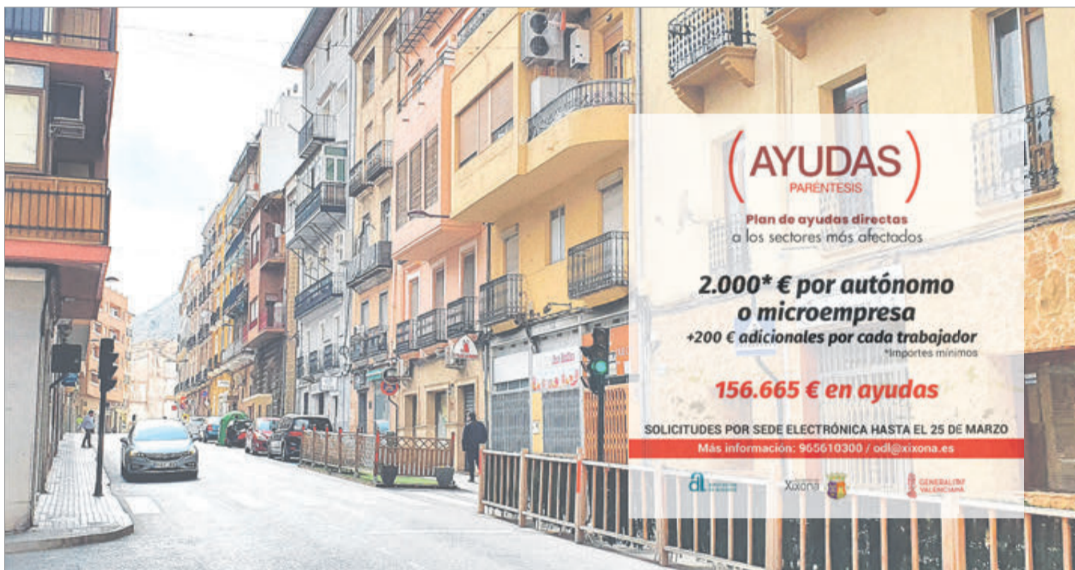
Les ajudes s'han plantejat per a dirigir-les a nombrosos sectors afectats.

reixen tots els documents relacionats amb aquestes ajudes, així com les bases d'aquestes.