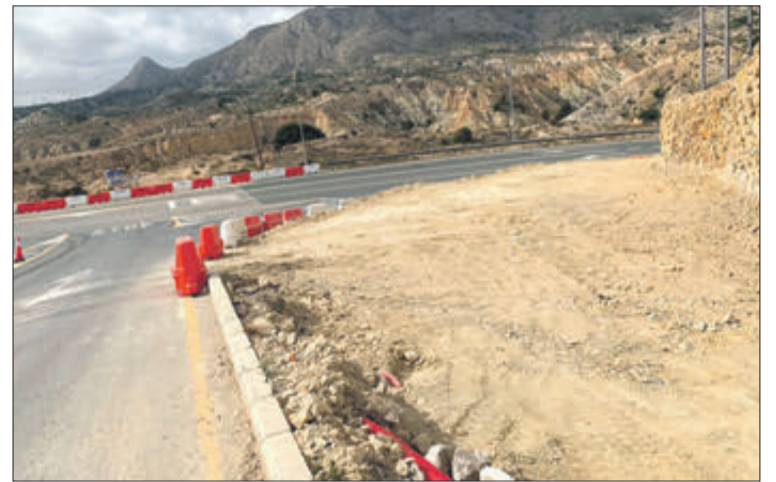
Les obres ja han començat.

España indica que el pressupost estimat de les obres és de 400.000 euros i el termini d'execució previst és de tres mesos. En aquest sentit, ha afegit que "des de la conselleria estem treballant per infraestructures que estiguen al servei de les persones, que garantisquen la seua seguretat i servisquen, per a millorar i fomentar el desenvolupament sostenible i la creació d'ocupació". Així mateix, el conseller valora la col·laboració de l'Ajuntament de Xixona per a poder dur a terme aquesta actuació.