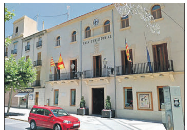
Façana de l'Ajuntament de Xixona.