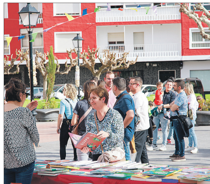
La clausura va incloure una mostra de llibreries al carrer.