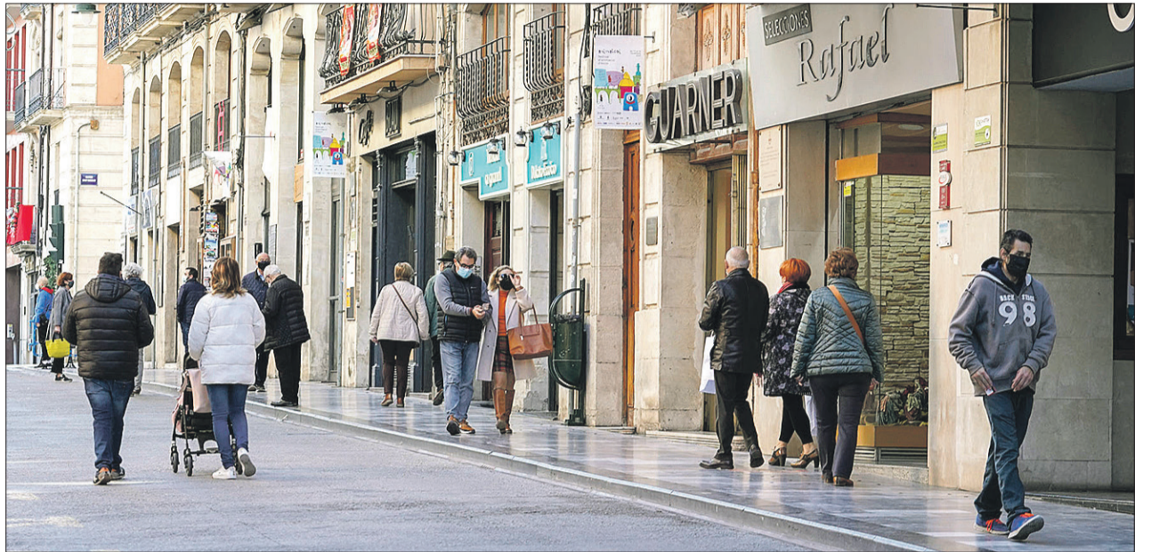
El comercio pertenece al sector servicios.

Por sexo, 698 fueron firmados por hombres y 604