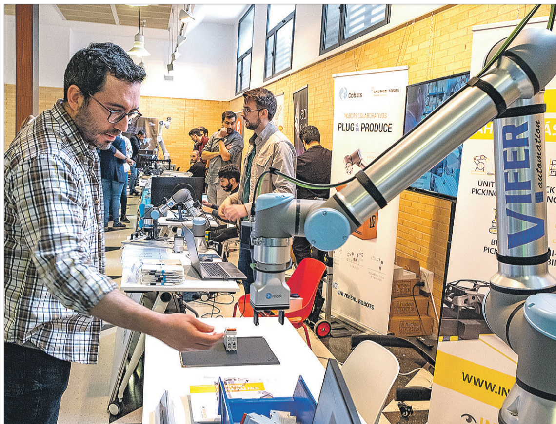
El Focus Pyme ha contado con una exposición de empresas y con numerosas ponencias.