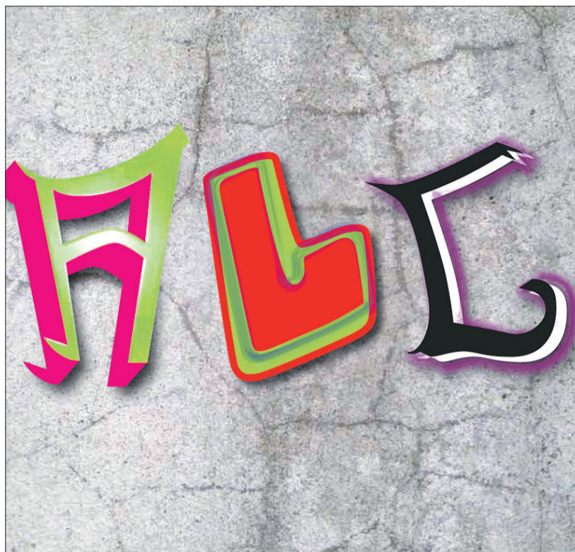
Alguns dels projectes i treballs de l'alumnat d'Arts Gràfiques.