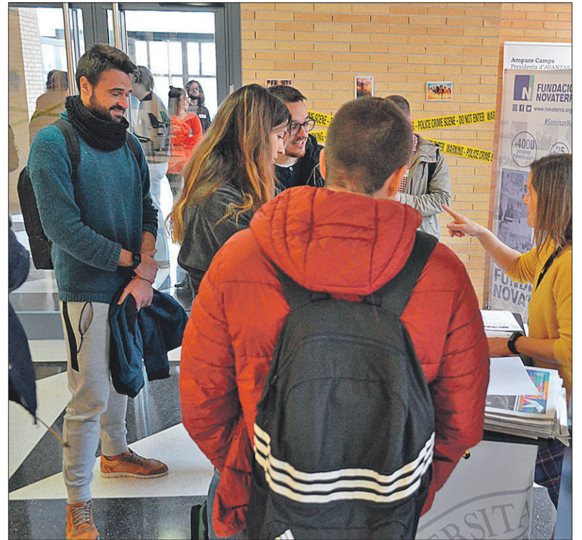
Escape Room, una activitat del Campus dirigida a la recerca d'ocupació.