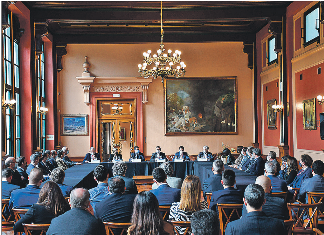
Creació del Consell Consultiu Empresarial.