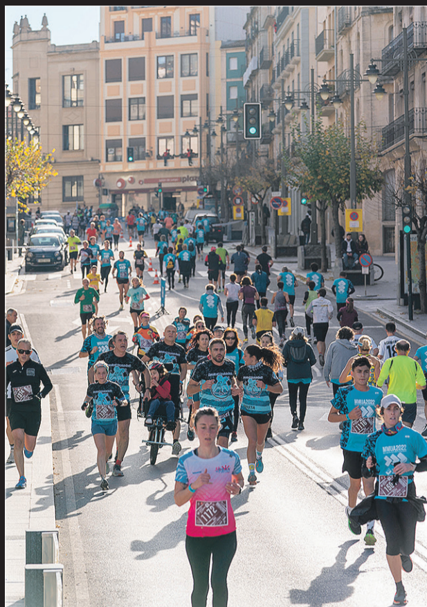
Aspecto que presentaba el puente de Sant Jordi.