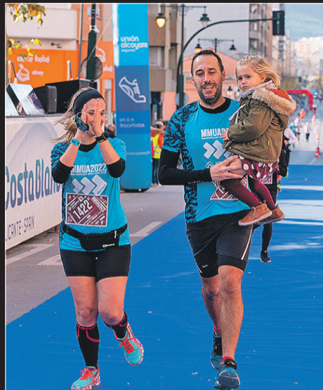
Familia de atletas entrando en meta.