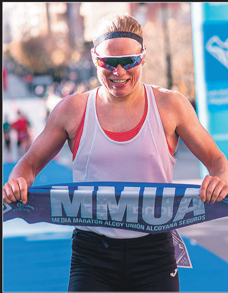
La belga Tonderu ganó por segundo año.