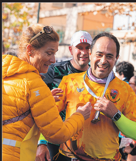
Todos los participantes recibieron medalla.