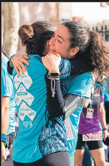
Dos corredoras abrazadas.