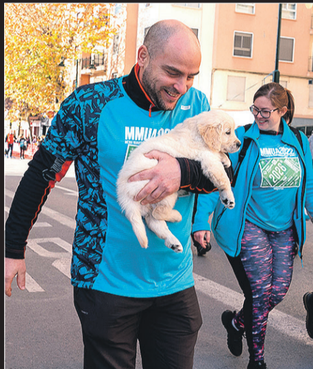
Un caminante con su mascota en brazos.