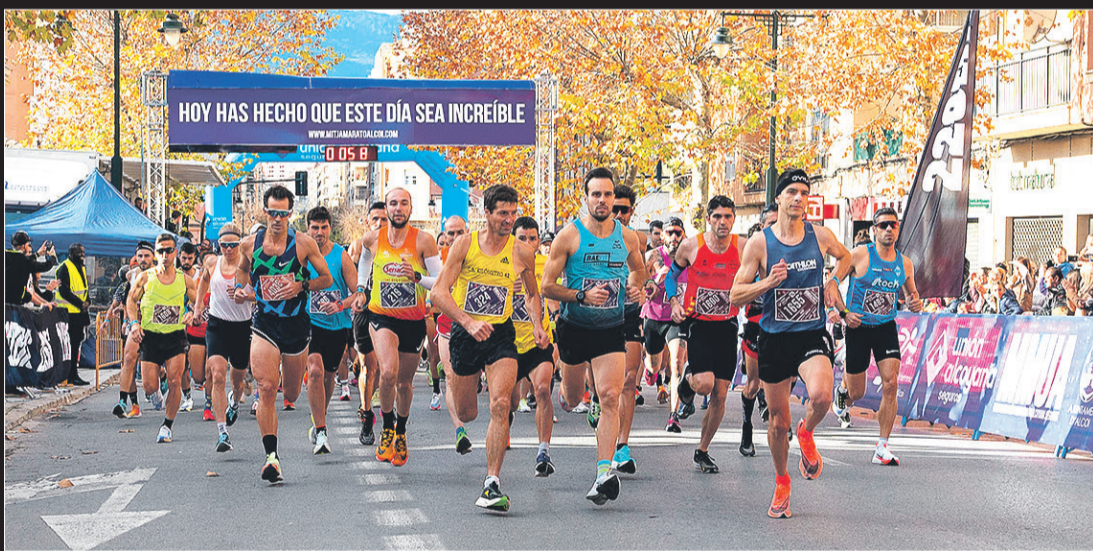
Momento de darse la salida a la undécima edición de la MMUA.