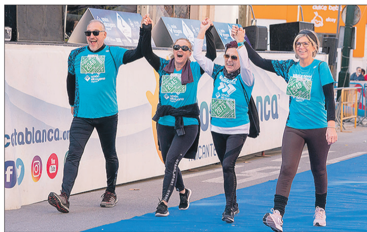
Participantes en la caminata entrando en meta.

“La gente de Alcoy anima mucho y es muy bonito para el corredor ver que el público se vuelca con la prueba. Es de las carreras en las que he participado con más animación a lo largo de todo el recorrido. Me gusta venir a la MMUA se cuidan mucho los detalles. Siempre que pueda volveré a correr si me lo piden”, desveló Micó para finalizar.