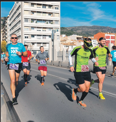
Corredores a su paso por el pont de Sant Jordi durante la celebración de la prueba.