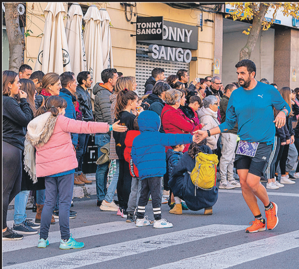
Hubo mucha conexión entre el público y los participantes.