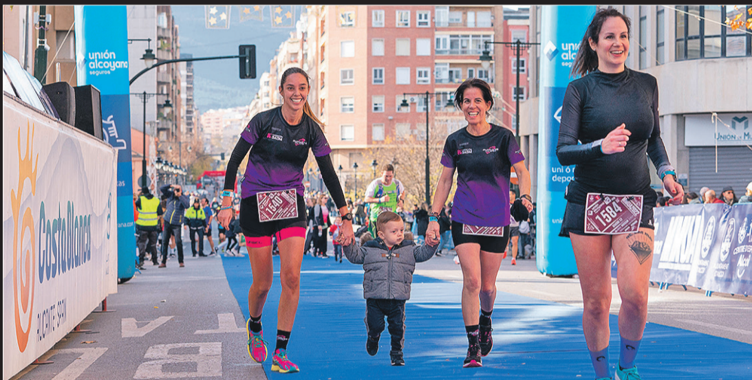
Curiosa imagen con un niño pequeño cogido de la mano de dos participantes.