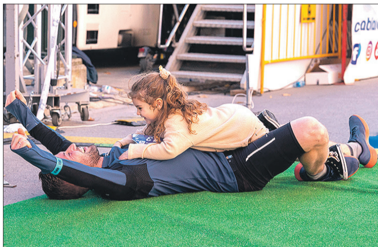
Un participante celebrando con su hija la entrada en meta.

El domingo se lo tomó como un test para ver si los 36'23" conseguidos en la 10K de Gandia se ajustaban a su nueva realidad. Un buen momento que espera ratificar el 15 de enero en la 10K Valencia Ibercaja y posterior-