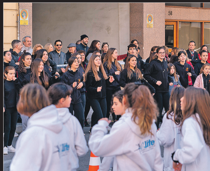
Fueron 18 grupos de animación repartidos por todo el circuito.