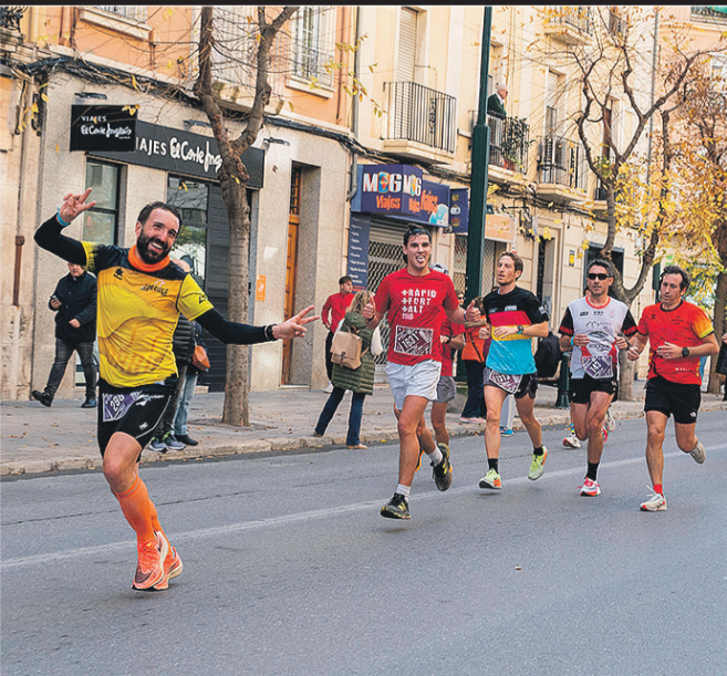
No faltó el buen humor entre los participantes.