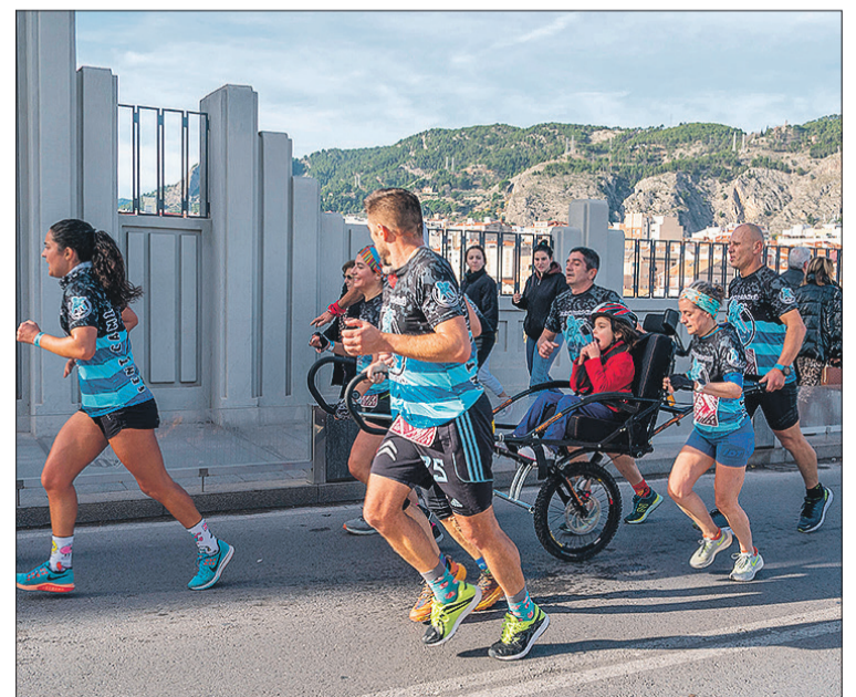
Participante con una silla joelette de la Associació Fent Camí.

De cara a 2023 ha puesto su foco también en el Campeonato de España de duatlón en la modalidad de sprint (5km corriendo, 20 en bic y vuelta a calzarse las zapatillas con otros 2,5km). Ovidi Albert quiere ser más ambicioso y pelear por la clasificación en élite. Será en marzo en Soria. Antes, en febrero, le espera el clasificatorio en Águilas.