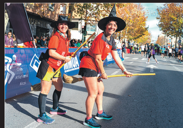
Las "brujitas" encargándose de cerrar el circuito.