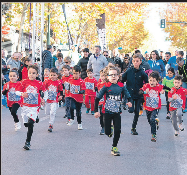
En la hora previa a la MMUA se disputó la Micro Maratón con carreras para niños.