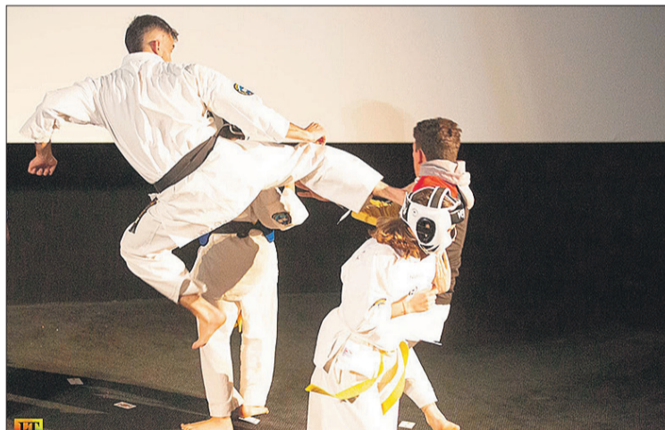
El Club Ben Gym realizó una exhibición de kárate.