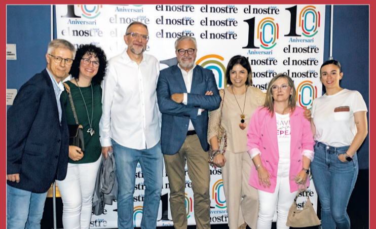
Equipo de El Nostre presente en la Gala.

A la conclusión de la Gala, se sirvió un vino de honor para los presentes que muchos aprovecharon para departir y compartir experiencias cuando se acerca el final de la temporada.