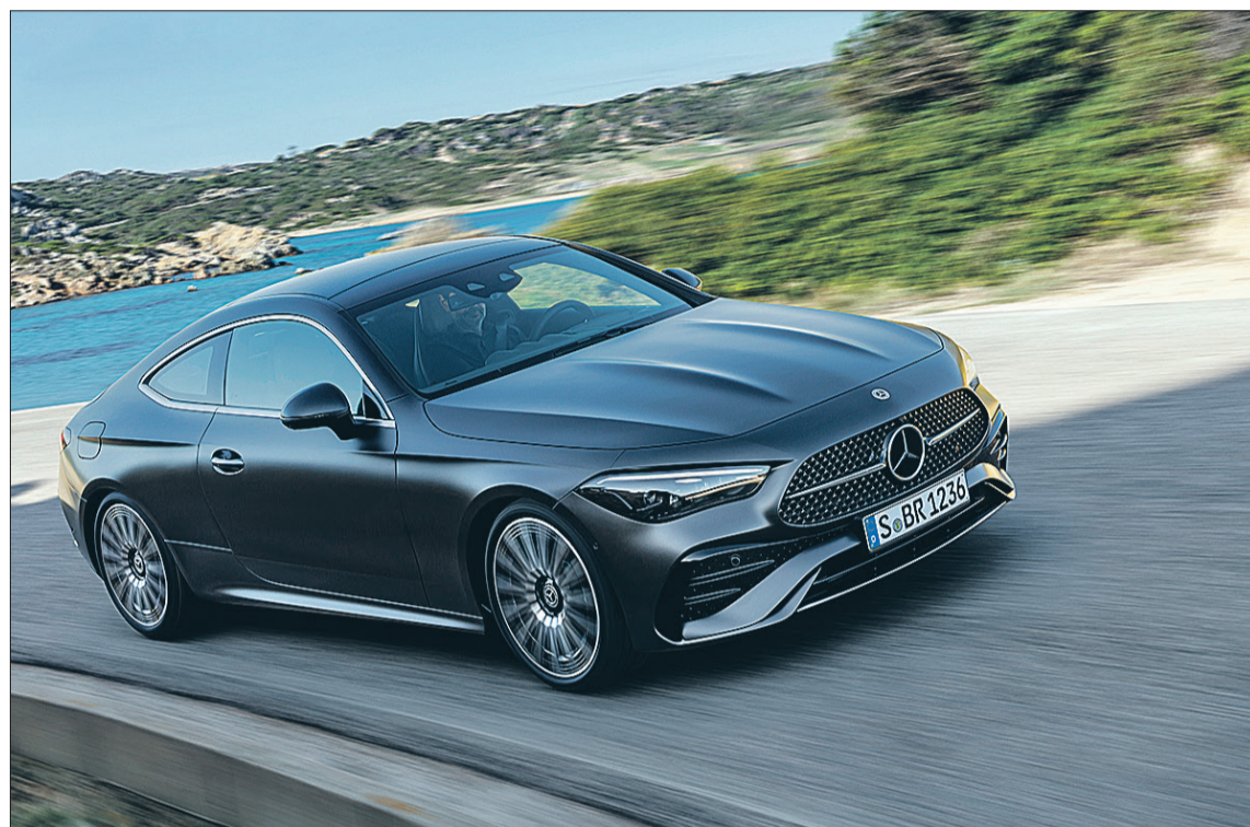
La nueva serie de coches de la marca de la estrella.

El nuevo CLE Coupé aprovecha las innovaciones conceptuales y técnicas de la Clase C y la Clase E. Las marcadas líneas en el largo capó hacen referencia a los potentes motores de hasta seis cilindros