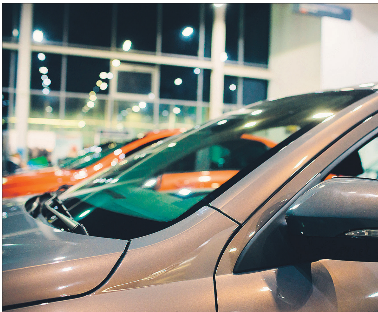
Vehículos expuestos en un concesionario de automóviles.

En junio, las matriculaciones de vehículos industriales, autobuses, autocares y microbuses