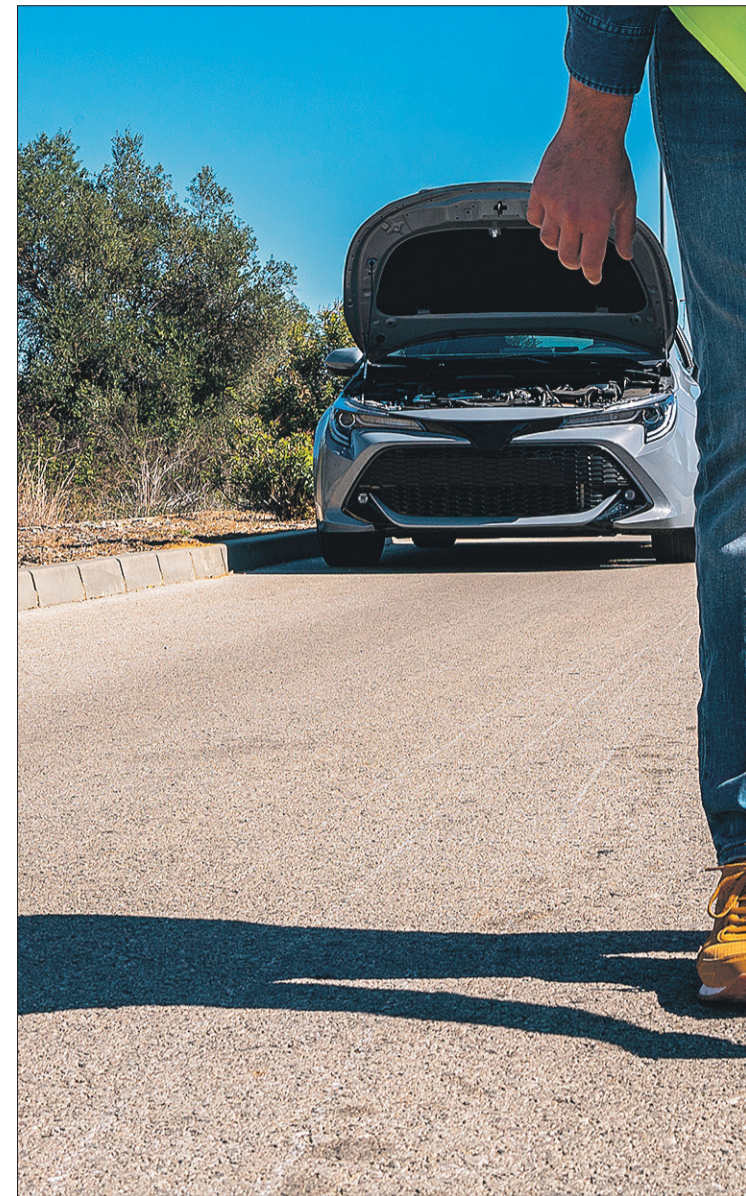
Un conductor coloca el triángulo para advertir de una avería.

un fin de semana. Por este motivo y para atender a ese mayor número de personas que comienzan las vacaciones en fin de semana, y que optan por el vehículo como medio de transporte, la DGT ha establecido dispositivos especiales de regulación y control del tráfico durante todos los fines de semana del periodo estival, intensificándolos durante los primeros fines de semana de cada mes y dando lugar a las llamadas operaciones salida o regreso. Una de las novedades de este verano, es que a partir del 1 de julio se exime el uso de los triángulos de preseñalización de peligro en autopistas y autovías en caso de inmovilización del vehículo por causa de accidente o avería. Su uso sigue siendo obligatorio cuando estas circunstancias se produzcan en vías convencionales. La DGT ha publicado una instrucción en la que se recoge dicha excepción, motivada principalmente por las siguientes cuestiones: