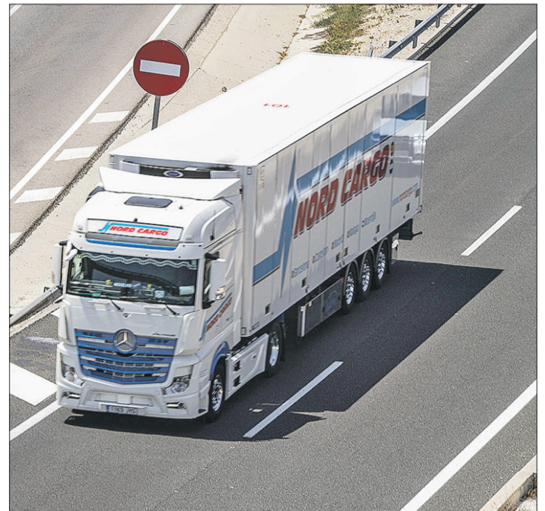
Un camión circulando por una autovía

Las cabezas tractoras y los semirremolques se equiparon con neumáticos MICHELIN X Line, la opción de Michelin para recorridos de larga distancia con un bajo consumo de energía, gracias a su reducida resistencia a la rodadura. Un neumático que ahorra y, al mismo tiempo, cuida el medio ambiente. Los camiones rígidos se equiparon con la gama MICHELIN X Multi, que destaca por su polivalencia en carretera y autopista y por su gran duración y movilidad en cualquier condición climática, por lo que son ideales para recorridos tanto de corta como de larga distancia.