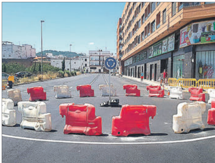
La ronda Sud acollirà la meta.

transcorregut cinc de les últimes huit edicions de la Volta, des de l'etapa entre València i Castelló de 2015. Amb posterioritat, la carrera ha tornat en 2016 i 2017, amb les etapes entre Requena i Gandia, i Llíria i el Port de Sagunt. Amb posterioritat, la Volta ha visitat la província en anys alterns, en 2019 amb