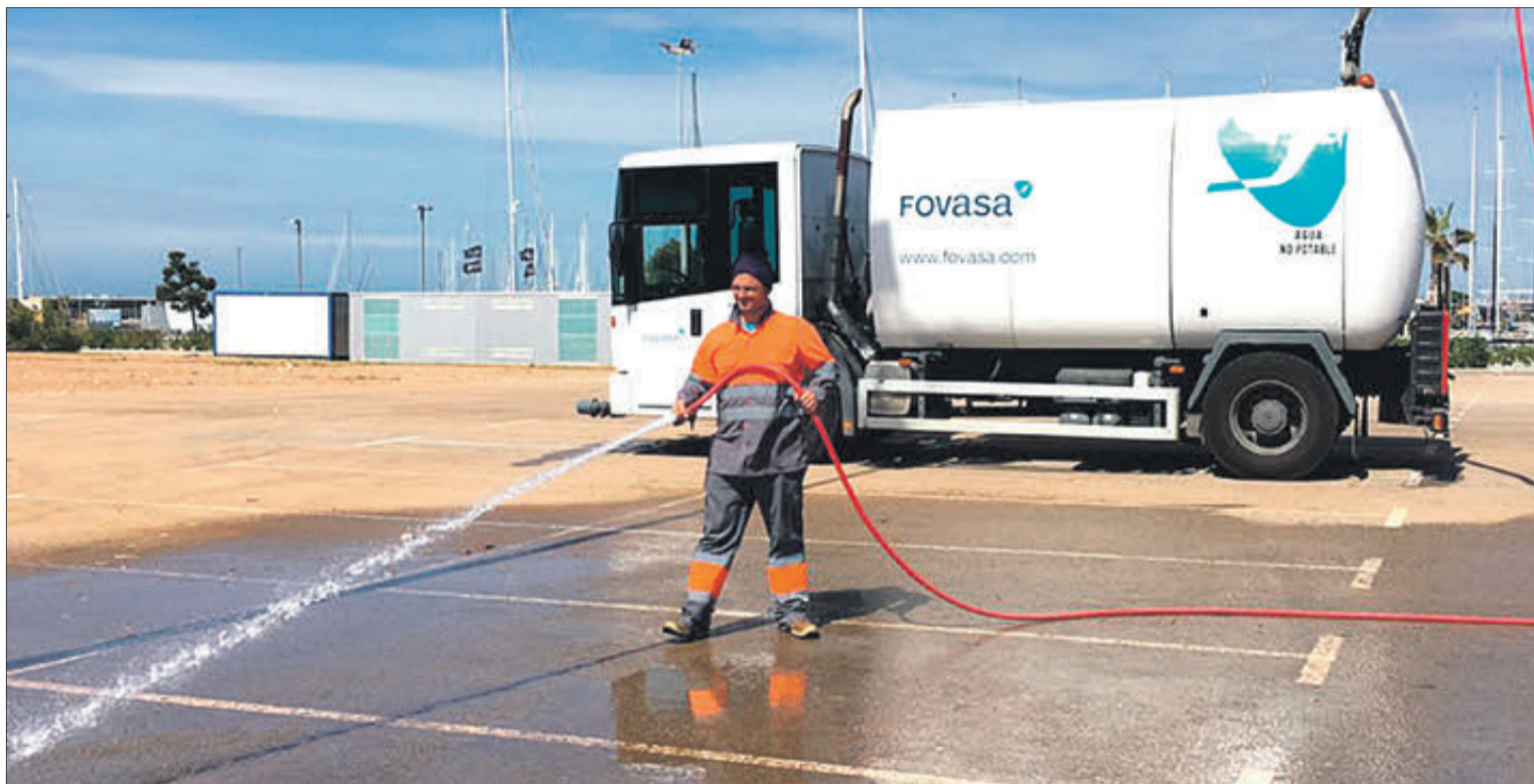
Un operari fa tasques de neteja.

També se substituiran els vehicles per a la recollida de fem per uns altres menys sorollosos i més eficients i s'ampliaran les freqüències i les zones de neteja de carrers. S'inclou també la incorporació de diversos vehicles i maquinària elèctrica o híbrida. Cal destacar que Fovasa medi ambient inicia el servei l'1 d'agost comptant amb la incorporació de tres agradores totalment noves, una d'elles 100% elèctrica, que milloraran des de l'inici del contracte la neteja de la ciutat.