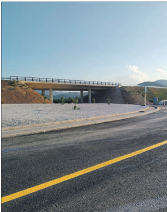
Una de les rotondes i mapa del projecte que es durà a terme.

L'alcaldeessa va confirmar que vol dur a terme una reunió amb els portaveus de tots els grups municipals per a intentar consensuar entre tots el tipus de projecte que es pensa executar, perquè és clau per al futur desenvolupament de la ciutat d'Oliva.