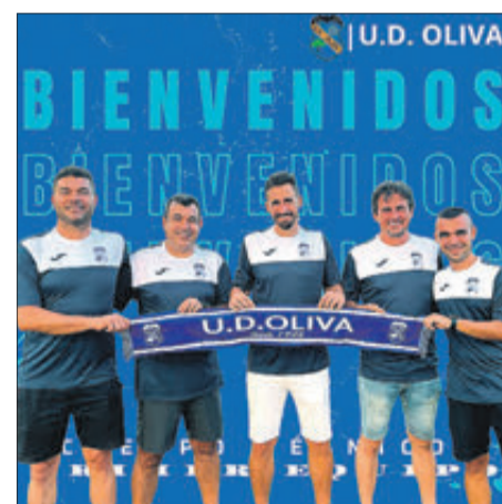
Algunes de les incorporacions, jugadors renovats i cos tècnic.

l'equip i dels pocs jugadors que queden de l'últim ascens, és un jugador polivalent que pot jugar en qualsevol posició de la línia defensiva