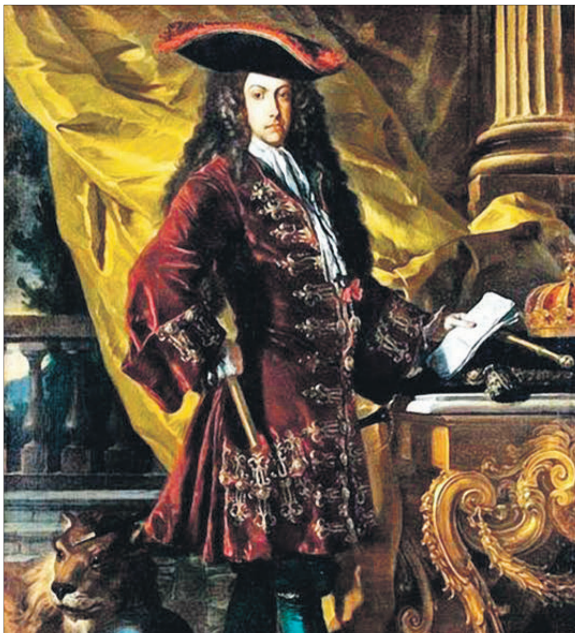
Carles VI d'Àustria. Oli de E. Solimena.