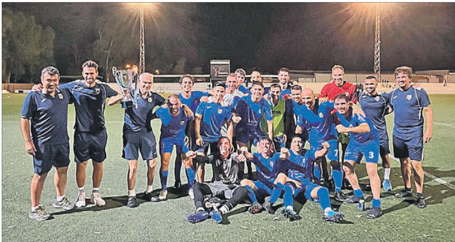
Formació del U.D. Oliva que va guanyar al Denia en el trofeu Vicent Cabrera.