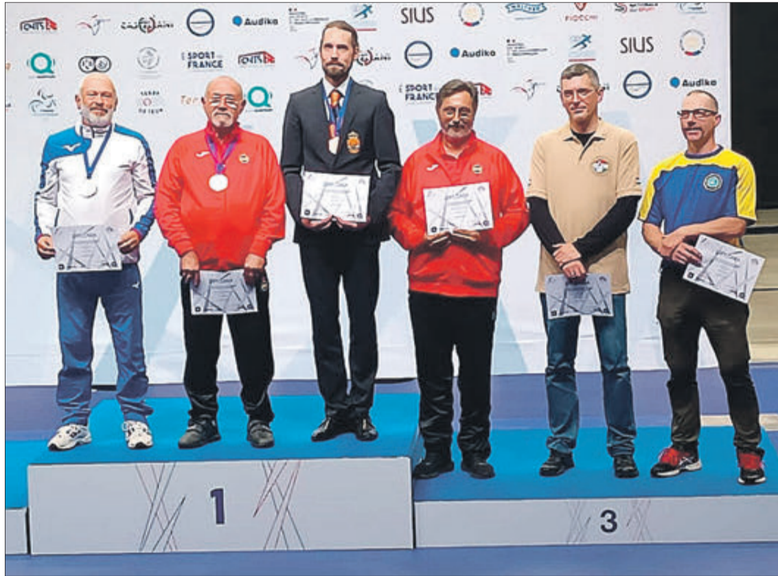
Els olivers, al podi de l'Europeu d'Armes Històriques.