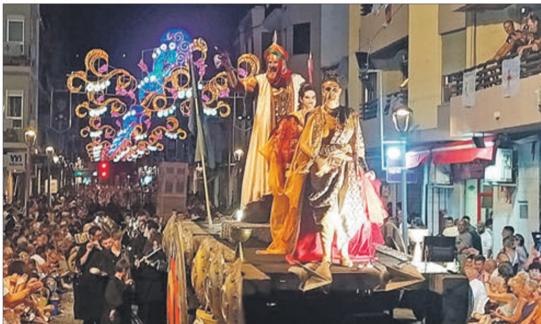
L'ambaixador moro durant la desfilada.