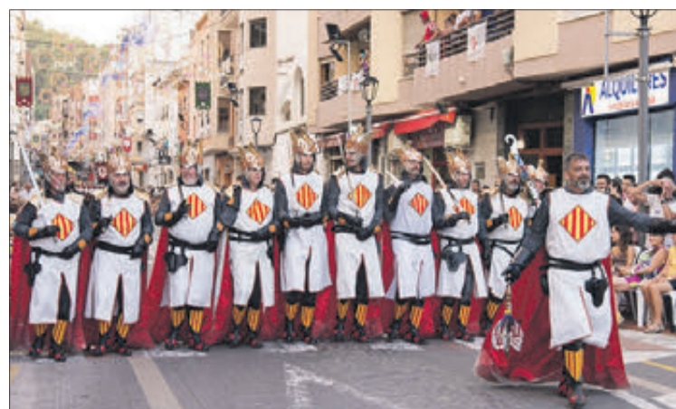
Filà Jaume I.