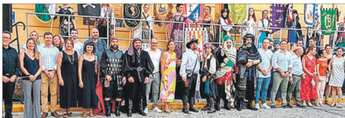
Diferents imatges de les festes 2023.