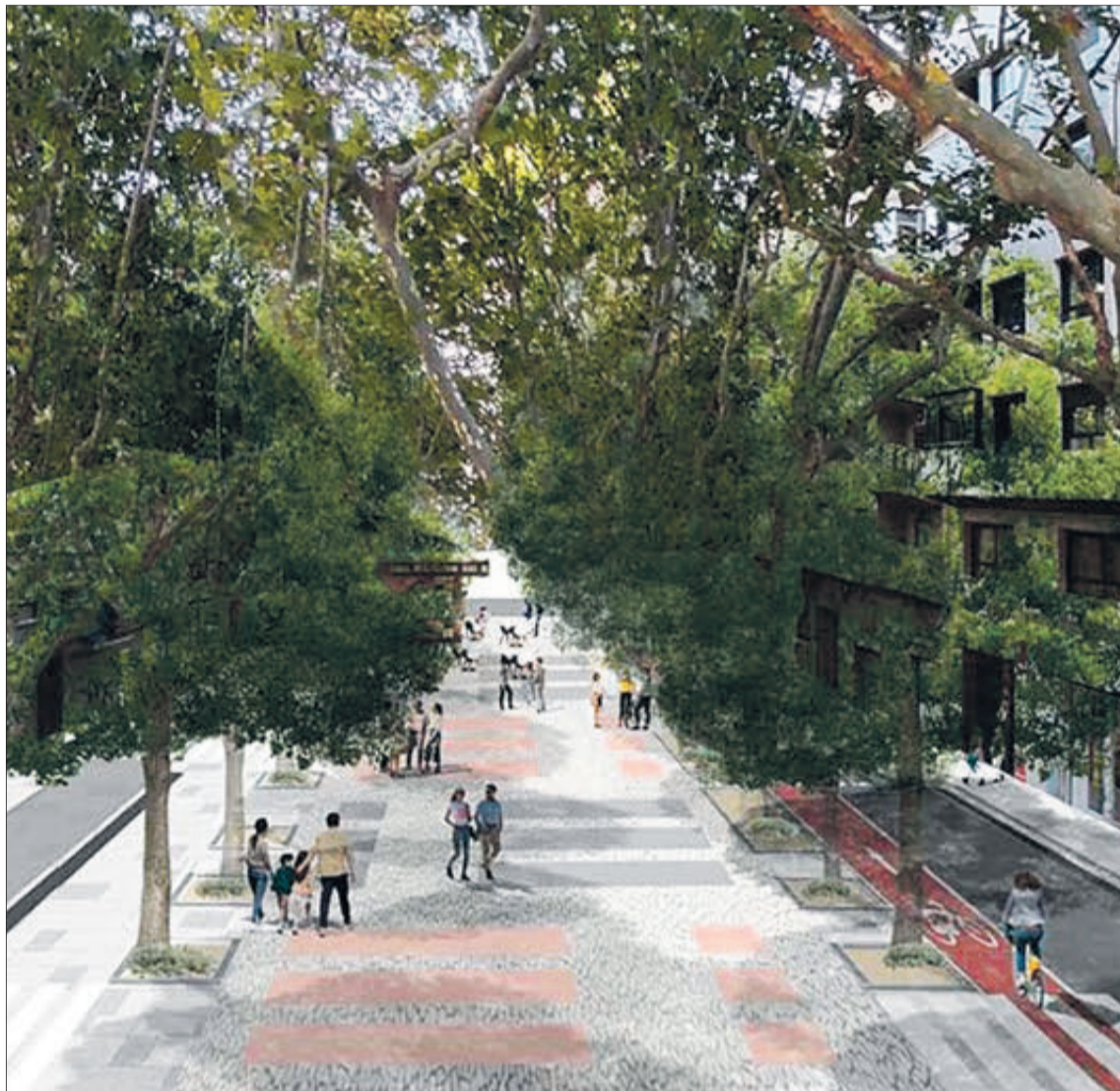
Recreació virtual de com quedarà l'avinguda després de les obres.

Per la seua part els veïns demanen una solució al tema de l'aparcament en la zona, ja que amb les obres s'han eliminat nombroses places públiques i per l'anterior equip de govern s'havia promès crear en un solar propietat municipal pròxim un espai per a aparcar els vehicles, però això encara no és gens clar ja que es tracta d'un sector urbanístic que encara no s'ha desenvolupat, amb tots els problemes que aquesta qüestió podria provocar. De fet l'alcaldesa Yolanda Pastor ha confirmat que en el modificat de projecte tornen els aparcaments laterals i la calçada s'amplia a 3,30 metres, per poder travessar vehicles pesats o grans.