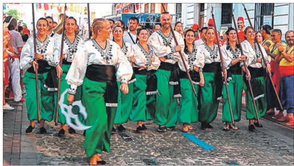
Els capitans cristià i moro van acaparar gran part de l'atenció del públic. I festeres del bàndol moro durant una desfilada.

MILERS DE PERSONES HAN SIGUT TESTIMONIS DIRECTES DE LA GRAN QUALITAT DE LES CELEBRACIONS