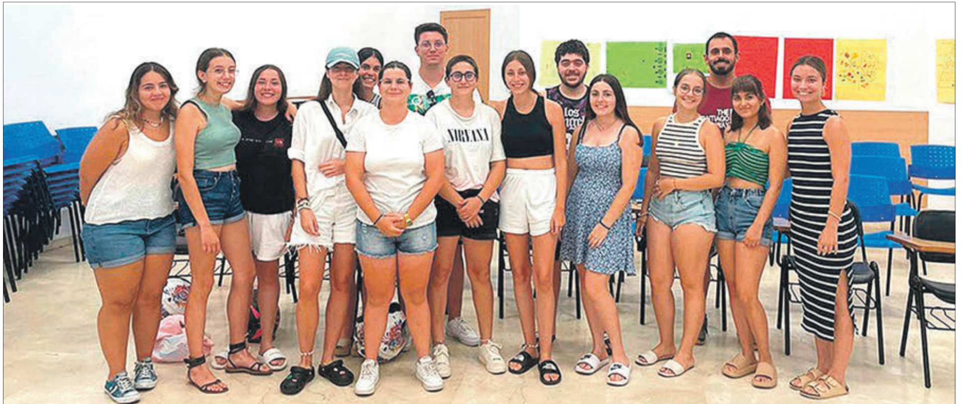
Integrants de les Quintades 2023

HAN SIGUT UNA TRADICIÓ, QUE HAN SERVIT PER A REUNIR ELS MEMBRES DE LA MATEIXA GENERACIÓ