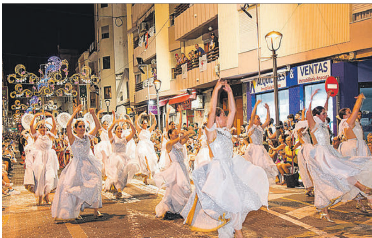
Ballet Opera Ontinyent durant la desfilada.