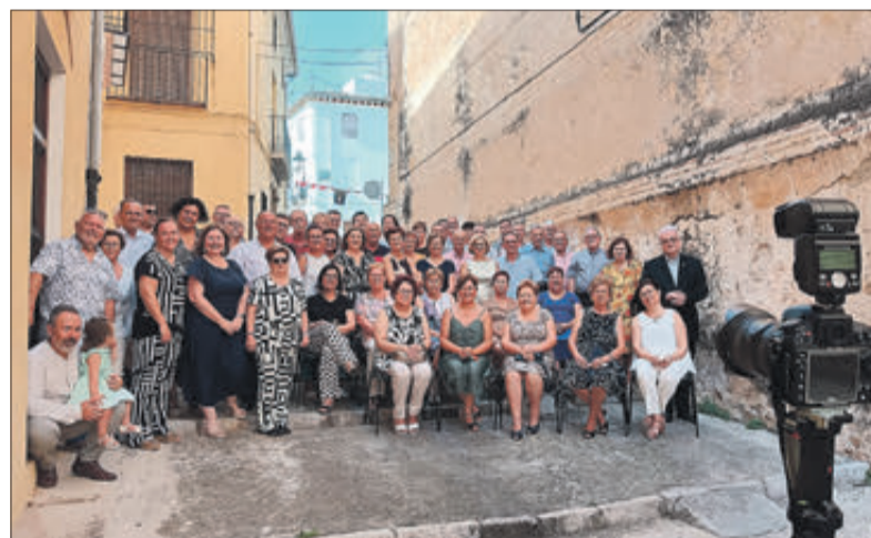
Festers del Rebollet 2023.