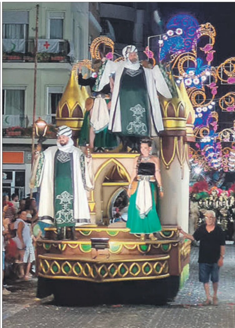
Els capitans del bàndol cristià i moro van desfilat sobre espectaculars carrosses.

AMB LES FILAES PIRATES I MUDÈJARS COM A GRANS PROTAGONISTES DE LES DESFILADES