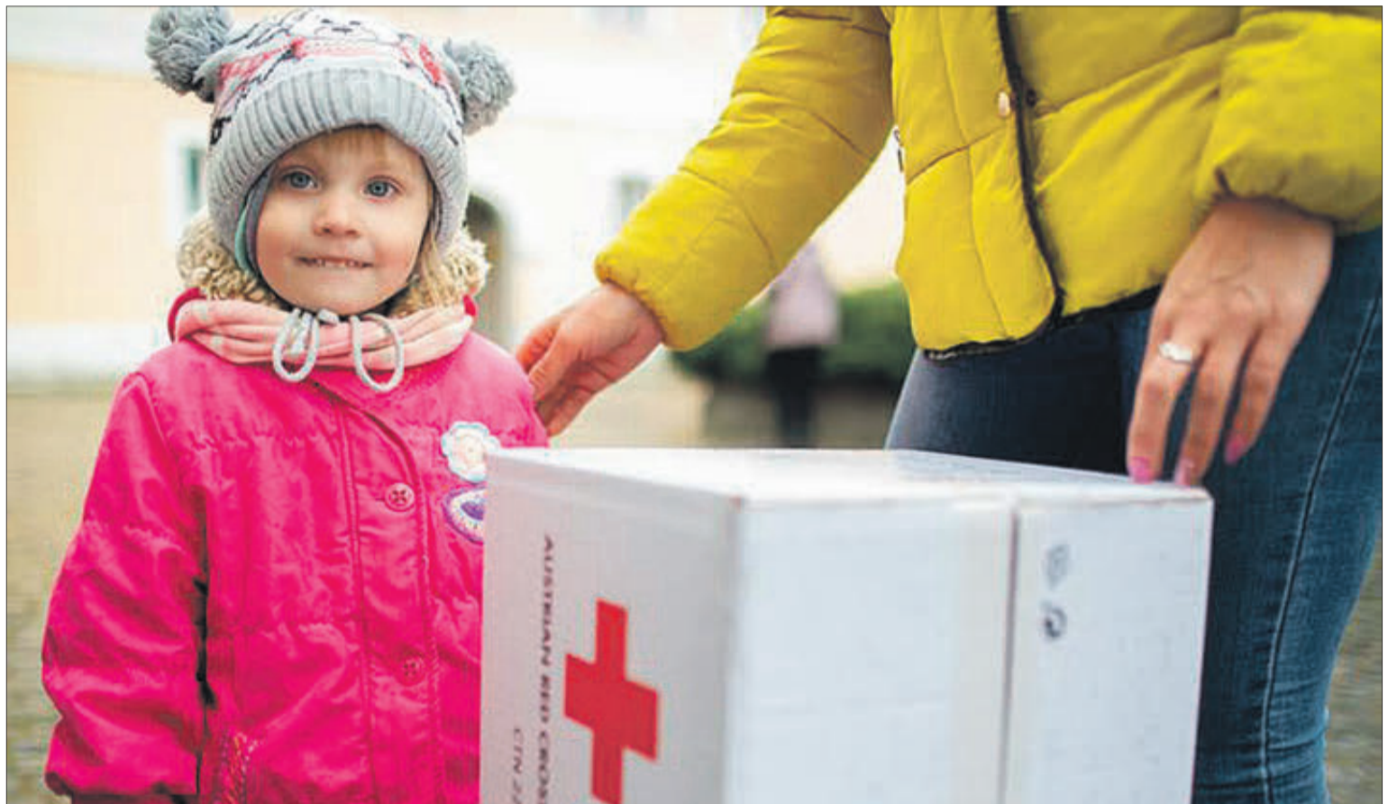
Creu Roja dona suport als ucraïnesos arribats a Oliva.

"Donem suport als serveis humanitaris de la Creu Roja a Ucraïna i als països veïns i acollim a les persones que arri-