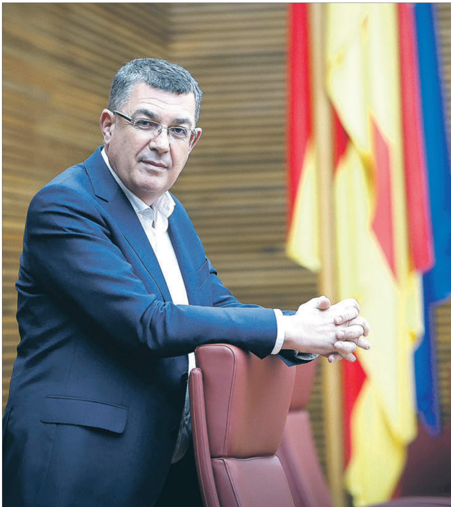
Enric Morera, en el parlament autonòmic, durant la seua etapa com a president de les Corts Valencianes.

Va ser candidat pel Bloc a l'alcaldia de València en 1999, així com