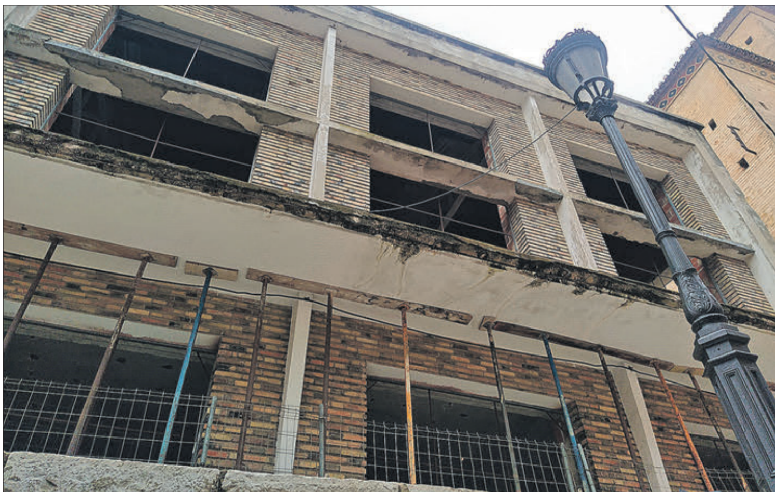
Imatge del edifici i estat en que van quedar les obres.

l'antiga Casa dels Orduña, un edifici dels segles XVII i XVIII i una part més nova, que es va construir a mitjan segle XX i que ha patit diverses remodelacions fins hui.