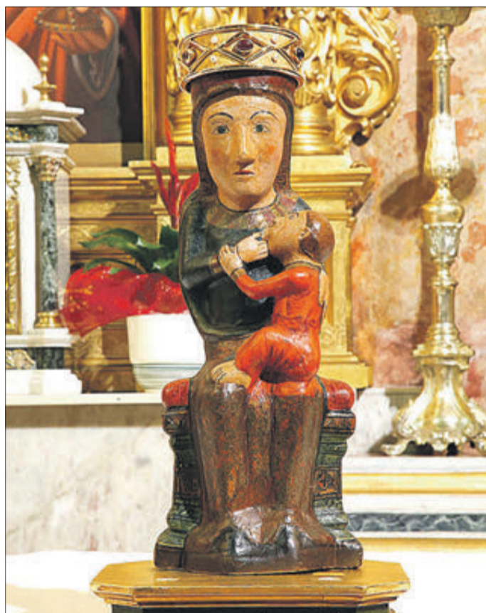
Imatge de la Verge del Rebollet.