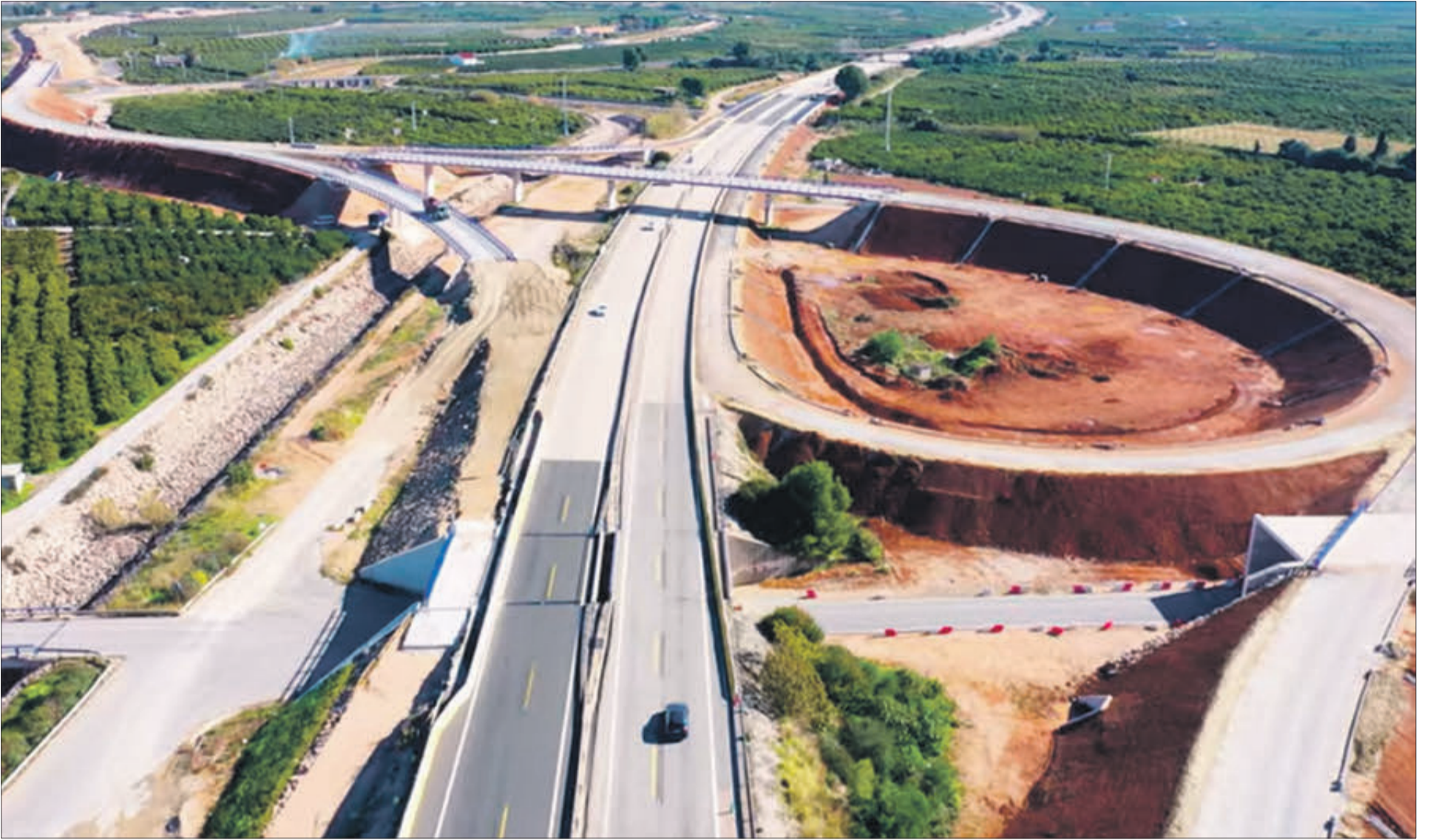
Obres de la connexió sud.

PASTOR HA DEMANAT TAMBÉ QUE ES PUGA DUR A TERME L'ANHELAT PROJECTE DEL BULEVARD PEL CENTRE DE LA CIUTAT